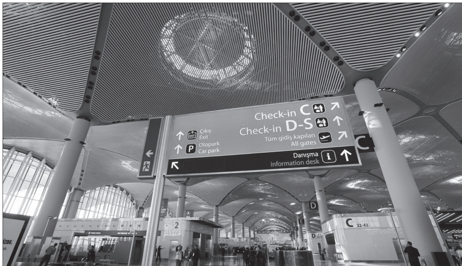
▲ “Turkish Airlines innova para atraer pasajeros y volverlos clientes. Si tienen más de seis horas de espera, hay un mostrador que ofrece tours gratis para visitar Santa Sofía, al Bazar de las especias o al Bósforo. Una paseadita y regreso a tiempo para tomar el vuelo que sigue”.