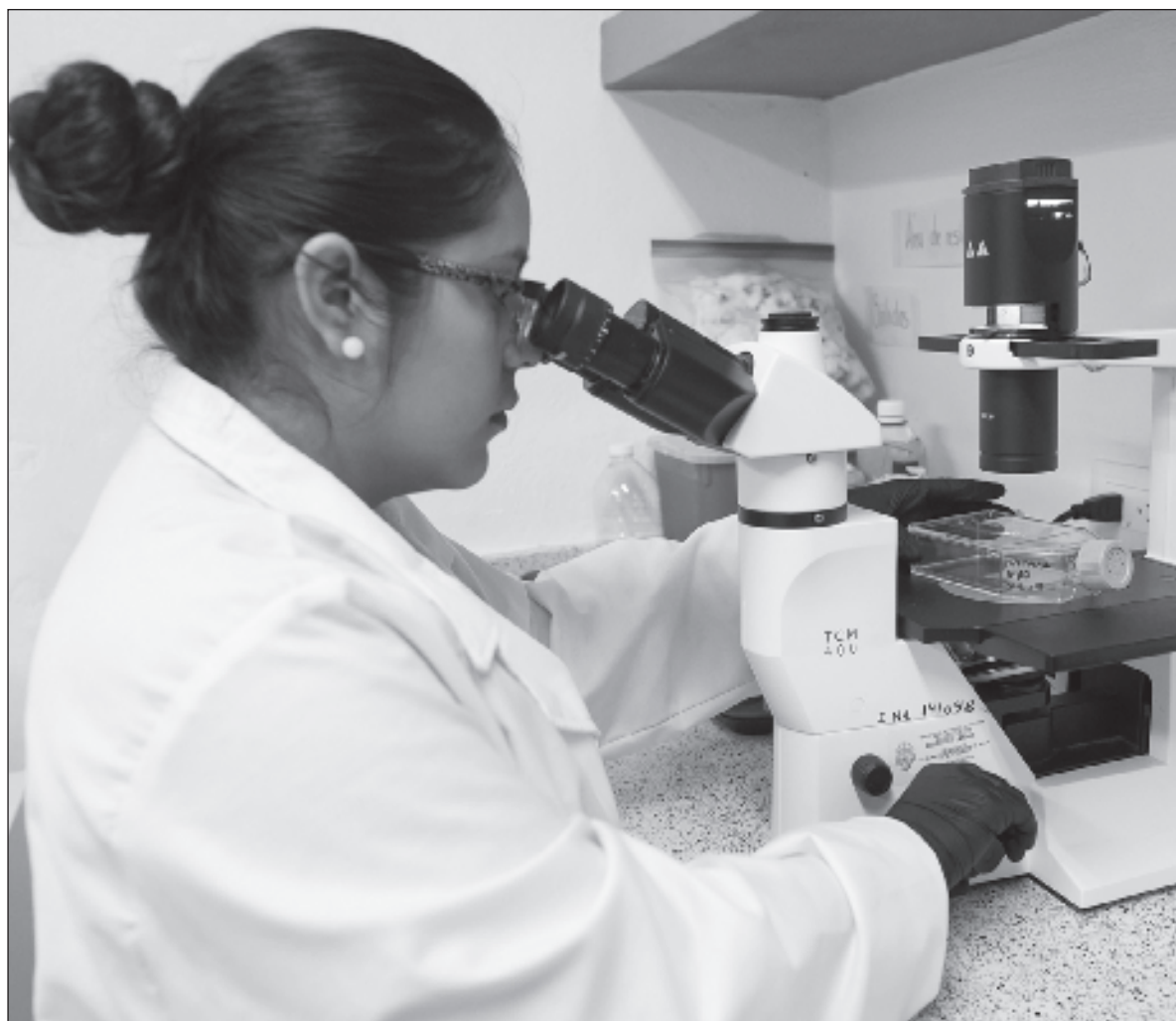
▲ "Respecto a las carreras STEM, 22% son mujeres en todas las universidades del estado".

EN EL MUNDO, sólo 33.3 por ciento de la investigación es realizada por mujeres (ONU, 2023). En México, el porcentaje de investigadoras es similar, aunque la incursión de los espacios educativos va en aumento. Desde el nivel básico hasta el medio superior, prácticamente se ha conseguido la paridad. No obstante, los porcentajes comienzan a cambiar cuando se trata de la educación superior y posgrados. Aún más cuando se ven los datos de las licenciaturas STEM (Ciencia, Tecnología e Ingenierías y Matemáticas, STEM por sus siglas en inglés) donde la brecha se hace más amplia a favor de los varones. Respecto a las mujeres que hablan una lengua originaria menos de 1 por ciento alcanzan a obtener un título de doctorado. Este dato