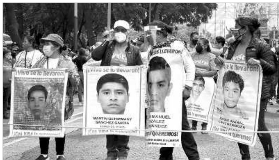
▲ López Obrador también señala que el desmoronamiento de la llamada verdad histórica, urdida en la pasada administración priista, generó una secuela de complicaciones.

"La desaparición de los jóvenes y el crimen de Iguala no fue ordenado por el pre-