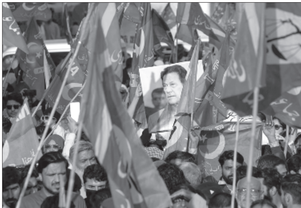
▲ Hasta hace unos días, el partido Pakistán Tehreek-e-Insaf había evitado manifestaciones públicas por temor a la represión y el arresto de sus seguidores. Sin embargo, el amplio respaldo a sus candidatos en las elecciones del pasado jueves, ha aumentado el ánimo de los seguidores.

El hecho de que la Liga Musulmana de Pakistán