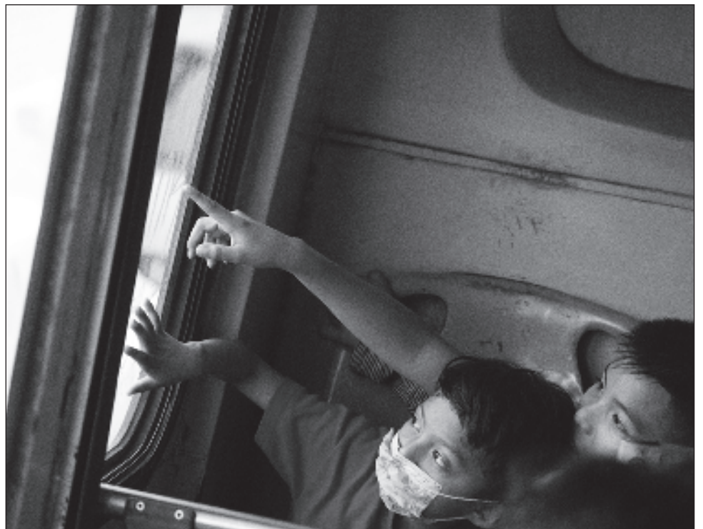
▲ Dentro de las acciones que se recomiendan están el uso de cubrebocas, el lavado frecuente de manos o el uso de gel antibacterial para prevenir enfermedades.

Puntualizó que las acciones que se están recomendando es el uso de cubrebocas, el lavado frecuente de manos o el uso de gel antibacterial.