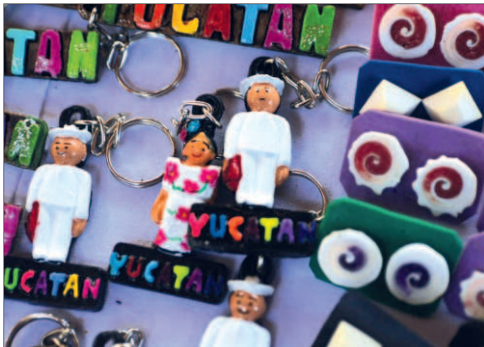
▲ La recuperación turística de Yucatán en los años 2022 y 2023 ha sido sorprendente, destacó la titular de Sefotur, pues se rebasaron las estadísticas pre pandemia.

Se trata de números, dijo, importantes, resultado de un trabajo en equipo del estado, los municipios, la iniciativa privada y los diferentes sectores sociales.