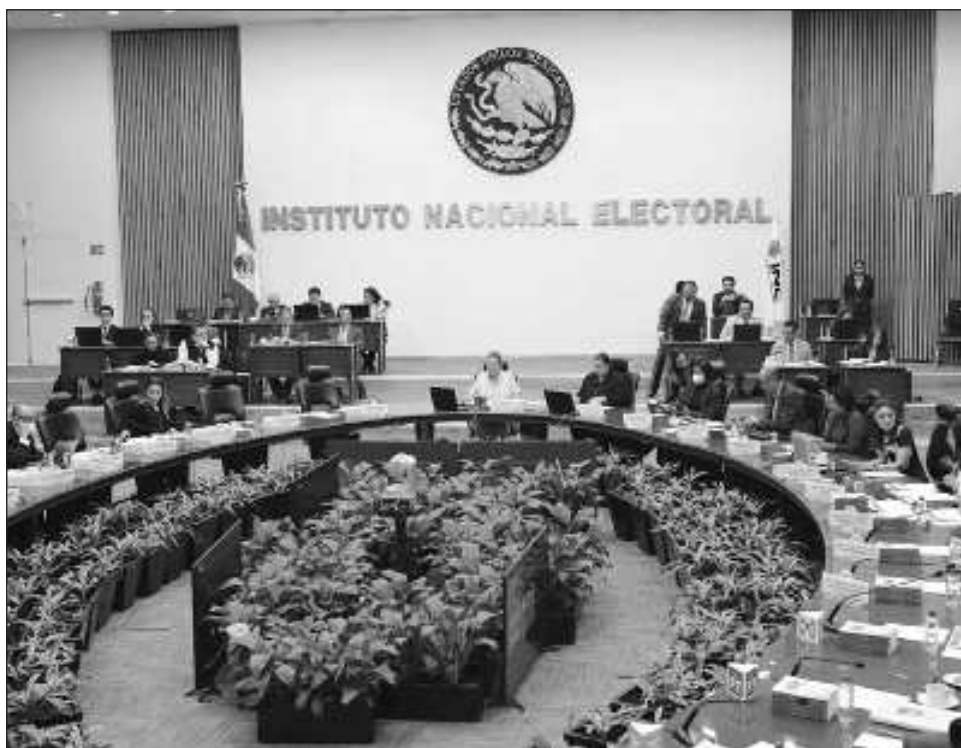
▲ La consejera presidenta Guadalupe Taddei Zavala, destacó la voluntad que han tenido todos los partidos políticos para estar presentes y atender el tema de la seguridad.

“En materia electoral lo que nos ocupa es esta seguridad de las candidaturas y la seguridad al proceso electoral en general”, anotó.