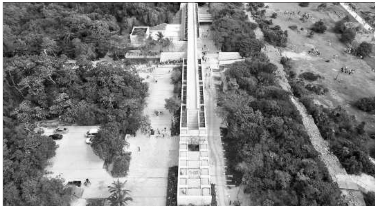
▲ El funcionario federal, Román Meyer Falcón, se trasladó a Tulum, donde informó que el módulo principal de recepción de turistas ya fue entregado al Instituto Nacional de Antropología e Historia (INAH) y se encuentra en operación.

Posteriormente el funcionario federal se trasladó a Tulum, donde informó que el módulo principal de recepción de turistas ya fue entregado al Instituto Na-