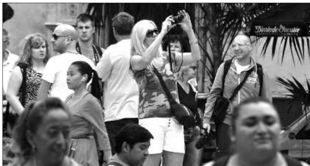
▲ El incremento en la llegada de visitantes, después de la pandemia de Covid-19 y la dramática caída de la actividad turística ocasionada por el confinamiento, no es poca cosa.

Los tiempos electorales inician formalmente en unos cuantos días. Esperamos escuchar evaluaciones objetivas de lo que se ha hecho bien y la manera en que se puede mejorar.