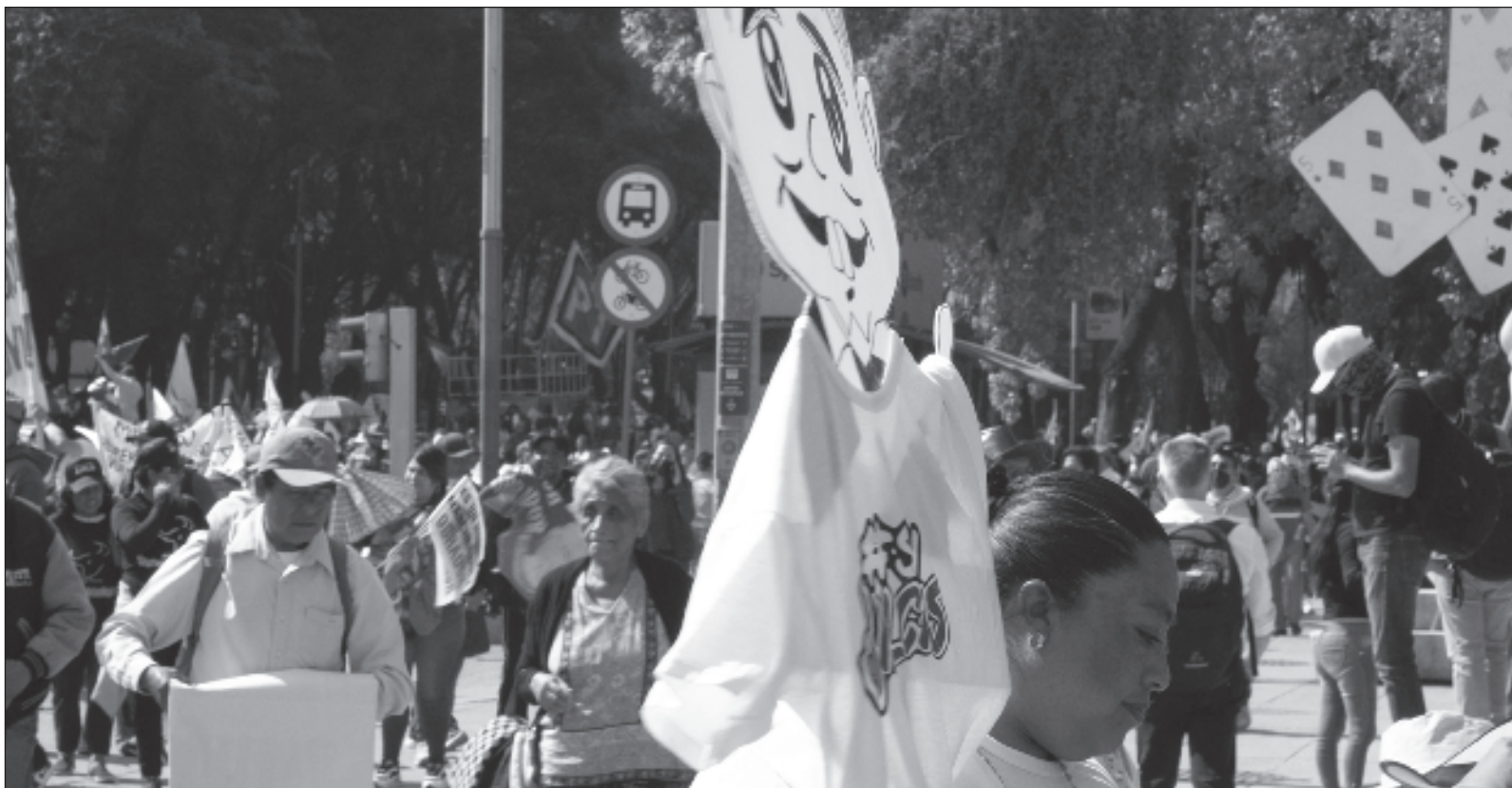
▲ "Embarcados en una transformación, bautizada por ellos mismos como 'la cuarta' de la historia patria, estos revolucionarios del nuevo tiempo mexicano no han parado en mientes cuando de obstáculos se trata y ante cualquier finta de la política o la economía se han distinguido por sus habilidades para esquivarlas, cuando no de plano desaparecerlas del mapa político económico nacional".

Habrà que ver los derroteros del paquete de reformas, su ritmo y compás; también, dilucidar si les asiste razón a quienes han querido ver en tamaño paquete de reformas un compromiso, o un ¿cerrojo? para su sucesora designada o, más bien, se confirma la sospecha, que circula entre no pocos, de que nos han querido tomar el pelo.