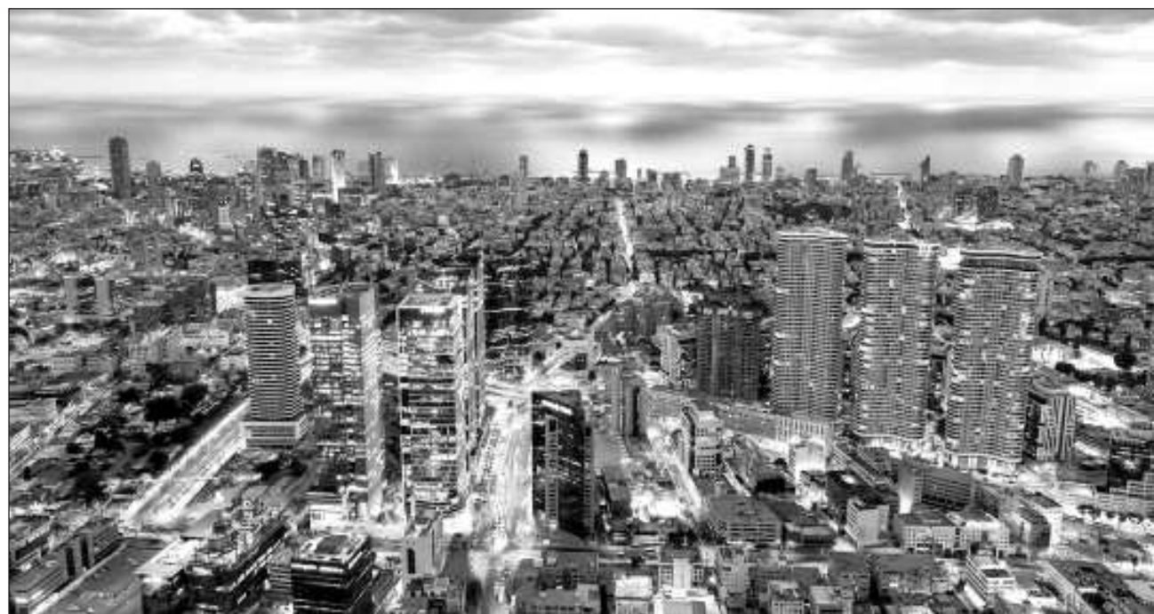
▲ El primer ministro de Israel, Benjamin Netanyahu, puntualizó que “la economía de Israel es fuerte. La rebaja en el rating no está conectada a la economía sino que se debe por completo al hecho de que estamos en guerra”.

El primer ministro de Israel, Benjamin Netanyahu,