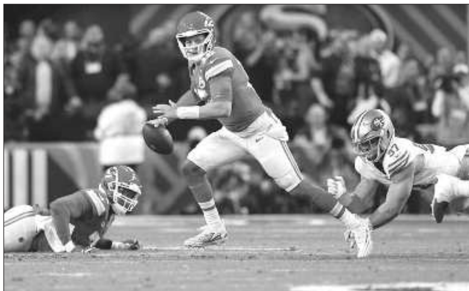
▲ El jefe Patrick Mahomes elude a Nick Bosa durante el Súper Tazón en Las Vegas.

Los Jefes perdían 22-19 luego que Jake Moody pateó un gol de campo de 27 yardas en la primera posesión del tiempo extra, pero Mahomes condujo a los campeones de la Conferencia