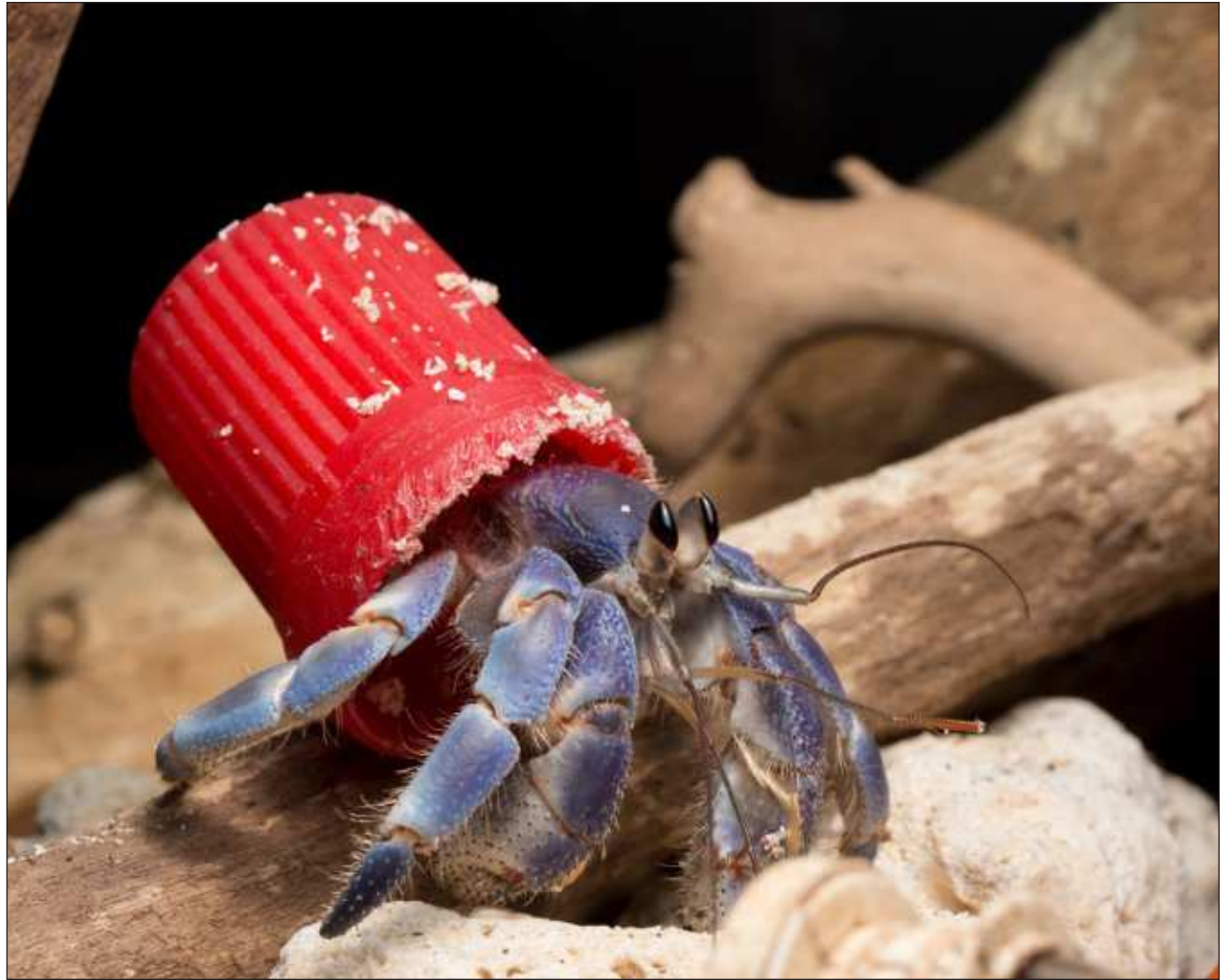
▲ Ti' meyajje' xak'alta'ab u yochelo'ob ba'alche' ti' u baatsil Coenobitidae na'aksa'an Internet.

"Ermitaño xbabe' ku kaxtik bix u kaláantik u nak'o'ob tumen ts'uts'ukil. Suuka'ane', ku ta'akikubáajo'ob ti' uláak' xexo'ob ts'o'ok u kiimilo'ob.