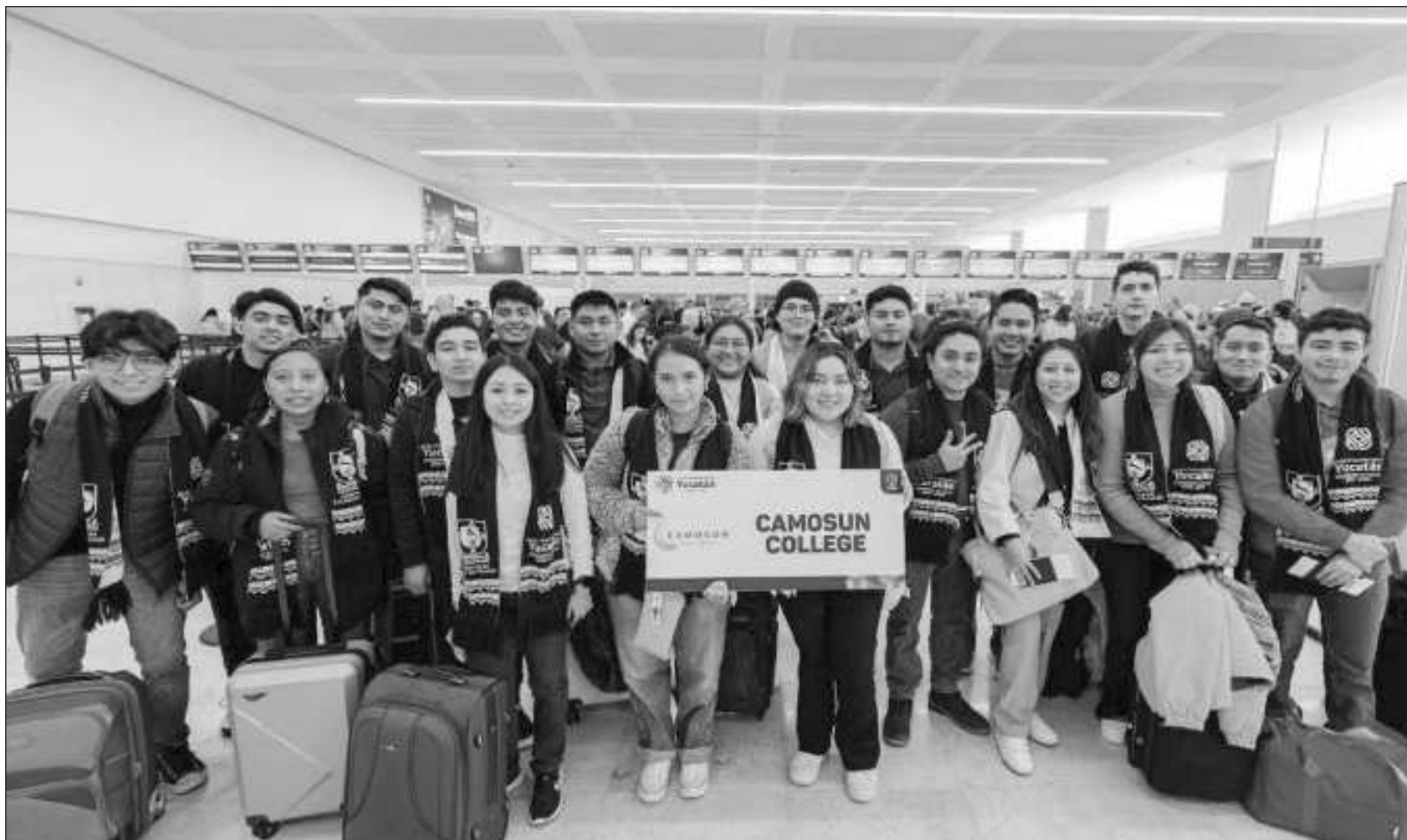
▲ Los primeros jóvenes partieron a Lakehead University mientras que un segundo grupo de estudiantes viajó a Camosun College.