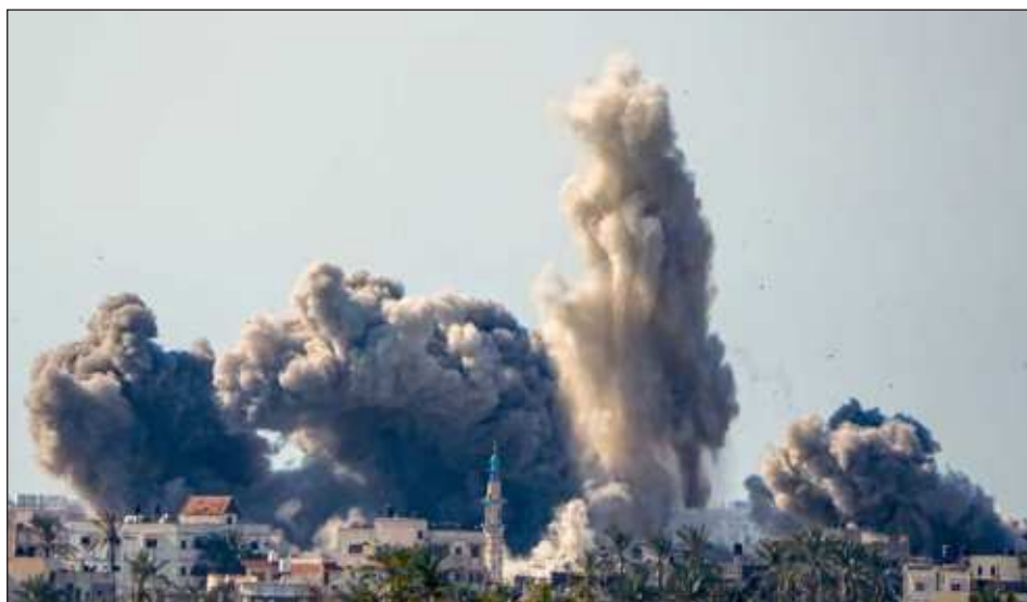
▲ Más de la mitad de los 2.3 millones de habitantes de Gaza han huido a Rafah para escapar de los bombardeos en otros lugares, y están en campamentos de carpas y refugios administrados por la ONU cerca de la frontera.

Más de la mitad de los 2.3 millones de habitantes de Gaza han huido a Rafah para escapar de los