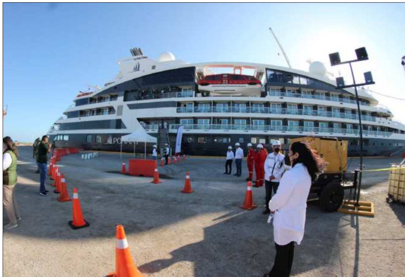
▲ La Sectur subrayó que este año tiene programado que el puerto de Cozumel se mantenga con la primera posición en el arribo de excursionistas en crucero a nivel nacional y de la región Golfo y Caribe, con una participación de 38.4 por ciento del total.

Por su parte, el gasto medio ascendería a 80.9 dólares, cifra similar a 2023, y un incremento de 17.5 por ciento con respecto a 2019.