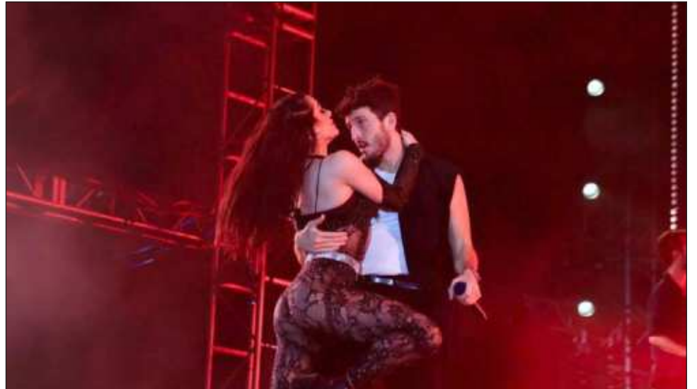
▲ El cantante colombiano puso a cantar y bailar a todo el público asistente con Tacones rojos , Traicionera , Como mirarte y Pareja del año , entre otros éxitos.

El recorrido de comparsas se embelleció con