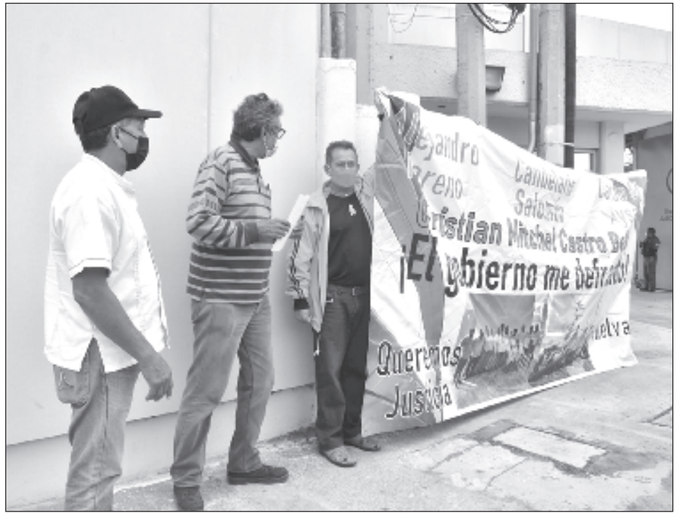
▲ Un grupo de 54 taxistas fue estafado por el funcionario de la administración de Alejandro Moreno: los presionó para que pagaran hasta 350 mil pesos por concesión.

nas, el Fgcam citó al funcionario para comparecer en la Sala de Juicios Orales en una audiencia inicial que abriría la oportunidad de una prisión preventiva o la advertencia de llevar su proceso en libertad condicional, pero esto no se llevó a cabo ante la inasistencia del ex funcionario el pasado viernes, del cual no se sabe de su paradero desde hace un par de años, cuando le dieron de baja del Consejo Jurídico de la Comisión Na-