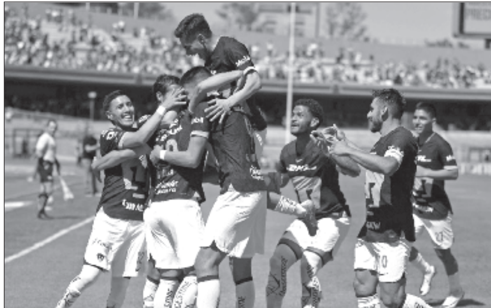
▲ Los Pumas golearon a Puebla con marcador de 3-0 en el estadio Olímpico Universitario..

Poco después, Ávila recibió un trazo largo de 25 metros, en-