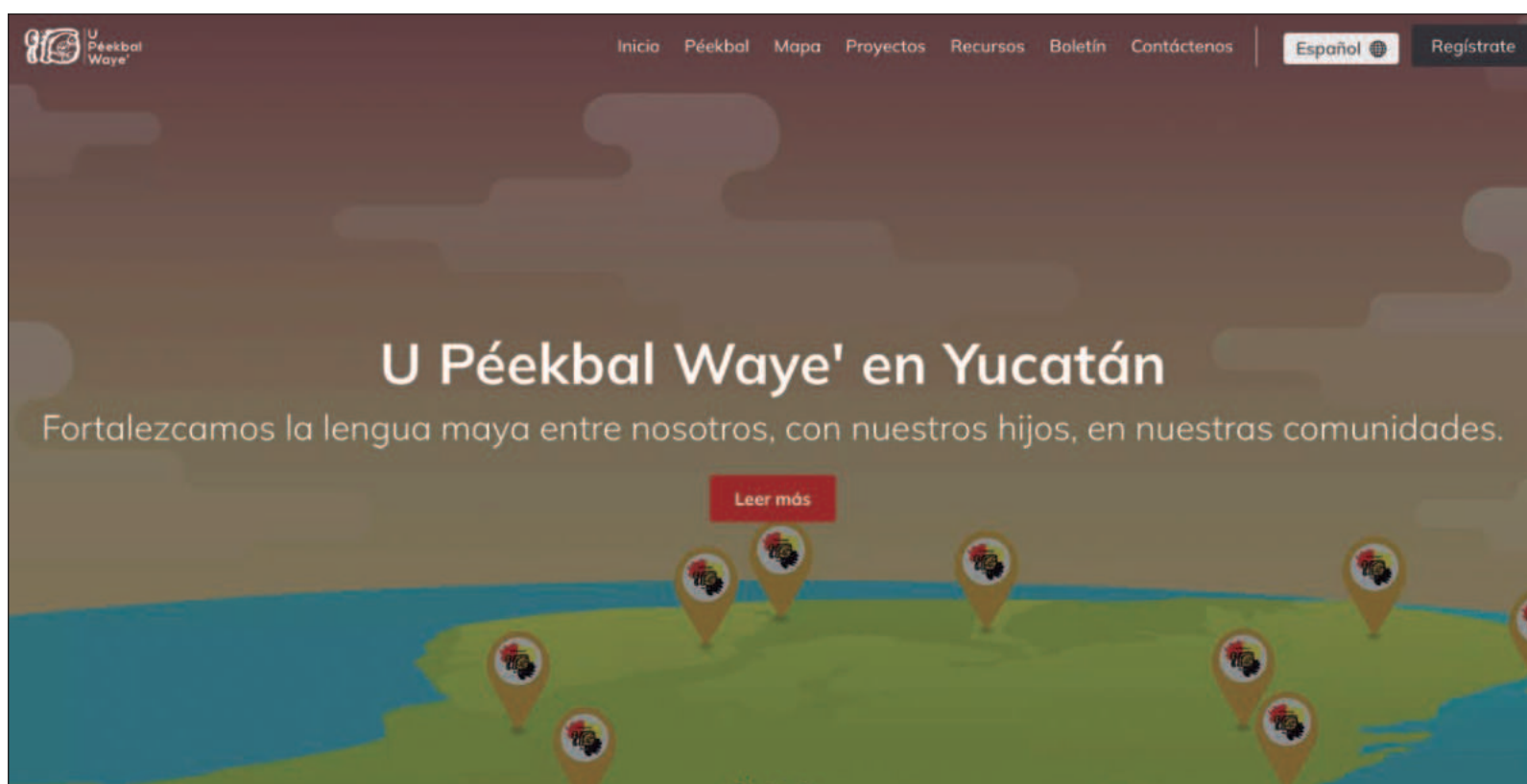
▲ “U éekba Waye’ busca generar un movimiento comprometido con el presente y futuro de la lengua maya”.

manuel.xool@enesmerida.unam.mx y manuel.xool@gmail.com