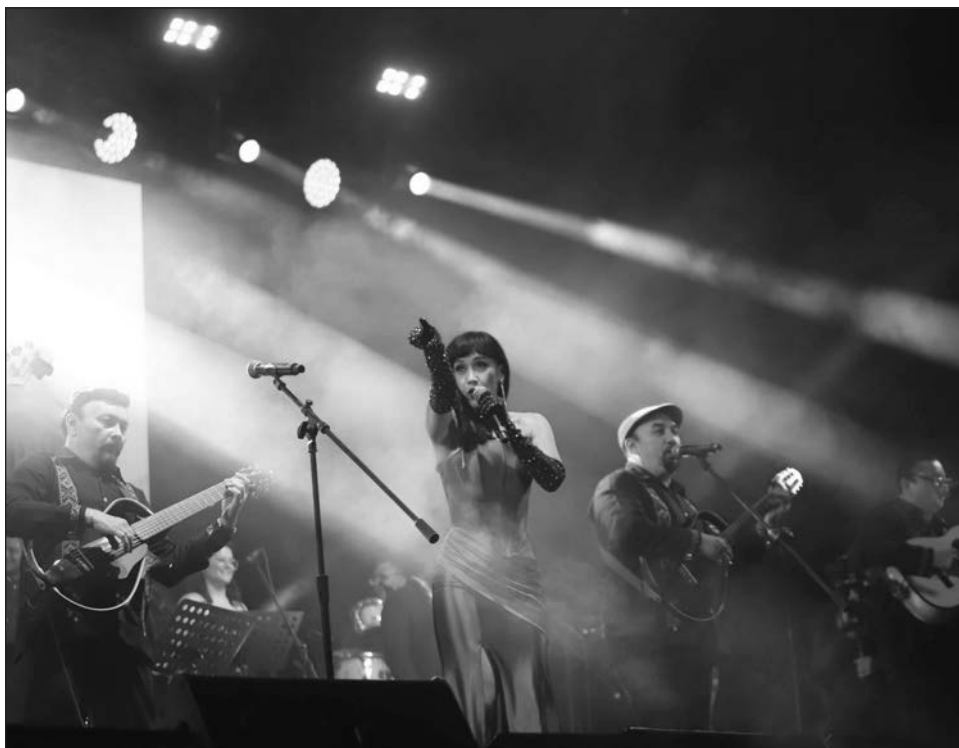
▲ Una noche estrellada fue el marco del espectáculo, estreno mundial en honor del afamado compositor yucateco y evento central del Mérida Fest 2026.

Los eventos del Mérida Fest 2026 continúan hasta el 18 de enero. La cartelera completa se puede consultar en merida.gob.mx/meridafest .