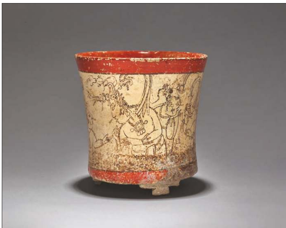
▲ El evento denominado Pre-Columbian Art & Taino Masterworks from the Fiore Arts Collection cerró con la venta de 97 obras de 139 ofertadas.

Puntualiza que para corroborar o rectificar los enunciados del dictamen, deberá considerarse la inspección física de las piezas.