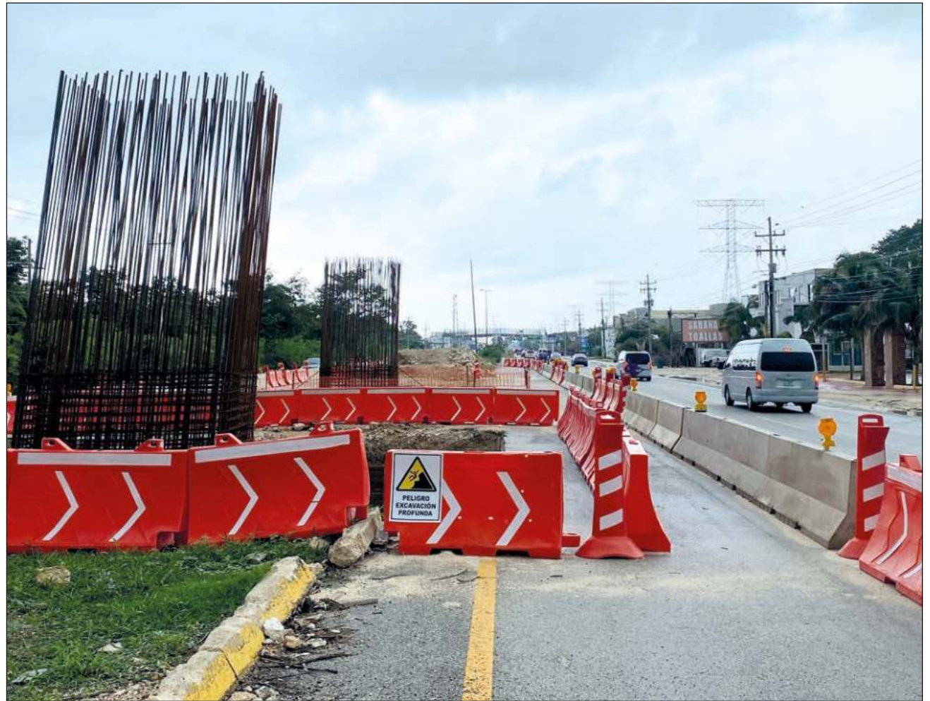
▲ Los hoteleros de la Riviera Maya argumentan que el precio que ofrece la Sedatu por partes de sus predios está por debajo incluso del valor catastral de estos.

Cuestionada al respecto, Lilia González, enlace terri-