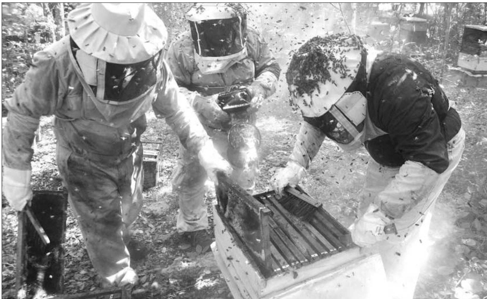
▲ La semana pasada, la empresa Supermiel sufrió el hurto de 27 colmenas, que representan una inversión de aproximadamente 80 mil pesos.