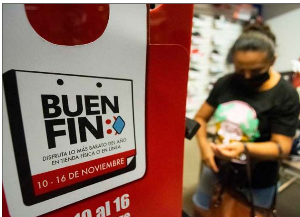
▲ Con motivo de El Buen Fin , se espera bastante movimiento en plazas comerciales y el centro de Mérida.

En este Buen Fin , subrayó, el sector turismo tendrá una mayor presencia con las mejores ofertas, para ampliar la posibilidad a los compradores de planear sus vacaciones a playas, pueblos mágicos y ciudades coloniales, entre otros, para los meses que restan del año y para el 2022.