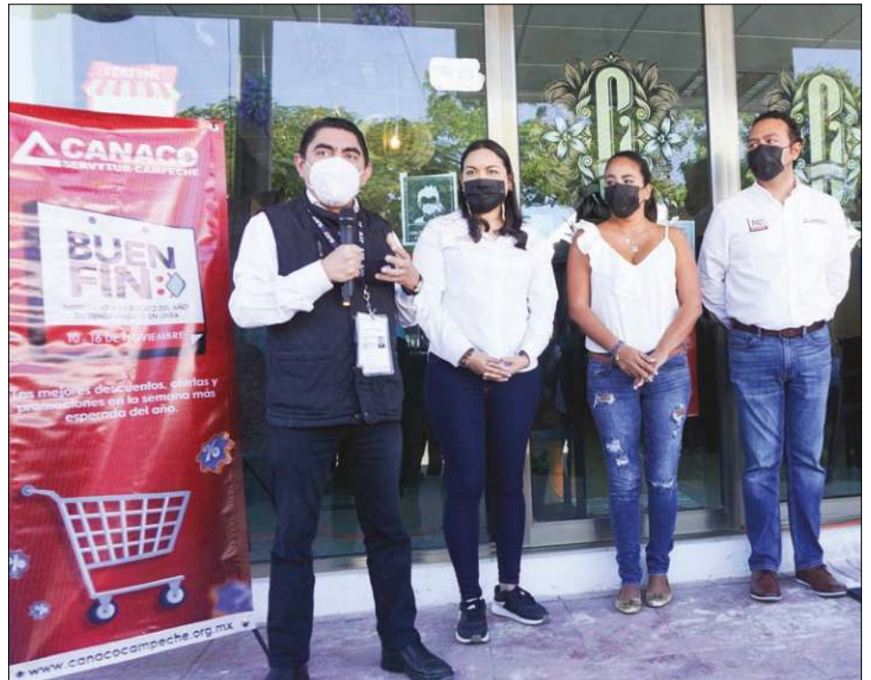
▲ Este año, los consumidores tendrán la oportunidad de escoger productos, ofertas, variedad de mercancía e incluso servicio al cliente, entre establecimientos registrados en la Canaco y otros ajenos a la Cámara que también "le entran a los descuentos".