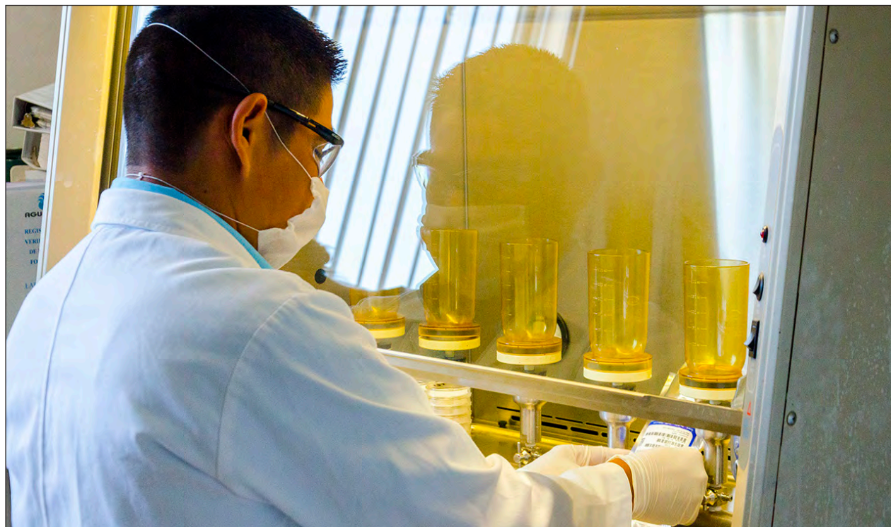
▲ Aguakan lleva a cabo alrededor de 5 mil análisis fisicoquímicos y microbiológicos al mes de muestras de agua potable.

Para garantizar que el agua se encuentre dentro de los estándares óptimos de calidad para uso de los clientes, Aguakan lleva a cabo de manera mensual