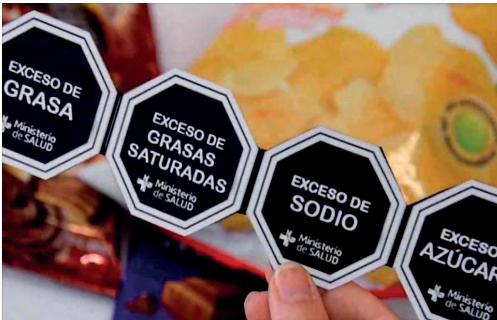
▲ Con el nuevo etiquetado en productos procesados las autoridades de salud esperan reducir padecimientos como la diabetes, la obesidad o problemas cardiovasculares.