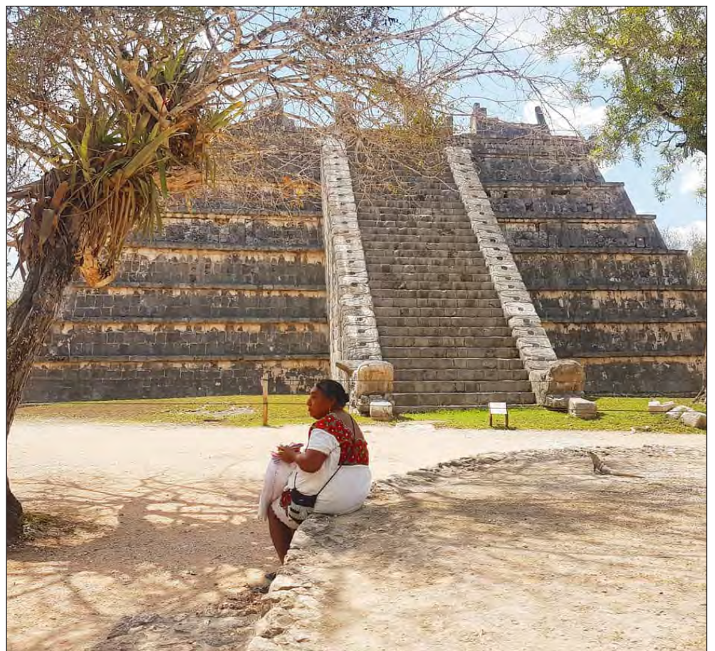
▲ El ORGA atenderá los ámbitos de seguridad alimentaria y pueblo maya, además de economía, empleo, violencia de género y restricciones a la movilidad.