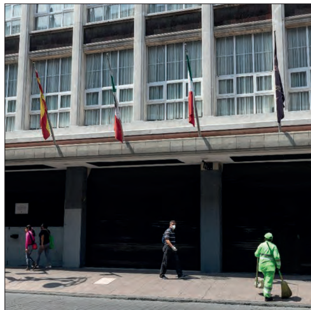
▲ En gran parte del mundo los hoteles permanecen cerrados debido a la pandemia de COVID-19.

Los ingresos totales por esta actividad llevan mayor avance. En abril se reportaron divisas por un monto de 71 millones 800 mil dólares, en mayo crecieron a 33.29 por ciento y en junio a 83.07 por ciento.