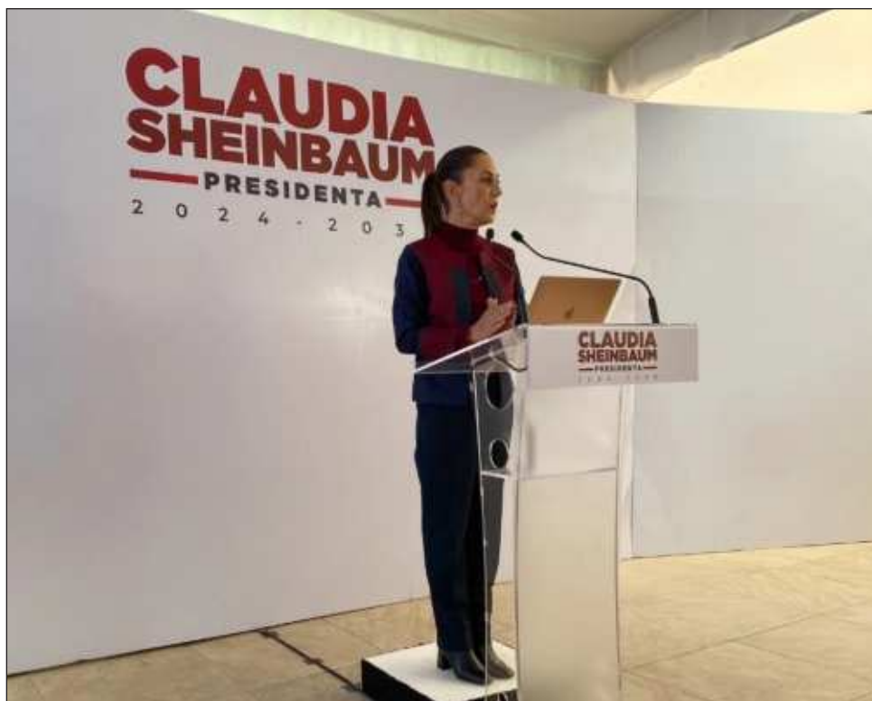
▲ Sheinbaum subrayó que el pronunciamiento de la derecha "es como de mucho autoconsumo. O sea, ¿en quien quieren influir?", y agregó que "se hablan a ellos mismos, porque a quién más".