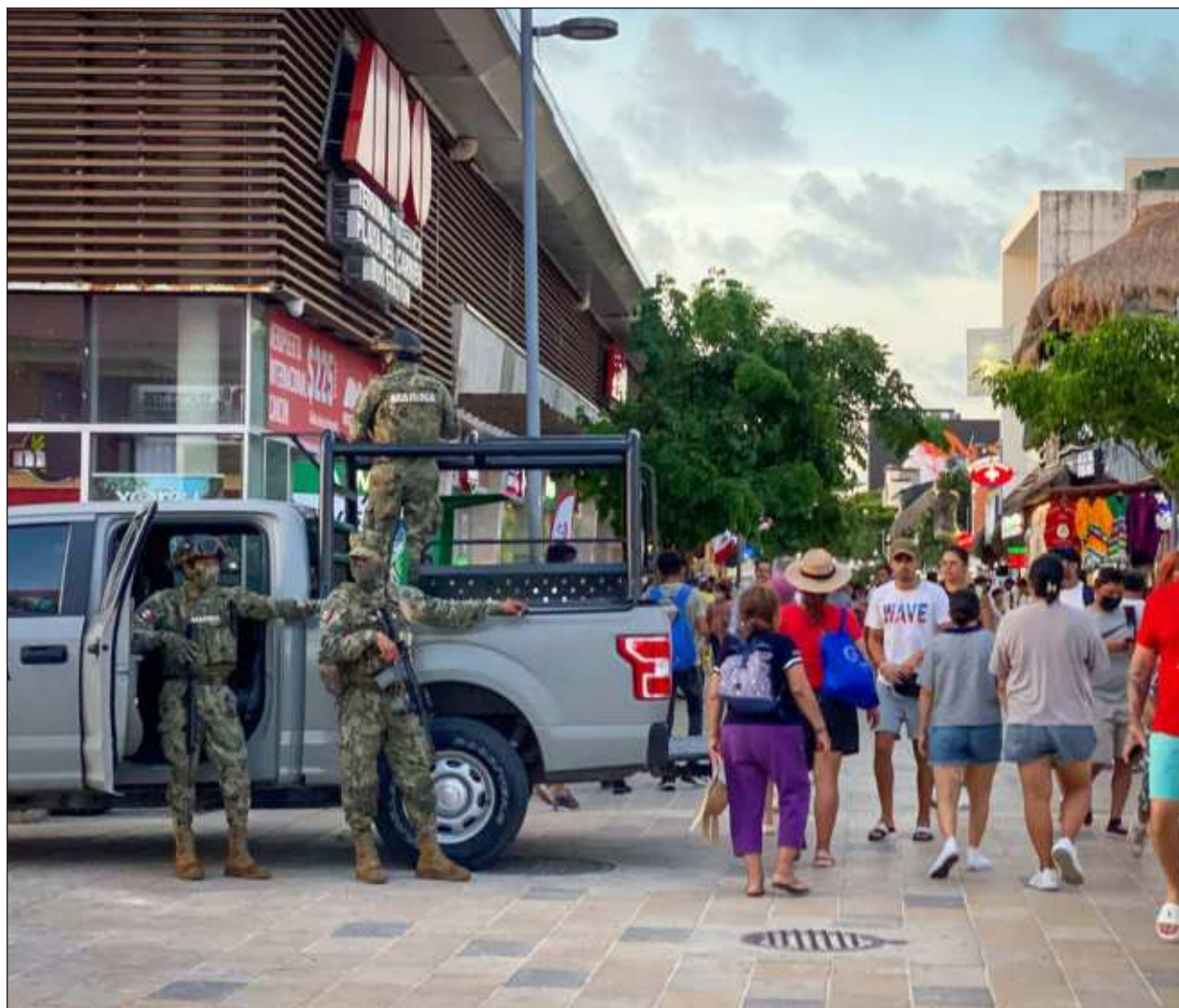
▲ El estado con más delitos sigue siendo Quintana Roo, que alcanzó 27 mil 869 en el primer semestre del año pasado y en este fueron 26 mil 942; mientras que Yucatán tuvo 2 mil 104 el año pasado y en este 2 mil 134.

En el proceso electoral, participaron 258 mujeres, 290 hombres y una persona no binaria. Por lo que 52.6 por ciento de las personas que participaron fueron hombres. 47.3 por ciento fueron mujeres y 0.2 personas fueron personas no binarias.