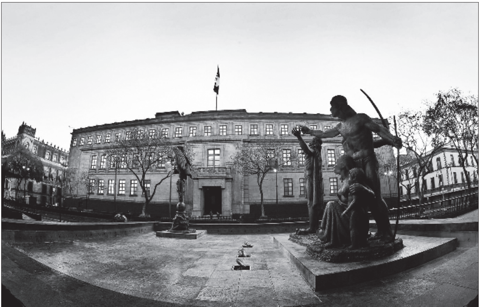
▲ "Los integrantes de la Suprema Corte de Justicia olvidaron que el fundamento de todo poder es el pueblo de México, incluyendo la Constitución".