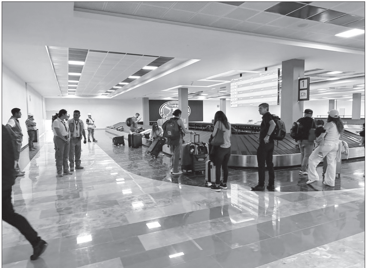
▲ "Hay que hacer caravanas de promoción, seguir insistiendo con las visas, el comportamiento de Migración y Aduanas en el aeropuerto, que sigue dejando que desear", lamentó el presidente del Consejo Hotelero del Caribe Mexicano.

Incluso, dio a conocer que se tiene en planeación la conformación de un fideicomiso que integre a los náuticos, plazas comerciales, el Consejo Coordinador Empresarial y el comité de vecinos de Pok Ta Pok, esto para enfocarse en el mantenimiento de la zona hotelera de Cancún, que es la cara principal que se presenta a los visitantes y que requiere atención total.