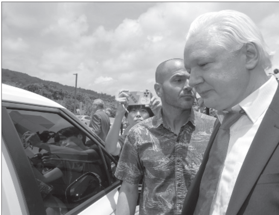
▲ “Como han señalado reiteradamente observadores, el acuerdo de culpabilidad alcanzado con el gobierno estadounidense para obtener su libertad, sienta un precedente peligroso y en realidad criminaliza el periodismo en todo el mundo”.

Como estaba acordado para que obtuviera su liberación, Assange se declaró culpable de conspiración por supuestamente violar la Ley de Espionaje de los Estados Unidos, es decir, por revelar documentos secretos del gobierno estadounidense, de su ejército y diplomacia, en los que se revelan crímenes de guerra y conspiraciones e informaciones delicadas que muestran el verdadero doble rostro de la diplomacia estadounidense.