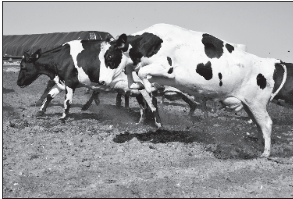
▲ Para la Asociación danesa por una Agricultura Sostenible, el acuerdo es "inútil". Es "un día triste para la agricultura", estimó en un comunicado.

El Parlamento del país escandinavo, que se presenta como uno de los más vir-