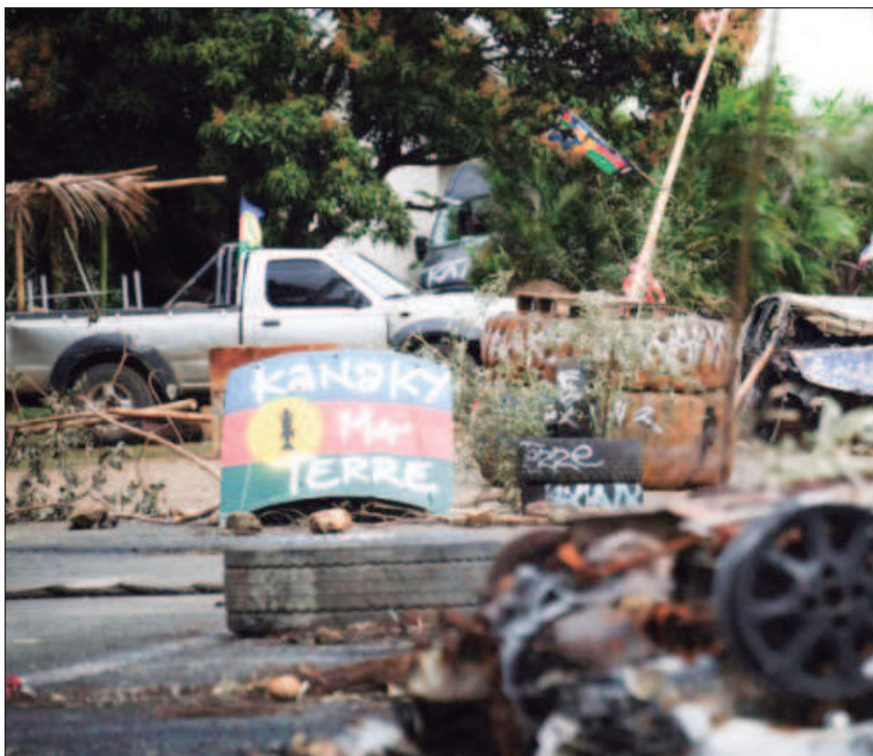
▲ El archipiélago francés es escenario de disturbios desde el 13 de mayo, desencadenados por el plan del gobierno de ampliar el derecho de voto en las elecciones locales a quienes lleven viviendo en el territorio al menos 10 años; fue cancelado en junio.

Muchos canacos, los pobladores locales que constituyen alrededor de 40 por ciento de la población, temían que esta reforma diluyera su influencia en las instituciones caledonias, pero los habitantes contrarios a la independencia querían que se aprobara.