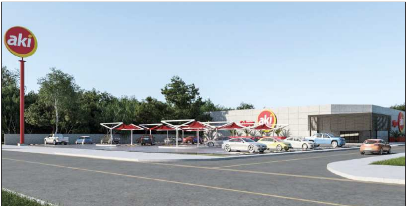
▲ Al igual que el resto de las tiendas de la cadena Súper Akí, la nueva sucursal en Bacalar cuenta con amplias y cómodas instalaciones con 53 cajones de estacionamiento exclusivo para clientes, así como el pago en cajas de una extensa variedad de servicios como: Agua, luz, telefonía o streaming .

A partir de ahora todos los residentes de Bacalar y sus alrededores podrán disfrutar de la amplia variedad y calidad de productos a buen precio, que como ya es costumbre, la cadena de tiendas Súper Akí ofrece, confirmando que... ¡Akí sí me alcanza!.