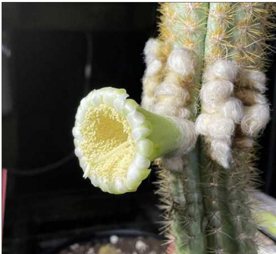
▲ La intrusión de agua salada en el área, la erosión del suelo debido a las tormentas y mamíferos herbívoros, ejercieron presión sobre la población.

Los cactus arbóreos de Cayo Largo continúan creciendo limitadamente en algunas islas dispersas del Caribe, incluido el norte de Cuba.