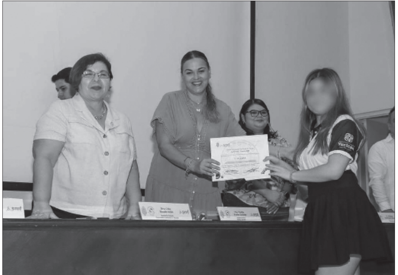
▲ La alcaldesa electa asistió a la premiación de la XXXV Olimpiada Nacional de Física Fase Estatal.

Desde el ayuntamiento se implementarán más es-