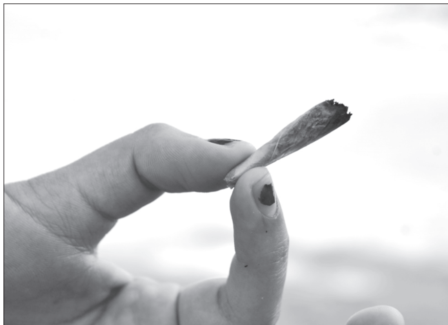
▲ El objetivo de la estrategia es poder ayudar en la detección, tratamiento de trastornos, reducción de la tasa de suicidio y consumo de sustancias psicoactivas.

“Esta Comisión Estatal en Salud Mental permitirá la implementación de programas integrados con la finalidad de realizar diagnósticos pertinentes que identifiquen con mayor claridad las necesidades, aplicar protocolos de calidad, impulsar estrategias legislativas y generar más promoción de salud mental. Nos ayudará con la detección y tratamiento de trastornos y reducción de la tasa de suicidio y adicciones”, aseguró Castillo Avendaño.