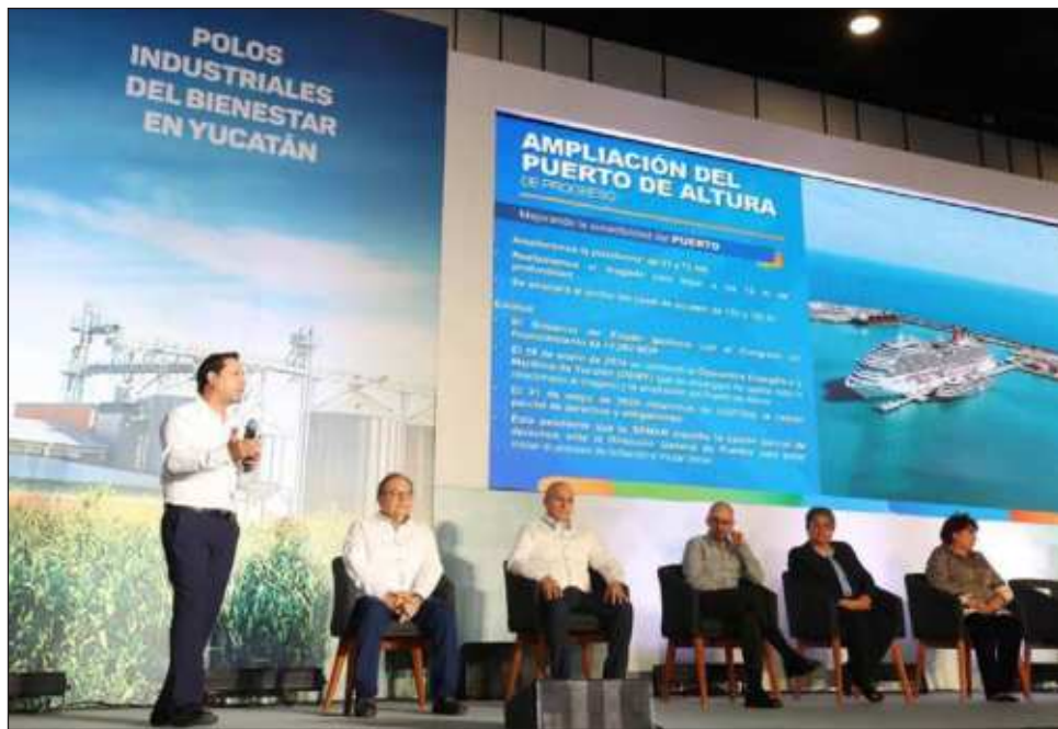
▲ El proyecto busca el detonar el desarrollo con 11 actividades económicas. El gobernador Mauricio Vila destacó que estos polos atraerán a industrias que ofrecen empleos mejor remunerados, pero que requieren de personal especializado.

Se trata de una iniciativa consolidada entre el gobierno estatal y el gobierno federal que establece dos puntos, uno en Progreso y uno en Mérida, para llevar a cabo 11 actividades económicas: sector eléctrico y electrónica; semiconductores; automotriz; autopartes y equipo de transporte; dispositivos médicos; farmacéutica; agroindustria; equipo de generación y distribución de energía eléctrica; maquinaria y equipo; tecnologías de la información y la comunicación; y metales y petroquímica con la finalidad de