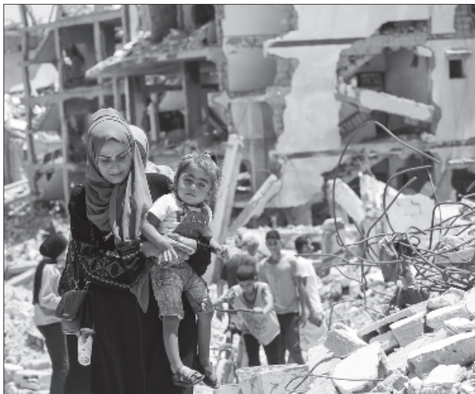
▲ El nuevo asalto israelí a Gaza ha provocado lo que la ONU ha denominado un éxodo "peligrosamente caótico" de personas que se dispersan en múltiples direcciones sin saber adónde ir.

En una visita el miércoles al centro de Gaza, el jefe militar israelí, teniente general Herzi Halevi, dijo que el ejército está operando de distintas maneras en distintas partes del territorio "para llevar a cabo una misión muy importante: ejercer presión. Segui-