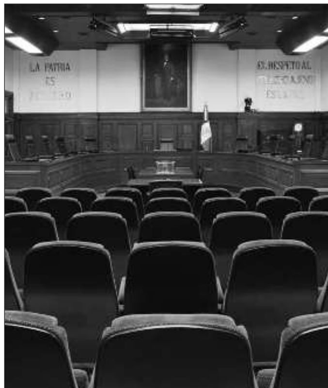
▲ La SCJN ha sido la institución que dicta el criterio final de interpretación de la ley en casos en los que las autoridades son parte.

De manera tardía, Norma Piña ha reconocido la necesi-