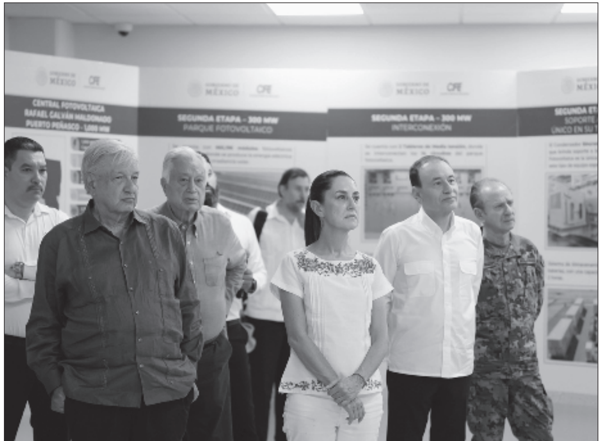
▲ "Si la nueva presidenta muestra tales virtudes, es posible que más bien se deba a una vida que la hizo sensible a la injusticia, a su trayectoria como luchadora social. En definitiva, a haber crecido en una comunidad preocupada por el futuro colectivo".

AHORA BIEN, TAMBIÉN encuentro dos prejuicios que fácilmente pueden colarse en la concepción de una presidenta