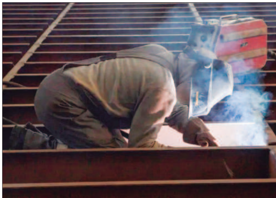
▲ Se impondrá arancel de 25% al acero no fundido o vertido en México, y 10% al aluminio.

Se impondrá un arancel de 25 por ciento al acero no fundido o vertido en México, y de 10 por ciento al aluminio. Esta acción también es un claro golpe político contra el