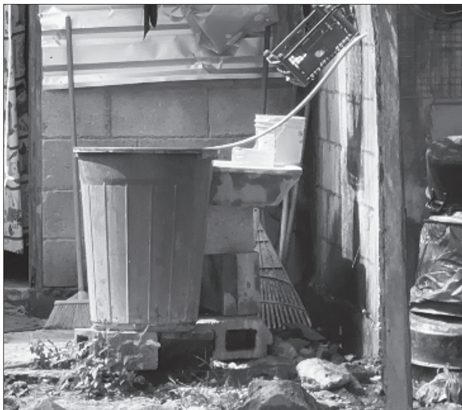
▲ Consultorio de Coin Tree atiende hasta 17 personas al día por diarrea.

La médico general explicó que la fundación Coin Tree, además de proveer educación y prosperidad económica, también brinda consultas médicas y entrega medicamentos gratuitos a personas de escasos recursos. Además, Contreras Gómez explicó que aconsejan a los habitantes de estas zonas limpiar constantemente sus tinacos o recipientes donde almacenan el vital líquido cada tres o seis meses, y mantener herméticos estos sitios donde disponen del agua para cocina, lavado corporal y de su ropa.