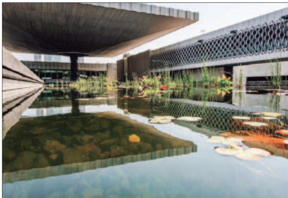
▲ El director del Instituto Nacional de Antropología e Historia, Diego Prieto Hernández, pidió ayuda para desmentir la oferta de paseos personalizados por un valor de 5 mil 707 pesos; “ni el MNA ni el patronato del museo organiza esa supuesta visita especial”, dijo.

El director del Instituto Nacional de Antropología e Historia (INAH), Diego Prieto Hernández, negó que en el Museo Nacional de Antropología (MNA) se realicen “recorridos personalizados fuera del horario habitual” por un valor de 5 mil 707 pesos, como lo difundió la plataforma Priceless de Mastercard en su página electrónica y redes sociales.