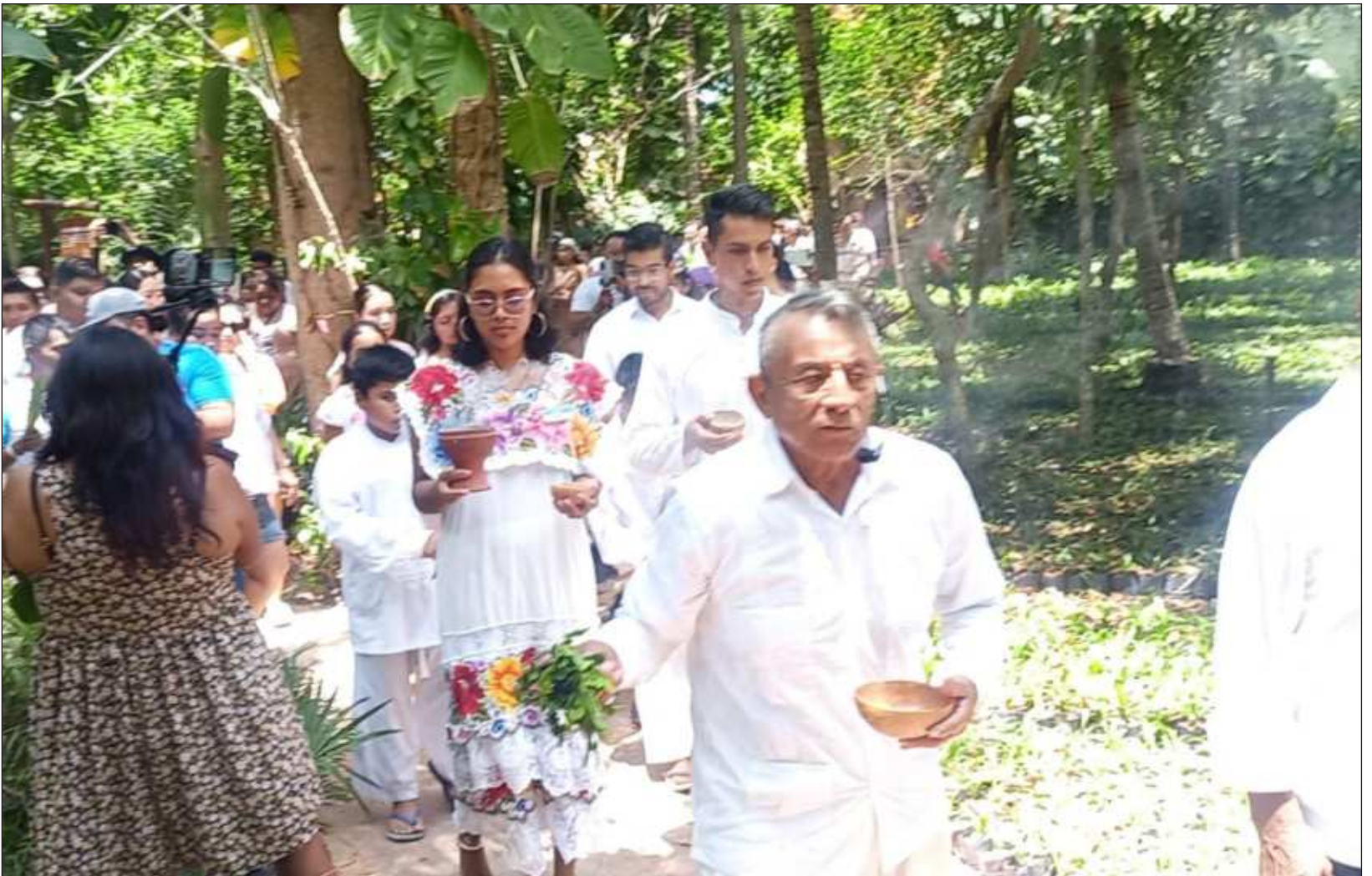
▲ La abeja melipona ha sido venerada por los mayas desde la antigüedad debido a su invaluable contribución a la polinización y sus propiedades medicinales.

En la época prehispánica se realizaban entre cuatro y seis ceremonias como esta al año; actualmente se celebran dos veces al año en Xel Há. Asimismo, se dio a conocer que el parque Xel Há, ubicado en Tulum, se convirtió en el primer parque en el mundo en obtener certificación Master por parte de la organización Earth Check.