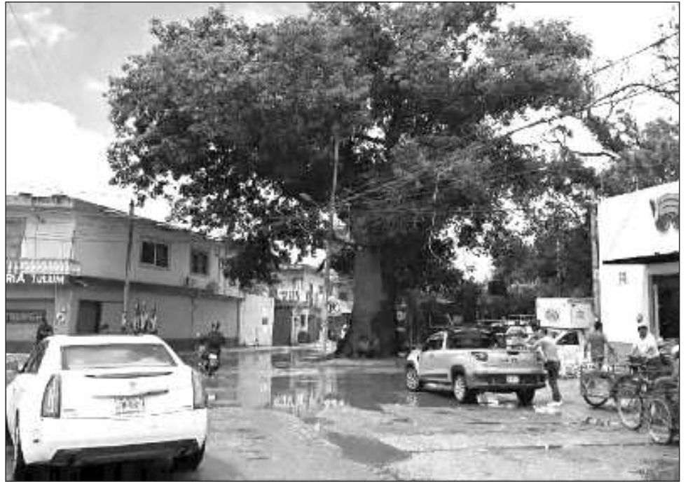
▲ En un recorrido por la zona céntrica se pudo observar que el tránsito vial presentó problemas debido a que no serían los semáforos, mientras que los comercios lucían vacíos desde la mañana.