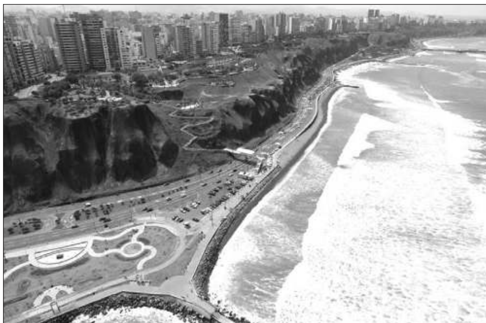
▲ La cancillería peruana señaló que esta medida se toma en vista del llamado de “diversas voces del sector turismo y afines” que en días anteriores solicitaron la eliminación del visado.

Cancillería anunció que la eliminación del decreto se haría oficial el jueves 11 de abril.