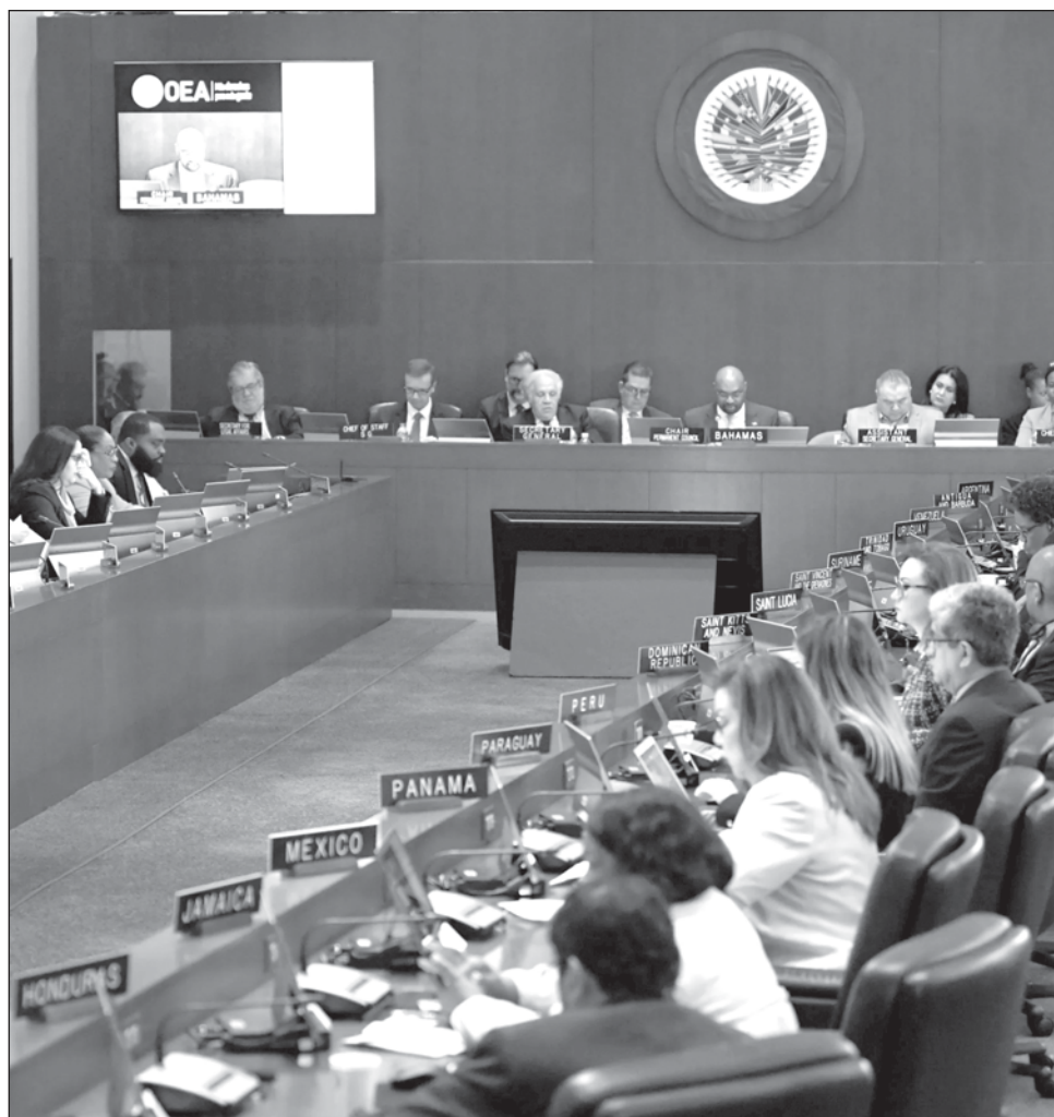
▲ La Organización de los Estados Americanos exhortó al diálogo entre Ecuador y México, y también se ofreció a mediar "para facilitar todo esfuerzo que pueda ser útil".

Además, se instruyó a la Secretaría General de la OEA a comunicar la resolución al secretario general de la ONU, António Guterres.