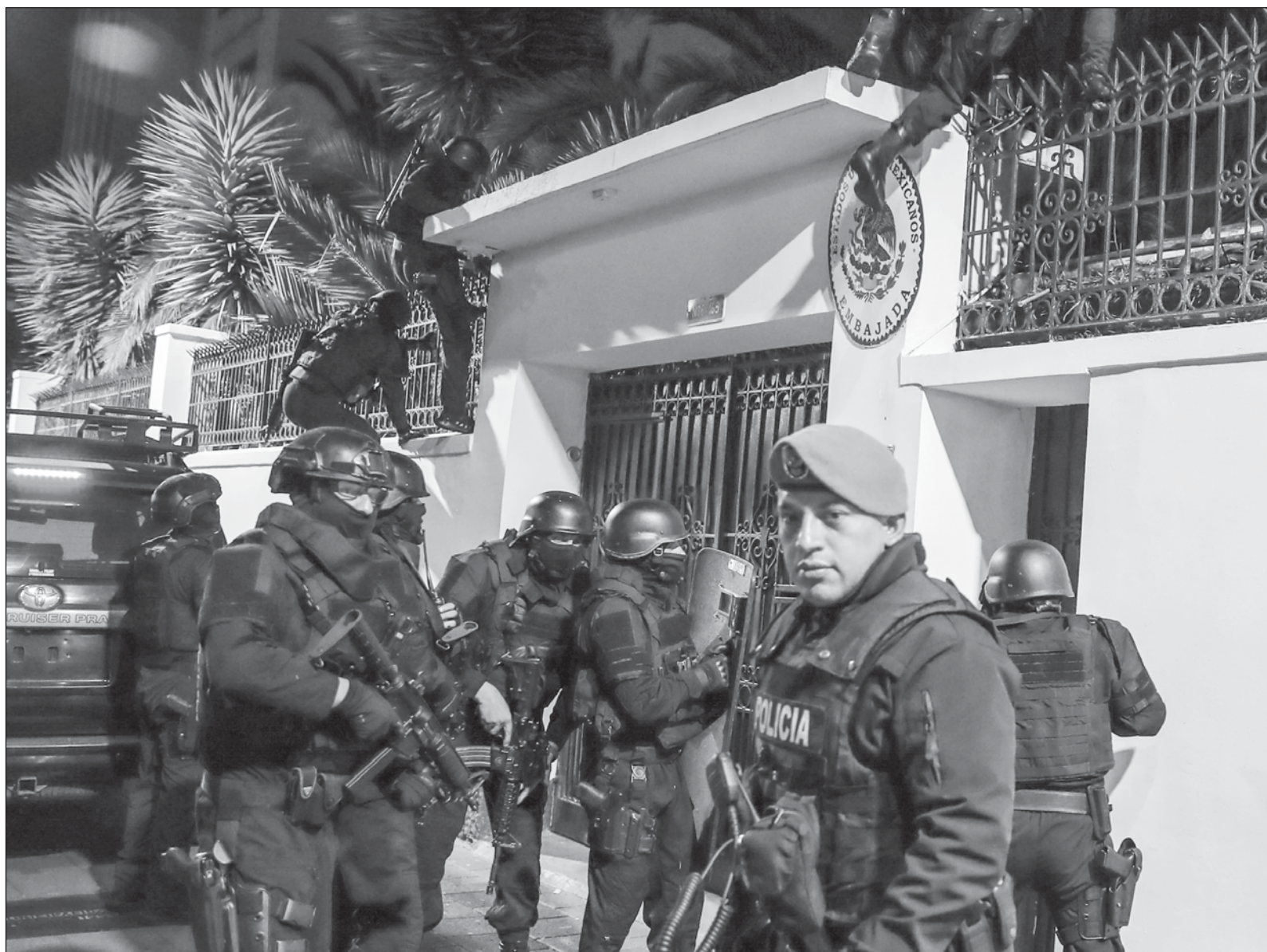
▲ "Lo que sucedió en la embajada mexicana en Ecuador es un acto de barbarie. Hubo allanamiento, vejación al personal diplomático y daños materiales".