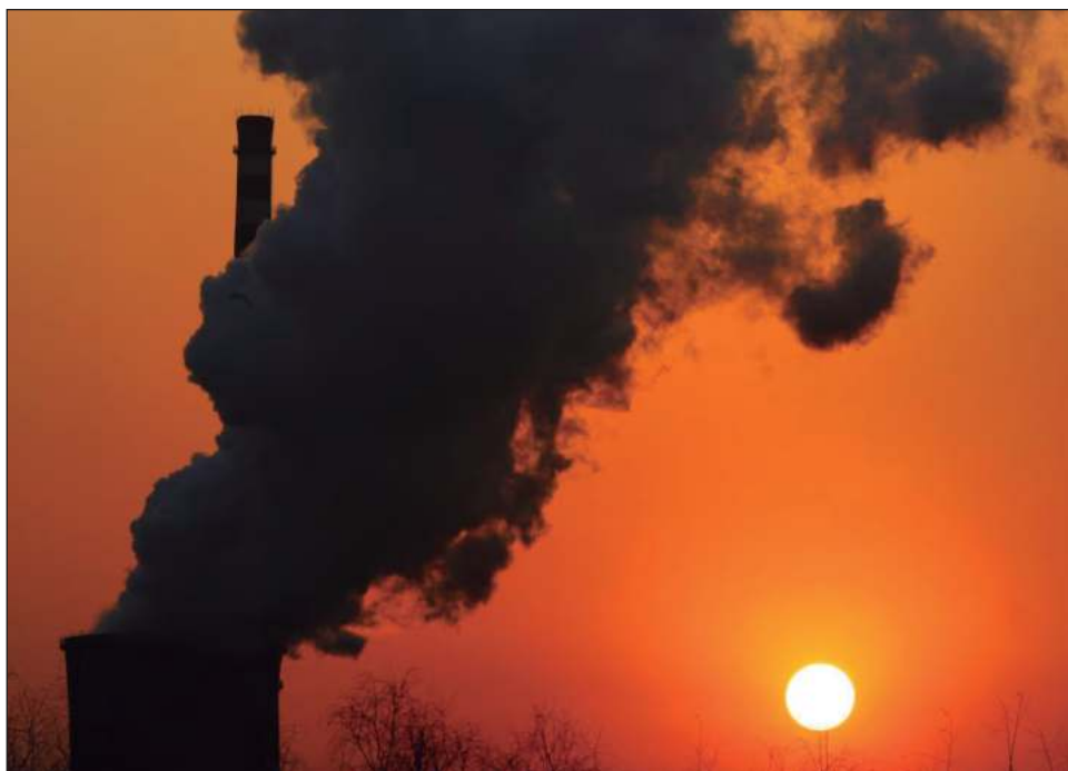
▲ El alto cargo de la ONU dijo que el grupo de las 20 principales potencias económicas necesitaba urgentemente dar un paso al frente en la lucha contra el calentamiento global.

Stiell dijo que el Grupo de las 20 principales potencias económicas -responsables de 80 por ciento de las emisiones globales- necesitaba urgentemente dar un paso al frente.