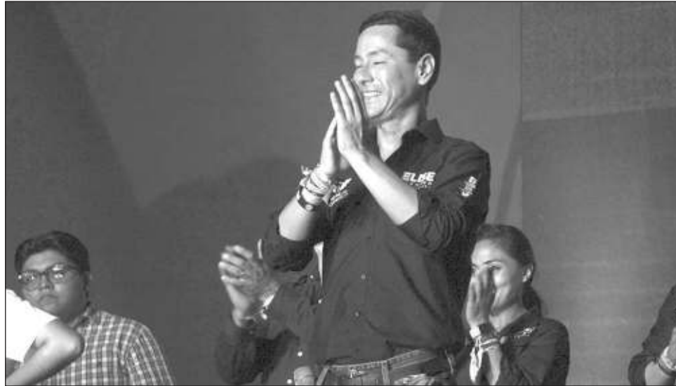
▲ Este martes el magistrado del TEPJF, Felipe Fuentes Barrera, ingresó un contraproyecto donde señala que no se dio derecho de audiencia a la dirigencia de MC para reformular sus inscripciones.

El pasado 21 de marzo, el Consejo General del INE canceló mediante acuerdo la inscripción de Eliseo Fernández Montúfar y Daniel Ba-