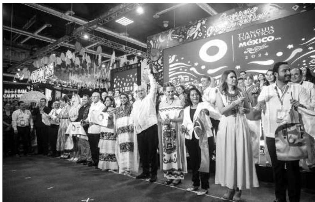
▲ El tianguis tiene un alto valor simbólico en esta ocasión: representa la capacidad de respuesta ante la adversidad y una oportunidad para promocionar las obras que está dejando el gobierno federal.

La edición 48 del Tianguis Turístico en Acapulco ha hecho visible que México posee una fuerte vocación turística y una extensa variedad de destinos para todos los gustos, y que seguirá siendo un gran destino por sí mismo aunque en alguno existan dificultades causadas por desastres naturales. Lo principal es que también ha dejado una enorme lección acerca del potencial de recuperación que se posee cuando una eventualidad golpea de manera inmisericorde algunos de los lugares más queridos por los mexicanos, como es Acapulco.