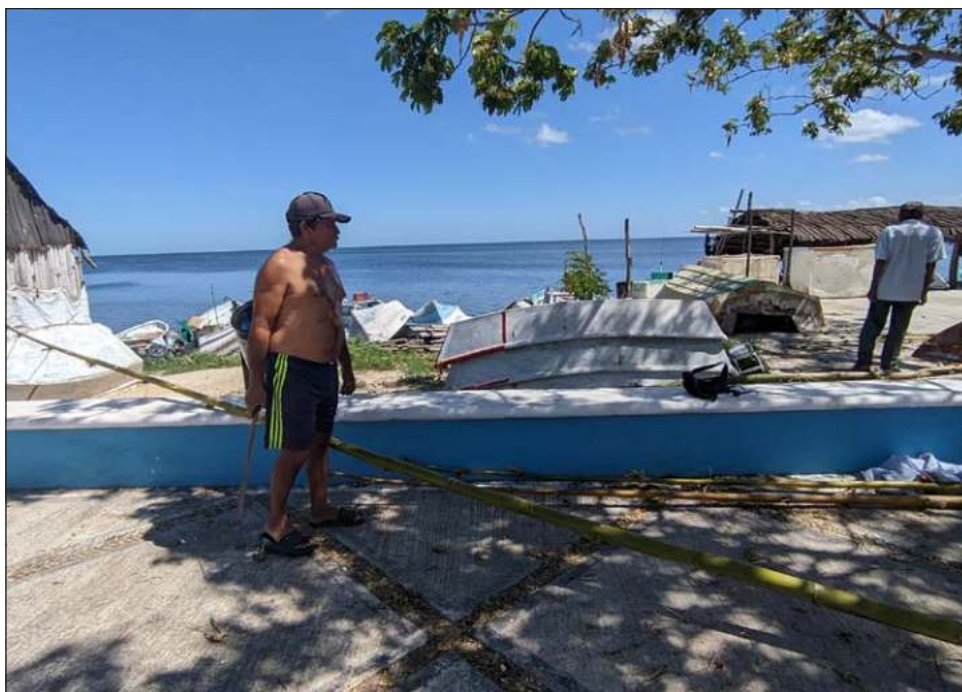
▲ El IEEA invitó a los pescadores a que se tomen un tiempo para acudir con su documentación a cualquier plaza comunitaria, puntos de encuentro o círculos de estudio.

Los requisitos para estudiar son los siguientes, primaria: Clave Única de Registro de Población (CURP), fotografía digital, boleta de grado aprobado (en caso de tener). Para secundaria: Clave Única de Registro de Población (CURP), fotografía digital, certificado de primaria, boleta de grado aprobado (en caso de tener).