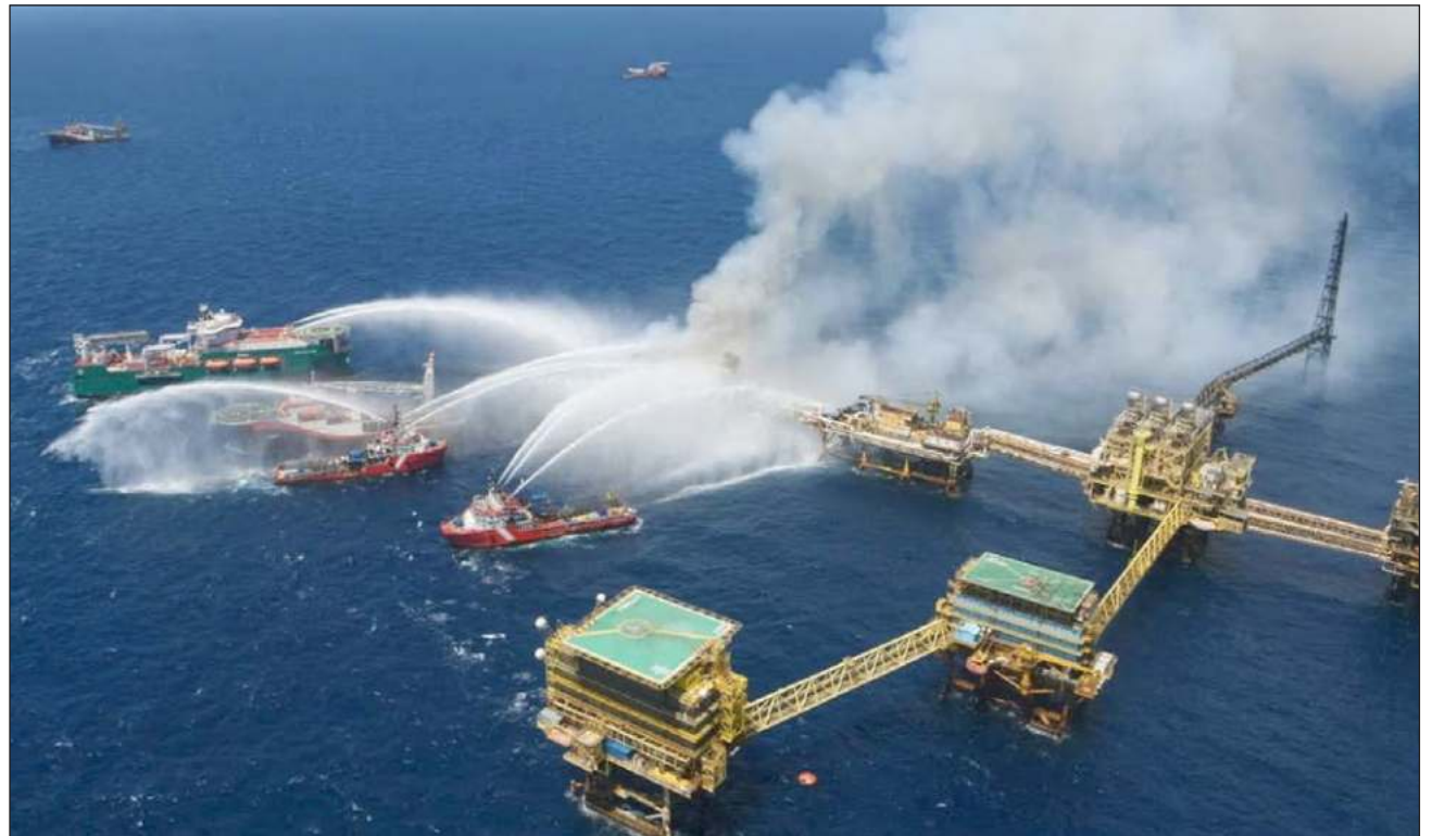
▲ Datos proporcionados por la petrolera nacional, a través de la Plataforma Nacional de Transparencia (PNT), destacan que de enero del 2018 a abril de 2024 se registraron 14 mil 147 eventos de riesgo en las instalaciones de Pemex en todo el país.

También se cuenta lo ocurrido en agosto 23 del