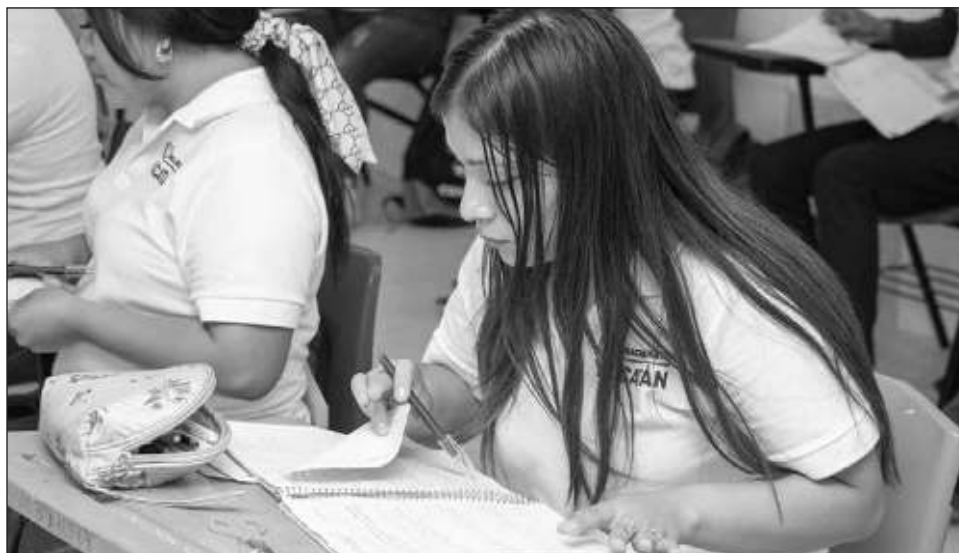
▲ Actualmente Bachillerato Yucatán cuenta con 28 planteles ubicados en 20 localidades del interior del estado, cada uno con una capacidad de 120 cupos para los tres grados.

A fin de asegurar espacio, inicialmente pueden