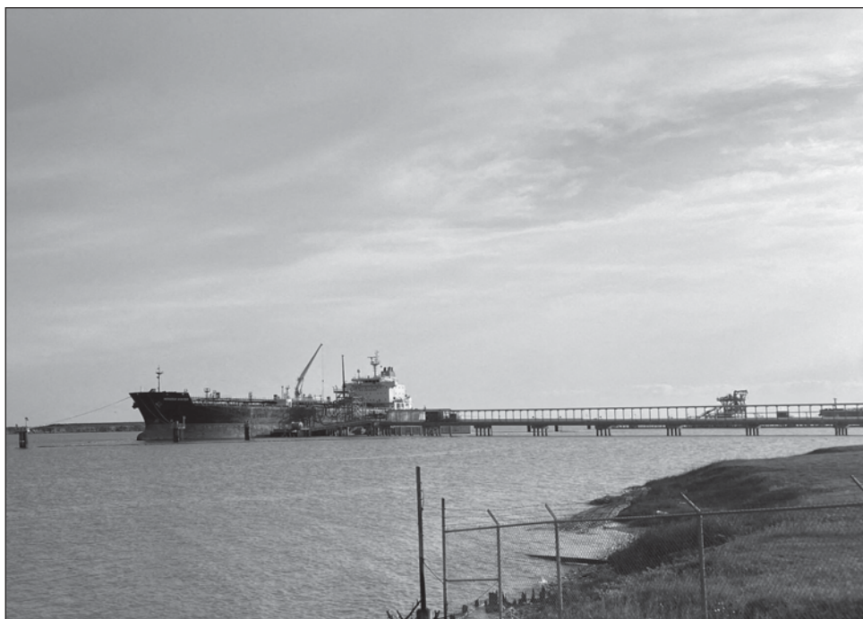
▲ Pemex solicitó a su unidad comercial cancelar hasta 436 mil bpd de exportaciones de crudo para abril y al menos 330 mil bpd para mayo para retener suministros para sus propias refinerías.

Pemex reveló el mes pasado que su producción de crudo en febrero había caído a su nivel más bajo en 45 años.