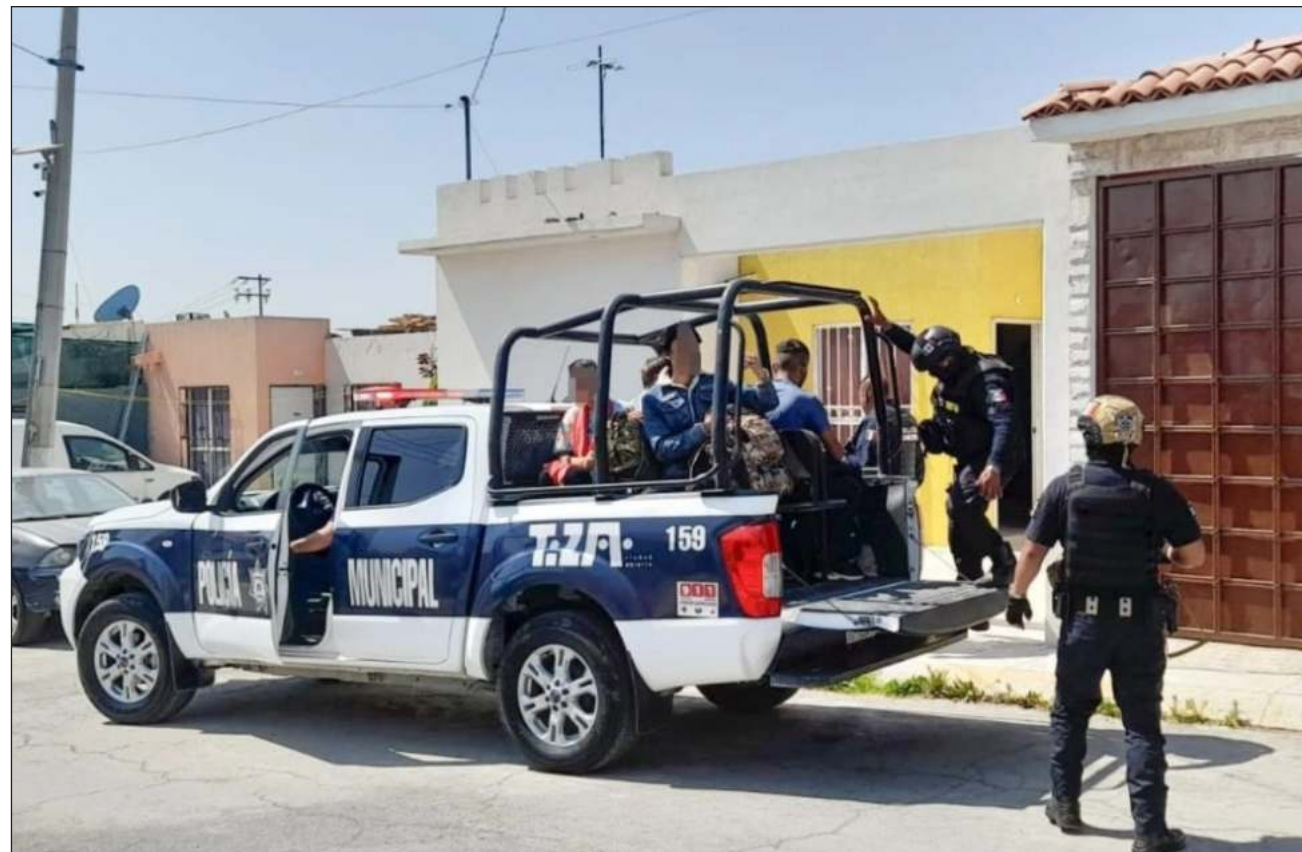
▲ De acuerdo con el reporte de la policía, una de las detenidas ofreció un soborno de 20 mil pesos, además de presumir que pertenecía a un grupo criminal. Las autoridades no informaron si las personas secuestradas eran víctimas de extorsión o si eran indocumentados.

A consecuencia del llamado de auxilio de los extranjeros, los policías pidieron a las mujeres les permiti-