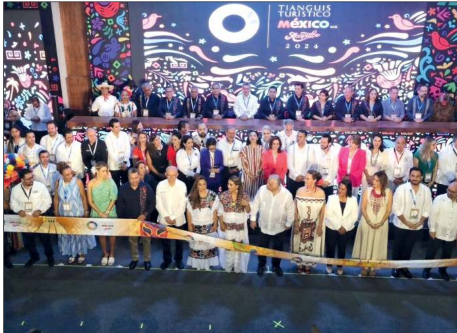
▲ El titular de la Sectur participó en la ceremonia de corte de listón de la 48 edición del Tianguis Turístico, para posteriormente realizar el recorrido con el cual se da el visto bueno para que arranquen las citas de negocio y las exposiciones.