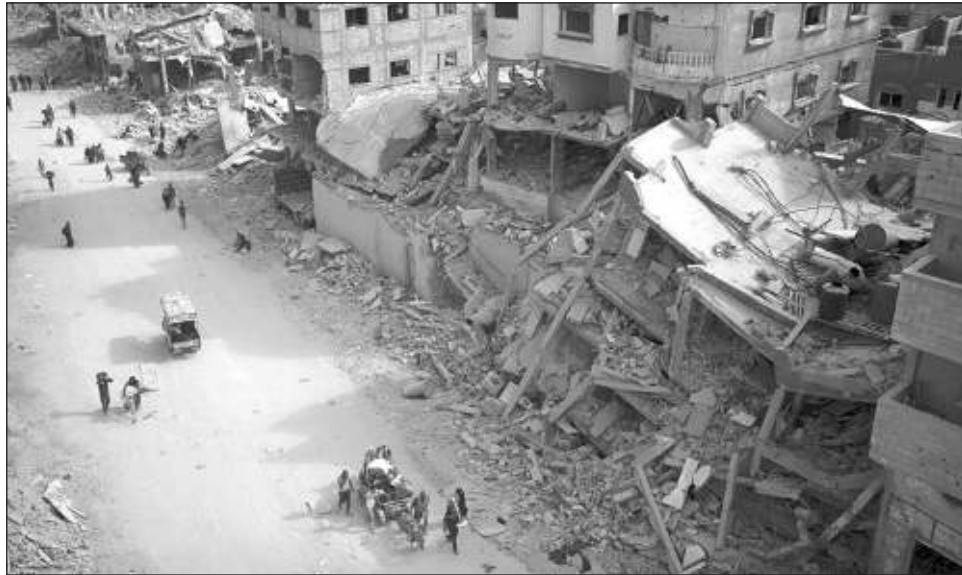
▲ Un dron israelí alcanzó el vehículo en el campo de refugiados de Al Shati, en el norte del territorio palestino, causando la muerte de los tres hijos de Haniyeh y de cuatro de sus nietos.

Según la cadena catari, un dron alcanzó el vehículo de la familia en el campo de refugiados de Al Shati, en el norte del estrecho y de-