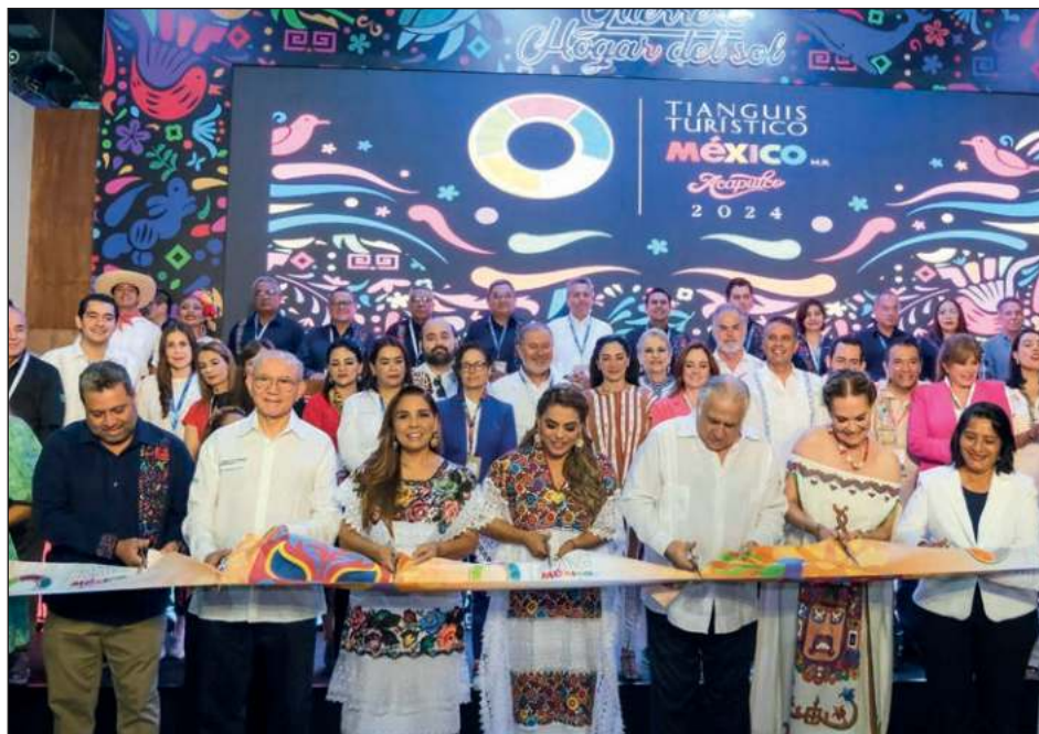
▲ La gobernadora Mara Lezama participó en el corte del listón inaugural del pabellón del Caribe Mexicano en la 48 edición del Tianguis Turístico.

Instalado en una superficie de 450 metros cuadrados de la Expo Mundo Imperial, el pabellón del Caribe Mexicano impone con su presencia, experiencia y liderazgo turístico entre los demás estados de la república y entre alrededor de 97 pabellones divididos entre