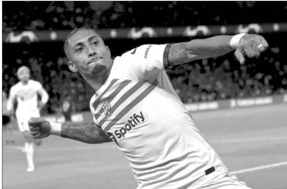
▲ Raphinha, del Barcelona, festeja luego de anotar el segundo tanto de su equipo ante el PSG.

"Habíamos hablado de este tipo de cambios, de que con Pedri seguramente jugaría media hora después de la lesión. Ha estado extraordinario, nos ha dado pausa, calma y es un futbolista diferencial en este sentido. Lo ve todo. Entonces, el pase es extraordinario y ahí nos ha venido muy bien ese empate, porque la segunda parte, para acabar de madurar, tenemos que entender que tenemos que salir mejor en la segunda parte", explicó