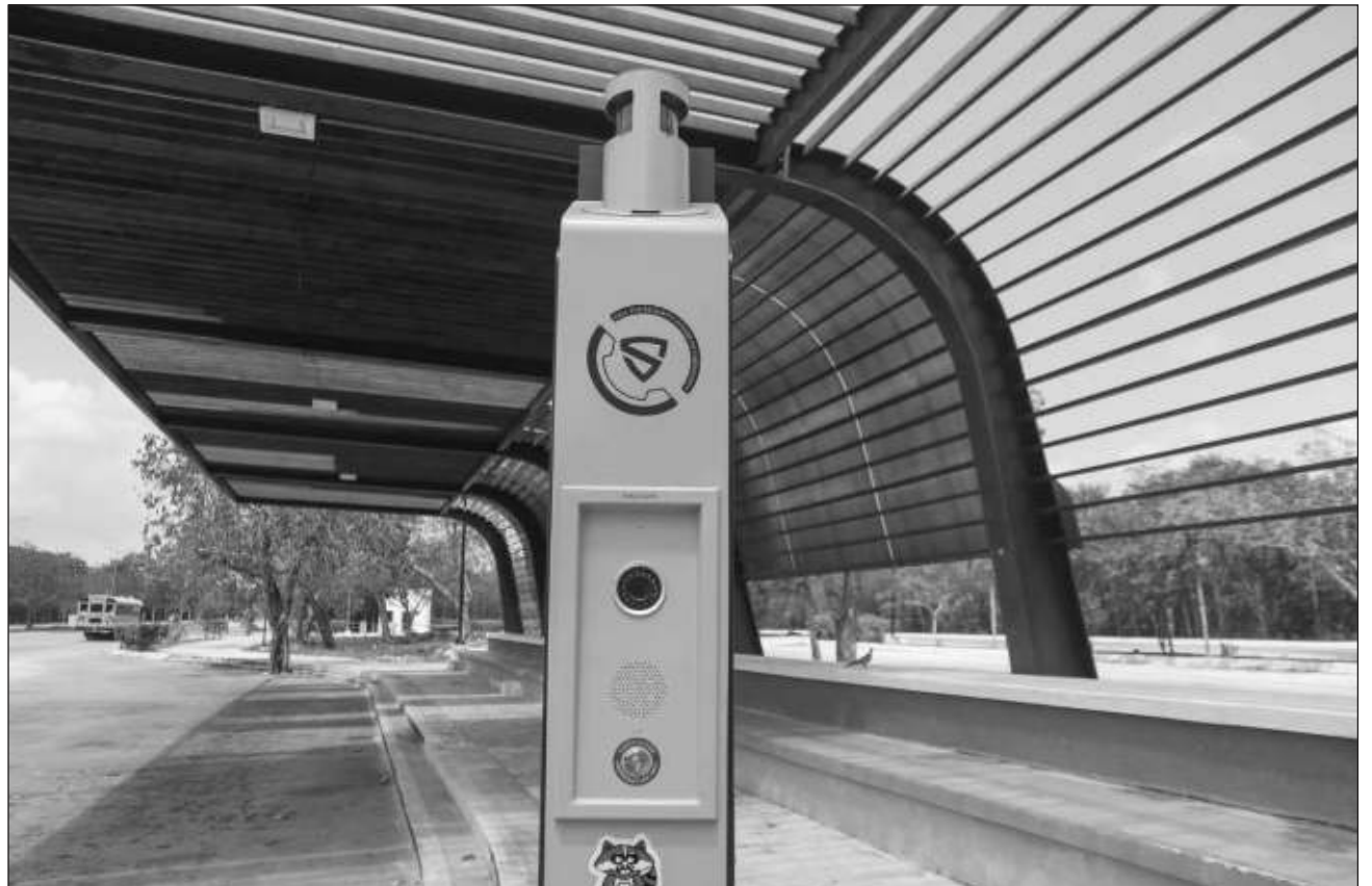
▲ Son 10 estructuras que estarán a disposición de los ciudadanos ante una emergencia médica, un delito o cualquier situación que ponga en riesgo la integridad física o psicológica.

Hay otros en avenida CTM con 115 (zona del pa-