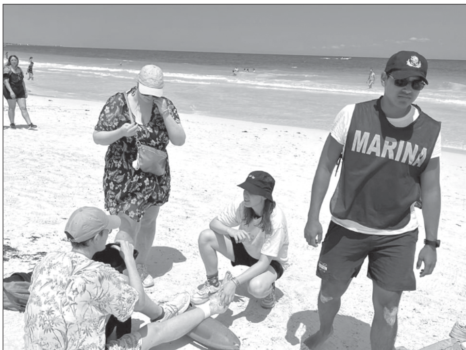
▲ Durante el operativo se atendieron cinco rescates en playas, tres vehículos incendiados, un cortocircuito, 11 accidentes vehiculares y una fuga de gas.