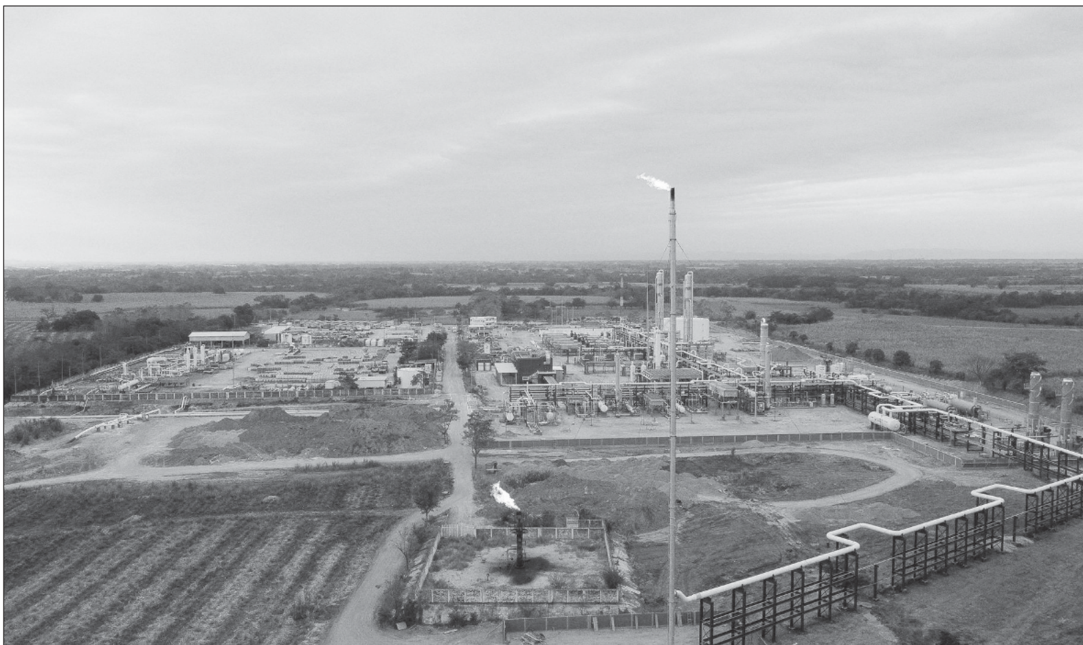
▲ “Para la oposición anti AMLO todo es oscuro, sin importar que sean programas, acciones, reformas, que benefician al pueblo mexicano como los incrementos al salario mínimo (...) el rescate de Pemex y la Comisión Federal de Electricidad para alcanzar la soberanía energética”.