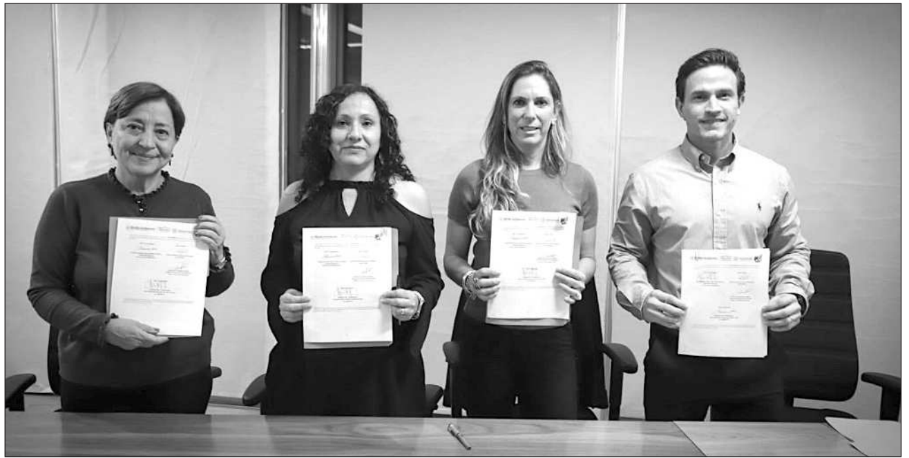
▲ El convenio firmado busca que las decisiones sobre granjas porcícolas en Yucatán se tomen con información técnica más completa y revisada de manera conjunta, gracias a la coordinación entre autoridades federales y estatales.

“Al contar con dictámenes ambientales especializados y seguimiento permanente, se fortalecen