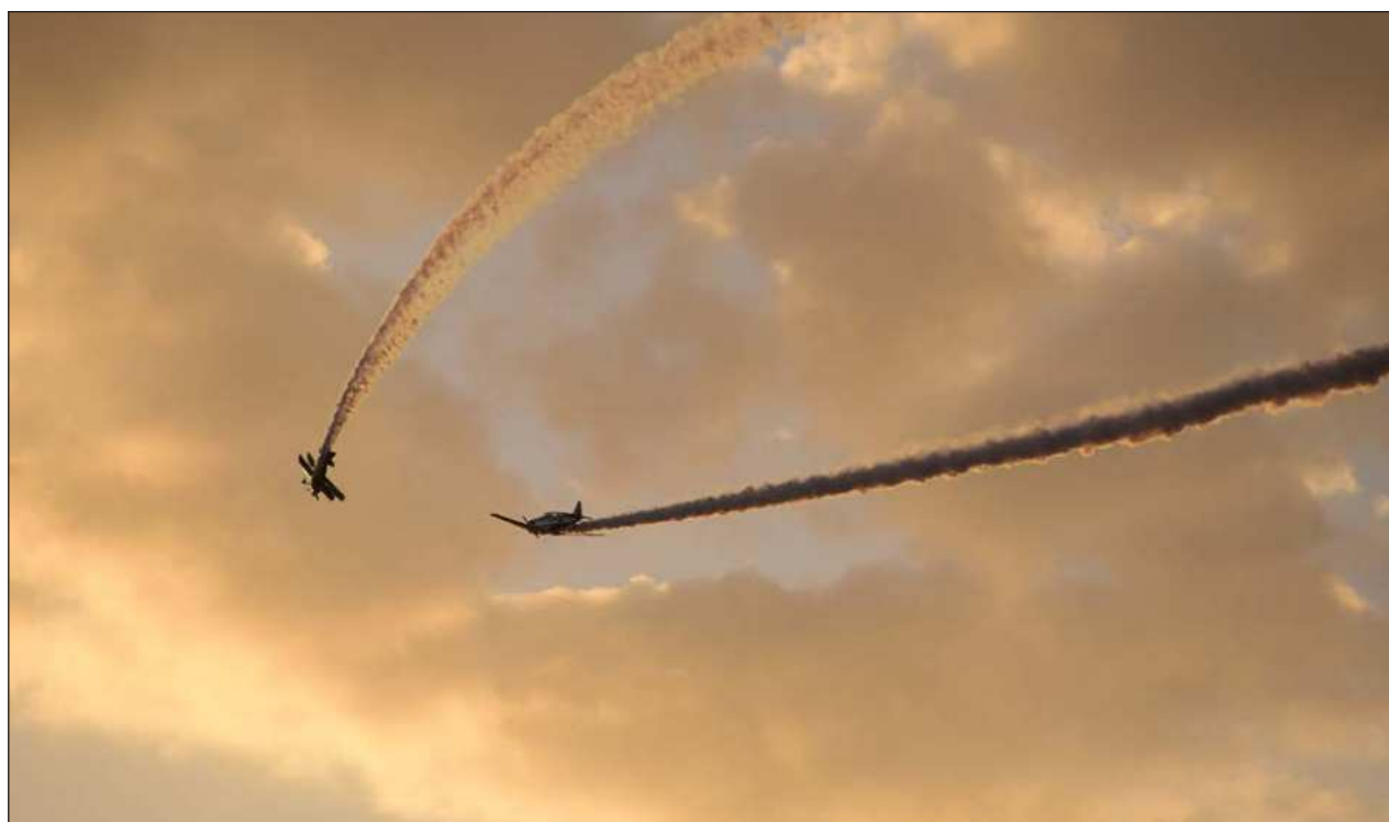
▲ El reglamento establece las acciones del sistema de vigilancia y protección del espacio aéreo, el cual está integrado por la Fuerza Armada Mexicana, la Guardia Nacional, la SICT y la Agencia Federal de Aviación Civil (AFAC), entre otros organismos.

La mandataria mencionó que cuando Zedillo privatizó los trenes de México, provocó monopolio de empresas sobre vías, “lo que ha generado problemas en la distribución de mercancía por trenes, porque no queda claro cómo pasa una empresa a usar la vía de otra, y evita la comunicación de todas las vías de tren en todo el país”.