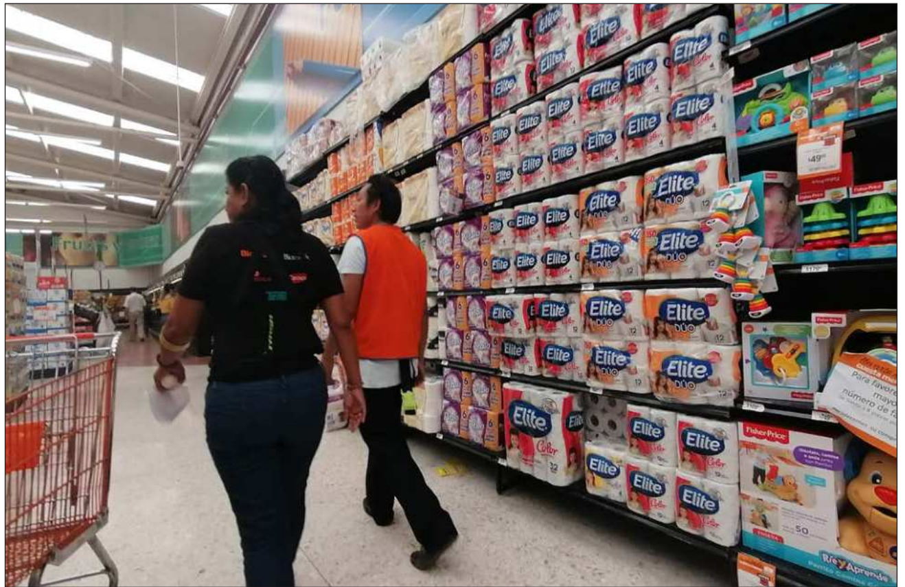
▲ El reporte del IMSS informa que en 15 estados hubo incrementos, siendo el Estado de México el de mayor variación comparado enero pasado con el de 2025, tuvo 4.8 por ciento más, seguido de la Ciudad de México con 4.6 por ciento e Hidalgo con 3.3 por ciento más.

Quintana Roo y Yucatán también registraron bajas en empleos, pero fueron de 0.3 y 0.002 por ciento, según el IMSS