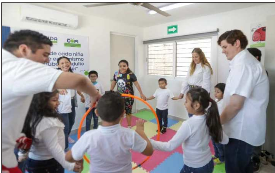
▲ La presidenta municipal subrayó que "ampliamos este servicio porque creemos en acompañar a nuestras niñas y niños en cada etapa de su vida, y en dar certeza a las mujeres de que sus hijas e hijos están bien cuidados".

Además de la atención a la primera infancia desde el periodo prenatal hasta los