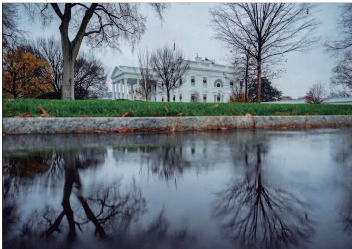
▲ “La Casa Blanca nos bombardea sin piedad, exigiendo una atención que, a decir de Simone Weil, cuando es pura y sin mezcla se vuelve una oración. Nada más lejos que el acto de rezar estos días”.

DECÍA VIRGINIA WOOLF que ser inédito era un estado de gracia. Seguramente esas no fueron sus palabras exactas, pero el mensaje que recuerdo de algún ensayo luminoso era que la libertad más cierta de la escritora se hallaba justo antes del primer libro. Contraria a la prisa que carcome a tantos autores, la Woolf recomendaba alargar esta etapa a toda costa, asegurando que, una vez atravesado el umbral de la publicación, ya no habría manera de volver a escribir un texto sin o fuera de expectativa alguna. El reto es siempre, cada vez, escribir un primer libro. Tal vez sea por eso que, en estos días de azoro y