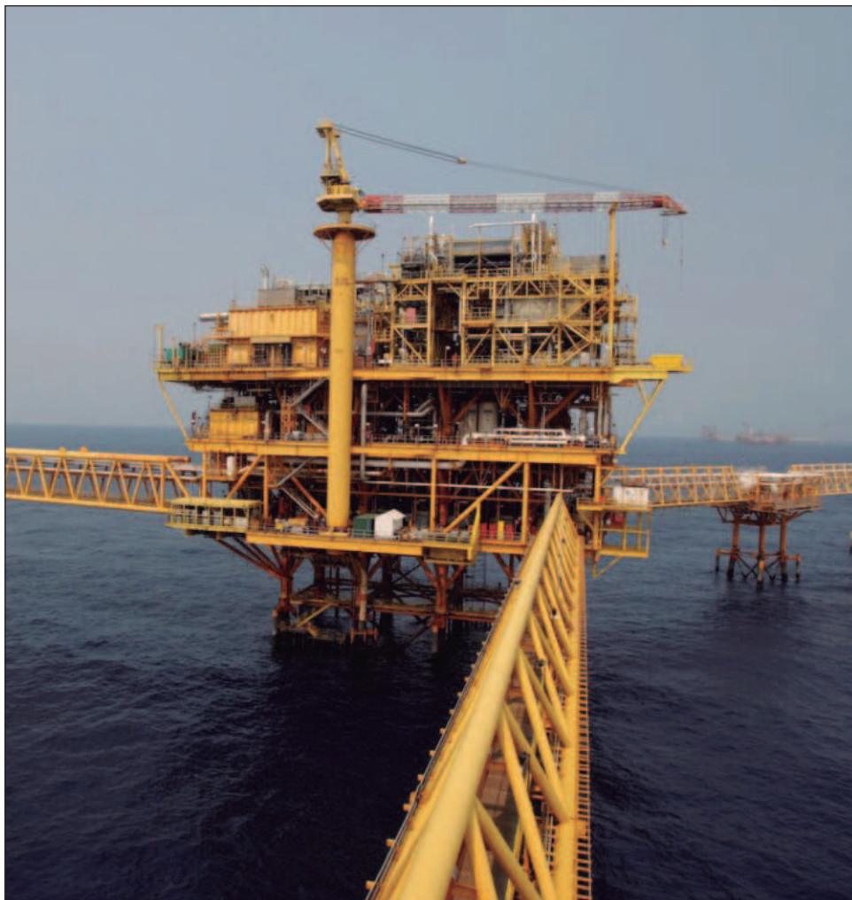
▲ De manera enérgica pidieron a Pemex y a la Marina, que se tomen acciones y se implementen estrategias para garantizar la seguridad de los obreros, en las plataformas.

“La Sección 47 estará atenta para defender los derechos y la seguridad de los trabajadores a bordo de las plataformas marinas de Pemex en la Sonda de Campeche y Litoral de Tabasco”.