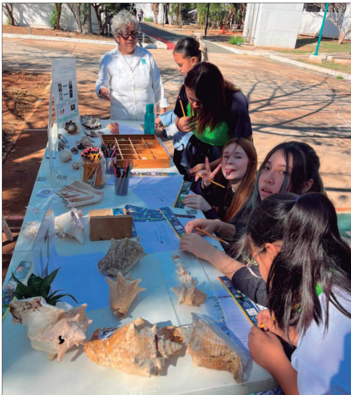
▲ "A nivel estatal, nacional e internacional, las mujeres que generan conocimiento científico y desarrollo tecnológico, siguen siendo una minoría. En función de las disciplinas, oscilan entre 5 y 30 por ciento".

En el caso de Yucatán, somos un Estado con una fortaleza de Instituciones y de académicos con la UADY, los tecnológicos y de los centros de investigación. Estos tienen un promedio de cuatro décadas de presencia en el Estado, se han ido consolidando a través de su planta de académicos, estudiantes, infraestructura y un presupuesto federal y estatal, que desafortunadamente la ido a la baja de manera muy significativa en los últimos 7 años. Entre estos centros de investigación vale la pena citar al Cinvestav, CICY, Ciesas, Ciatej. Somos el quinto estado de la República mexicana con la mayor fortaleza en ciencia y tecnología, para ello se ha requerido tiempo y presupuesto. El presupuesto debe mantenerse para que las Instituciones sigan cumpliendo su misión; formación de nuevos profesionistas y la de generar conocimiento para la solución de pro-