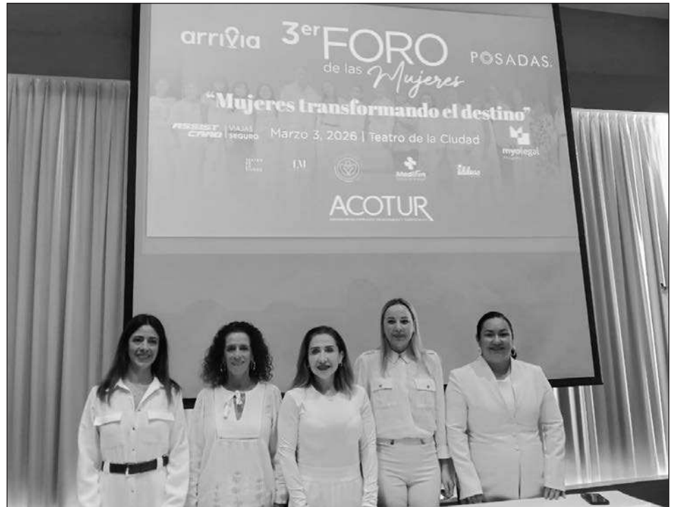
▲ El crecimiento del turismo en Quintana Roo, que mantiene ocupaciones hoteleras de entre 80 y 90 por ciento en temporadas altas y una constante diversificación de mercados internacionales.

Abundó que el crecimiento del turismo en Quintana Roo, que mantiene ocupaciones hoteleras de entre 80 y 90 por ciento en temporadas altas y una constante diversificación de mercados internacionales, ha abierto nuevas oportunidades laborales, pero también ha evidenciado la necesidad de romper barreras estructurales y culturales que limitan el ascenso profesional de las mujeres en el estado.