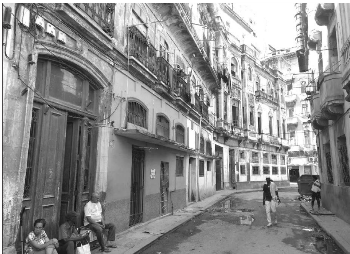
▲ "La producción petrolera y de gas de Cuba es de apenas 40 mil barriles, insuficiente para su operación básica. Venezuela, que enviaba 100 mil barriles hace años, envió apenas 30 mil el último mes. El 50% de la población está en pobreza extrema".

La acción de Trump de endurecer el bloqueo castigando con