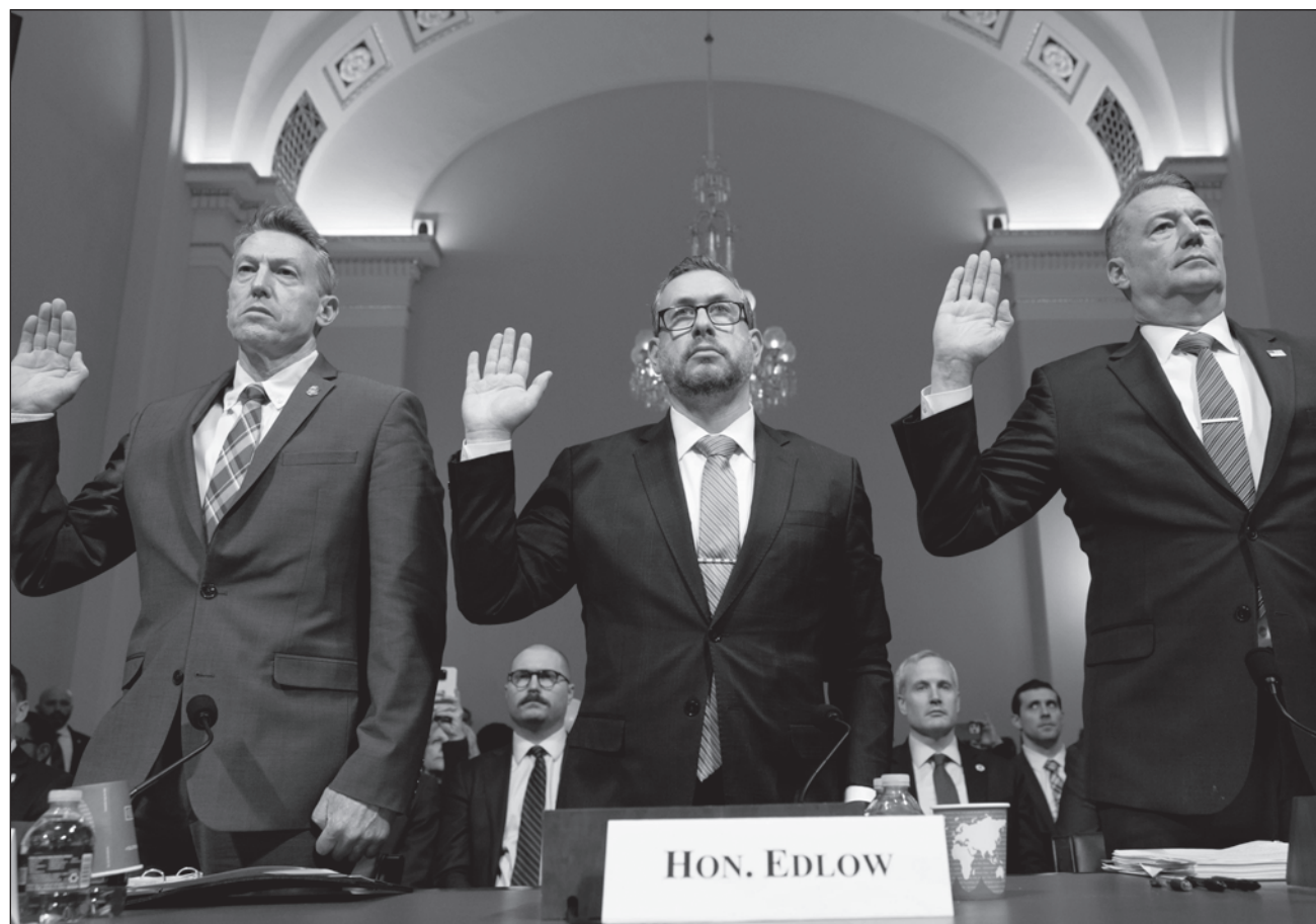
▲ Ante el Congreso estadounidense se presentaron Todd Lyons, director en funciones del ICE, Rodney Scott, responsable del Servicio de Aduanas y Protección Fronteriza, y Joseph Edlow, encargado de los Servicios de Ciudadanía e Inmigración. En sus declaraciones, destacaron que en el último año llevaron a cabo más de 475 mil expulsiones.

“Gracias a los recursos proporcionados por el Congreso, estamos aumentando la capacidad de detención y los vuelos de expulsión a diario. Solo en el último año, hemos llevado a cabo más de 475 mil expulsiones”, añadió.