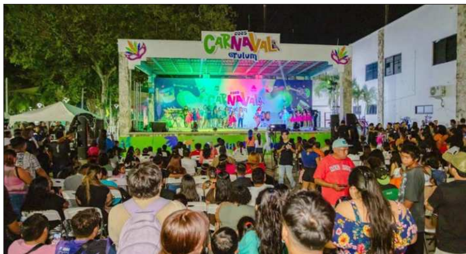
▲ La programación artística arrancará el 26 de febrero con la presentación de Nelson Kanzela, conocido como El gigante de Latinoamérica ; el 27 de febrero continuará la actividad musical con Junior Klan; el 28 de febrero el escenario recibirá a Los Super Caracoles.

Para ponerle ritmo a estas festividades, durante cuatro noches consecutivas el Carnaval reunirá a reconocidas agrupaciones del género tropical y de la cumbia, que serán las encargadas de ambientar esta tradicional fiesta con un ambiente familiar.