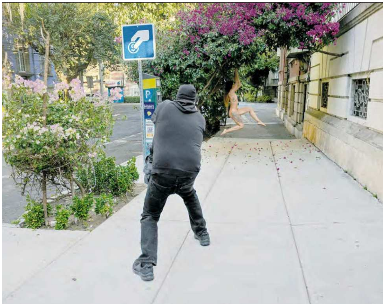
▲ “Lo que más me gusta es fotografiar a las personas de manera individual en exteriores”, afirmó. En la imagen, el artista neoyorquino Spencer Tunick durante la sesión fotográfica que realizó el domingo pasado en la Ciudad de México.

Días antes, durante el conversatorio InBED, conducido por Klaudia Oliver, también como parte de Algo Más de Lola, Tunick habló del desnudo como forma de resiliencia: “nadie es dueño de tu cuerpo. Si el gobierno dice que sí, en especial en un espacio público, no es bueno. Tu visión de cómo ves tu obra artística no debería ser juzgada como una actividad interna. El mundo es bello, también el exterior. Deben estar disponibles como locaciones, o telas en blanco, los cañones de los edificios y rascacielos, y los caminos que se asemejan a los ríos, en el sentido de crear un paisaje citadino, o corporal, que fluye. No me gusta que me digan que me quede adentro. Soy una persona de exteriores. No mantener mi obra en interiores es una de las cosas que da poder a las personas”.