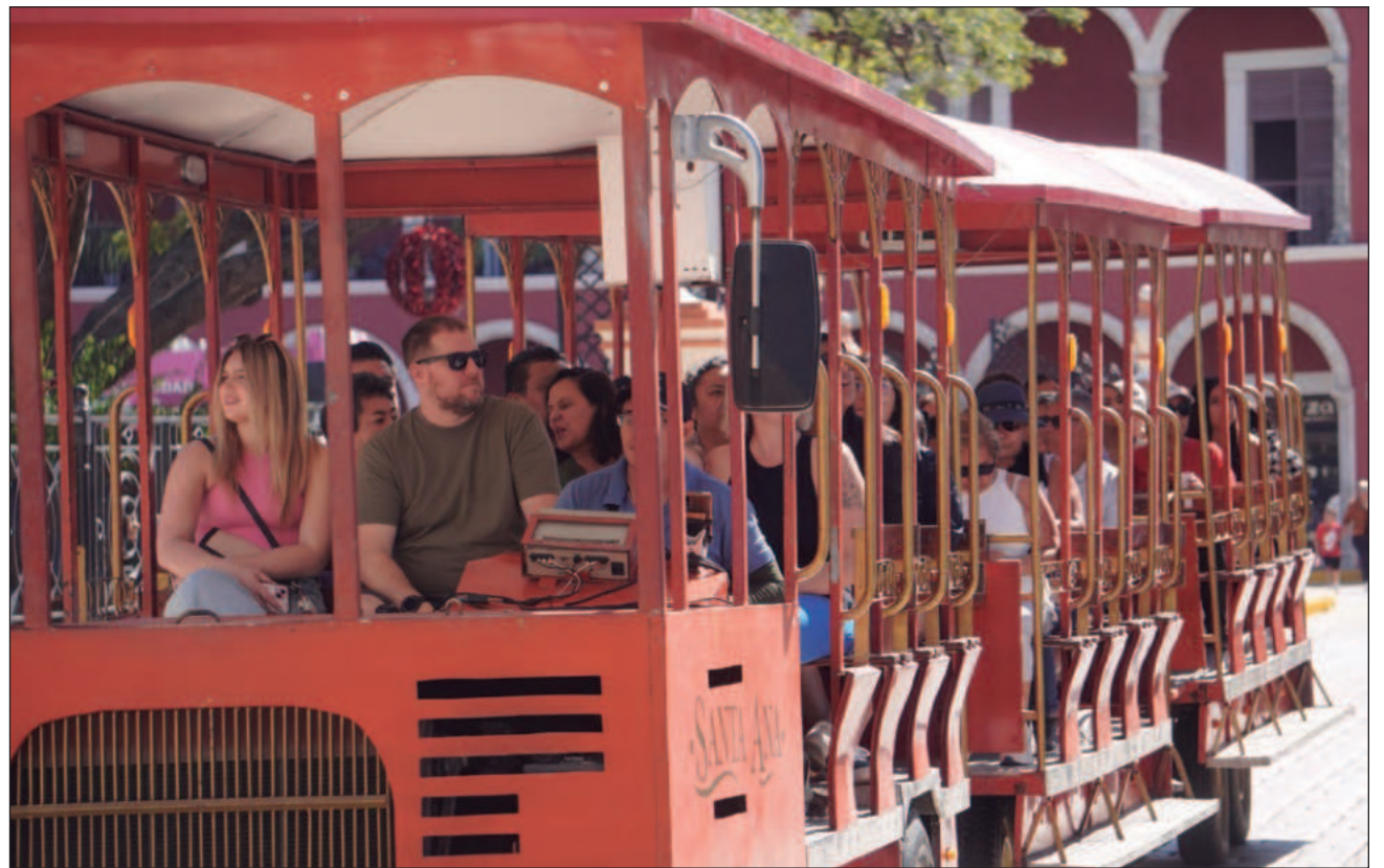
▲ Los Indicadores Trimestrales de la Actividad Turística (ITAT) dados a conocer por el Inegi, permiten conocer y dar seguimiento a la evolución del producto interno bruto turístico y del consumo turístico interior.

En el tercer trimestre de 2025 y con cifras desestacionalizadas, el Indicador Tri-