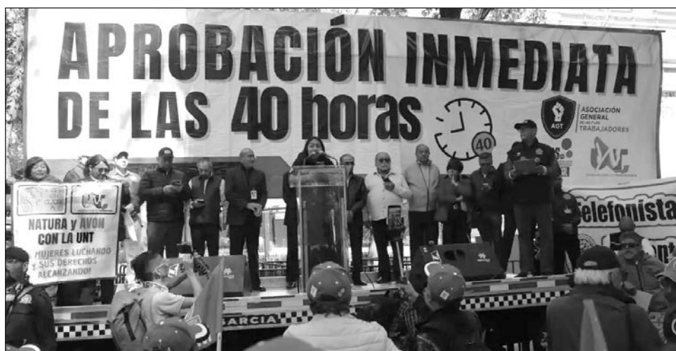
▲ Diversos sindicatos se manifestaron afuera del Senado en rechazo a que se apruebe la reforma por la jornada laboral de 40 horas, al advertir que no se garantizan los dos días de descanso y "legaliza la explotación" al ampliar el número de horas extras con un menor pago.

Los senadores del PRI, PAN y MC, que se habían manifestado en contra, durante la reunión de las comisiones de Puntos Constitucionales, Estudios Legislativos y Trabajo y Previsión Social, aceptaron que la iniciativa presidencial pasara en sus términos, excepto por una modificación en materia de lenguaje incluyente, pero insistieron en que una vez promulgada esa reforma a la Carta Magna, de inmediato se lleve a cabo los cambios necesarios a la Ley