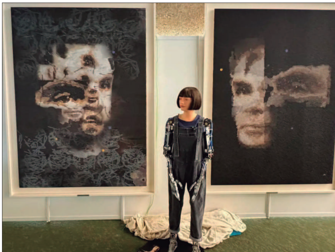
▲ "Entre la IA y las redes de percepción remota e información, tenemos ahora una caja de herramientas formidable". En la imagen, robot Ai-Da frente a su obra de arte A.I. God. Portrait of Alan Turing, creada por IA, en la sede de las Naciones Unidas.

¿Qué garantía tenemos de que las herramientas de inteligencia artificial tengan incorporado un criterio precautorio que favorezca la integridad ambiental y la sustentabilidad de las actividades humanas? ¿Qué nos permite asegurar que los gobiernos, ávidos de incrementar sus poderes, no vean en la IA una suerte de "meta inteligencia" que les aconsejará siempre lo que más convenga a su interés, sin importar los que suceda con el resto de la biosfera? Quizá décadas de lecturas de ciencia ficción, que pintan distopías terroríficas, me hayan absorbido un poco el seso, y esté viendo amenazas que no existen. Pero la verdad es que no puedo remediar la sensación de que estamos actuando ante la inteligencia artificial como el famoso aprendiz de brujo que, sin haber aprendido el protocolo de los encantamientos, se lanzó a resolver mágicamente problemas que habría hecho bien en enfrentar por medios naturales. No niego que, entre la IA y las redes de percepción remota e información, tengamos ahora una caja de herramientas formidable para manejar apropiadamente nuestra permanencia en el planeta; pero mucho me temo que la avidez de los poderosos acabe usándolas sin una visión humanista y global.