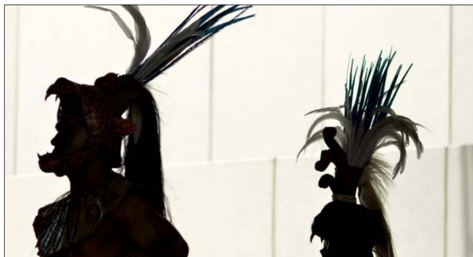
▲ La Cumbre de Activismo Digital de Lenguas Mayenses reunirá a activistas digitales y comunidades que trabajan para promover, preservar y revitalizar las lenguas mayenses en México y más allá.

El evento tendrá lugar en el Gran Museo del Mundo Maya (GMM) del 11 al 15 de enero. La entrada será gratuita.