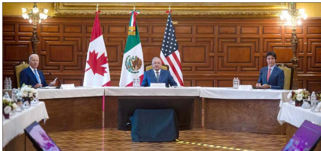
▲ Los tres países de América del Norte acordaron conformar un comité trilateral para planear una mayor integración por el bienestar de los pueblos, con respeto a las soberanías y dejando atrás el intervencionismo hegemónico.

Para ello, dijo haber solicitado al congreso estadu-