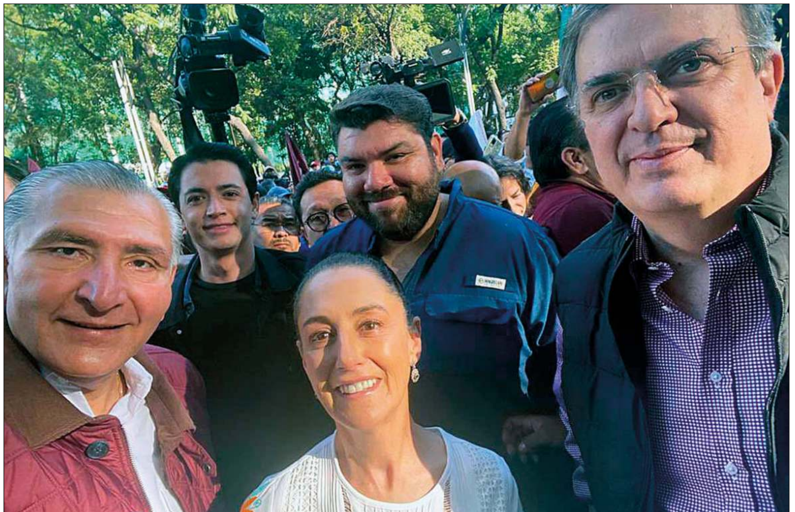
▲ "No habrá coincidencias, todo acto, programa, declaración, etcétera, tendrá un claro objetivo, ¿quiénes serán los candidatos para el 2024?".