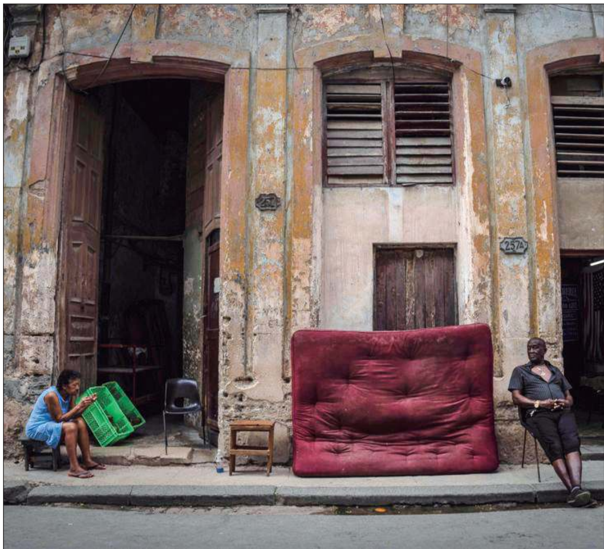
▲ "Este rincón citadino, reconstituido desde la perspectiva del narrador, se desgrana en un prisma en que cada historia crea una atmósfera particular, con los valores que le confieren los caracteres de sus personajes".

El barrio habanero de El Cerro encarna, en sus marcos limítrofes, un organismo que respira al calor de los actos y de las proyecciones de sus moradores, de la fama terrible que arrastra como resabio de la memoria popular traída a cuento en la tradición oral de la ciudad y en el hálito que recrea las identidades inscritas en el ser comunitario. Aquí confluyen las creencias en torno al destino que le toca a cada quien, los esfuerzos por superar sus adversidades y la conquista del