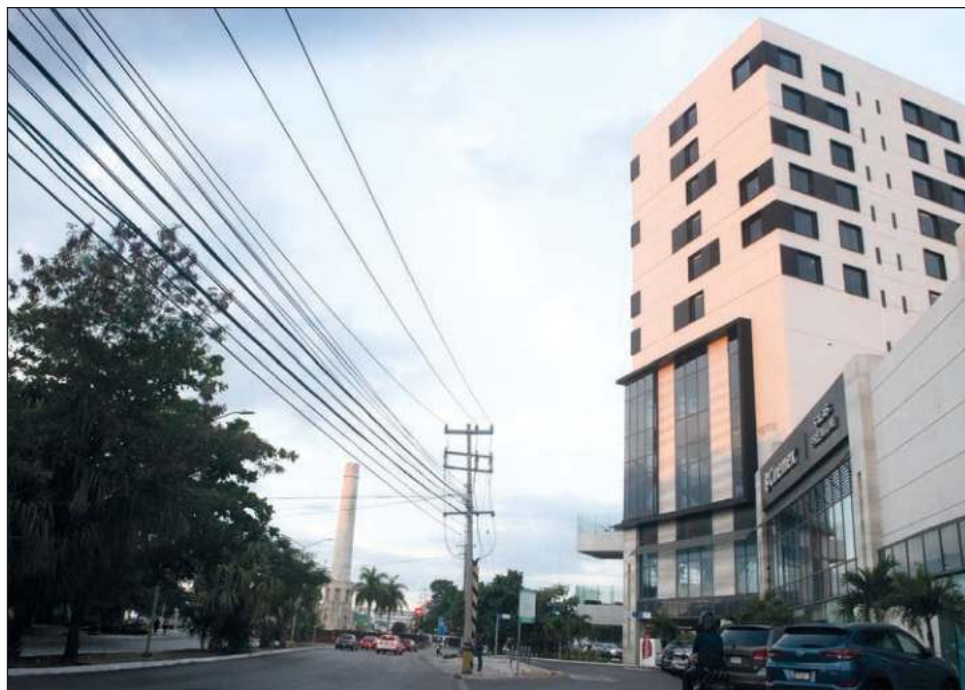
▲ Si bien los vecinos de Altabrisa celebraron el anuncio de un parque, indican que el proyecto no cuenta con permisos, presupuesto ni aprobación del cabildo.

El lunes 9 de enero, el ayuntamiento de Mérida y la iniciativa privada anunciaron el proyecto "Tho': Nuestro Parque", un espacio público al norponiente de la ciudad que ocupará ocho hectáreas y en el que se invertirán -de ser aprobado