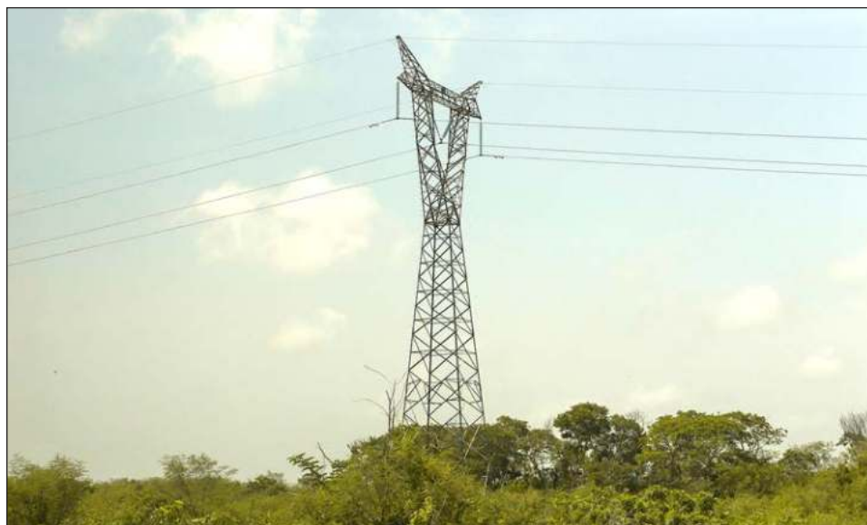
▲ México, Estados Unidos y Canadá se encuentran inmersos en un proceso de consultas sobre el tema energético en el Tratado de Libre Comercio entre los tres países.

“Yo supondría que el primer ministro Trudeau comentará algo relativo a esto, supongo yo, en la bilateral le expondrá al presidente su preocupación, pero no supondría yo que hoy en la cumbre sea un tema relevante, porque ya tiene un curso de solución,