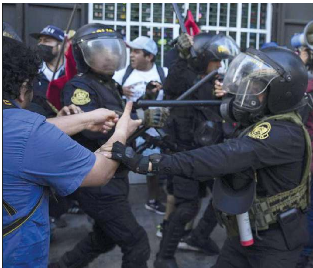
▲ El gobierno encabezado por Dina Boluarte, y el Congreso peruano, parecen apostar a que para abril de 2024 se haya diluido el malestar social.

Como se ha señalado en este espacio, al mirar más allá de la coyuntura se aprecia que la crisis política crónica que vive la nación andina desde hace al menos seis años (y muchos más, si se considera que el siniestro periodo fujimorista de la década de 1990 de ningún modo puede calificarse de normalidad democrática) es resultado de un entramado legal que sabotea de manera sistemática la gobernabilidad y que representa no un marco jurídico en que ha de desenvolverse la democracia, sino el principal obstáculo para el funcionamiento de ésta.