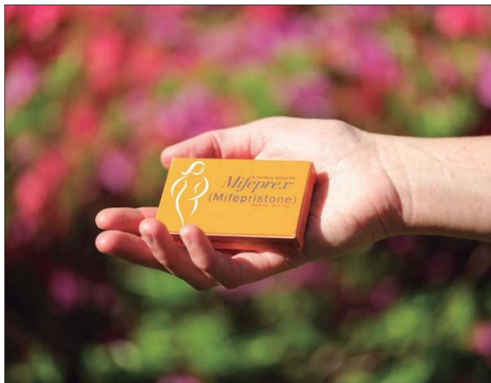
▲ Las farmacias primero deben estar certificadas por uno de los fabricantes del medicamento para dispensarlo de acuerdo con las normas federales de seguridad.

Una vez que las farmacias comiencen a dispensar el medicamento en los estados que permiten el aborto, "será mucho más fácil ac-