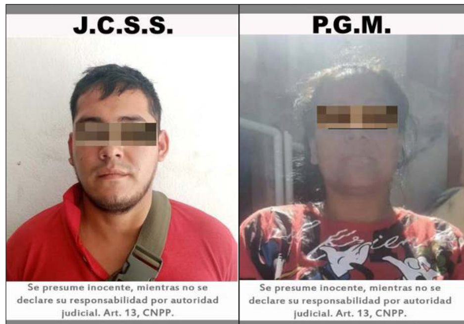
▲ El juez de control impuso prisión preventiva a dos de los cuatro detenidos; los otros vinculados a proceso están acusados de operaciones con recursos de procedencia ilícita.

La fémina P.G.M. y el masculino J.C.S.S., acusados del delito de robo, fueron interceptados cuando pese a haberseles indicado que estaban cometiendo un acto ilícito, pretendían