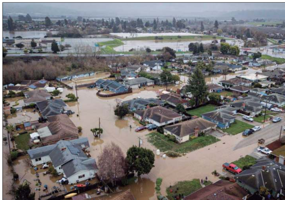
▲ Se esperaba que la zona recibiera hasta 200 milímetros de lluvia en 24 horas.

Las autoridades de emergencia de Montecito, a 90 minutos de Los Ángeles, instaron a abandonar la zona.