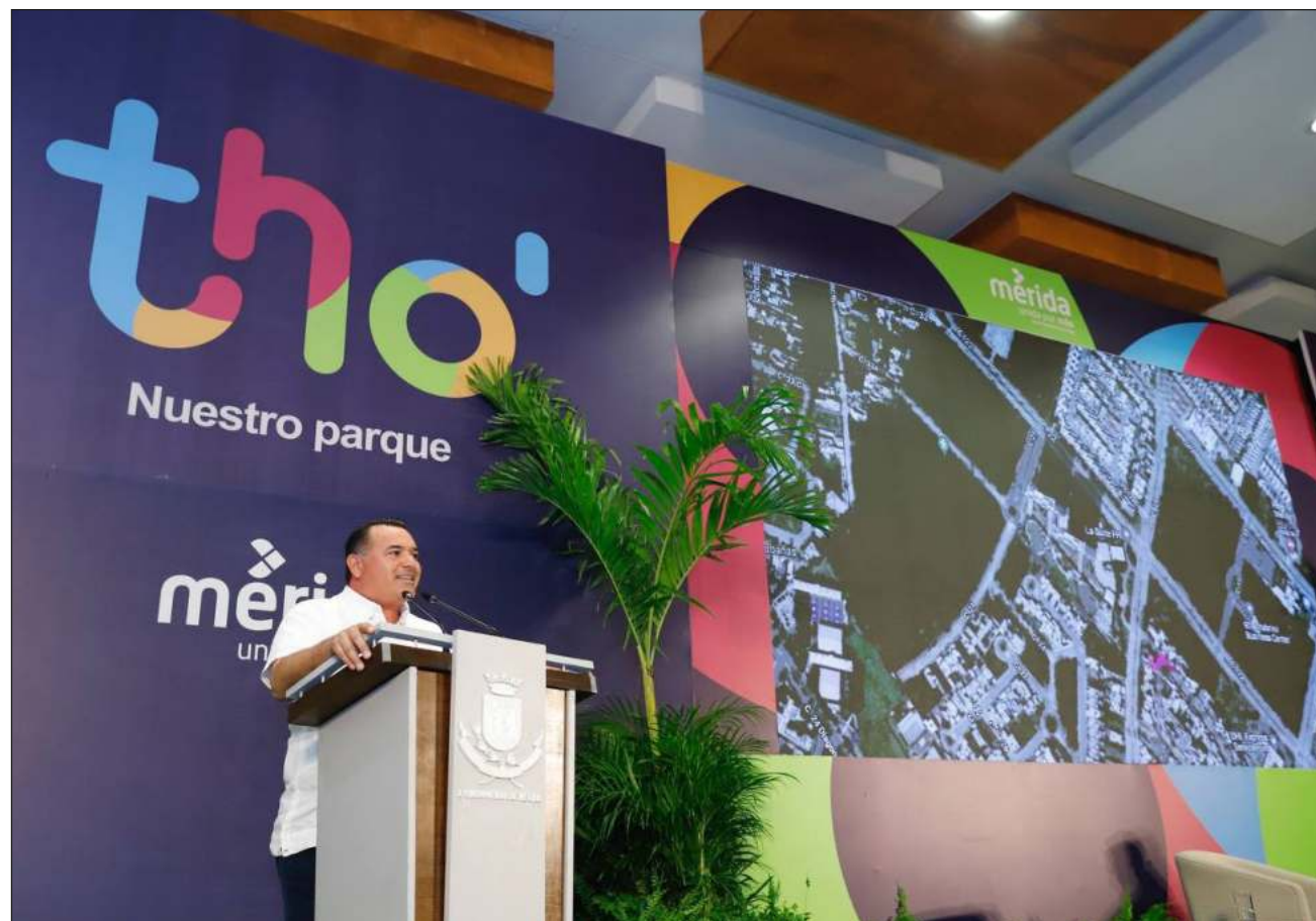
▲ En la presentación del parque que tendrá una extensión de ocho hectáreas y en el que destaca el modelo innovador de gestión, Renán Barrera señaló que se cambiará la forma de planear y construir los espacios públicos.

Jorge Charruf Cáceres, presidente de la Cámara Nacional de la Industria de Transformación (Canacintra) Yucatán, catalogó como un gran avance la próxima construcción de