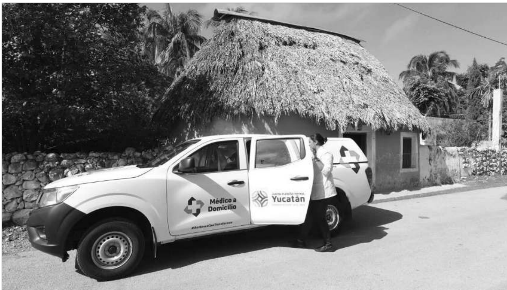
▲ Este esquema, que se creó en 2018 ofrece consultas, tratamientos, estudios, pláticas de orientación, prevención y promoción, que permiten mejorar el control de las enfermedades que se padecen y así evitar que puedan desarrollarse complicaciones según sea el caso de cada paciente.