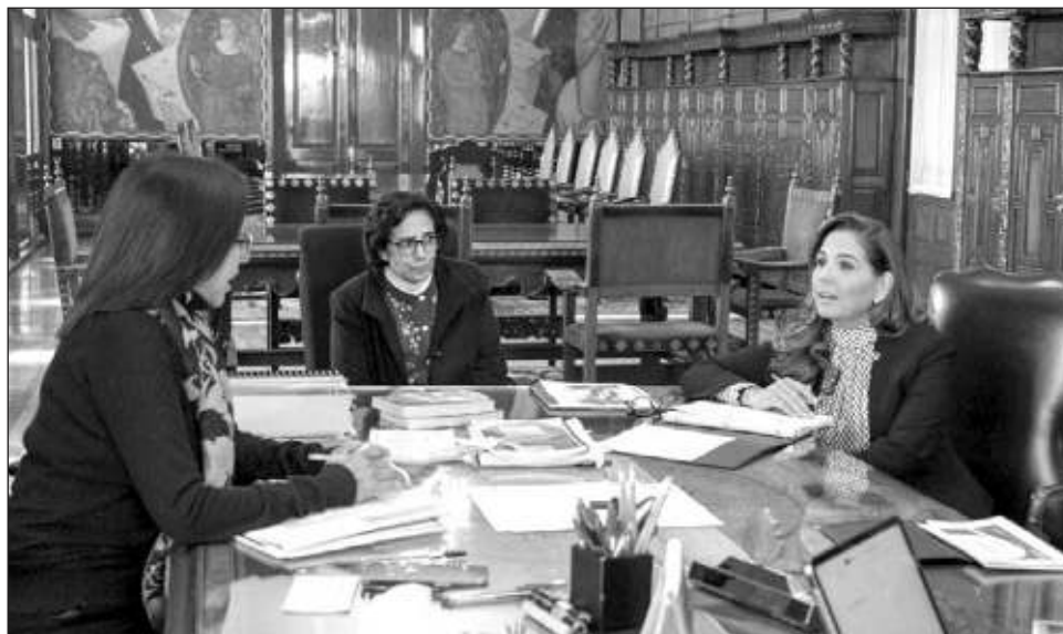
▲ Se mencionó la creación de un albergue para mujeres víctimas de violencia en la zona maya, así como un Centro de Justicia para las Mujeres en Chetumal.

Mencionó la apertura de un albergue para mujeres víctimas de violencia en la zona maya, así como un Centro de Justicia para las Mujeres en Chetumal, entre