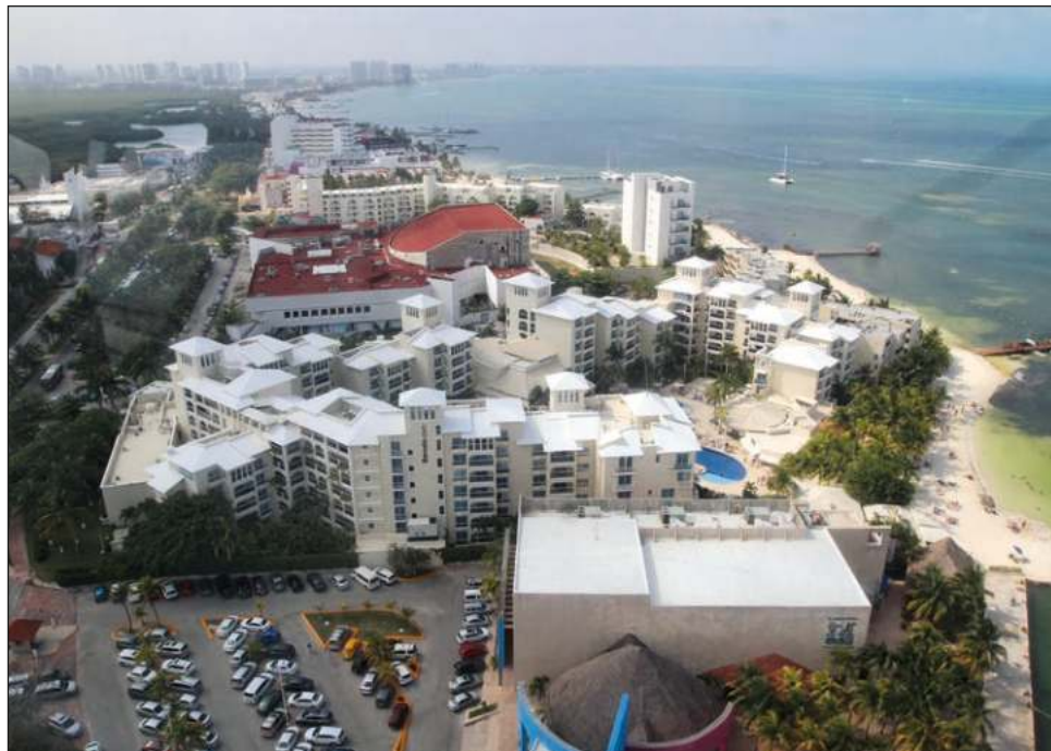
▲ Conforman el comité ciudadano de seguimiento a la aplicación de los recursos por concepto de Derecho de Saneamiento Ambiental.

En 2022 se recaudaron en ese rubro 296.1 millones de pesos y la estimación es que este año se alcancen aproximadamente 677 millones de pesos. Se acordó que 50 por ciento de los recursos se invierta en infraestructura de la ciudad, 30 por ciento en playas y 20 por ciento en seguridad. Acordaron reunirse