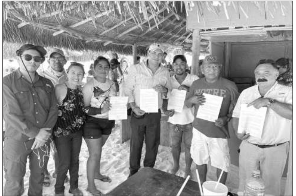
▲ La Sedatu se reunió con los prestadores de actividades comerciales para volver a hablar del proyecto, que consiste en el reordenamiento de la zona de playas del Parque Nacional Tulum.

Explicó que con estas ganancias se administrarán para poder reponerse de la difícil temporada baja que pasaron el año pasado y la que se avecina.