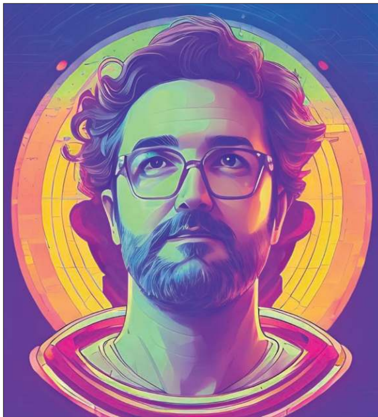
▲ “Y así, jugando a ser dios, la inteligencia de las máquinas está a pocos años de convertirse en un elemento cotidiano”.

el ajedrez pero con el objetivo de ser utilizada en otras áreas. Algunos visionarios comenzaron a alertar de estos avances, mientras que otros los justificaban. En un reducido círculo se formaron dos bandos, con visiones diametralmente distintas sobre la pertinencia de continuar caminando por el pantanoso y desconocido terreno de la inteligencia artificial. Deja de llorar y aprende a amar a la inteligencia artificial, parafrasean.