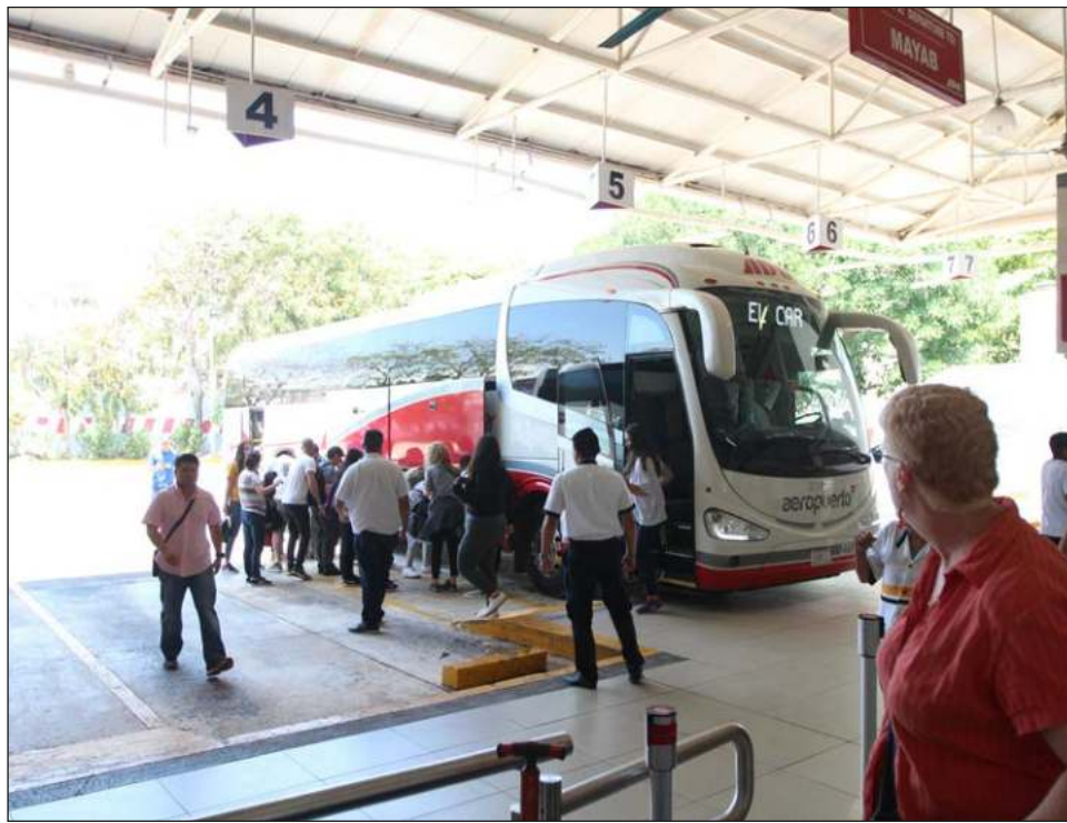
▲ Pese a la mejoría, el sector todavía no alcanza las cifras de 2019.

Estados Unidos fue el principal destino de las exportaciones de vehículos pesados, con 94.4 por ciento del total. Le siguieron Canadá y Colombia con 2.4 y 1.7 por ciento.