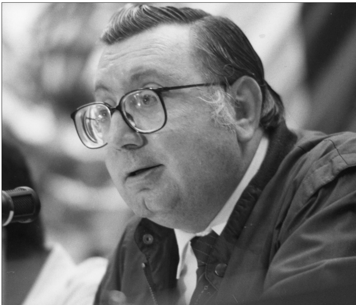
▲ Le lunes máanika' sa'at u kuxtal jk'iin. 77 u ja'abil ka'achij. Tuláakal u kuxtale' meyajnaj ti'al u chíimpol'ta'al u páajtalil wiinik.

Beey túuno', yéetel u yáantajil salvadorilo'ob yéetel