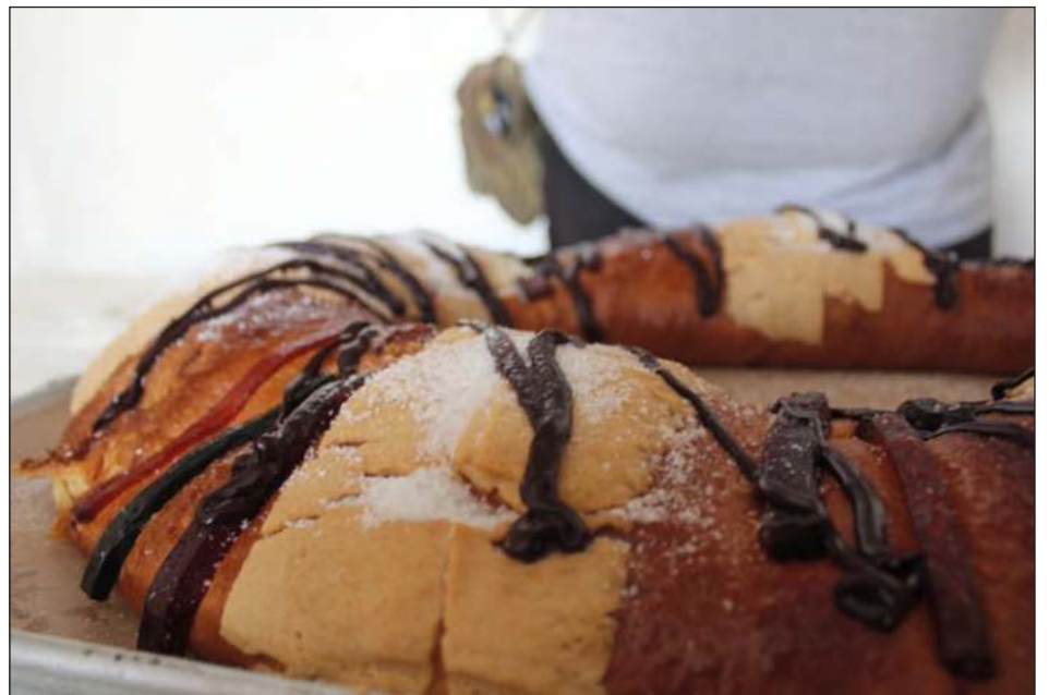
▲ Los precios de las roscas de reyes este 6 de enero fueron de los 230 a los 350 pesos y algunos panaderos emplearon muñecos de cerámica.

“Estimamos que en la isla se comercializaron al menos 10 mil roscas de reyes cuyos precios variaron entre los 230 y los 350 pesos, depen-