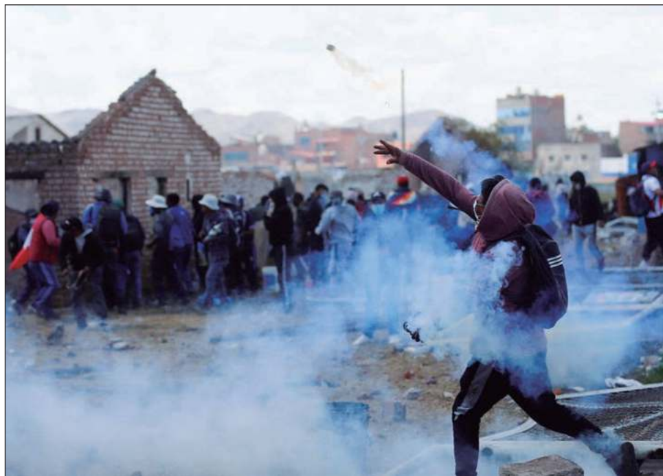
▲ Al final de la tarde del lunes 9 de enero, la Defensoría del Pueblo reportó movilizaciones, paralizaciones y bloqueos de vialidades en 25 provincias.

Con este saldo, el lunes fue la jornada más letal desde que empezaron las protestas en diciembre pasado. Hasta ahora, el día más violento había sido el 15 de diciembre, que dejó ocho muertos, según reportó la Defensoría. Se han contabilizado hasta ahora 46 víctimas en el contexto de las