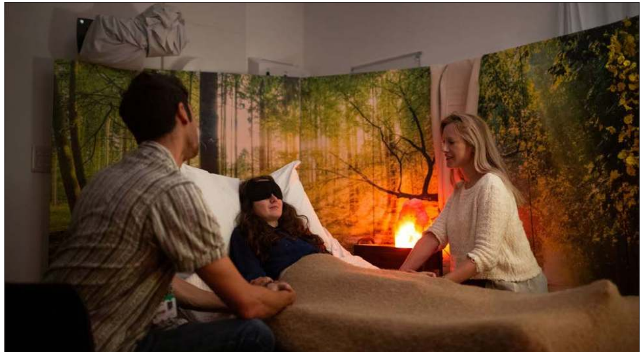
▲ Investigadores del Instituto de Neurociencias Wu Tsai de Stanford, en California, han comenzado los primeros ensayos clínicos para comprobar la eficacia de drogas como la MDMA y la ketamina en la atención de estrés postraumático o de depresión clínica.

La ketamina ha sido eficaz para reducir los pensamientos suicidas, los comportamientos del Trastorno Obsesivo Compulsivo (TOC) y la depresión clínica, mientras que la psilocibina -presente en los hongos alucinógenos- también ayuda con la depresión intratable.