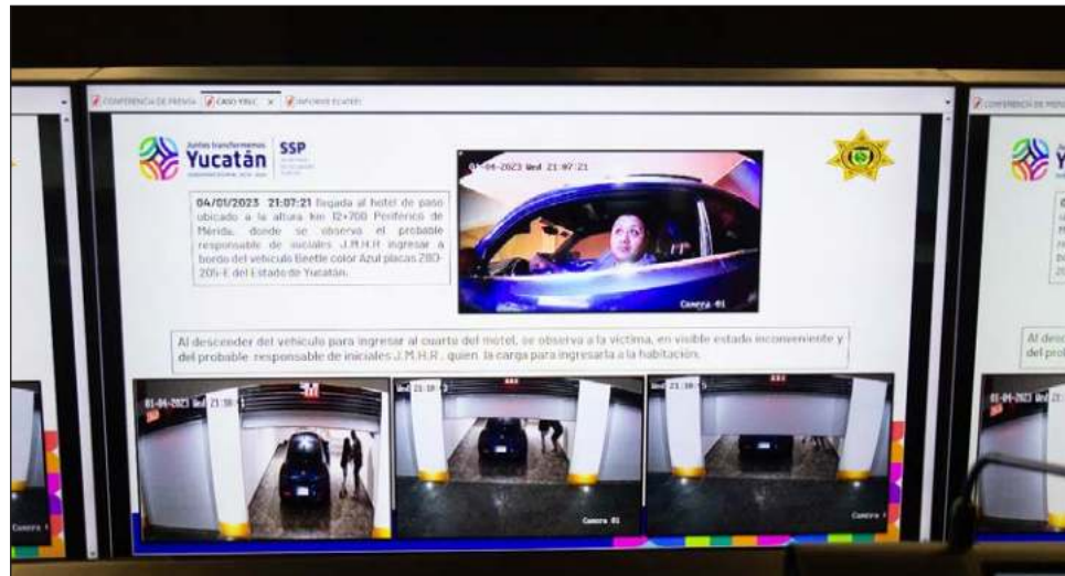
▲ En la cronología presentada por las autoridades se siguen los movimientos de Joshua "N", de quien hay una alta probabilidad de certeza de que sea el feminicida de Yeimy. Sin embargo, el cuerpo del presunto agresor fue encontrado en un motel de Ecatepec, Estado de México.

Así, tuvieron conocimiento de que Joshua "N" se suicidó en un cuarto de hotel del municipio de Ecatepec y su cuerpo fue encontrado junto con el de una persona de sexo femenino, presuntamente su esposa. Desde el 9 de enero iniciaron los trá-