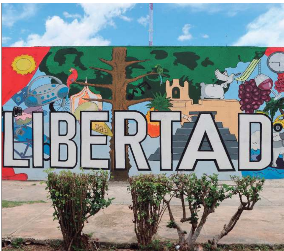
▲ Con 24 sesiones enfocadas en la autoestima, el autoconcepto y las relaciones interpersonales, el programa ofrece un espacio para el crecimiento personal.

Este curso de LSM ha permitido que las personas privadas de su libertad adquieran una herramienta fundamental para comunicarse con personas con discapacidad auditiva, contribuyendo no sólo a su reinserción social, sino también al fortalecimiento de una cultura de respeto. El proyecto también incluye un componente productivo, con actividades agrícolas y ganaderas.