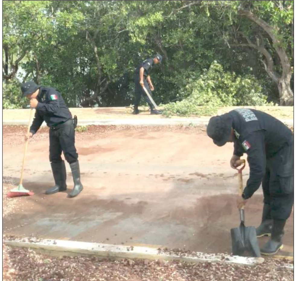
▲ En las zonas donde ya no hay agua, cuadrillas de elementos de la Secretaría de Seguridad Pública (SSP) han comenzado las labores de limpieza.

El mandatario también anunció que a partir de este jueves comenzará la brigada de limpieza para que entre todos se logre que Celestún vuelva a la normalidad muy pronto.