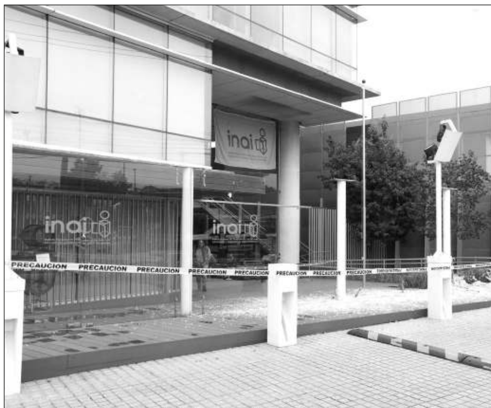
▲ Comisionada señala que hubo daños materiales, sin personas afectadas.

El Inai colaborará estrechamente con las autoridades para entregar la información necesaria que permita el esclarecimiento de los hechos.