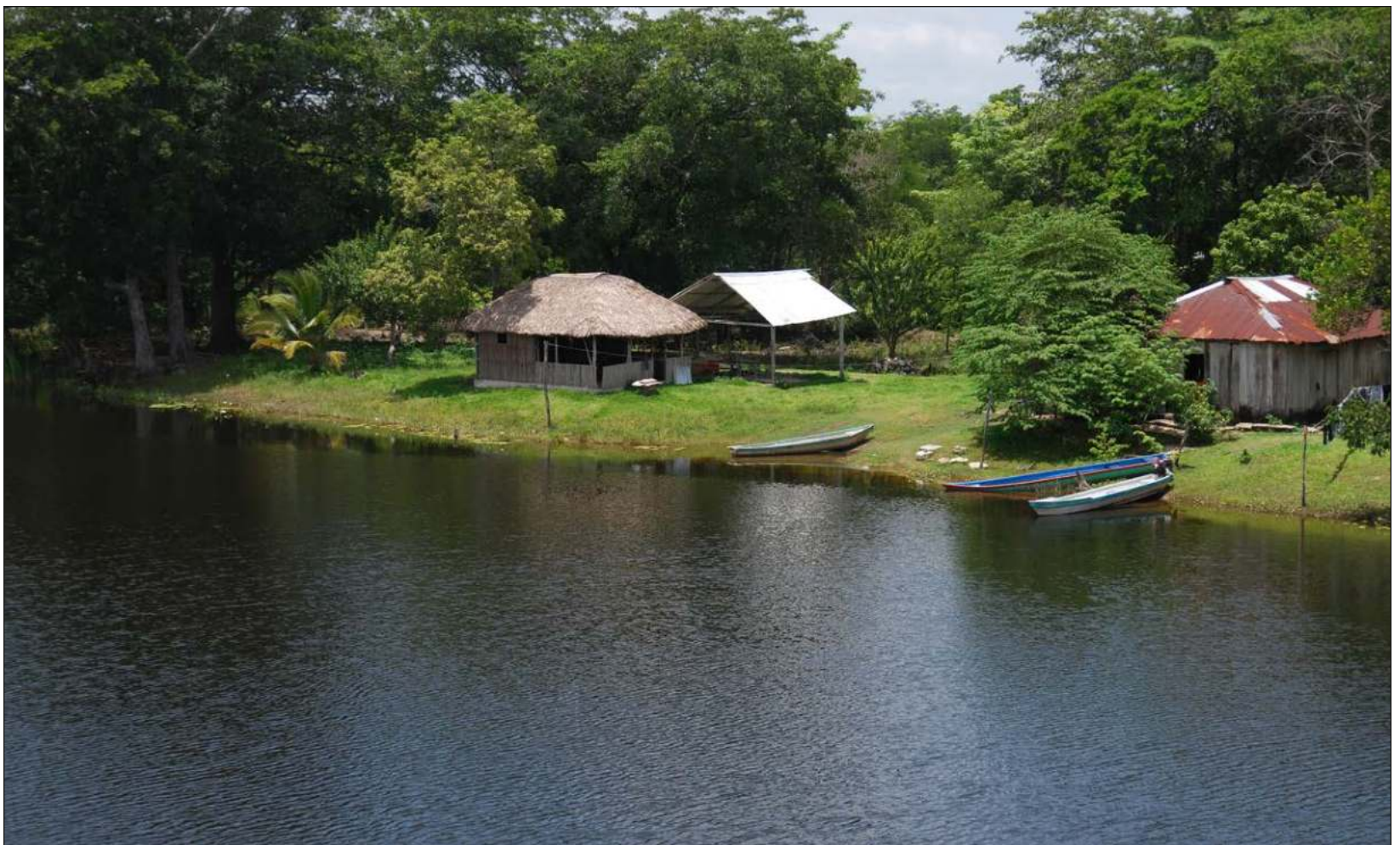
▲ Los afluentes de Champotón, Palizada y Candelaria incrementaron tras el paso del huracán Milton a principios de esta semana.

Los directivos revelaron que sólo esta boya sufrió daños, aunque se realizará una inspección a la red de balizamiento con que se cuenta.