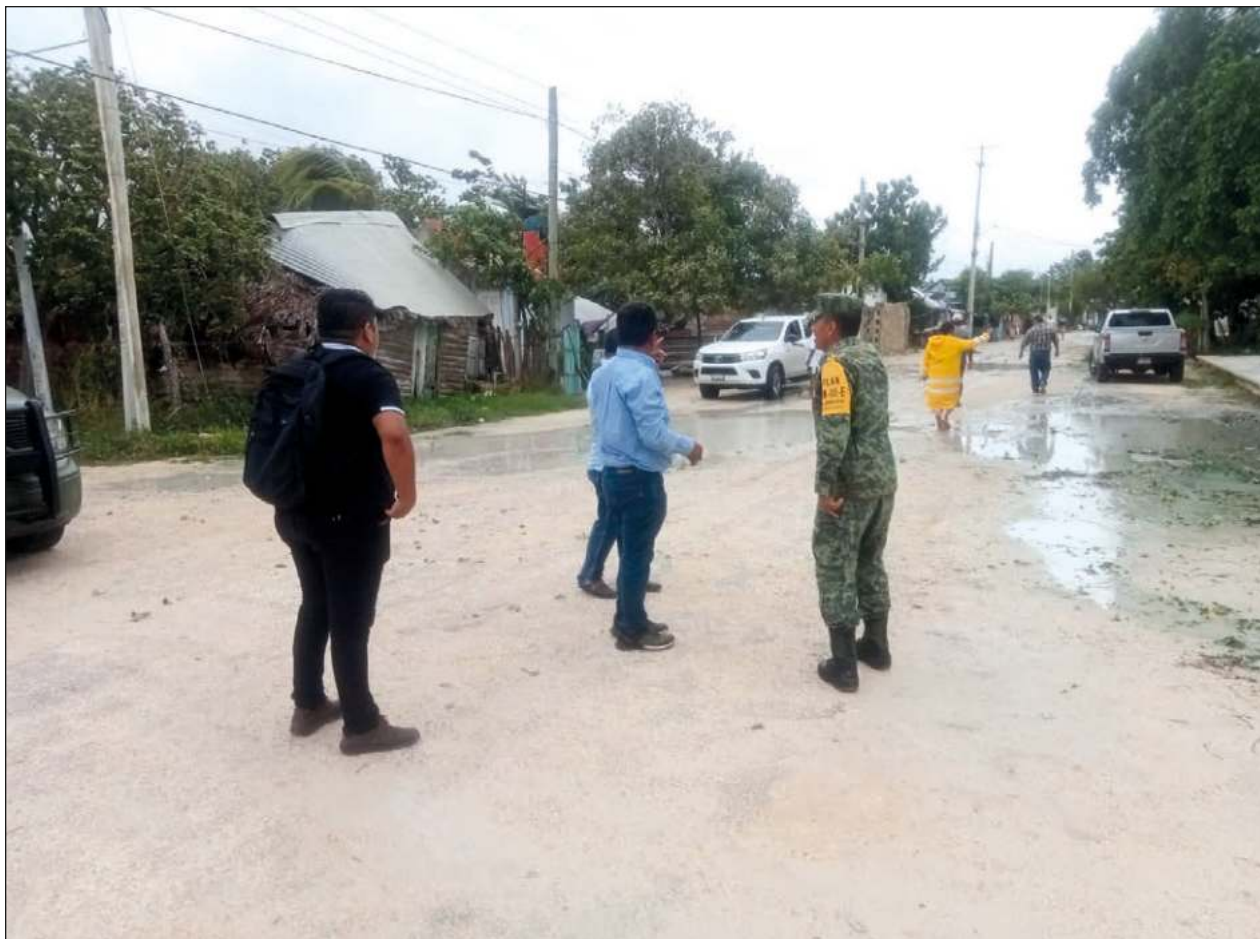
▲ La Sedena despliega el Plan DN-III-E para brindar apoyo en las zonas afectadas por el huracán Milton.

El alcalde paliceño manifestó su agradecimiento a la gobernadora Layda Elena Sansores San Román por su apoyo con los drones, y reiteró su entero respaldo y solidaridad a los familiares del menor.