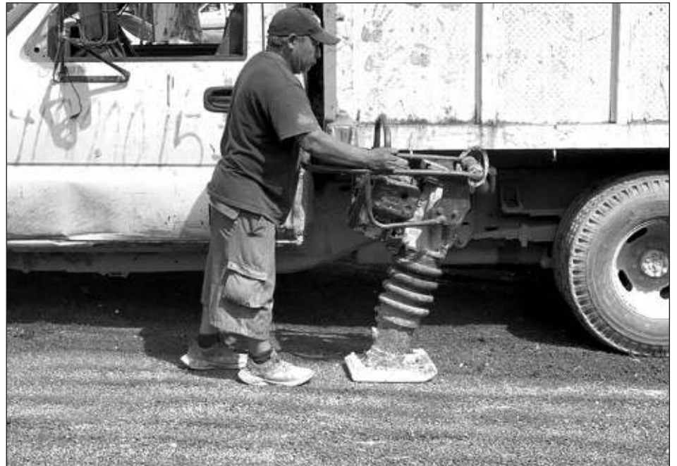
▲ La reparación forma parte de un programa de bacheo de la dirección general de Servicios Públicos que también incluye otras calles de la localidad.