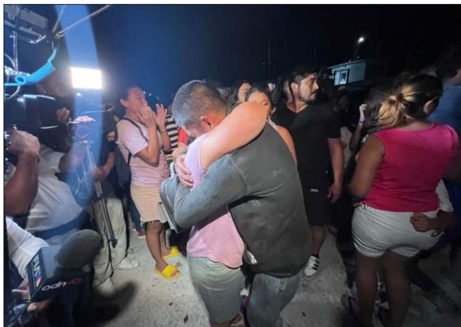
▲ Cientos de personas se reunieron para recibir a los tripulantes de Neldy , familiares, amigos y vecinos celebraron que los hombres hayan sido encontrados con vida y calificaron como un milagro el hecho de tenerlos nuevamente en casa.

Cientos de personas se dieron cita en el puerto de abrigo de Yucalpetén para recibir a los sobre-