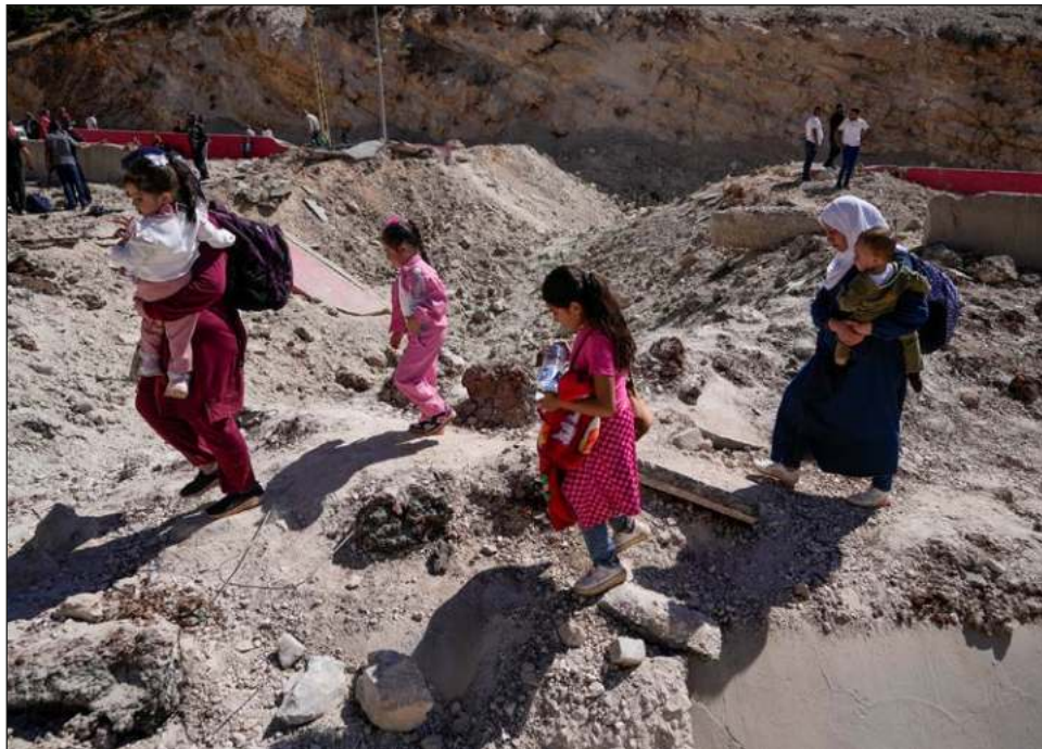
▲ Cifras emitidas por el coordinador humanitario de las Naciones Unidas para Líbano indican que del total de desplazados, al menos 150 mil son menores de edad.

“No atacamos a civiles. Pero al mismo tiempo, si descubrimos actividades de Hezbolá o la intención de lanzar cohetes contra Israel, haremos lo que cualquier otro país haría al respecto”, declaró el embajador de Israel ante la ONU, Danny Danon.