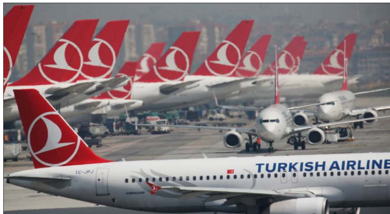
▲ Un piloto de 59 años de la compañía aérea turca Turkish Airlines falleció en pleno vuelo tras sufrir una descompensación, lo que llevó al avión a aterrizar de urgencia en Nueva York este miércoles, informó la aereo-

línea. La aeronave, que partió de Seattle el martes por la noche, en la costa oeste de Estados Unidos, se dirigía a la ciudad turca de Estambul, indicó en X el portavoz de Turkish Airlines, Yahya Üstün.