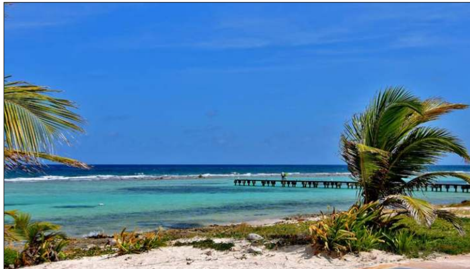
▲ La inversión también contempla una conexión directa a la estación de Limones, facilitando el acceso al Tren Maya y promoviendo visitas a destinos a lo largo del estado.

Añadió que en la Nueva Era del Caribe Mexicano