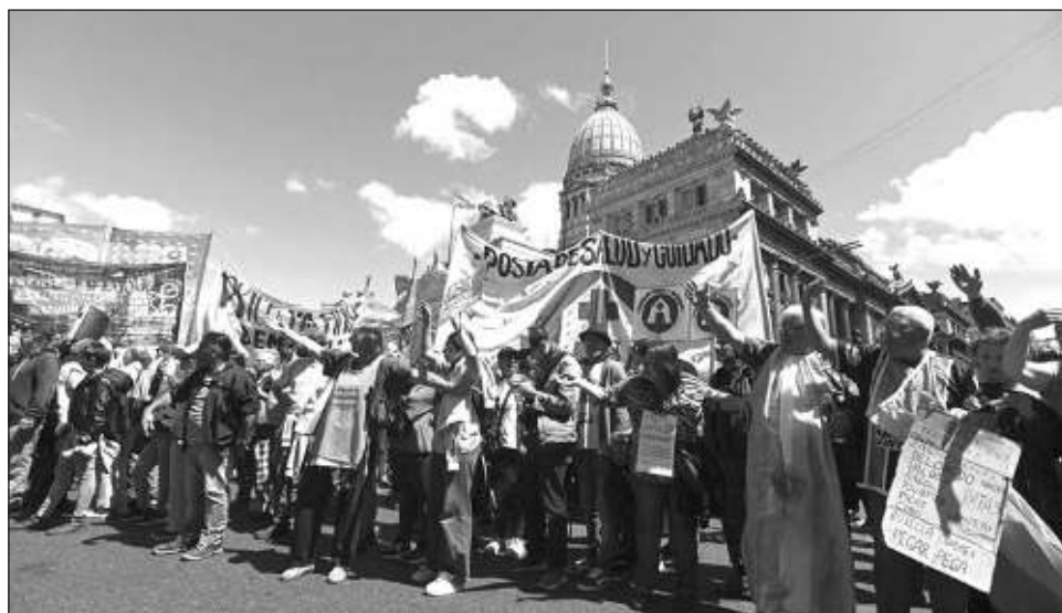
▲ El veto crispó los ánimos de la sociedad, que se movilizó en marchas multitudinarias para apoyar a los universitarios y contra el ajuste que golpea también otras áreas sensibles como la salud pública.

Cientos de manifestan- tes, muchos de ellos univer- sitarios, se concentraron