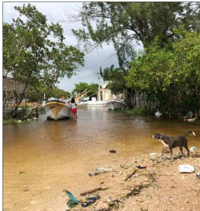
▲ Ahora es momento de que las autoridades coordinen la reparación de lo dañado y programen las siguientes medidas de prevención, y lo deseable es que exhorten a la población a participar en ellas.

La desaparición de pescadores terminó en un susto, y por los motivos que se quiera, lo importante es que no hay mayores pérdidas de vidas que lamentar. Lo que sí es cuestionable es que 1) una embarcación se haya encontrado en alta mar durante el paso del huracán; como si esto fuera garantía de que podrán capturar más pulpos, ahora que es temporada; y 2) que el rescate haya sido organizado y realizado por otros pescadores, sin contar con el permiso de la capitanía de puerto para salir, y menos con apoyo de las corporaciones de seguridad. Se entiende que existe un protocolo para seguridad de todos los par-