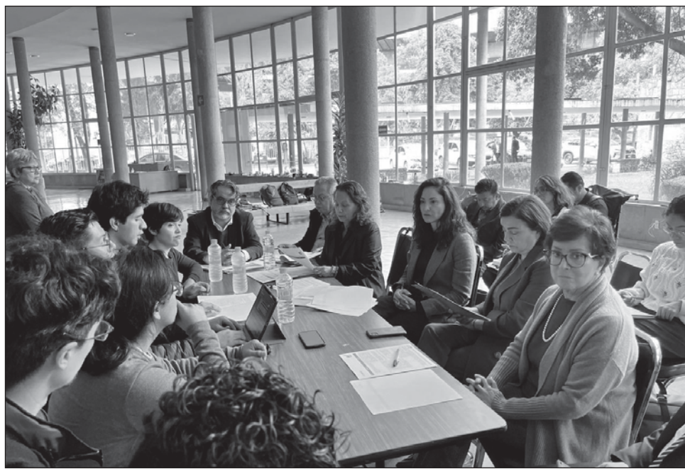
▲ En la reunión que sostuvo la secretaria de Cultura federal, Claudia Curiel, con estudiantes del conservatorio, se llegó al acuerdo de realizar comisiones de trabajo con representación para preparar una agenda conjunta y plan de acción.

En la reunión que sostuvo la secretaria de Cultura federal, Claudia Curiel de Icaza, con estudiantes del conservatorio, adonde acudió para atender la solicitud de los estudiantes y