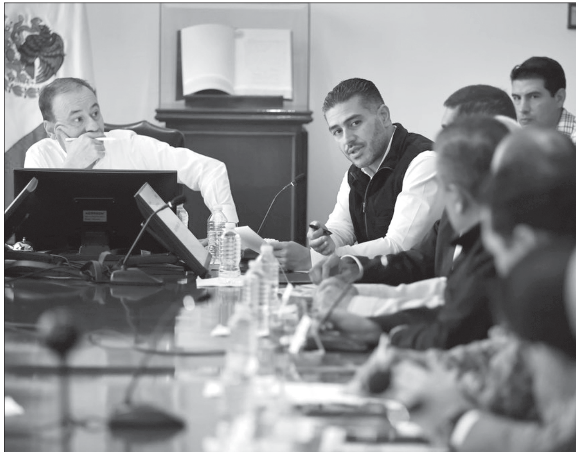
▲ “Fijó tres objetivos: 1) Disminución de la incidencia delictiva, principalmente de homicidios dolosos y delitos de alto impacto, como la extorsión. 2) Neutralizar generadores de violencia y redes criminales, con atención a zonas de alta incidencia, como Culiacán. 3) Fortalecer las capacidades de prevención y proximidad social de las policías locales en todo el país”.

LAS DIFERENCIAS QUE algunos buscan con impaciencia entre los presidentes Sheinbaum y López Obrador no van a encontrarlas en declaraciones rimbombantes de la Presidenta, sino en los hechos. “Despausó” al embajador de Estados Unidos, Ken Salazar, a quien Andrés Manuel “pausó” porque andaba haciendo declaraciones injerentistas en el tema de la reforma judicial. Claudia dijo que el canciller Juan Ramón de la Fuente se reunirá con el diplomático en fecha próxima en el edificio de la Secretaría de Relaciones Exteriores (SRE), como corresponde. Ya había hecho ancho el camino a Palacio Nacional. Por su lado, el titular de la SRE, en su comparecencia en el Senado señaló las prioridades de la política exterior de México: “primero que nada y por arriba de cualquier otra, la defensa de la soberanía nacional. En este rubro, permí-