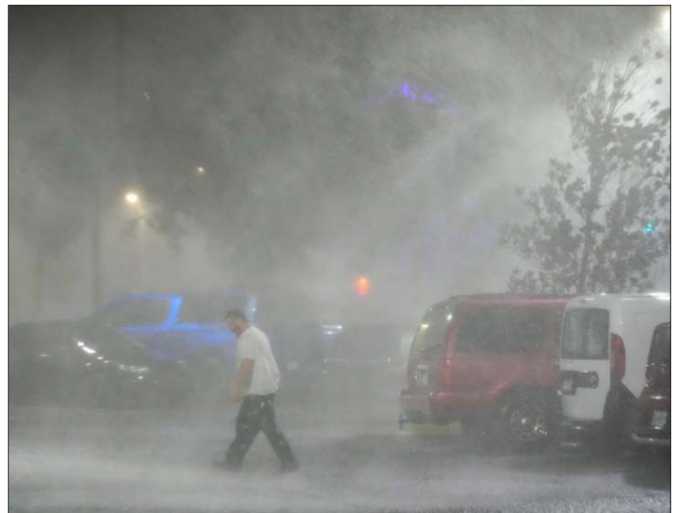
▲ El huracán Milton llegó el miércoles a Florida como tormenta de categoría 2, y azotó la costa con fuertes vientos, además de provocar una serie de tornados en todo el estado.

Milton azotó a una región de Florida que aún no se recupera del paso del huracán Helene, el cual provocó graves daños en comunidades costeras con marejadas ciclónicas que, tan sólo en el condado de Pinellas, causaron la muerte de una docena de personas.