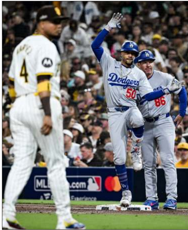
▲ Mookie Betts fue clave en el triunfo de Los Ángeles en San Diego el miércoles por la noche.

Inmediatamente después, en un camerino eufórico,