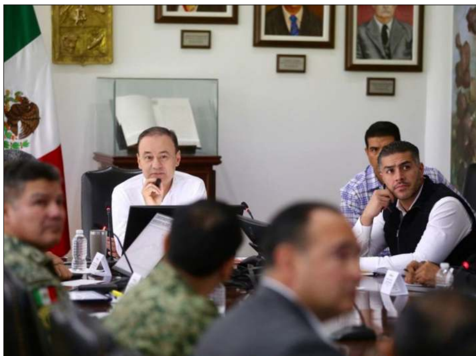
▲ El acuerdo se dio tras una reunión en el Palacio de Gobierno de Sonora encabezada por el gobernador del estado, Alfonso Durazo Montañó, con Omar García Harfuch.

La estrategia de Sheinbaum busca mejorar la coordinación entre los miembros del Gabinete de