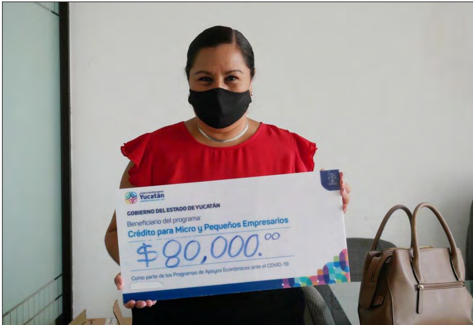
▲ Los créditos del Fondo Microyuc se otorgan con facilidades de pago.