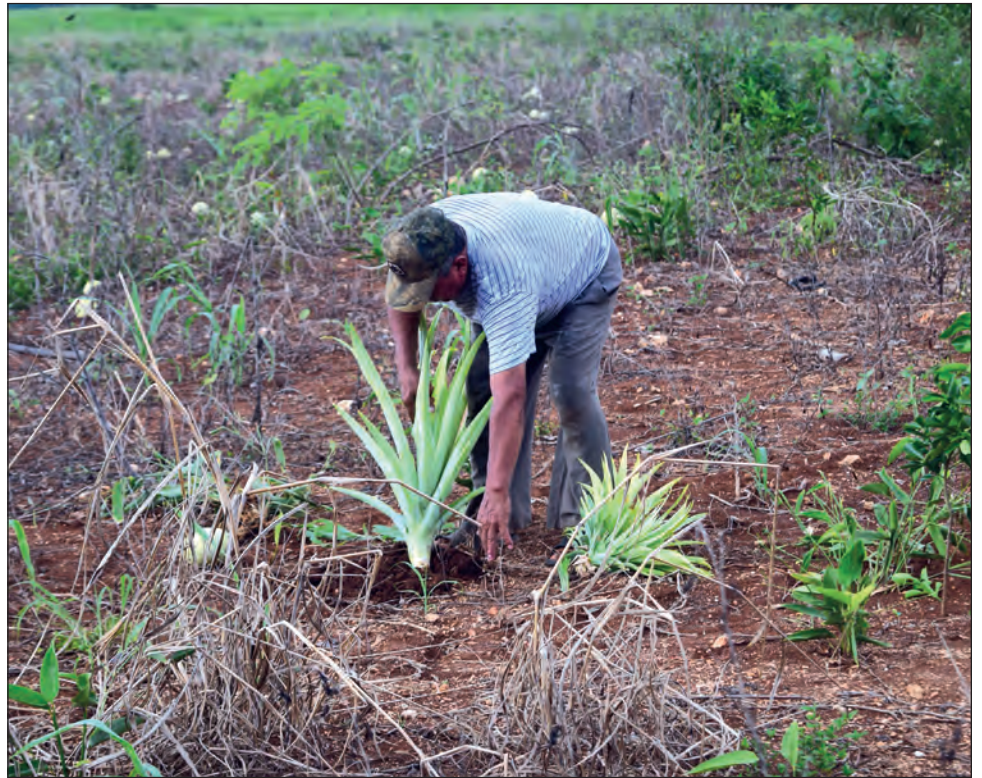
▲ El proyecto ferroviario representa una gran oportunidad para fortalecer y recuperar la vocación productiva de los pueblos.

Añadió que es una oportunidad para recuperar esta cultura de sostenibilidad que tienen las comunidades apostando a fortalecer las economías comunitarias. Algunos de los enfoques económicos del tren, agregó, no solo tiene que ver con las rutas, sino es un programa de justicia social que pretende incorporar a las comunida-