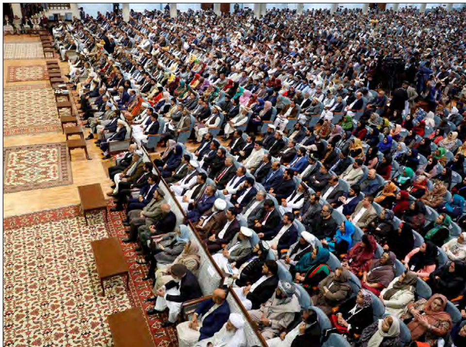
▲ La Loya Yirga, que se llevó a cabo durante el fin de semana en Kabul, reunió a miembros notables de la sociedad afgana para discutir la liberación de los presos talibanes.

La asamblea de notables también pidió a los talibanes que liberen a “todos los prisioneros civiles y militares del gobierno” y les exigieron garantías de que “los detenidos liberados (por el gobierno) no vuelvan al campo de batalla”.