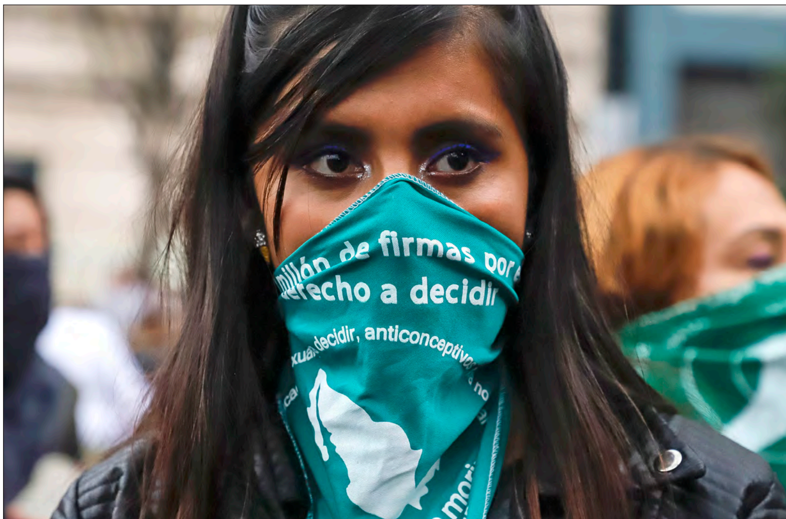
▲ La verdadera dignidad retornará cual marea verde haciendo a la primavera florecer llena de humanidad.