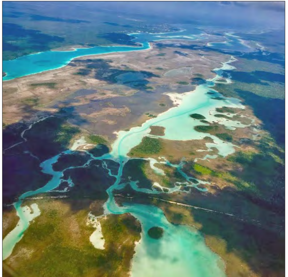
▲ La Sema resaltó la necesidad de crear un programa que permita la protección de toda la cuenca y que las actividades productivas tengan una visión sustentable.

En relación con la problemática de los caracoles chivitas, Villanueva Arcos especificó que ya están atendiendo el tema: expertos y técnicos del Colegio de la Frontera Sur estudian las posibles causas de la mortandad de la especie.