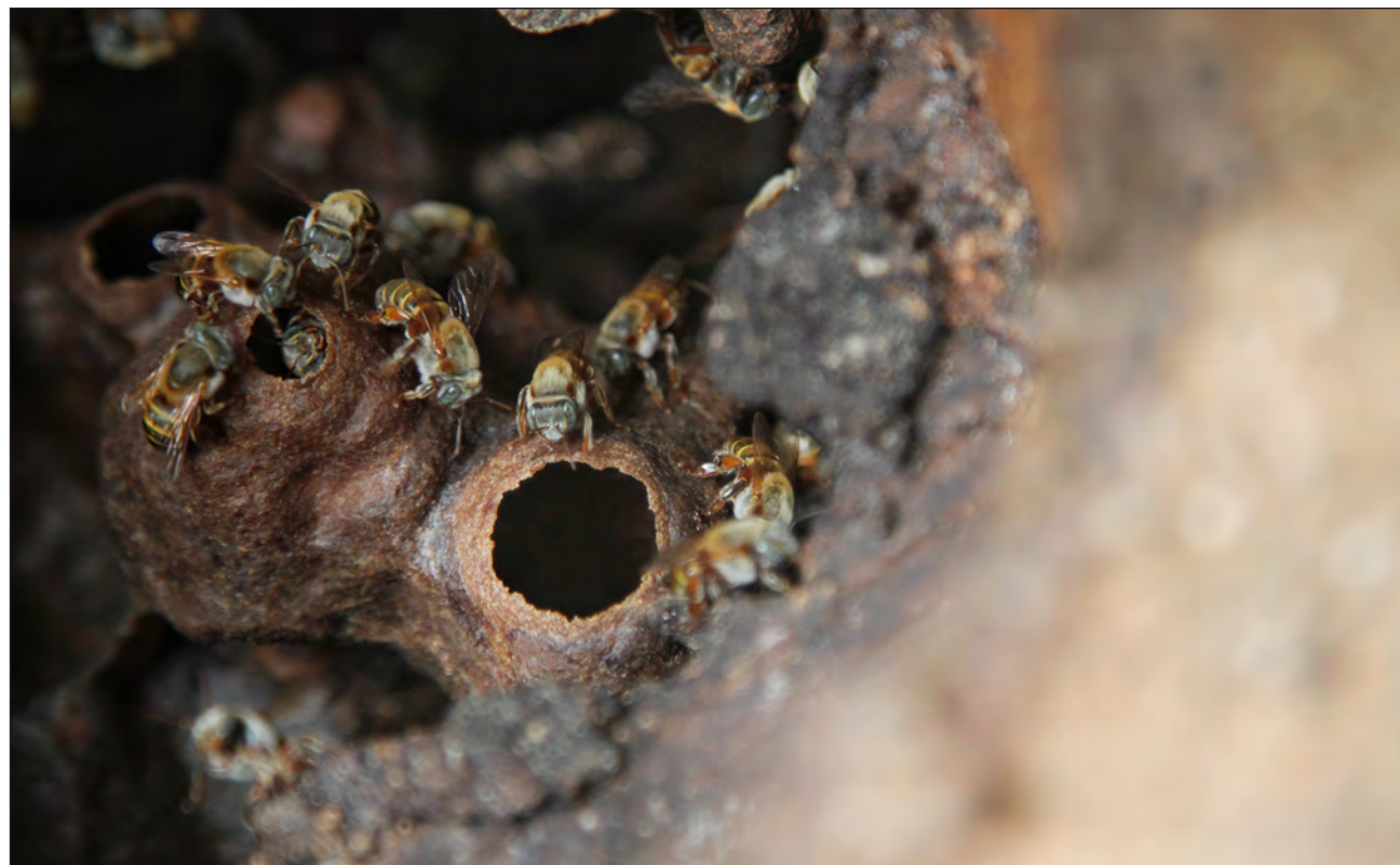
▲ Tras el paso de la tormenta tropical Cristóbal, el municipio de Felipe Carrillo Puerto registró la muerte de 300 colmenas.

La apicultura se ve afectada también por el cambio climático, reflejado en sequías y lluvias atípicas que afectan los periodos de floración. La especialista citó