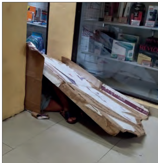
▲ Quienes viven en la calle deben valerse de cualquier recurso para su refugio a la hora de dormir.

Llama la atención que en puntos como los bajos de la tienda departamental Del Sol y las faldas de la catedral -en donde habitualmente pernoctaba la indigencia brille por su ausencia. La Plaza Grande que albergaba por lo menos a una decena de estas personas, ahora sólo luce la presencia de los policías.