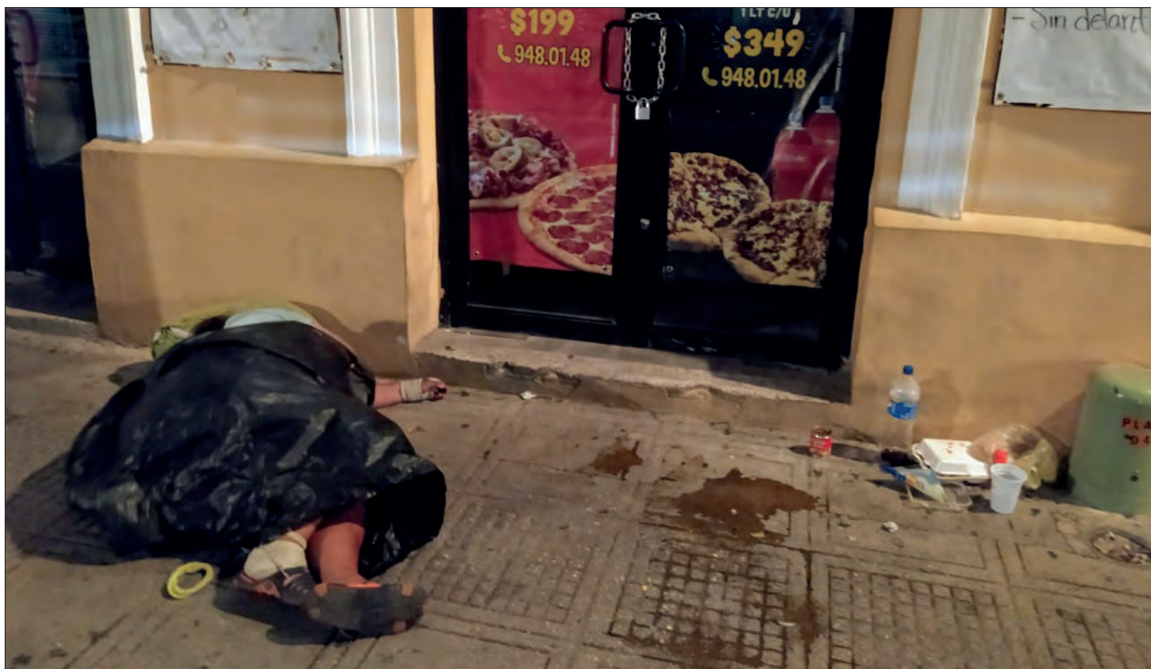
▲ Algunos indigentes encuentran refugio a las puertas del Lucas de Gálvez o el San Benito, dos colosos cuyas luces dan la impresión de ser benevolentes con quienes buscan en sus escaleras un sitio para reposar luego de una jornada de buscar comida y pedir dinero.