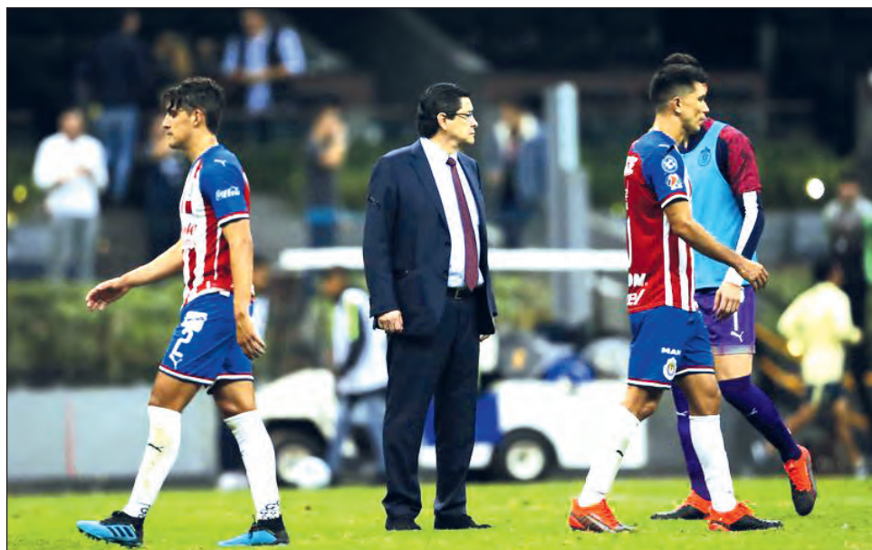
▲ El mal inicio de torneo le costó a Tena el puesto con las Chivas.

"La directiva ha determinado que sea un cuerpo técnico institucional el responsable de preparar nuestros próximos encuentros en esta jornada doble", señaló el club. "En el corto plazo se tomará la decisión de quién