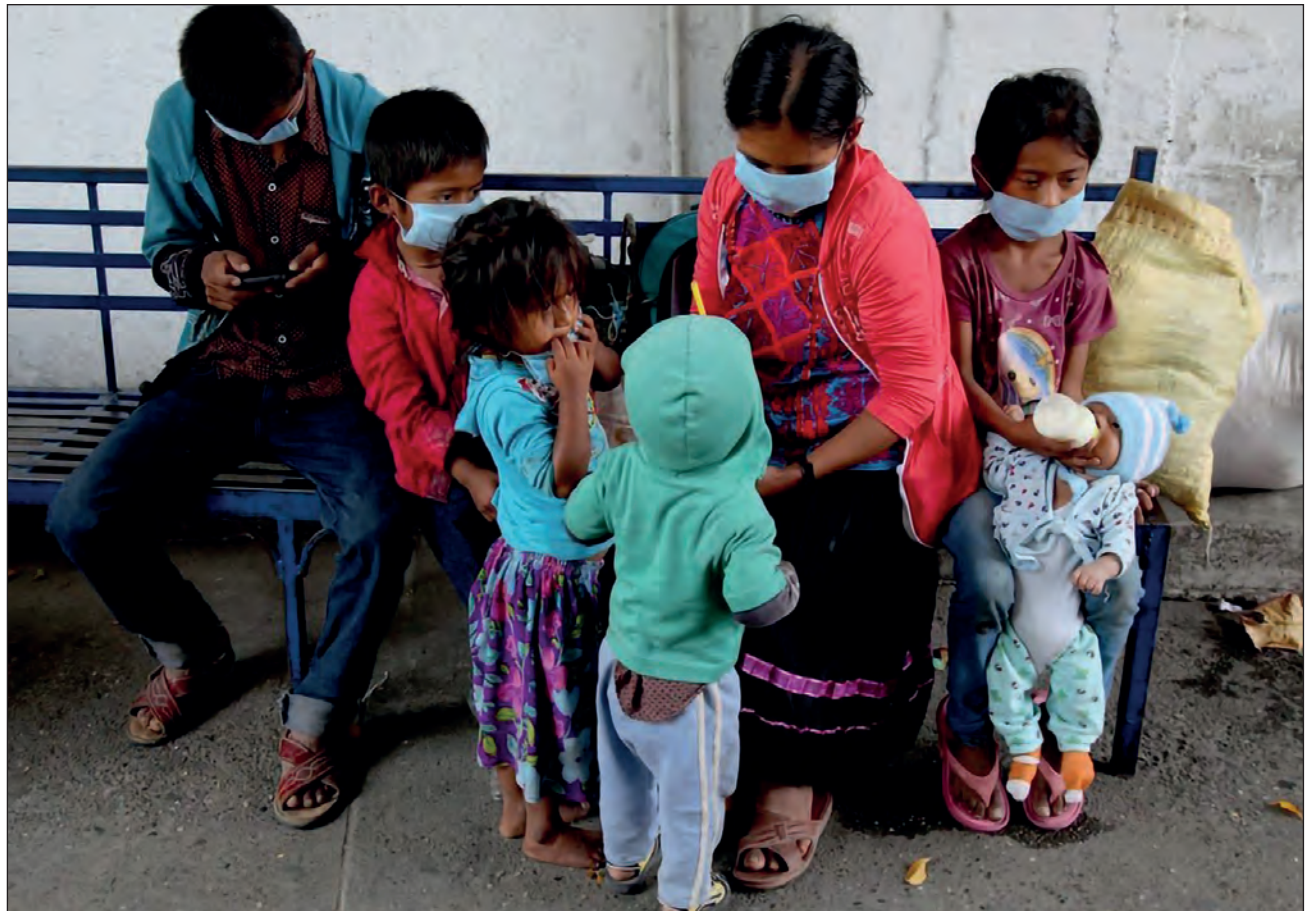
▲ Si bien hay que hablar de visibilizar a los pueblos indígenas, es preciso mostrar sus procesos de resiliencia y resistencia.