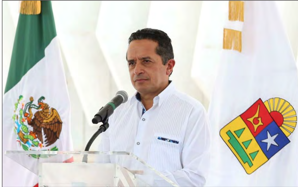
▲ El gobernador Carlos Joaquín programa Vigilantes asegurará el cumplimiento de las disposiciones y protocolos sanitarios.

Continuará el programa Sin Violencia en Casa, con el que hasta la fecha se le ha otorgado atención a dos mil 226 niñas, niños, adolescentes y mujeres