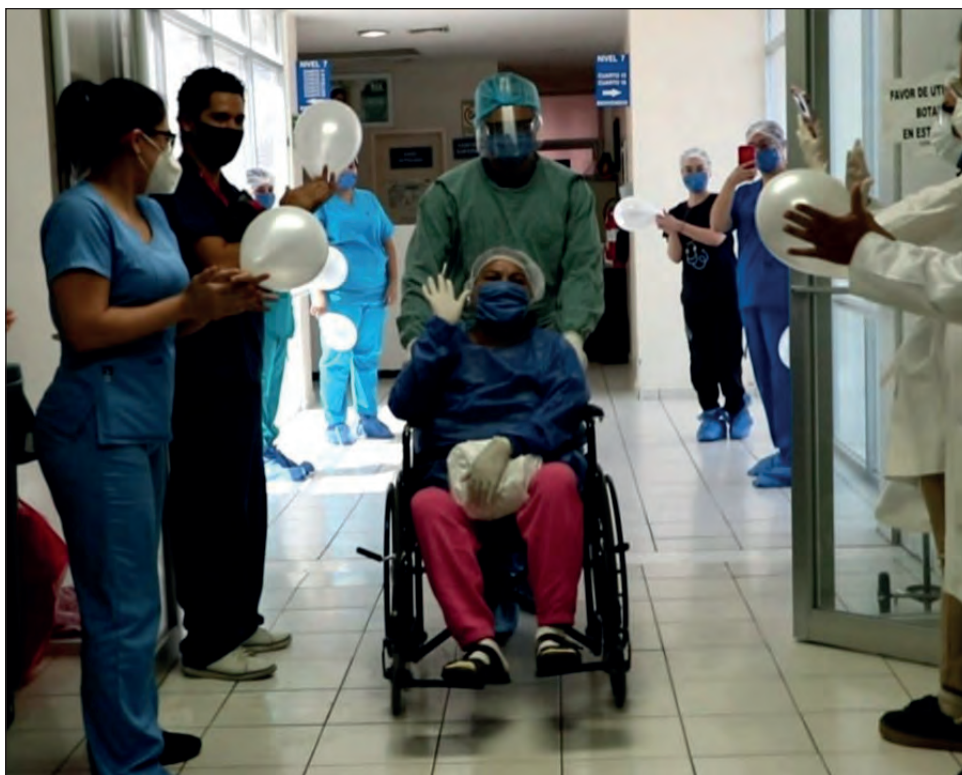
▲ En entidades como Tamaulipas, el número estimado de contagiados se redujo en 27 por ciento, según la SSA.

Cortés Alcalá destacó que en Campeche los casos estimados disminuyeron en 23 por ciento, y se mantiene por debajo del promedio nacional en casos activos, con 6 por ciento; Nuevo León logró una disminución de 18 por ciento en casos esti-