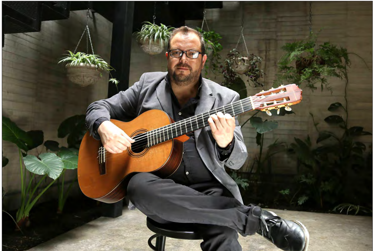
▲ Las piezas para Música en Cuarentena fueron pensadas para escribirse en un día y que los músicos interesados pudieran grabar en sus casas con sus teléfonos.

Justo estaba regresando de la hospitalización cuando comenzó la cuarentena, entonces imaginé a los compañeros, a mis amigos y conocidos en la desesperación porque los oyeran tocar, y pensé que sería genial escribirles música nueva para