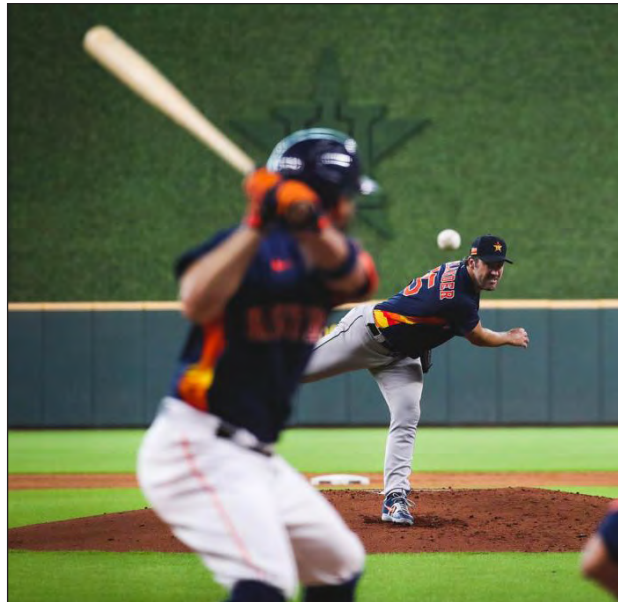
▲ La baja de Justin Verlander fue un golpe muy duro para Houston este año.

Las rectas de Chapman han sido impresionantes por varios años y, como destaca la publicación en su reportaje, el antillano fue el primero en alcanzar 105 millas por hora en la era de Statcast, pero la durabilidad, logros y velocidad de Johnson aún como veterano lo ponen adelante. El también zurdo, que obtuvo su primer reconocimiento de la mejor recta en 1993 y el último en 2004, "es tal vez el pitcher más dominante de todos los tiempos", indica la publicación.