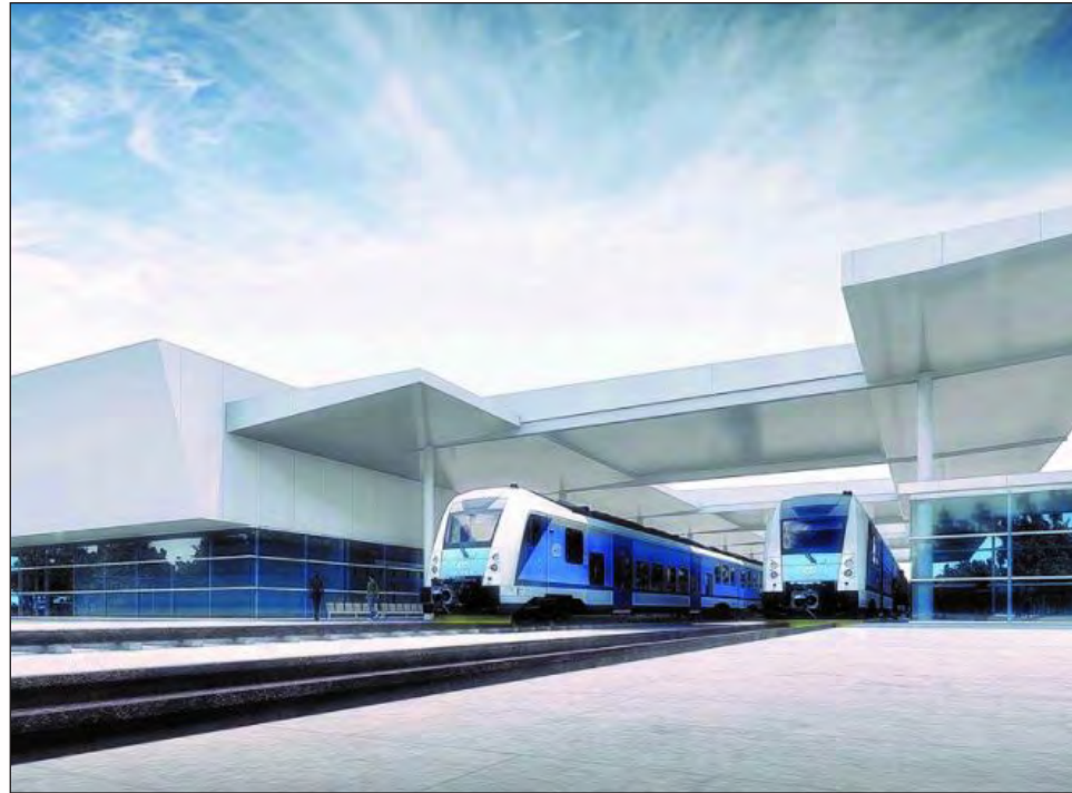
▲ Una de las estaciones de Cancún será de pasajeros, y estará cercana al aeropuerto. Render Fonatur

Mencionó que hay cuatro ejes fundamentales: económico, social, cultural y ambiental. Para afianzarlos han tenido acercamientos con comunidades de Solidaridad, Puerto Morelos y Tulum, que son los municipios que abarca este tramo, para escuchar sus demandas sociales y que ellos se vean incluidos. "Se trata de no dejar a nadie fuera, reforzar la vinculación social,