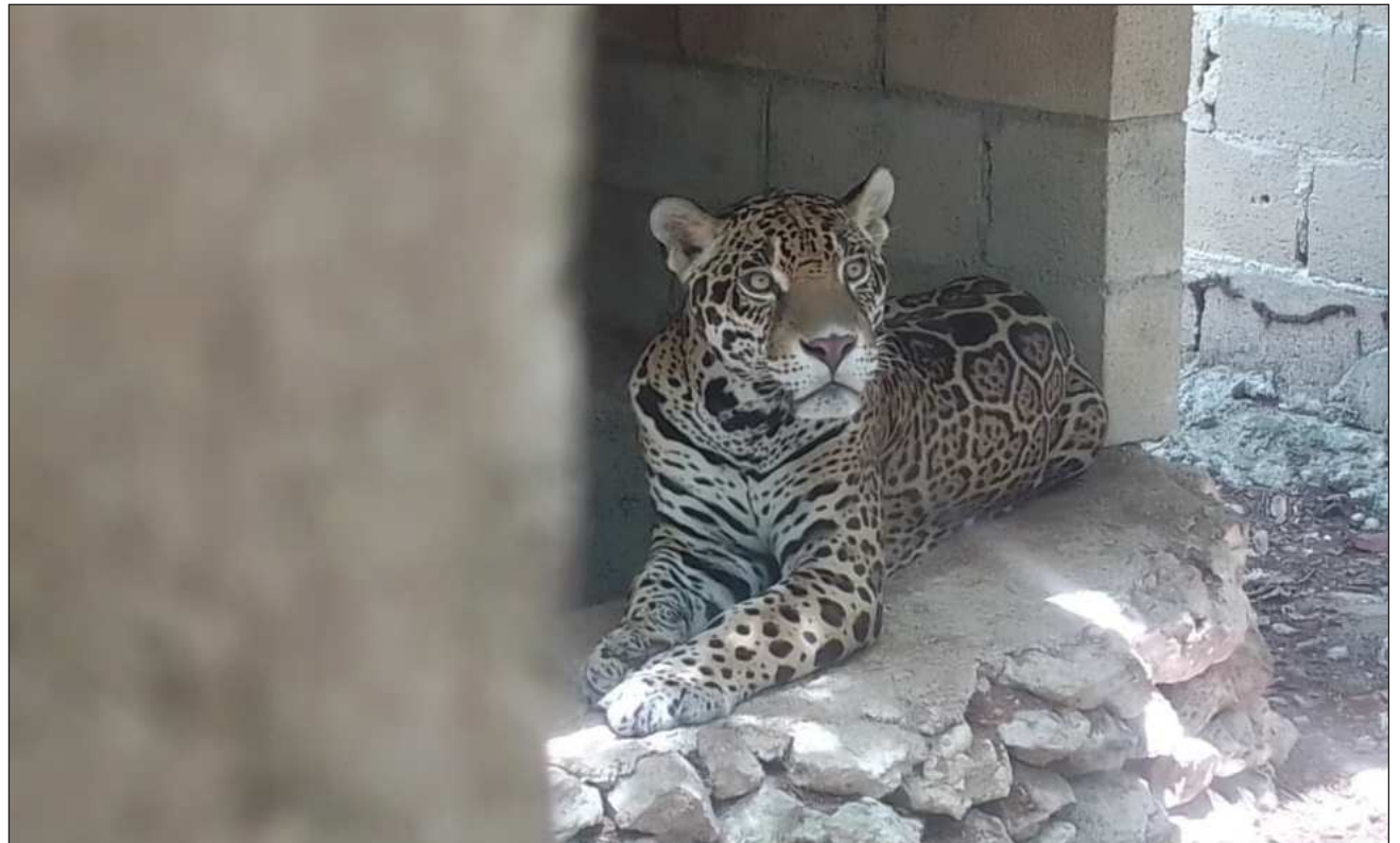
▲ La acción fue en el predio de 60 hectáreas, ubicado en Playa del Carmen.

Esta acción, en la que contaron con apoyo de la Procuraduría Federal de Protección al Ambiente y Secretaría de Medio Ambiente de Quintana Roo, tuvo lugar en