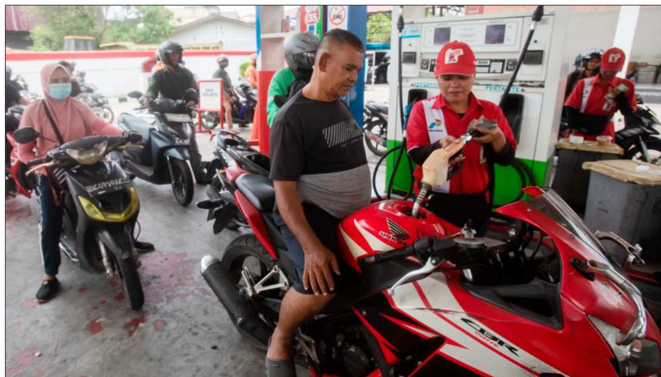
▲ El próximo presidente de las negociaciones de la COP31 declaró que la nueva preocupación en torno al suministro mundial de combustible, a medida que Irán e Israel lanzan nuevos ataques, solo "demuestra los riesgos" de la dependencia de los combustibles fósiles.

"La buena noticia es que la respuesta a la crisis