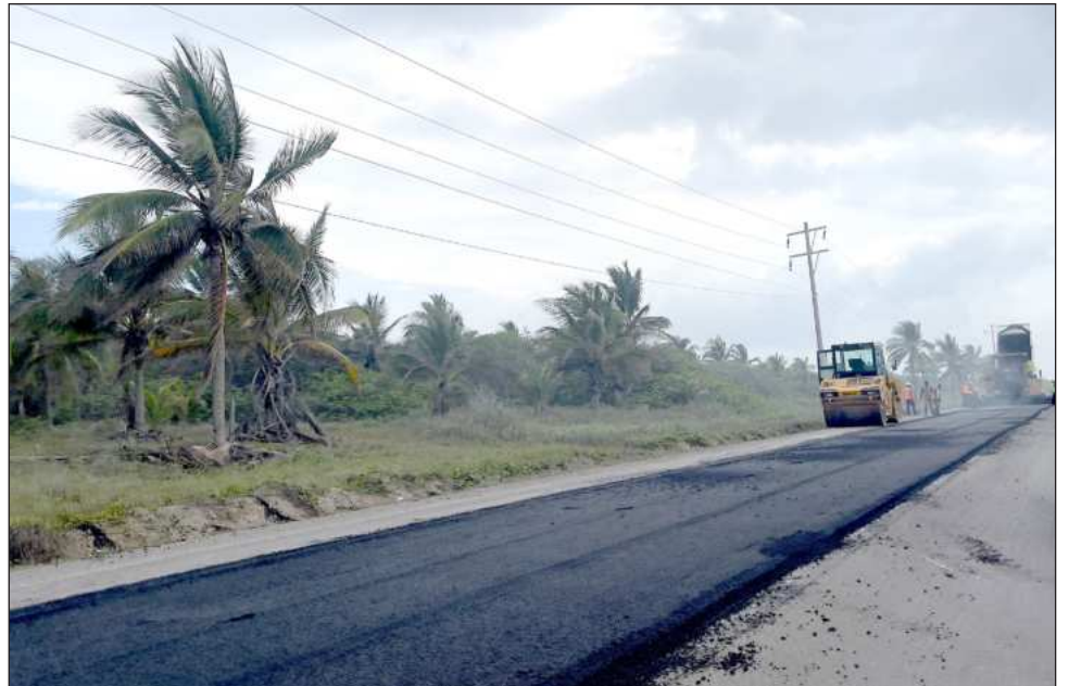
▲ Además del mantenimiento permanente que se realiza en distintos tramos carreteros, en los próximos días comenzarán las labores de conservación periódica.

Explicó que estos seis kilómetros se sumarán a los cuatro kilómetros modernizados durante 2025, por lo que al concluir 2026 se alcanzarán 10 kilómetros re-