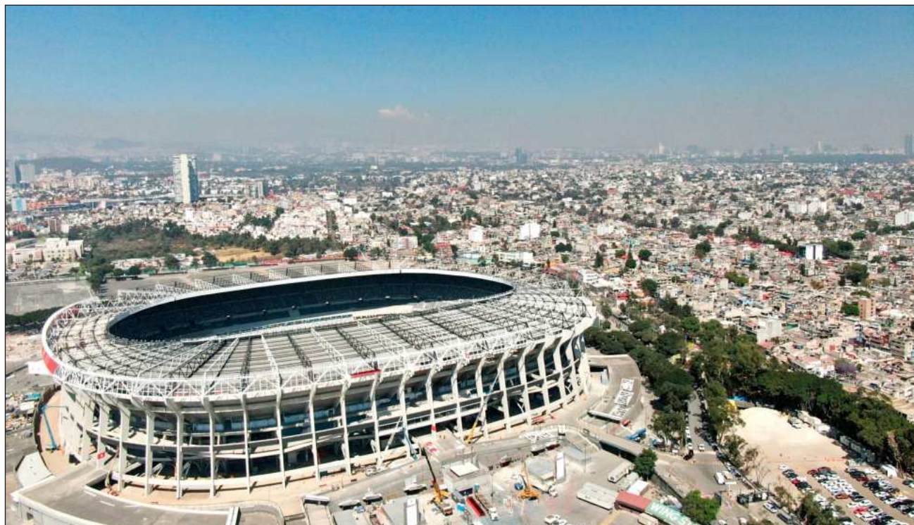
▲ En el decreto oficial publicado por el gobierno federal, se destaca que estas medidas buscan agilizar la movilidad exclusivamente para la inauguración del mundial para este 11 de junio. La Presidenta subrayó que no se trata de una obligación, sino un exhorto.

La presidenta Claudia Sheinbaum precisó que en el caso de la iniciativa privada no se trata de una obligación, sino de un exhorto. Podría haberse hecho de otra manera y que fuera obligatorio, pero no se pretende obligarlos a reducir actividades, sino exhortarlos a