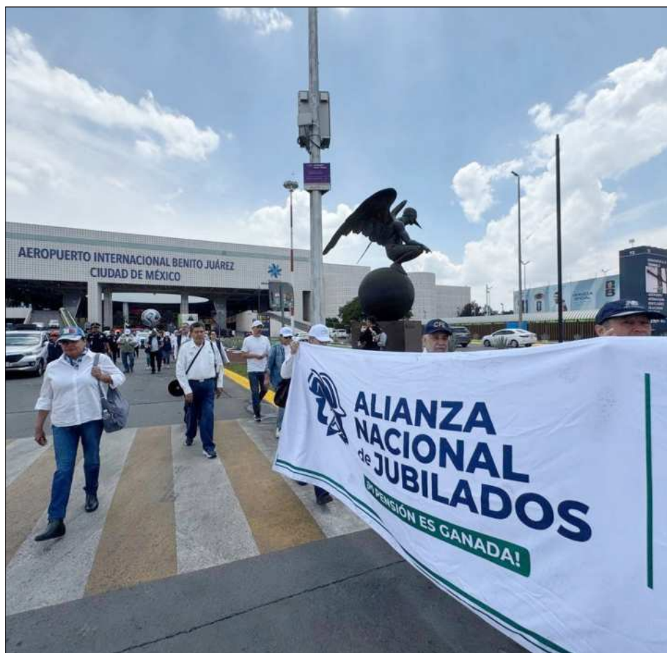
▲ La Alianza Nacional agrupa a jubilados de la Comisión Federal de Electricidad, Luz y Fuerza del Centro, así como Banrural y también Nafin.

“Hoy más que nunca hacemos un llamado a mantener la unidad, la