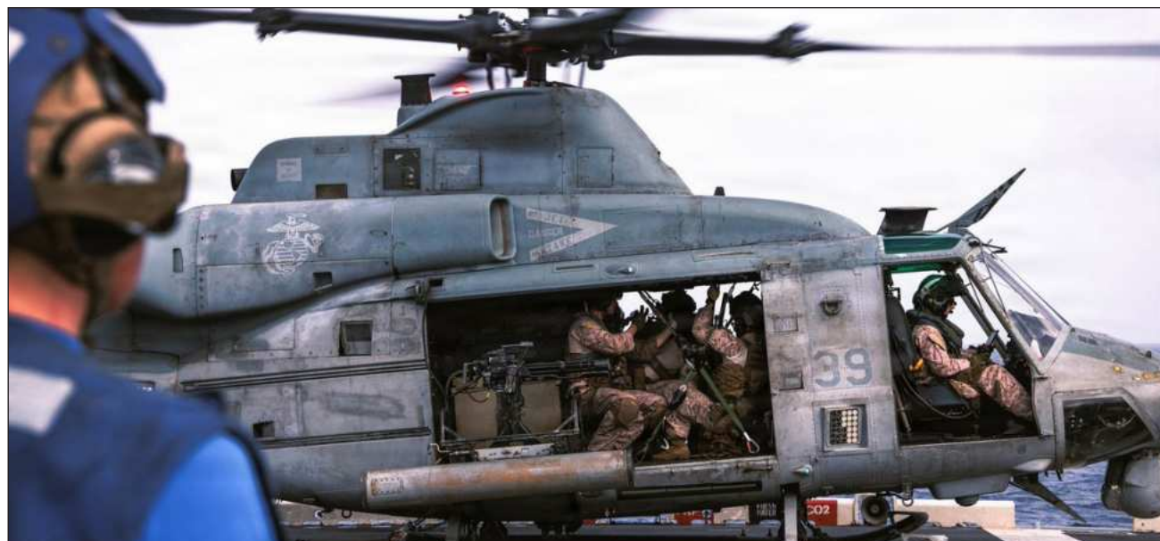
▲ El presidente, Donald Trump, escribió en Truth Social que fue informado por las fuerzas armadas de que Irán derribó un helicóptero Apache de alta tecnología mientras sobrevolaba por el estrecho de Ormuz.

Las causas del accidente seguían sin estar claras este martes por la mañana en Medio Oriente, que aún se recuperaba del intercambio de fuego entre Irán e Israel en la víspera, en el mayor golpe,