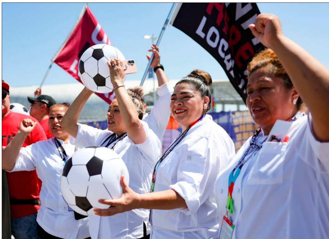
▲ El sindicato UNITE HERE Local 11 representa a 2 mil cantineros, meseros, cocineros y lavaplatos del SoFi Stadium.

Los trabajadores representados por UNITE HERE Local 11 manifestaron que buscaban aumentos salariales, protecciones frente a la subcontratación y seguridad laboral en medio del incremento de la aplicación de las leyes migratorias bajo