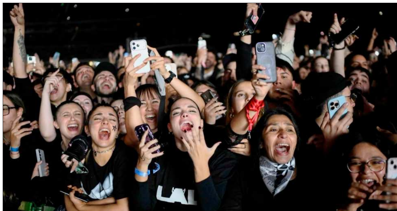
▲ Los especialistas afirman que los tapones para los oídos solo reducen el volumen, no lo apagan. Y cada vez más jóvenes los están adoptando, dando un paso sencillo para proteger sus oídos de cara a muchos conciertos más.