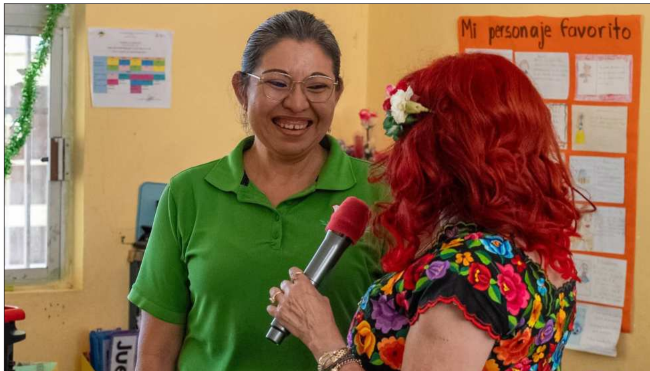
▲ La gobernadora afirmó que los docentes y servidores públicos retomarán sus labores con mayor entusiasmo.

Las escuelas particulares decidieron mantener sus actividades