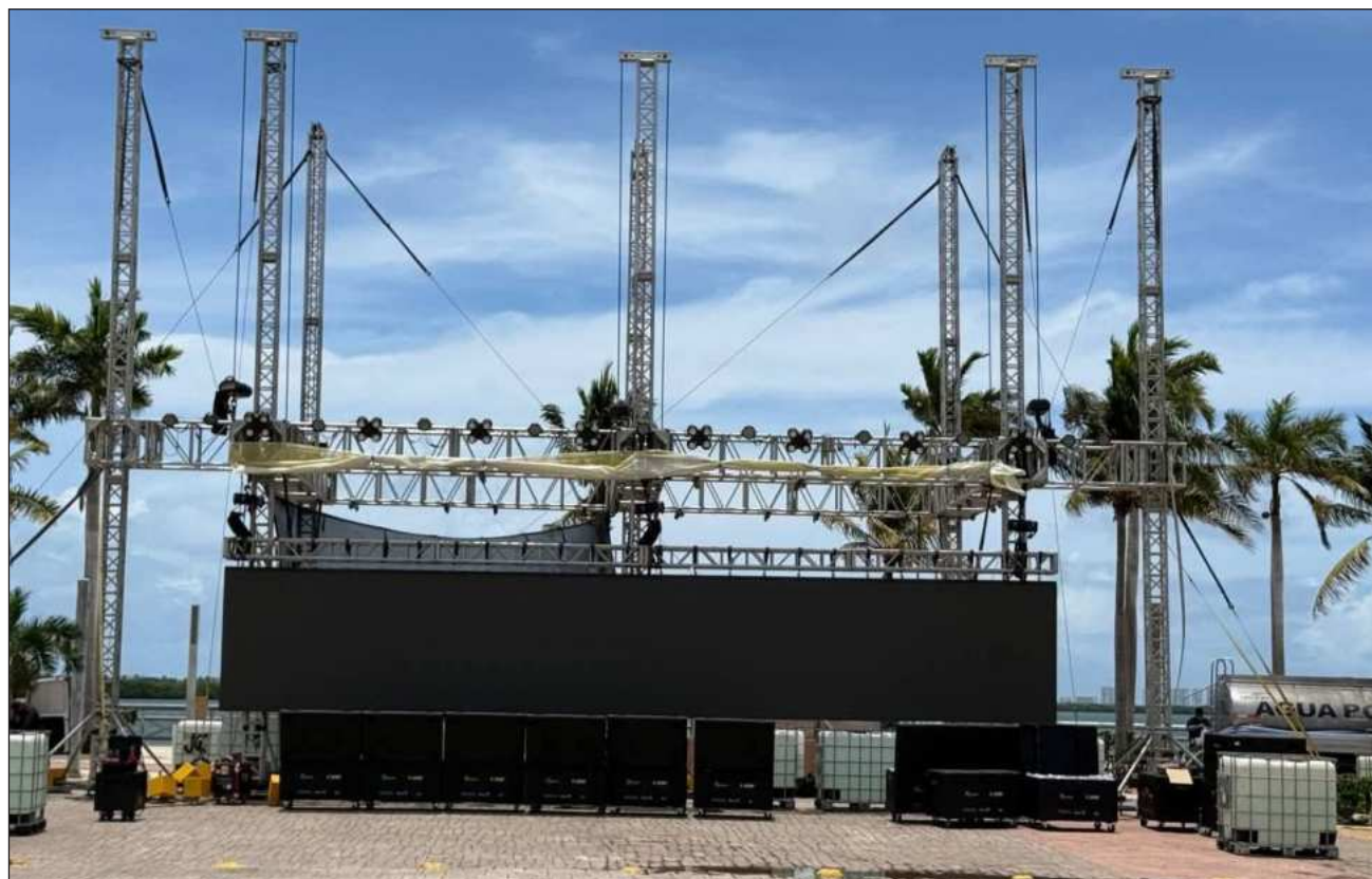
▲ La transmisión de partidos también se realizará en los municipios de Bacalar, Tulum, Cozumel e Isla Mujeres. En total serán 50 partidos, de los 104 que tendrá el Mundial, los que podrán verse gratuitamente en el Caribe Mexicano

La transmisión de partidos también se realizará en