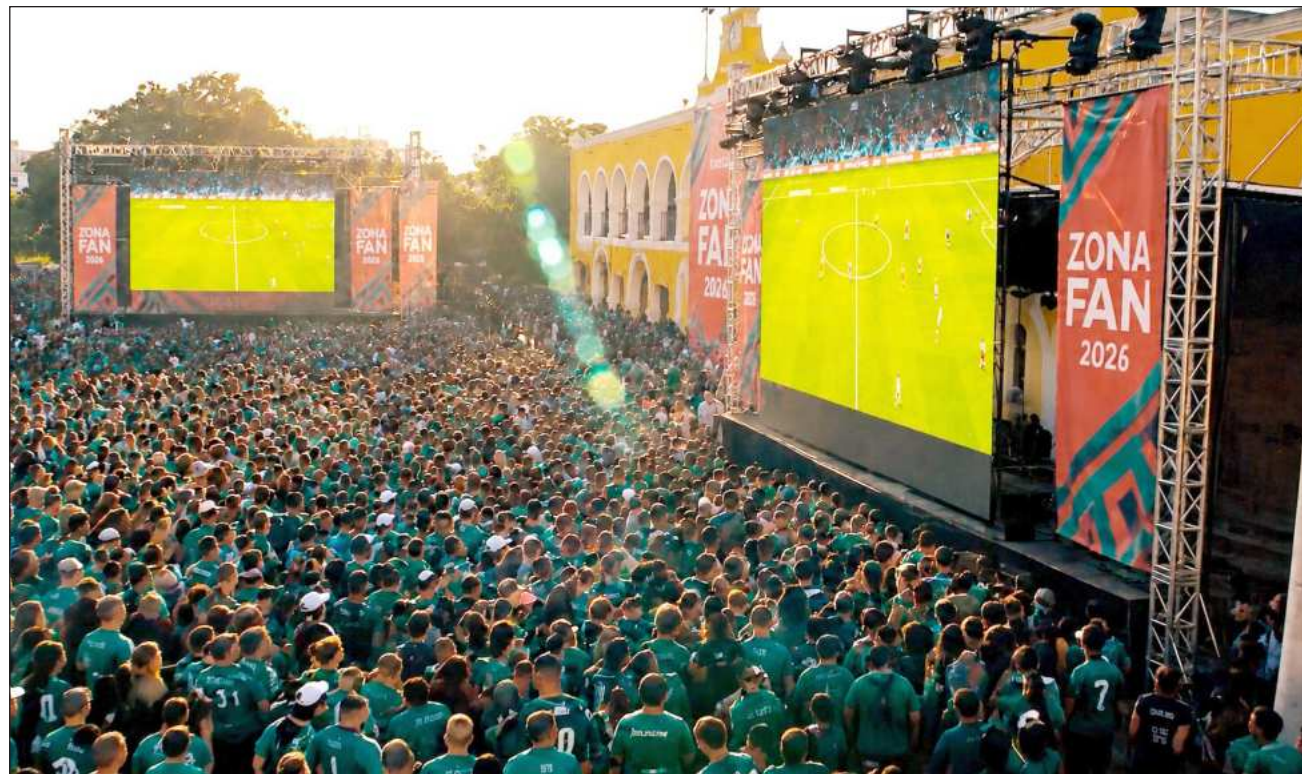
▲ El jueves se habilitarán estos puntos desde las 11 horas para ver la transmisión de la inauguración.

El 18 y 25 de junio la cita es a las 7 de la noche para ver los siguientes partidos de México, contra Corea del Sur y Chequia, respectivamente.