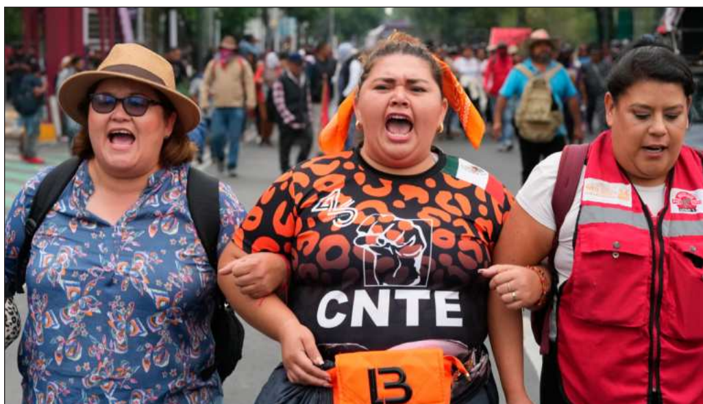
▲ Si la CNTE obedece a una estrategia para proyectar una imagen de caos e inestabilidad en el país, y la organización está a la espera de un acto de represión, esto ya lo anticipó el gobierno.

Pero con el decreto de suspensión de clases, y los servidores públicos desde el home office, el ambiente festivo previsto para el juego inaugural entre México y Sudáfrica ya no será. Millones han quedado excluidos de este Mundial, y lo deportivo ha quedado ya muy detrás de lo político en el negocio del fútbol.