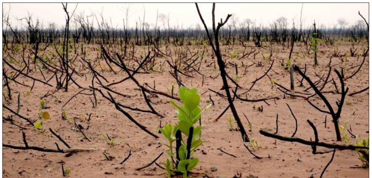
▲ "Hay muchas personas que siguen pensando que proteger y conservar la naturaleza atenta contra su interés, y que es legítimo su interés por acumular con que consideran riqueza sin considerar los efectos del deterioro".

Es verdad que hay algunas noticias alentadoras: nacen unos cuantos lobos, se reproducen unos pocos bisontes, se detiene al menos por el momento la explotación depredadora de los humedales de Mahahual, se suspende la construcción de infraestructura portuaria en Loreto, y se detiene la construcción de un gasoducto en el norte del país. No puedo sin embargo deshacerme de la sensación e que es poco, disperso y tardío. Al ver los mensajes, "memes", carteles y anuncios que han hecho diversas organizaciones para recordarnos la conmemoración de este día mundial del medio ambiente, me ha llamado la atención encontrarme con que, fuera de la ONU, nadie ha hecho eco del lema que este año nos propuso. Parece ser que, a ojos de quienes hoy dedican sus mejores esfuerzos a la protección de la naturaleza, la idea de "Nuestro poder. Nuestro planeta" no alcanza a generar entusiasmo alguno.