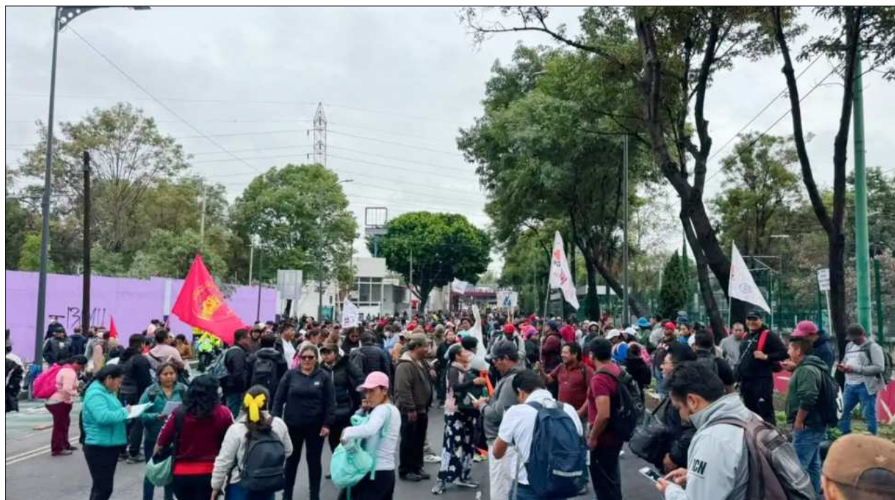
▲ Desde poco antes de las 10 horas de este martes, cientos de profesores comenzaron a concentrarse en esta vialidad, a la altura de Taxqueña, para exigir una mesa de diálogo con la presidenta Sheinbaum.

Durante el trayecto de la manifestación, vecinos salieron de sus casas a mostrarles apoyo con aplausos y levantando los puños. Como respuesta, los docentes respondieron con “ese apoyo si se ve, ese apoyo si se ve”.