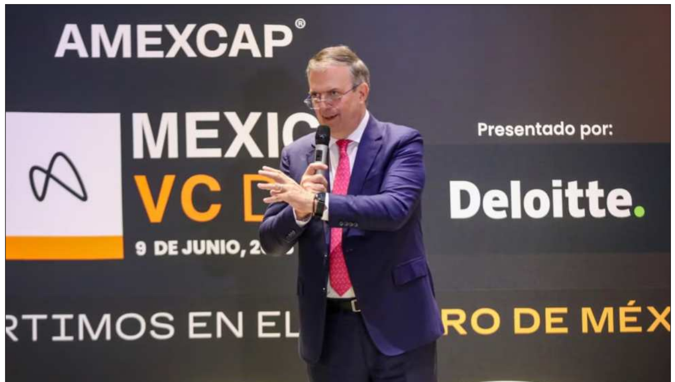
▲ El funcionario explicó que México paga actualmente un arancel de alrededor de 3.6% para ingresar al mercado de EU, mientras que sus competidores más dinámicos enfrentan tasas considerablemente más altas.

Ebrard dijo que la política comercial de Washington generará condiciones para que México crezca