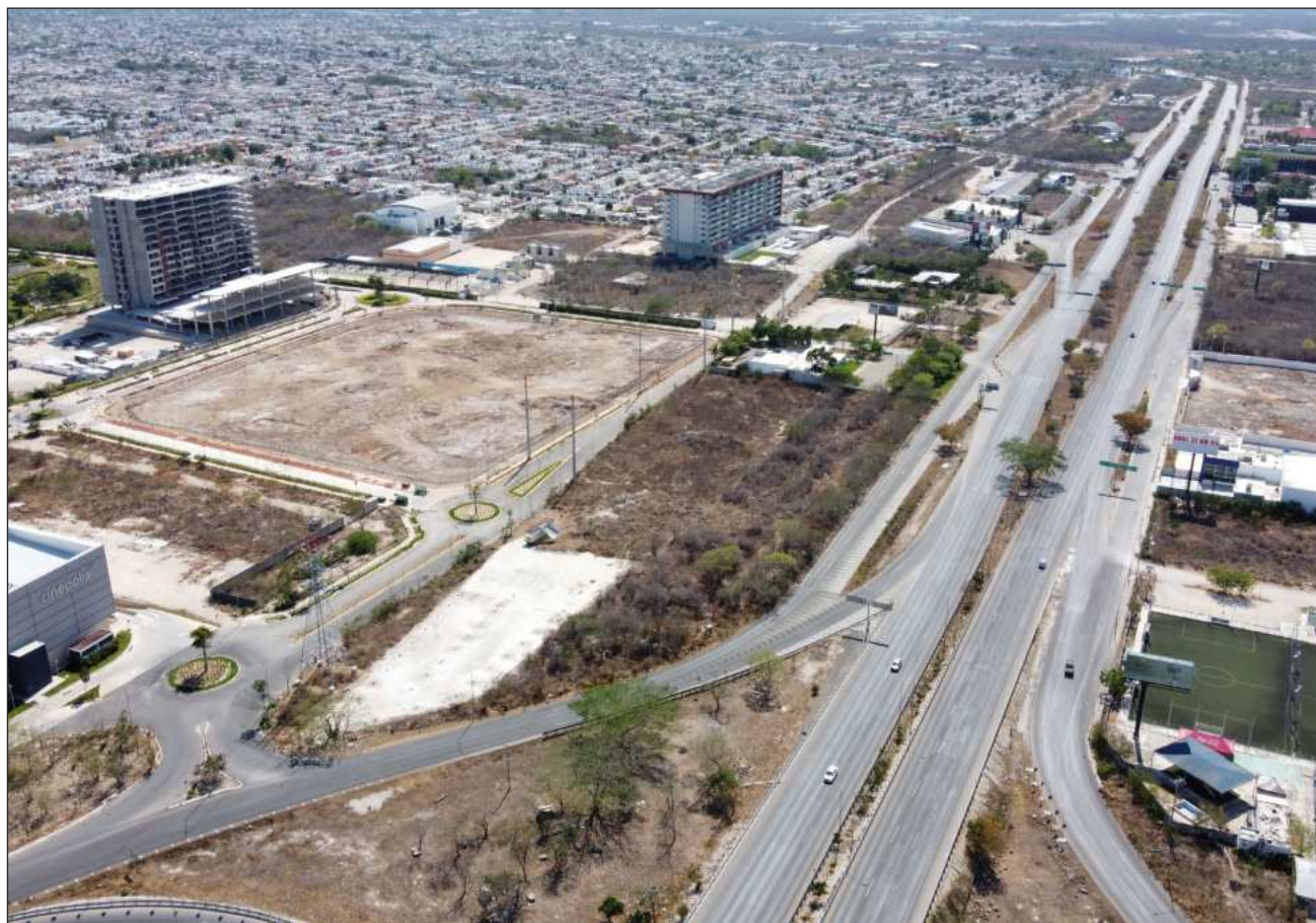
▲ Entre los primeros diagnósticos del Plan Renacimiento para Mérida, se alertó sobre el aumento de la población en la capital yucateca y el crecimiento del parque vehicular, situaciones que han incrementado el impacto en la infraestructura y accidentes viales.

La tercera fase de este Plan se llevará a cabo del 20 de julio al 10 de agosto con la sistematización de las propuestas y la elaboración del documento base para finalmente, en una cuarta fase dar a conocer el proyecto completo con las prioridades validadas.