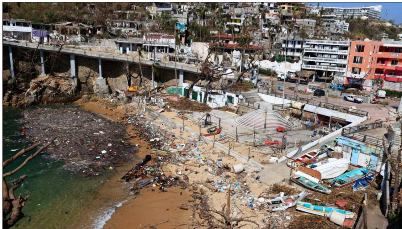
▲ El seguro fue diseñado para garantizar una respuesta financiera oportuna ante catástrofes de alta severidad.

“Su cobertura abarca todo el territorio nacional ante sismos, erupciones volcánicas, huracanes e inundaciones de severidad media alta, con vigencia del 5 de junio de 2026 al 5 de mayo de 2027”, detalló la dependencia al dar a conocer el contrato con Agroasemex, S.A.