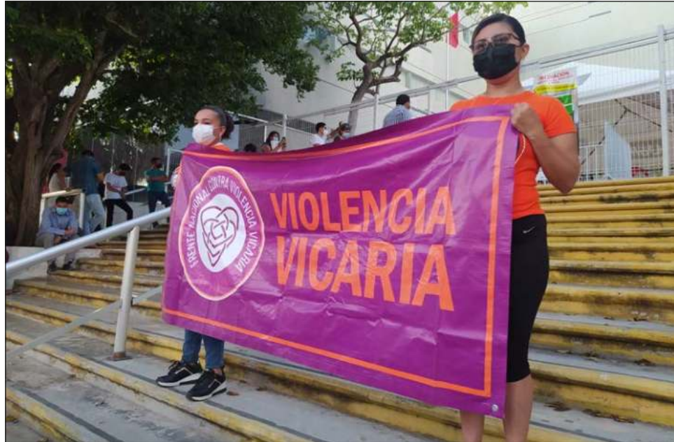
En el estado existen por lo menos más de 20 mujeres que no han visto a sus hijos e hijas desde hace años, además de denunciar abusos de parte de los padres.

Poco después de las 5:30 de la tarde de este lunes 9