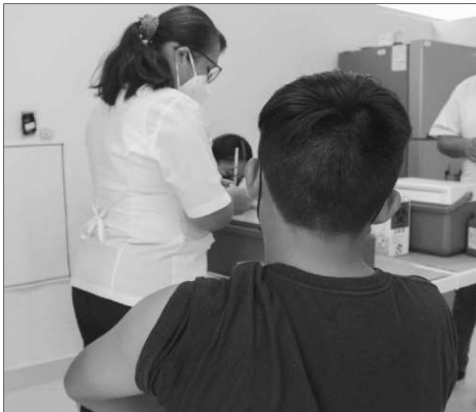
▲ Las personas mayores de edad que no cuentan con alguna de las dosis o no han recibido ninguna vacuna pueden acudir a los centros de salud más cercanos para ser inoculizados.

Asimismo, la Secretaría Estatal de Salud (Sesa) informó que del 9 al 13 de mayo, de 8 a 16 horas, hay vacunación contra el Covid para mayores de 18 años a