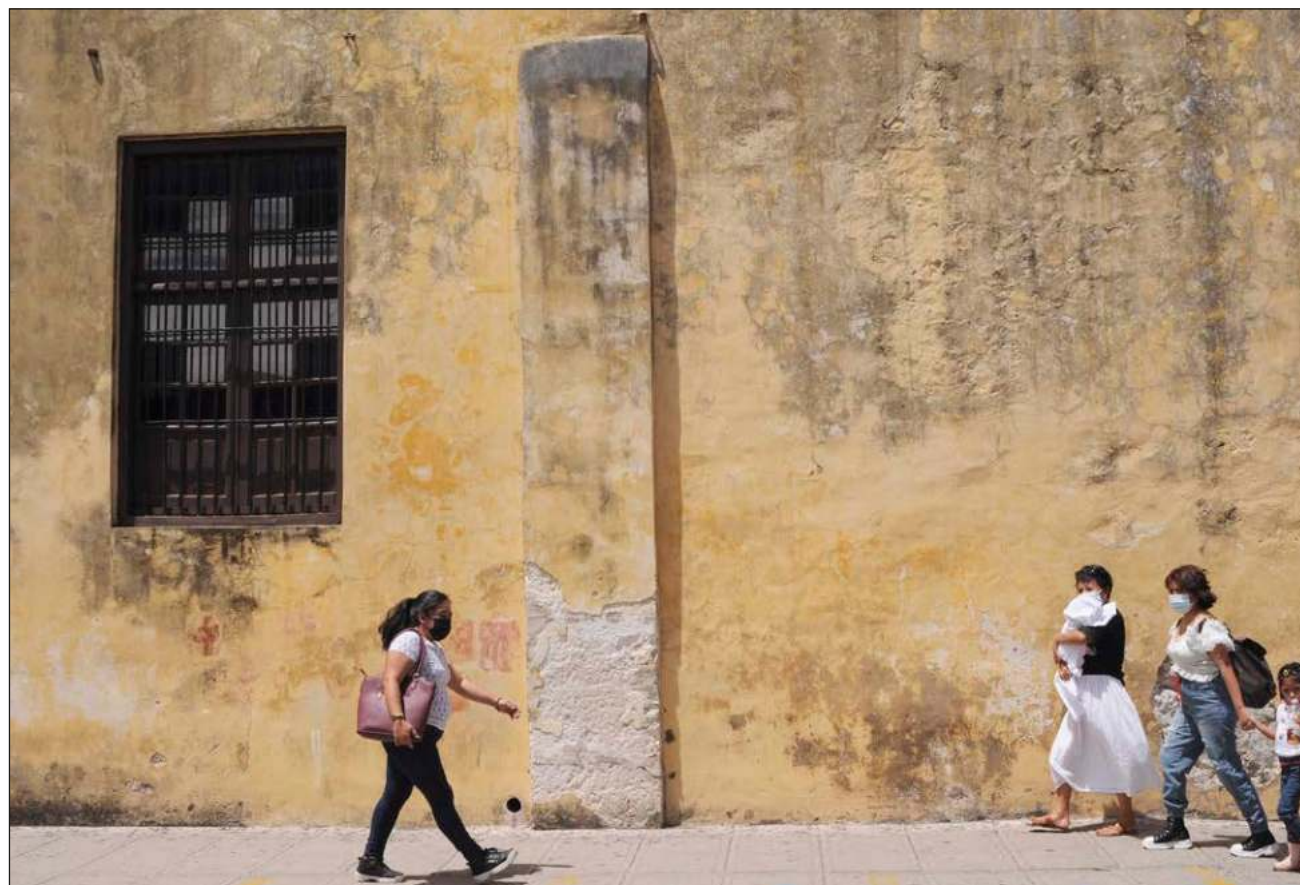
▲ ¿Qué pasa cuando la sociedad exige a las mujeres ser madres y perfectas? Muchas acuden a terapia cargadas con mucha culpa con respecto a no cumplir con las expectativas sociales, familiares y hasta de ellas mismas.

En su caso, es maestra de preescolar y, aunque haya