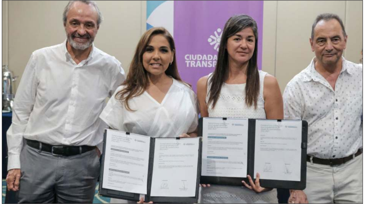
▲ La candidata se comprometió a llevar al estado a los primeros lugares en materia de transparencia.

El tema de educación aseguró que invertirá en el futuro de los niños, niñas, jóvenes, mujeres, trabajadores y emprendedores y señaló que es muy grave la situación que sufren principalmente las comunidades rurales en lo relacionado a servicios de salud, y en la gran mayoría de los casos por no tener acceso a una simple consulta médica con el oportuno y correcto diagnóstico, por lo que ampliará el sistema de salud, "si no recibes el servicio, la consulta, los análisis y las medicinas el gobierno te los va a pagar a través de vales por la salud".