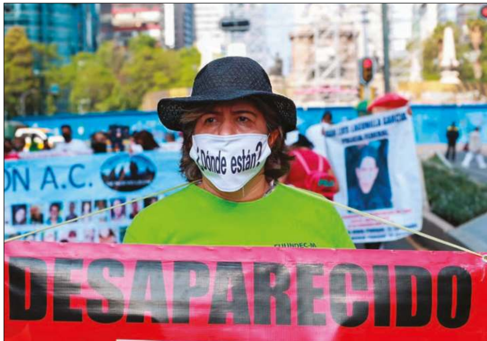
Debido al fenómeno de la migración, los familiares de los desaparecidos siguen en su lugar de origen y se les dificulta seguir con la búsqueda en Quintana Roo.

"Del 2018 a la fecha, contabilizando las fichas activas, de las que se han desactivado, tenemos un aproximado de 2 mil 800