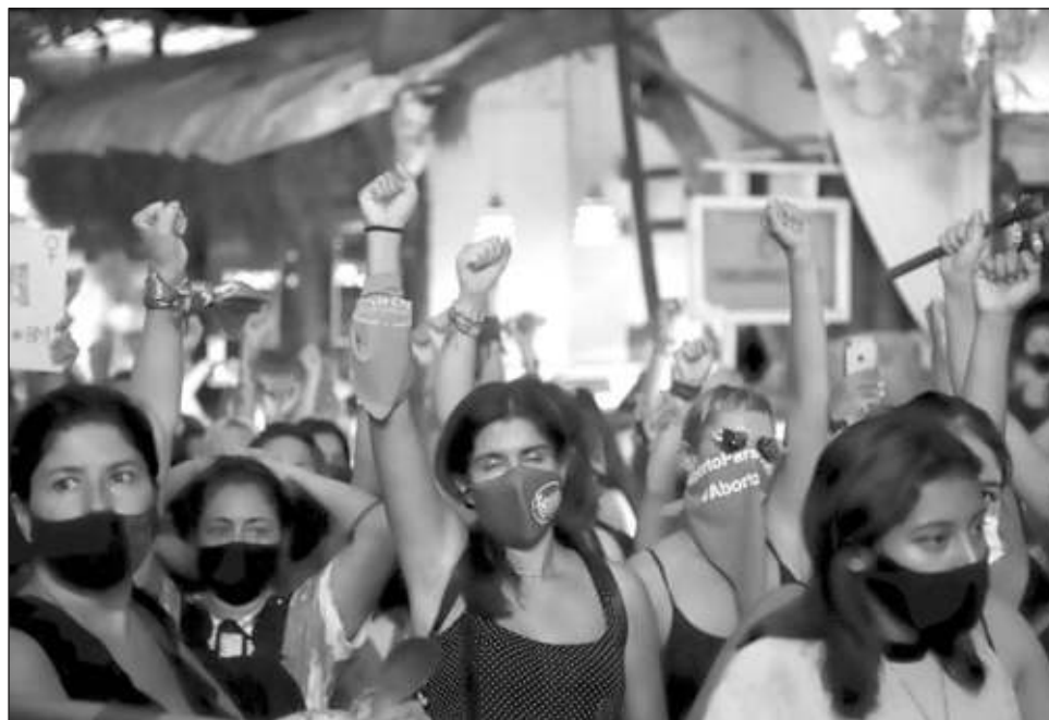
▲ La Red Feminista Quintanarroense espera que los contendientes se comprometan tal como lo han hecho con cámaras empresariales y otras asociaciones.

Desde hace varios años, expusieron, el estado de Quintana Roo padece de una creciente crisis de derechos humanos, particularmente las mujeres, juveniles y niñas, para vivir en un ambiente de seguridad, con dolorosas consecuencias, por lo que este acuerdo