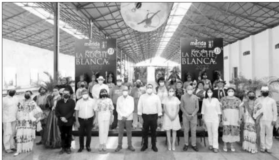
▲ El programa de La Noche Blanca incluye a más de 880 artistas.

Como parte del evento, presentaron el libro Miradas femeninas desde el mezcal , del Mezcal Insitu de Oaxaca.