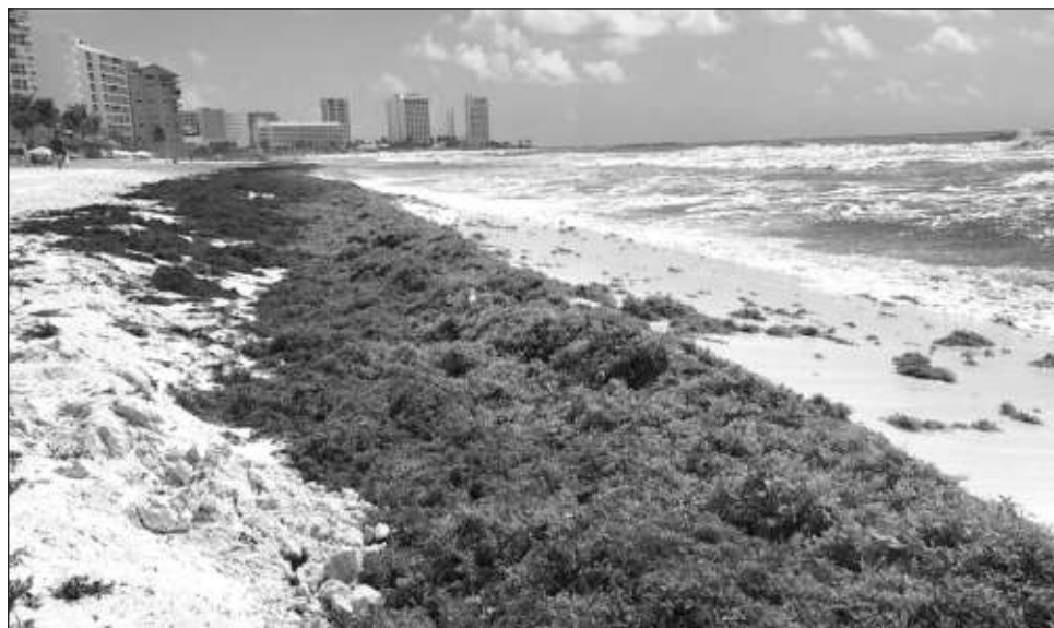
▲ La Red de Monitoreo reiteró la recomendación de verificar en redes sociales el semáforo actualizado, donde mediante el mapa se puede corroborar qué arenales están en color verde.

"Grandes balsas de sargazo se están acercando a la zona hotelera de Cancún, por lo que se espera que en los próximos días la cantidad de macroalgas que arriben a nuestras playas aumente de manera considerable", dio a conocer la red.