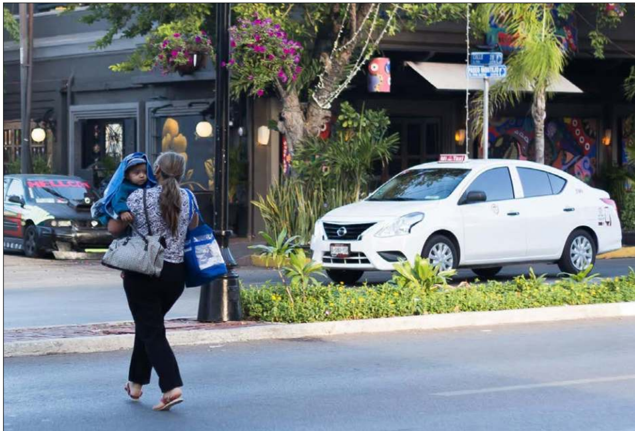
▲ En una sociedad esquizofrénica se sacraliza la figura materna, pero se deja solas a las madres.

Muchas mujeres, precisó, hacemos lo que podemos con lo que tenemos, entonces estos factores pueden generar una crianza violenta, y esto deriva en culpabilidad.