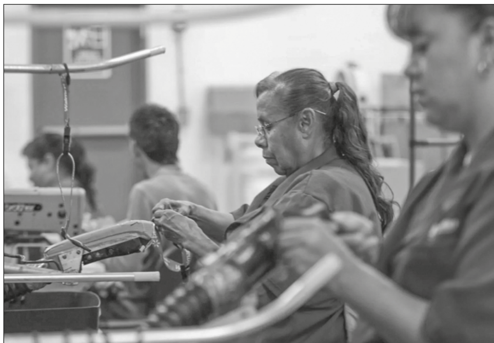
▲ Con datos del Censo de Población y Vivienda 2020, el Inegi dio a conocer que 59 por ciento de las madres en el país no tienen una actividad económica.

Mientras que 41 por ciento de las madres en el país estaban económicamente activas (40 por ciento trabajaba y 1.0 por ciento buscaba trabajar). De este universo se estimó que el 63 por ciento (11 millones) reportaron ser empleadas u obreras; 26 por ciento (3.8 millones) trabajaban por