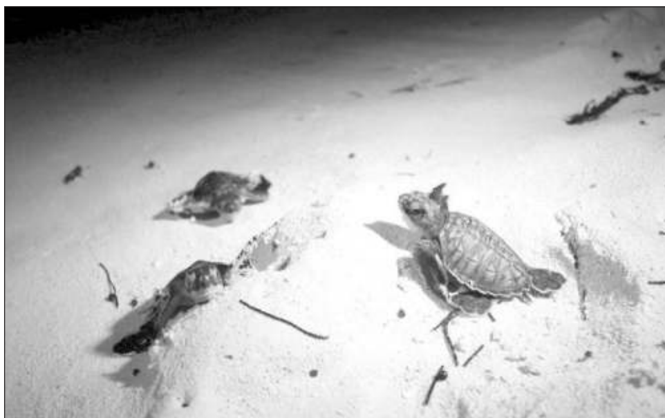
▲ El 6 de abril, en las playas de Xcacel-Xcacelito, en el municipio de Tulum, se registró el primer nido de la especie caguama, informó Itzel Trujano.

Sobre los pronósticos, detalló que salvo la tortuga de la especie caguama que tiende a dejar más huevos