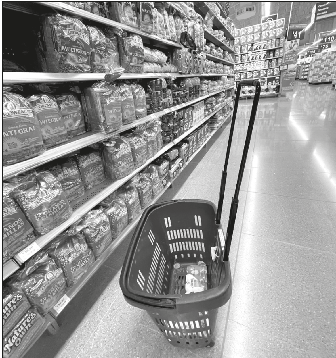
▲ "El PACIC no incluye solamente el tema de seguridad alimentaria, sino que atiende el tema de los aranceles de la importación de los alimentos, seguridad en las carreteras, acceso a fertilizantes, etcétera".

Existe la posibilidad de que el impacto positivo del PACIC coincida con las elecciones 2022, incluyendo Quintana Roo, y que será el nuevo gobierno estatal quien atienda la continuidad y eficacia del PACIC, en coordinación con la