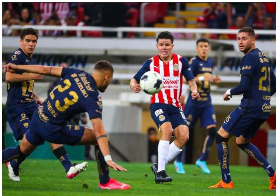
▲ El Guadalajara arrolló a los Pumas para avanzar a la liguilla.

En las otras series, el Pachuca se medirá al Atlético San Luis, Tigres chocará con el Cruz Azul y América con Puebla. Mañana, los Tuzos visitarán a San Luis, a las 19