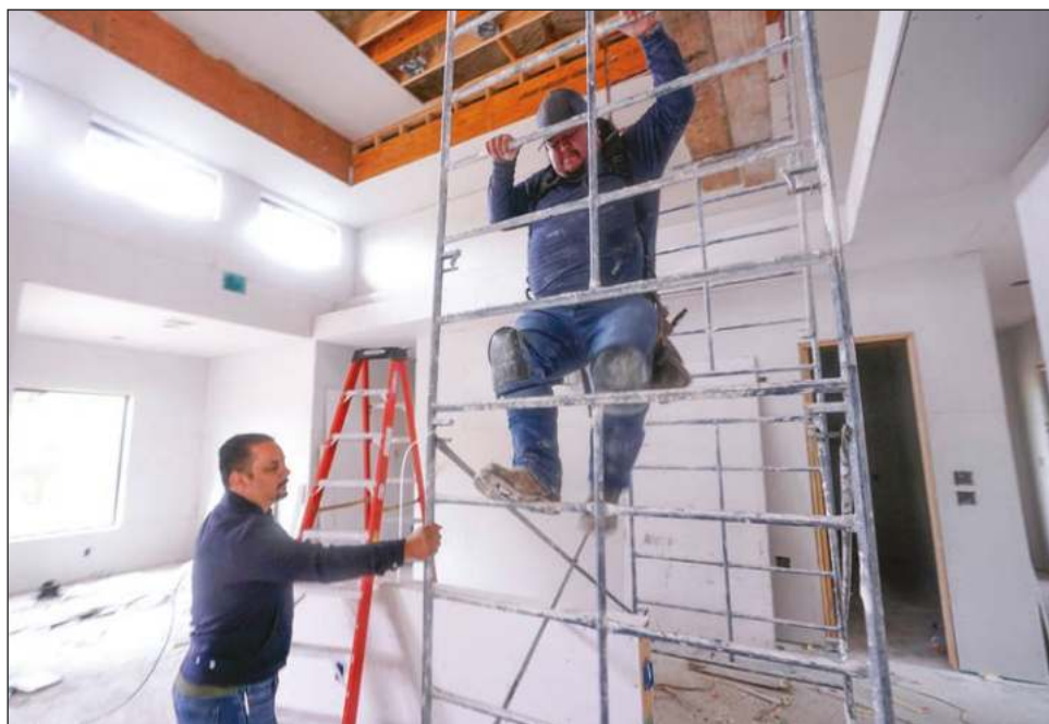
▲ Se calcula que el país tiene dos millones de inmigrantes menos de los que tendría si el ritmo se hubiera mantenido como antes de la pandemia por coronavirus. Esto ha provocado una disputa desesperada por mano de obra en muchos sectores.