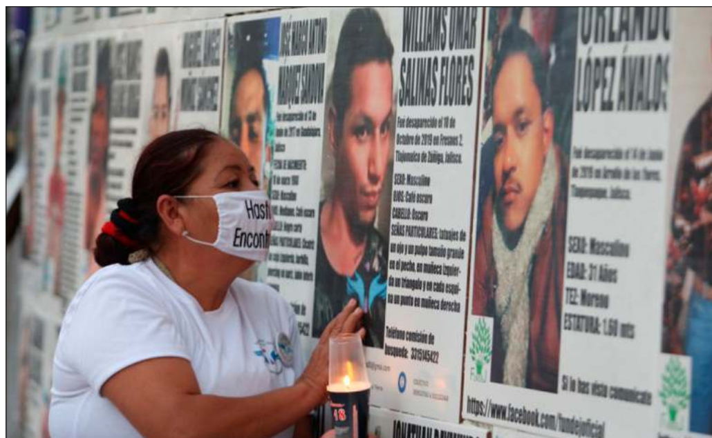
▲ En México hay más de 70 colectivos de búsqueda, cada uno con más de 50 familias donde las madres tienen un papel activo en la investigación de campo por cuenta propia.