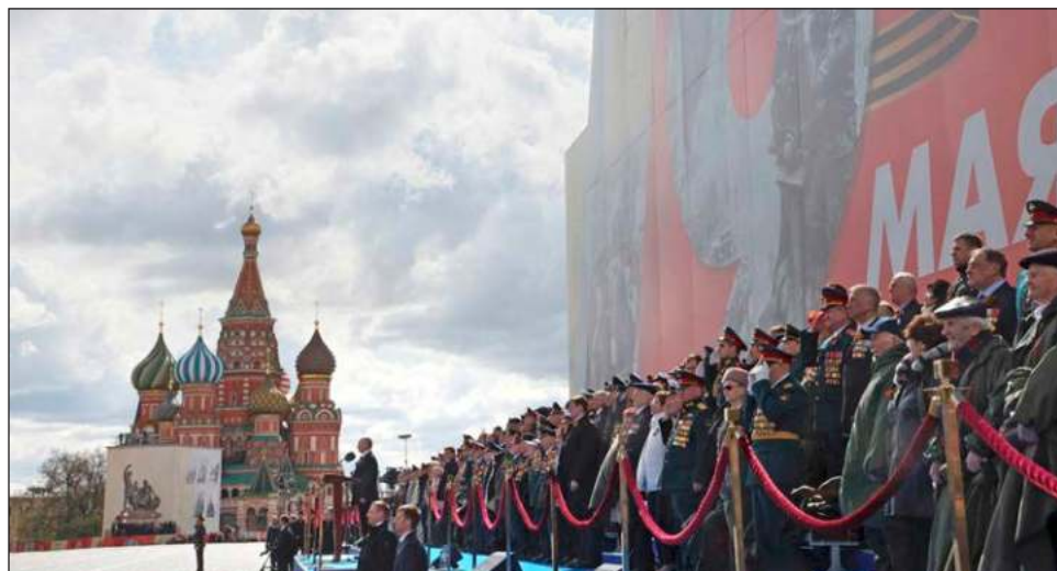
▲ Durante el tradicional desfile militar en la plaza Roja, el presidente Putin subrayó que su “deber” es “hacer todo lo posible para que no se repita el horror de una guerra mundial”.

Eso sí, no declaró la movilización general entre los rusos, una opción que se barajaba ante la falta de avan-