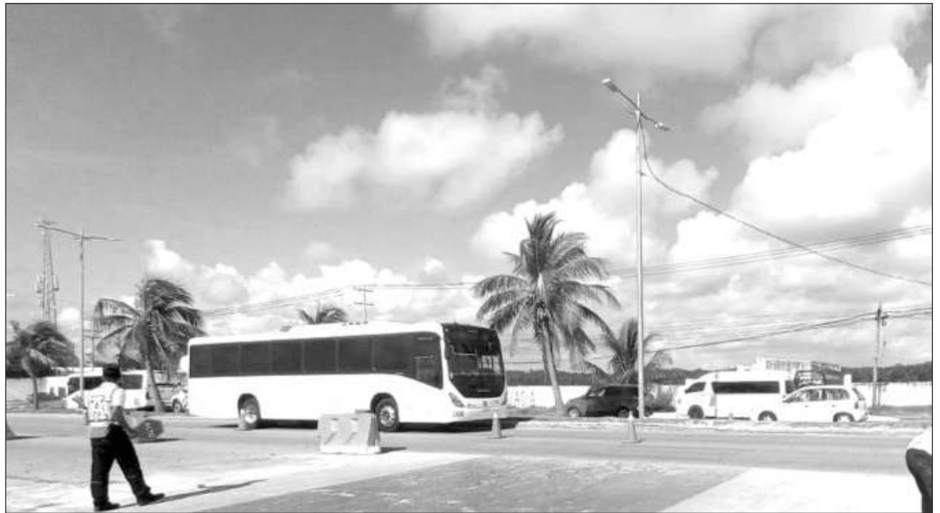
▲ Desde la Asociación de Hoteles de Cancún, Puerto Morelos e Isla Mujeres, solicitan a las autoridades que la remodelación se haga de tal manera que las obras no afecten el tráfico y flujo hasta el aeropuerto.

Desde la asociación, dijo, buscarán un acercamiento para sugerir y pedir que lo hagan de manera inte-