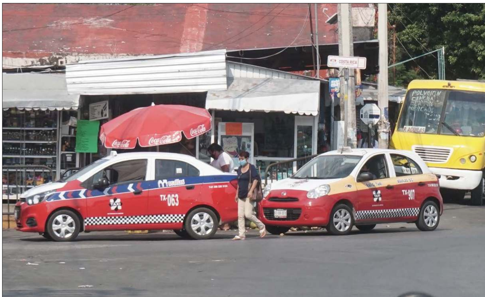
▲ Según los choferes, el Instituto Estatal del Transporte ha ralentizado los trámites y son más de mil los afectados por ello.