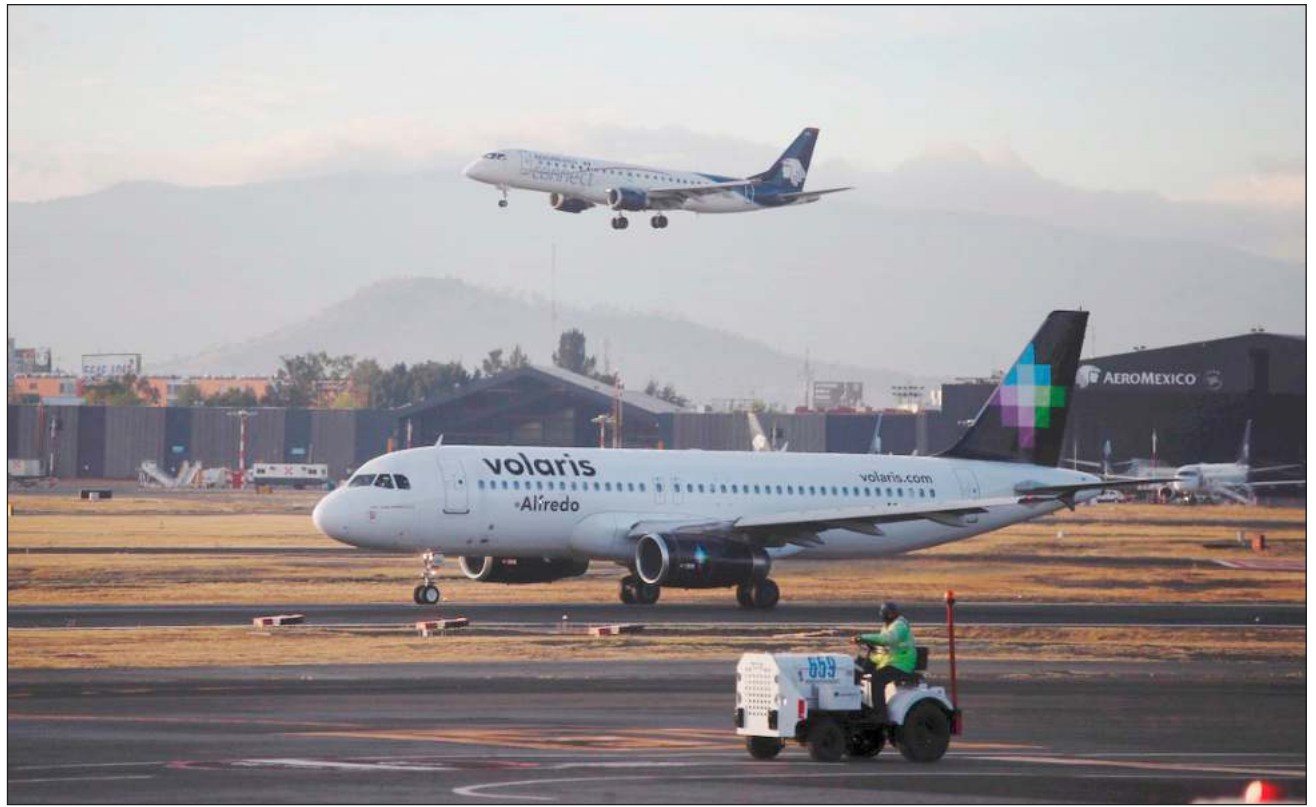
▲ A partir del rediseño del espacio aéreo, en marzo de 2021, ha habido más de 100 incidentes a nivel nacional.

La Subsecretaría de Transporte formalizó la instalación de una mesa permanente con actores aeronáuticos internacionales y nacionales, entre ellos la Asociación Internacional de Transporte Aéreo (IATA); la Federación Internacional de Pilotos de las Aerolíneas (Ifalpa); la Asociación Sindical de Pilotos Aviadores de México (ASPA); y el Sindicato Nacional de Controladores Aéreos (Sinacta, para evitar nuevos incidentes en el espacio aéreo mexicano.