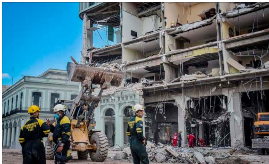
▲ Según reporte de familiares, cerca de 10 trabajadores están desaparecidos todavía.

Las labores de búsqueda de desaparecidos continúan en el sótano y subsótano del hotel y el edificio colindante, aseguró el coronel Luis Carlos