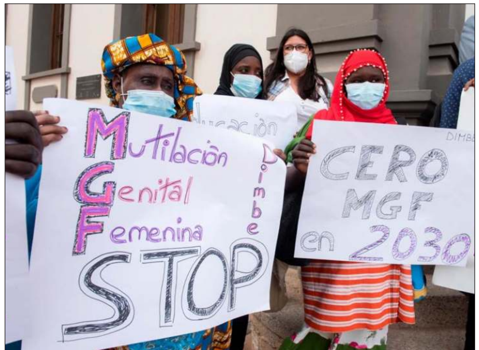
En España, cerca de 4 mil niñas están en riesgo de sufrir mutilación genital.

La práctica ha evolucionado con el tiempo, en la década de los 90 eran mu-