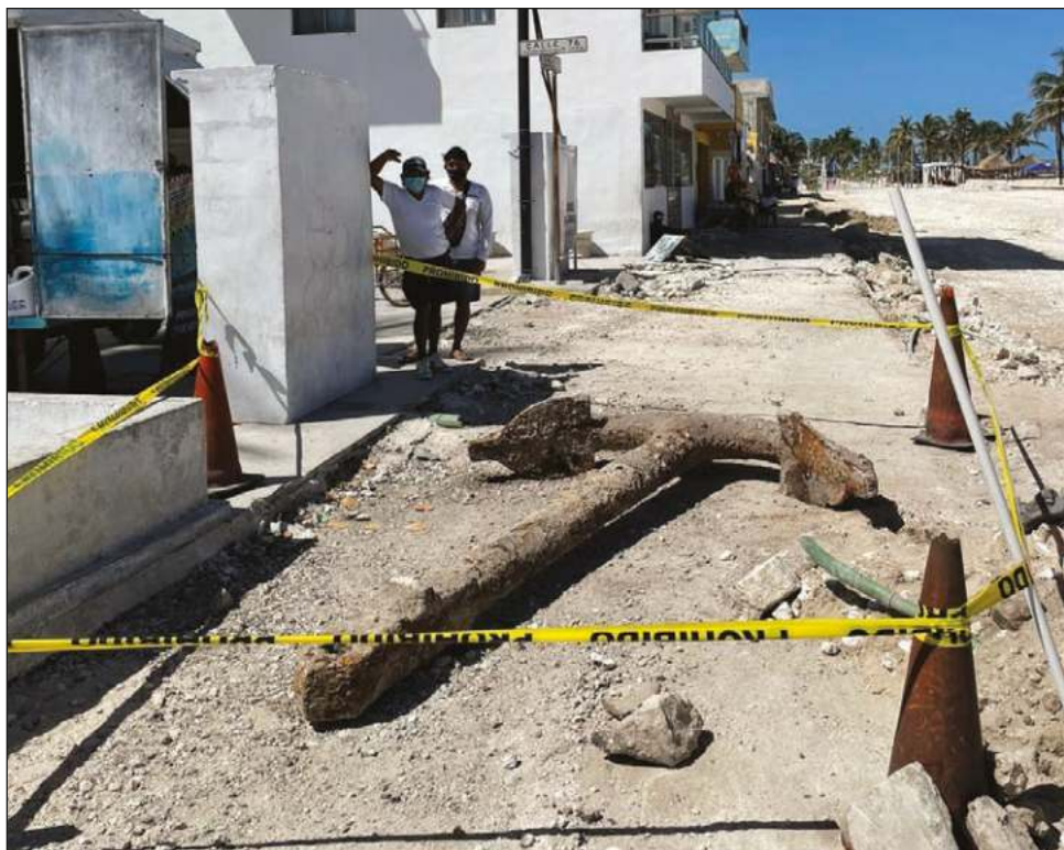
▲ El peso de la pieza hallada es de aproximadamente 1.5 toneladas y mide 3.03 de largo por 2 metros de ancho.