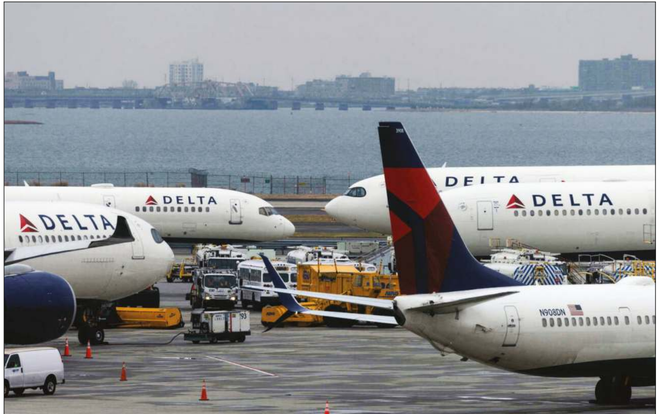
▲ La aeronave del vuelo DAL 643 permanece varada en la terminal aérea de Cancún, y algunos turistas manifestaron a través de redes sociales que seguían esperando abordar otro avión.

Al momento la aeronave sigue varada en la terminal aérea de Cancún y se desconoce en qué momento retomará su ruta de regreso.