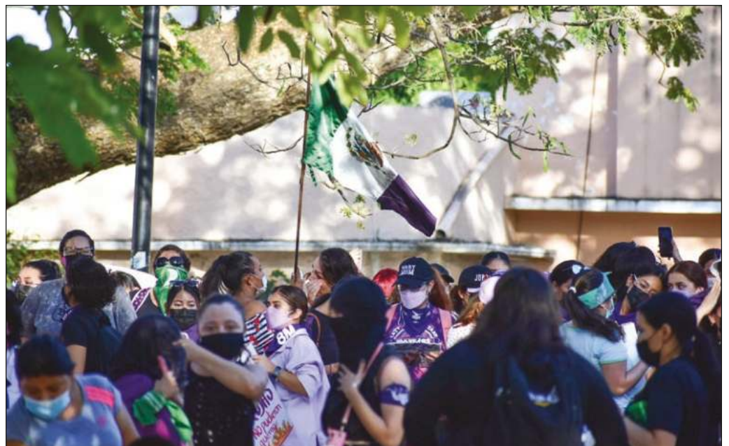
“Es deseable y urgente que el hartazgo de las mujeres se traduzca en avances reales en la concientización sobre las condiciones adversas hacia ellas”.

En suma, es deseable y urgente que el hartazgo de las mujeres se traduzca en avances reales en la concientización sobre las condiciones adversas hacia ellas, en acciones puntuales de las autoridades y en un inequívoco rechazo social hacia toda forma de violencia y discriminación por causa de género.