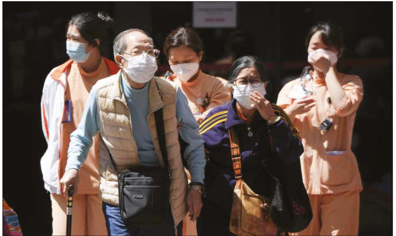
▲ El virus continúa evolucionando y llevar vacunas y tratamientos a los lugares donde se necesitan es una tarea llena de dificultades para la OMS.

“Dos años después, más de 6 millones de personas han muerto”, apuntó Ghebreyesus.