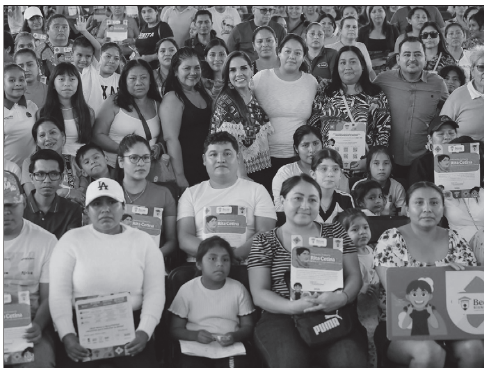
▲ La gobernadora Mara Lezama participó en la asamblea informativa realizada en Cancún, donde recordó a los asistentes que el apoyo consiste en un pago único anual de 2 mil 500 pesos a cada niña y niño de escuelas públicas de educación primaria.

Las metas de atención son las siguientes: inician este 9 de febrero, para concluir el día 25 del mismo mes, teniendo programado llevarlas a cabo en 370 escuelas con una asistencia de 25 mil 884 personas.