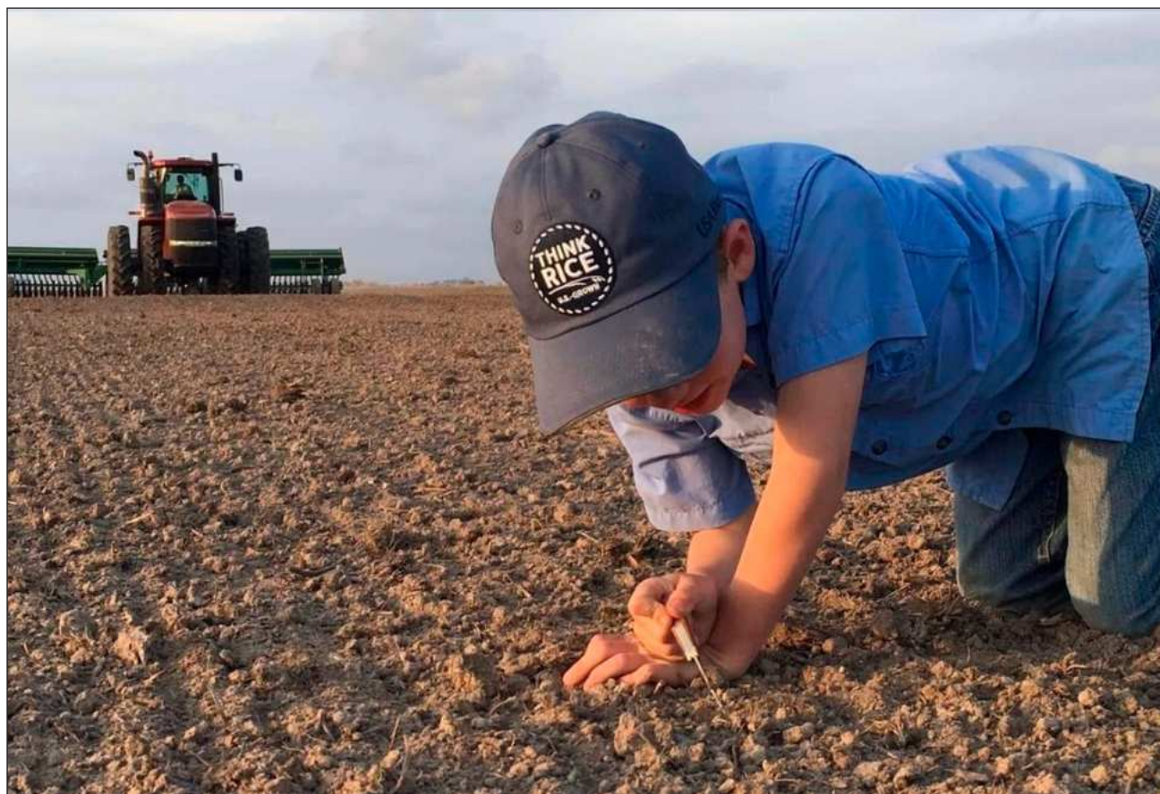
▲ El T-MEC fue firmado por Estados Unidos, México y Canadá en 2018 durante el primer mandato del presidente Donald Trump, y se implementó en 2020 para remplazar el Tratado de Libre Comercio de América del Norte.

De acuerdo con esta coalición, el acuerdo ha incrementado significativamente