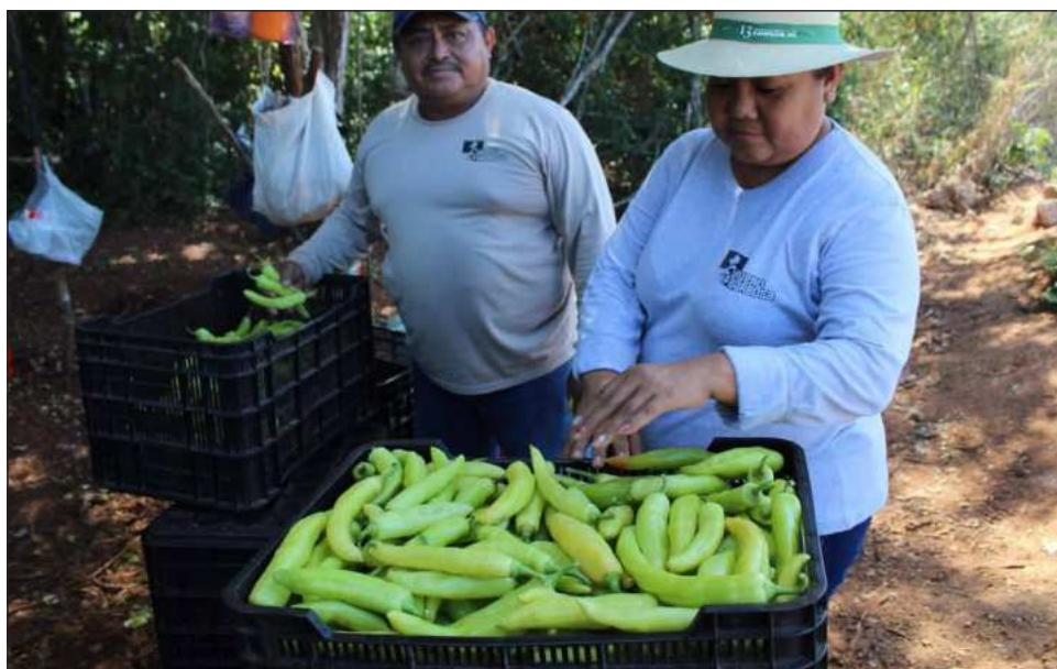
▲ El proyecto de la alianza entre productores, gobierno del estado y el IMPI toma en cuenta a 54 municipios de Yucatán, encabezados por Muna, y contempla la posibilidad de incluir a seis municipios más ubicados en los estados de Campeche y Q. Roo.

Santiago Nieto, director general del IMPI, compar-