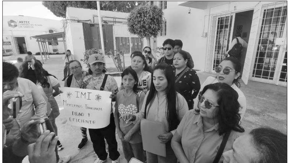
▲ Manifestantes acudieron a la Artec con su ticket de recarga entre los 100 y 200 pesos y pidieron un reembolso, pues señalaron que en dos o tres viajes se quedaron sin saldo.

Al ser cuestionada por la eliminación del Transporte Urbano Municipal hace unos cinco años, afirmaron