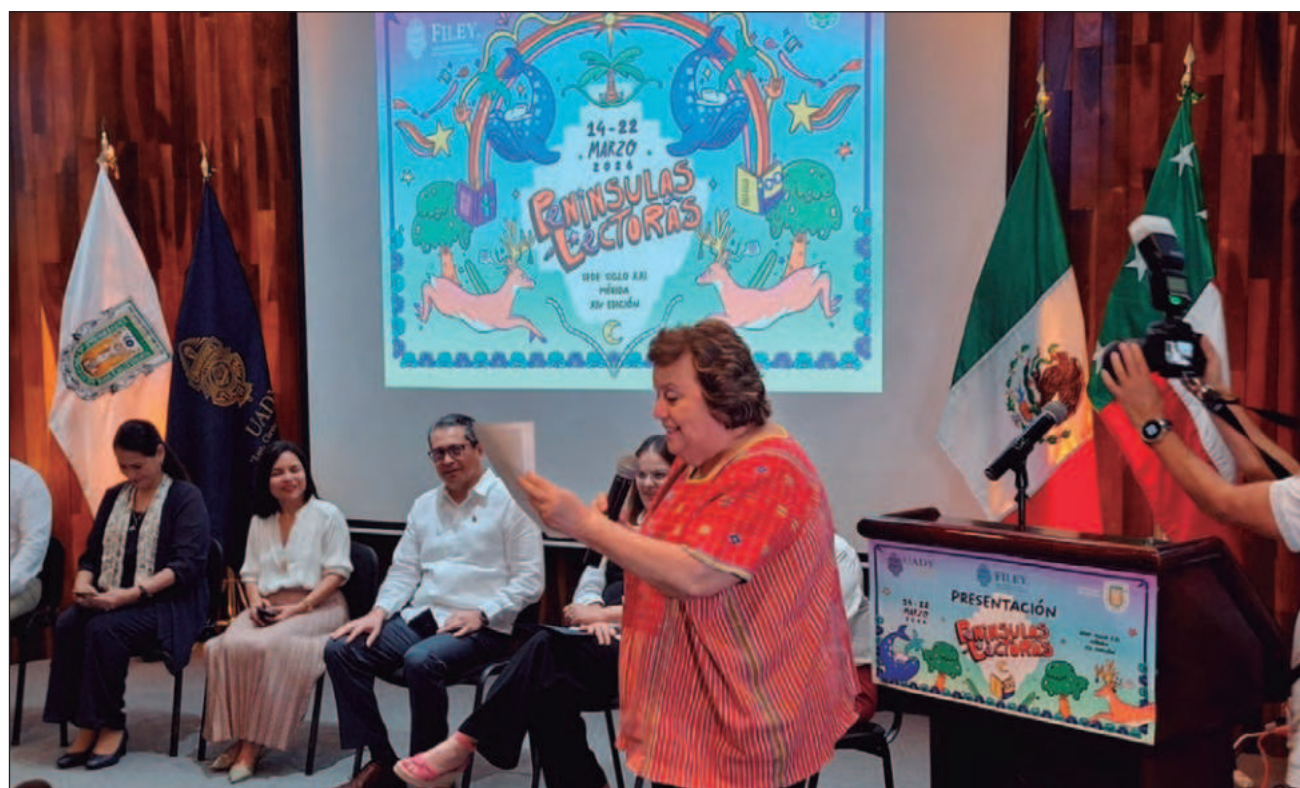
▲ La imagen gráfica de la Filey integra símbolos como la ceiba maya y la ballena gris, el venado cola blanca y el arcoíris, en una narrativa visual que alude a la migración, la diversidad y la unión entre ambas penínsulas.

Bajo ese concepto, explicó, la imagen gráfica de la Filey integra símbolos como la ceiba maya y la ballena gris, el venado cola blanca y el arcoíris, en una narrativa visual que alude a la migración, la diversidad y la unión entre ambas penínsulas.