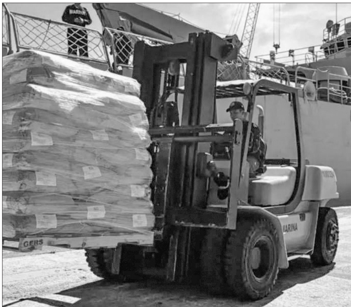
▲ Los buques de la Marina Papaloapan e Isla Holbox zarparon este domingo rumbo a Cuba con casi 814 toneladas de ayuda humanitaria; se prevé que arriben a la isla en cuatro días.

Tiktok: galvanochoa X: @galvanochoa galvanochoa@gmail.com