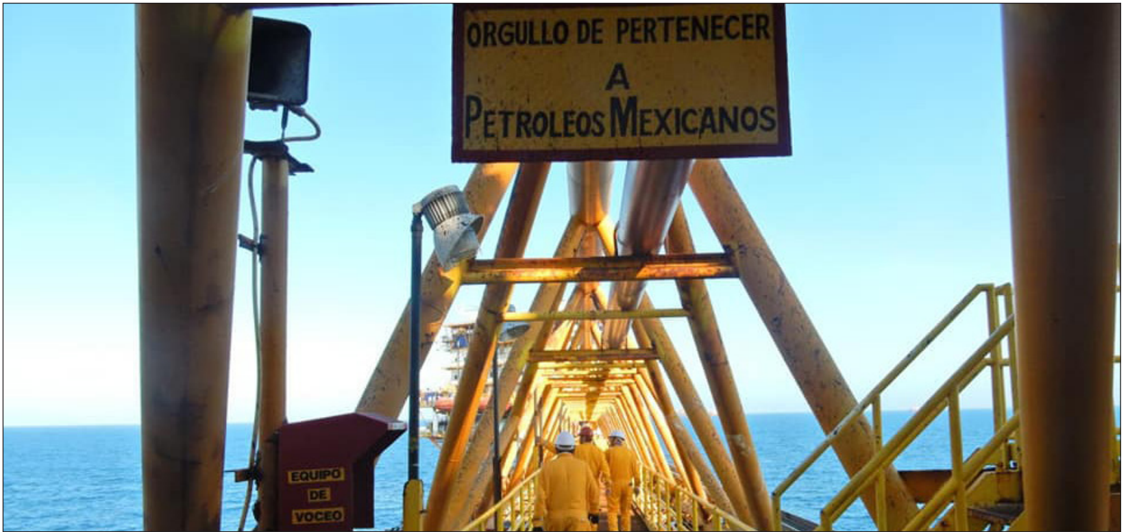
▲ Este doble robo se registró entre la noche de este sábado y la madrugada del domingo, cuando los delincuentes arribaron en embarcaciones ribereñas.