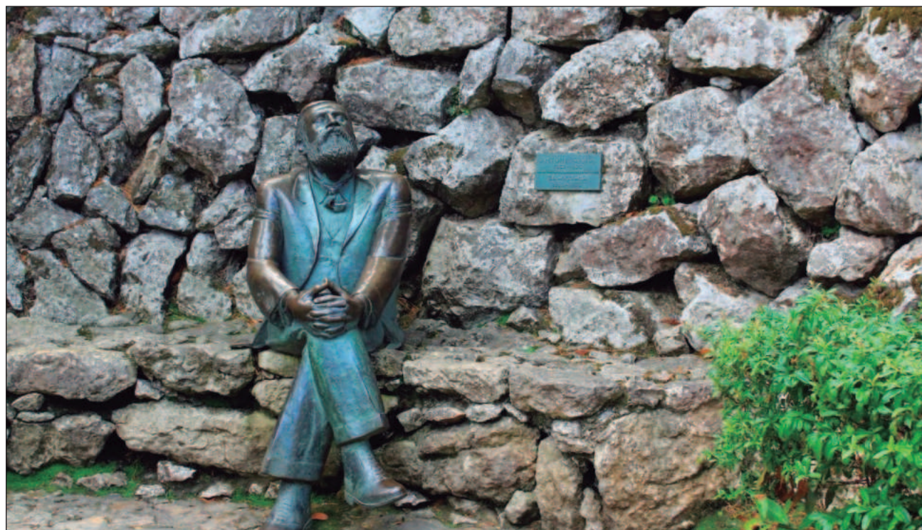
▲ Las instituciones catalanas celebran el Año Gaudí, en el que pretenden descubrir las facetas más desconocidas de Antoni Gaudí, incluso sus edificios menos visitados o conocidos, también la importancia que tuvo en su trayectoria su erudición científica.

"Hay gran contenido de su obra aún inexplorado; hay hitos muy conocidos, pero hay otros, bastantes, desconocidos, y se trata de