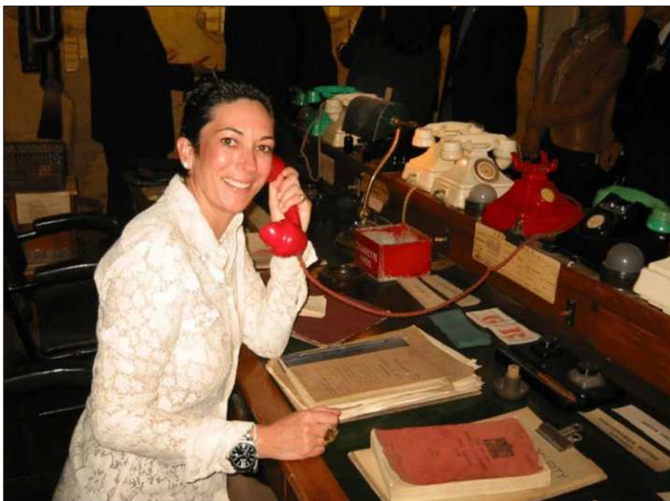
▲ Maxwell iba a ser interrogada durante una videollamada a una prisión federal en Texas. Ella está nuevamente bajo escrutinio mientras los legisladores intentan investigar cómo Epstein, un financiero bien conectado, pudo abusar sexualmente de menores durante años.

"Si este Comité y el público estadounidense realmente quieren escuchar la verdad sin filtros sobre lo sucedido, hay un camino directo. La señora Maxwell está preparada para hablar completa y honestamente si el presidente Trump le concede el indulto. Solo ella puede proporcionar el relato completo".