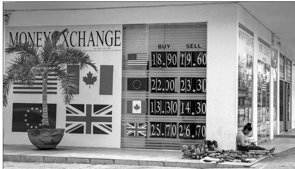
▲ La entidad se caracteriza por ser receptora de migrantes.

“Primero, somos pocos habitantes, después de eso, no somos un estado que migre, sino que migran hacia nosotros. La realidad es de que hayan salido esos números en la parte de las remesas tampoco nos hace mucho sentido a nosotros de cuál es el fondo de esta situación”,