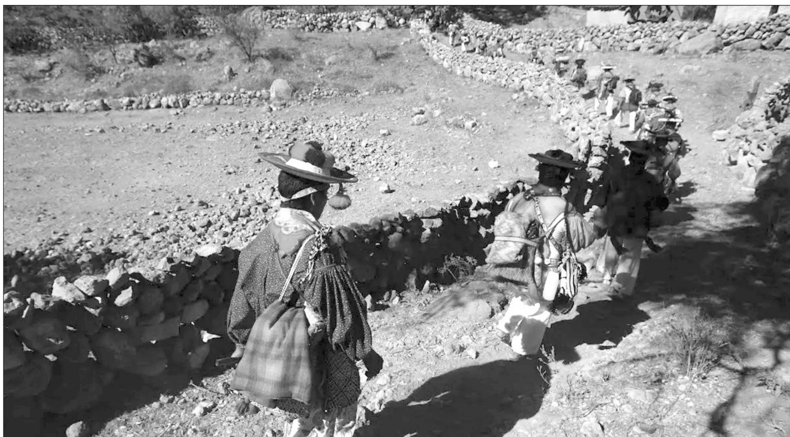
▲ "Es lamentable que la legislación y el reconocimiento de la Unesco, no logren detener la expansión agroindustrial y la apertura ilegal de pozos" en Wirikuta.

Fernando Benítez acompañó a los huicholes en una peregrinación a Wirikuta. Manifestó asombrado que en toda esa extensión era difícil hallar una sola piedra que no tuviera un nombre y una importancia sagrada. Es lamentable que la legislación vigente y el reconocimiento de la Unesco, no logren detener la expansión agroindustrial y la apertura ilegal de pozos. Urge que el gobierno, tan dado a prometer el bienestar de las comunidades ancestrales, evite más daño en el territorio sagrado de Wirikuta.