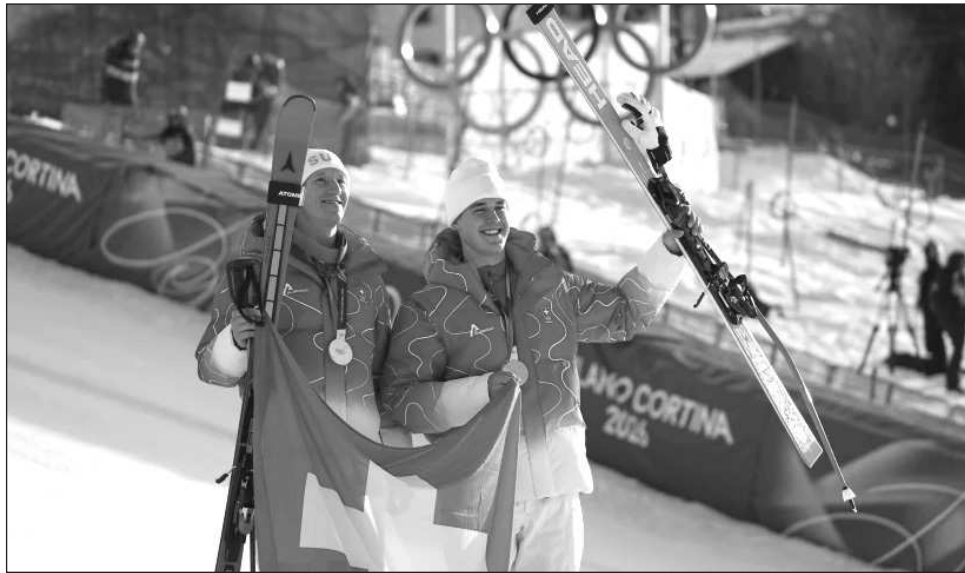
▲ Franjo von Allmen y Tanguy Nef, tras ganar el oro en el descenso combinado.

El equipo Suiza-1, compuesto por Marco Odermatt y Loic Meillard, empató por la plata con el equipo Austria-1, de Vincent Kriechmayr y Manuel Feller.