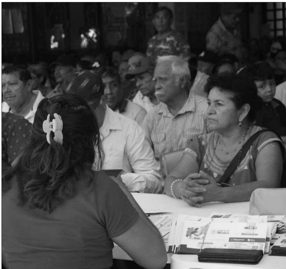
▲ Del 16 al 22 de febrero, se abrirá nuevamente el registro en los Módulos del Bienestar, cuya ubicación se puede consultar en la página gob.mx/bienestar , de 10 a 16 horas.

Reportan avances en programas como Sembrando Vida y Salud Casa por Casa