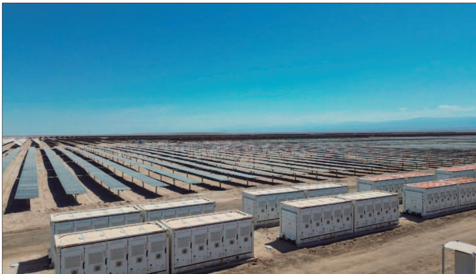
▲ "La energía que sale del sol y del viento es limpia, pero la tecnología para capturarla, transformarla y almacenarla es sucia".