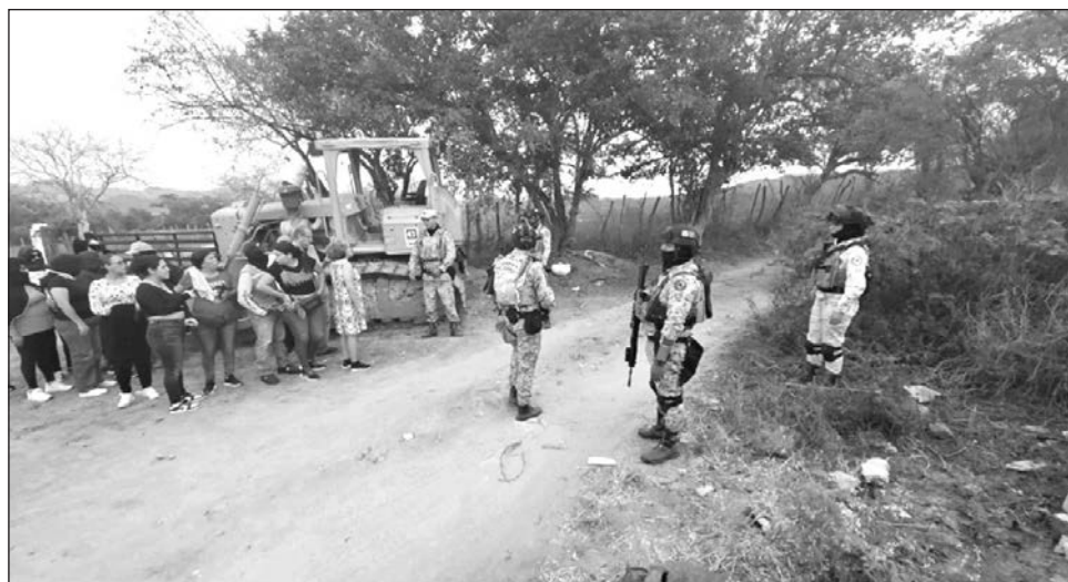
▲ La FGR destacó que continúa la búsqueda de indicios, así como de cualquier elemento que lleve al esclarecimiento de los hechos y al paradero de los mineros aún desaparecidos.

Confirmaron lo anterior al periódico Debate fuentes de la Fiscalía General de Justicia de Sinaloa, adscritos al Servicio Médico Forense de la ciudad de Mazatlán, instancia que coadyuva a la Fiscalía General de la República en las investigaciones