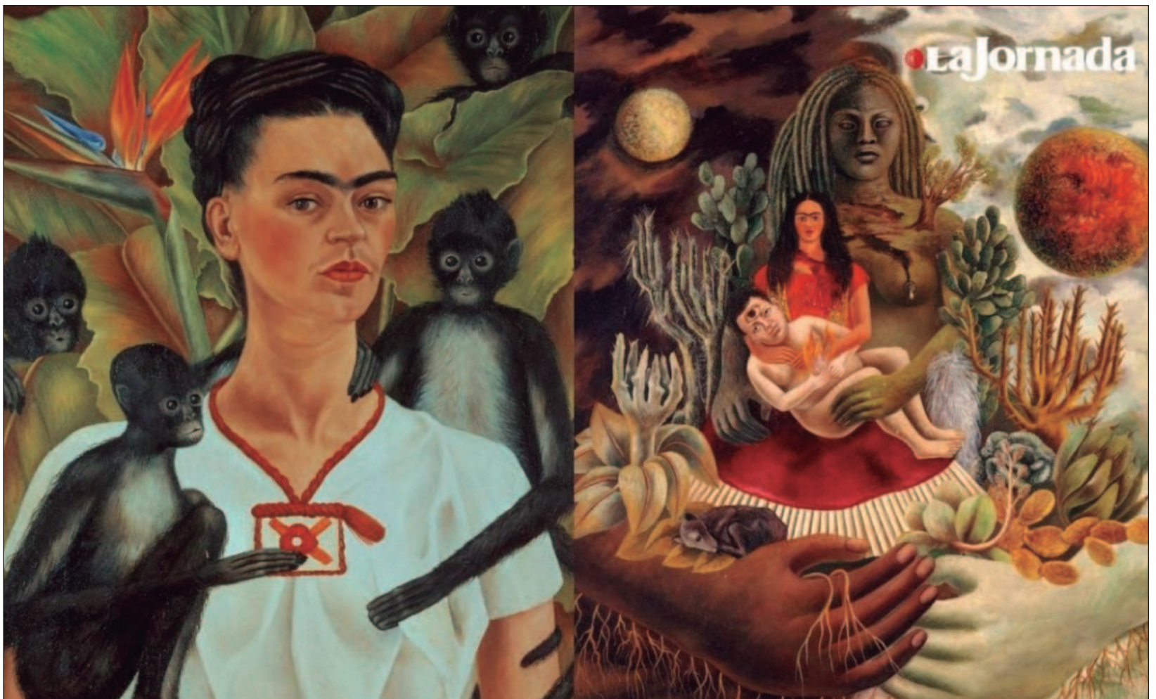
▲ La curaduría propone un recorrido por distintas vertientes del arte moderno en México, que van desde la construcción de una iconografía nacional, los lenguajes de vanguardia, las tensiones entre tradición y modernidad, hasta la potencia de la experimentación plástica y visual.

De las 68 piezas que integran la muestra, casi la mitad, 27, cuentan con declaración de Monumento Artístico, por lo que su exhibición implicó que las instituciones culturales concluyeran los registros oficiales ante el Centro Nacional de Conservación y Registro del Patrimonio Artístico Mueble (CEN-CROPAM), para garantizar su control, conservación y resguardo durante la muestra.