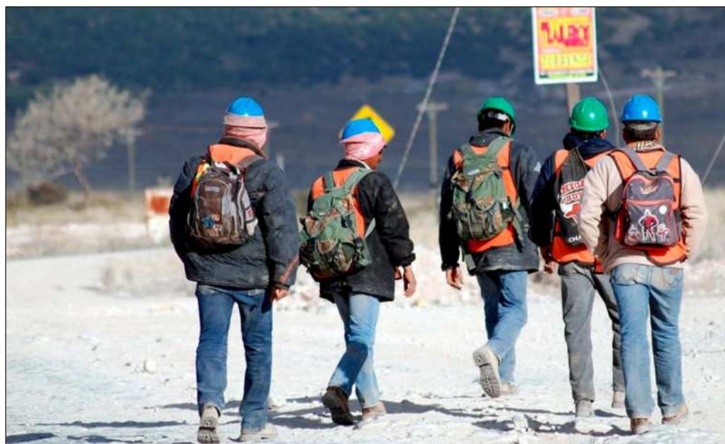
▲ Los trabajadores se dirigían del campamento minero a las vetas concesionadas a la minera canadiense Vizsla Silver; los respectivos cadáveres de cuatro de ellos aparecieron en El Verde.

Sin embargo, debe reconocerse que las corporaciones federales de seguridad sí se abocaron a la búsqueda de los mineros y escucharon a los grupos civiles que se han dedicado a esta trágica tarea. El resultado fue el hallazgo, y no el abandono de los cuerpos bajo la tierra, como ocurrió en el caso de la mina Pasta de Conchos, que está a punto de cumplir dos décadas sin que se recuperaran los cuerpos de 65 mineros, y sin llevar a nadie ante la justicia.