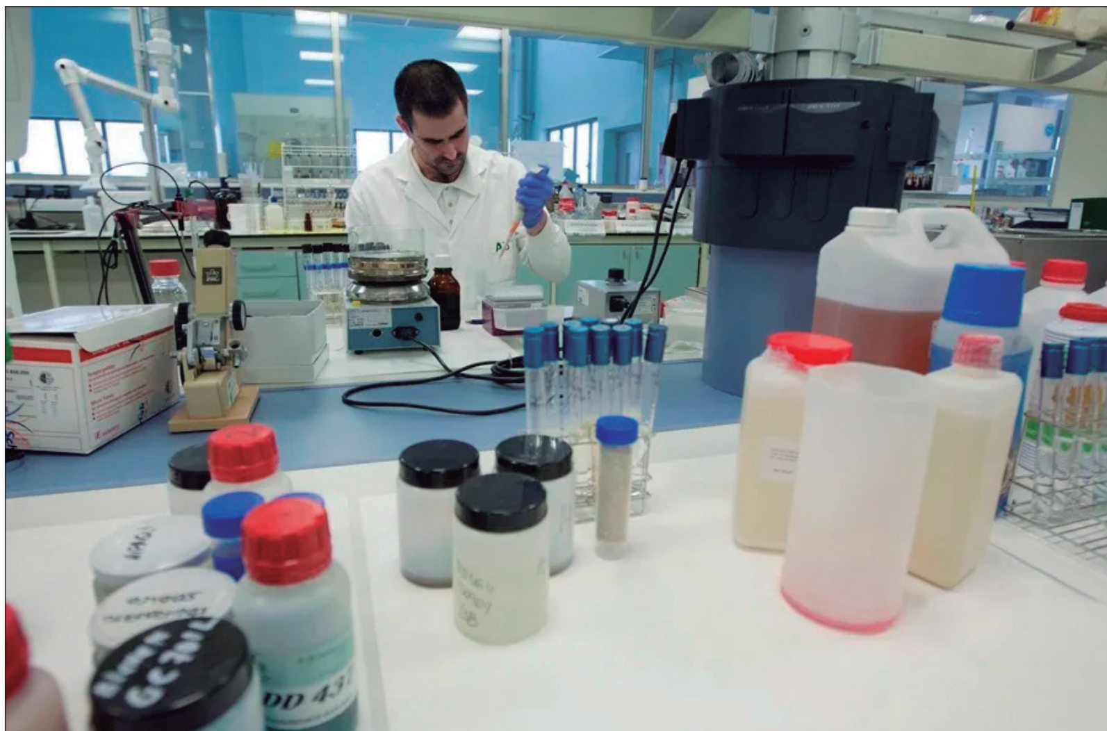
▲ "Son varios los factores críticos que se necesitan para desarrollar un alto nivel de ciencia que atienda los retos nacionales".