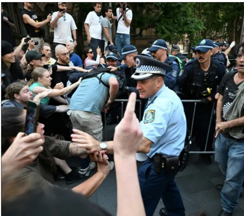
▲ Testigos dijeron haber visto al menos 15 manifestantes arrestados y escenas de grescas con la policía. En Melbourne, una protesta en el centro pidió el fin de la ocupación de los territorios palestinos.

"Estoy convencido de que nuestro país ha cambiado completamente", dijo Guanipa a los periodistas tras su liberación. "Estoy convencido de que nos corresponde ahora enfocarnos todos hacia la construcción de un país libre y democrático".