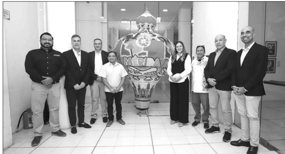
▲ Las becas estarán dirigidas a estudiantes que no han concluido el bachillerato, para cursar carreras técnicas o para universitarios que tienen la intención de especializarse en biotecnología y biomedicina, entre otras opciones.

“Es lo que buscamos como ayuntamiento, siempre darle oportunidades a nuestras juventudes, a todos los meridianos, de crecimiento y estamos convencidos que a través del aprendizaje y de la educación es como se transforma vidas y hoy estos jóvenes transfor-