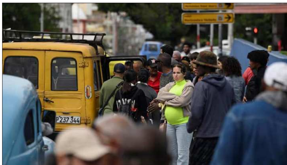
▲ Desde el lunes, los clientes de taxis privados notaron un aumento del precio del servicio, al pasar, en algunos trayectos, de 200 pesos (unos 40 centavos de dólar) a 350 pesos cubanos.

Usuarios de taxis privados dijeron que las tarifas se habían disparado de la noche a la mañana. Para ahorrar energía, el gobierno comunista dispuso el viernes la restricción de la venta de combustible, la reducción de los viajes entre provincias por ómnibus y trenes, el cierre temporal de algunas em-