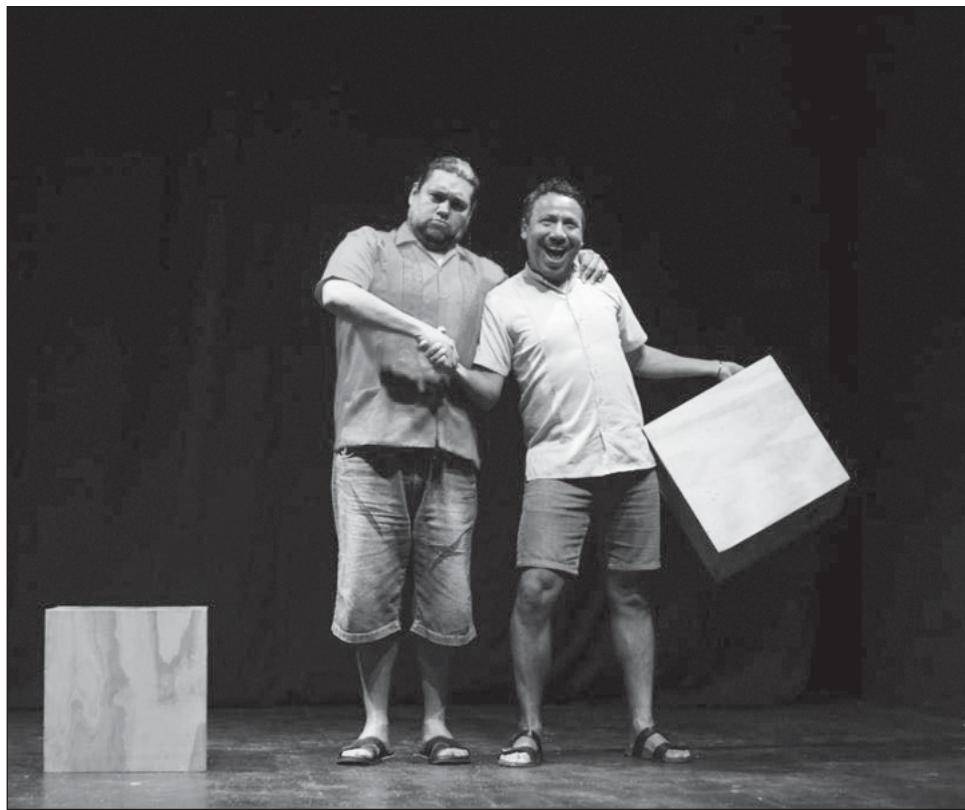
▲ La gira de este proyecto iniciará el viernes 12 en Villahermosa, Tabasco.

Este circuito es una iniciativa que busca apoyar a grupos de teatro y espacios independientes para crear giras por toda la república, llevando así diferentes historias por todo el país. La obra también estará en