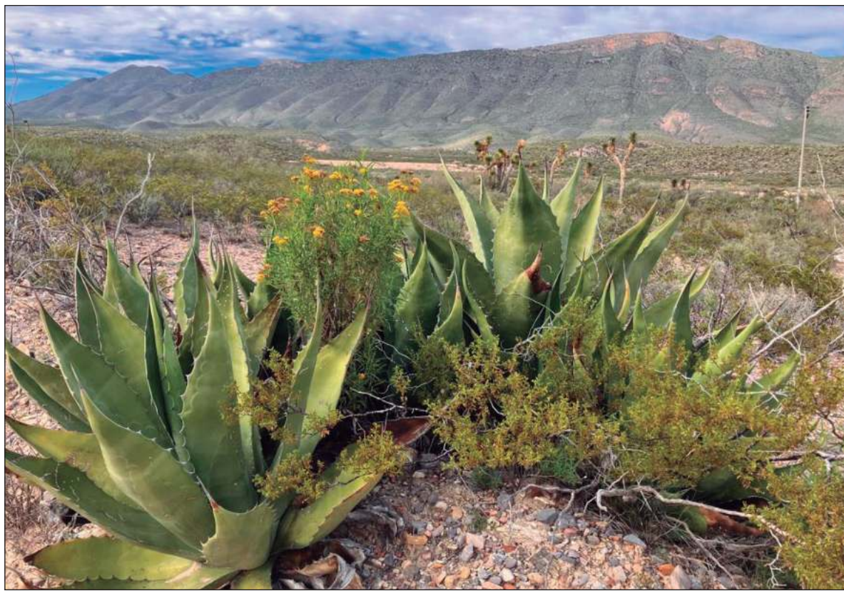
▲ “¿Tiene sentido decretar áreas protegidas a mansalva, pretendiendo, como dice la licenciada Albores, que es un logro establecer más áreas que las que crearon administraciones anteriores? Me parece que no necesariamente”.

A mi juicio, la diversidad ecosistémica y social de nuestro país ofrece espacios y circunstancias apropiadas para el establecimiento de áreas naturales protegidas, ya sea que se trate de reservas de la biosfera, parques, refugios, santuarios, áreas de protección de flora y fauna, unidades de manejo para la conservación y aprovechamiento de la vida silvestre, o cualquier otra de las categorías contempladas en la legislación nacional y en los diversos ordenamientos estatales y municipales que las contemplan. Responden en su origen a una intención honesta, seria y comprometida por encontrar esquemas que permitan la conservación de una muestra relevante de los ecosistemas nacionales, la biodiversidad que alojan y los servicios ambientales que aportan a la humanidad, y afortunadamente México cuenta hoy con un marco jurídico apropiado para garantizar