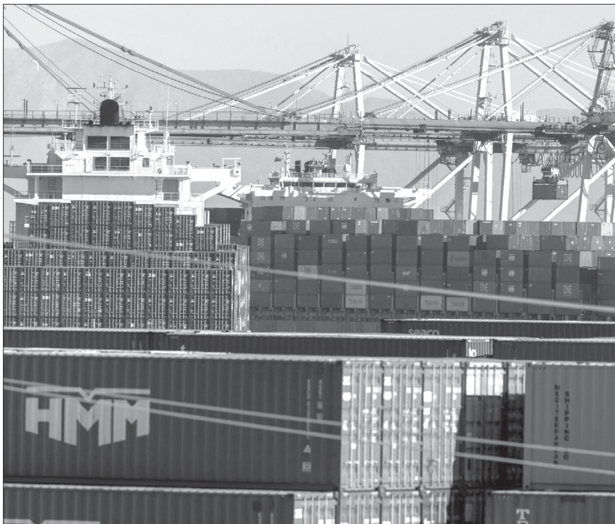
▲ Entre enero y octubre de 2023, de acuerdo con información de la Oficina del Censo, México exportó a Estados Unidos bienes por un valor de 439 mil millones de dólares, un crecimiento anual de 4.8 por ciento.

De continuar esta tendencia, México romperá con la racha de China de 16 años consecutivos siendo el principal proveedor de EU.