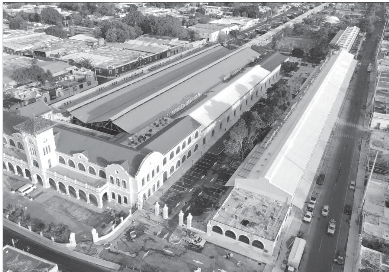
▲ El gobernador Mauricio Vila señaló que, en abril de 2023 se comprometió con que la Esay se convierta en la UNAY, lo que cumplió en noviembre del mismo año para subir de nivel y tener mejores condiciones.

“En ese entonces, la UNAY no estaba contemplada en