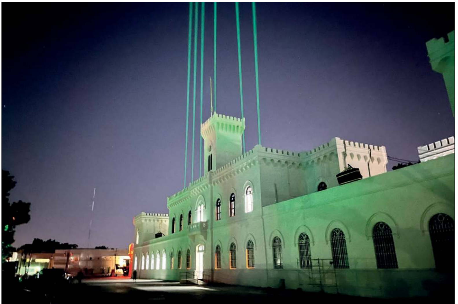
▲ Esta iniciativa “transforma totalmente” la zona del Parque de la Paz: “es el primer espacio interactivo e inmersivo de Latinoamérica, la crisálida en la que se recluyó este espacio antes de convertirse en un campo de luces, en una galaxia, en un ballet de aguas danzantes”.