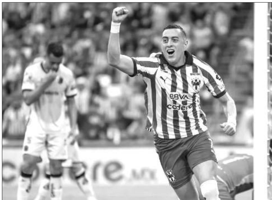
▲ Rogelio Funes Mori, goleador histórico del Monterrey, se une a los Pumas para el Clausura 2024.

A pesar de que después de ello mantuvo un buen nivel con su antiguo equipo, los Rayados del Monterrey, Funes Mori no ha vuelto a ser convocado por la selección.