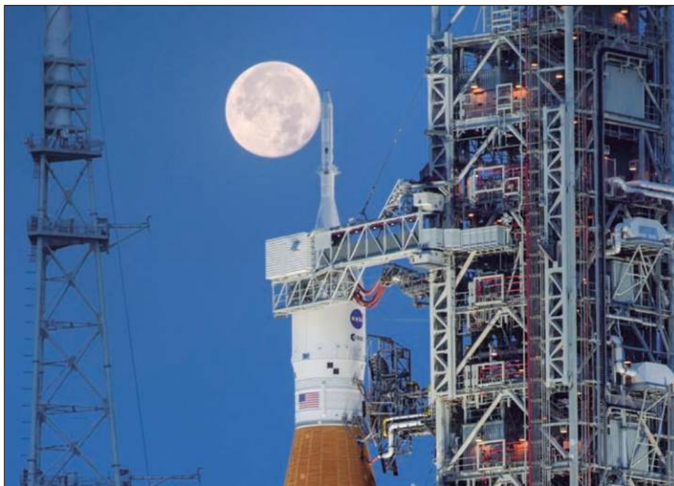
▲ La compañía, Astrobotic Technology, lanzó el lunes la sonda lunar Peregrine, que debía explorar el terreno antes de una eventual llegada de astronautas.

La NASA está dependiendo de compañías privadas para su programa Artemis, dedicado a volver a enviar astronautas a la Luna.