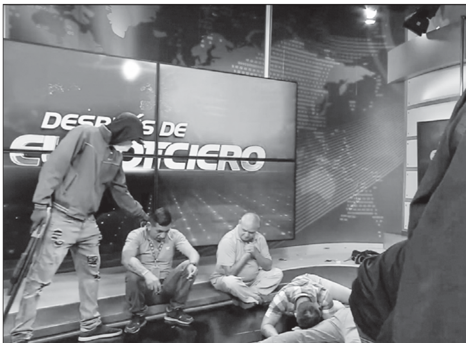
▲ En las imágenes en vivo dentro de las instalaciones del canal TC Televisión, se observaba a varios encapuchados con armas que mantenían en el piso a trabajadores del medio, a quienes exigían que pidan en directo a la Policía que se retire del lugar.

Añadió que los presidentes primero deben ser acusados y destituidos por el Congreso antes de poder ser procesados. Trump fue acusado dos veces pero el Senado no logró condenarlo.