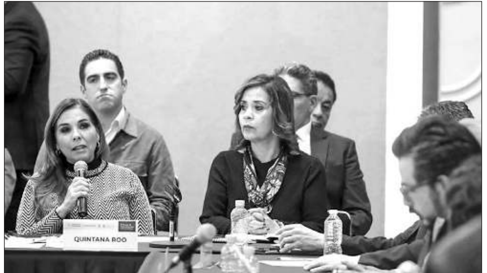
▲ El pasado 8 de enero, la gobernadora Mara Lezama y otros mandatarios se reunieron con el titular del IMSS para avanzar en la "transición de los servicios de salud".

Recordó que el lunes 8 de enero se encontró con gobernadores del país en una reunión encabezada por la secretaria de Gobernación, Luisa María Alcalde Luján; el secretario de Salud federal, Jorge Alcocer Varela; y