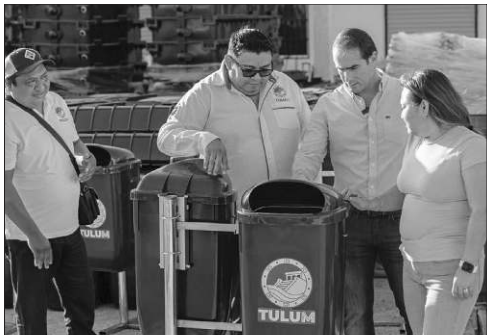
▲ Los contenedores beneficiarán a cerca de 46 mil tulumenses.

“Estamos escuchando a las y los ciudadanos y resolviendo sus peticiones. Que vean que cada peso que entra a las arcas municipales se refleja en beneficio de la sociedad”, dijo.