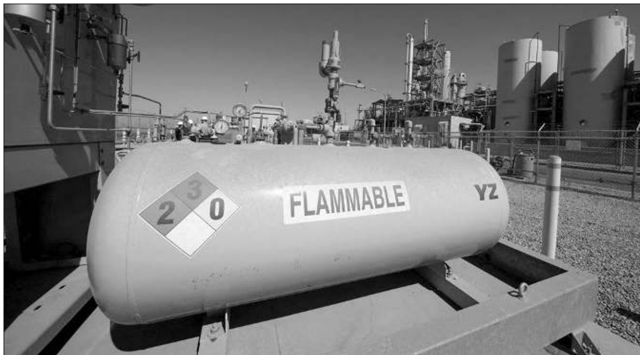
▲ La gasera proveerá a una nueva gama de empresas y a la termoeléctrica de Lerma con este combustóleo más económico.

La planta tiene proyectada instalarse en el municipio capitalino para trabajar directamente con la termoe-