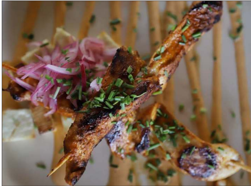
▲ La meta es difundir la gastronomía del destino, para lo cual los hoteleros y restauranteros locales se reunirán con empresarios de España y de Europa en general.

“El 25, que es el corte de listón de Fitur, junto con la gobernadora, después nos vamos el día 26 de enero a Guadalajara, una provincia de Madrid, es un viñedo, Altos de Píos, que pertenece a empresarios mexicanos que tienen viñedos en España. Se realizará una comida networ-