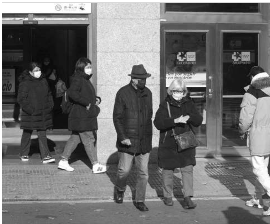
▲ La ministra de Sanidad en España, Mónica García, puntualizó que se trata de "ponerte una mascarilla cuando entras en un centro de salud y de quitártela cuando sales".

El país registró más de 14 millones de casos y alrededor de 120 mil decesos a causa del coronavirus.