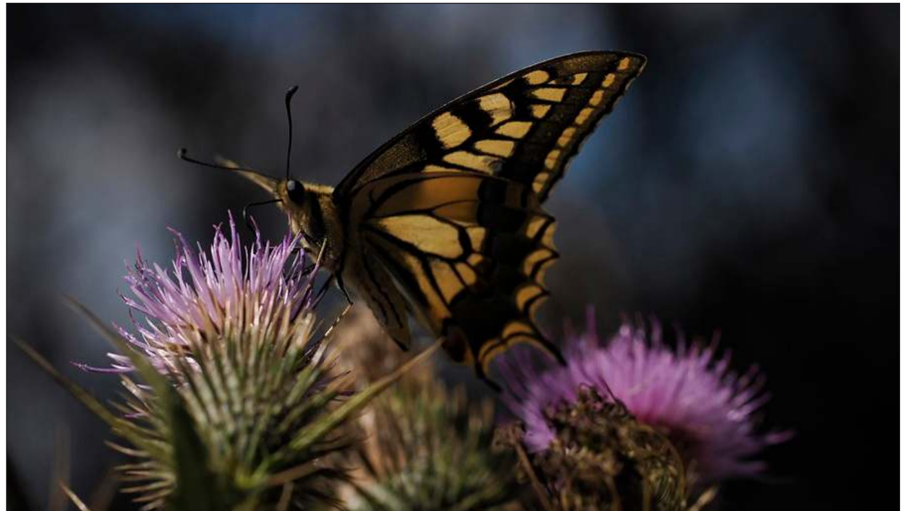
▲ Kex tumen u yojel beyka'aj u k'iinalil u wíinkilal unaje', je'el u pítmáan wa ka u jach beet ooxole'.

Ba'ax chíikpaje' jts'a'ab k'ajóoltbil tu pikil ju'unil Journal of Animal Ecology , ts'o'oke' ku ye'esiko'obe' le bix u bin u ya'abtal chokoj yooxole', le mejen