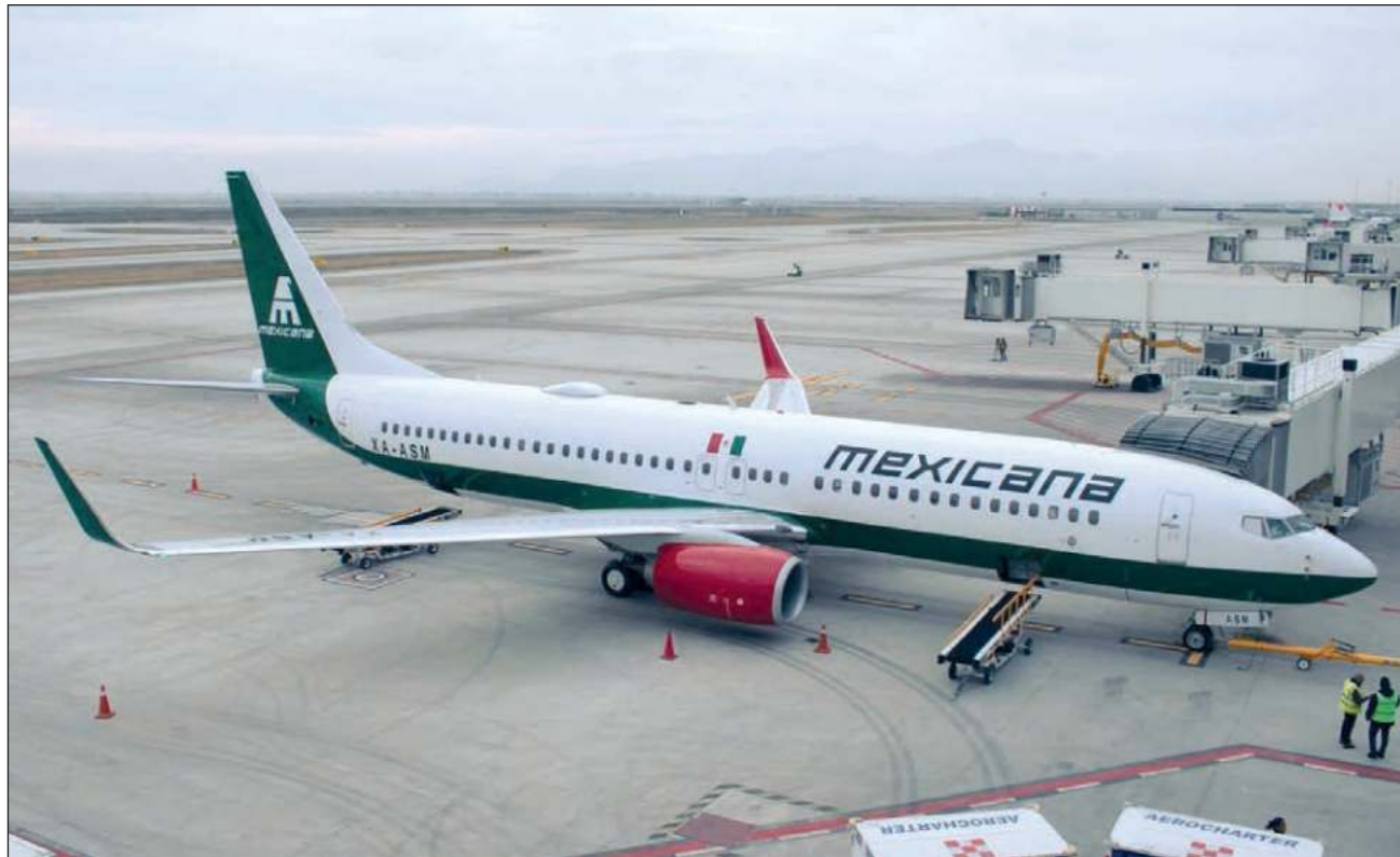
▲ El municipio de Tulum también se encuentra a la cabeza de reservas de la aerolínea para los próximos meses, con 2 mil 676; le siguen Mazatlán, con mil 673 y la capital yucateca, Mérida, con mil 493.

Las rutas con mayor demanda en los primeros 14 días de operaciones fueron: Tulum, con 738 pasajeros;