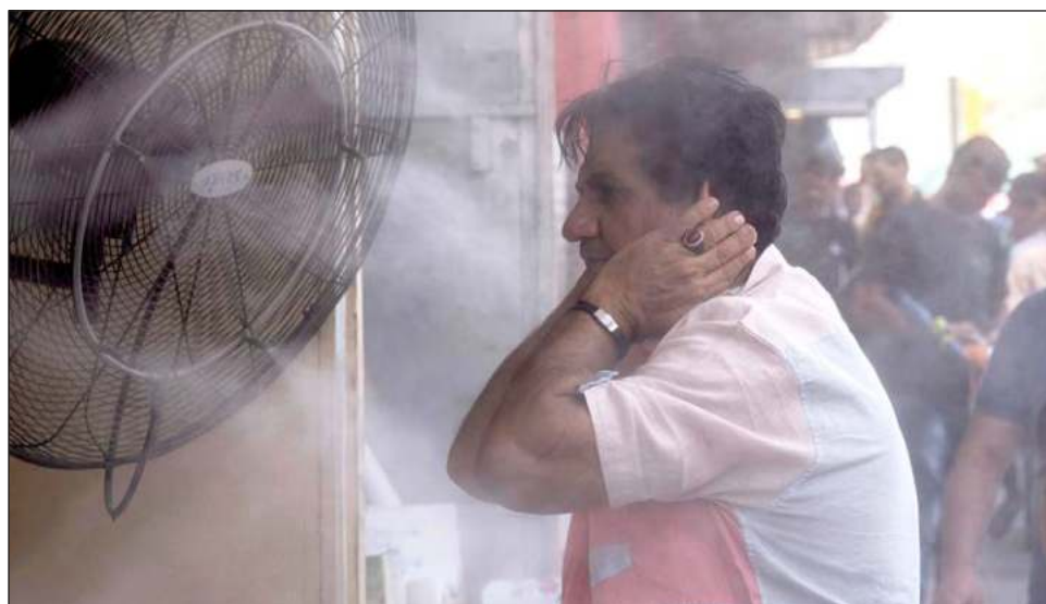
▲ Las altas temperaturas en nivel récord hizo la vida miserable y a veces mortal en Europa, América del Norte, China y muchos otros lugares durante el año pasado.

Y enero de 2024 va camino de ser tan cálido que por primera vez un período de 12 meses superará el umbral de 1.5 grados, dijo la subdirectora de Copernicus, Samantha Burgess. Los científicos han dicho repetidamente que la Tierra necesitaría un promedio de 1.5 grados de calenta-