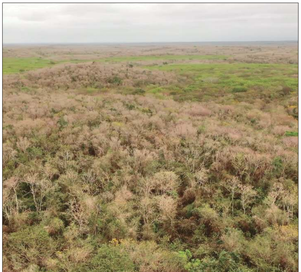
▲ Las nuevas áreas protegidas son el Santuario Playa Chenkan, para salvaguardar a las tortugas marinas, y el Parque Nacional Nuevo Uxmal, por el importante rol de su vegetación.