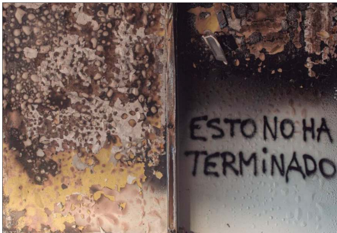
▲ MARca y #maldejojo , registran la investigación sobre dos fenómenos ocurridos en Chile: el maremoto de 2010 y el estallido social en 2019, con una diferencia de diez años.

MARca y #maldejojo , registran la investigación sobre dos fenómenos ocurridos en Chile: el maremoto (2010) y el estallido social (2019), con una diferencia de diez años. MARca , desde el nombre, fija la mirada sobre la realidad natural y social del borde costero. Aquí, Sáez se conmueve al observar los efectos del maremoto: "experiencia estremecedora (...) el