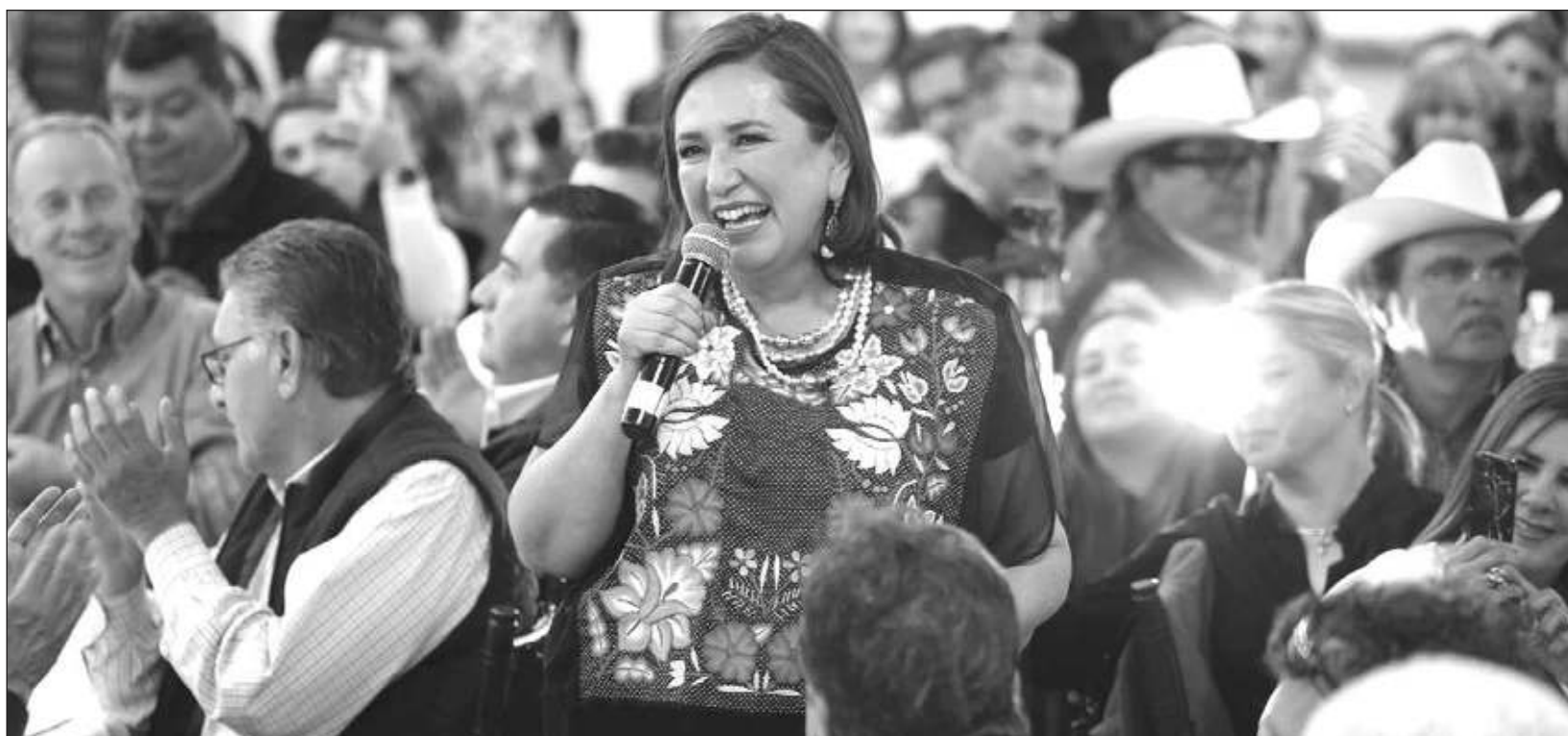
▲ La precandidata presidencial del Frente Amplio por México dijo que presentará las denuncias ante la Fiscalía Anticorrupción por el abuso contra los trabajadores de Notimex y ante el Instituto Nacional Electoral por el uso de recursos públicos en la campaña.

que la gobernadora Delfina Gómez les descontó 10 por ciento de su salario para la campaña y Marcelo Ebrard, quien había denunciado que la Secretaría del Bienestar está al servicio de Claudia Sheinbaum.