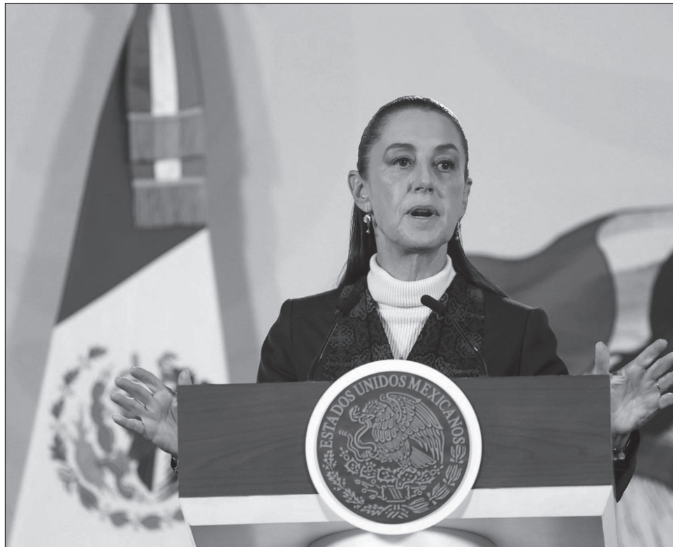
▲ La correcta tipificación del delito depende de conocer con precisión la causa, el modo en que ocurrió la explosión y quiénes fueron los responsables, afirmó la Presidenta.

“Mañana (martes) pueden explicarlo, explicar cómo se clasifica un delito de terrorismo en México o delincuencia organizada.