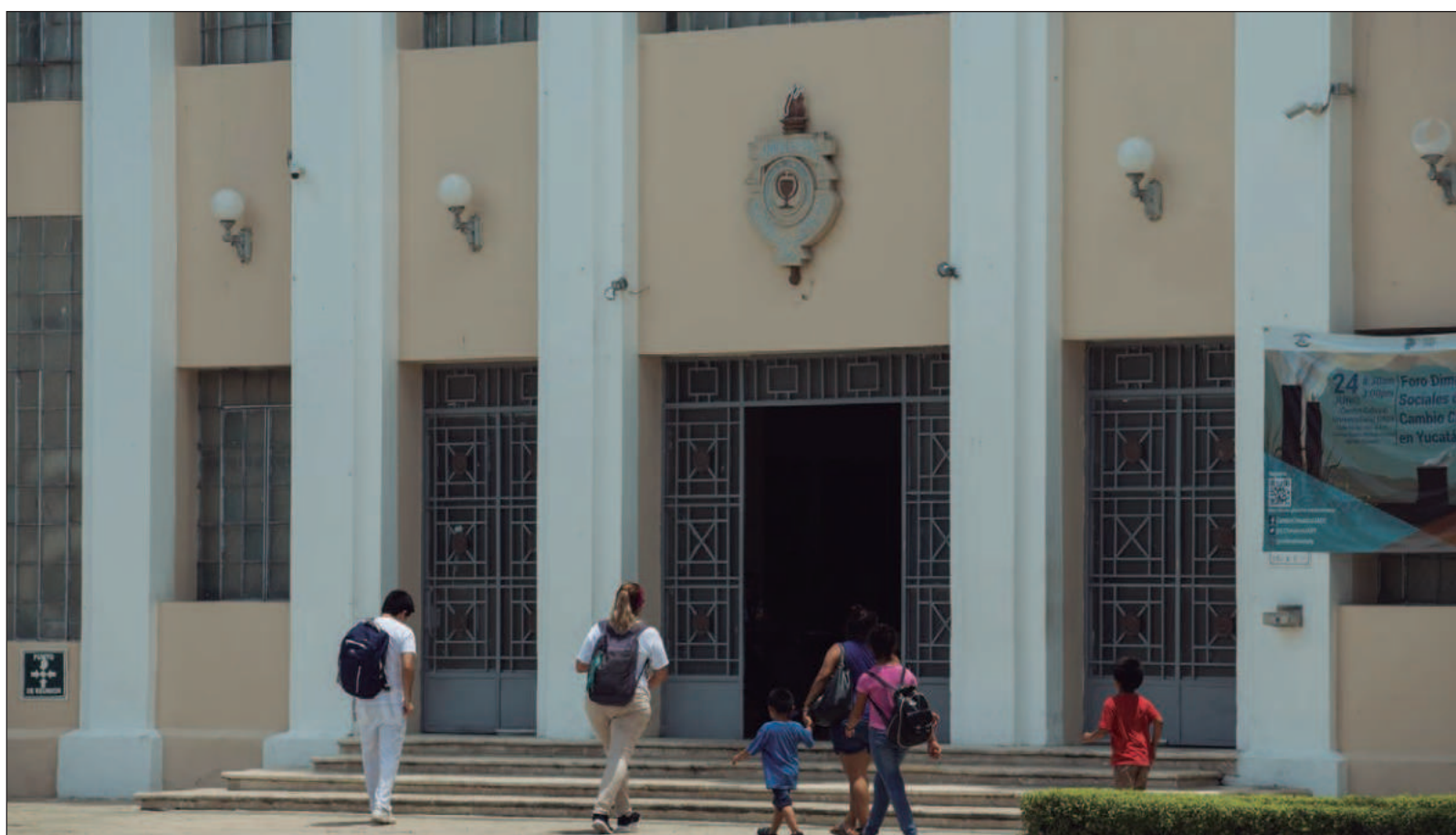
▲ "Para que la curva de desarrollo y de innovación no se aplane pronto, debe atenderse al posgrado con calidad".