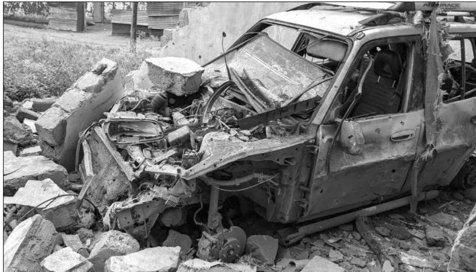
▲ Más de 100 grupos armados luchan en el este de Congo, una zona rica en minerales cerca de la frontera con Ruanda, y el principal de ellos es el M23, respaldado por Ruanda.

Más de 100 grupos armados luchan en el este de Congo, una zona rica en minerales cerca de la frontera con Ruanda, y el principal de ellos es el M23, respaldado por Ruanda. El conflicto ha