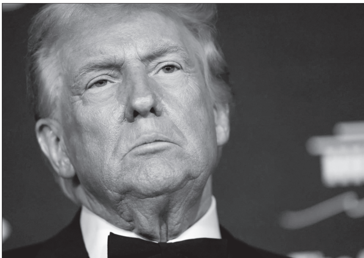
▲ "Trump, en la presentación del documento correspondiente, asegura que su país ha retomado el papel controlador que le corresponde y que ha ido implantando la paz cuando menos en ocho conflictos que él atendió".

TRUMP ASUME EXPLÍCITAMENTE la Doctrina Monroe: "América para los americanos", y le agrega un "corolario". Es la expresión descarnada del interés