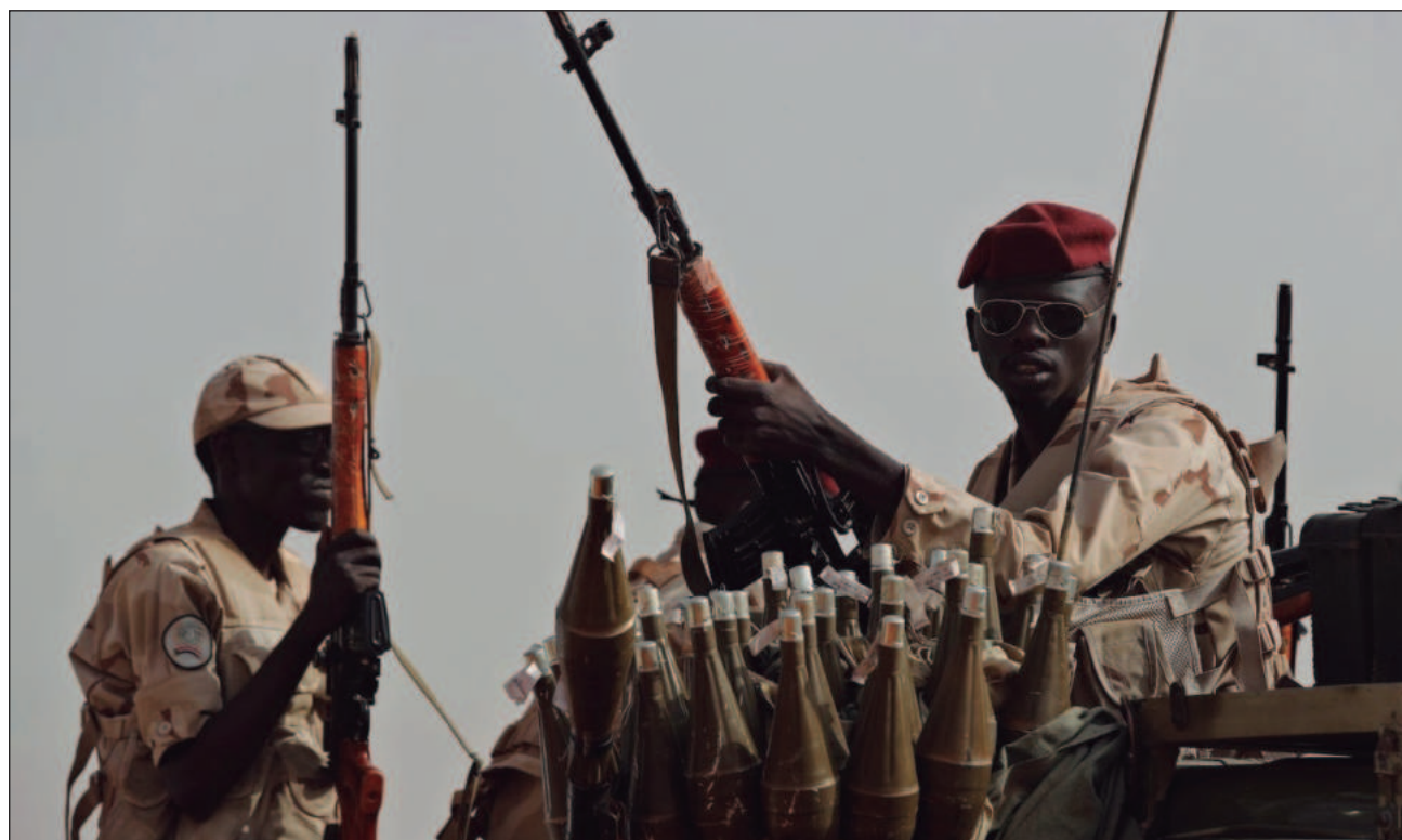
▲ El conflicto, marcado por las denuncias de atrocidades cometidas por ambos bandos, ha causado decenas de miles de muertos y ha obligado a millones de personas a desplazarse; Sudán está ahora dividido en dos.

“La liberación de la región petrolera de Heglig es un punto clave hacia liberación de toda la patria, por la importancia económica de