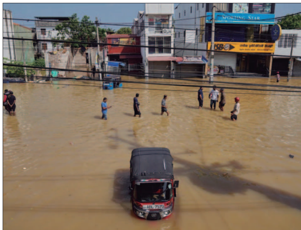
▲ Los desastres relacionados con el agua aumentan en toda la región asiática, mientras que el gasto para proteger a sus comunidades es insuficiente.

Esos riesgos se han manifestado este año en toda Asia, azotada por tormentas tardías, lluvias implacables e inundaciones graves. En Quy Nhon, en el cen-