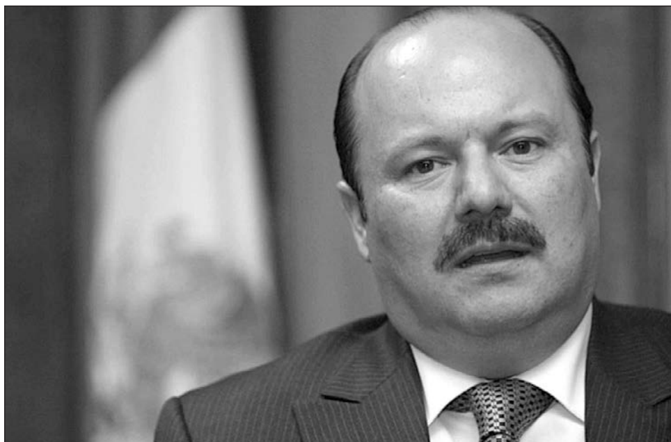
▲ En 2024 se tramitó ante el gobierno de EU la autorización para procesar a Duarte por un delito distinto a los de peculado y asociación delictuosa, que se concedió este 4 de diciembre.

Apuntó que el ex gobernador es investigado por su probable intervención como servidor público en Chihuahua, en un esquema de lavado de dinero, en el que pretendió ocultar recursos de procedencia ilícita desviados de las arcas estatales, utilizando para ello el Sistema Financiero Mexicano.