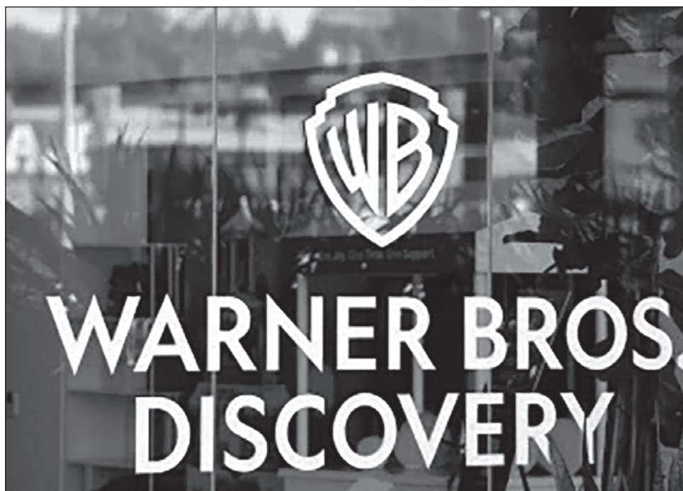
▲ El presidente Donald Trump dijo que el acuerdo con Netflix "podría ser un problema" porque se quedaría con una enorme cuota de mercado en la industria.

"Realmente estamos aquí para terminar lo que empezamos", declaró David Ellison a la CNBC cuando su compañía presentó su sexta puja por WBD desde septiembre, cuando comenzó la guerra de ofertas.