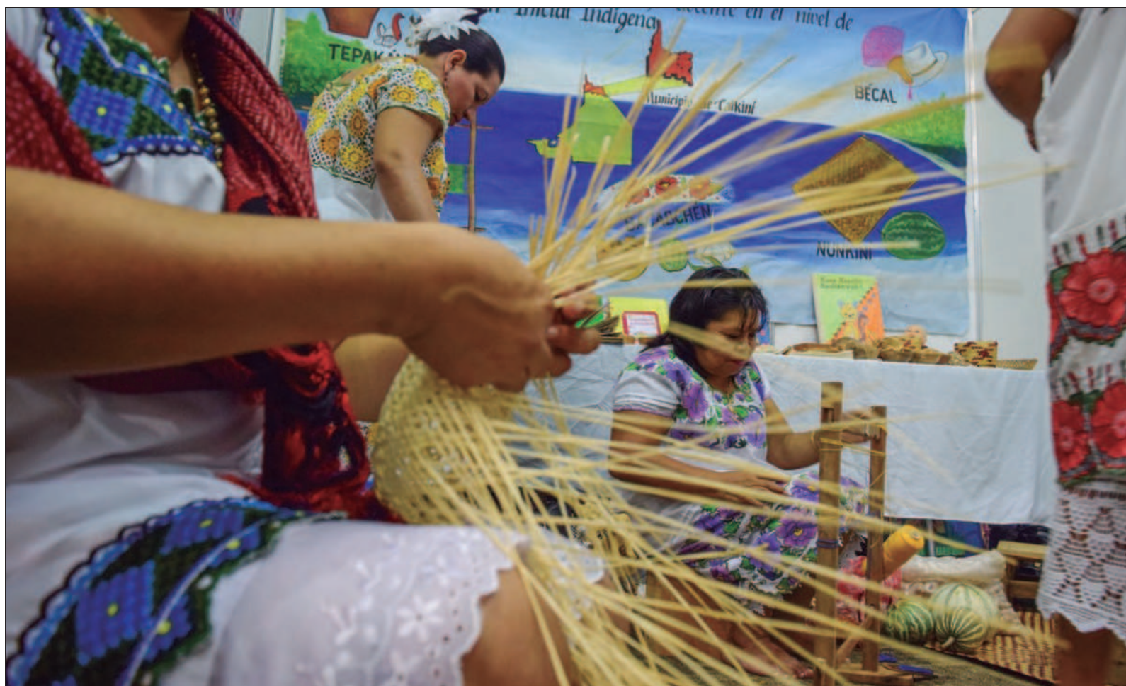
▲ “En la actualidad, respecto del desarrollo integral de los escolares, continúa vigente el propósito de la educación artística: contribuir en el desarrollo de las capacidades y habilidades como la curiosidad, la imaginación, la apreciación estética, la creatividad artística y la confianza en sí mismo”.