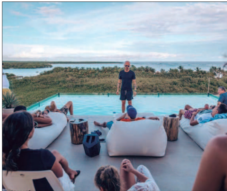
▲ “Notas afirmaban que Casa D recurriría a “palos para espantar fauna” y sugerían que se trataba de un proyecto ambientalmente riesgoso, vinculado además a decisiones del gobierno del estado. Ninguna de estas afirmaciones correspondía a la realidad”.

En pocas horas, Casa D fue colocado injustamente en la categoría de “proyecto depredador”, pese a que su diseño, sus parámetros y su densidad lo situaban en el extremo opuesto. La polémica se volvió un síntoma claro de lo que hoy enfrenta el ambientalismo en México: una mezcla de preocupación legítima y desinformación viral que dificulta evaluar cada caso con rigor. El contexto real: un proyecto de baja densidad y cumplimiento estricto.