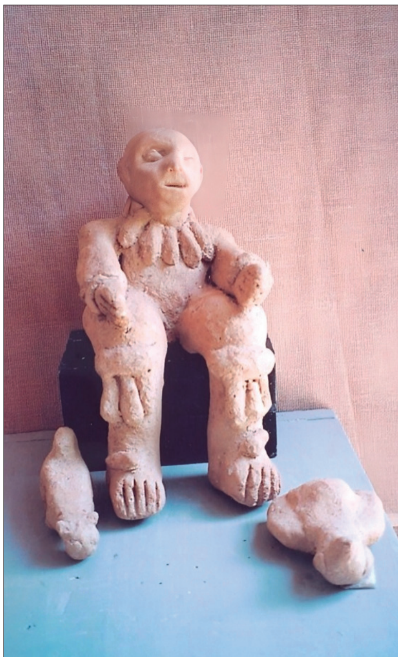
▲ "Los espíritus o vientos que son cuidadores del mundo, guardianes de la milpa, regadores de la lluvia y seres con alguna función para equilibrar el universo, están en constante renovación".

VOLVIENDO AL JT'UUP , cuando este permanece y crece hasta llegar a ser adulto en casa de los padres, tiene la tarea de cuidar de los