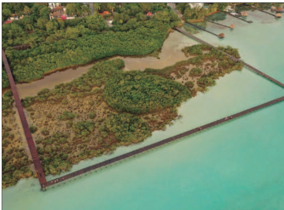
▲ El convenio firmado por Semarnat, Conanp, el gobierno estatal y el municipio de Bacalar establece los mecanismos y compromisos del que será el instrumento rector para orientar de manera sustentable el uso del suelo.

También subrayó que cada titular de Cultura presenta en el encuentro "experiencias que hablan de la diversidad, no solo del país, sino del hacer política cultural determinada en el territorio. A todos nos convoca la convicción de que a partir de las diferencias somos capaces de construir acuerdos, y en este espacio vamos a trabajar juntas y juntos".