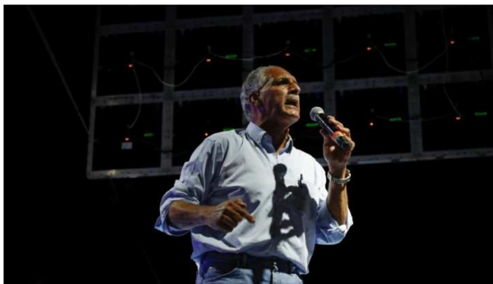
▲ Desde el pasado viernes, el candidato del conservador Partido Nacional, Nasry Tito Asfura, quien es apoyado por el presidente de Estados Unidos, Donald Trump, va a la cabeza.

La candidata oficialista del Partido Libertad y Refundación (Libre, izquierda), Rixi Moncada, si-