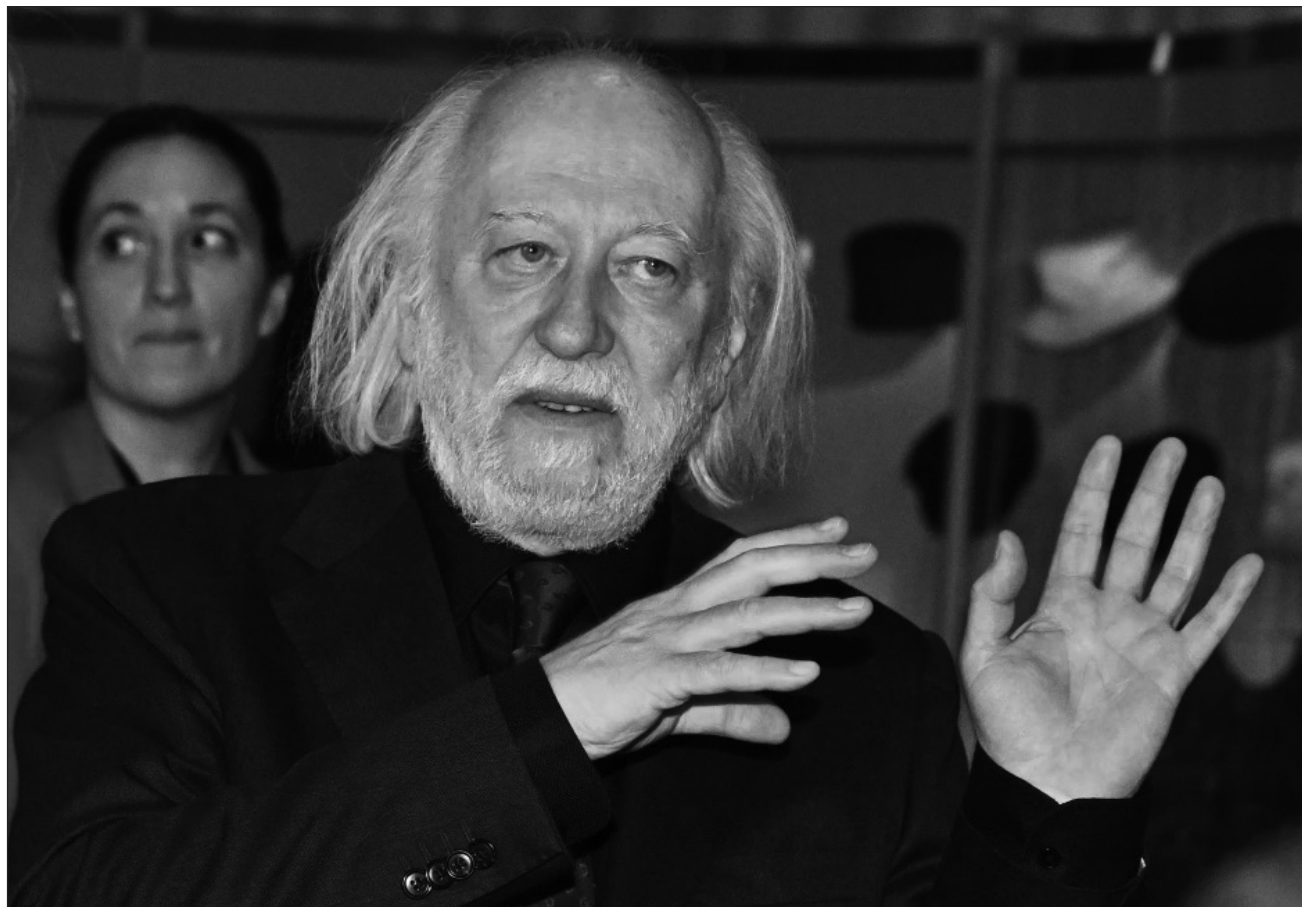
▲ El ganador del Premio Nobel de Literatura 2025, el húngaro László Krasznahorkai, destacó en su discurso -que dio en húngaro- que los ángeles “están aquí entre nosotros con su ropa de calle simple, irreconocibles, si así desean”.

Las ceremonias de entrega se celebran el 10 de diciembre, aniversario de la muerte de Alfred Nobel en 1896. En tanto, la gala del premio de la Paz se realiza en Oslo y las demás se llevan a cabo en Estocolmo.