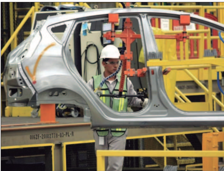
▲ En noviembre se crearon 48 mil 595 nuevos puestos de trabajo y en los once meses que van de 2025, se han generado 599 mil empleos formales en el país.

En los ingresos por suministro de bienes y servicios de las empresas constructoras registrados en los tres periodos, la ejecución de obras representó el principal rubro.