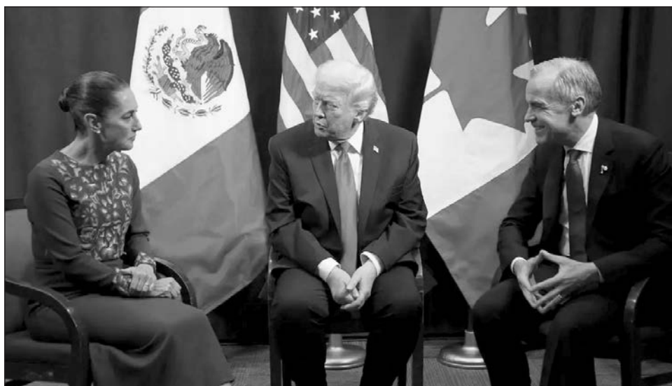
▲ La presidenta Claudia Sheinbaum sostuvo que el encuentro trilateral con su homólogo estadounidense, Donald Trump, y el primer ministro de Canadá, Mark Carney, fue cordial.

Claudia Sheinbaum consideró que el trato amable de Trump muestra el respeto que le tiene a México. Afirmó que esto sólo evidencia que “vamos muy