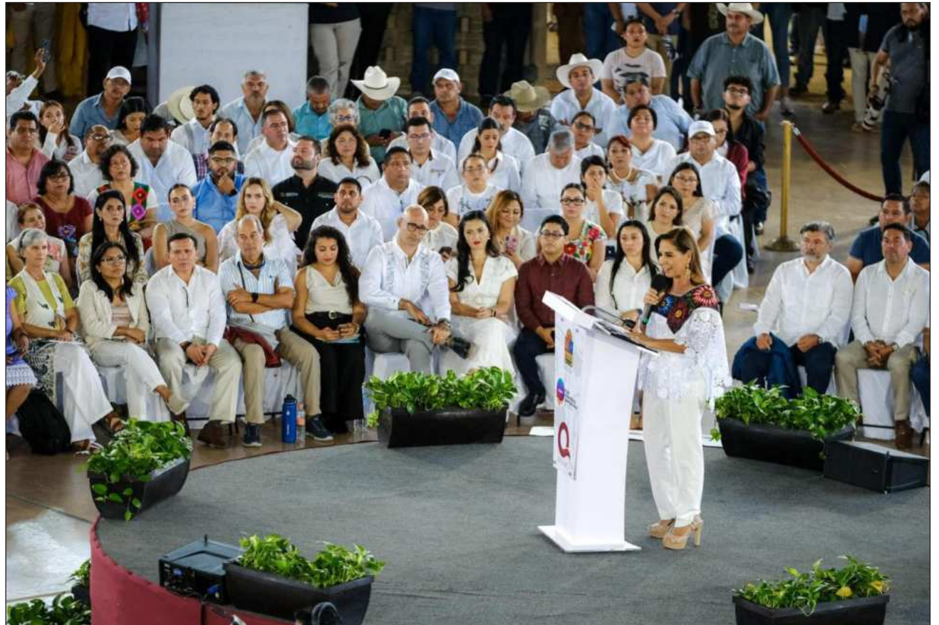
▲ Mara Lezama enfatizó que “este plan es de la gente, no es de un gobierno; está construido con la voz de quienes habitamos este estado y, sobre todo, con la energía, creatividad y visión de nuestras y nuestros jóvenes, que serán los protagonistas del futuro”.

Con la asistencia de más de 2 mil 500 personas de los diversos sectores de la sociedad, la gobernadora Mara Lezama destacó que el Plan Estratégico para el Desarrollo Sostenible 2050 convierte a Quintana Roo en el primer estado del país en contar con un instrumento de largo plazo elaborado