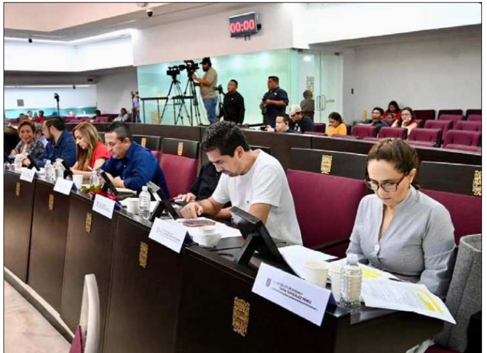
▲ El diputado presidente del Poder Legislativo, Antonio Jiménez Gutiérrez, reveló que el protocolo será el mismo que con los presidentes municipales.

Tras sostener que siguen pensando en otras estrategias más allá del endeudamiento por mil millones de