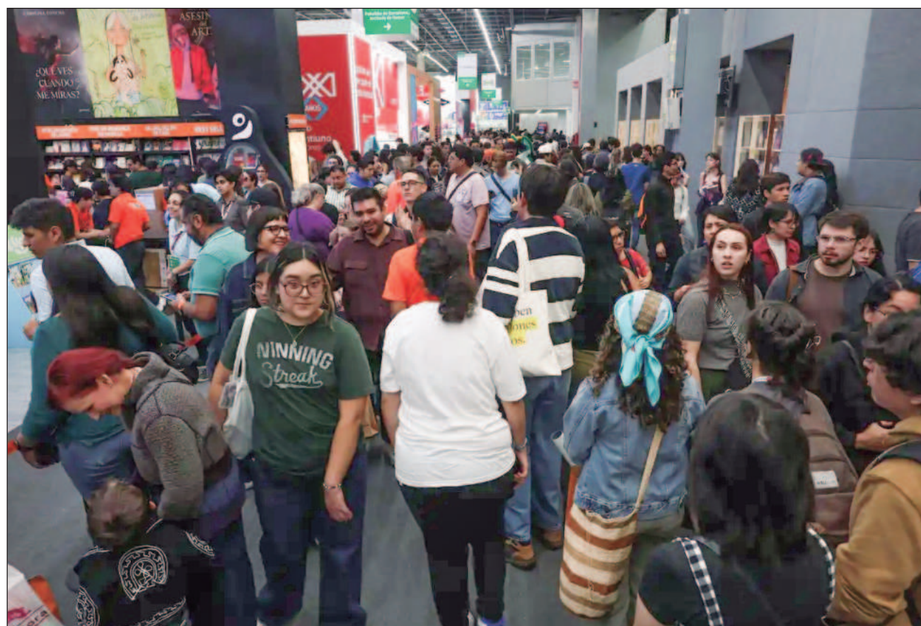
▲ A lo largo de nueve días se realizaron más de 3 mil actividades dentro y fuera de la Expo Guadalajara; en los 43 metros cuadrados del recinto se incrementó el número de sellos editoriales a 2 mil 790 provenientes de 64 países.

Destacaron también la chilena Nona Fernández y el salvadoreño Horacio Castellanos Moya, así como los