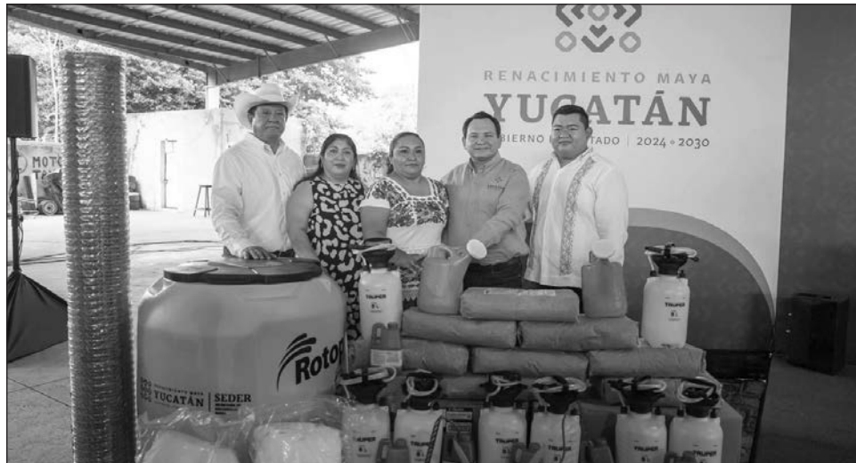
▲ “Con el apoyo del gobierno del estado, queremos que el campo produzca y deje más dinero para las familias de las y los productores”, subrayó el gobernador Joaquín Díaz Mena.

De igual manera, para que las mujeres y hombres de campo tengan una movilidad más digna hacia