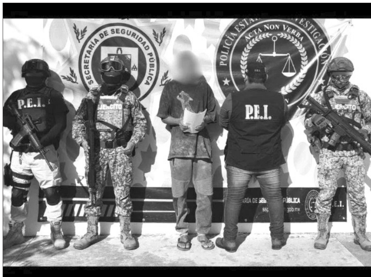
▲ El hombre detenido fue identificado con las siglas N. G. T., de 26 años de edad, originario de Orange Walk, Belice, de oficio pescador. De acuerdo con la investigación, la noche del 4 de diciembre de 2025, en el interior del predio que ambos habitaban en Telchac Puerto, la víctima fue agredida en múltiples ocasiones con un objeto punzocortante, causándole la muerte.

La Secretaría de Seguridad Pública reitera su com-