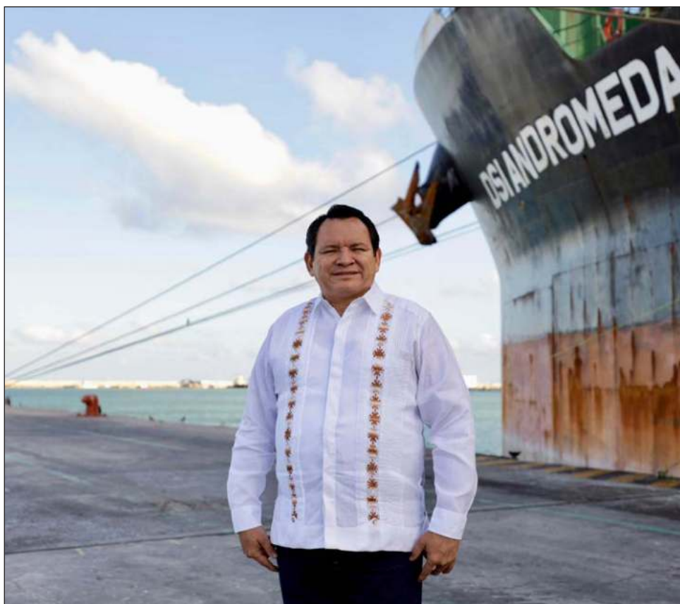
▲ El gobernador de Yucatán aseguró que la ampliación del Puerto de Altura de Progreso representará un punto de inflexión en el desarrollo social del estado.

Esta obra, que forma parte del proyecto estatal Renacimiento Maya, es un ejemplo de cómo la colaboración entre distintos niveles de gobierno puede traducirse en beneficios tangibles para la población, impulsando un futuro más prometedor para el estado y sus comunidades.