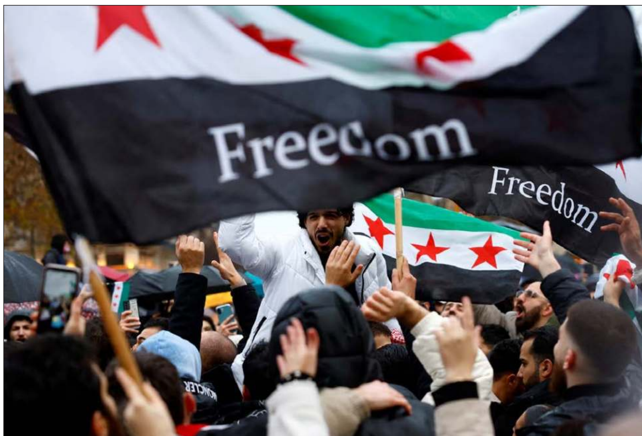
▲ Diez años después de haber huido de Siria, Khedr vive en Egipto y desde la distancia le cuesta creer que el gobierno de Bashar al Assad, responsable de la muerte de su padre, haya sido derrocado finalmente.

En Damasco, los rebeldes vestidos con uniforme de