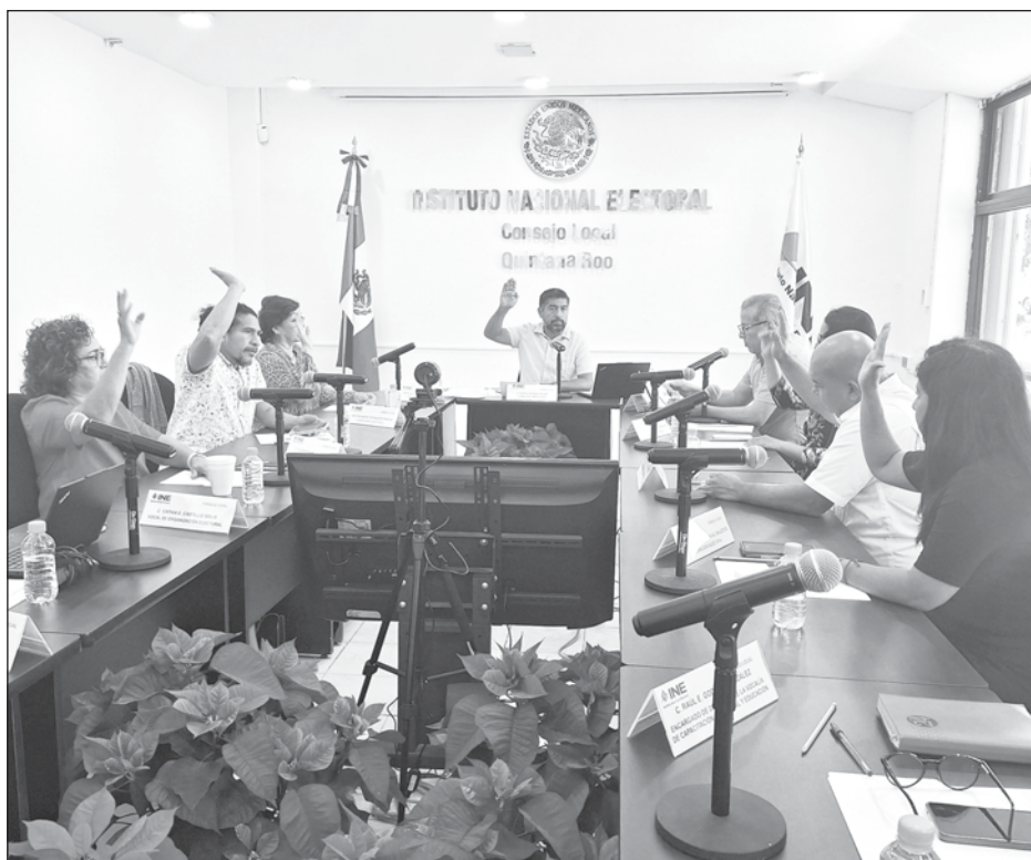
▲ Sobre la lista nominal para participar en el proceso electoral para elegir a los 35 jueces y magistrados a nivel federal, será de un millón 480 mil personas.