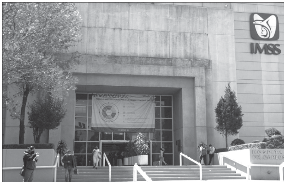
▲ El Tribunal ordenó al Instituto el pago retroactivo de las mensualidades no cubiertas desde febrero de 2019; el aguinaldo correspondiente a los años 2019, 2020, 2021, 2022 y 2023; así como el incremento anual de las pensiones.

El Consejo de la Judicatura Federal (CJF) informó que tras el fallecimiento de su esposo en abril de 1975, la mujer accedió a una pensión por viudez; posteriormente, sostuvo una relación de concubinato con una persona que gozaba de una pensión por cesantía en edad avanzada y que tras el deceso de su concubino, tramitó la respectiva pensión de viudez, misma que le fue otorgada en marzo de 2018.