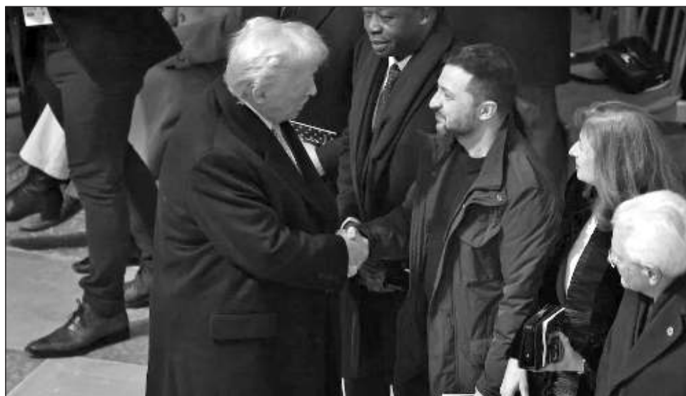
▲ El presidente ucraniano se reunió con Donald Trump en París; el republicano que asume el gobierno de Estados Unidos el 20 de enero, afirmó en una entrevista difundida este domingo que su gobierno “probablemente” reducirá la ayuda para Ucrania.

Zelensky declaró que Ucrania necesita “una paz justa y duradera, una que los rusos no sean capaces de destruir en unos años”, informó este domingo en las redes sociales con respecto al conflicto que se inició hace casi tres años con la invasión rusa.