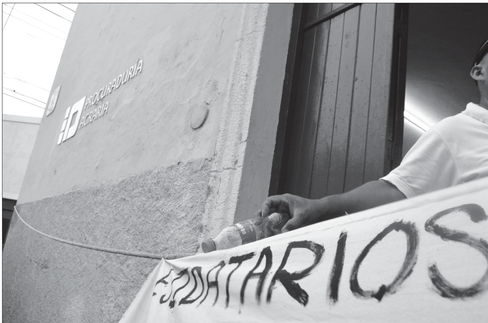
▲ "Los problemas de hoy no son los mismos de ayer y aunque muchos creen que la cuestión agraria ha quedado saldada, la realidad es otra".

No obstante, es necesario advertir que por muy efectiva que parezca la política pública en materia agraria que se diseñara, se vislumbra muy difícil que prospere si los cuadros encargados de su aplicación siguen siendo los mismos que operaron el aparato público agrario durante las gestiones presidenciales del pasado. Lo único que nos falta por ver es que los "modernizadores" y pro privatizadores de ayer (priistas y panistas), cuya capacidad acomodaticia es admirable, resulten ser los "agraristas" de hoy.