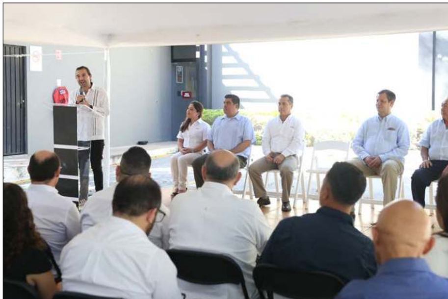
▲ Los procedimientos aplicados contra el cambio climático que acompañan su producción de carne de cerdo que garantiza y contribuye con la seguridad alimentaria de México y con los Objetivos de Desarrollo Sostenible en apego a la agenda 2030.

Por parte de las plantas de alimentos balanceados registraron un cumplimiento del 100 por ciento en los indicadores ambientales, reflejaron un eficiente control de los residuos generados en su operación, así como su clasificación y mostraron eficiencias en el uso del agua.