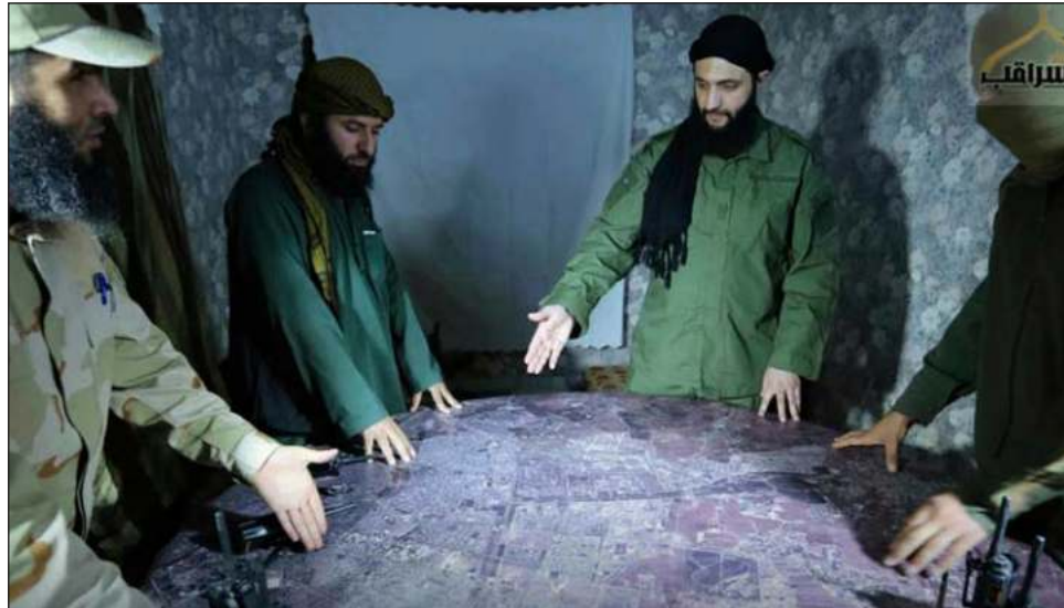
▲ Al Jolani rompió relaciones con Al Qaeda en 2016, desde entonces ha intentado presentarse como un líder más moderado, sin embargo, aún levanta suspicacias entre analistas y gobiernos.

Pero ahora no duda en dar entrevistas a medios internacionales y dejarse ver en la segunda ciudad siria, Aleppo, después de arrebatarla completamente al gobierno por primera vez desde la guerra civil que estalló en 2011.