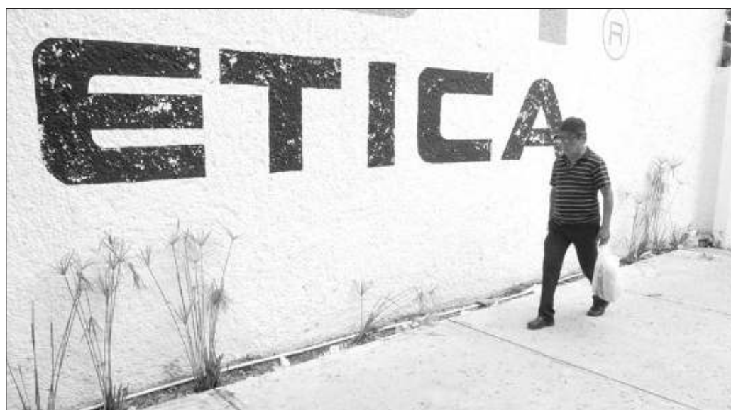
▲ Durante este fin de semana, el Inegi reveló que en la península de Yucatán, una de cada 10 personas mayor de 18 años fue víctima de la corrupción durante 2023.

La corrupción tiene múltiples expresiones y funciona en varios niveles, no solamente entre dos personas, sino también entre empresas y representantes de instituciones, en la aprobación de leyes sin una discusión extensa, y también tendríamos que detenernos para analizar si cuando existen conflictos entre gobiernos locales y municipales no es sino porque algún actor está impidiendo el flujo regular de la "transa" que ya está diseñada para "facilitar" que las cosas funcionen, pero en beneficio de unos cuantos.