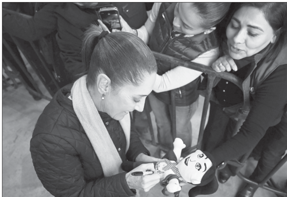
▲ Desde la ciudad fronteriza de Nuevo Laredo, la presidenta Claudia Sheinbaum reivindicó el papel de los mexicanos migrantes en el país del norte.

Defendió la aportación de los mexicanos: “Son los mejores trabajadores del campo. Nadie se asemeja a los trabajadores mexicanos, Sin ellos, no llegaría alimento a la mesa de norteamericanos. De igual manera son los mejores trabajadores de la construcción y echan adelante la economía de Estados Unidos y de México. Son grandes trabajadores en las fábricas. Es más, hay me-