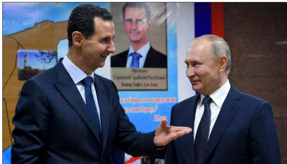
▲ Moscú ofreció su respaldo al “diálogo político inclusivo, que se basa en la resolución 2254 del Consejo de seguridad de la Organización de las Naciones Unidas, aprobada por unanimidad”.

Aunque “Rusia no participó en esas negociaciones”, reconoce el texto, “está en contacto con todos los grupos de la oposición siria” y los insta a “evitar