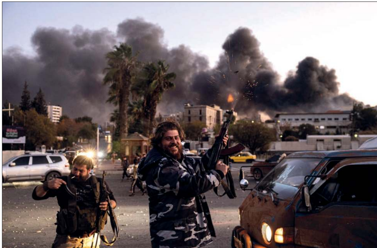
▲ “Después de 50 años de opresión bajo el gobernante partido Baaz, y 13 años de crímenes, tiranía y desplazamiento, anunciamos hoy el fin de esta era oscura y el comienzo de una nueva era para Siria”, afirmaron los rebeldes.

La violencia también desplazó a 370 mil personas, según la ONU, en un país que sufrió una sangrienta guerra civil provocada por la represión de masivas manifestaciones prodemocráticas en 2011.