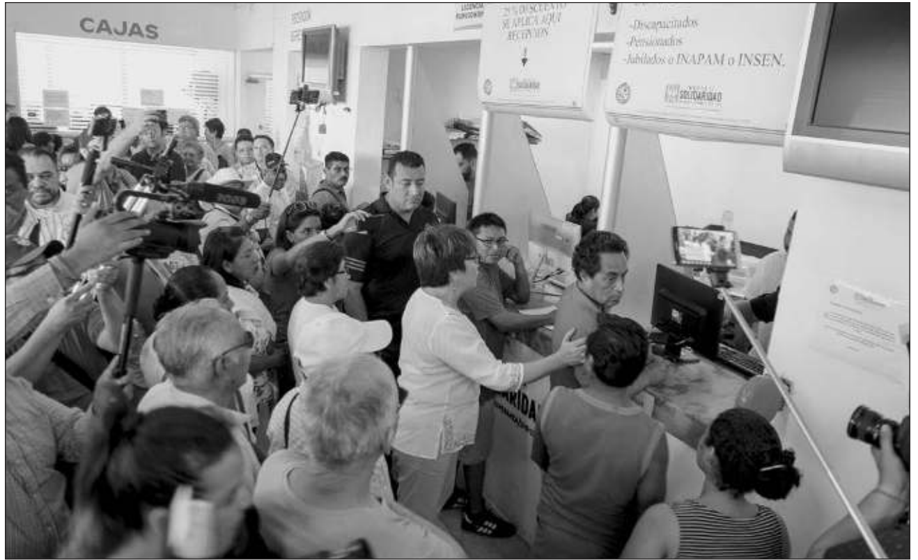
▲ Los trámites realizados ante alguna instancia del gobierno estatal, como el pago del impuesto vehicular, los trámites en el registro civil, o ante el Ministerio Público, entre otros, tuvieron la mayor prevalencia de corrupción.

En segundo lugar, están los trámites del orden municipal, como el pago del agua, el predial y otros servicios municipales.