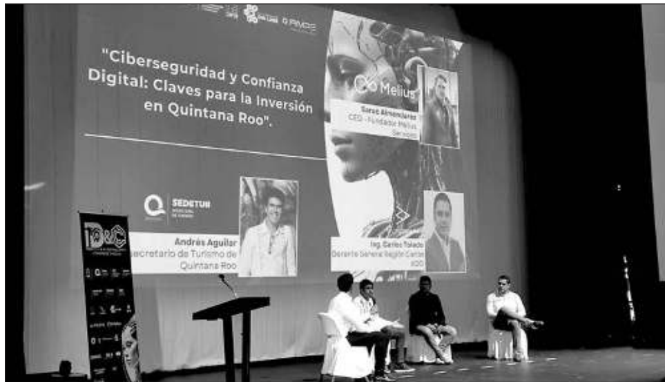
▲ Además del Guest Assist, la Sedetur también remarcó el Registro Estatal de Turismo, que busca brindar seguridad y confianza a los viajeros mediante la identificación de empresas que ofertan servicios turísticos y paquetes vacacionales.