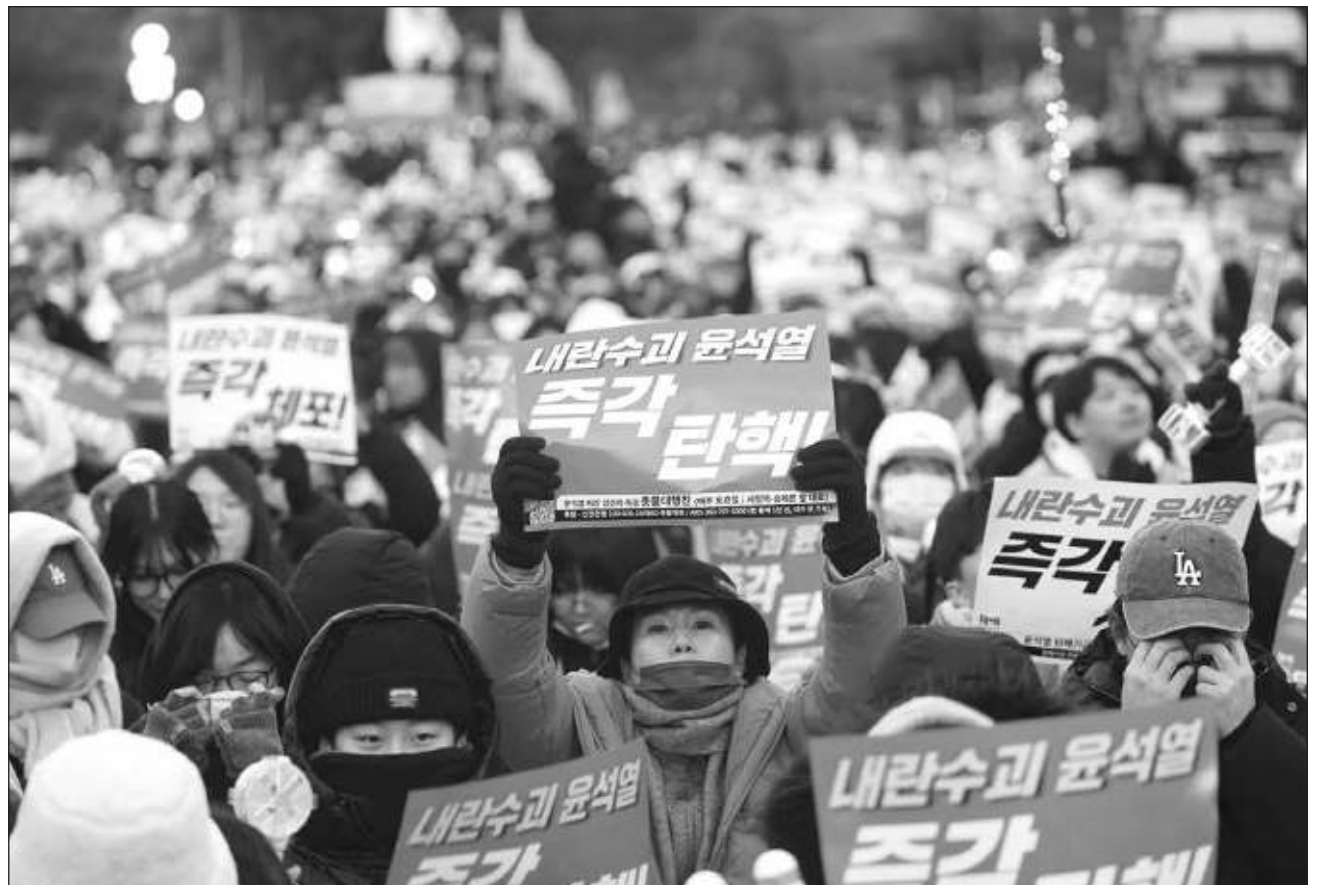
▲ La decisión del presidente Yoon Suk Yeol de declarar la ley marcial la semana pasada, que tuvo que ser anulada horas después, ha desatado una profunda crisis política en Corea del Sur, donde se han realizado protestas multitudinarias.

"Yoon (...) debe renunciar de inmediato o ser acusado sin demora", declaró Lee a los periodistas. "El 14 de diciembre, nuestro Partido Demócrata acusará a Yoon, en nombre del pueblo", añadió.