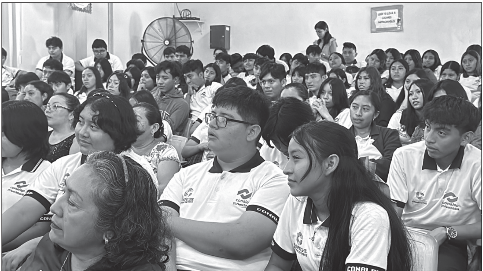
▲ “Si nuestros jóvenes eran retraídos entonces, la pandemia “los pasó a perjudicar”, como dirían en mi pueblo. Los jóvenes se encerraron en sus cuartos, dizque a estudiar, se enclaustraron en ellos mismos, cerraron la comunicación verbal, dejaron de socializar, perdieron la oportunidad de vivir el enamoramiento, compartir las dudas, las risas, el gozo de saberse vivos”.