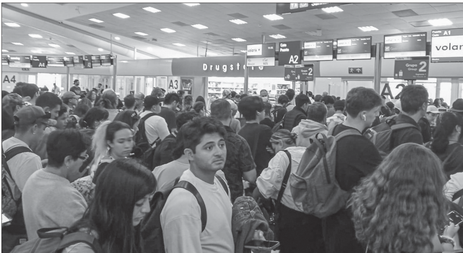
▲ “¿Cómo es posible que siga operando esta fractura del ser humano en pleno siglo XXI, donde unos son considerados bienvenidos/deseables y otros sean rechazados? Acciones como la acontecida, si bien no matan directamente a los campesinos, sí están ‘dejando morir’ sus saberes”.

http://orga.enesmerida.unam.mx/ Facebook @ORGACovid19 Instagram @orgacovid19 X @ORGA_COVID19