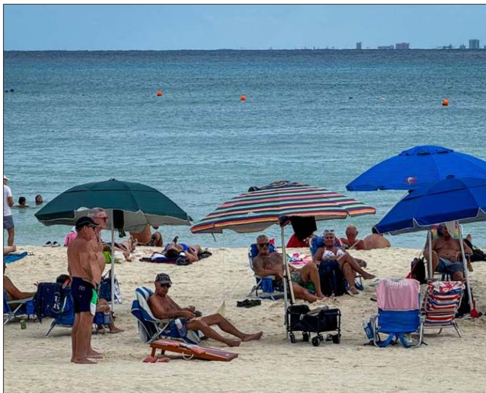
▲ En el tercer trimestre del año en curso, el empleo turístico superó a la cifra histórica registrada en el primer trimestre de 2020, previo a la pandemia.

“En el tercer trimestre de 2024, el empleo turístico superó en 9.2 por ciento, es decir, con 414 mil 191 personas, a la cifra histórica registrada en el primer trimestre de 2020, previo a la pandemia, cuando se registraron cuatro millones 487 mil personas”, agregó.