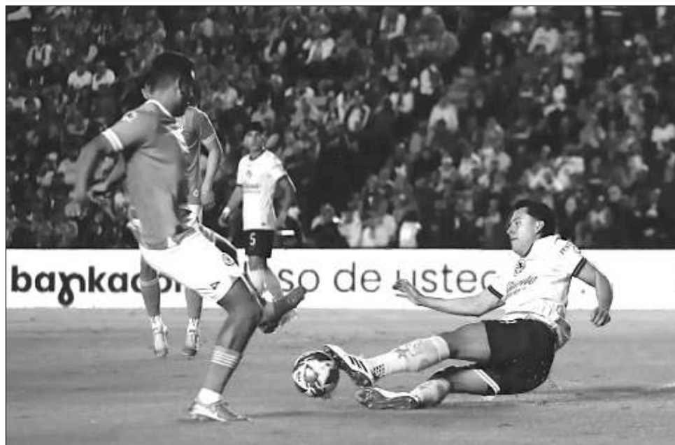
▲ América hizo valer su camiseta y se convirtió en finalista tras superar al Cruz Azul.

América, que juega como local en el estadio de la Ciudad de los Deportes mien-