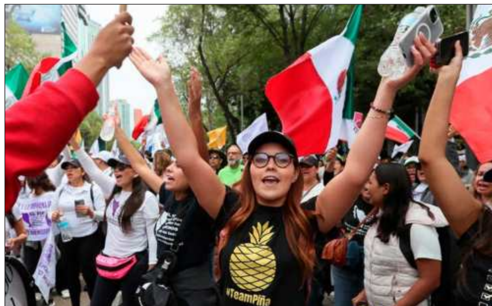
▲ “Nuestra convicción y compromiso va más allá de nosotros. Es con las generaciones que vienen y fundamentalmente con el país que todos anhelamos”, subrayó la ministra presidenta del PJF.

“Si tenemos el valor y la voluntad real, hoy mismo podríamos dar pasos firmes para hacer los cambios profundos y necesarios para construir la paz, la justicia y la reparación que México tanto necesita. Nuestra historia no se puede definir a