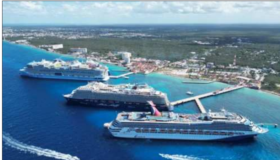
▲ El modelo Nueva Era del Turismo tiene como objetivo eliminar las barreras de desigualdad que tuvo la mayoría de la población excluida del éxito de esta industria.

Algunos de los logros han sido, por ejemplo, que en 2023 más de 21 millones de turistas llegaron a Quintana Roo; se registró un movimiento