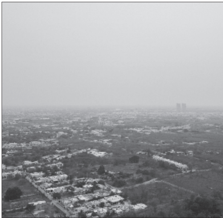
▲ “Se trata de la farsa, o montaje de la construcción de casas, departamentos y townhouses para uso habitacional dentro de un régimen de propiedad de condominio, ubicada en la Zona Norte de la Ciudad de Mérida y hacia el puerto de Progreso”.

El “fraude inmobiliario” se trata de la farsa, o montaje de la construcción de casas, departamentos y townhouses para uso habitacional dentro de un régimen de propiedad de condominio, ubicados “en la Zona Norte de la Ciudad de Mérida y hacia el puerto de Progreso”,