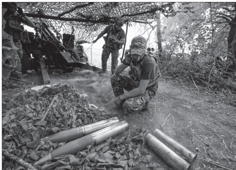
▲ De acuerdo con la fiscalía regional, dos mujeres murieron en un ataque ruso con cohetes contra una aldea cercana a la línea del frente en la región de Donetsk, epicentro de los combates.

“El enemigo bombardeó anoche la ciudad de Sumy. Dos personas murieron y cuatro resultaron heridas, entre ellas dos niños”, informó este domingo la administración militar de la región homónima en la red Telegram.