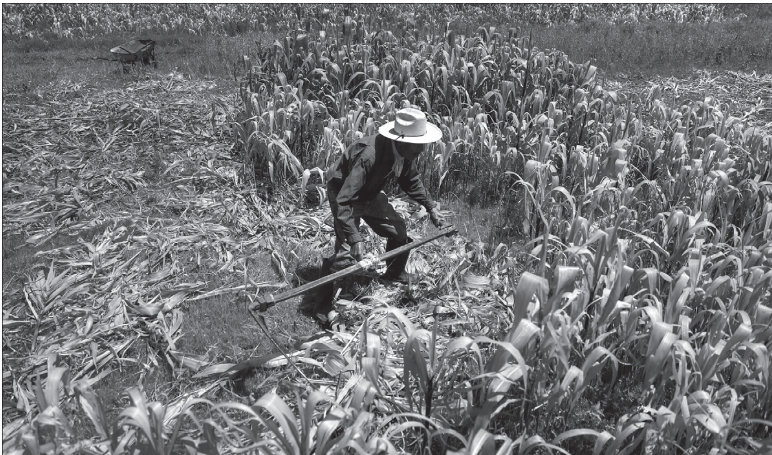
▲ “Una especie de conciencia volitiva por borrar de la conversación al único constructo social triunfante en las revoluciones de los recientes 130 años: los campesinos”.

*Participó como consultor y estratega en procesos presidenciales, estatales y locales. Editor de publicaciones para la HCD en materia de política económica, así como en diversos títulos enfocados en procesos de organización comunitaria y poder popular. Ha impartido clases en diversos diplomados y maestrías con el tema “Hacia un nuevo paradigma epistemológico en las Ciencias Sociales” y coyuntura política a nivel México y América Latina.