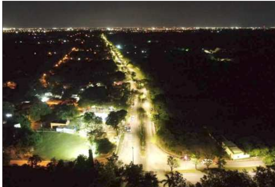
▲ La alcaldesa encendió la nueva iluminación de la cancha de la comisaría de Xmatkuil y la avenida 50 que va hasta el periférico con más de 200 lámparas LED.

Dio a conocer que de manera simultánea se realiza la sustitución de 1 mil 114 luminarias de vapor de sodio en las colonias Emiliano Zapata