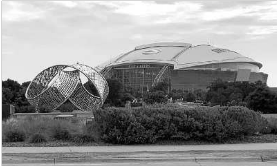
▲ El Estadio AT&T, casa de los Vaqueros de Dallas, donde la selección mexicana de futbol se enfrentará este martes a Canadá en un partido amistoso. Los "Cowboys" debutarán como locales en la temporada de la NFL el próximo domingo ante Nueva Orleans.

Hill terminó con siete recepciones para 130 yardas. Devon Achane logró también siete atrapadas para 75 yardas