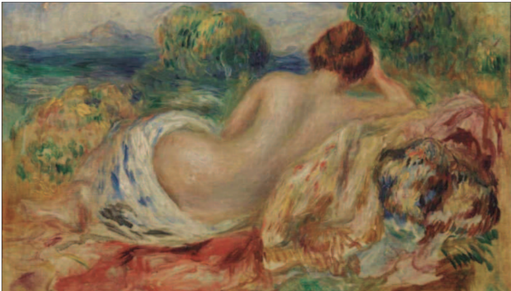
▲ La muestra Diálogos de vanguardia: La colección Pearlman revive la forma en que se realizaban las exposiciones internacionales de entre siglos para acercar a los visitantes a los intereses de la belle époque que desde la plástica fue un parteaguas en técnicas como el paisaje, el desnudo, el cabaret y la vida cotidiana.

La inauguración de Diálogos de vanguardia: La colección Pearlman será el 12 de septiembre en el Munal (Tacuba 8, Centro Histórico).