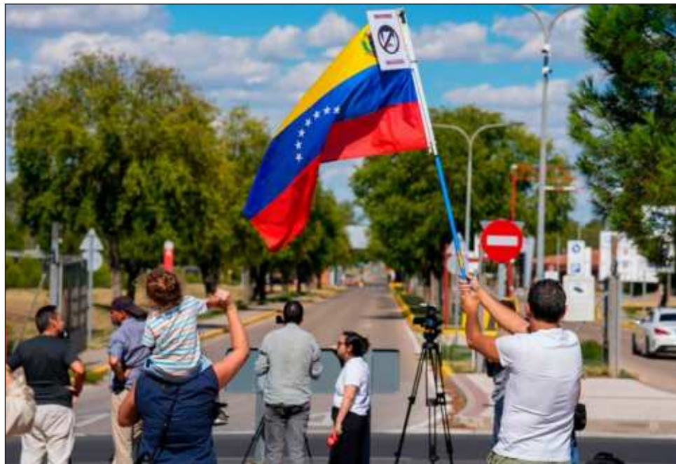
▲ El jefe de la diplomacia de la Unión Europea, Josep Borrell, dijo en un comunicado que "hoy es un día triste para la democracia en Venezuela", y agrega que, "en democracia, ningún líder político debería verse forzado a buscar asilo en otro país".

"A partir de ahora, comenzarán los trámites para la petición del asilo, cuya resolución será favorable en aras del compromiso de España con los derechos políticos y la integridad física de todos los venezolanos y venezolanas, especialmente de los líderes políticos", agregó la nota.