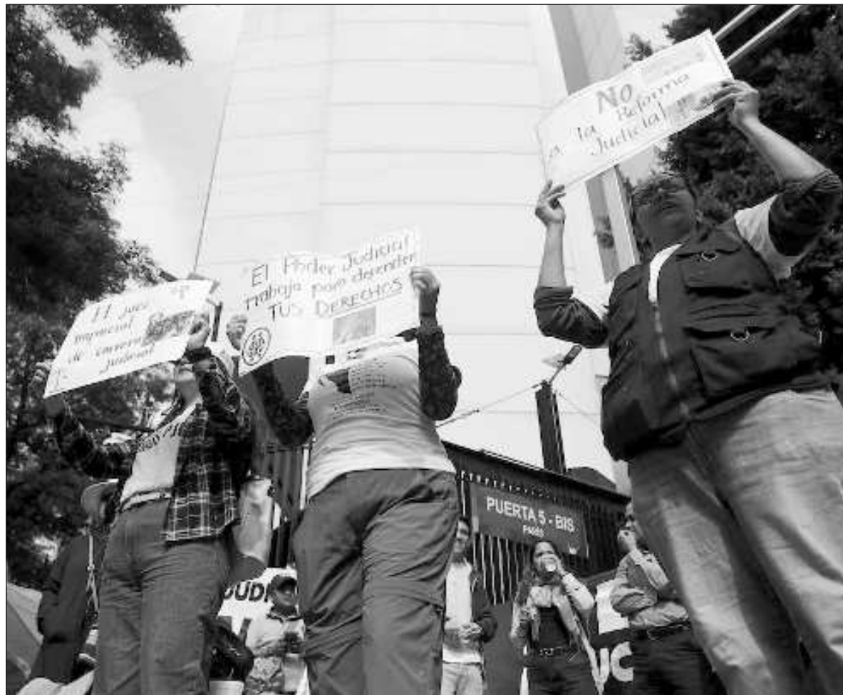
▲ "Eliminarlos supone cancelar muchos años de formación y especialización de conocedores del derecho a la información, la evaluación de proyectos, el desarrollo de la producción de energía y de hidrocarburos".

PORQUE CADA UNO de estos organismos proviene de experiencias largas que demostraron su necesidad y que justifican su utilización eficaz a lo largo de al menos dos décadas. Recuperan algún momento del desarrollo político del país y, en algunas ocasiones incluso, como lo han recordado (con poco tacto) los embajadores de Estados Unidos y Canadá, acuerdos hechos para brindar seguridad al Tratado conjunto entre los tres países (el caso de la Cofece). Otros organismos surgen de problemas semejantes y resuelven asuntos cotidianos a los que nos hemos acostumbrado: ¿Cómo asegurar que se me informe sobre actos del gobierno? Ahí está el INAI. ¿Sabemos si las medidas para mejorar el bienestar y los niveles de vida dan resultado? Para eso está el Coneval. Pese a sus fallas y errores, han