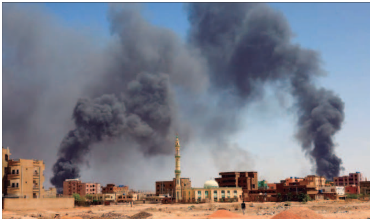
▲ El director general de la Organización Mundial de la Salud, Tedros Adhanom Ghebreyesus, aseguró que “la magnitud de la emergencia es asombrosa, como lo es la falta de acciones para poner fin a este conflicto”.

Sudán se hundió en crisis en abril del año pasado cuando estallaron choques entre las fuerzas armadas y un grupo paramilitar llamado Fuerzas de Apoyo Rápido.