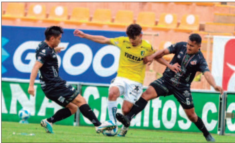
▲ La derrota por 1-0 registrada este domingo en el Instituto Tecnológico de Oaxaca mantiene la racha negativa de los astados ante Alebrijes en calidad de visitante.