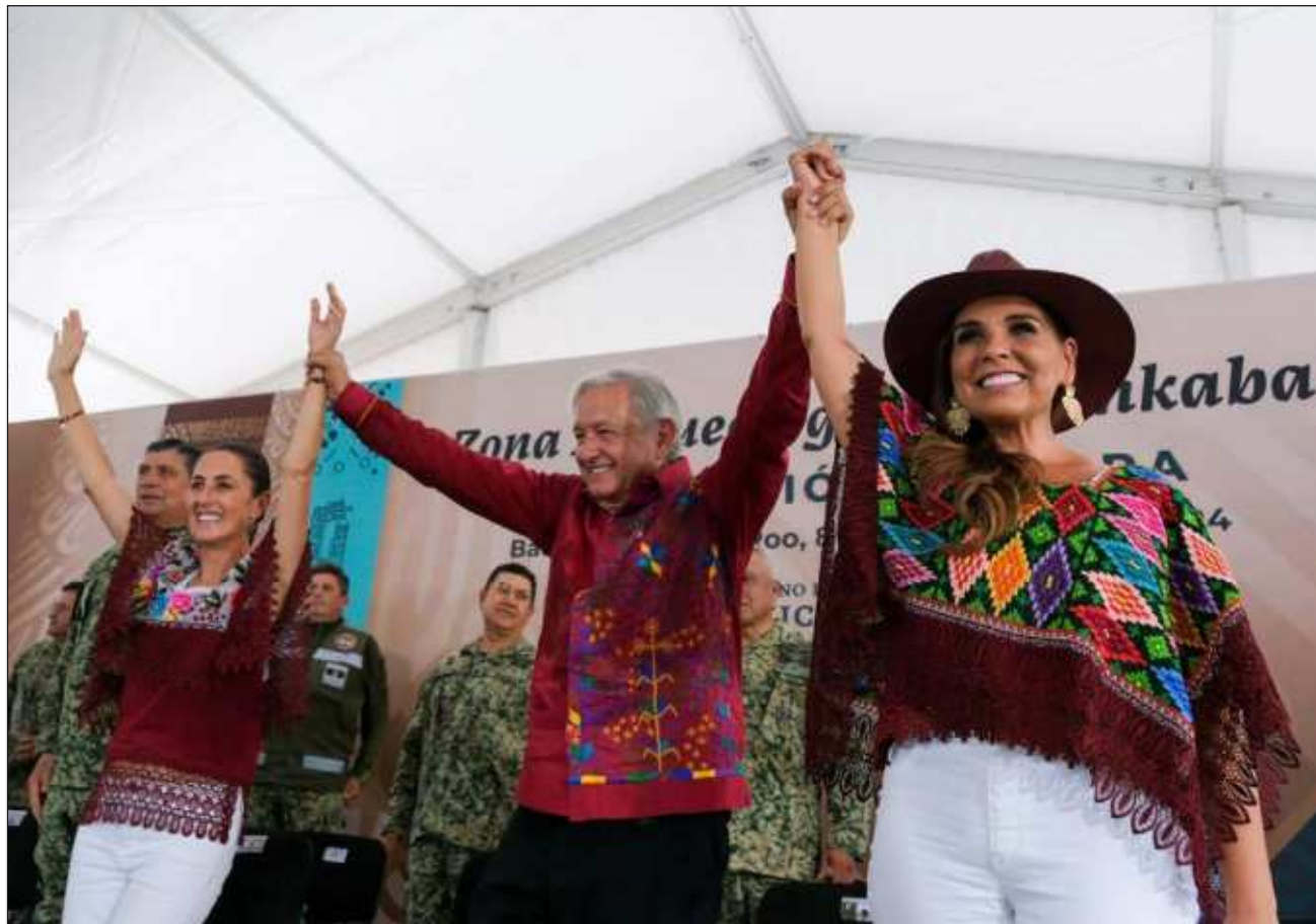
▲ Desde Bacalar, el presidente Andrés Manuel López Obrador calificó a Mara Lezama Espinosa como una extraordinaria gobernadora y sostuvo que “es de justicia reconocer su trabajo en estos dos años”.

Insistió en que los programas sociales no solo continuarán, sino que serán for-