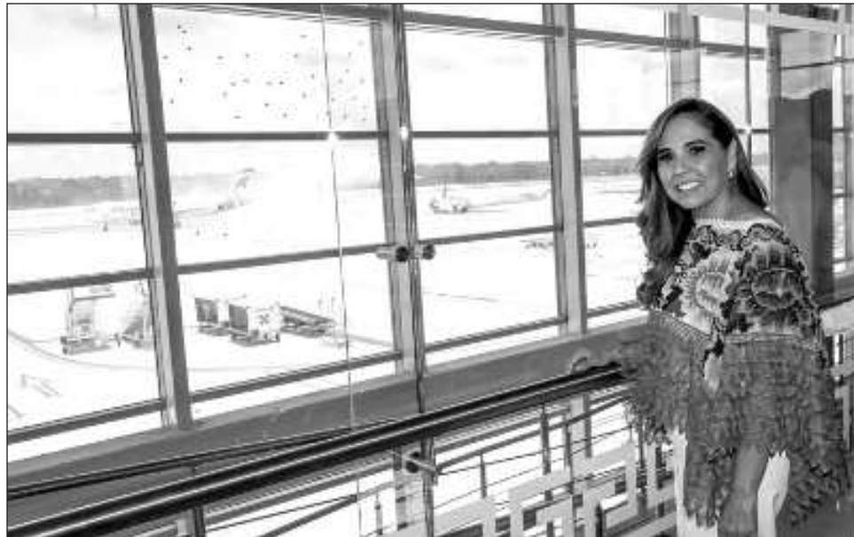
▲ En dos años de gobierno, Mara Lezama Espinosa ha trabajado en la regularización en la tenencia de la tierra para más de 7 mil familias.

En ese marco, mediante un comunicado de prensa el gobierno del estado dio a conocer que en dos años de gobierno, Mara Lezama ha trabajado en la regula-