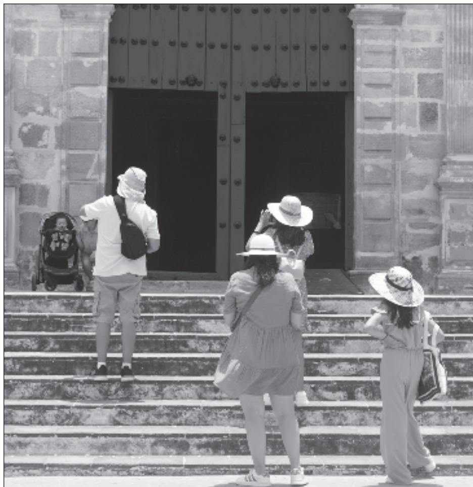
▲ El empleo turístico registró un incremento de 148 mil 58 personas empleadas en el sector productor de bienes y servicios turísticos, informó la dependencia federal.

Con lo anterior, señala, se logró el objetivo de mantener los precios por debajo de la inflación para no afectar a la economía de la población mexicana.