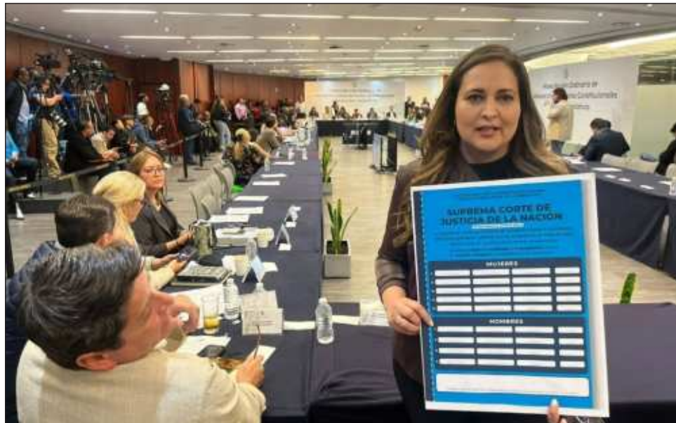
▲ La votación final fue de 25-12; los sufragios en contra fueron del PAN, PRI y MC, quienes sostuvieron que la reforma va encaminada al sometimiento de la Suprema Corte y el poder Judicial.

Expuso asimismo que la reforma permite sustituir al Consejo de la Judicatura Federal por el Tribunal Disci-