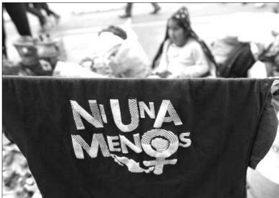
▲ Las pesquisas indican que la pareja se encontraba en su domicilio, en el fraccionamiento Las Cumbres de la ciudad de Tepic, cuando en "un momento determinado la agredió físicamente, provocando lesiones fatales", detalla el reporte.

La fiscalía también detalló que al imputado se le impuso "la medida cautelar de prisión preventiva oficiosa misma que se justificó".