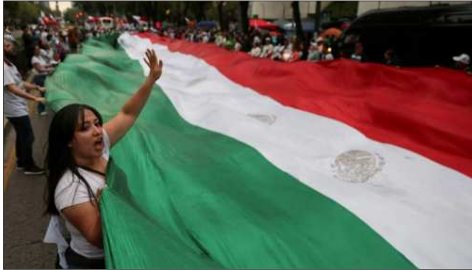
▲ Más de tres mil personas corearon consignas como "el juez imparcial es de carrera judicial" en lo que fue el trayecto hacia el recinto Legislativo ubicado en Paseo de la Reforma.

Los participantes también gritaron "señor senador, déten al dictador" para exigir a los senadores que cumplan su promesa de defender la Constitución y no cedan ni un voto a favor de esta reforma a la que consideran