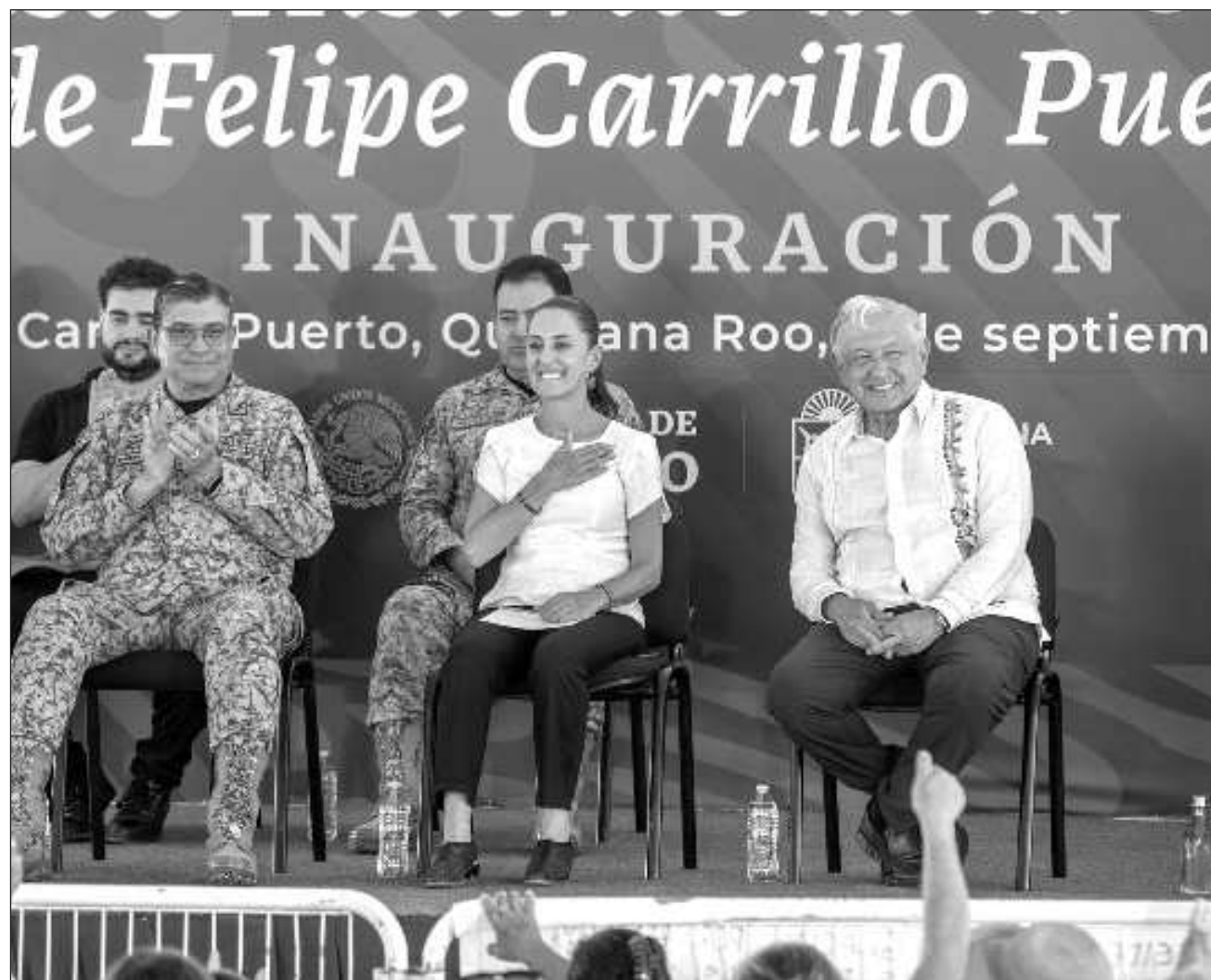
▲ En compañía de la mandataria electa, Claudia Sheinbaum, el presidente Andrés Manuel López Obrador agradeció al pueblo maya todo el apoyo que le dio a la causa de la cuarta transformación.

El sábado 7 los mandatarios participaron en la inauguración del Parque del Jaguar y el Museo de la Costa Oriental, en Tulum. El primero, un área de más de mil hec-