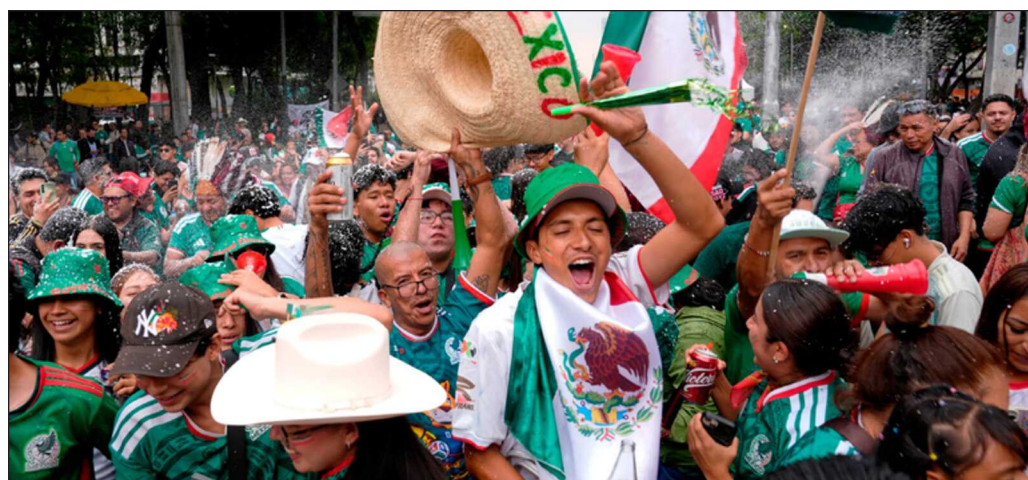
▲ Aparte de las imágenes de abrazos e intercambios de playeras, los festejos han sido relevantes para mostrar hasta dónde llega la previsión de las autoridades y las debilidades en materia de protección civil.

Sin embargo, los festejos, especialmente en la avenida Reforma de la Ciudad de México, también dejaron víctimas fatales. Precisamente ahí es donde quedó de manifiesto la falta de preparación de las autoridades de la capital del país, más ocupadas en ajolotizar que en prevenir una tragedia. Los cuatro decesos ocurridos tras la victoria contra Ecuador no fueron fortuitos. Ya se había decretado la "ley seca" precisamente para inhibir conductas de riesgo, pero por sí sola, la medida resultó insuficiente ante la concentración de más de un millón de personas en la vía. Es momento de analizar qué falló, porque se tuvo mucho tiempo para diseñar los protocolos.