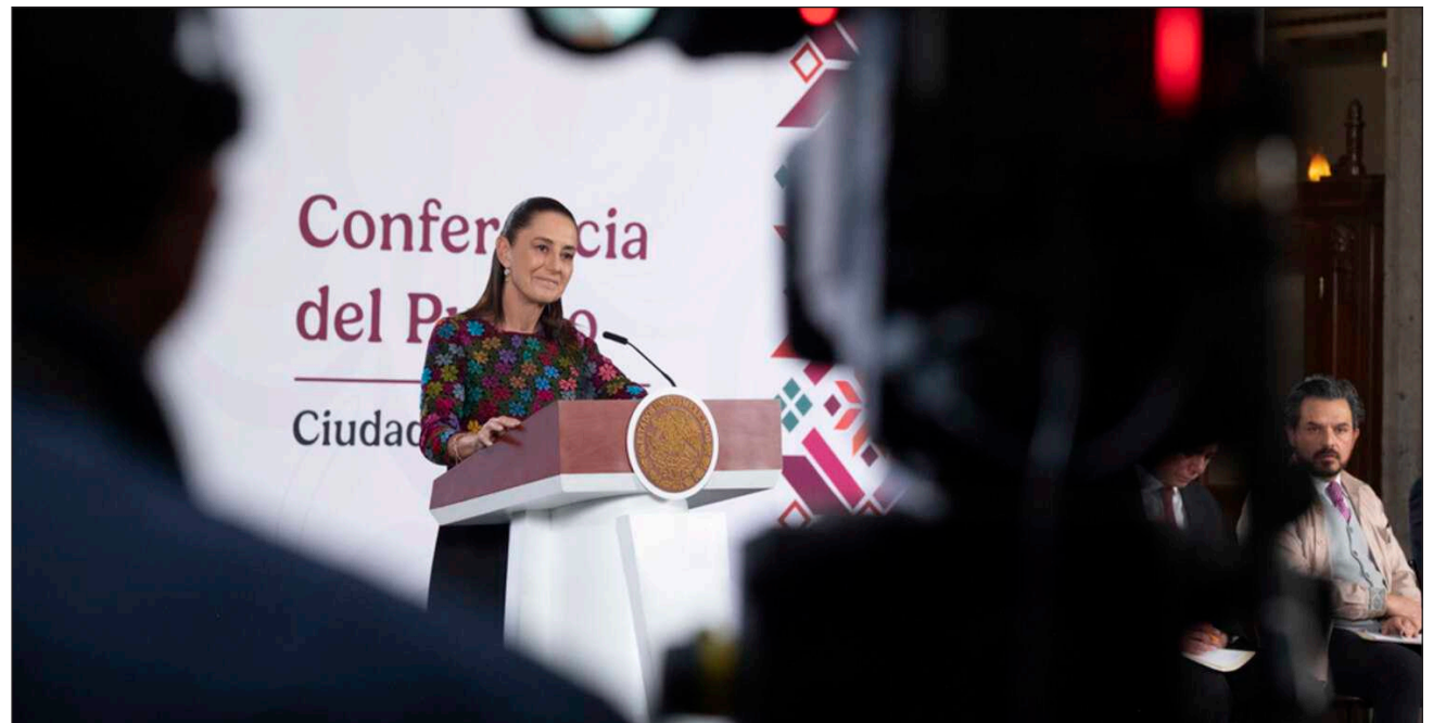
▲ Destaca que el intercambio comercial entre México y Estados Unidos alcanzó 839 mmd, cifra histórica.

-México, primer lugar entre los países de la OCDE con mayores incrementos a los salarios reales desde 2018.