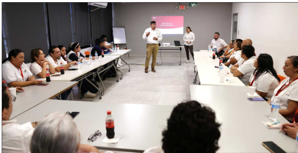
▲ El modelo impulsado por la empresa Kekén no solo beneficia a los colaboradores, sino también a sus familias, al brindar estabilidad y mejores oportunidades de vida.

Asimismo, resaltó que el modelo impulsado por Kekén no solo beneficia a los colaboradores, sino también a sus familias, al brindar estabilidad y mejores oportunidades de vida, ya que la posibilidad de acceder a un trabajo, un sueldo y seguridad representa un cambio significativo para jóvenes con alguna con-