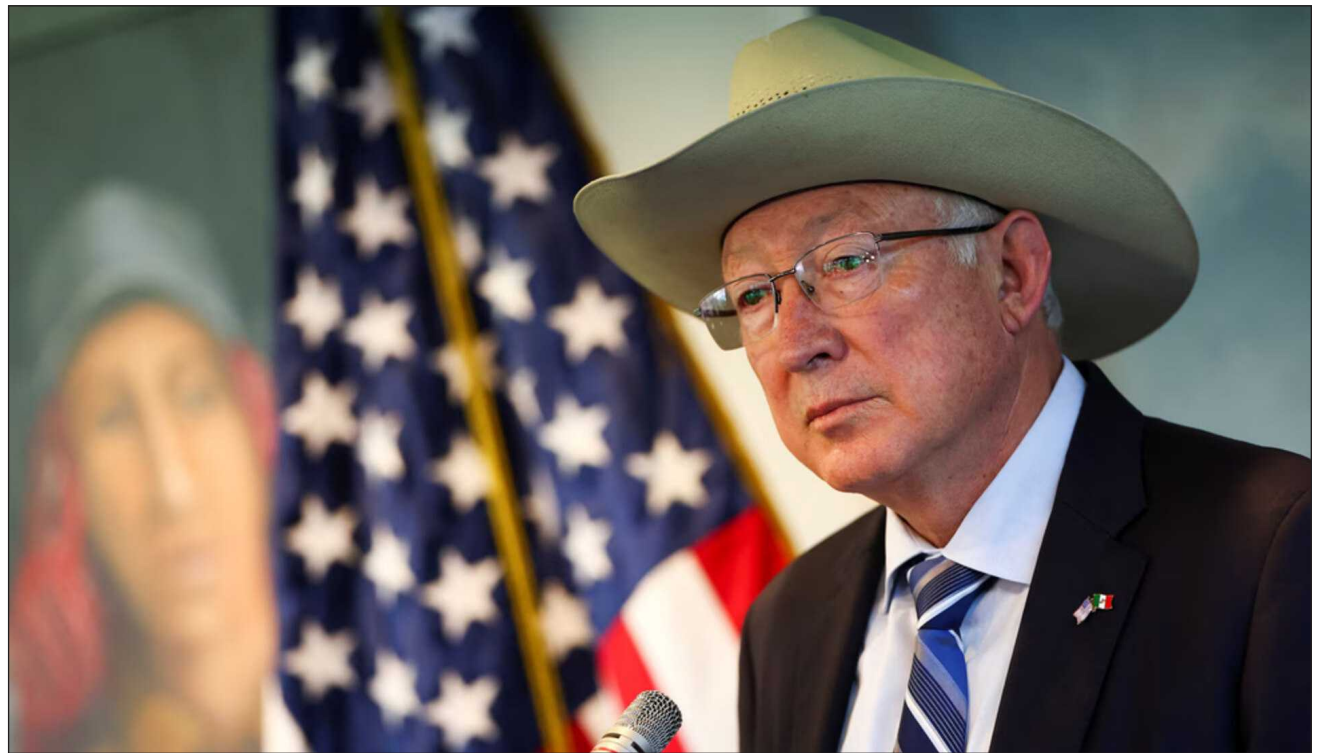
▲ “¿Qué argumentos adicionales podemos dar, aparte de la declaración de Ken Salazar?”, sentenció la Presidenta.

La presidenta Claudia Sheinbaum Pardo resaltó que en una reciente entrevista el ex embajador de México en Estados Unidos, Ken Salazar, reconoce que “no había ningún vínculo” del gobierno del presidente Andrés Manuel López Obrador con el cártel de Sinaloa, después de que “se le mintió al gobierno de México” sobre la participación de agentes estadounidenses en el operativo para detener a Ismael El Mayo Zambada.