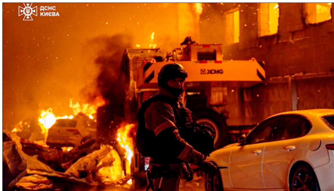
▲ Poco después de la medianoche se escuchó una primera gran explosión en la ciudad de Kiev, incluso antes de que sonaran las sirenas de alerta aérea, un fallo inusual en el sistema que alarmó a los residentes.

Le siguieron varias explosiones más, según periodistas de la Afp en la ciudad.