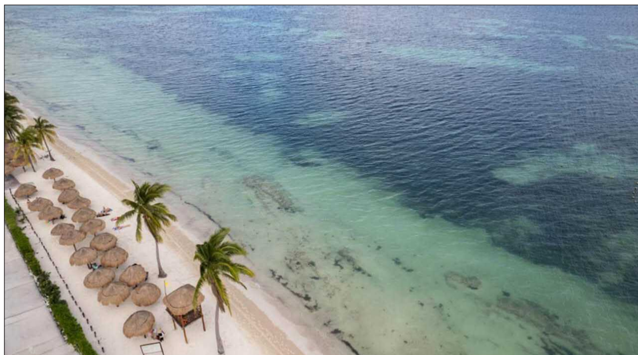
▲ De acuerdo con las proyecciones realizadas para los principales centros turísticos del país, en el periodo vacacional de verano, que comprenderá del 20 de julio al 30 de agosto, se prevé la llegada de 22.4 millones de turistas a hoteles.

Rodríguez Zamora dio a conocer en un comunicado difundido por Sectur que, entre los principales centros turísticos del país, Cancún registrará la mayor ocupación hotelera durante el periodo vacacional, con 67.9 por ciento, seguido de Puerto Vallarta, con 64.4 por ciento;