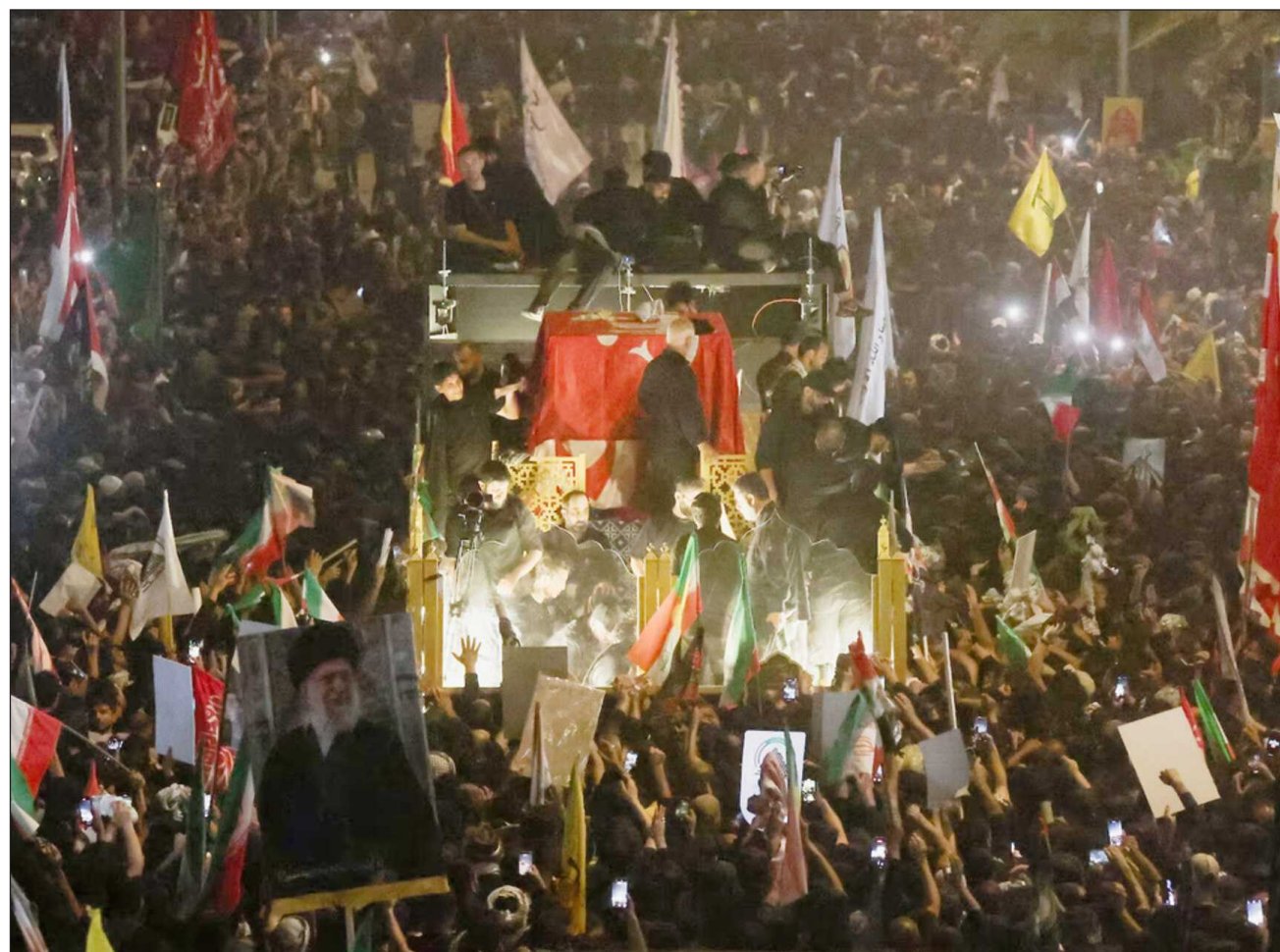
▲ Las autoridades iraquíes declararon feriado el miércoles y anunciaron un amplio dispositivo de seguridad.

El cortejo en Nayaf (norte) se realizó en medio de un nuevo estallido en el conflicto entre Irán y Estados Unidos. Washington anunció haber bom-