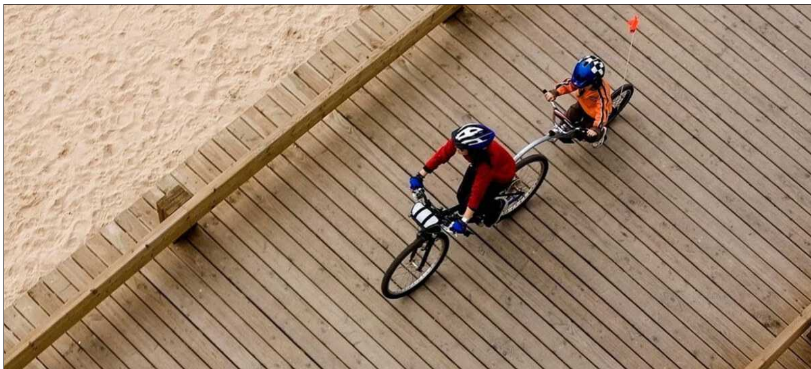
▲ "A veces pasamos la vida buscando el reconocimiento de quienes amamos (...) quizá la vocación sea, en el fondo, el lento aprendizaje de distinguir, entre todas las voces que nos habitan, aquella que expresa verdaderamente nuestro propio deseo".