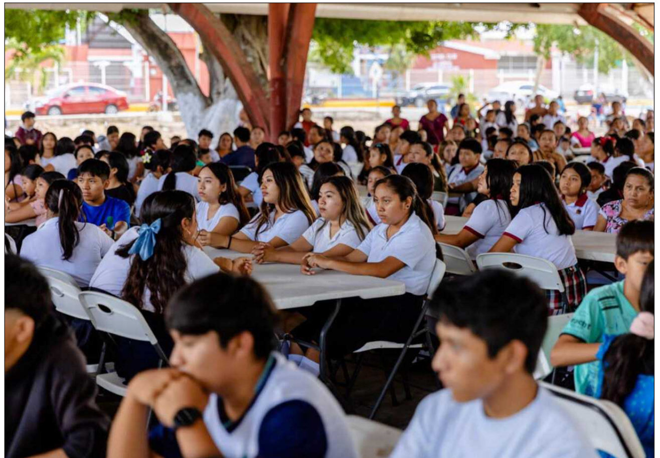
▲ Durante el ciclo escolar pasado se registró una matrícula cercana a los 11 mil alumnos entre los diferentes niveles educativos, mientras que para el próximo periodo se estima alcanzar entre 13 mil y 15 mil estudiantes.

Explicó que durante el ciclo escolar pasado se registró una matrícula cercana a los 11 mil alumnos entre los diferentes niveles educativos, mientras que para el próximo periodo se