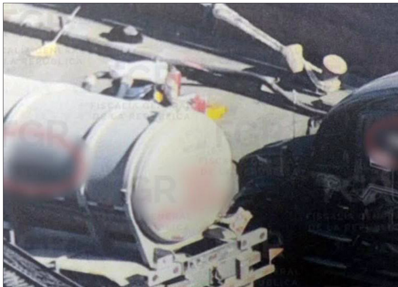
▲ La FGR destacó que el esquema de huachicol ferroviario se diferencia del “robo de combustible mediante tomas clandestinas porque opera a través de complejas redes de empresas fachada, importadores, operadores logísticos”.

“En este esquema participan empresas importadoras, agentes aduanales, empresas destinatarias del combustible, operadores ferroviarios y empresas encargadas de la dispersión financiera de los recursos, todos ellos integrados para fragmentar la trazabilidad de la operación y aparentar que