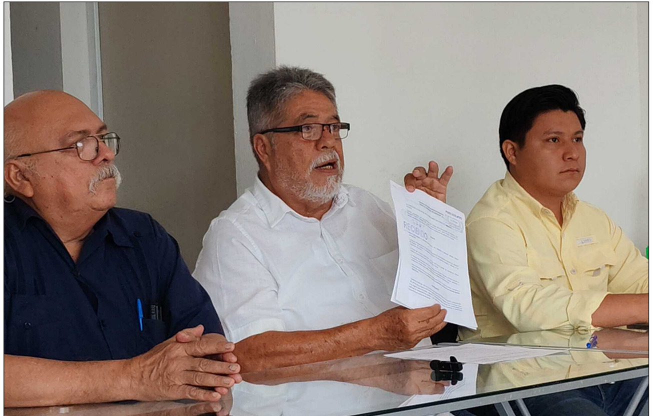
▲ De acuerdo con los juristas, durante el actual gobierno ya se habían presentado carencias pero en los últimos meses, con la llegada de Juan Pedro Alcudia a la presidencia del Tribunal Superior se han acrecentado los problemas.

Piden realizar un diagnóstico de necesidades materia-