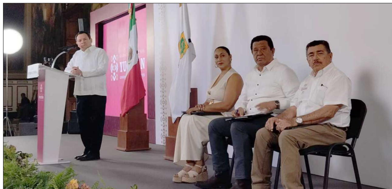
▲ El gobernador Joaquín Díaz Mena especificó que en los encuentros se podrán brindar propuestas enfocadas en tres ejes principales: agua potable, red metropolitana de vialidades seguras e infraestructura de seguridad.

Lunes 13 de julio en el norte, en el Insituto Tecnológico de Mérida; martes 14 de julio, zona sur en la Universidad Tecnológica Metropolitana; miércoles 15 de julio, zona oriente, Universidad