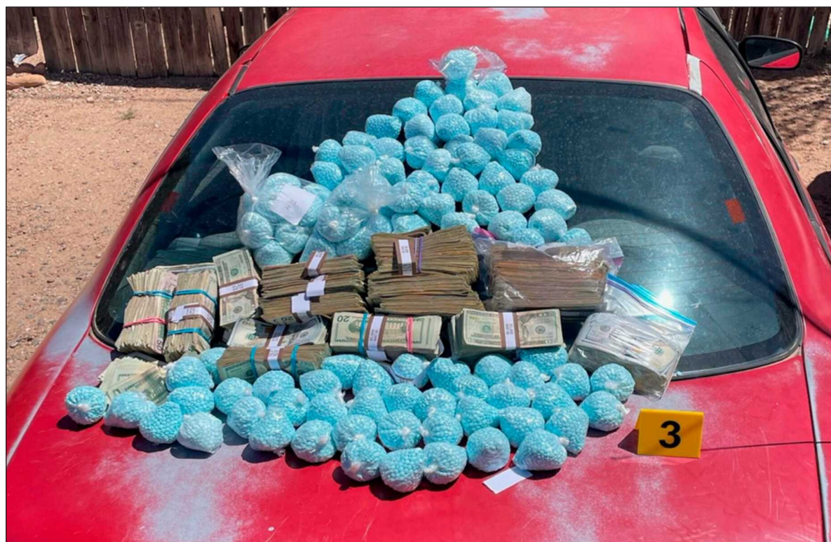
▲ “En Italia ‘desaparecieron’ 80 dosis de fentanilo de la caja fuerte del Hospital Israelita (...) Algunos descartan a los grupos mafiosos italianos ya que según dicha versión no permiten actualmente la propagación del fentanilo”.

A lo largo de dos meses, añade Ap , “el equipo de investigación revisó cientos de documentos gubernamentales y entrevistó a decenas de expertos para revelar la modificación secreta de los «protocolos sobre el fentanilo» del Departamento de Justicia, la cual otorgaba a los agentes discrecionalidad para no incautar una droga altamente letal. La exclusiva, publicada el 22 de junio, tuvo un impacto sísmico inmediato, despertando el interés de la audiencia en las plataformas de APNews y generando numerosas apariciones en medios audiovisuales. La primicia motivó una investigación