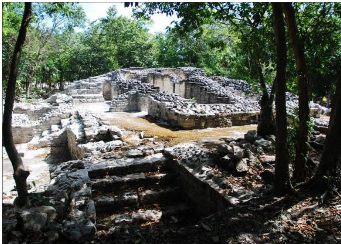
▲ Quienes visiten la zona arqueológica de Xel Há ahora pueden conocer dos nuevos museos creados en el marco de las obras del Tren Maya: el Regional de la Costa Oriental de Tulum y el Histórico de la Ciudad de Felipe Carrillo Puerto.

Los horarios de operación son de lunes a do-