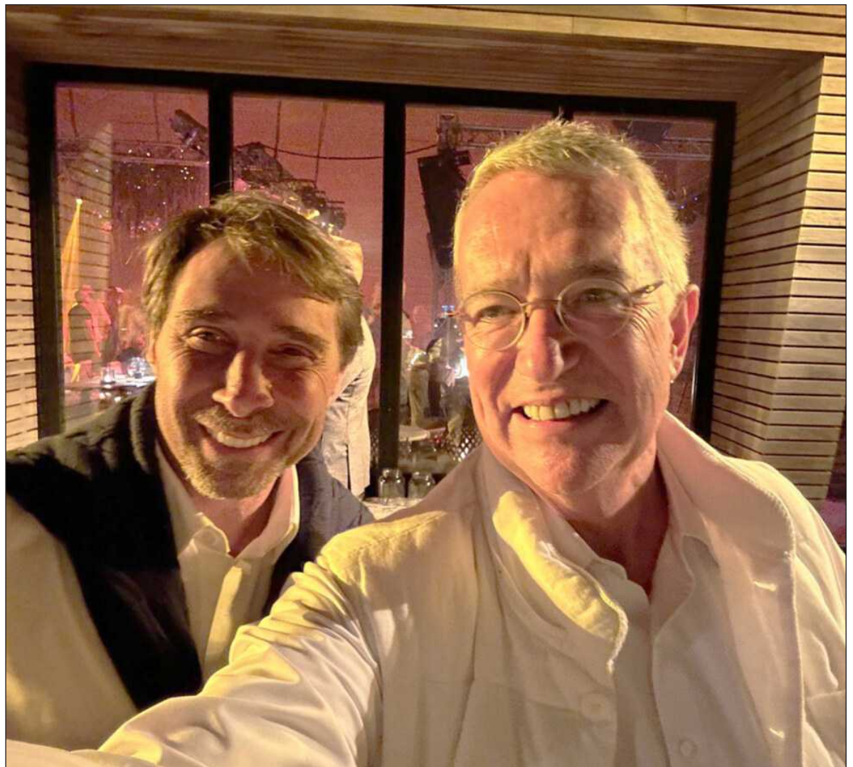
▲ “En redes circulan fotos del comunicador de marras, Feinmann, con el empresario mexicano Ricardo Salinas Pliego”.