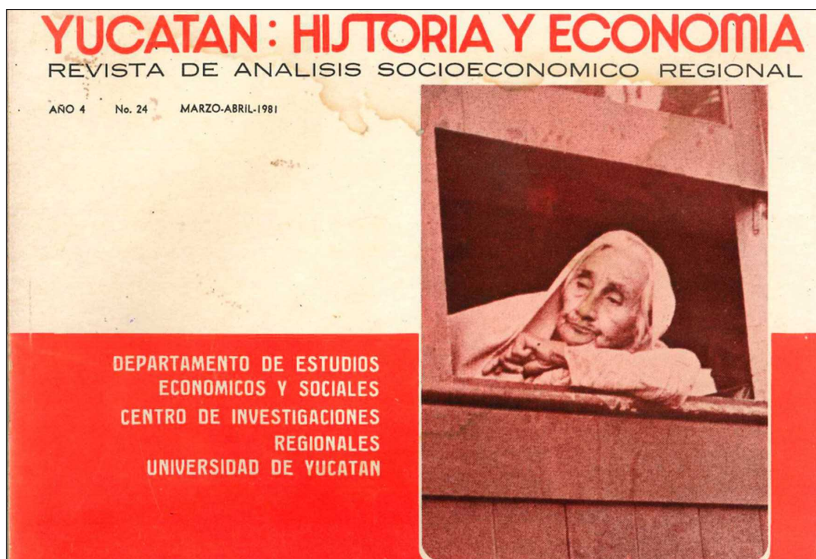
▲ “El primer número de Yucatán: Historia y Economía. Revista de Análisis Socioeconómico Regional , fechado en el bimestre mayo-junio. Sus ediciones se extendieron hasta 1983, reanudándose en 1986 con una entrega más”. Foto Facsímil