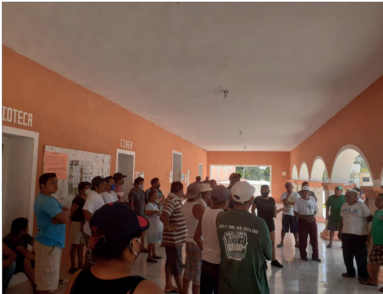
▲ Los habitantes de Tinum dependen económicamente del turismo que llega a Chichén Itzá, pero desde que fue cerrado el sitio arqueológico, varias familias se han quedado sin ingresos.