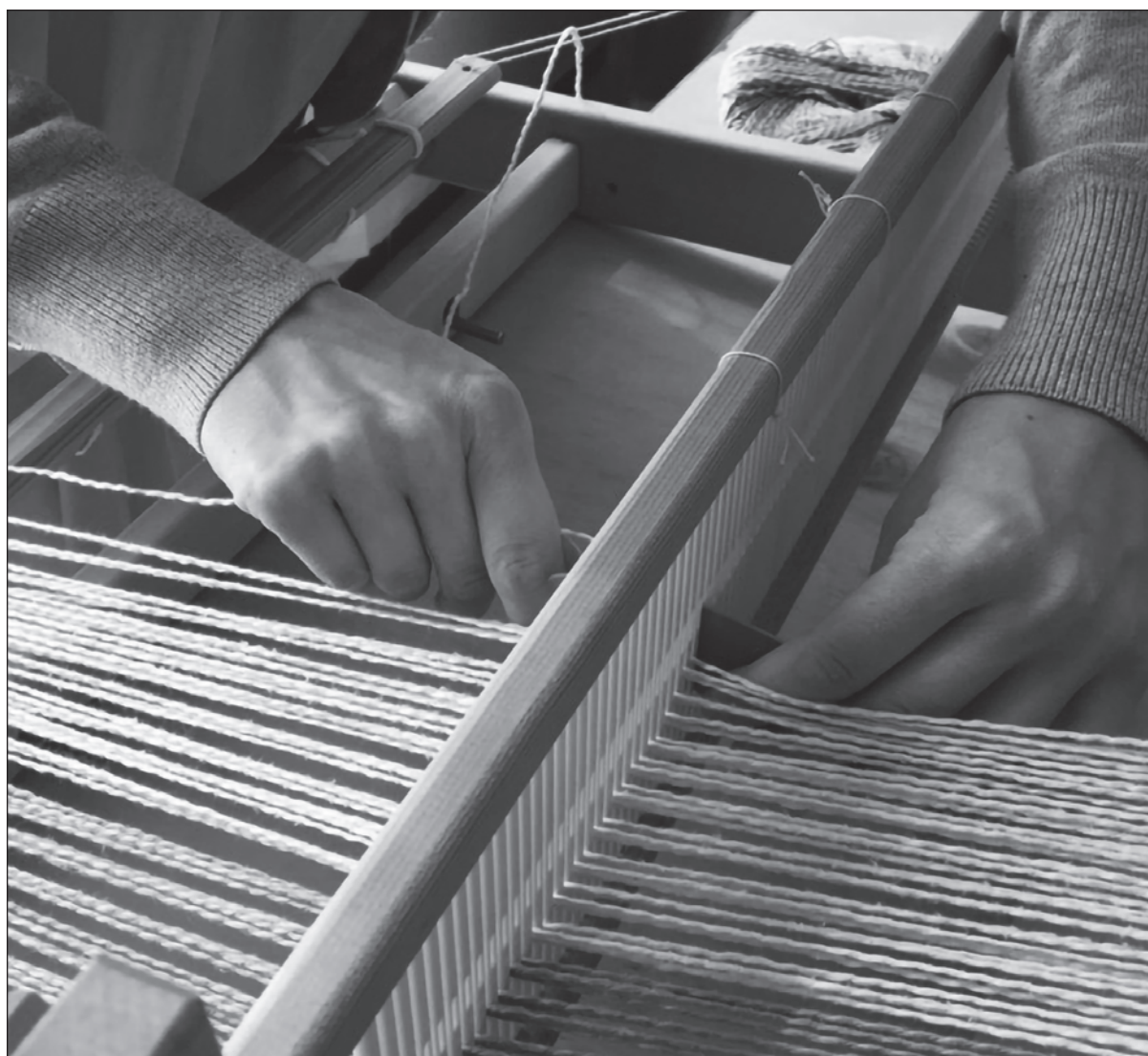
▲ Los trabajos de Cecilia Martínez Lusarreta han alcanzado exposiciones y premios internacionales con textiles sublimes.

MIRAR LOS LIENZOS de Cecilia es arrojarse con esta destreza ancestral que es entrelazar hilos. El origen de su uso fue seguramente con fines de protección de la especie ante las inclemencias de la naturaleza. Esa práctica cultural que perdura en el tiempo es lo que la lleva en algunas manos a su condición máxima: el arte. Sus trabajos han alcanzado exposiciones y premios internacionales con textiles sublimes.