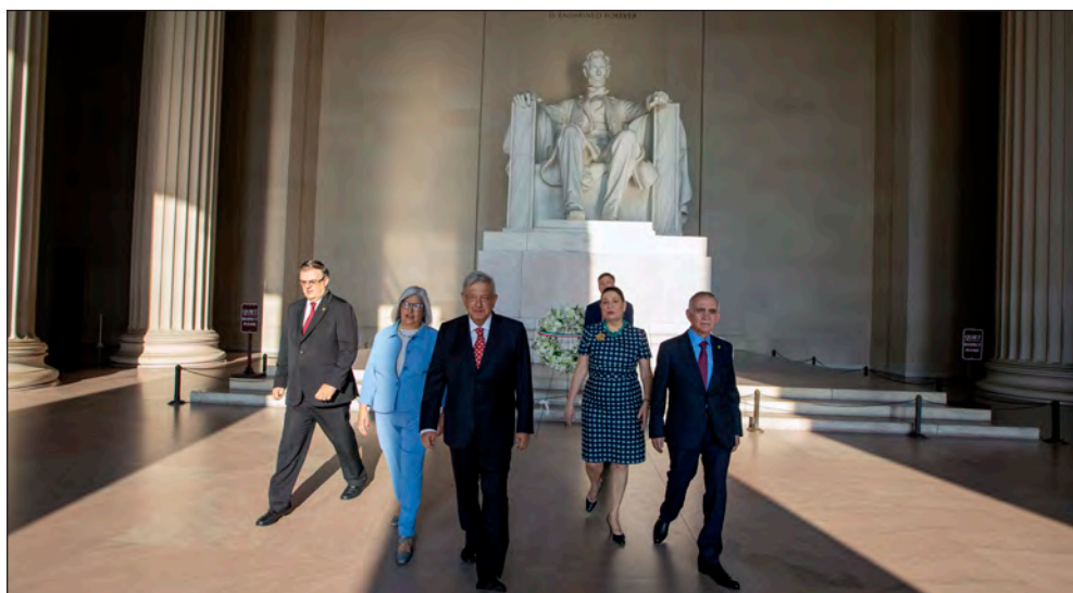
▲ La pieza oratoria de AMLO fue sinuosa, un torrente buscando una grieta a través de la cual se podrá romper un muro. Falta ver si halló oídos atentos.

No fue el poema A Roosevelt, de Rubén Darío. No fue con voz de la Biblia o verso de Walt Whitman que pretendió llegar al cazador/negociador; sí le habló a esa América que en Estados Unidos vive. Y sueña. Y ama, y vibra; y es la hija del Sol.