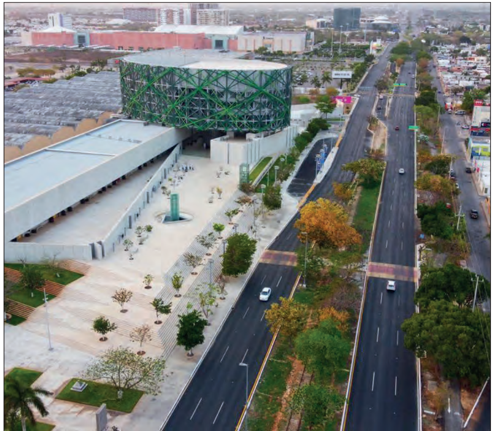
▲ El Gran Museo del Mundo Maya, inaugurado en el 2012 por la entonces gobernadora Ivonne Ortega, ha resultado una fuerte carga económica para el estado.

En nombre de los integrantes de la fracción priísta, la diputada Janice Escobedo Salazar entregó al presidente de la Comisión, Víctor Merari Sánchez Roca, un documento donde solicitaron se les haga llegar el anteproyecto del convenio modificatorio para la terminación anticipada del contrato para la prestación de servicios del Gran Museo del Mundo Maya de Mérida con la Promotora de Cultura Yaxché y también el documento donde se acredite en qué consistiría el compromiso financiero del Gobierno del estado en ese acto modificatorio.