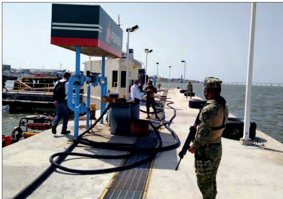
▲ El operativo derivó de denuncias anónimas, recibidas por el Gabinete de Seguridad Nacional.

Posteriormente fue inmovilizado un dispensario de la estación de servicio terrestre; quedó la clausura temporal total de la estación marítima y terrestre, pre-