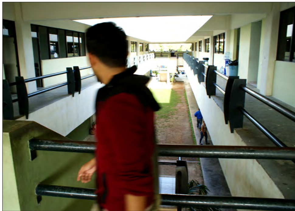
▲ El panorama educativo podría complicarse todavía más con la emergencia sanitaria.

Conajo solicita que haya un etiquetado en el presupuesto específico destinado a resolver los problemas de la educación, en relación al equipo y todo lo necesario para los estudiantes y no pierdan el ciclo escolar, y si se aprueba la deuda