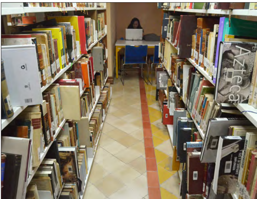
Esta iniciativa tiene como objetivo brindarles herramientas a los universitarios para que continúen con sus estudios.

*El papel arde a los 233 grados centígrados, tal como lo hace en la inmortal novela de Ray Bradbury, Fahrenheit 451.