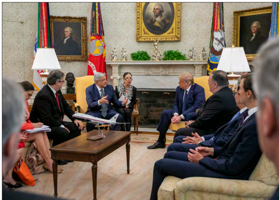
▲ López Obrador y Donald Trump apabarron su cooperación, su respeto mutuo y enfatizaron que el T-Mec generará empleo y prosperidad.

Después de los actos protocolares, López Obrador se dirigió a la Embajada de México, donde permanecerá hasta pasado el mediodía, cuando será recibido en la Casa Blanca por el pre-