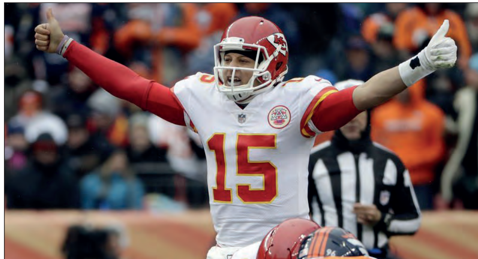
▲ Patrick Mahomes ya hizo historia en la NFL con galardones y un anillo de campeón y apenas tiene 24 años de edad.

“Así es como he actuado siempre. He seguido mis pasiones y he hecho lo mejor para mi familia”, dijo el quarterback de los Jefes, durante una videollamada realizada el martes. “Para mí, esto jamás se ha relacionado sólo