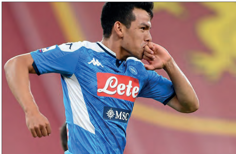
▲ Hirving Lozano le dio los tres puntos ayer al Napoli.

Lozano, de 1.76 metros, se convirtió hace un año en el jugador más caro en la historia del Napoli, que