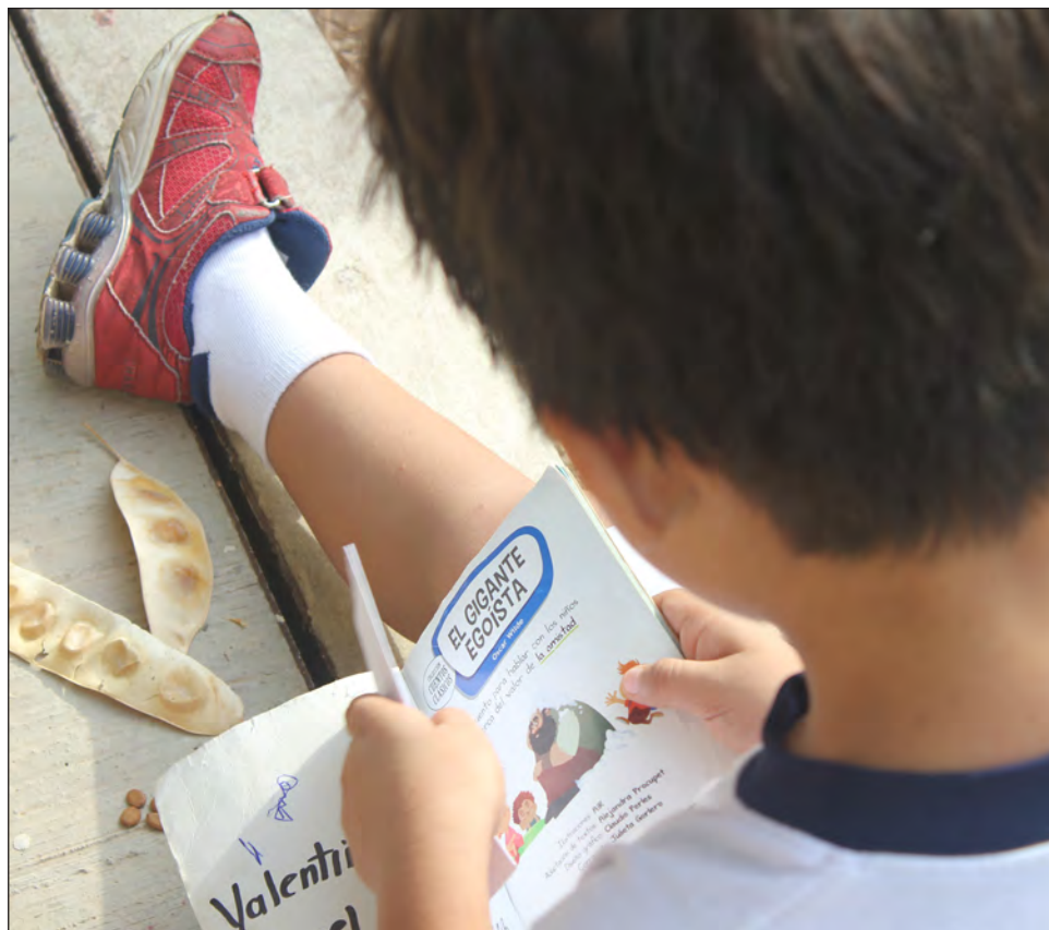
Las editoriales trabajan directamente con las escuelas y son ellas quienes escogen con qué plataforma desean trabajar.

Aseguró que los docentes, incluso los de mayor edad, han hecho un esfuerzo por adaptarse a estas novedades. Las editoriales trabajan directamente con las escuelas y son ellas quienes