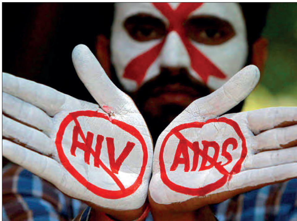
▲ El VIH ha infectado a más de 75 millones de personas y ha causado la muerte de casi 33 millones desde que comenzó la epidemia del sida, en los años 80.

Advirtió, sin embargo, que otros cuatro pacientes VIH positivo tratados