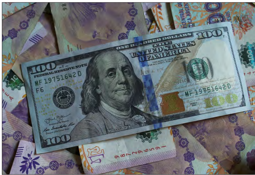
▲ Las pérdidas económicas en el mundo sumarán entre 2020 y 2021, más de 12 billones de dólares, lo que equivale a las economías de Japón, Alemania, Italia y España.

Y en este entorno los países en desarrollo resentirán