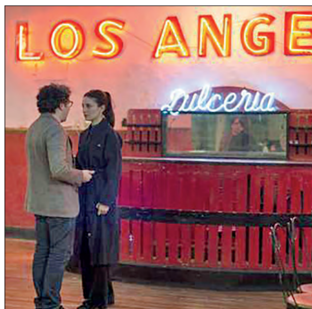
▲ El director de orquesta Gustavo Dudamel, junto con su esposa, la actriz española María Valverde, festejó en Los Ángeles el 15 de noviembre de 2019, luego de encabezar un concierto en el Auditorio Nacional.

Tel.: 999-930-3050 Ext.45007 o consulta en www.salud.yucatan.gob.mx .