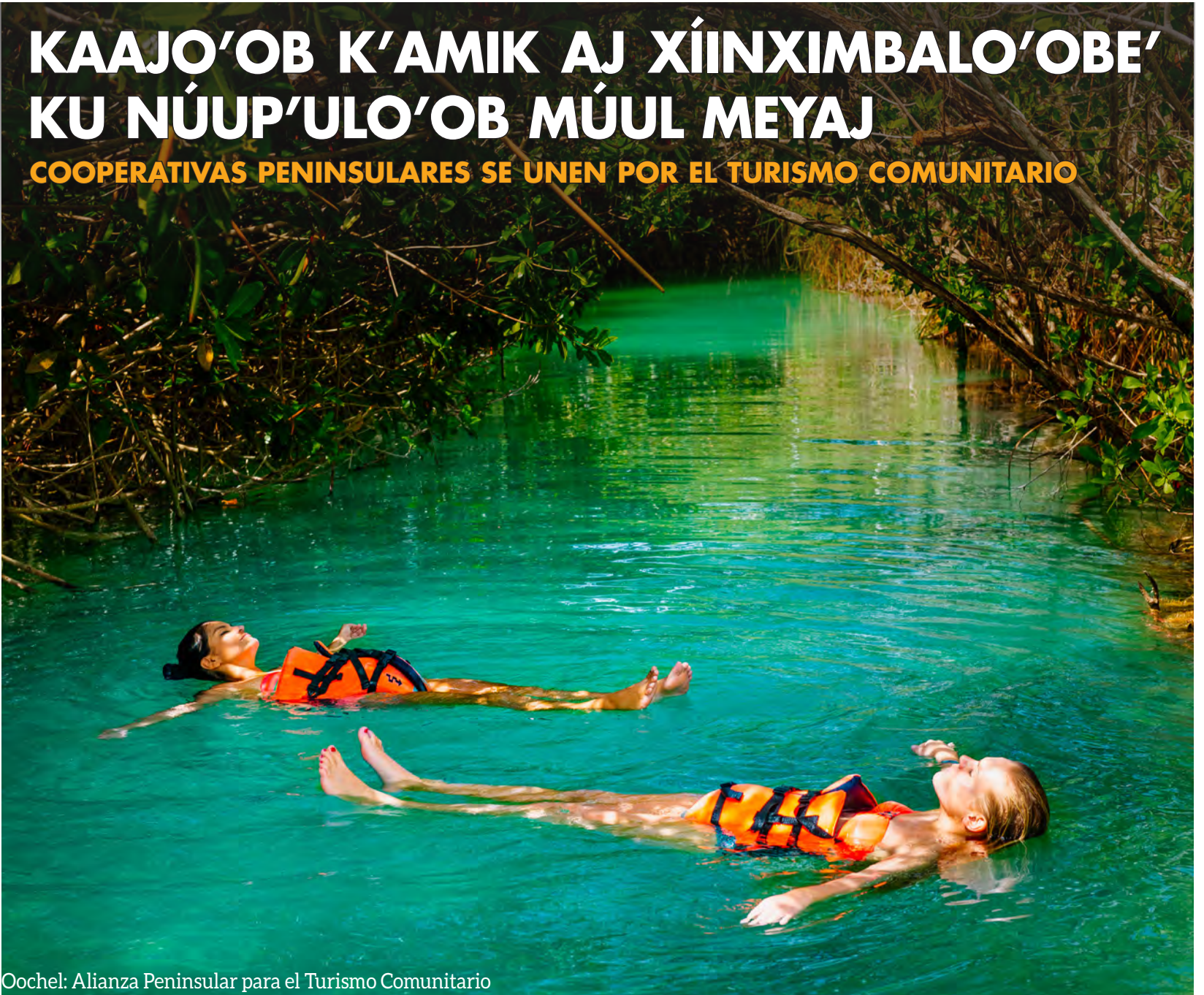
Oochel: Alianza Peninsular para el Turismo Comunitario

COOPERATIVAS PENINSULARES SE UNEN POR EL TURISMO COMUNITARIO