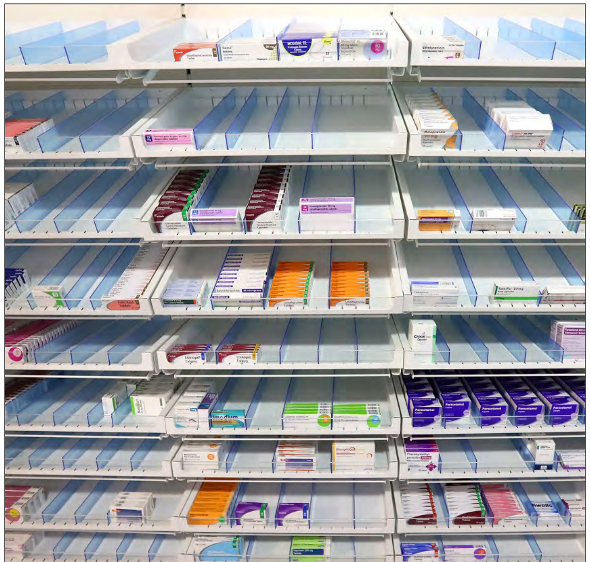
▲ En 2020, las 10 farmacéuticas con mayores activos en el mundo tendrán ingresos por 1.43 mil millones de dólares, un crecimiento del 28.8 por ciento, sin considerar la pandemia.

EL GOBIERNO MEXICANO ha hecho énfasis en las medidas de prevención de contagios de COVID 19 para evitar la saturación de hospitales. México tiene más de 127 millones de habitantes.