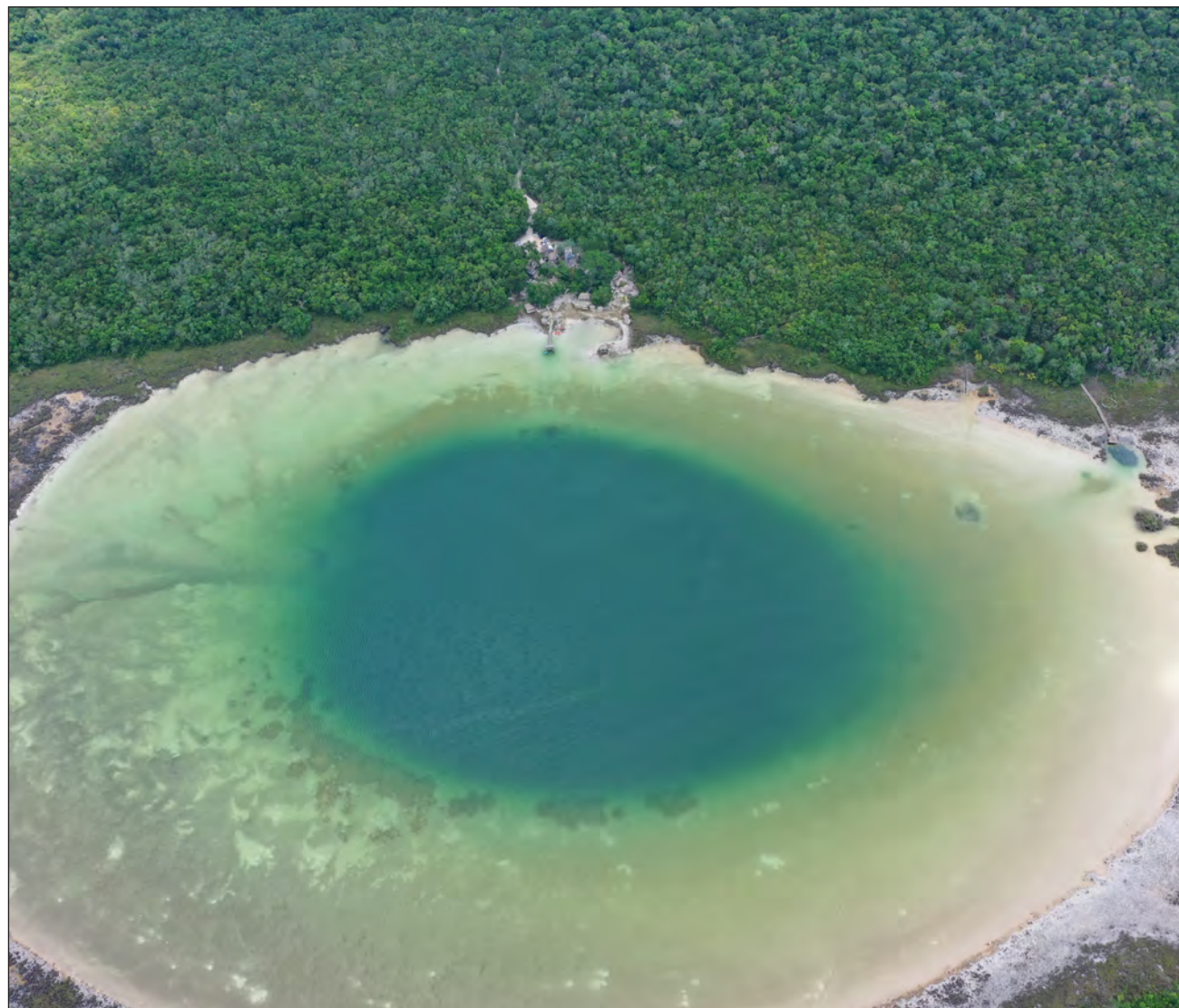
▲ Este año, el turismo busca experiencias más cercanas a la naturaleza y a la cultura.

El turismo de naturaleza es una de esas experiencias donde se podrán encontrar recorridos en los canales de la Reserva de la Biosfera de Sian Ka'an, en Quintana Roo; paseos en lancha por las costas de Campeche a lado de delfines, flamencos e islas desiertas; nado en las refrescantes aguas de los cenotes de Yucatán y la posibilidad de conocer de cerca a los cocodrilos, monos saraguatos y aves de la región.