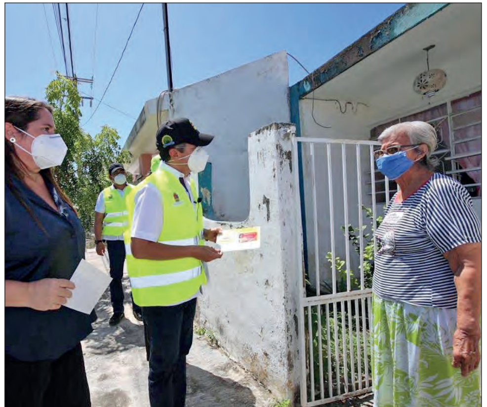
▲ Carlos Joaquín estuvo en la colonia Santa María, donde el Grupo Salinas entregó 560 monederos electrónicos con un valor de 300 pesos cada uno.

Carlos Joaquín estuvo en la colonia Santa María, donde el Grupo Salinas entregó 560 tarjetas, monederos electró-