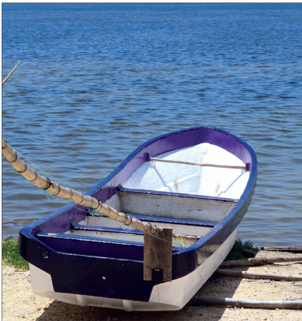
▲ La dueña del predio argumenta que las embarcaciones invadían su propiedad.

En abril de 2019, la Cámara de Diputados del Congreso de la Unión aprobó una iniciativa que prohíbe la existencia de playas privadas en nuestro país, ya que se trata de un bien nacional.