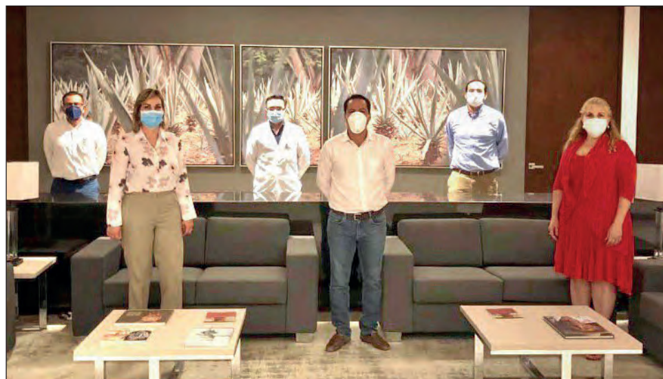
▲ En reunión con funcionarios federales del sector Salud, el gobernador Mauricio Vila reiteró la disposición de su gobierno de apoyar a hospitales del gobierno federal, sean del IMSS o el ISSSTE.

Al respecto, el gobernador agradeció, una vez más, la disposición del director general del IMSS para escuchar las peticiones de los yucatecos y trabajar en soluciones que se traduzcan en una mejor atención médica, así como para seguir colaborando con el gobierno del estado.