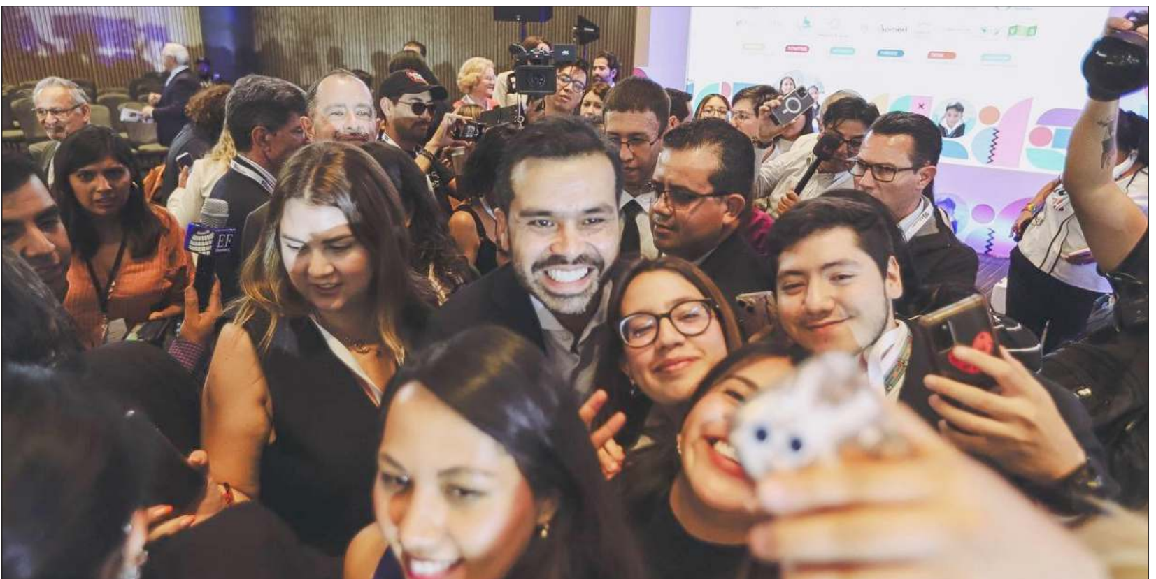
▲ “Hago responsable a Xóchitl Gálvez de estos actos de provocación que están organizando desde su coordinación de campaña”, declaró el candidato de MC.

Lo intentaron en Morelia e hicieron el ridículo. Y ahora insisten. Ten dignidad; yo siempre he sido respetuoso contigo. Acepta que ya te rebasé”.