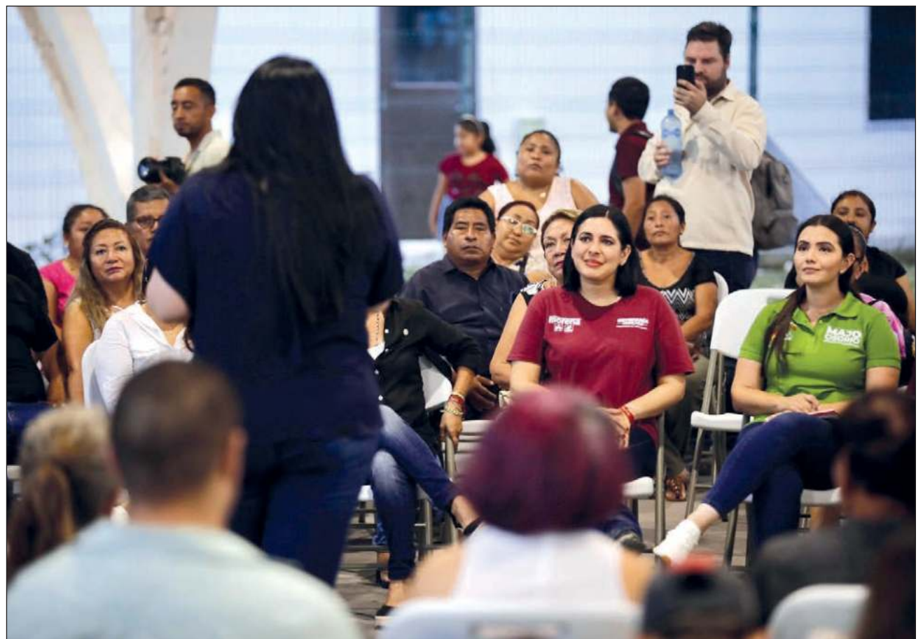
▲ Monitoreo integral, recuperar casetas y prevención del delito: las propuestas de la candidata.

Al terminar su caminata, encabezó el cuarto foro Diálogos por la Transformación , realizado en la colonia La Guadalupana, donde dijo que, en la próxima administración, se duplicará el presupuesto en seguridad, uno de los rubros prioritarios de su gobierno. Aseguró que su gobierno va a mejorar las condiciones laborales de las y los policías, que hoy no