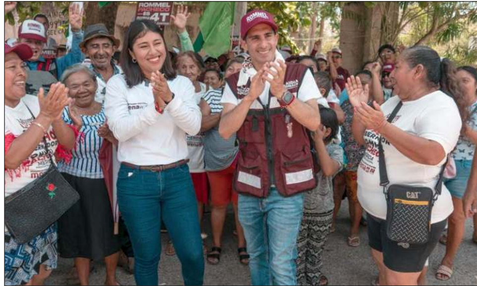
▲ El candidato de Morena, PT y PVEM saludó a los vecinos de la colonia Plan de Ayala Sur y escuchó sus principales demandas y preocupaciones.

Recordó el compromiso de Claudia Sheinbaum con el