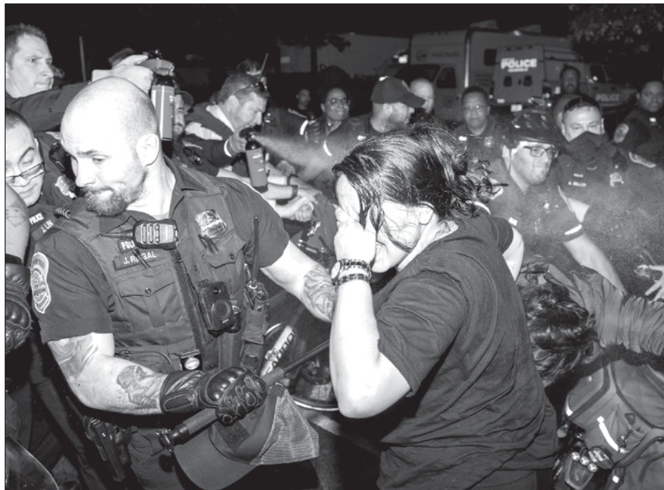
▲ Los agentes usaron gas pimienta y arrestaron a un grupo de manifestantes.

El departamento de policía declaró en un comuni-