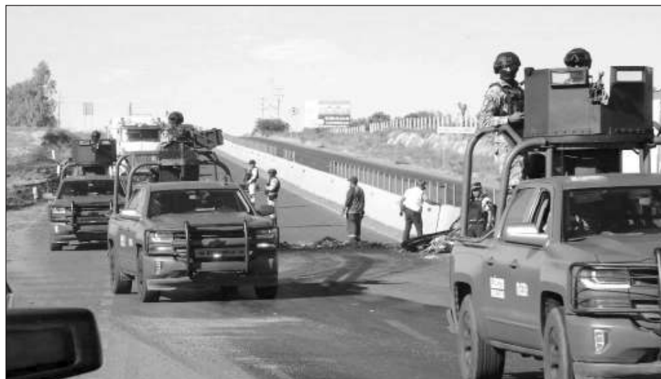
▲ Con estas nueve personas ejecutadas el miércoles, suman 25 personas asesinadas por miembros del cártel de Sinaloa, en respuesta al enfrentamiento con policías donde murió El Gordo .

La madrugada de este día, un comando de hombres fuertemente armados arribaron a bordo de varias camionetas a la cabecera municipal de Morelos -ubicada 10 kilómetros al norte de la capital de Zacatecas- y bajaron a nueve hombres maniatados y envueltos en