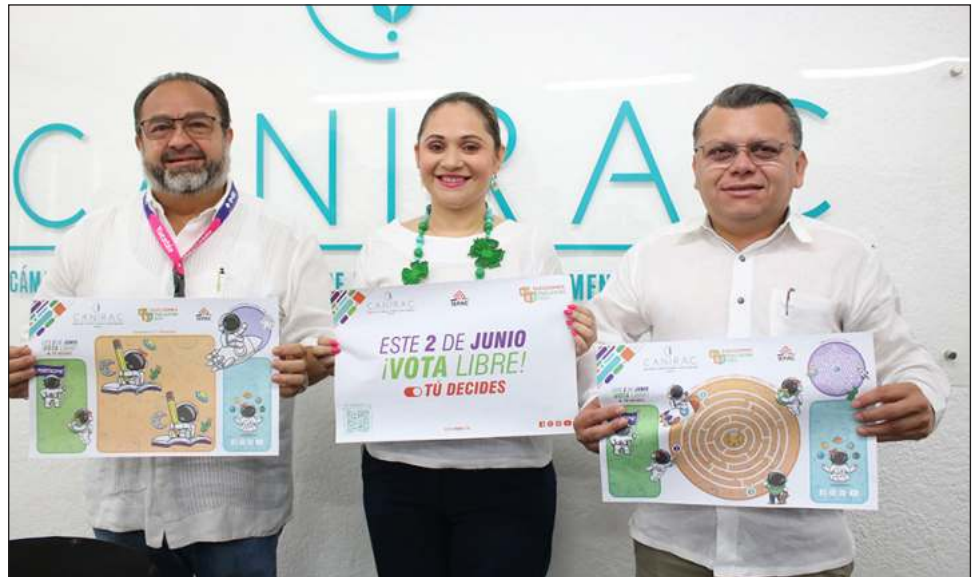
▲ Una de los incentivos de la Canirac en conjunto con los restaurantes es el café gratis, o, en su defecto, algún otro producto que se incluya en cada menú, así como distintas ofertas o descuentos.

“Esta es una muestra más del compromiso de nuestra industria con el bienestar de