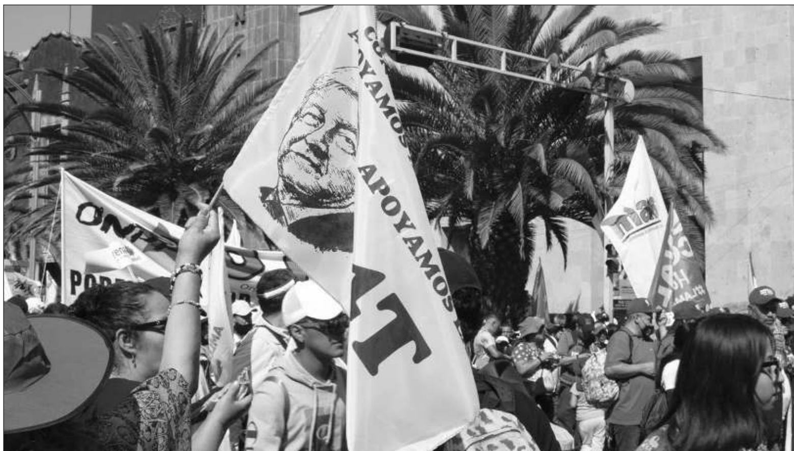
▲ “La popularidad de Andrés Manuel López Obrador es cercana a 70 por ciento, Bloomberg destaca que su gobierno deja una economía sólida con moneda fuerte, disminución del desempleo, ganancias en la bolsa, y programas sociales que alivian el impacto de la inflación que afecta al mundo”.