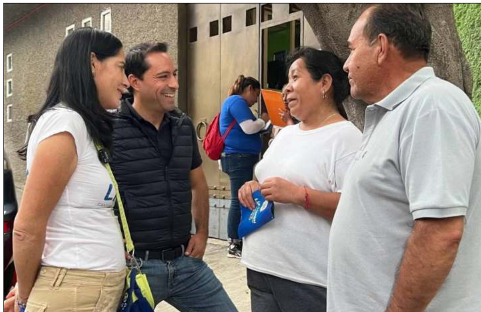
▲ El gobernador con licencia realizó visita a la alcaldía Álvaro Obregón.

Junto con Lía Limón, candidata del PAN a la titularidad de esta alcaldía, Vila Dosal realizó un recorrido por la colonia Herón Proal de esta demarcación, en donde recordó a vecinos que los Gobiernos emanados de Acción Nacional si saben dar resultados y como ejemplo citó que en los últimos años Yucatán se ha consolidado como el estado más seguro del país, con desarrollo económico, crecimiento