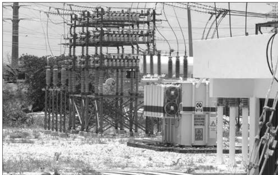
▲ En el primer mes de 2024, los estados que presentaron los ascensos más significativos en su producción industrial fueron: Q. Roo, Campeche, Oaxaca y SLP.

En el caso de generación, transmisión, distribución y comercialización de energía