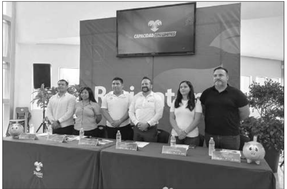
▲ Buscan recolectar nueve toneladas de PET, aluminio, tapas y tetrapack.

Los talleres ofrecidos abarcan una amplia gama de temas, desde repostería hasta taekwondo, pasando por inglés, corte y confección, entre otros. Cada CDC tiene una variedad única de cursos disponibles.