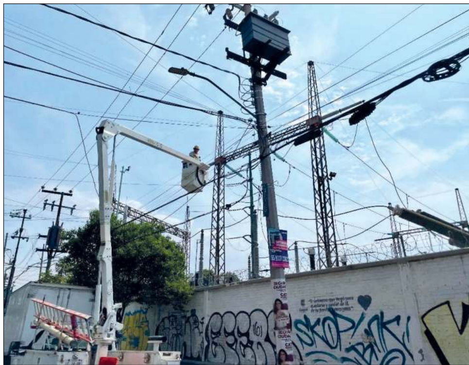
▲ El Centro Nacional de Control de Energía tuvo que implementar acciones operativas, por lo que se registraron apagones en más de 11 estados del país.

Según información del organismo descentralizado de la Secretaría de Energía (Sener) hasta las 16 horas del