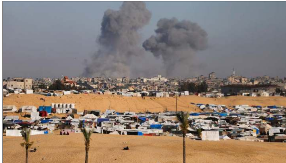
▲ El Departamento de Estado aún no tiene listo el informe con su conclusión sobre si Israel ha violado o no el derecho internacional humanitario en la Franja de Gaza.

Este era un paso que desde hace meses reclamaban a Bi-