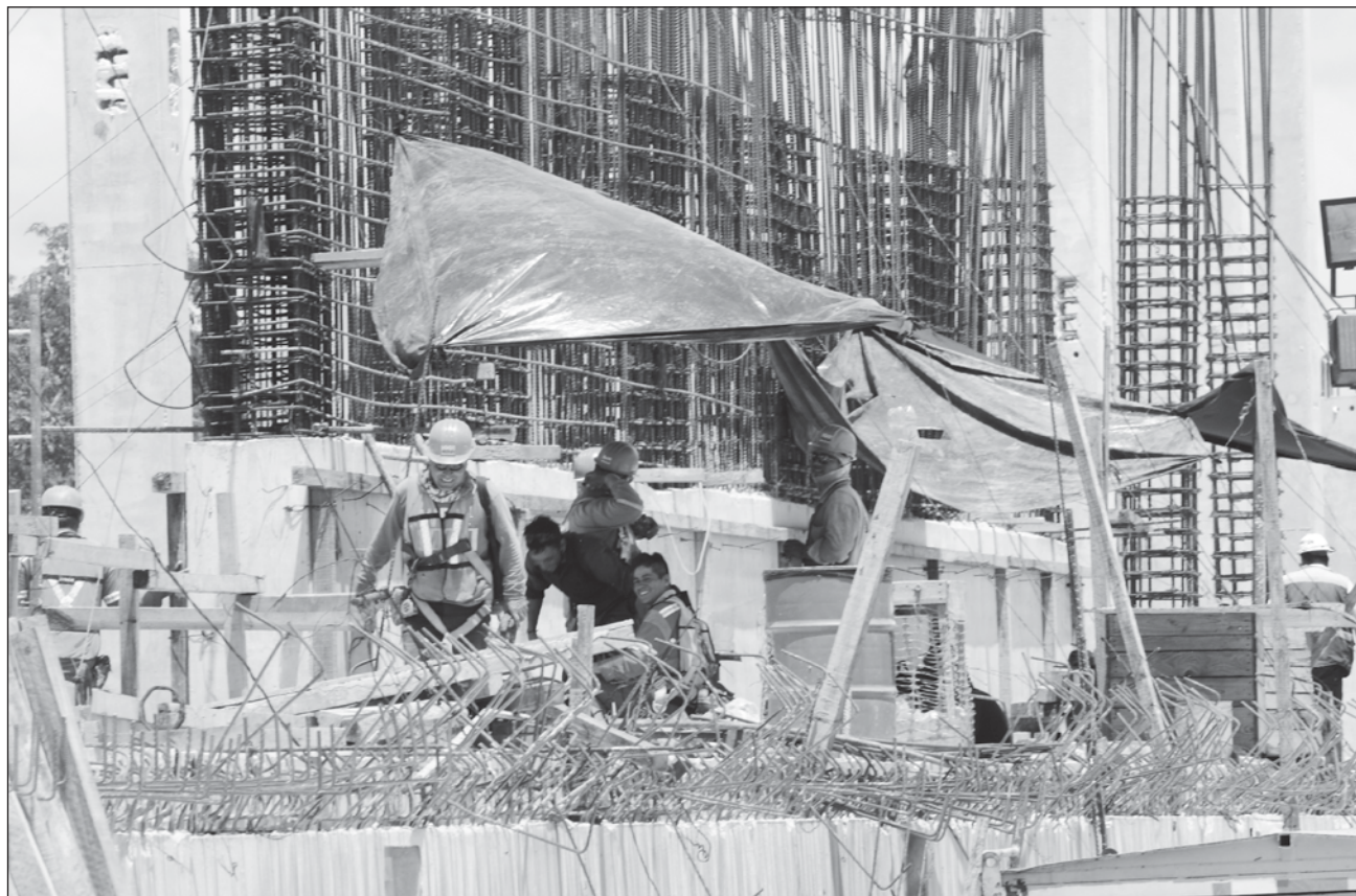
▲ La confederación llamó a las organizaciones de comerciantes y vendedores ambulantes, así como a quienes trabajan por su cuenta, a sumarse a este organismo, para contar con el beneficio de la seguridad social, que ofrecen.

Explicó que en el nuevo modelo de sindicalismo mexicano no hay cabida para el chantaje, la extorsión a los empresarios, ni de