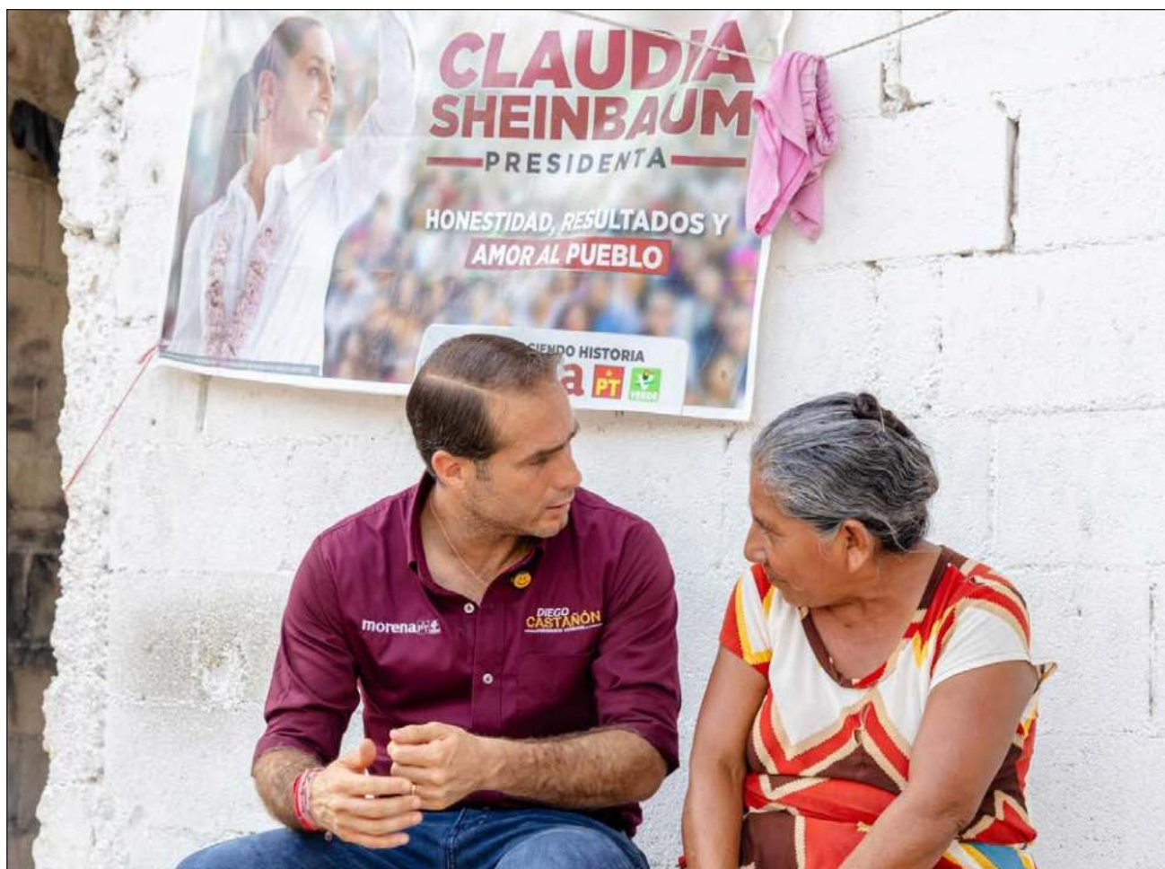
▲ Al abordar el Bienestar Compartido, el candidato habló de la continua transformación de Tulum que, como nunca antes, ha recibido en los gobiernos de Morena grandes inversiones, pero que ahora "lo mejor está por venir".

En el eje justicia social, destacó que las familias se-