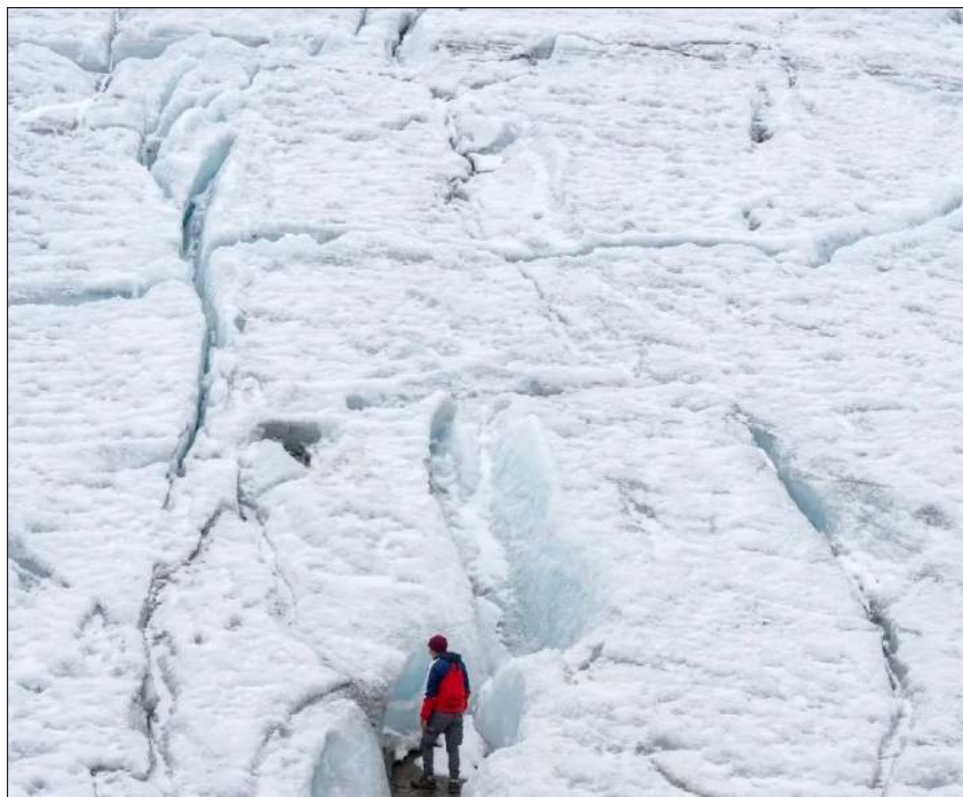
▲ El Ritacuba Blanco es el más quebrado de los picos nevados del país, en cuenta regresiva hacia la extinción: turistas lo visitan y posan para fotografías entre los altos muros de las grietas.

“El fenómeno de El Niño es quizás lo peor que le puede pasar a nuestros nevados o glaciares colombianos, ya que hay ausencia de nubosidad y, por lo tanto, no precipita nieve en los glaciares, que es lo que necesitamos para que se mantengan”, explica Jorge Luis Ceballos, glaciólogo del estatal Instituto de Hidrología, Meteorología y Estudios Ambientales (Ideam).