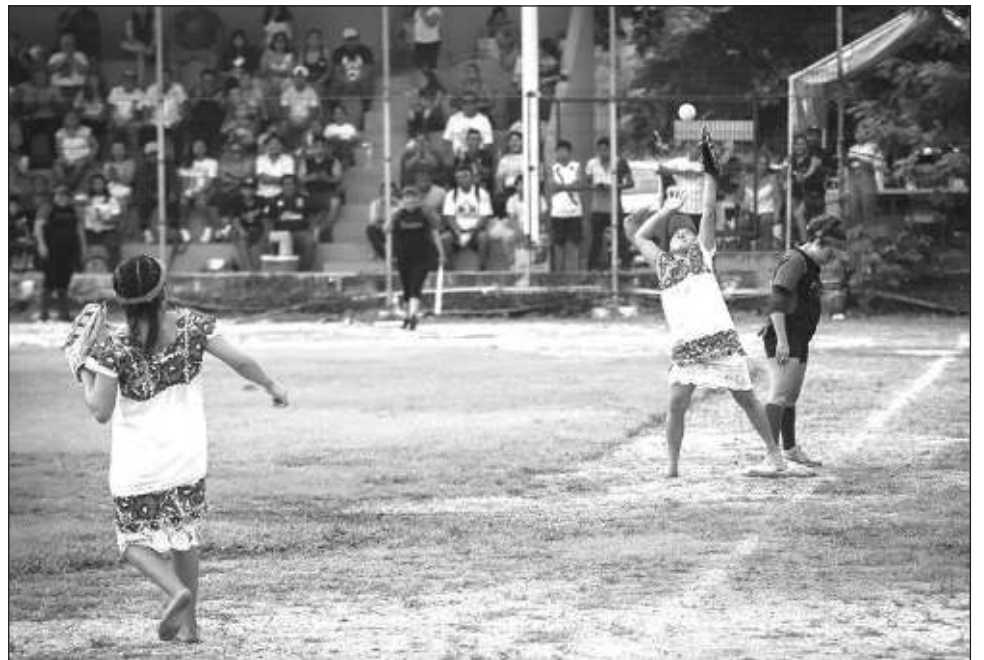
▲ Antes, las integrantes del equipo de softbol estaba limitadas a los quehaceres domésticos, pero ahora juegan y se manifiestan de forma original, portando el tradicional huipil.

El representante externo su emoción y orgullo por estas chicas que ponen en alto el nombre de su comunidad, el de Tulum, Quintana Roo y todo México por su genuina forma de jugar softbol. Ellas, recordó, antes estaban limita-