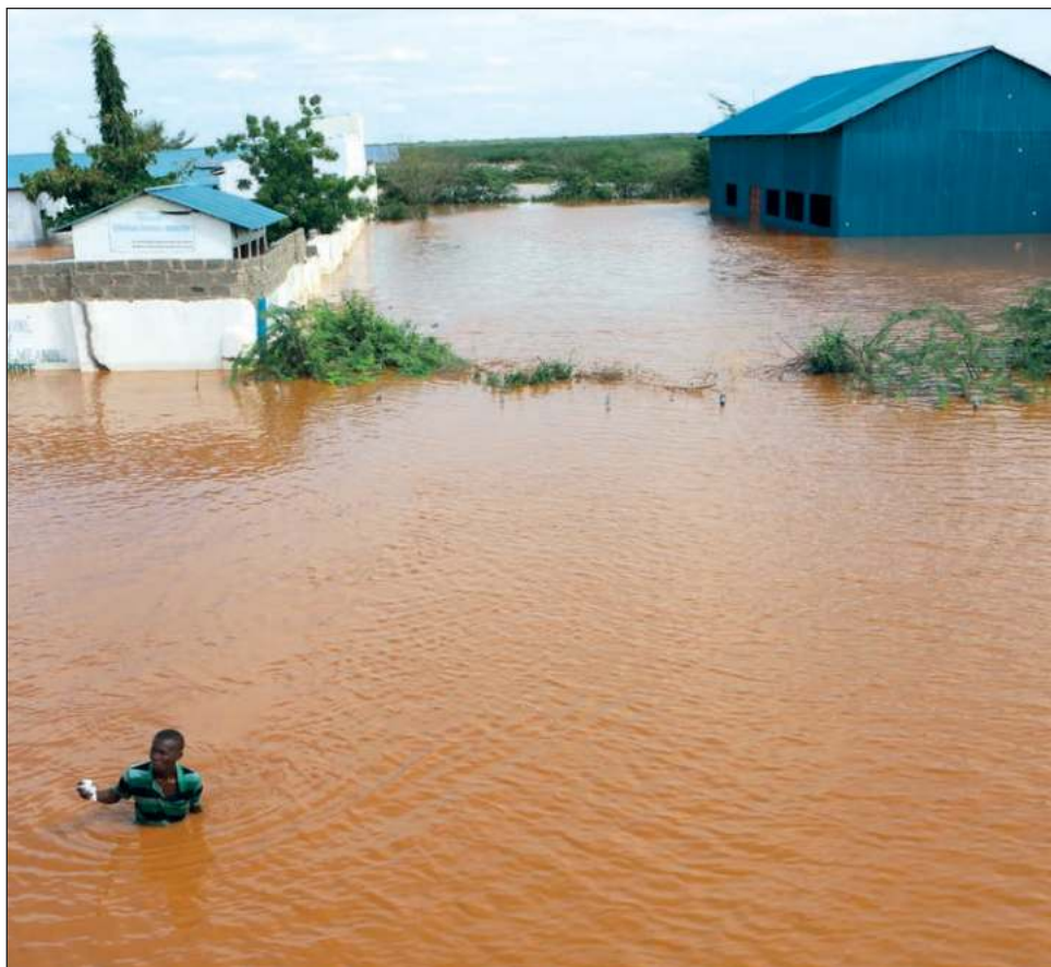
▲ Las inundaciones en Kenia han dejado 257 muertos, según un balance oficial, y más de 400 personas han muerto en todo el este de África durante la temporada de lluvias.

A finales de 2023, las fuertes lluvias en Kenia, Somalia y Etiopía provocaron más de 300 muertos, mientras la región apenas se recuperaba de la peor sequía registrada en 40 años.