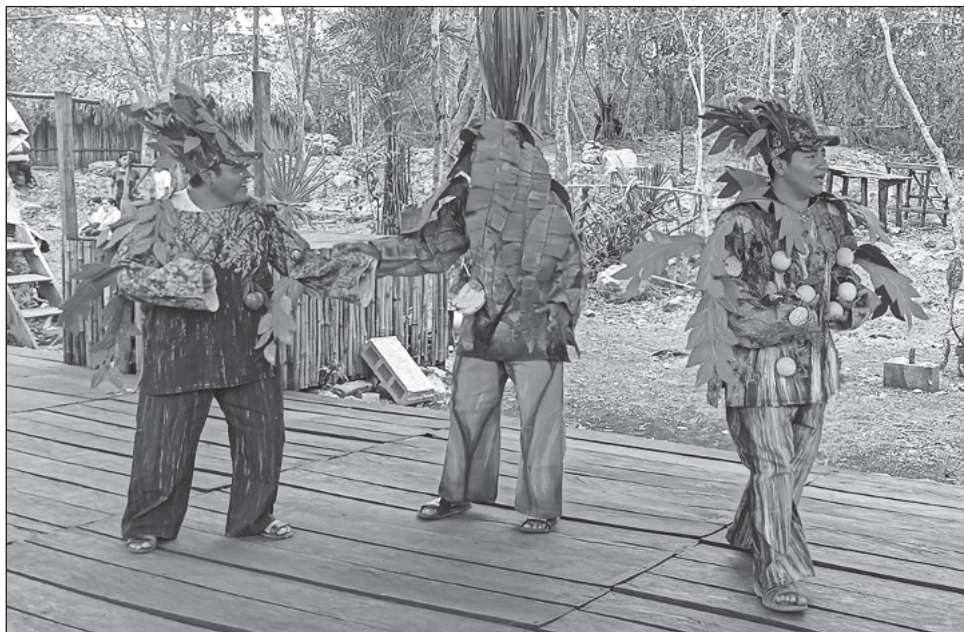
▲ La función será totalmente gratuita para todas las personas que acudan a las 17 horas al Espacio Escénico de X'ocen.

La obra está basada en el libro Lilus Kikus , de Elena Poniatowska, por eso la protagonista se llama así y gran parte de su personalidad respeta al personaje de la escritora francesa de nacionalidad mexicana.