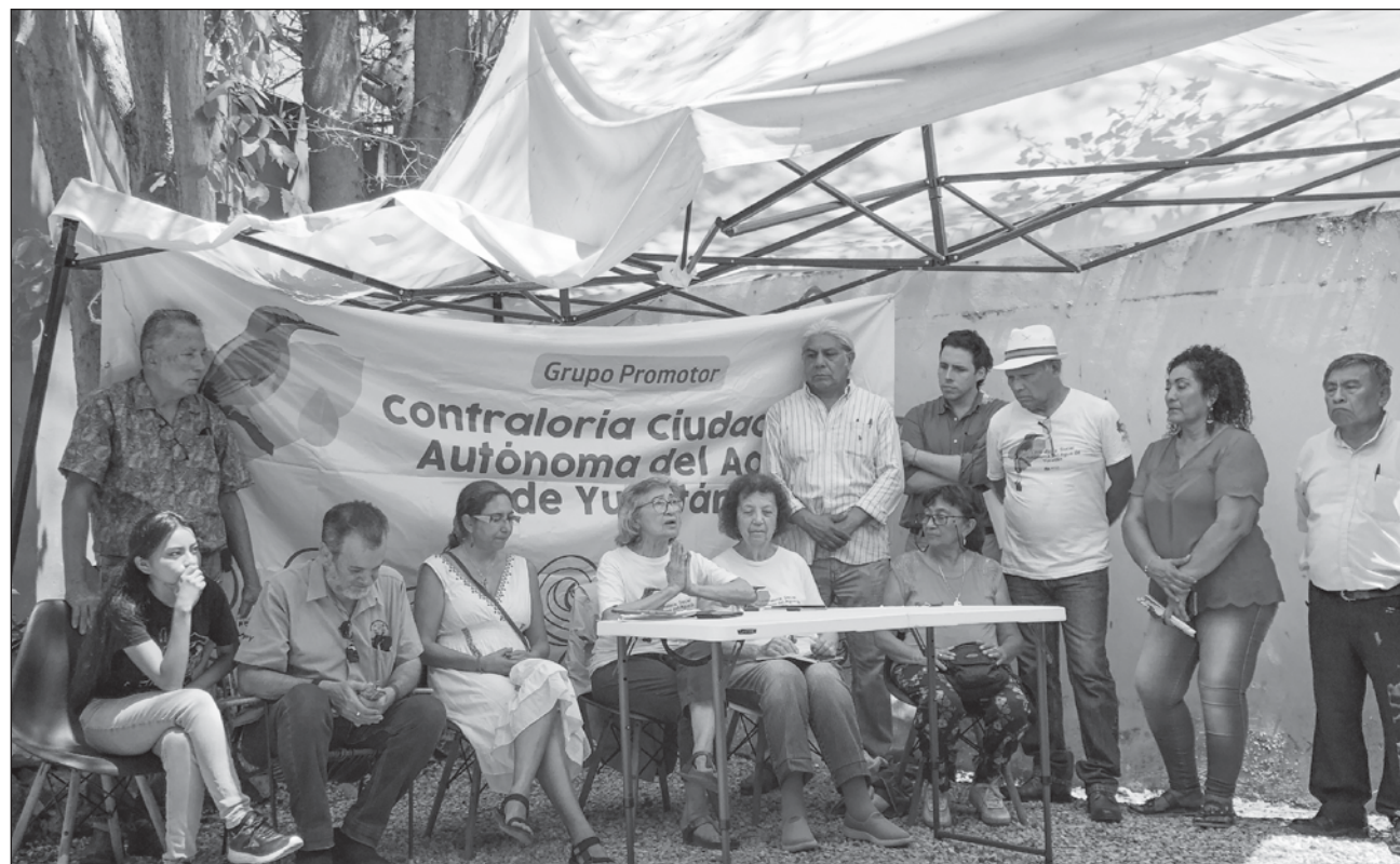
▲ Los ciudadanos pidieron que candidatas y candidatos a la gubernatura de Yucatán, así como a la cámara de Senadores, de Diputados y al congreso local asuman este compromiso y le den un seguimiento responsable.

Representantes de estos grupos apartidistas y de la sociedad civil presentaron 14 consensos que son producto de foros organizados a nivel peninsular y que atienden las principales problemáticas en materia de agua y territorio.