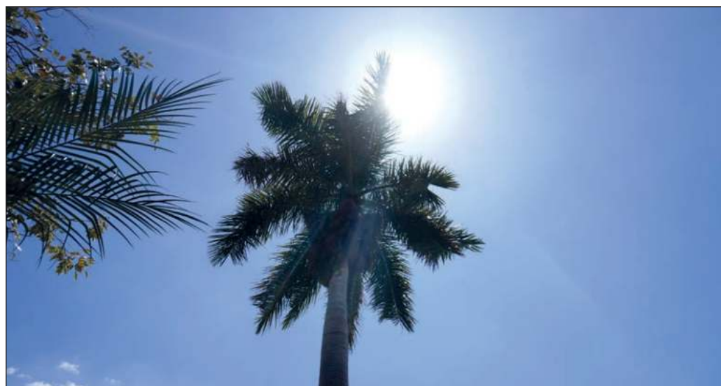
▲ En nombre de mejorar la movilidad, se arrasó con grandes árboles que bien pudieron servir de zonas de ascenso y descenso en lugar de colocar paraderos prefabricados de metal inútiles.

Vale la pena preguntarse si, en época electoral, el calor puede ser tema político, porque en nombre del desarrollo se ha procurado el crecimiento urbano desordenado y sin respeto por el medio ambiente. El concreto no vota, pero quienes padecen el calor que produce, sí tenemos una cita con las urnas.