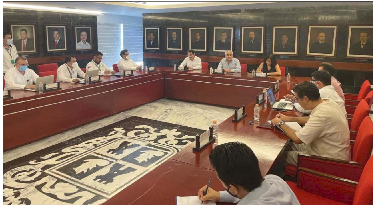
▲ Durante la primera sesión, los integrantes del comité acordaron realizar un levantamiento de condiciones y opiniones de los habitantes de diversas comunidades respecto al servicio de electrificación.