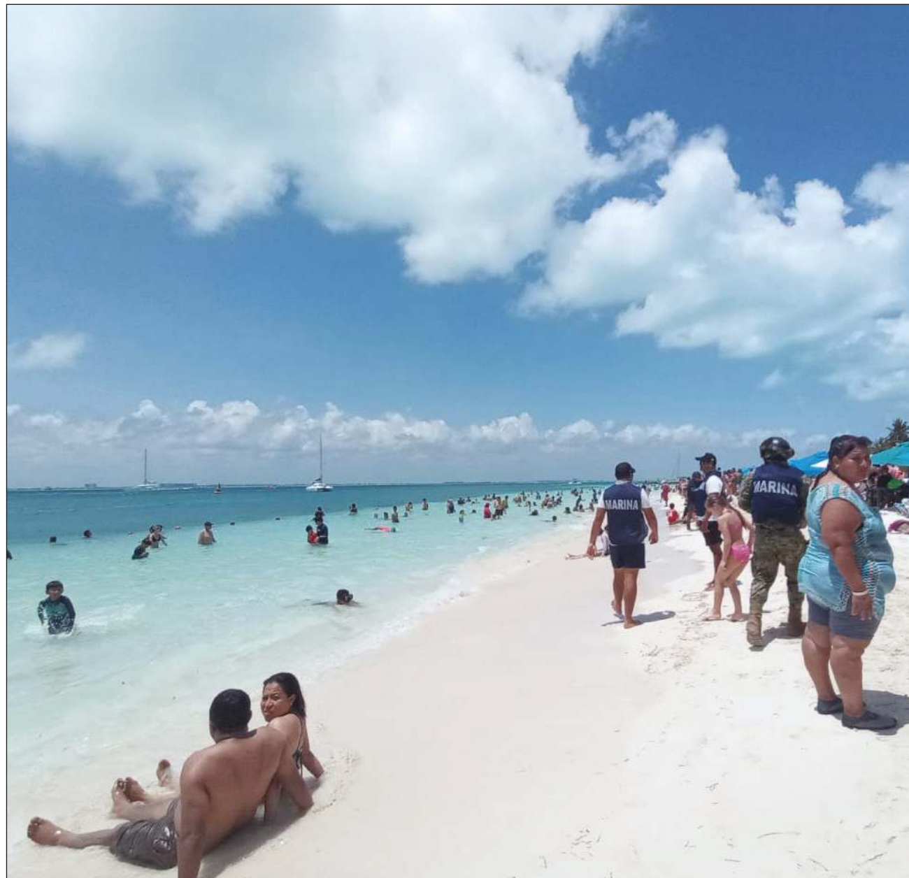
Habitualmente, elementos de Seguridad Pública, la Marina o el Ejército recorren las playas de la isla.

La dirección de Seguridad Pública, con la Guardia Nacional y la policía de proximidad turística, ejemplificó, establecieron en la reciente temporada de Semana Santa los puntos de control y vigilancia, recorridos y presencia de elementos en zonas turísticas, mientras que Protección Civil y Zofemat se enfocaron en la costa, para