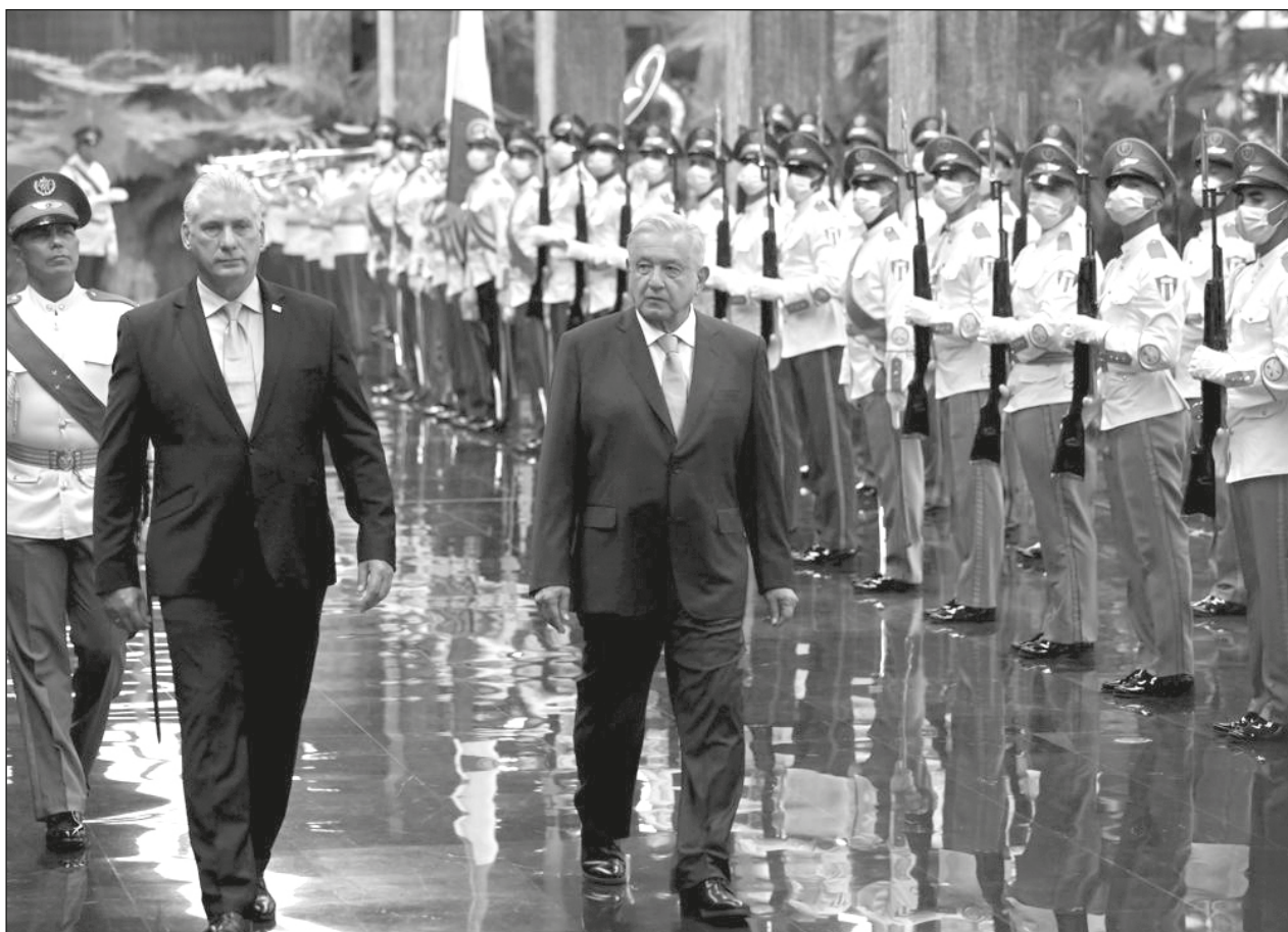
▲ López Obrador recibió la condecoración José Martí “por su distinguido papel en la integración latinoamericana”.

López Obrador dijo que es necesario enfrentar este declive de todas las Américas e insistió en que Estados Unidos levante el bloqueo a Cuba para iniciar el establecimiento de relaciones.