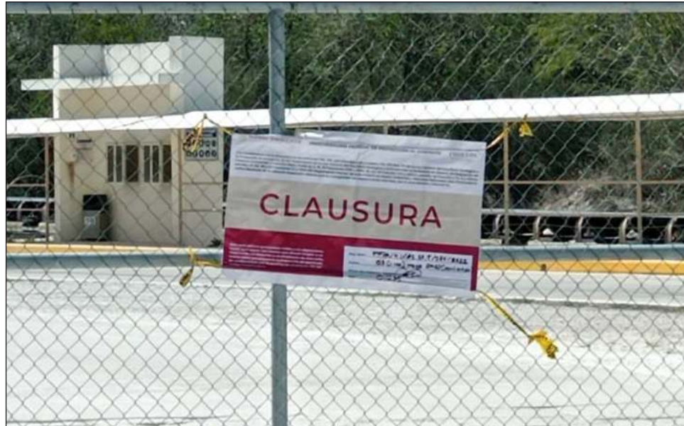
▲ En 2017 y 2018, la Profepa había impuesto una clausura y sanciones administrativas a esta empresa por aprovechamiento de roca caliza mayor al autorizado.

Derivado de la inspección se advirtió la existencia de probables daños y deterioros graves a los ecosistemas, por lo que, con base en la legislación ambiental, se impusieron como medidas de seguridad las clausuras temporales totales de las actividades y obras realizadas en el sitio, informó Profepa en un comunicado de prensa.