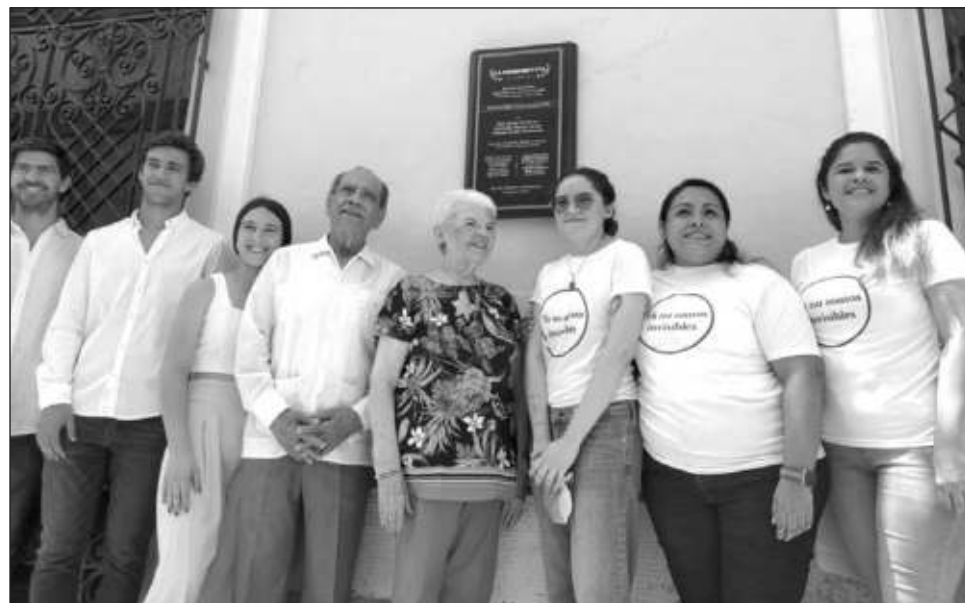
▲ La placa fue colocada en un predio ubicado en la esquina de la calle 59 con 52 del centro de Mérida, donde también funcionó la escuela de niñas La Siempreviva.