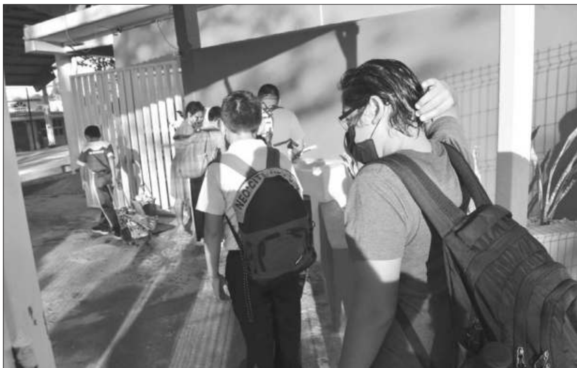
▲ “El regreso presencial a las escuelas, sin duda, es un paso clave para la continuidad de la educación”.

DE ACUERDO CON el Informe de la OMS, Organización Panamericana de la Salud, 2021, con su rápida propagación y consecuencias devastadoras para la salud, la pandemia causada por la enfermedad por coronavirus afectó la vida y los medios de subsistencia de las personas, y descarriló las sociedades, las economías y el desarrollo de los países. Todo esto ocurrió en el contexto de los numerosos desafíos y obstáculos que son inevitables en el camino hacia un desarrollo equitativo y sostenible y el logro de los Objetivos de Desarrollo Sostenible (ODS) para el 2030 y de los objetivos de la Agenda de Salud Sostenible para las Américas 2018-2030 (ASSA2030), que constituye la respuesta regional a los ODS. Muchos aspectos de los ODS el ORGA los ha seguido a lo largo de la pandemia en sus espacios de observa-