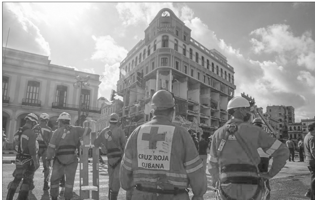
▲ Brigadas de bomberos y rescatistas trabajaron la madrugada del domingo buscando cuerpos bajo los escombros de la edificación ubicada en La Habana Vieja; los primeros cuatro pisos del hotel 5 estrellas resultaron destruidos.

De los 30 fallecidos, 16 son hombres y 14 mujeres, cuatro de ellos menores de edad, una embarazada y una turista española de 29 años, cuyo esposo también resultó herido durante la explosión que destruyó parcialmente al hotel de lujo que estaba siendo refaccionado.