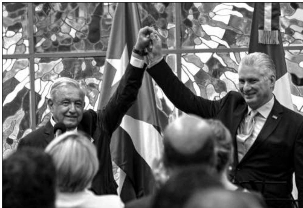
▲ “A título personal, sostengo que yo nunca he apostado, no apuesto ni apostaré al fracaso de la Revolución cubana, a su legado de justicia y a sus lecciones de independencia y dignidad; yo nunca voy a participar con golpistas”, dijo el Presidente mexicano.

Durante la Colonia, en Cuba, igual que en México,