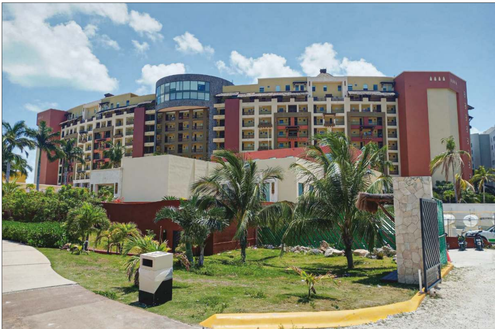
De acuerdo con el titular de la AMPI Cancún, la zona continental podría subdividirse en tres áreas: Playa Mujeres, Costa Mujeres e Isla Blanca.

Y a partir de allí empieza Isla Blanca, con cerca de 800 hectáreas de terreno, con tres grupos propietarios que ya tienen un plan maestro integral, un plan parcial del ayuntamiento, con densidades, usos de suelo, pero que aún no se han puesto de acuerdo para desarrollar juntos el acceso. “Ya hay Manifestaciones de Impacto Ambiental generadas para un terraplén que vaya sobre la laguna y conecte con Isla Blanca”.