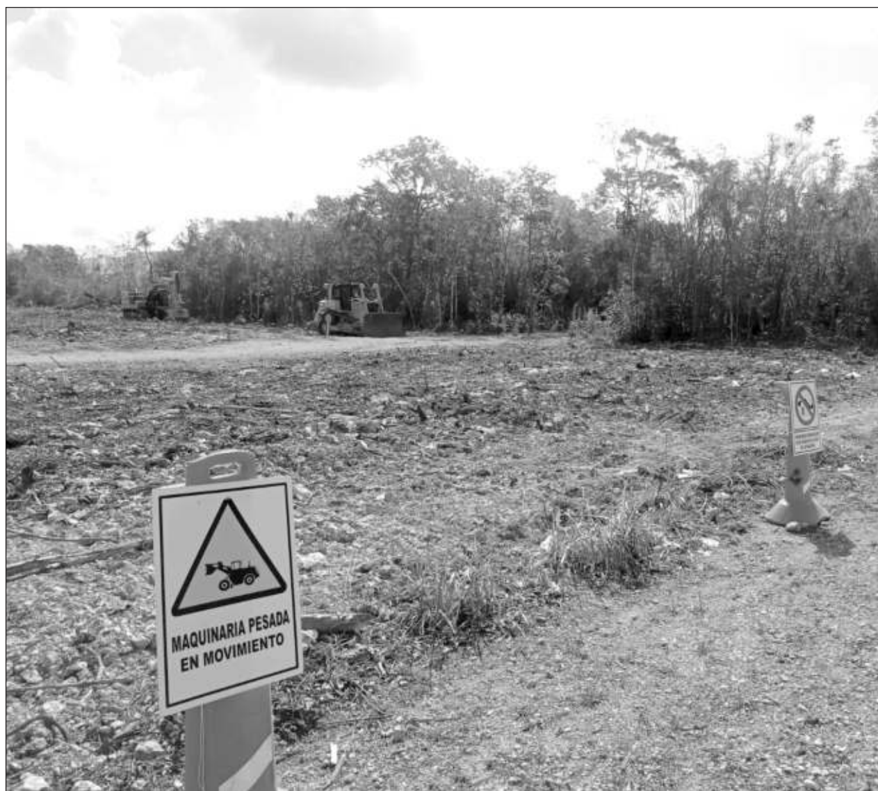
▲ Para hacer válido que el gobierno federal utilice estos espacios era necesario aprobarlo mediante Sesión de Cabildo.

Se destacó que es importante realizar los estudios de impacto ambiental para garantizar un desarrollo sostenible, progreso que no afecte o dañe el medio ambiente.