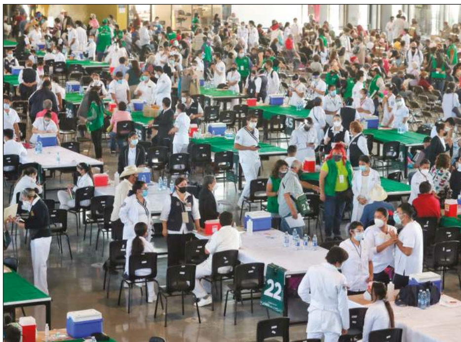
▲ Empresas como Moderna, Pfizer, BioNTech, AstraZeneca, Novavax y Johnson & Johnson registraron un fuerte incremento en su valor; mismo que ha caído en los últimos meses, ya que muchas personas ya se encuentran vacunadas.

"(Las medidas son) muy bienvenidas, pero ¿cuántos puentes más y cuántos estadios más nos van a ayudar a crear un entorno de crecimiento predecible?", dijo el jueves el presidente de la Cámara de Comercio de la