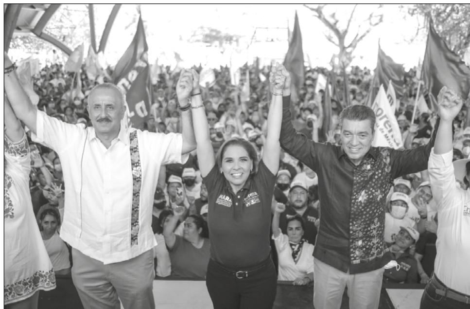
▲ La candidata de Morena a la gubernatura estuvo acompañada de los mandatarios Carlos Merino Campos y Rutilio Escandón Cadenas, de Tabasco y Chiapas, respectivamente.

“También nos da mucho gusto trabajar de la mano con el Gobierno de México, que autorizó para Cancún un paquete de obras histórico, con el que se busca acortar brechas de desigualdad, mejorar las condiciones de vida de los ciudadanos y recupe-