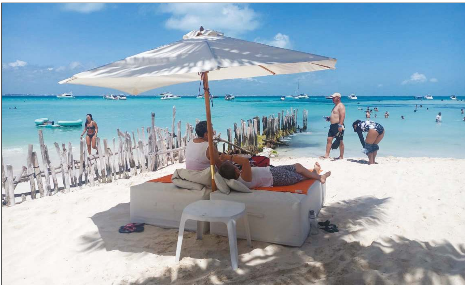
La mayoría del turismo que visita Isla Mujeres es estadounidense, seguido del nacional. La meta para verano es captar al mercado europeo.