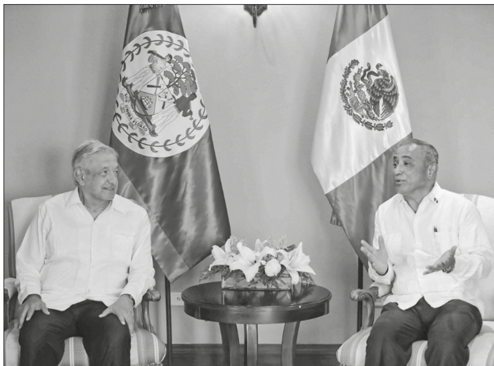
▲ Los presidentes se comprometieron a intercambiar experiencias y buenas prácticas en transporte e infraestructura, así como en fortalecer la conectividad aérea.

Además, hicieron un urgente llamado para que la novena Cumbre de las