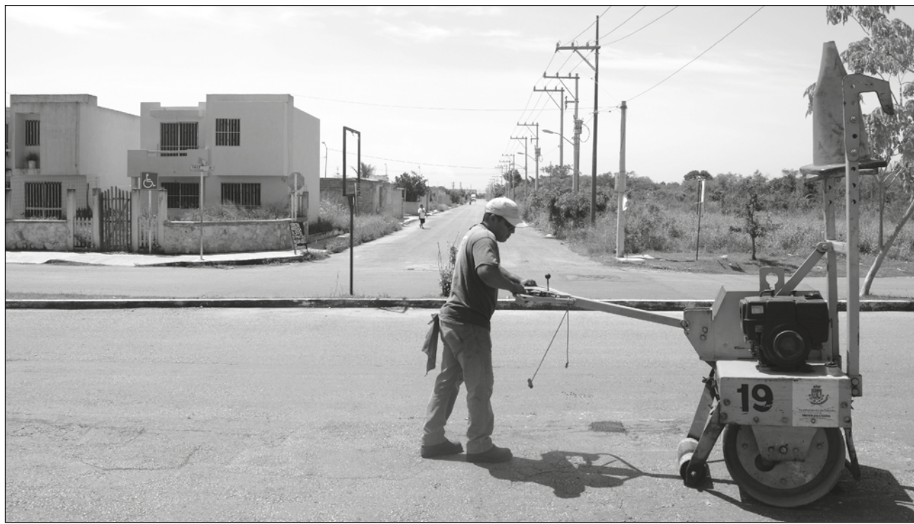
▲ Entre las advertencias para los compradores de lotes está prestar atención a que estos tengan accesos desde el primer día, el desarrollo cuente con todos los permisos, y que el régimen de propiedad sea en condominio.