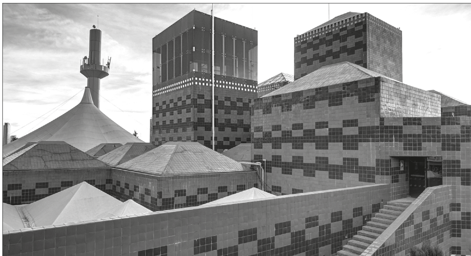
▲ Los tres edificios del Papalote representan las tres figuras geométricas básicas: círculo, triángulo y cuadrado.