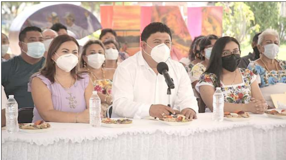
▲ El evento será el 15 de mayo en el parque principal del municipio.