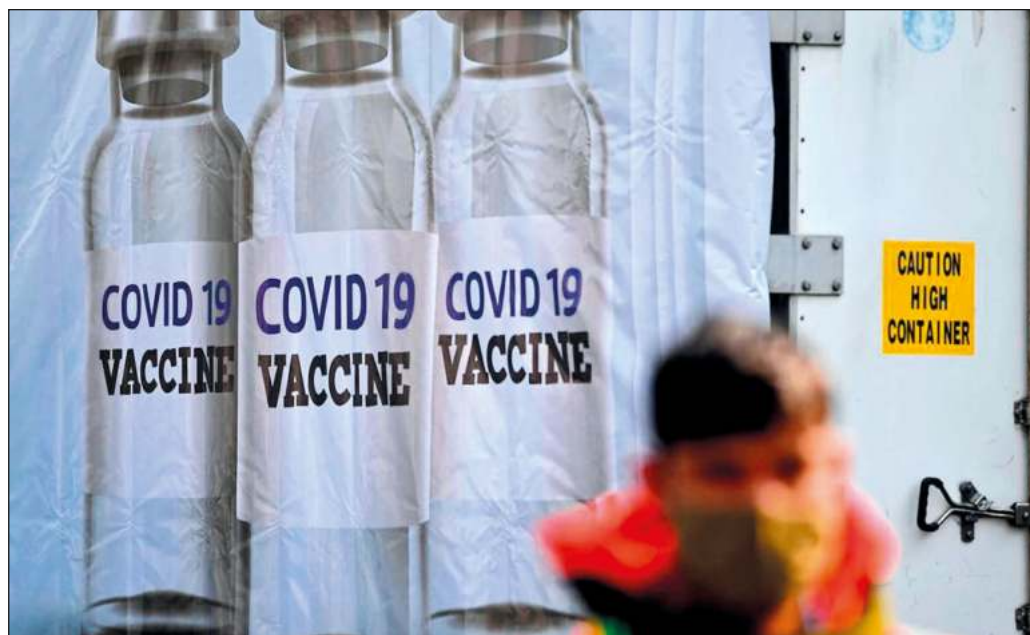
▲ Desde que comenzó la pandemia de Covid-19, seis compañías farmacéuticas que desarrollaron vacunas contra la enfermedad ganaron 227 mil mdd en valor de mercado.

En las conclusiones a su 15 edición, realizada en nuestro país del 1 al 6 de mayo, las organizaciones participantes del Foro Social Mundial señalaron que los gobiernos usaron la pandemia "para dar un poder injustificado a los grandes laboratorios privados". El reporte de ganancias de las compañías involucradas muestra la certeza de esta apreciación, y supone un recordatorio de que, en el orden neoliberal, el lucro se antepone a la sensatez y a las necesidades humanas, incluso en la más apremiante de las emergencias.