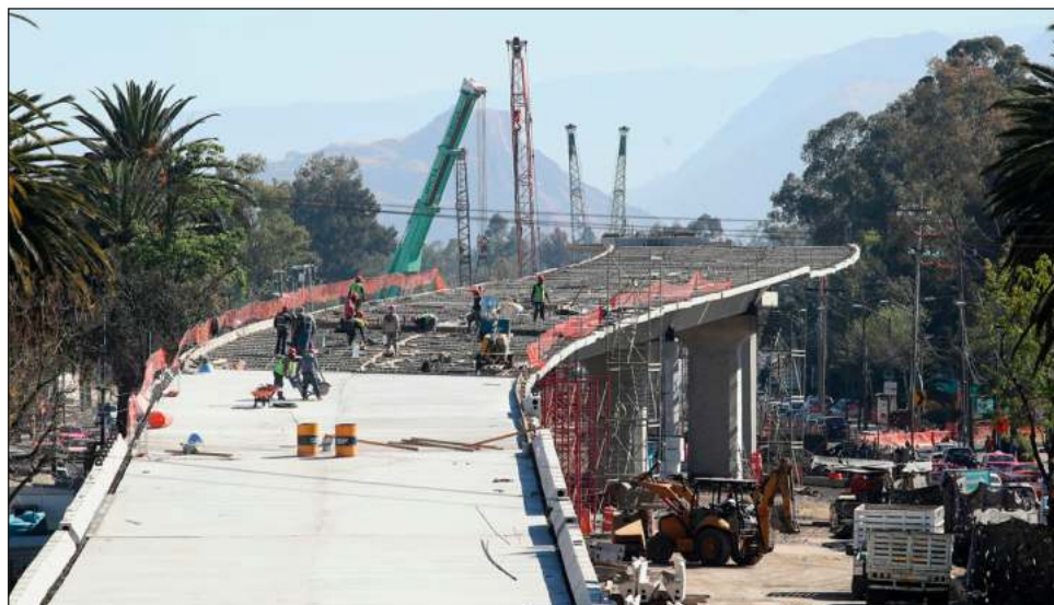
▲ Si bien el ciclo de precios apuntaba a un alza, lo cierto es que no se esperaba que rompiera la barrera de 10%; esto debido a las constantes sorpresas en la inflación a nivel mundial.

La guerra ha hecho crítico contar con una sólida cadena de suministro, algo que se complica con los nuevos brotes de Covid en