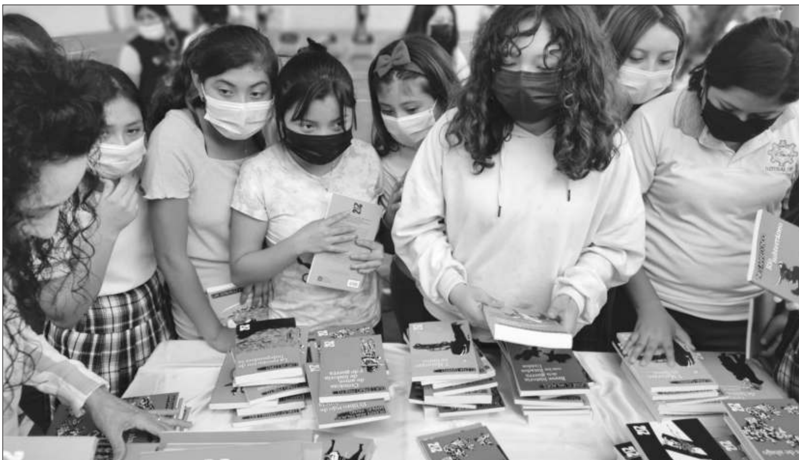
▲ “Un pueblo sin memoria es como una hoja al viento, presa fácil de los que arman historias para controlar vidas”.