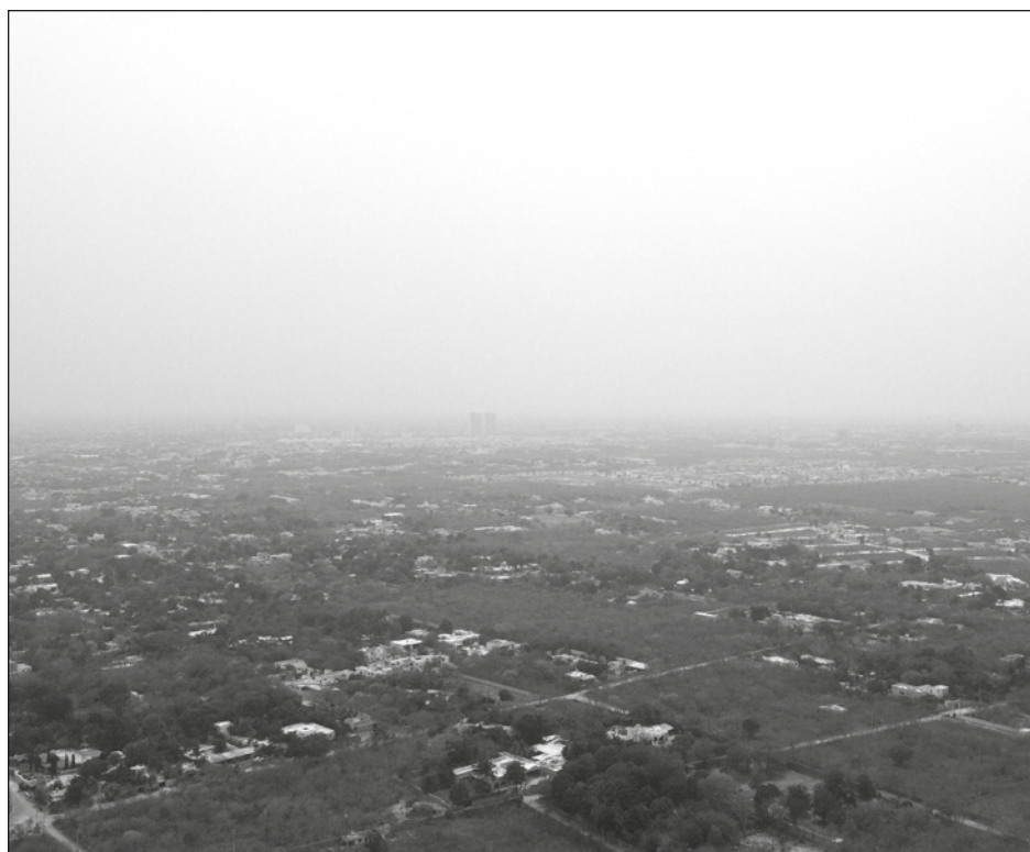
▲ “Es necesario crear hogares porque el tiempo es el recurso más importante para las personas y, de no haber casas en la zona, los trayectos serán muy largos”.