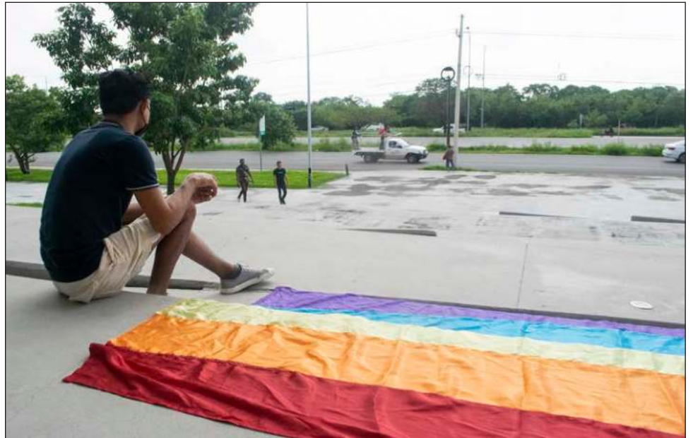
▲ Las y los participantes de la quinta mesa ciudadana expusieron problemáticas relacionadas con la falta de igualdad laboral entre hombres y mujeres, así como de accesibilidad para personas con discapacidad, violencia institucional y discriminación entre la comunidad LGBT+.

En el desarrollo, las y los participantes expusieron problemáticas relacionadas con la falta de igualdad laboral entre hombres y