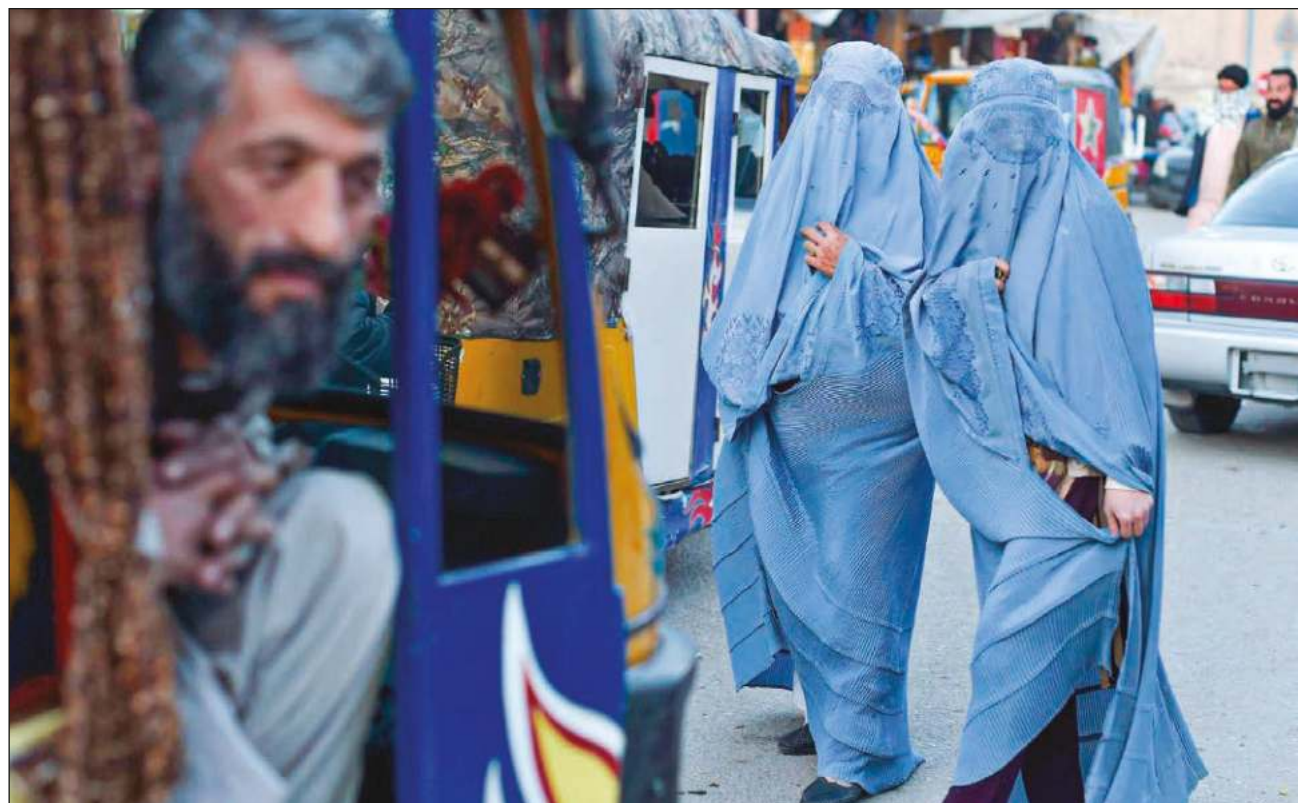
▲ Las mujeres deberán cubrirse el rostro cuando estén en compañía de un hombre que no pertenezca a su familia inmediata para evitar cualquier "provocación", de acuerdo con su interpretación rigorista de la "sharía", la ley islámica.

Dijeron también que si no tienen nada importante que hacer, era "mejor" que se queden en casa.