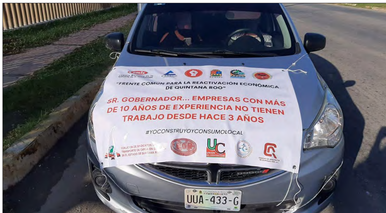
▲ Los inconformes realizaron una marcha pacífica en sus vehículos, y llamaron a las autoridades a contratar empresas locales en obra pública.

Transportados en volquetes, camiones y vehículos particulares partieron