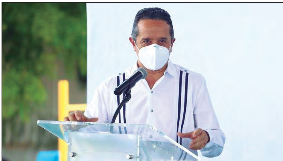
▲ El evento no tendrá invitados ni habrá concentración de personas.

A través de las redes sociales, Carlos Joaquín ha difundido algunos avances de lo que contendrá este Cuarto Informe de Gobierno: la entrega de cinco apoyos básicos (agua, luz, gas, alimentos y salud) durante la pandemia; el incremento de la infraestructura hospitalaria para atender a pacientes con COVID-19, y la reactivación económica de la entidad con la certificación de los protocolos de empresas y negocios, entre otros datos.