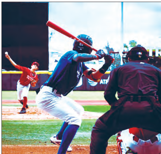
▲ La LPM está en su recta final y los playoffs comienzan el próximo martes 15.