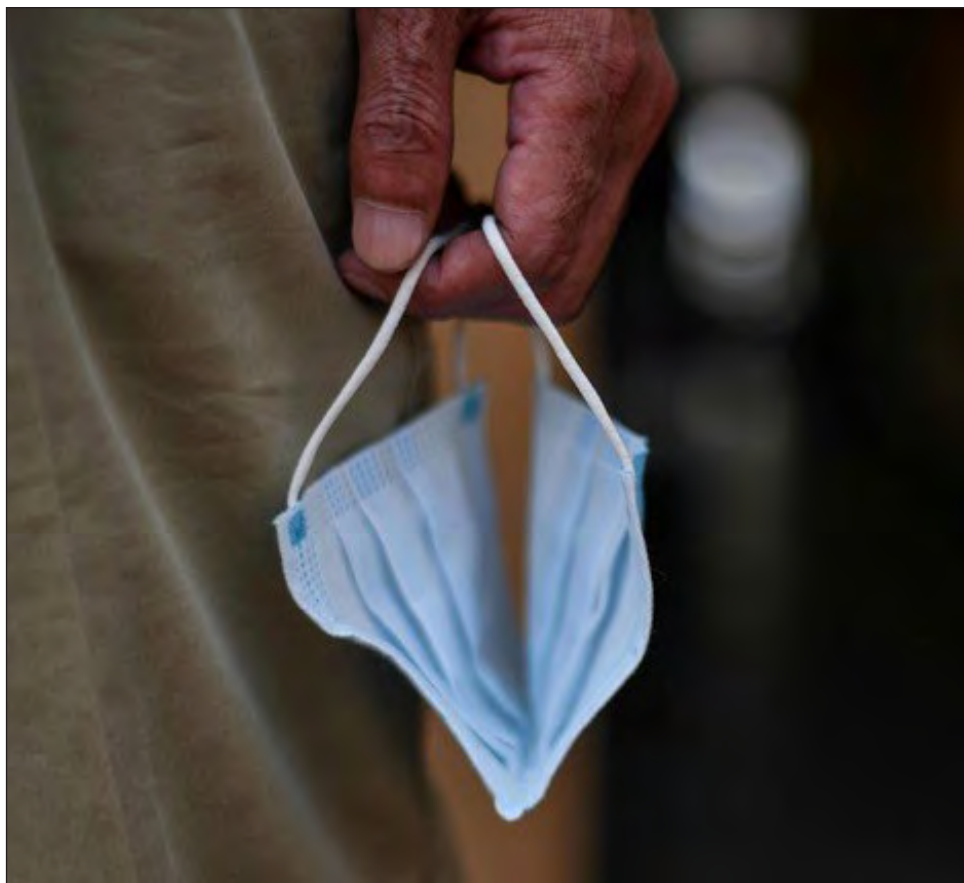
▲ China ha sido acusada por Estados Unidos de reaccionar tarde ante el COVID.

El desarrollo en el país de una o más vacunas contra el COVID-19 permitiría a Pekín contrarrestar esta mala imagen.