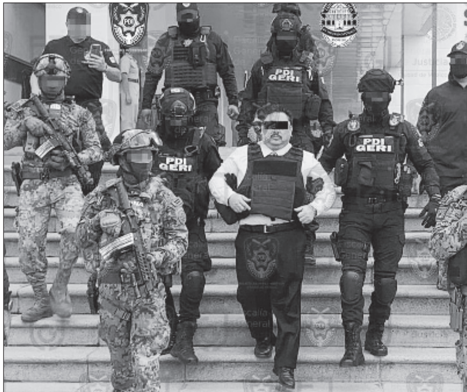
▲ El fuero protegía a Uriel Carmona por delitos del orden federal, pero se le acusó de un delito del fuero común al ocultar la verdad sobre el asesinato de una joven.

Acusó que había muchos intereses protegiendo al fiscal, desde políticos hasta integrantes del Poder Judicial, al recordar que la Fiscalía General de la República había solicitado orden de aprehensión