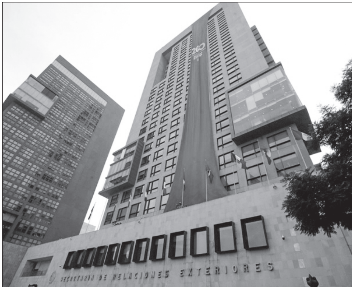
▲ “Resaltamos mucho por nuestra política internacional independiente e irreprochable. ¡Necesitamos volver a ser los líderes que fuimos en el pasado! (...) La política exterior debe contribuir al crecimiento económico del país.”

—En esos años de 1985, en que me presenté en la Cámara, me trató