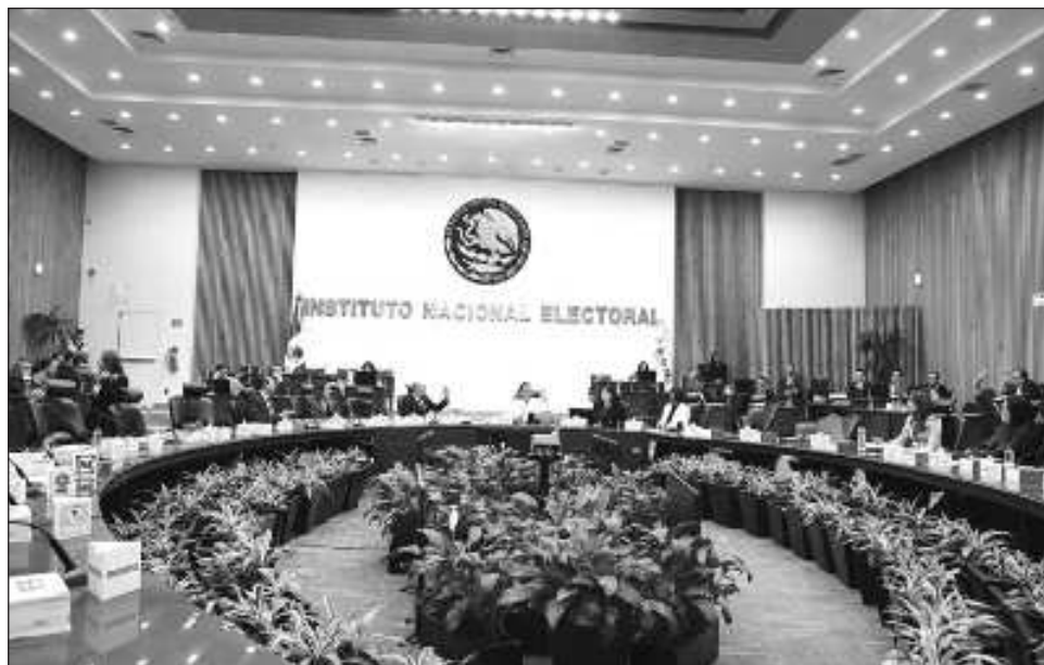
▲ Los datos oficiales indican que de los sancionados, 289 han sido hombres y 74 mujeres.

Es decir, en el ámbito municipal es donde se acumula el mayor número con el 75.72 por ciento de los