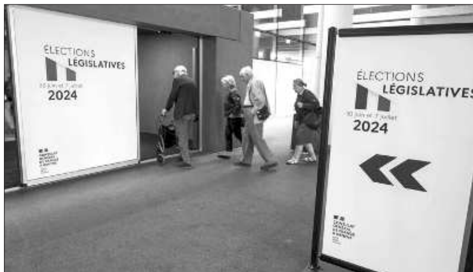
▲ Al convocar elecciones el 9 de junio, después de que la extrema derecha destacara en la votación para el Parlamento, Macron dijo que enviar a los votantes de vuelta a las urnas proporcionaría una "aclaración".

Los resultados mostraron poco más de 180 escaños para la coalición de izquierda Nuevo Frente Popular, que quedó en primer lugar, por delante de la alianza centrista de Macron, con más de 160 escaños. El partido de ultraderecha Agrupación Nacional de Marine Le Pen y sus aliados quedaron restringidos