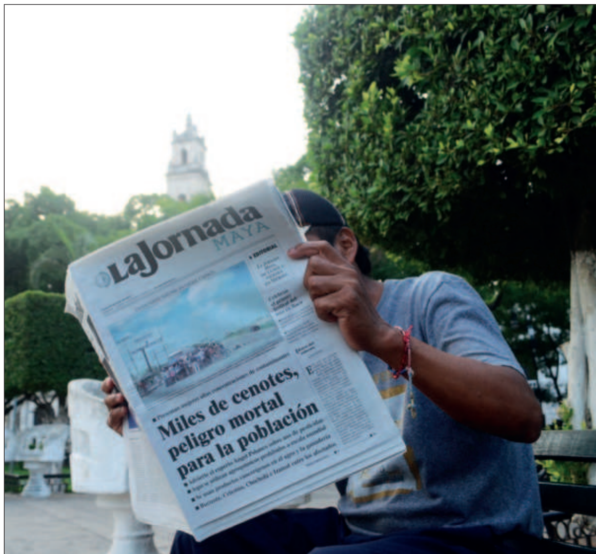
▲ "Mientras una gran mayoría de medios impresos ya tienen listos sus propios obituarios, La Jornada Maya se aferra a un futuro, un porvenir que muchos no logran vislumbrar".

Soy lo que he leído; en gran medida, lo que he leído en los