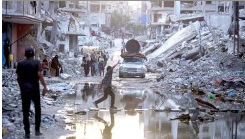
▲ El movimiento islamista palestino exigía que Israel aceptara un alto el fuego completo y permanente antes de negociar, pero “este punto se ha superado”, declaró un alto cargo del grupo.

Los mediadores se han “comprometido a que, mien-