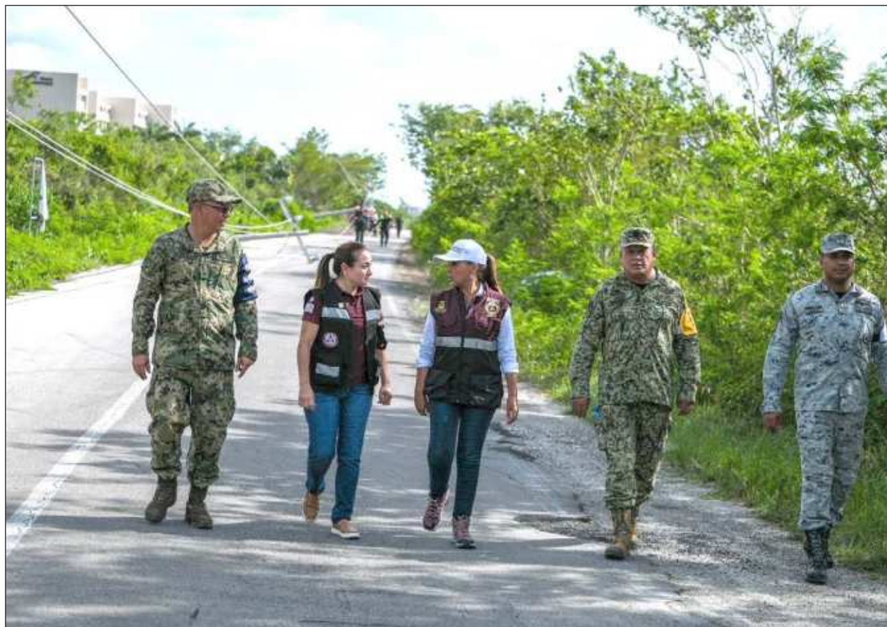
▲ La gobernadora Mara Lezama sigue atendiendo los reportes de daños en todos los municipios de Q. Roo.

Como se recordará, el pasado jueves 4 y viernes 5 de julio se suspendieron las clases en todo el estado como medida preventiva para asegurar la protección y el bienestar de estudiantes, docentes y personal administrativo, debido a la llegada del fenómeno hidrometeorológico.