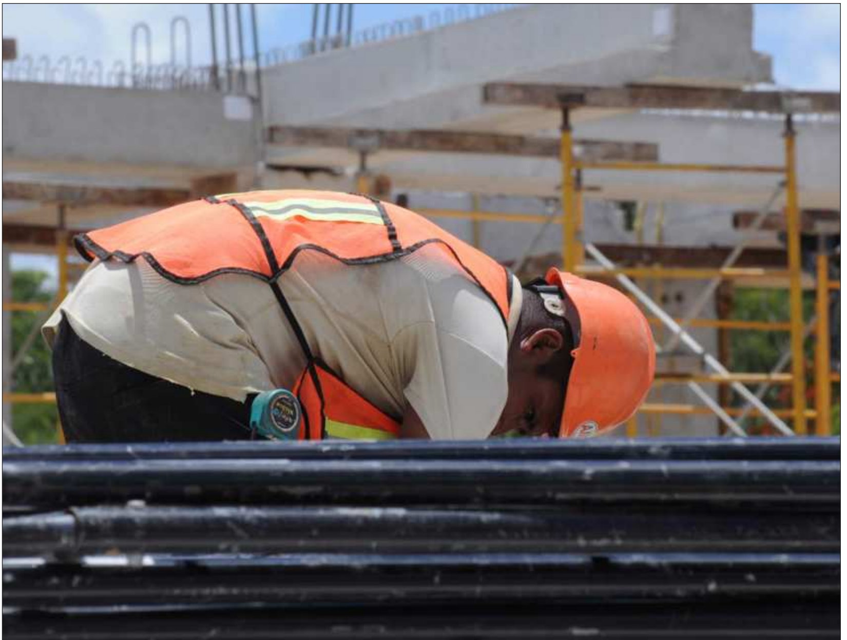
▲ Entre junio de 2023 y 2024, se dieron 14 mil 45 nuevos empleos, cifra superior al promedio nacional y posicionó a la entidad en el lugar 11 con mayor generación de empleos.

Es por eso que Vila Dosal continúa impulsando la llegada de más empresas que traigan a las familias de Yucatán los empleos mejor pagados y con seguridad social que se necesitan para elevar su calidad de vida.