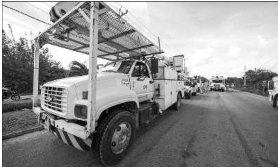
▲ En Cancún habitualmente se tiene un consumo en energía eléctrica de 600 megawatts, pero en este verano se ha elevado aproximadamente a 900 megawatts.

Por ello, se está trabajando en las subestaciones, con lo