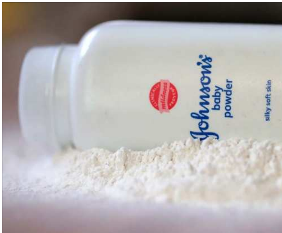
▲ El talco, un mineral natural, se extrae en muchas regiones del mundo. La exposición a éste se produce en entornos ocupacionales durante la extracción y molienda o procesamiento del talco, o durante la producción de productos que contienen talco.

En animales de experimentación, el tratamiento con talco provocó un aumento de la incidencia de