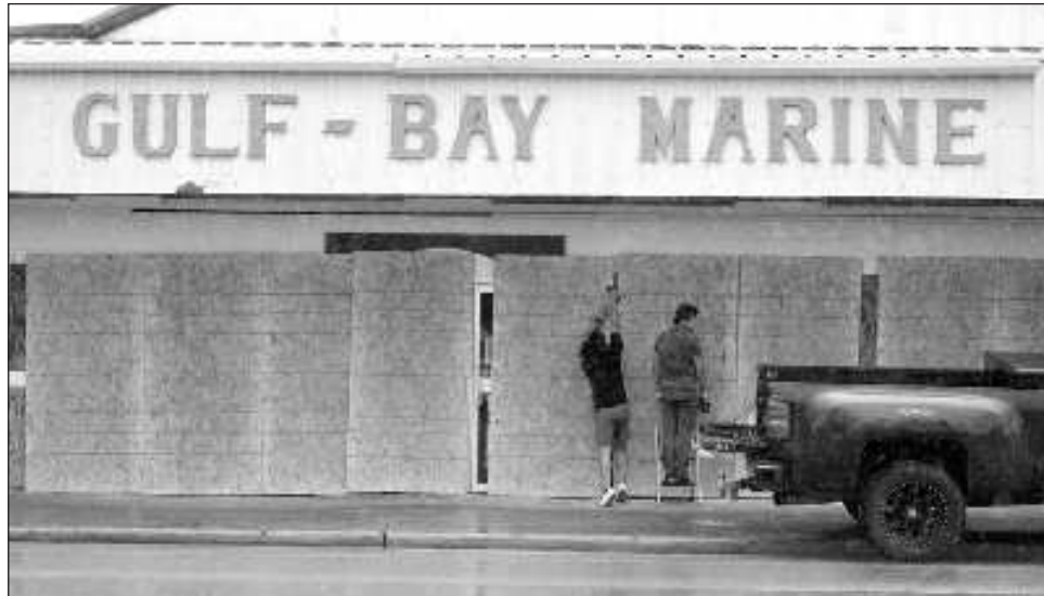
▲ Residentes y propietarios de negocios tomaron las precauciones usuales para cuando se aproxima una tormenta, pero también dijeron sentirse inciertos sobre su intensidad.

Aunque Beryl seguía siendo una tormenta tropical el domingo a medida que se acercaba a Texas, amenazaba con recuperar fuerza de huracán en las cálidas aguas del golfo de México antes de tocar tierra el lunes en la madrugada. Se pronostica que la tormenta llegue a tierra a la mitad de la costa de Texas, en los alrededores de la bahía de Matagorda, un área ubicada a unos 161 kilómetros al sur de Houston, pero las autoridades advirtieron que su ruta aún podría cambiar.