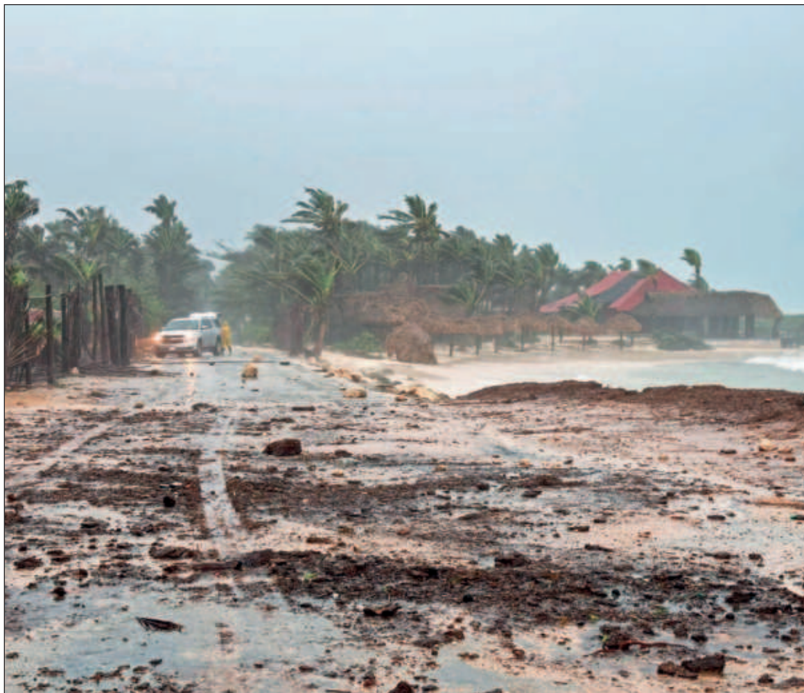
▲ “El cuidado del ‘otro’ parece una cuestión distante. Se agudiza la vulnerabilidad de algunas poblaciones ante ciertos fenómenos naturales. La indiferencia ante las afectaciones pareciera ser rampante; año tras año, los riesgos aumentan en cada período de huracanes, más no las acciones para remediar la desigualdad social”.

VOCES COMO LAS anteriores, tan antiguas como recientes, pueden vincularse con el concepto de vulnerabilidad, relacionado con el rasgo común humano de estar expuesto a un daño. Esta noción no se vive del mismo modo, sino según la diversidad de condiciones preexistentes, como políticas y sociales. ¿Qué tanto la vulnerabilidad del pueblo maya ante los huracanes es producto de marcos históricos, económicos y sociales ajenos? Las respuestas —tan amplias como los pronósticos meteorológicos— exceden a este texto. Pero vale cuestionarnos sobre la vulnerabilidad y su relación con elementos ajenos a la población maya, pero que acaba afectando: poco desarrollo e infraestructura