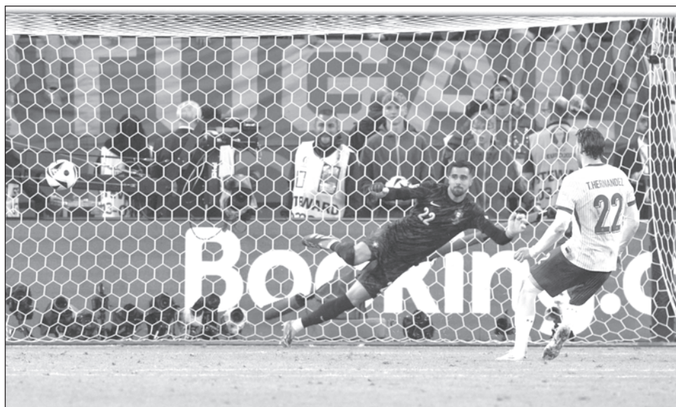
▲ Theo Hernández convierte el penal con el que Francia eliminó a Portugal en Hamburgo.

Cristiano, quien disputaba su sexta Eurocopa para imponer un récord, acertó el primer disparo de la tanda. El veterano de 39 años, quien ha dicho que esta Euro será su última, terminó consolando a su compañero Pepe.