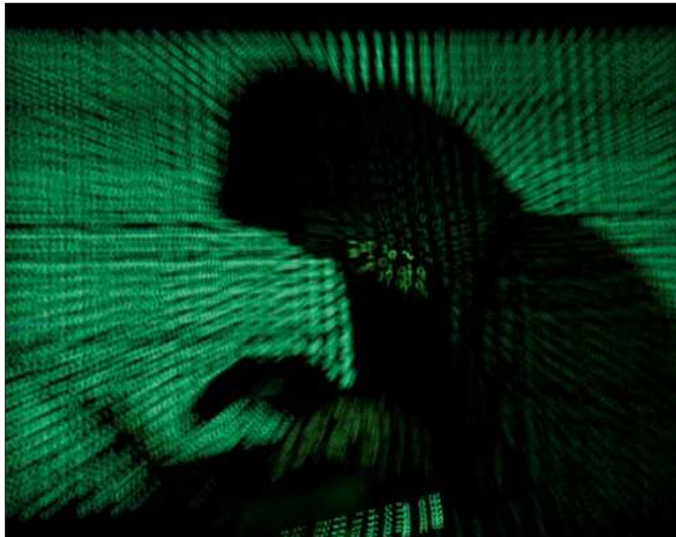
▲ La IA propicia nuevos riesgos derivados de su uso por parte de grupos cibercriminales para potenciar sus ataques, usurpar identidades, engañar o desinformar a la población. Foto crédito

Les piden otorgar datos personales o entrar a sus