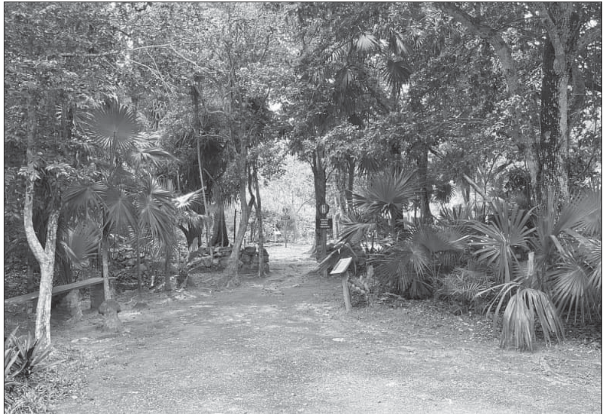
▲ “No está claro si esta propuesta presidencial se realizaría solamente en el predio propiedad de Caribe Paradise, o si pretende incluir también los terrenos propiedad del gobierno estatal”.

No pretendo conocer los motivos que han llevado a la empresa Caribe Paradise a no