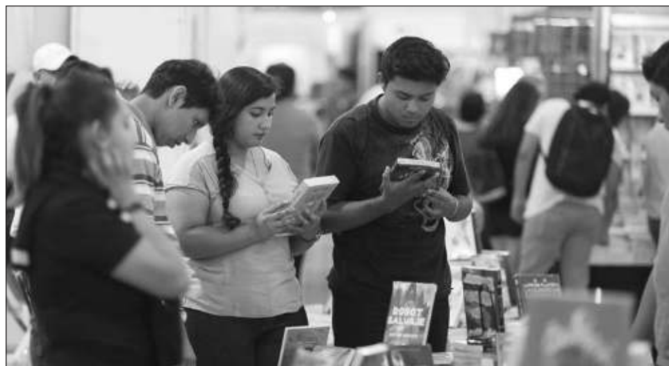
▲ La edición 2023 de la Filey contará con varias sedes: el Siglo XXI, el Centro Cultural La Ibérica, el Auditorio Maricarmen Ancona Herrera y Aerel Espadas Medina del Campus de Arquitectura.

Con el lema "por la aventura de leer", abrirán espacio para encuentros entre libros,