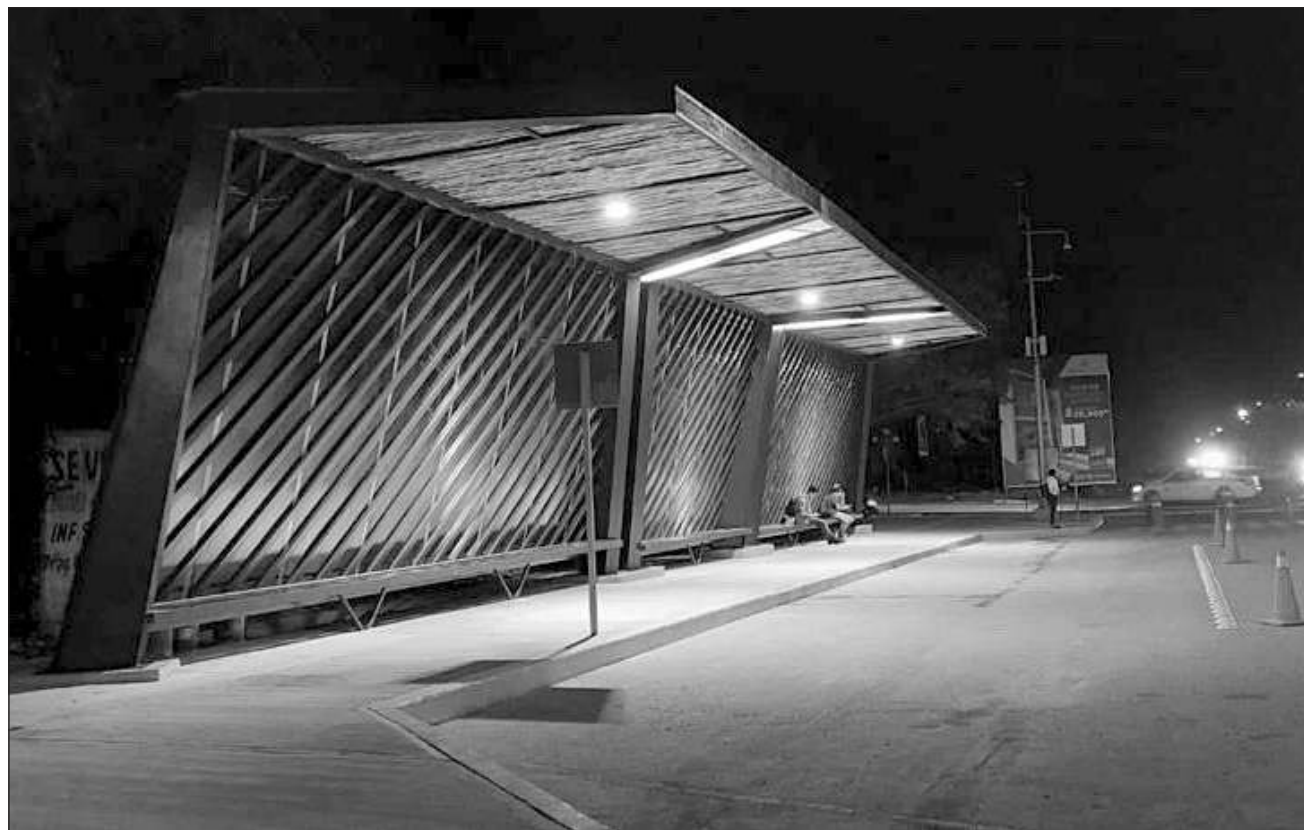
▲ El paradero fue construido en respuesta a una petición de los propios estudiantes.

En otro tema, la presidente municipal dijo que se trabaja para erradicar la violencia de género, de modo que las mujeres y sus