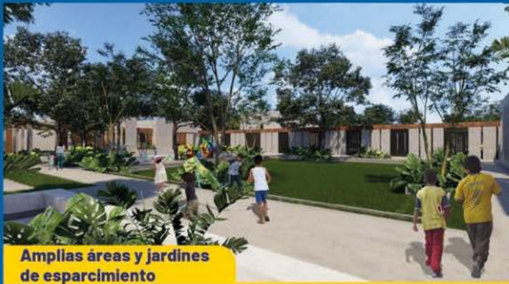
Amplias áreas y jardines de esparcimiento

Iniciamos la construcción del nuevo centro que sustituirá al CAIMEDE.