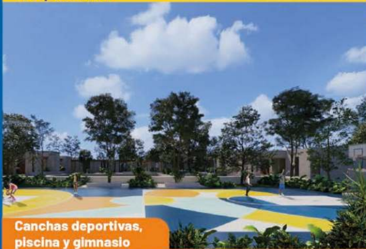
Canchas deportivas, piscina y gimnasio