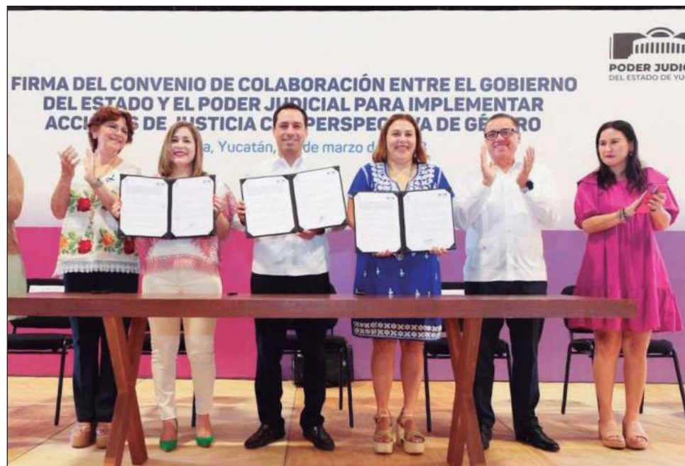
El gobierno del estado y el Poder Judicial signaron un convenio de colaboración para implementar acciones de justicia con perspectiva de género.

Con tal de seguir fortaleciendo las acciones para atender esta problemática y el empoderamiento de las mujeres, se crearán dos Centros Regionales Violetas, en Buctzotz y Ticul, los cuales se suman a los 34 existentes; con apoyo del ayuntamiento de Tekax se instalará el primer refugio para mujeres en situación contingente del interior, y en Ticul, se establecerá la Casa de Emergencia