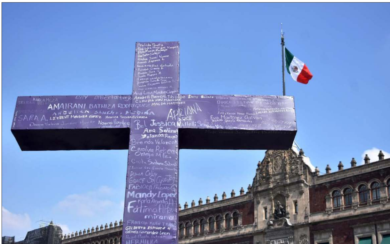
"Hoy hay que gritar esas historias; vivencias que, en muchas ocasiones, concluyeron con la muerte. Escribir esos episodios en cualquier hoja blanca que tengamos a mano, ya sea la de un periódico, ya sea en un monumento. Recordar a las protagonistas, y repetir sus hazañas".