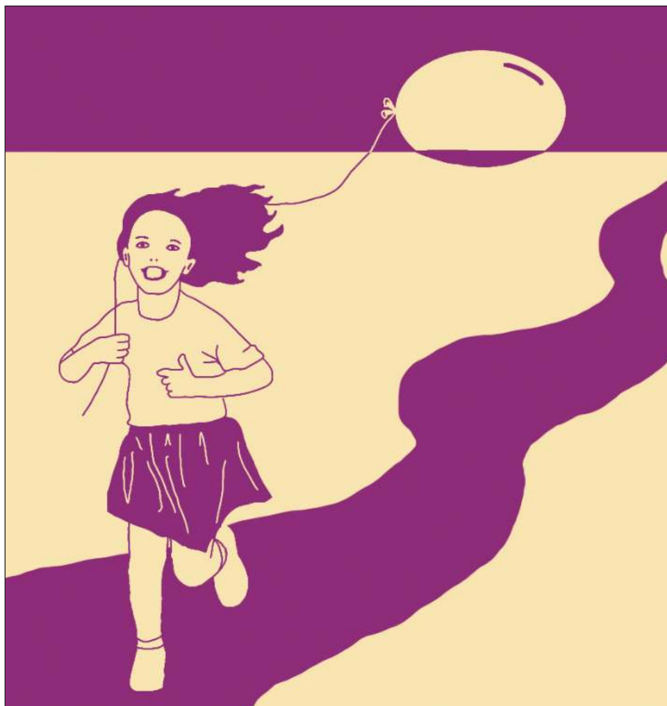
Virginia Bautista pidió a las mujeres comunicadoras tener mucho valor, fortaleza, que se cultiven a través del arte y la cultura, y que no se detengan ante nada. Ilustración Sergiopv @serpervil

algunas redacciones siguen pidiendo exámenes para comprobar que las mujeres no están embarazadas antes de contratarlas.