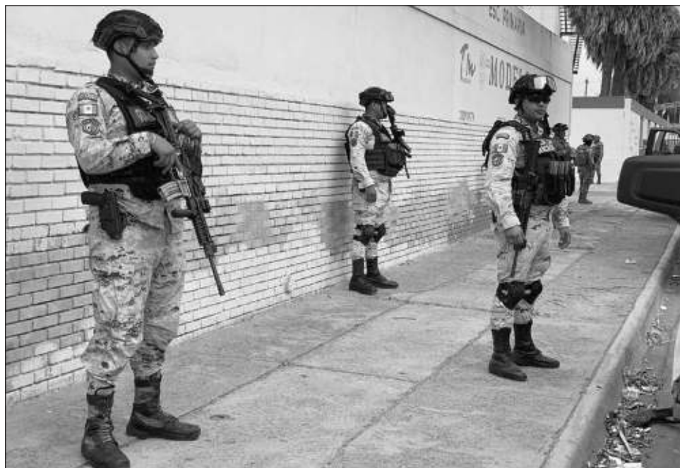
▲ Los ciudadanos estadounidenses viajaron a México para realizar un procedimiento médico y apenas llevaban dos horas y media en el país cuando fueron atacados a balazos mientras iban en una camioneta.

El equipo interinstitucional, conformado por elementos de la Secretaría de la Defensa Nacional (Sedena), la Secretaría de Marina (Semar), la Guardia Nacional (GN), la Secretaría de Seguridad y Protección Ciudadana (SSPC), la Fiscalía General de Justicia de