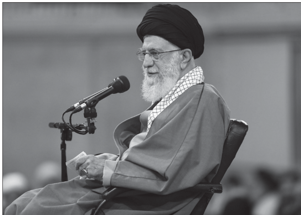
▲ De acuerdo con un miembro del comité parlamentario de investigación, "se están realizando varias pruebas para identificar el tipo y la causa de las intoxicaciones".

En total, "25 provincias y aproximadamente 230 escuelas se vieron afectadas, y más de 5 mil