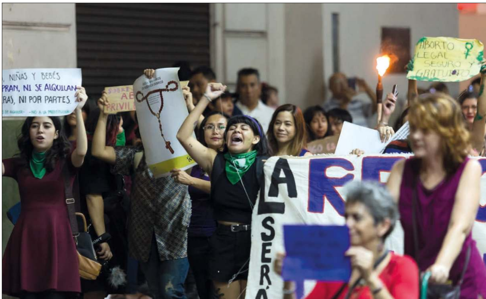
Las mujeres adultas ven las marchas feministas como un puente para la defensoría de los derechos, la igualdad y equidad de género.