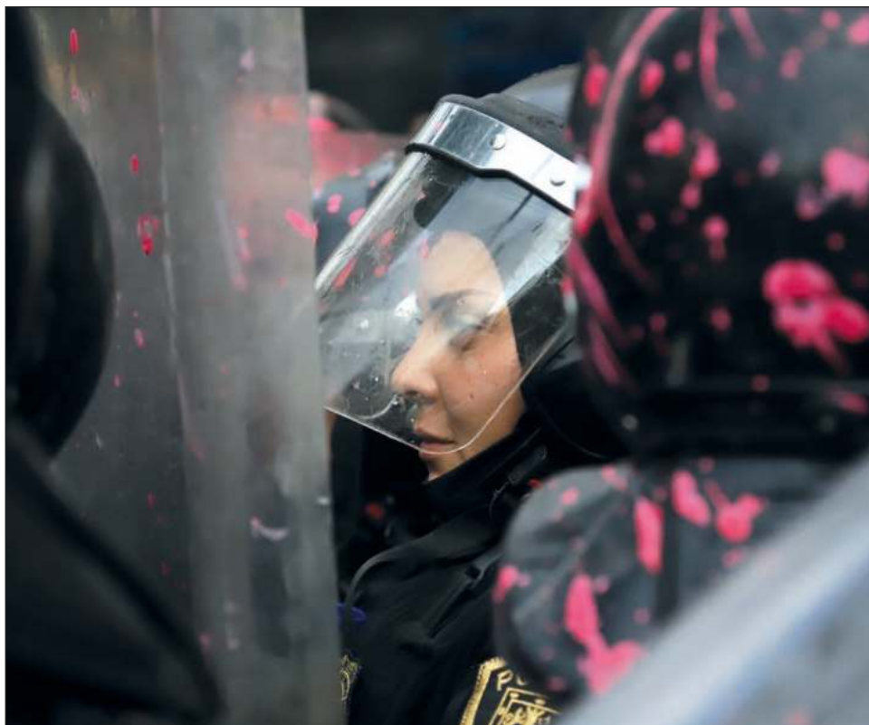
Policías encargados de la seguridad de las estaciones del Metrobús comentaron que este miércoles se retirarán los cristales para evitar que sean quebrados.

Mientras tanto, dueños y encargados de locales comerciales procedieron a colocar tapias de metal para proteger sus negocios ante