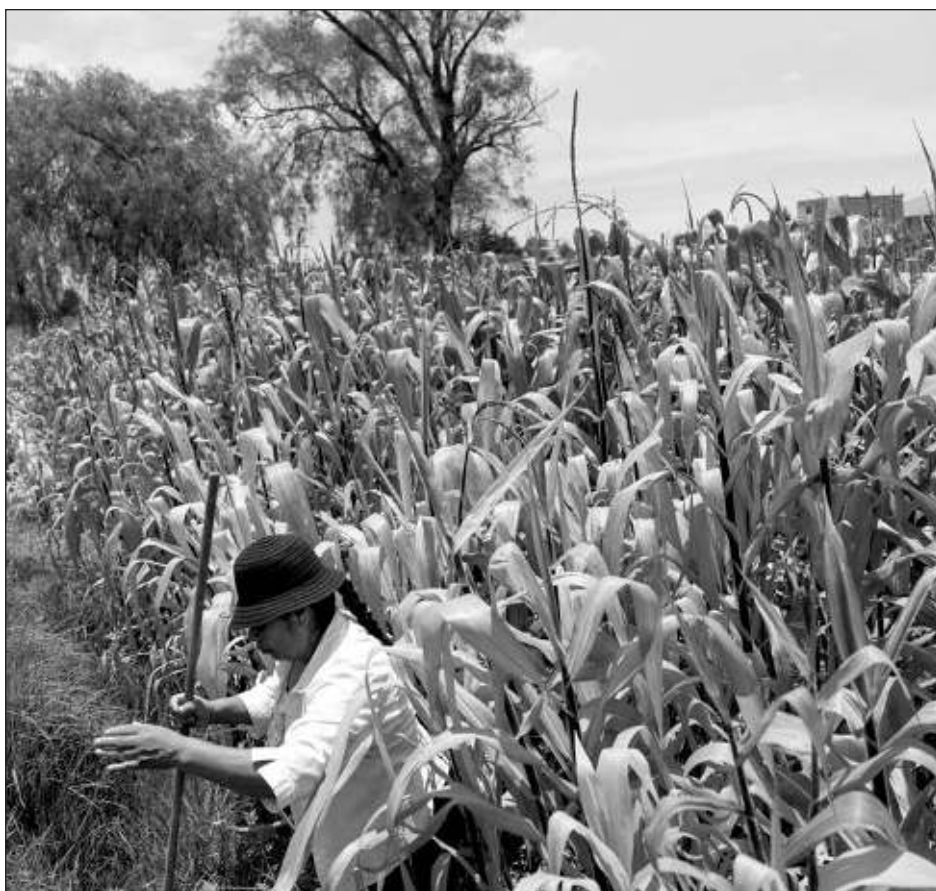
▲ El proceso de consultas fue invocado por la administración de Biden por las restricciones decretadas del gobierno de López Obrador al maíz transgénico y la prohibición del glifosato.