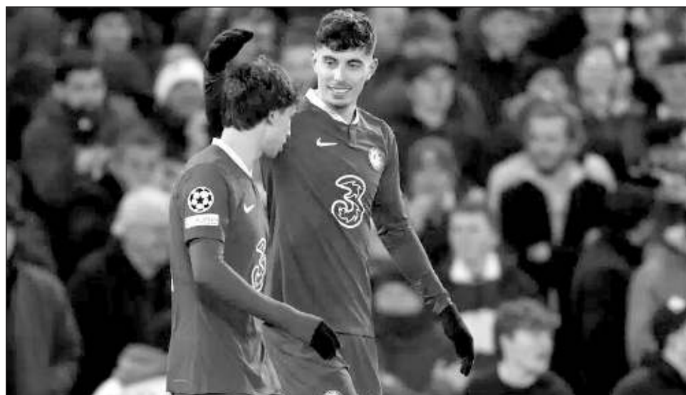
▲ Kai Havertz (derecha), del Chelsea, festeja con su compañero Joao Félix tras anotar ante el Borussia Dortmund. El alemán consiguió el segundo tanto con un penal.

"Hemos pasado por un duro periodo, y esta competencia significa mucho para nosotros", dijo Potter. "Queríamos avanzar a la ronda