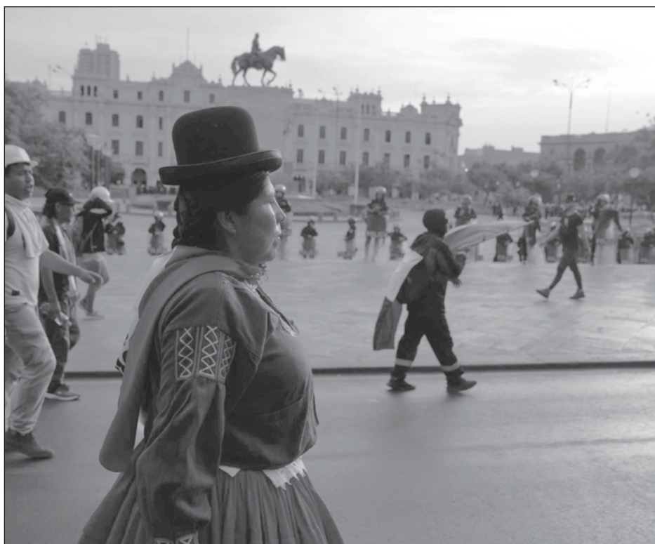
▲ Las protestas que exigen la renuncia de la presidente Dina Boluarte y la de los miembros del Parlamento han dejado al momento 66 muertos y más de mil 300 heridos.

Las organizaciones benéficas afirman que la gente se arriesga al peligroso viaje porque hay pocas avenidas legales y seguras para llegar a Gran Bretaña. El gobierno asegura que una vez la nueva ley esté en vigencia, establecerá más procesos para pedir asilo, además de los ya habilitados para personas de Afganistán, Hong Kong y Ucrania. No ha concretado cuántos solicitantes de asilo serán admitidos ni cuándo comenzará ese programa.