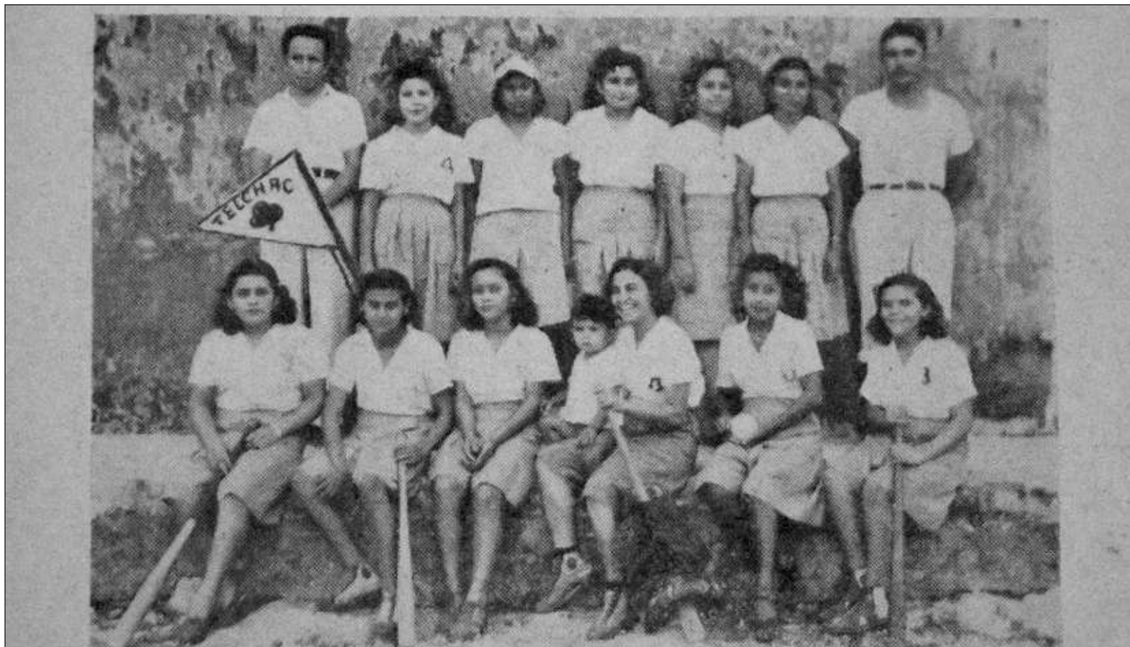
"Pues bien, no contamos con la referencia de que haya organizado un circuito femenino, pero una fotografía publicada en Deportes, el mensajero de la afición , en su número 30, confirma la existencia de equipos de softbol integrados por mujeres".