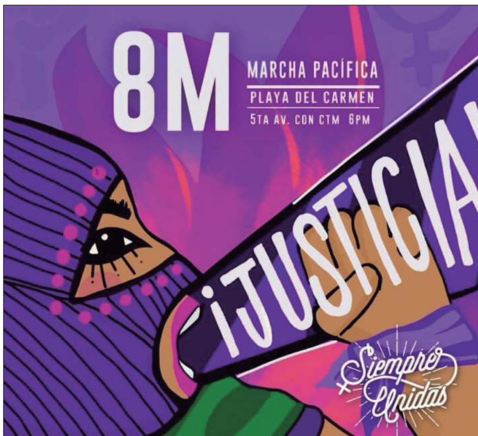
La movilización en Playa incluirá un contingente de madres que denuncian violencia vicaria y tendadero para exhibir a agresores, violadores y deudores alimenticios.

Recordó que por quinto año consecutivo la organización feminista de Tulum marchará este 8 de marzo, tras conformarse en el año 2019.