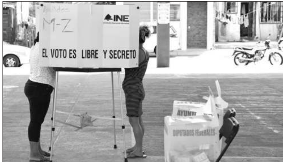
▲ Del 9 al 13 de marzo el Instituto Electoral de Quintana Roo abrirá el periodo para solicitar el registro de candidaturas para diputaciones por el principio de mayoría relativa.

En ese sentido, el Partido Revolucionario Institucio-