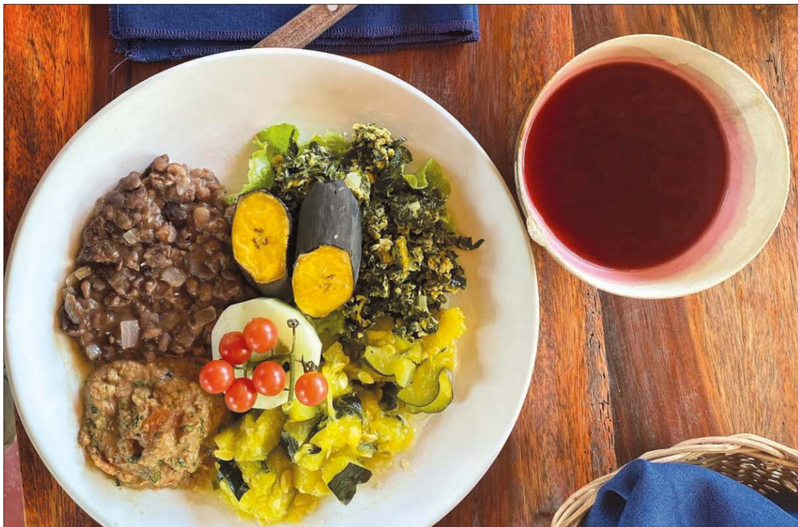
Los integrantes de la Comunidad de Aprendizaje se sumaron a otros colectivos para generar un mapeo colectivo y establecer en qué estatus se encuentra la zona norte, en particular la isla de Cozumel para los proyectos agrícolas.

Indicó que requieren que más personas se involucren en el tema, y en tanto imparten cursos de composta y otros, para que las personas se involucren y se sumen a las tareas de agricultura.