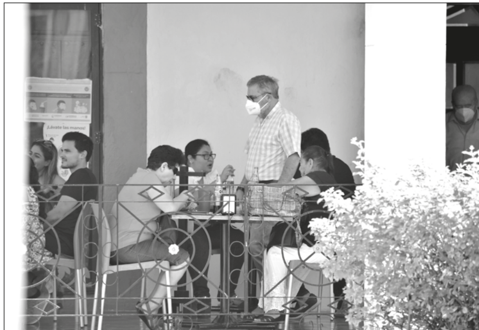
▲ Durante el carnaval, Carmen recibió una gran cantidad de visitantes, lo que hizo que los restaurantes incrementaran sus ventas entre 50 y 60 por ciento.

“Los socios de la Canirac han señalado que durante esta celebración, se registró un incremento en las ventas de entre 50 y 60 por ciento, lo cual ha sido un respiro importante para las finanzas de los empresarios del ramo,