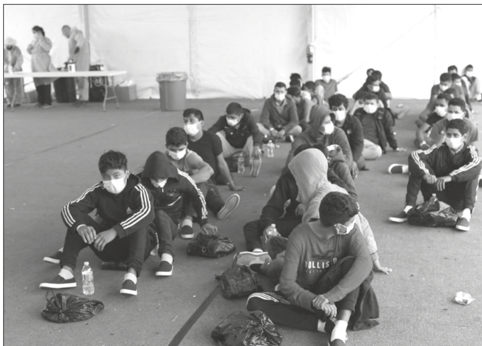
▲ Las autoridades de Estados Unidos actualizaron este lunes los criterios para que menores inmigrantes víctimas de abuso, negligencia o maltrato puedan permanecer en el país.

Biden exentó a los niños no acompañados de la expulsión y les permitió permanecer en Estados Unidos mientras hacen efectivas sus solicitudes de asilo. Las familias con niños a menudo también son dejadas en libertad en el país.