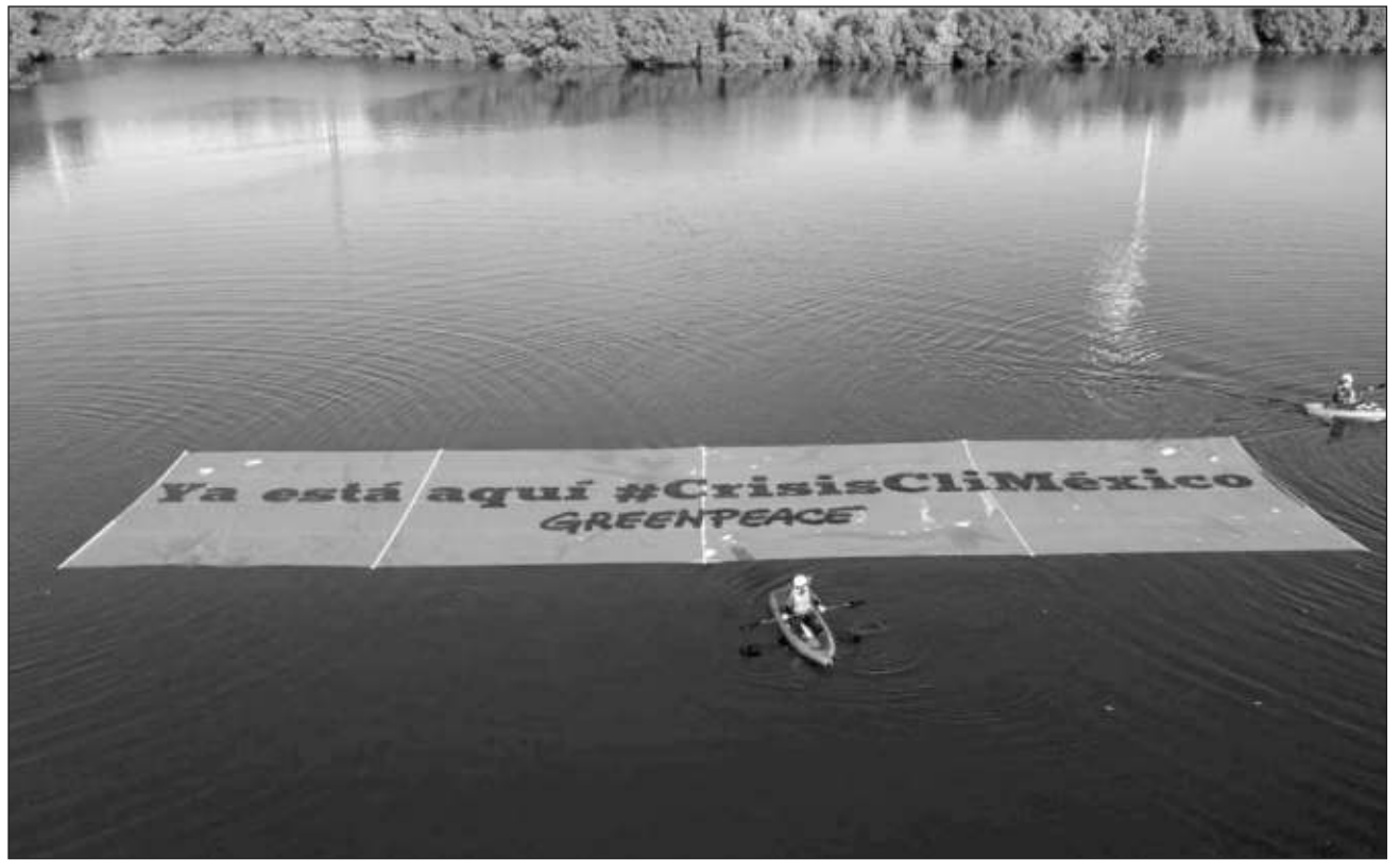
▲ Con el acuerdo, se crearía una red de santuarios marinos encaminada a limitar actividades depredadoras como la pesca industrial excesiva, la minería submarina, la explotación petrolera y la contaminación plástica.

“Los océanos están en crisis y toda la biodiversidad que albergan se encuentra en una situación de gran vulnerabilidad, no sólo debido a las actividades humanas sino a consecuencia del cambio climático. Los gobiernos tienen que actuar ahora y de manera decisiva para protegerlos y evitar