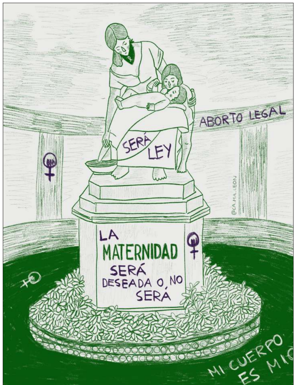
La marcha del 8M es necesaria para visibilizar la exigencia de justicia para las víctimas de violencia de género, la crisis de las desaparecidas, el acoso callejero y todas las situaciones que viven las mujeres.