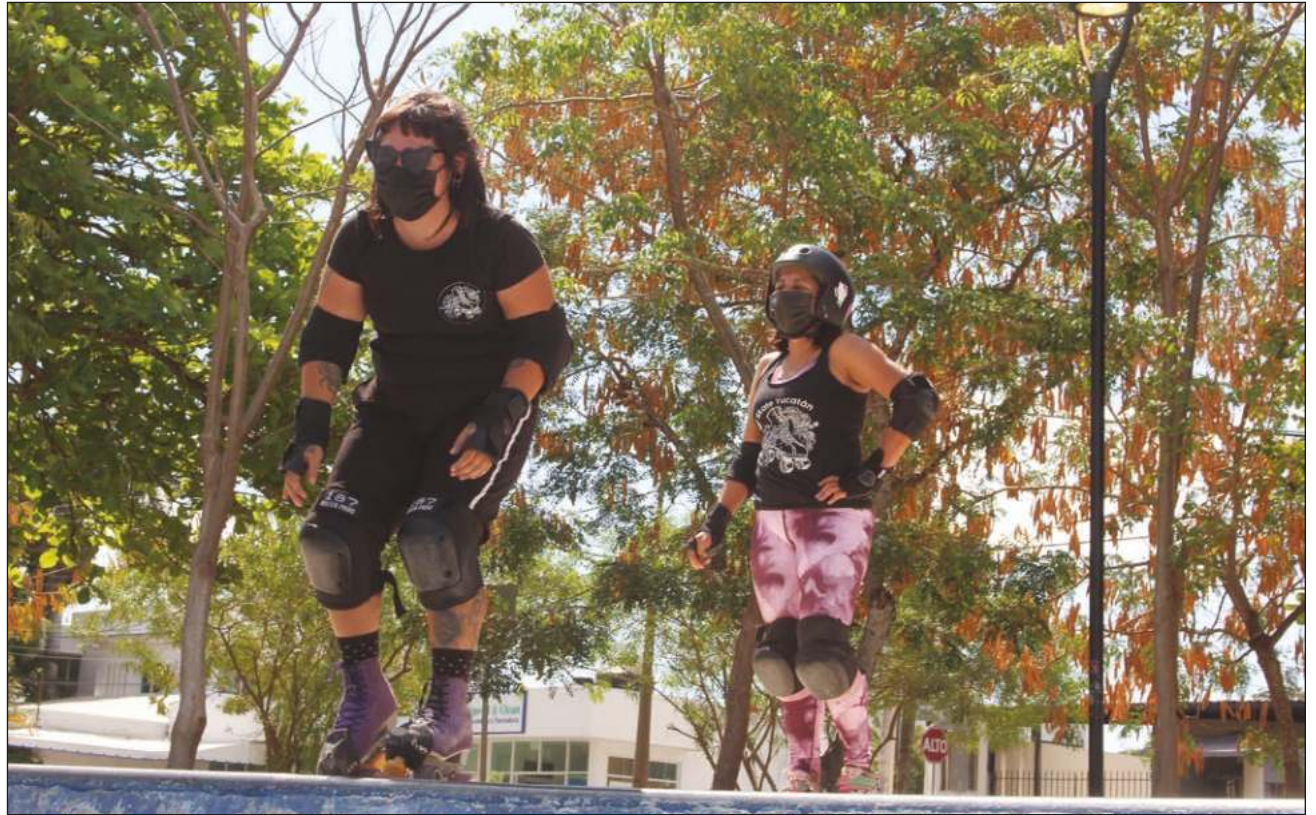
La enseñanza desde un enfoque no competitivo, sino desde la confianza es lo que distingue a las patinadoras.

Enseñan no desde un enfoque competitivo, sino a través de la confianza y la motivación. Ambas chicas transmiten sus experiencias con paciencia y precisión a mujeres que apenas inician. Las impulsan para confiar en ellas mismas, a no tener miedo a caerse, y si esto pasa les mues-