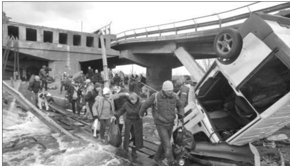
▲ Los esfuerzos para habilitar pasos seguros para los civiles en zonas sitiadas han fracasado, en medio de los bombardeos incesantes.

Ambas partes se reunieron en una tercera ronda de discusiones el lunes, de acuerdo con medios estatales rusos, si bien eran pocas las esperanzas de algún avance importante. Los ministros del Exterior de ambos países también tienen programado reunirse en Turquía el jueves, de acuerdo con el máximo diplomático turco.