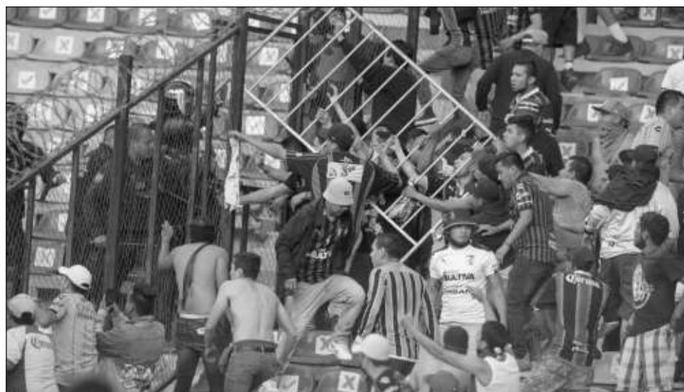
▲ El Querétaro podría ser desafiado por la violencia que se desató en su estadio el sábado pasado.

El encuentro del torneo Clausura fue interrumpido a los 62 minutos cuando aficionados ingresaron al campo, buscando alejarse de una pelea entre barras del Querétaro y el visitante Atlas — actual campeón—, que comenzó en la cabecera norte del estadio.