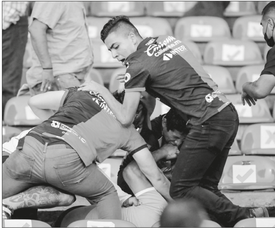
▲ El Presidente indicó que el gobernador de Querétaro ha informado bien sobre la gresca en el estadio Corregidora, durante un partido entre el Atlas y los Gallos.