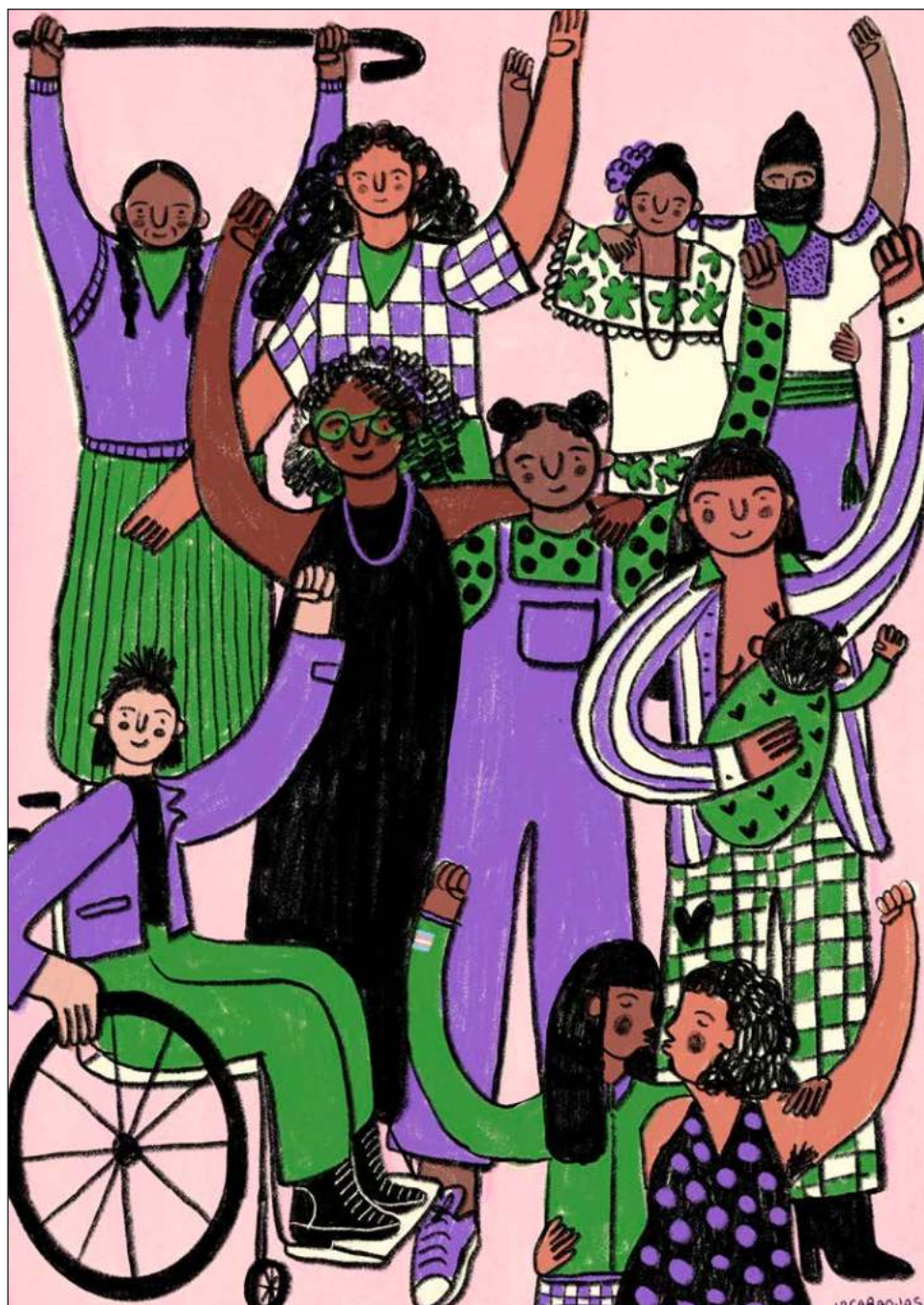
U yantal le péeksajila', k'aanan ti'al u chíikbesa'al u k'áata'al ka yanak kéet kuxtal ti'al máaxo'ob loobilta'ano'ob, beyxan ko'olel ku sa'atbesa'al, u ya'alal ba'al te'e bejo'obo' yéetel uláak' ba'alo'ob ku máansik ko'olel. Boonil @jacaranjas

Centro Cultural y de Derechos Humanos "Casa Colibrí" ku páayt'antiko'ob u ko'olelil Cuzamá, Nohchakan, Eknakan yéetel Chunkanan ti'al u beeta'al xiimbalil líik'saj t'aan, láas 6:00 u taal u chíinil k'iin. Motule' yaan xan u beeta'ali', yéetel u páayt'anile' beeta'ab tumen Violetas del Mayab, ba'ale' le je'ela', ti'al u k'iinil sábado 12 ti' marzo, láas 5 u taal u chíinil k'iin.