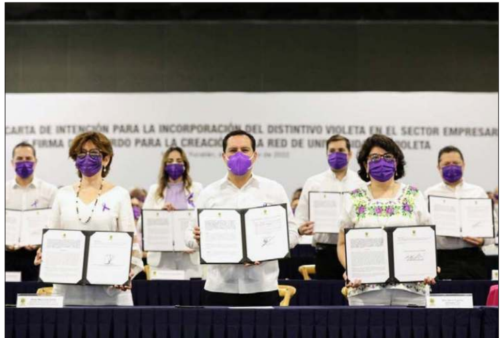
La iniciativa presentada este lunes reconoce la importancia de la participación de las mujeres en los distintos ámbitos de la vida pública y privada.

“Estamos conscientes que esta tarea requiere de sumar todas las voces y voluntades