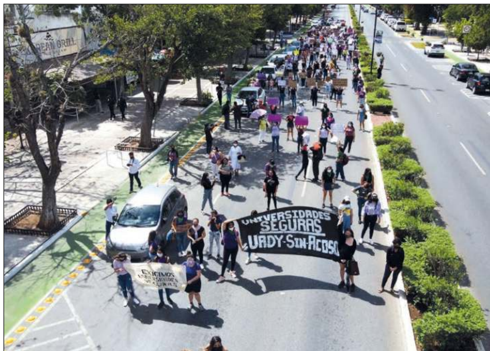
▲ Las mujeres generarán espacios de denuncia como tendedores y micrófonos abiertos para señalar a los agresores.

La manifestación transincluyente ha dado a cono-