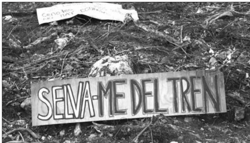
▲ El Presidente señala que de las 100 mil hectáreas que serán impactadas por el mega proyecto, la federación reforestará el doble.

Destacó que el domingo, tras sobrevolar la zona, ex-