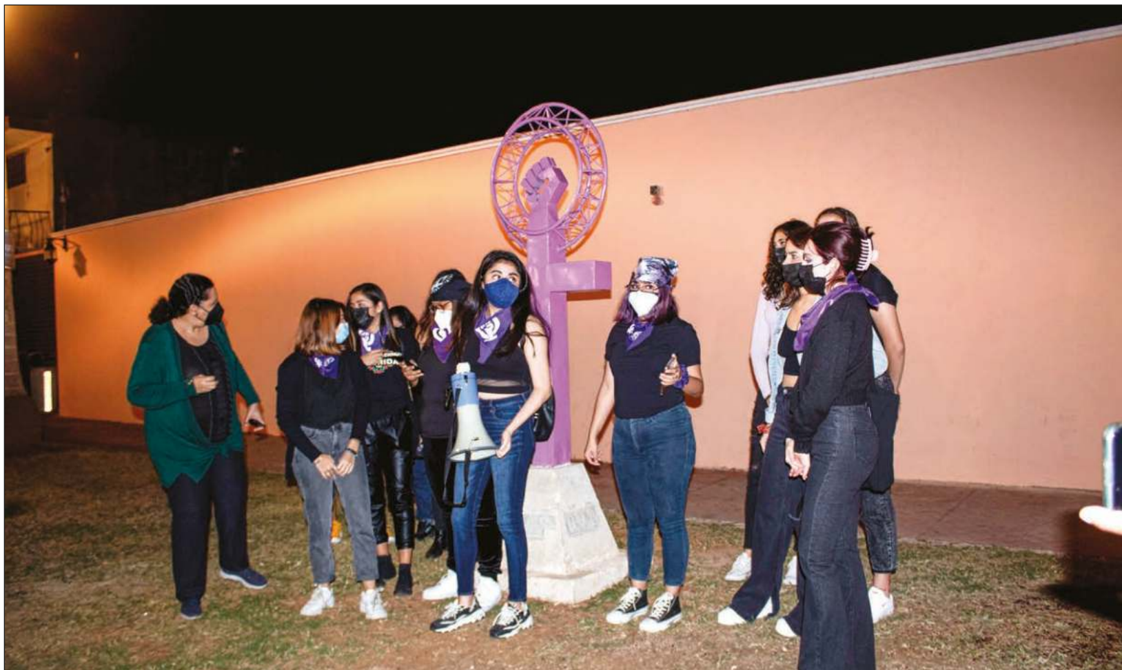
El caso de violencia digital contra universitarias en Yucatán tuvo casi nulo seguimiento en los medios de la península por un sesgo patriarcal.