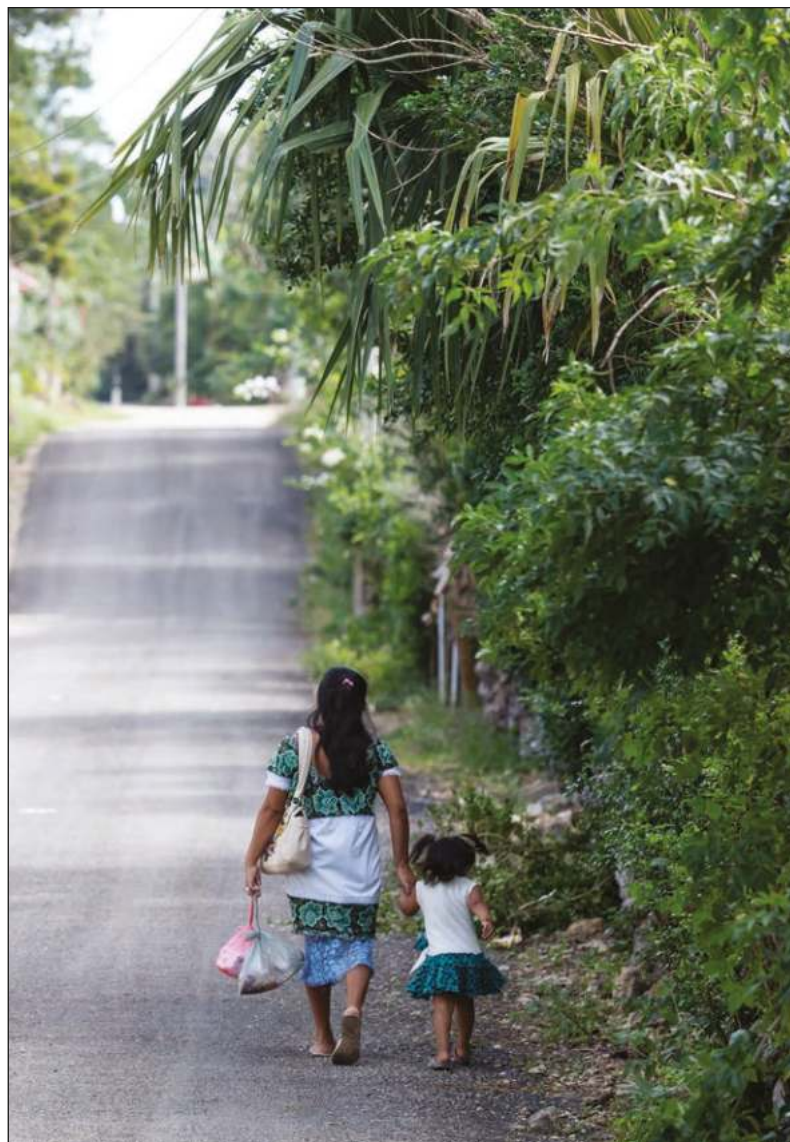
La sororidad nos hace vernos reflejadas la una en la otra.