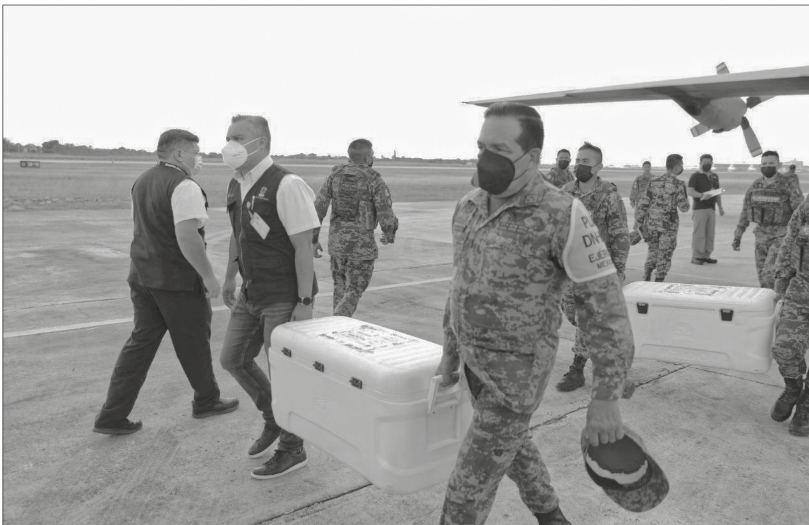
▲ El cargamento de vacunas arribó a bordo de una aeronave Hércules de la Fuerza Aérea Mexicana, procedente de la capital del país.