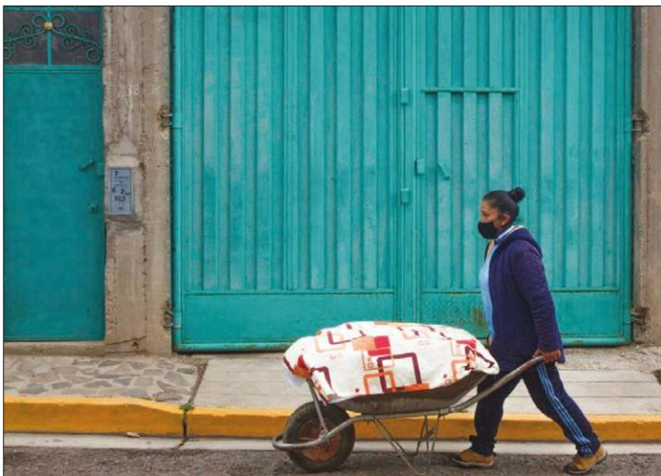
▲ El coronavirus agravó la desigualdad de género laboral en Perú y en el resto de América Latina, donde más de cuatro millones de mujeres aún no recuperan el empleo.

Según la OIT, 24 millones de mujeres perdieron su empleo por la pandemia en Latinoamérica y más de cuatro millones continúan sin trabajo.