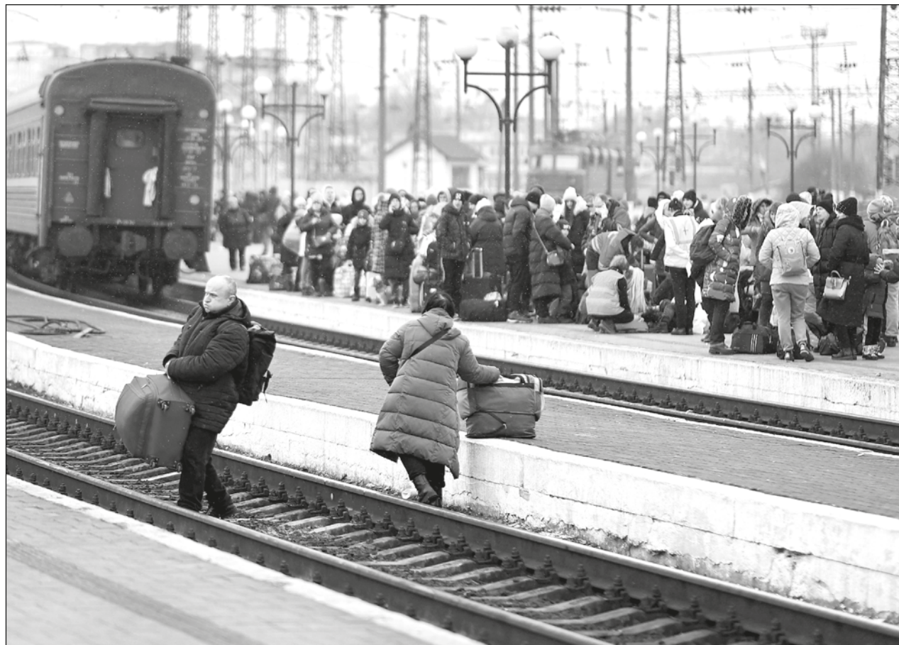
▲ La apertura de corredores humanitarios inició a las 10 horas de este lunes, desde las ciudades ucranianas de Kiev, Járkov, Mariúpol y Sumy.

Corredores humanitarios dirigen a ese país // Propuesta es "absurda, cínica e inaceptable", indica Irina Vereshchuk