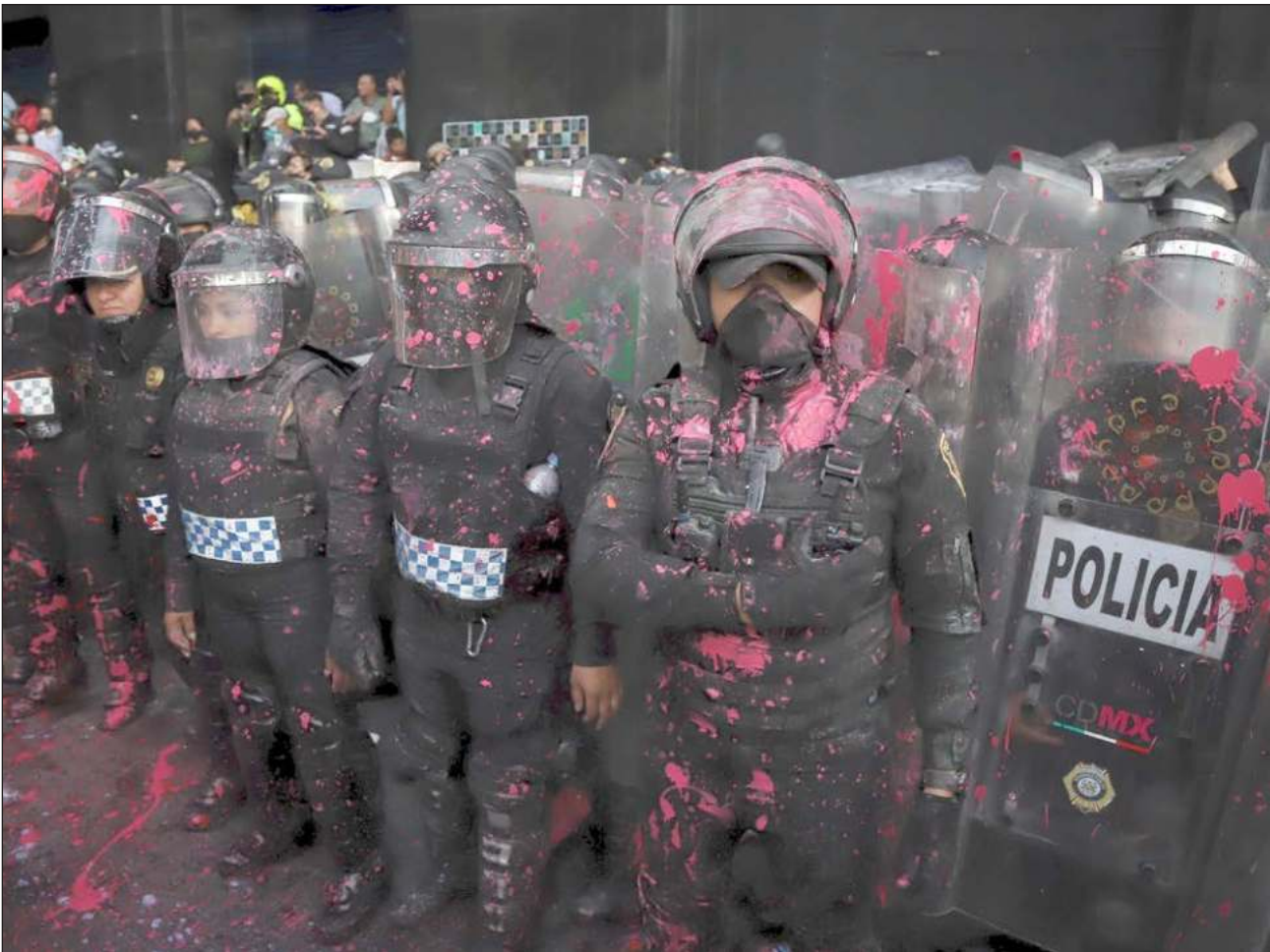
El gobierno de la Ciudad de México desplegará 3 mil mujeres policía para el resguardo de la marcha por el Día Internacional de la Mujer en la capital del país.