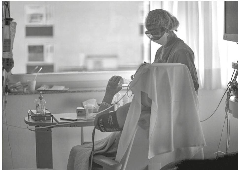
▲ El estudio proporciona un profundo conocimiento del proceso de la enfermedad y supone un gran paso adelante para encontrar tratamientos más eficaces.

Después, los compararon con los de otras 48 mil 400 personas que no habían pa-