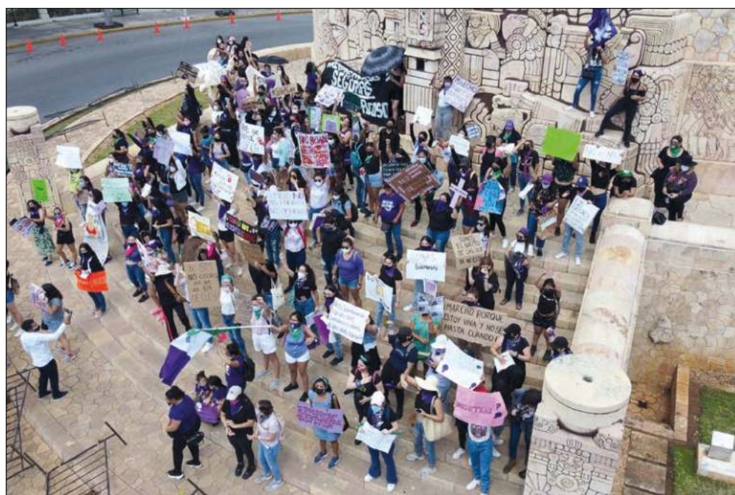
Acostumbradas ya estamos a ser juzgadas, por nuestro cuerpo y el espacio que ocupa, por nuestra vestimenta, por nuestra edad y comportamiento, y ahora, por cómo decidimos abordar el feminismo en nuestra vida.