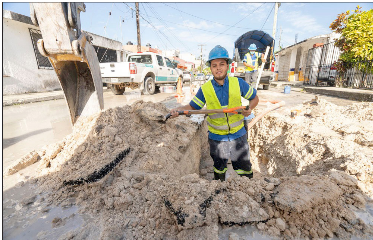
▲ Durante 2020, la prioridad fue pensar de manera integral, iniciando por los colaboradores, apoyándolos en todo momento y manteniendo los puestos de trabajo al 100%.

Mediante un comunicado, el ayuntamiento señaló que con los trabajos de mantenimiento, el gobierno municipal cumple su compromiso de preservar las costumbres y tradiciones de la cultura maya que se mantiene viva a través de los años y coadyuva para preservar los espacios donde se realizan las actividades de la población tulumense.