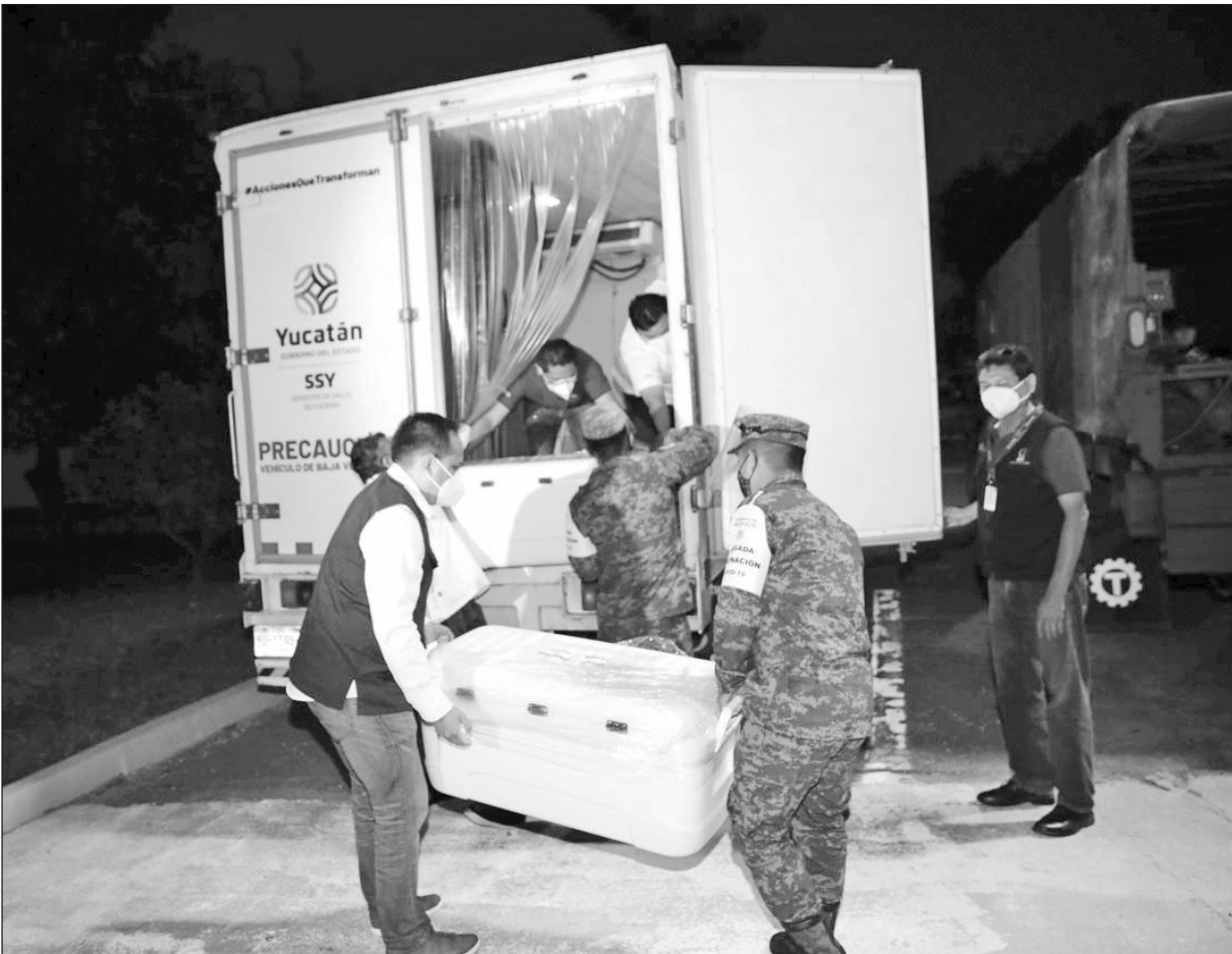
▲ El cargamento del biológico de Sinovac llegó a la entidad este domingo.