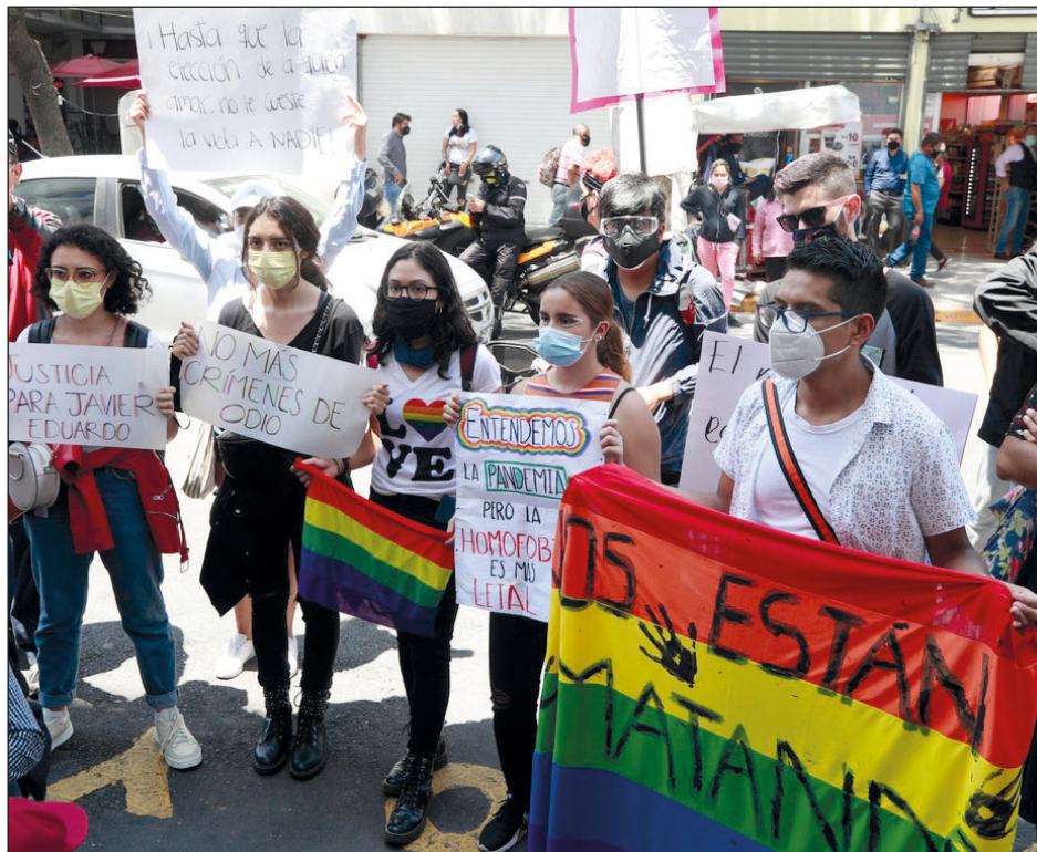
▲ Colectivos LGBT demanda justicia por los asesinatos ocurridos en contra de algunos de sus miembros.

Mencionó que 32 por ciento de las personas se sintió "de muy a extremadamente sofocadas por el hecho de no poder expresar con su familia su identidad como persona gay, lesbiana, bisexual o trans". Y el 46 por