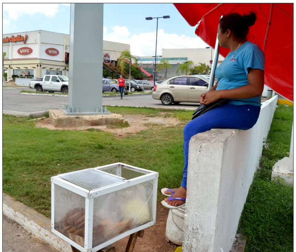
Las nenis , según Igualdad Sustantiva Yucatán, le apuestan a la economía circular de mujeres para mujeres.