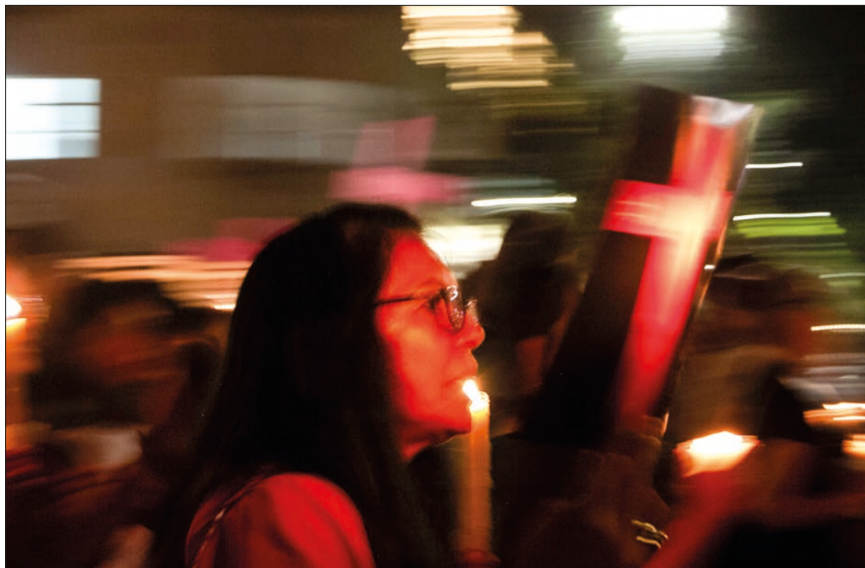
Las mujeres, quienes hemos iluminado, alimentado y protegido la gran cueva universal desde el inicio de los tiempos, no estamos dispuestas a vivir con miedo de quien ya amenazó.

Considero que no es la falta de respeto sino el dialogo lo que debe prevalecer entre nosotros. Escuchar y el intercambio de ideas y argumentos nos permitirá llegar a un consenso que beneficie a México.