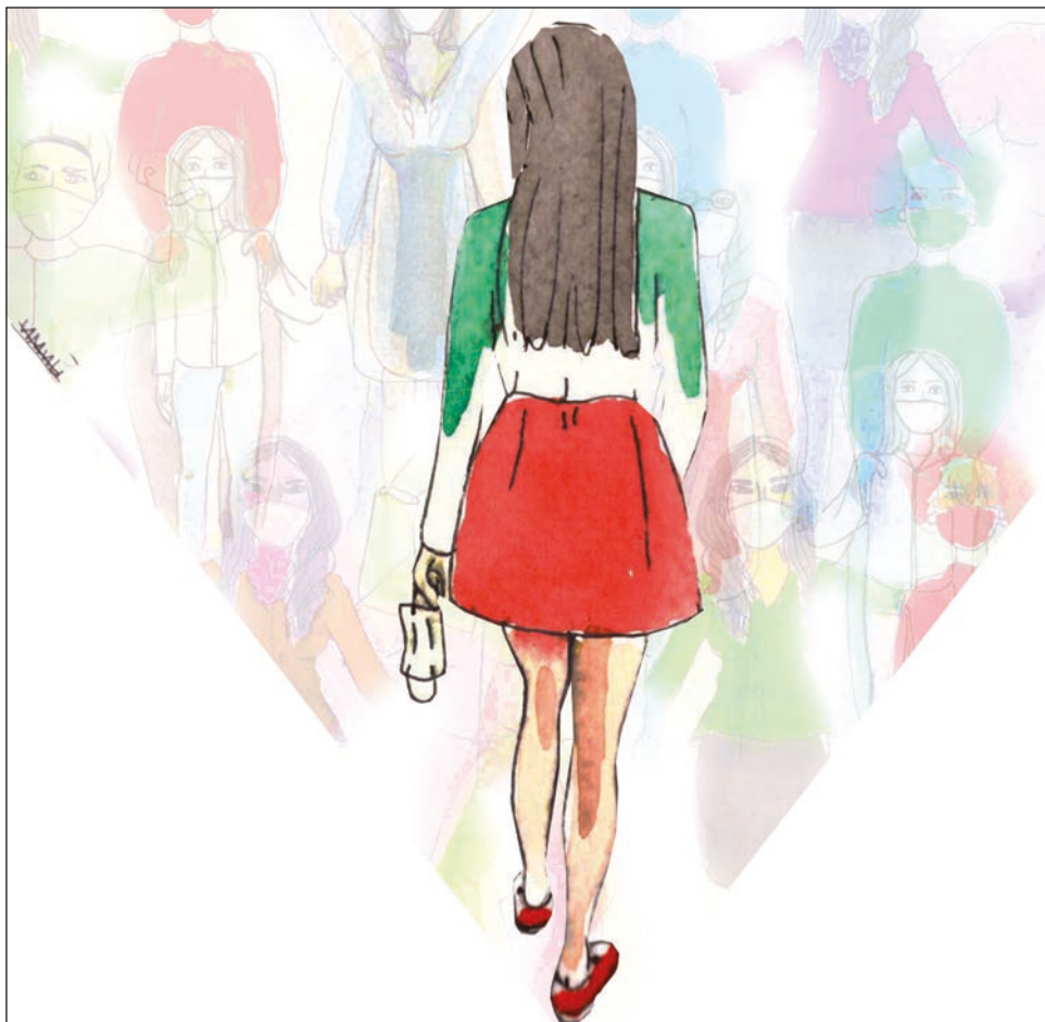
El personal administrativo y maestras de escuelas y universidades también están invitadas a este movimiento. Ilustración Viviana Bugliani

Convocan al paro las colectivas El aquelarre de Leta, Herederas de Montoya, Buhás Sororas, Hijas de Lilith, Colectiva Apolonia, Las herederas de Antonia, El círculo de Marie, Violetas de Elvia, Economía Violeta; además de otras organizaciones como UADY sin Acoso, Igualdad Sustantiva Yucatán, Sé La Diferencia y Feminista del Mayab.