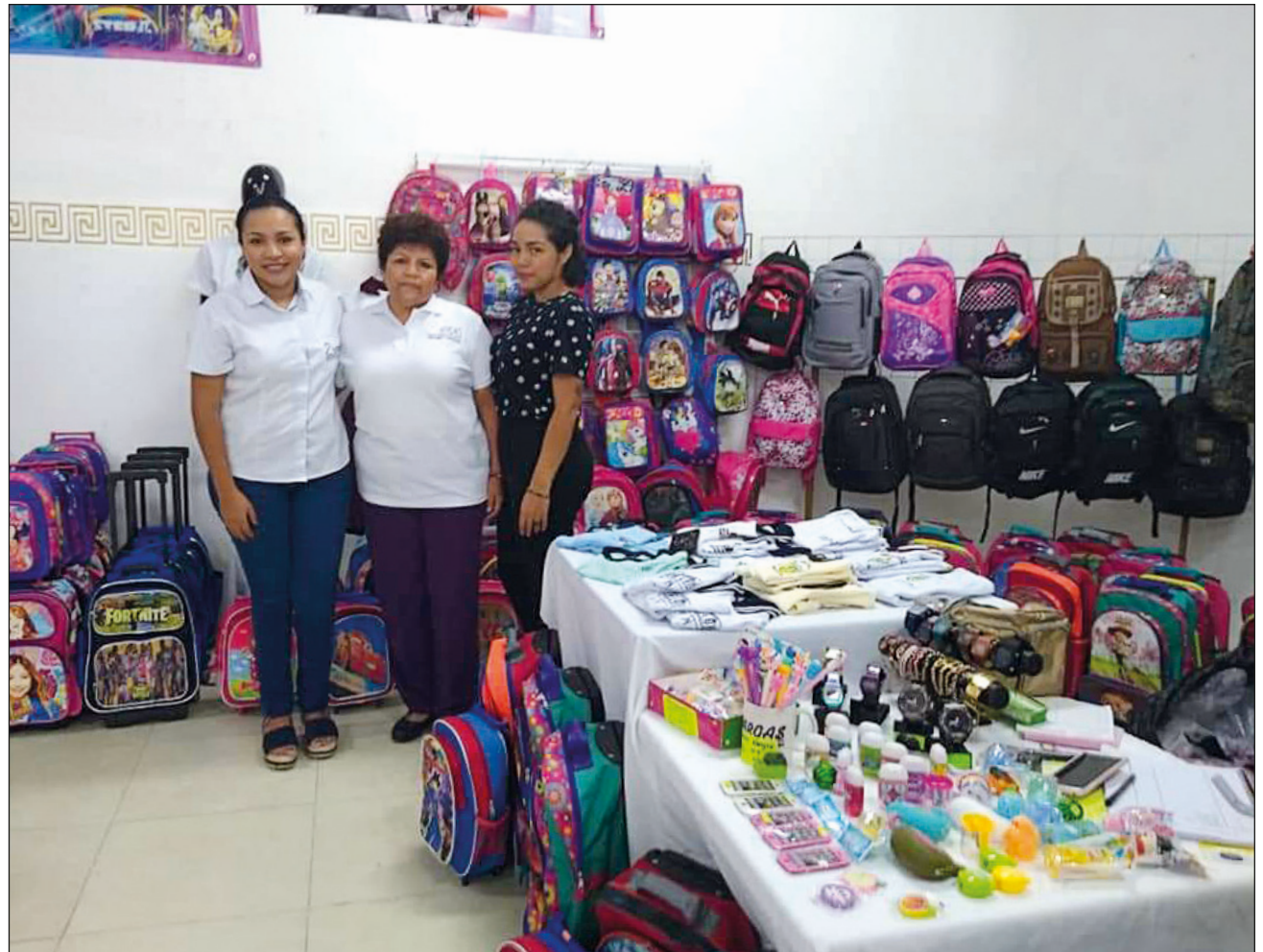
El negocio familiar es una clara muestra de un emprendimiento hecho y sostenido únicamente por mujeres durante más de medio siglo y varias generaciones. Foto Uniformes Vargas

Esa costura, principalmente de vestidos, era ropa a medida que le solicitaban los vecinos y quienes la conocían. Así empezó el legado de la familia Vargas, ya que