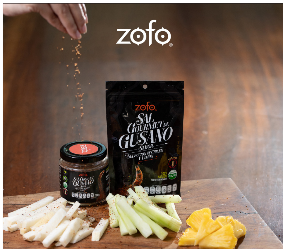
▲ En agosto de 2019, la empresa Zofo lanzó al mercado la sal de gusano y botana de gusano, tras año y medio de desarrollo.

Recién lanzado su producto tuvieron que enfrentar la pandemia, en 2020, una etapa “muy difícil”, pues estaban a punto de expandirse a todas las tiendas La Europea del país. Al cerrar todas las tiendas bajaron la producción. “Yo entro en