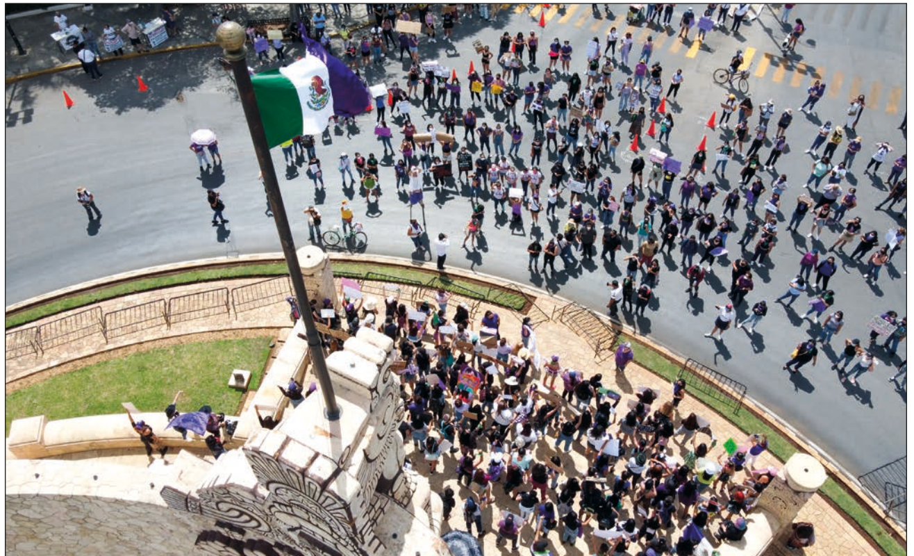
Las consignas reflejaron el llamado de justicia a las autoridades, por la violencia de género.

Mientras tanto, otras llevaban pancartas de diversos tamaños y realizadas con variedad de materiales, en