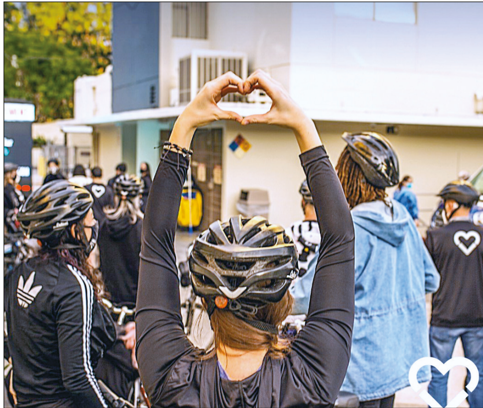
Alrededor de 77 por ciento de quienes buscan cambiar su alimentación hacia el veganismo son mujeres.

"La lucha por la igualdad de género también debe tomar en cuenta la distribución en las labores del hogar, que el cuidado de los niños y la