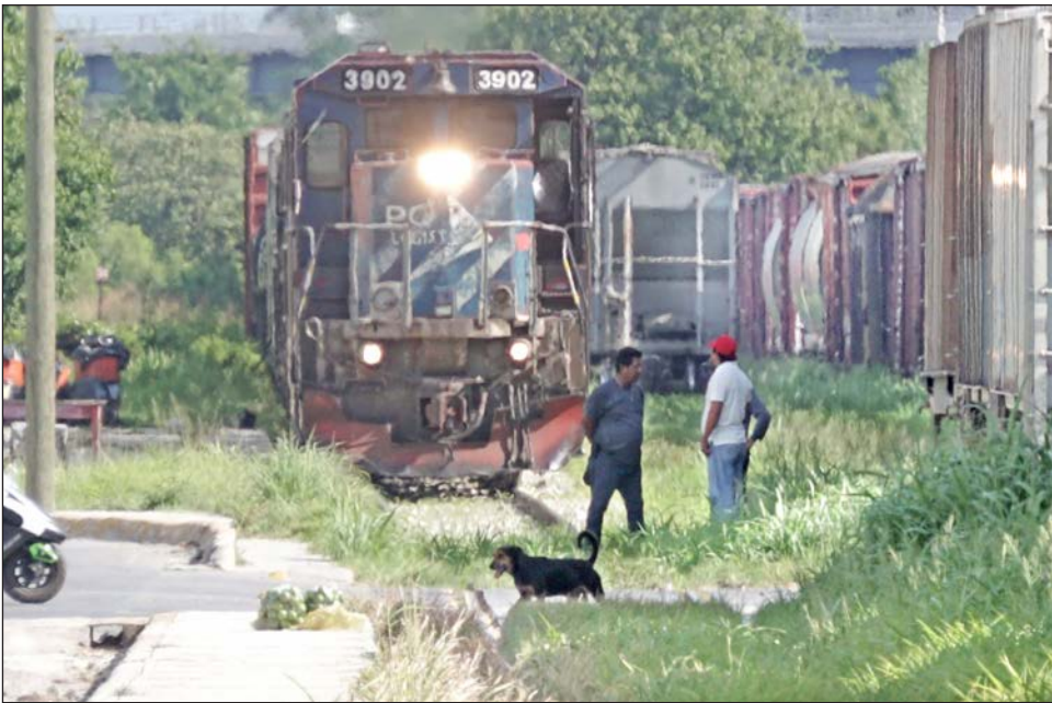
▲ Al menos 15 familias fueron indemnizadas por sus casas.