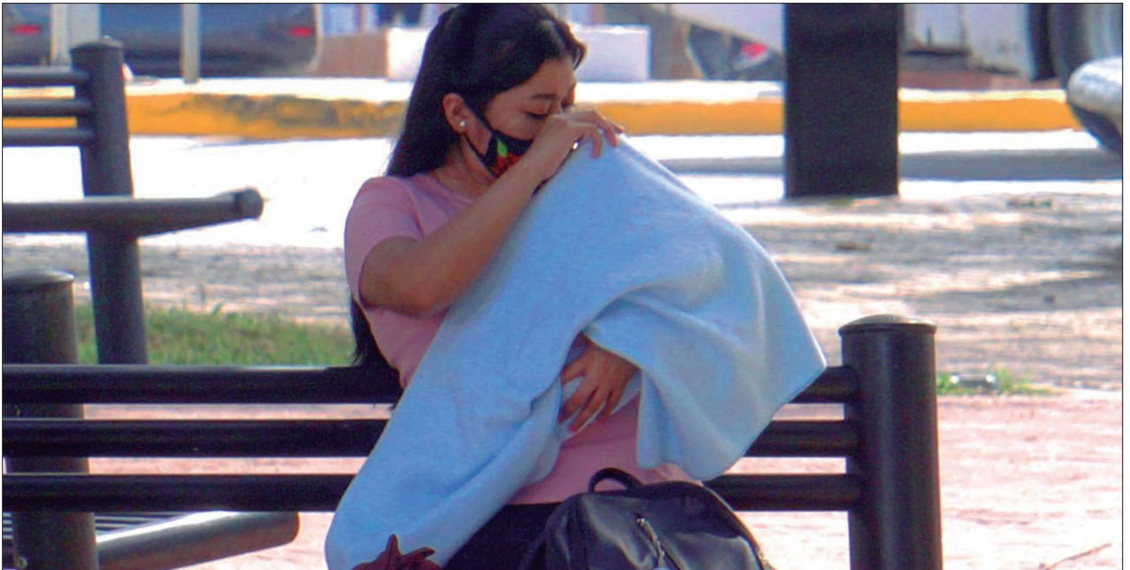
Casi nueve de cada diez nacimientos ocurridos en Quintana Roo corresponden a madres con edades entre 15 y 34 años.