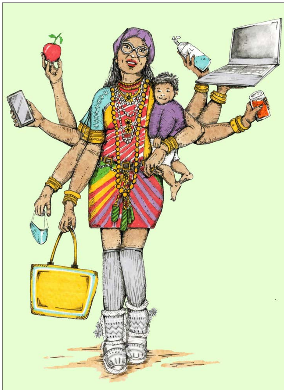
En el pasado mes de enero, se observó que las mujeres ganaban en promedio 12 por ciento menos que los hombres. Ilustración Sergiopv @serpervil

Eso por el lado del empleo formal, pero los datos del Inegi —que expresan de manera más amplia los ingresos laborales de la población, dado que abarcan empleo y actividades no reguladas— muestran que entre el primer trimestre del año pasado y el cuarto se amplió la presencia de los hombres frente a las mujeres en los rangos salariales más altos.