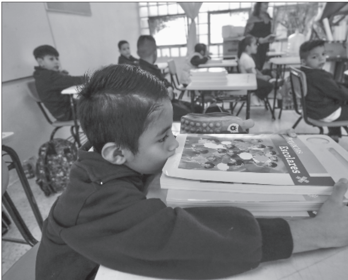
▲ “La actual crisis no es, del todo, una crisis generacional, es una crisis de sistema, de un sistema hegemónico y depresivo que ha construido engranes de maquinaria y robots operativos que mantengan una matrix”.

La faena requiere un diagnóstico de la situación. Como humanidad, en general, hemos perdido el contacto con la naturaleza, la sensibilidad hacia lo que nos rodea, nos hemos alejado de otras expresiones artísticas y humanísticas que nos permitan reflexionar. Desde mi aposento de gente de ciencia reconozco que para la descripción y el entendimiento que tratamos de realizar de la naturaleza, resultan insuficientes las actuales visiones de la ciencia, la tecnología y las humanidades (CTH), por supuesto que nos alimentan espiritualmente a quienes amamos las CTH. Sin embargo, su manera de abordar la comprensión de la naturaleza no representa la única, la poesía, la música, la literatura, la filosofía, la teología, la historia, el arte y demás expresiones permiten armar un rompecabezas aún incom-