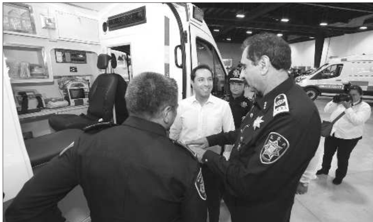
▲ La dotación del gobierno encabezado por Mauricio Vila a la SSP también incluyó 20 ambulancias: cinco camionetas Ram Promaster 2500 modelo 2023 tipo II Soporte Vital Avanzado y 15 tipo Transit 2023.

Trece motocicletas Gixxer Naked modelo 2024 marca Suzuki, equipada como patrulla con balizamiento color negro e incluye kit profesional de sirena y bocina con controlador de sonido, luces y micrófono con clip para casco, defensa y male-