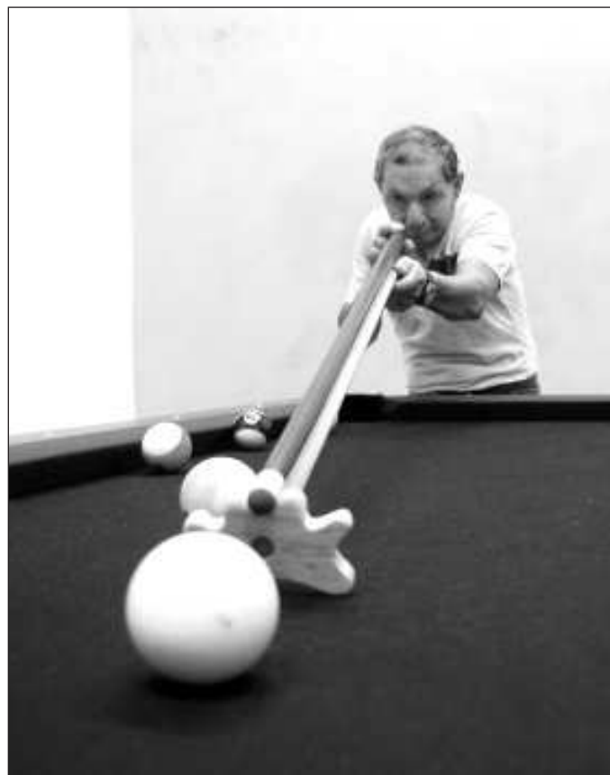
▲ Difícilmente se aprobará garantizar que se jubilen con 100% de su último sueldo si no se venden los terrenos de Fonatur.

El otro factor es cuánto dinero público se destinará a jubilaciones y pensiones. El pasado 31 de enero, la Secretaría de Hacienda y Crédito Público dio a conocer que durante 2023 destinó un billón 302 mil 736.1 pesos a este rubro, equi-