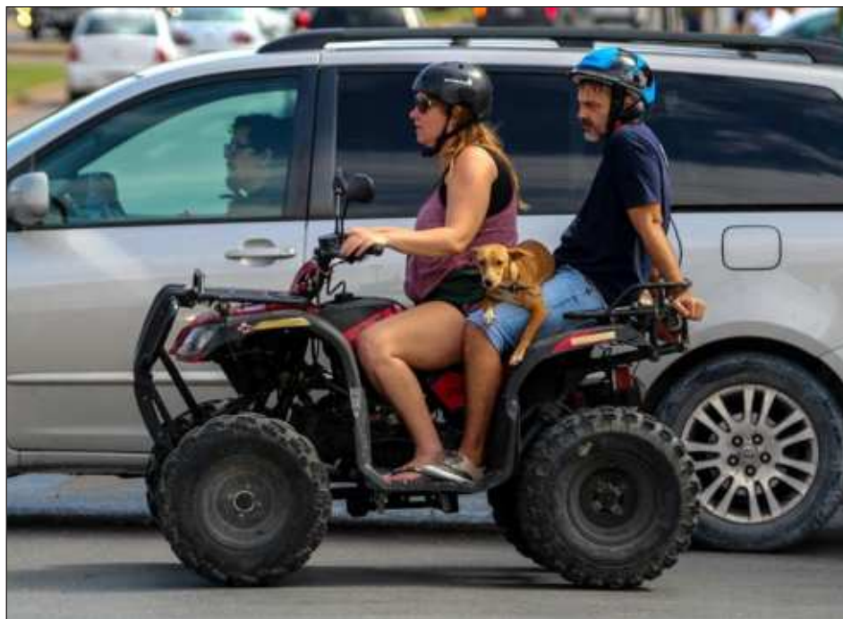
▲ A través de la campaña Amar es cuidar se han entregado ya más de 18 mil plaquitas de identificación para evitar que los animales pierdan a su familia.

Extendió la invitación a toda la población para que sigan haciendo las plaquitas para sus perros, por ser muy importante para ayudar a reducir toda la fauna callejera que hay en la ciudad e incluso en el estado. Son plaquitas que se entregan a cambio de un donativo de mínimo 30 pesos en adelante por cada una, lo que la gente quiera donar; se hacen en las oficinas de la empresa con citas de lunes a jueves de 9 de la mañana a 5 de la tarde y los viernes de 9 de la mañana a 2 de la tarde.