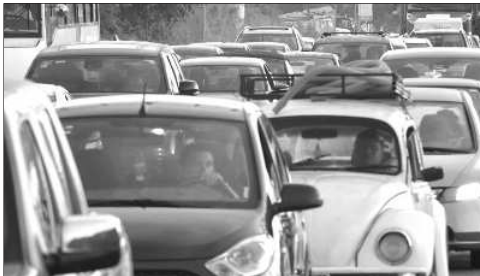
▲ La Asociación Mexicana de Instituciones de Seguros destacó que 55 por ciento de los robos del país las familias asumen las pérdidas de su patrimonio.

“No prevemos que regresemos a los números pre-