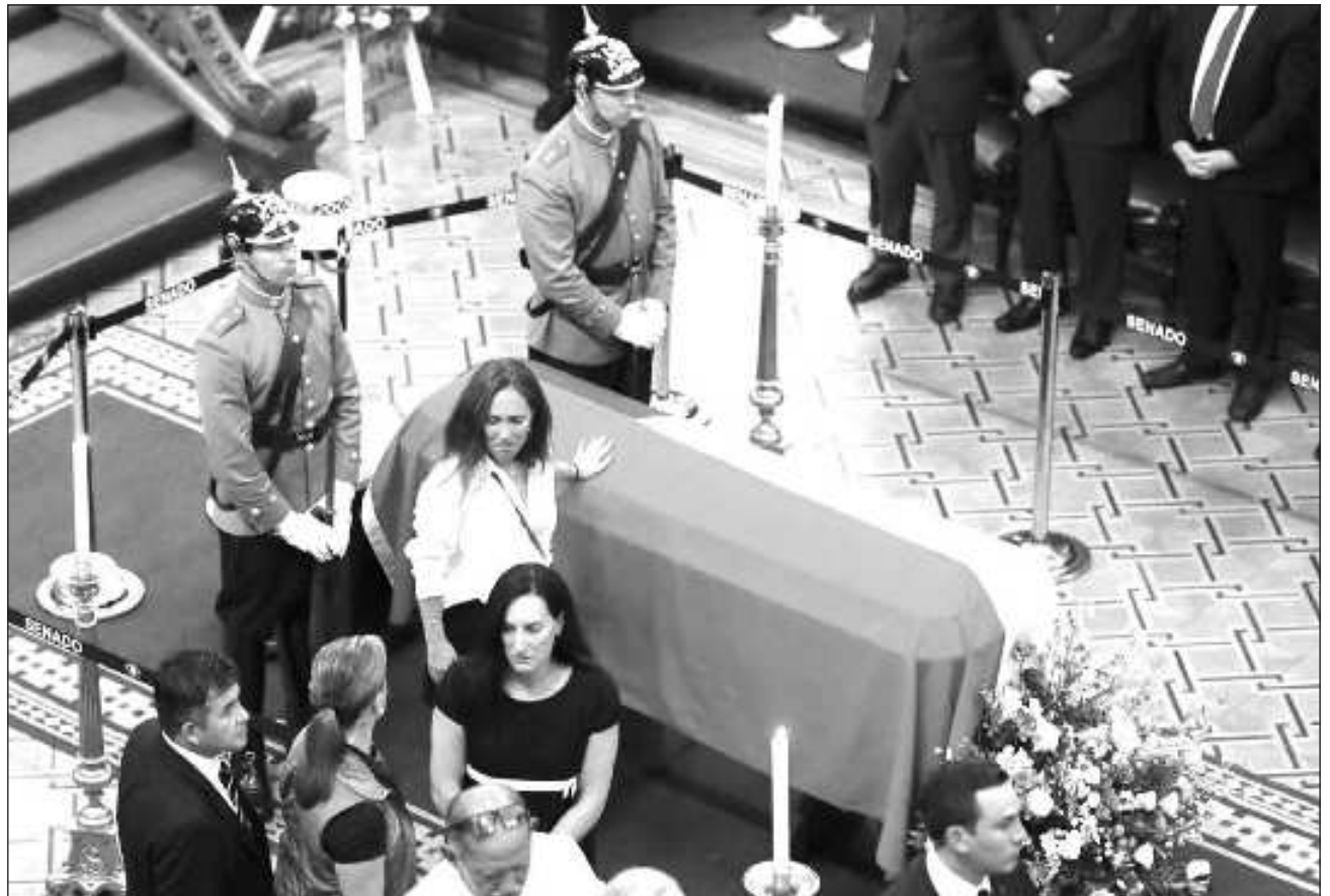
▲ Para el viernes está programado el traslado de los restos del ex presidente a la Catedral Metropolitana, donde se llevará a cabo una misa a la que asistirán "aquellos líderes o presidentes extranjeros que desean participar en el funeral".