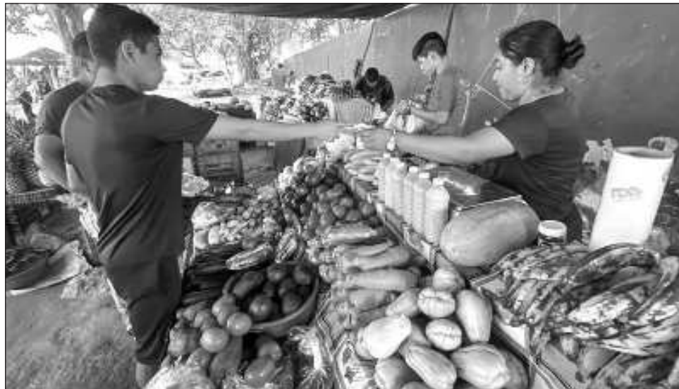
▲ AMLO subrayó que si esta iniciativa de reforma al artículo 123 de la Constitución se aprueba, no se repetirá la pérdida en el poder adquisitivo que se tuvo durante el periodo neoliberal.

Al respecto, el jefe del Ejecutivo subrayó que si esta iniciativa de reforma al artículo 123 de la Constitución se aprueba, no se repetirá la pérdida en el poder