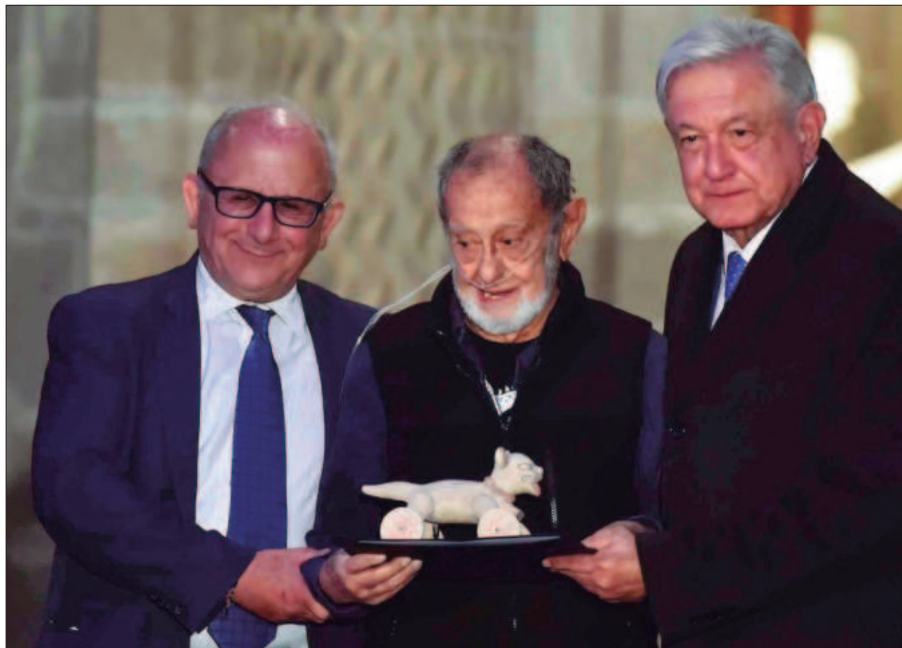
▲ La dependencia a su cargo atiende 193 zonas arqueológicas, una zona paleontológica y 162 museos.