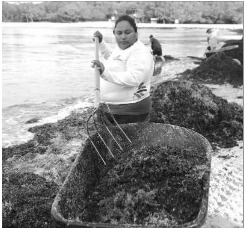
▲ El año pasado se recolectaron 26 mil 400 toneladas de sargazo y se recuperaron más de 13 mil toneladas de arena en el municipio.

Las aerolíneas estadounidenses United, Delta, Spirit y American Airlines, y la canadiense Air Canada informaron desde 2023 que a partir de marzo tendrán operaciones con el nuevo aeropuerto de la selva.