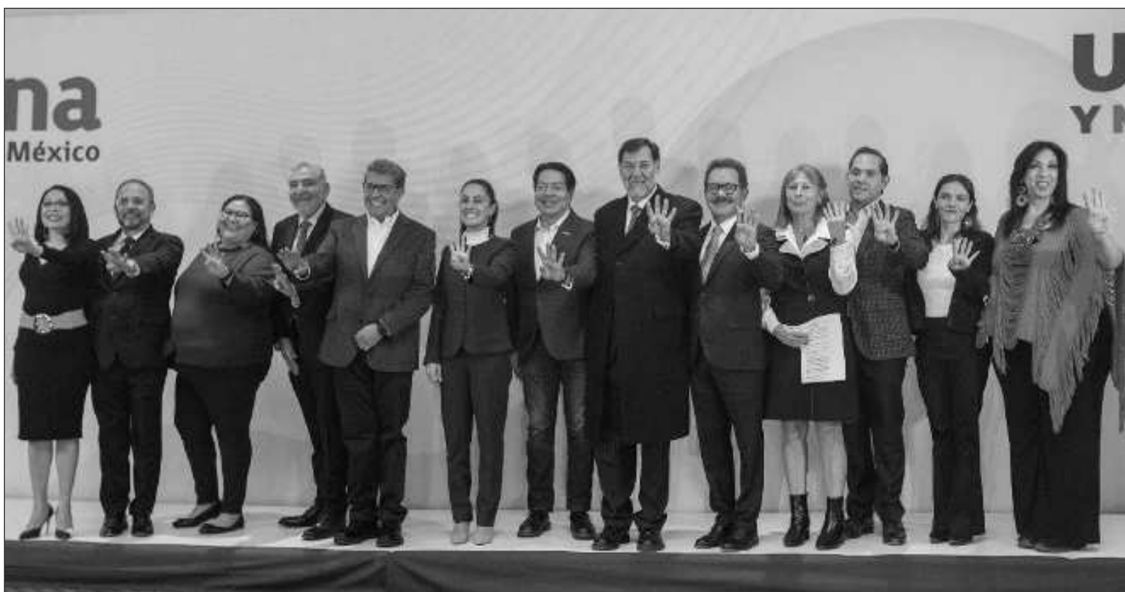
▲ "Cumplió puntualmente el libreto diseñado para 'justificar' que la parte más nefasta de la élite de Estados Unidos intervenga en el proceso electoral mexicano".