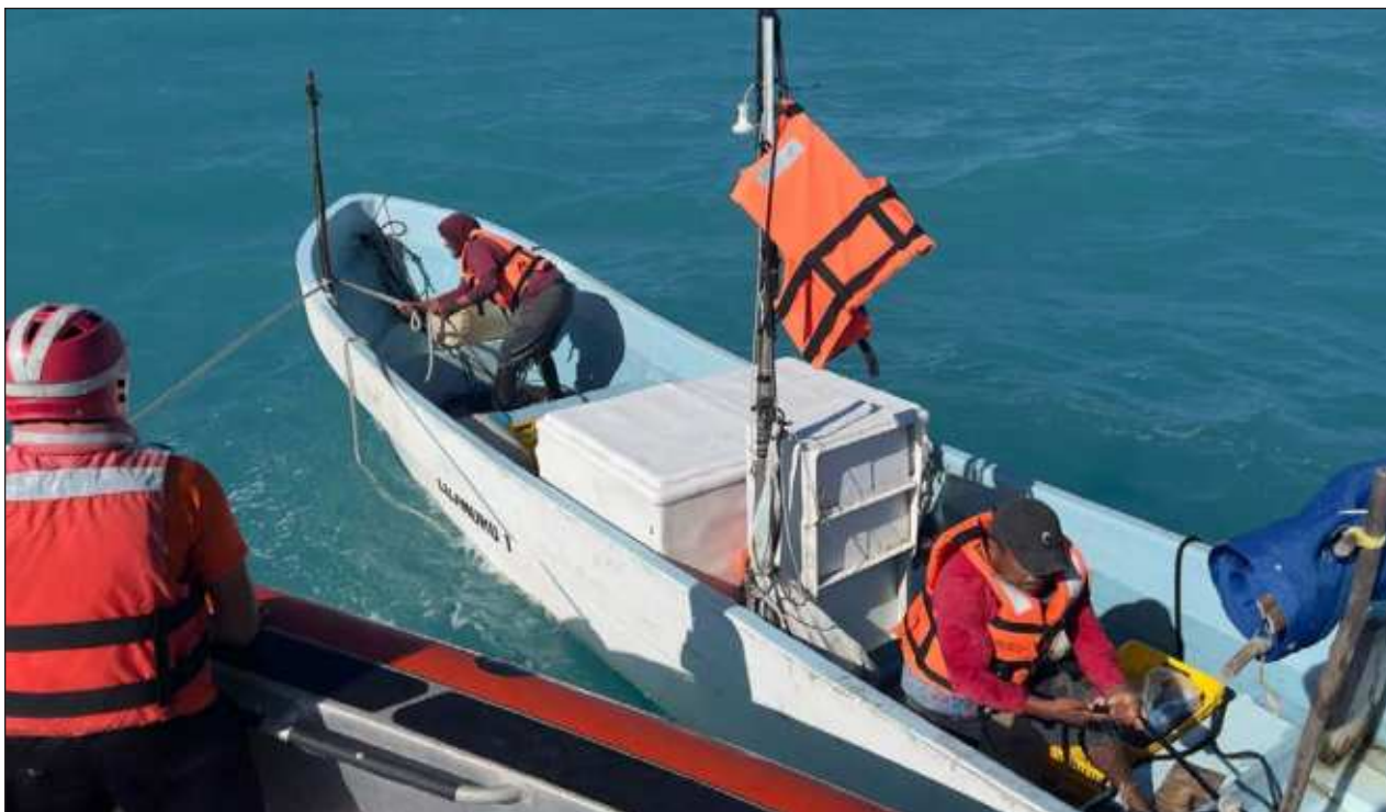
▲ Los pescadores rescatados estuvieron a la deriva a bordo de la embarcación Lizandro 1 durante cuatro días. La Marina continúa la búsqueda de otros tres que también fueron reportados como desaparecidos a bordo de una embarcación diferente.

Familiares perdieron contacto con ellos el viernes, pero las afectaciones por el frente frío número 32 dificultaron las labores de búsqueda.