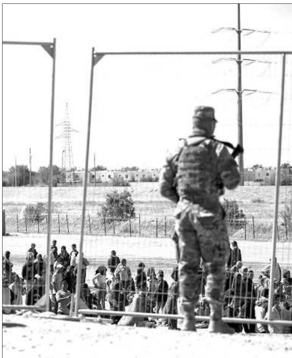
▲ Senadores republicanos bloquean acuerdo para restringir la migración entre EU y México.

blicanos informaran que votarían en contra de la legislación, que también incluye 60 mil millones de dólares en ayuda en tiempos de guerra para Ucrania y 14 mil millones de dólares para Israel. Los legisladores republicanos habían insistido en que el dinero para conflictos en el extranjero se combinara con ayuda para la frontera estadounidense.