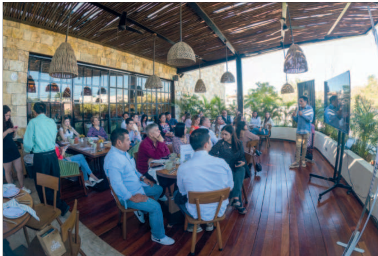
▲ En dos desayunos en el restaurante CUNA Mérida, brokers y asesores inmobiliarios conocieron los proyectos de esta empresa 100 por ciento yucateca enfocada en desarrollos inmobiliarios de alta gama.

En dichos desayunos, Grupo Fiat buscaba fortalecer relacio-