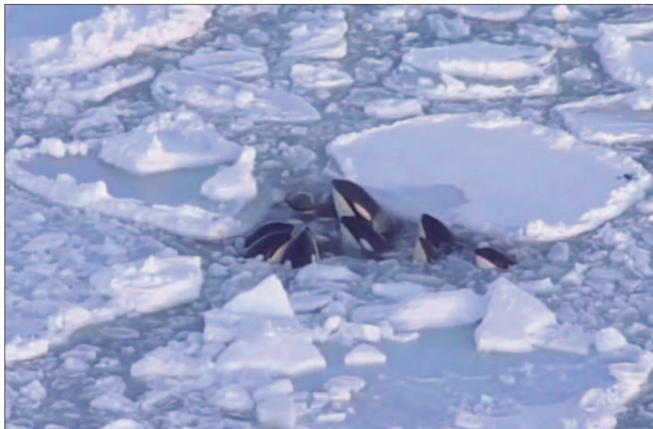
▲ Las autoridades locales presumen que las orcas pudieron liberarse del hielo a la deriva a medida que los huecos entre los pedazos se hacían más grandes. "Creemos que fueron capaces de escapar sin problemas".

A su regreso a la costa por la noche, vieron que la manada se había desplazado hacia el norte, y para cuando volvieron el miércoles en la mañana a la zona ya se había