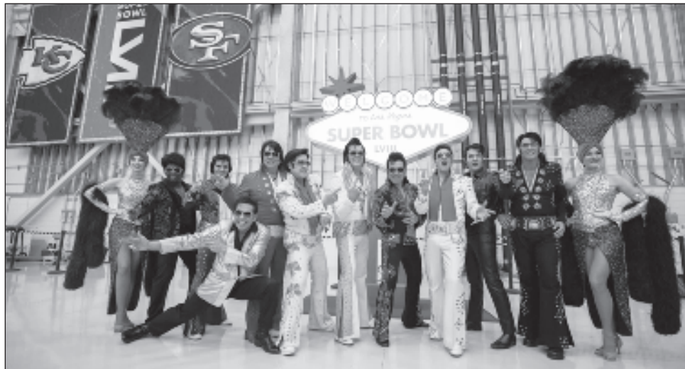
▲ Imitadores de Elvis Presley previo al arribo de los equipos con miras al Súper Tazón 58 entre 49's y Jefes, el pasado domingo en Las Vegas, que será sede por primera ocasión de la final de la NFL.

En los dos choques recientes, los Jefes no eran favoritos antes de la patada