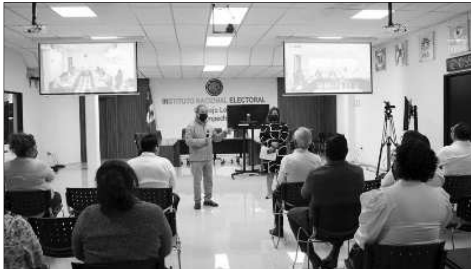
▲ Cuando haya finalizado la primera insaculación, las Juntas Distritales Ejecutivas del INE Campeche imprimirán las cartas-notificación de cada una de las y los ciudadanos que resultaron sorteados.

Cabe destacar que de los 685 mil 733 campechanos, pertenecen al 01 Distrito