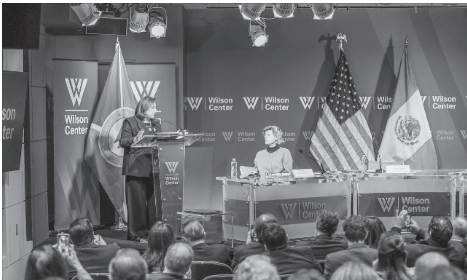
▲ “Acudir a Estados Unidos como lo hizo la virtual candidata de la alianza del PRIANRD, Xóchitl Gálvez, para que sean ‘testigos y aliados en defensa de la democracia mexicana en riesgo grave’ es pretender ‘justificar’ la intervención del imperio en las elecciones de México”.