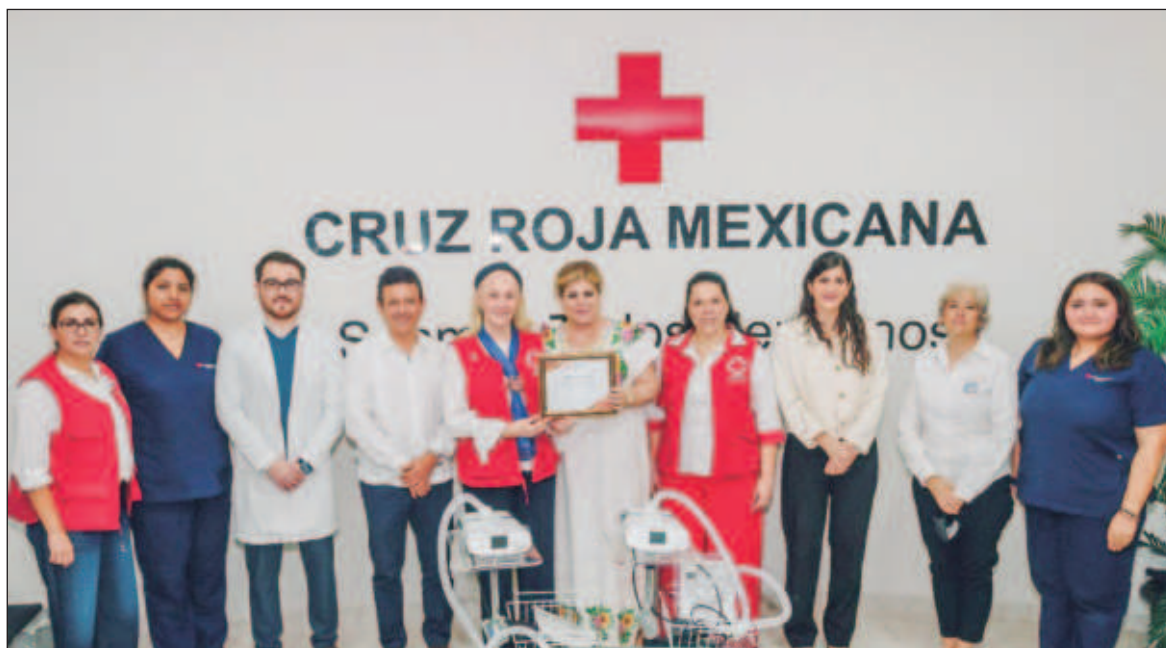
▲ La donación de este equipo médico por parte de Fundación Bepensa contribuirá a fortalecer la capacidad de respuesta de los nosocomios para enfrentar emergencias y proporcionar atención de calidad.

Bepensa, grupo empresarial mexicano con un amplio portafolio de productos y servicios en los sectores motriz, industrial, financiero y bebidas, a través de su Fundación Bepensa, ha hecho la donación de tres respiradores a dos instituciones de salud en Yucatán. Dos se destinarán a la Cruz Roja y el último se enviará al Hospital San Carlos de Tizimín. Esta donación pone en evidencia el compromiso de Fundación Bepensa con la solidaridad y con la salud en las comunidades donde Bepensa tiene presencia.