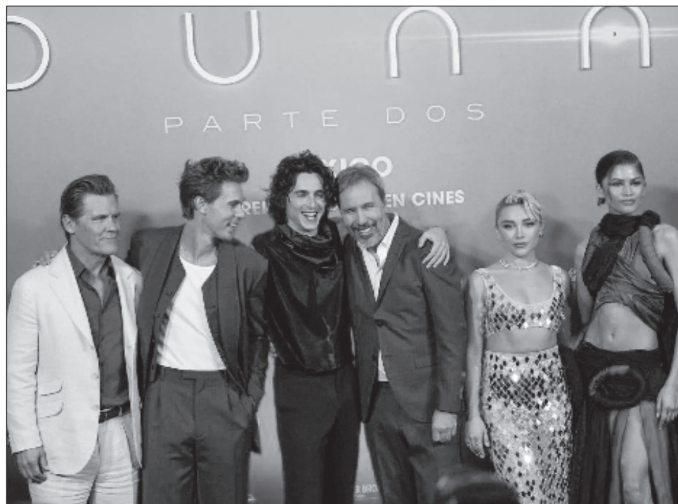
▲ El elenco de Dune 2 estuvo en la Ciudad de México para promover la cinta.

Dijo que realizarla fue como un sueño hecho realidad, pues disfrutó cada segundo de su creación. Autor de cintas como Blade Runner 2049 o Arrival (La llegada) , señaló que este segundo filme —basado en las novelas de Frank Herbert—, fue hecho pensando también en aque-