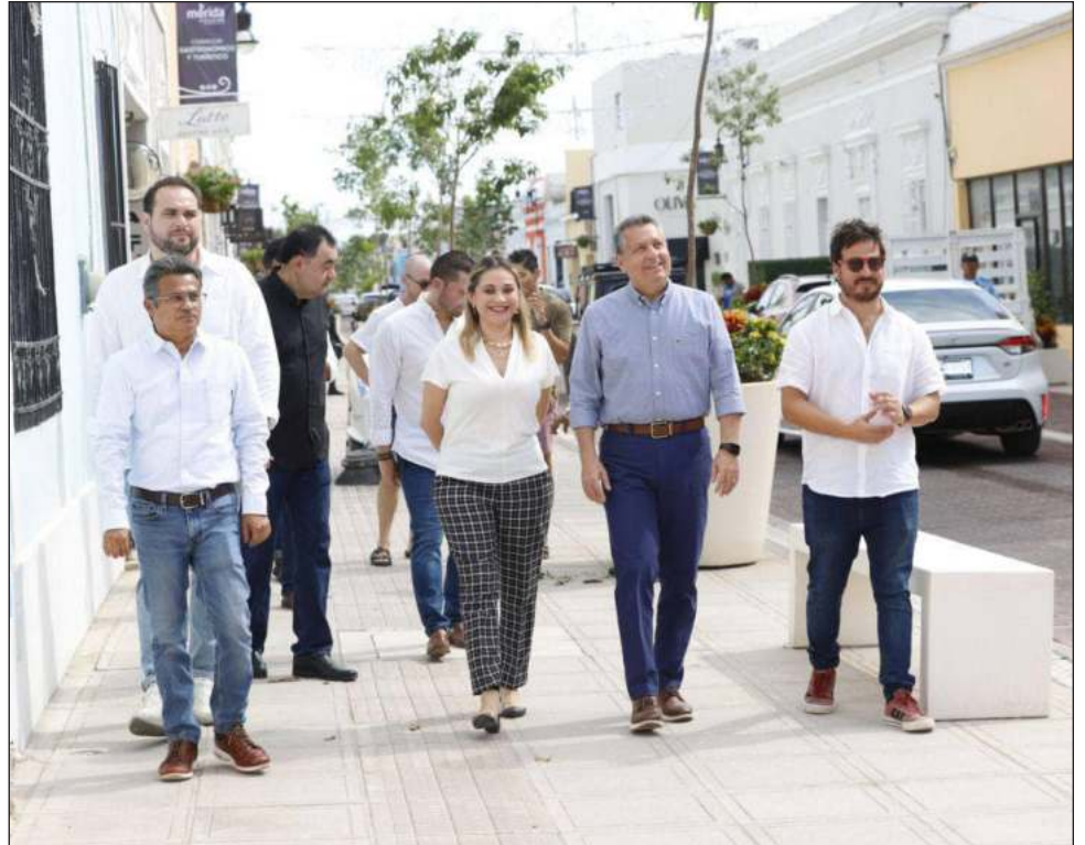
▲ El alcalde de Mérida recorrió el lugar en compañía de empresarios del sector restaurantero provenientes de Izamal, Umán y Progreso.

La empresaria agregó que cuando existe una buena sinergia entre autoridades de gobierno, la iniciativa privada y la sociedad, surgen proyectos como el Corredor Turístico y Gastronómico de la calle 47 y la calle 60, que junto con el Gran Parque de La Plancha será un fuerte atractivo para la atracción de más visitantes tanto locales como extranjeros, lo que dejará una mayor derrama económica para la ciudad.