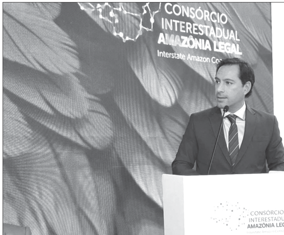
▲ En el panel de la COP28, el gobernador reiteró que se han asumido compromisos más ambiciosos, estableciendo que el estado alcance emisiones cero para 2050.

“Uno de nuestros principales enfoques ha sido la transición del sector del transporte hacia un modelo bajo en carbono, enfatizando la movilidad sustentable y la equidad social a través de la iniciativa de Transporte Justo. Los esfuerzos incluyen un enfoque en la movilidad sostenible que promueve la