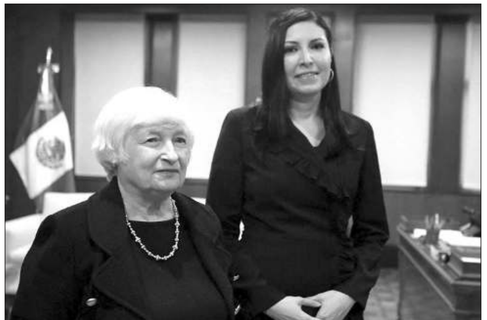
▲ Durante su visita al país, la secretaria de Tesoro estadounidense, Janet Yellen, resaltó la relación de México y EU a lo largo de un bicentenario.

"Creemos que el trabajo coordinado es la mejor manera para enfrentar desafíos como el crimen organizado, que representa un peligro