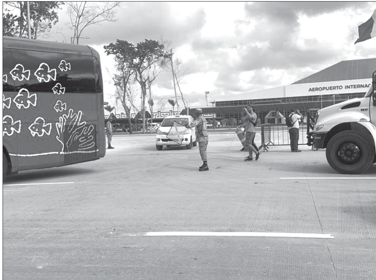
▲ El ADO ofrece el servicio de transporte desde la terminal aérea por menos de 300 pesos.

Hasta ahora llegan al destino un máximo de tres vuelos diarios (dos de la Ciudad de