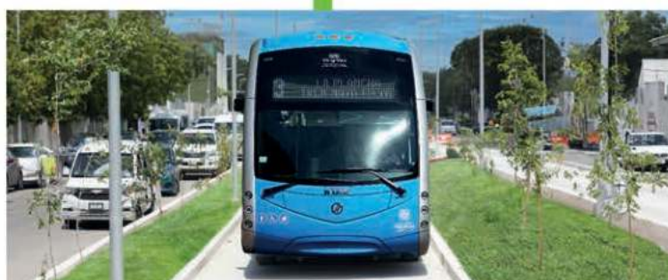
Construcción de vías en donde transitarán las unidades del IETRAM, además de construcción de banquetas y guarniciones, señalética, sistema de iluminación y pozos pluviales.