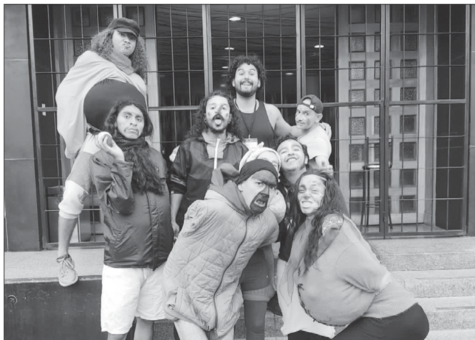
▲ La Cabra Salvaje Teatro Laboratorio alista un curso intensivo del 8 al 19 de enero en Mérida para quienes estén interesados en las técnicas clown y bufón .