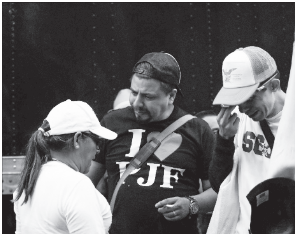
▲ "Para los ministros de la Suprema Corte que sufrieron una crisis de identidad y se sintieron legisladores. Si hubieran ido a la Facultad en aquellos tiempos, ¿los hubieran reprobado? No creo".

LOS CATEDRÁTICOS DE la Facultad de Derecho de la UNAM Mario de la Cueva (derecho constitucional), Jesús Reyes Heróles (teoría del Estado) e Ignacio Burgoa Orihuela (garantías y am-