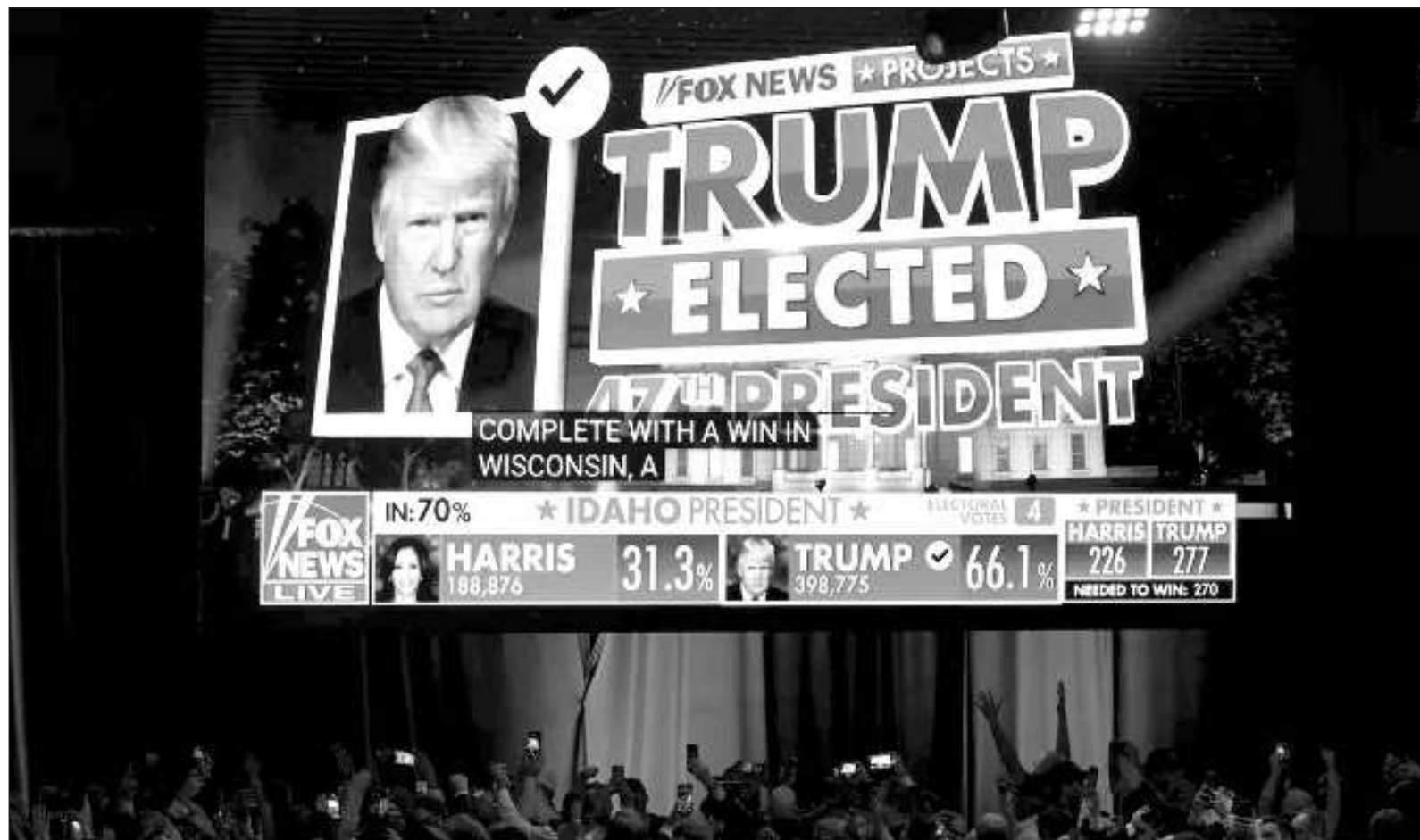
▲ "El candidato republicano Donald Trump ha alcanzado por segunda vez la presidencia de uno de los países más poderosos del mundo".