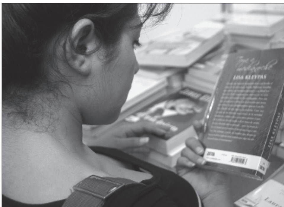
▲ Este evento anual celebra la literatura y la cultura infantil y juvenil, ofreciendo una variedad de actividades, presentaciones de libros, talleres y más.

El día 14 será la Inauguración de la Comiteca, en la Biblioteca Pública Central Francisco Sosa Escalante a las 16:30 horas.