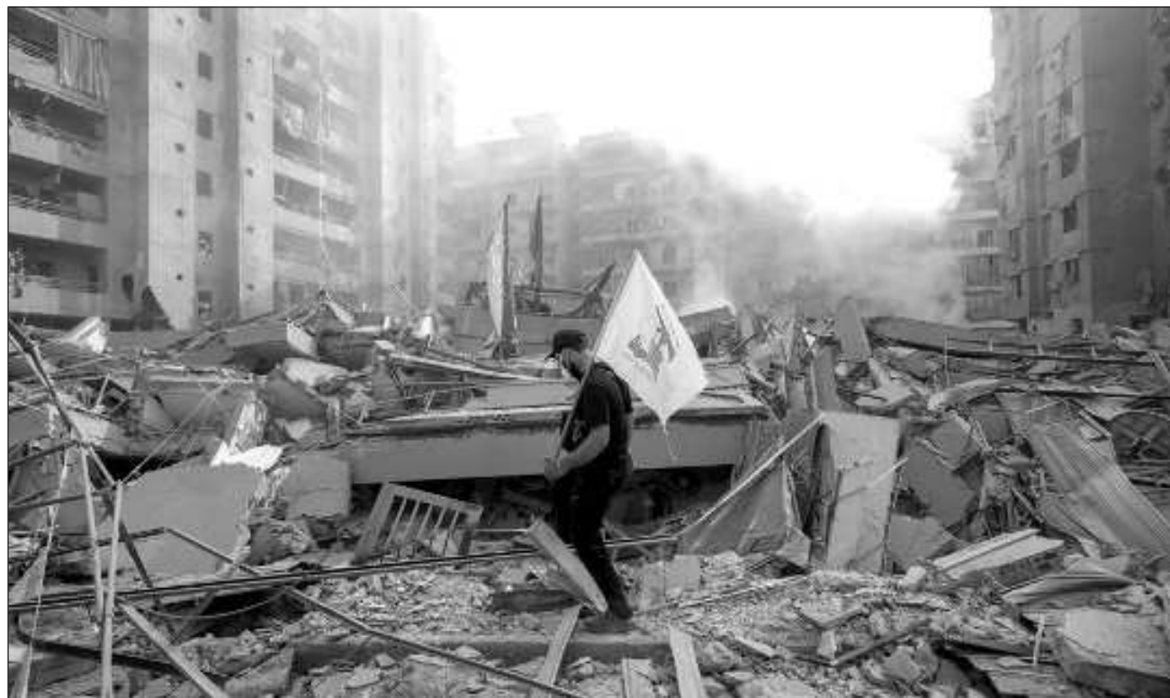
▲ La escalada comenzó con explosiones simultáneas de cientos de bípens y walkie-talkies usados por los trabajadores miembros de Hezbolá, que dejaron decenas de muertos y miles de heridos en todo Líbano.

La escalada comenzó con explosiones simultáneas de cientos de bípens