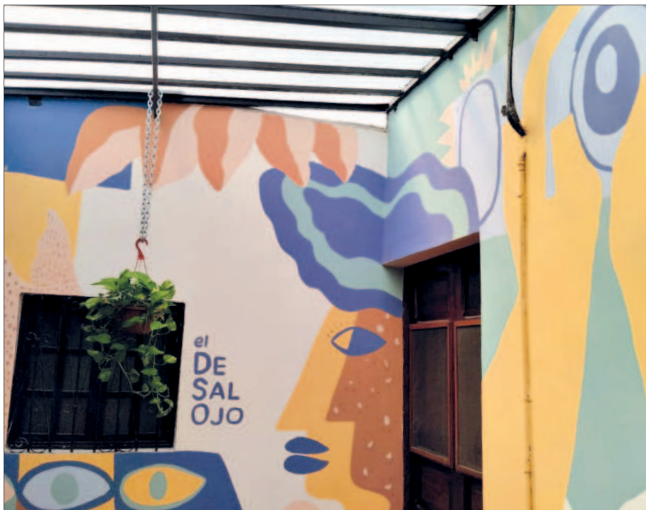
▲ Del 9 al 16 de noviembre, en cada ciclo se ofrecerán cuatro películas de ficción y cuatro documentales, en temáticas como danza, música, terror, ciencia y medio ambiente; las entradas son cooperación voluntaria.

Para formar parte de esta primera entrega del multiverso de superhéroes hecho en Yucatán, las personas pueden contactar a James en el número 999 111 4594 o a través de Facebook.