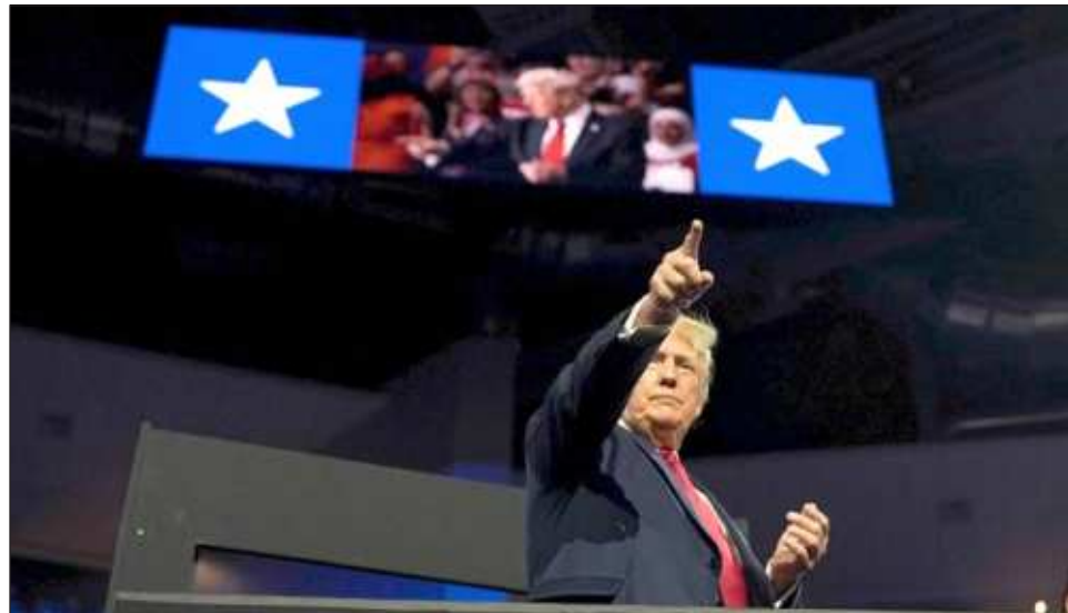
▲ “Hemos hecho historia”, proclamó el ahora presidente electo, Donald Trump, a sus seguidores en West Palm Beach, Florida, rodeado de su familia, incluida su esposa Melania.

Trump, de 78 años, reconoció “la determinación, profesionalismo y perseverancia” de su rival, según Steven Cheung, portavoz del magnate.