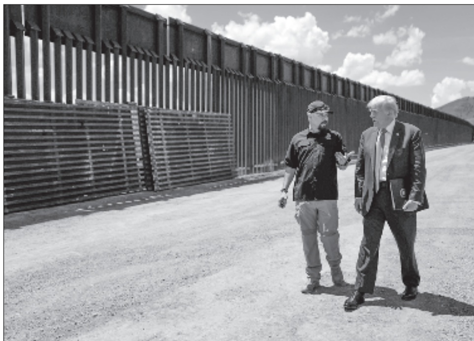
▲ “¡Construir el muro!”, de su campaña anterior en 2016 se ha convertido en crear “el programa de deportación masiva más grande de la historia” para la regulación migratoria.

Inmigración: “¡Construir el muro!”, de su campaña de 2016 se ha convertido en crear “el programa de deportación masiva más grande de la historia”. Trump ha