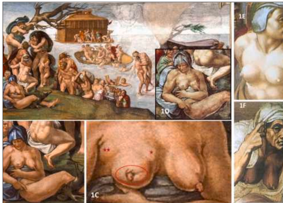
▲ En El diluvio , hay una mujer representada casi desnuda; su pecho izquierdo parece normal, mientras que el derecho presenta anomalías significativas.

El iconodiagnóstico es un proceso de análisis médico que busca signos clínicos de trastornos y enfermedades médicas en obras de arte. A menudo