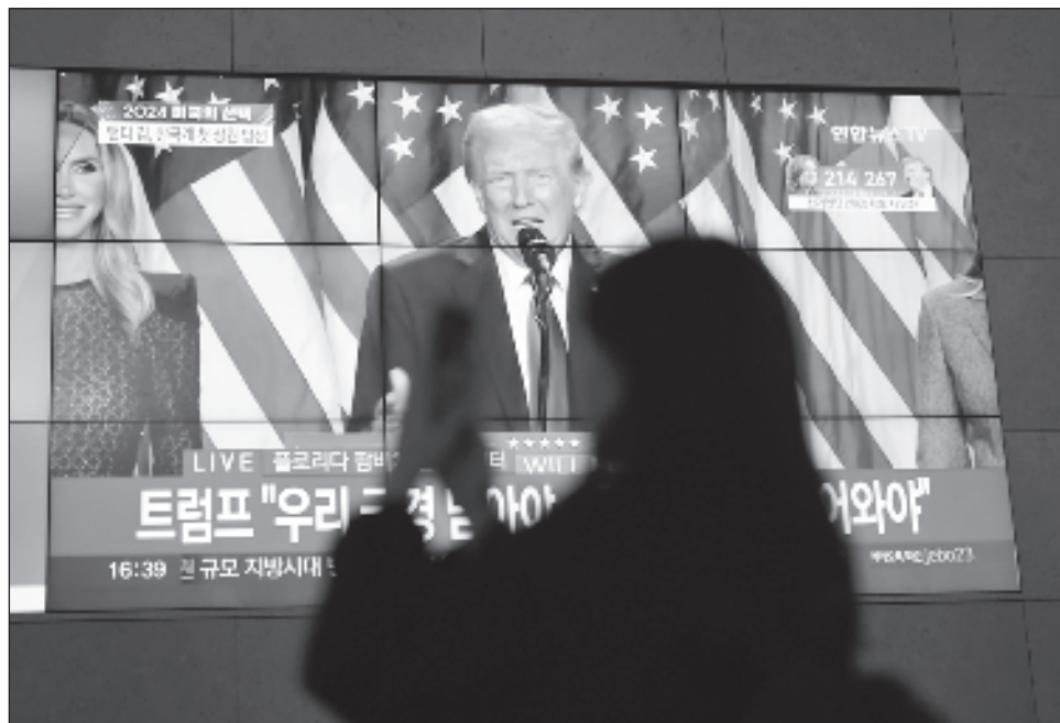
▲ En su primer mandato, Trump insultó y alejó a muchos de los aliados de EU. Su regreso a la Casa Blanca, cuatro años después de perder ante el presidente Joe Biden, tiene enormes consecuencias para todo, desde el comercio global hasta el cambio climático.

Trump aseguró su triunfo el miércoles, tras superar los 270 votos del colegio electoral necesarios para ganar. En un discurso de victoria antes de la declaración oficial, pro-