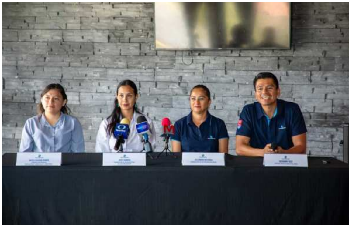
▲ El evento tendrá lugar el 15 de noviembre en el Parque Ventura Park, del municipio Benito Juárez.

Los estudiantes que asistirán en esta ocasión provienen de diferentes escuelas ubicadas en los cuatro municipios donde opera la concesionaria: Benito Juárez, Puerto Morelos, Solidaridad e Isla Mujeres. Como cada año, se cuenta con la participación de diferen-