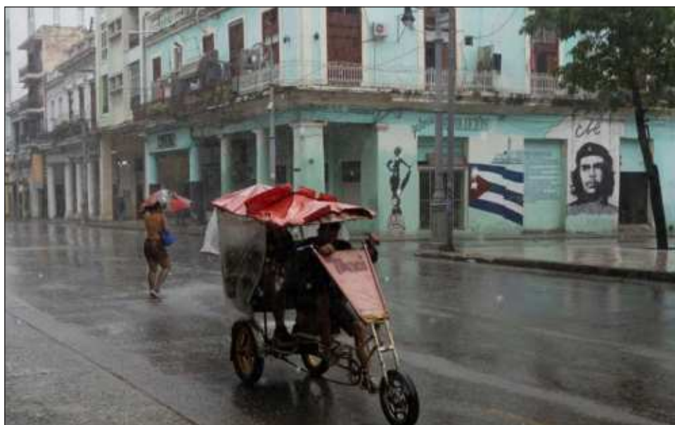
▲ Rafael presenta vientos máximos sostenidos de 170 kilómetros por hora y rachas de 210, y su desplazamiento es hacia el noroeste a 22 kilómetros por hora.

Antes de este reporte, pidió extremar precauciones a la población en general en las zonas de los estados mencionados por lluvias, viento y oleaje, incluyendo la navegación marítima, y atender las recomendaciones emitidas por las auto-