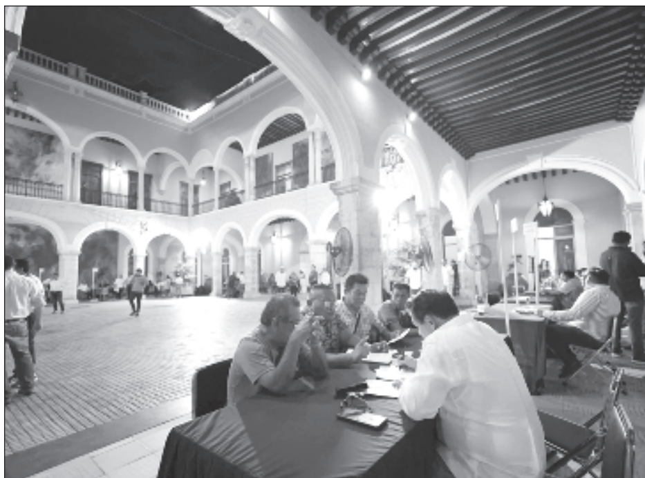
▲ Las consultas también se realizarán a través de una página web que se habilitará en los próximos días para que participen todas y todos los yucatecos.