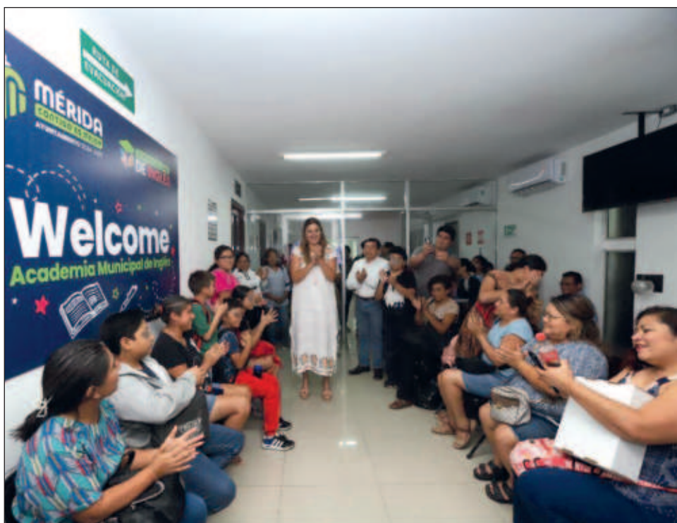
▲ La presidenta municipal visitó la Academia Municipal de Inglés y llamó a los estudiantes a aprovechar las ventajas que ofrece el dominio de este idioma.

Al final del curso los alumnos realizan una exposición frente a un grupo de maestros en el idioma e invitados, donde ponen en práctica el dominio de las cinco habilidades: gramática, comprensión de la lectura, comprensión auditiva, expresión escrita y expresión oral.