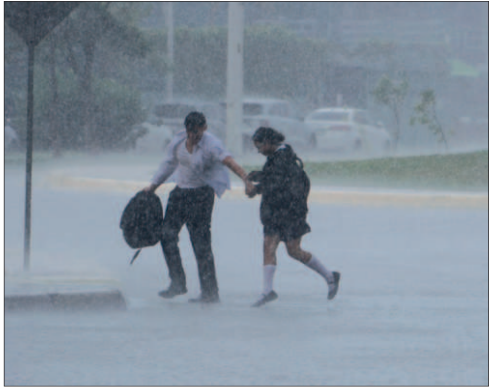
▲ La zona centro, norte, noreste, noroeste y oeste del estado entra en la fase de peligro mínimo; se advierte a sus habitantes que estén al pendiente de las indicaciones oficiales.

De acuerdo con los pronósticos, se espera que el huracán impacte a Cuba en las próximas horas.