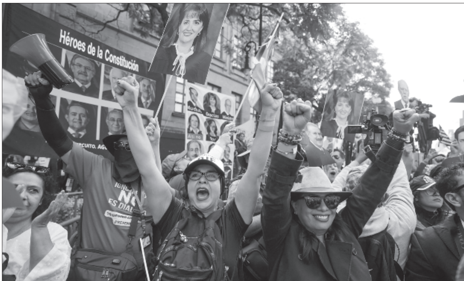
▲ “El verdadero peligro para México lo son los poderes fácticos mexicanos formados en la fila de la derecha neoliberal que fue derrotada en las urnas, de manera contundente en 2018 y de manera todavía más aplastante en las elecciones presidenciales de 2024”.