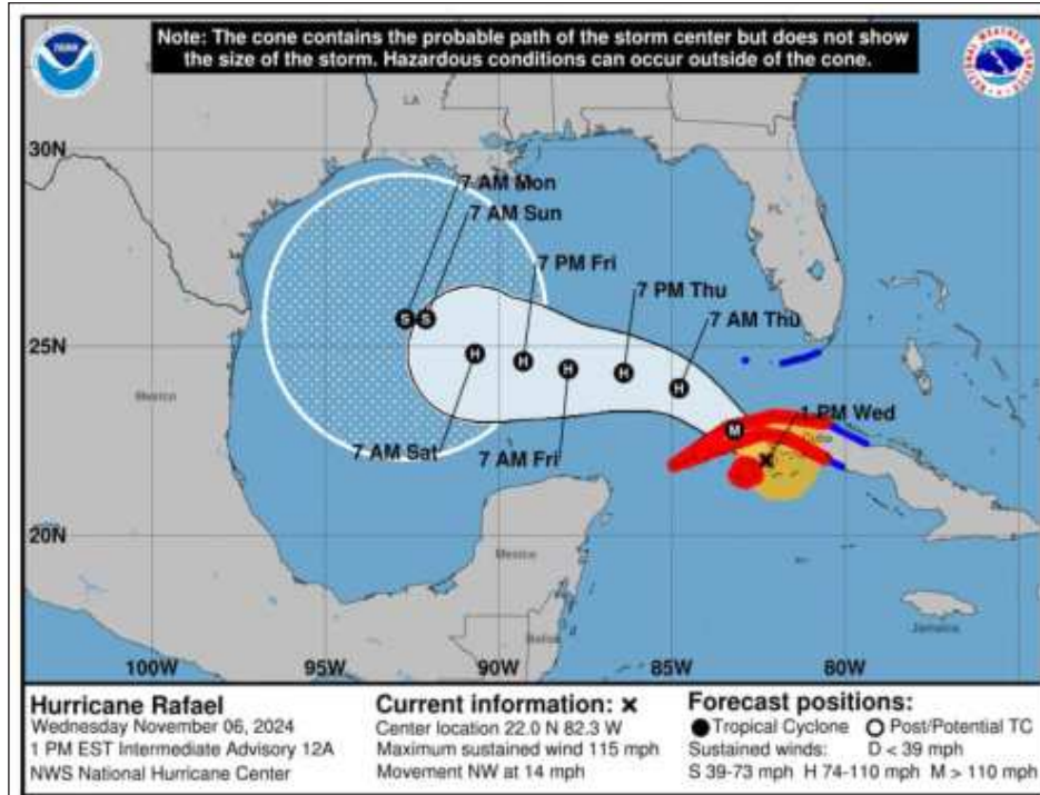
▲ Por su ubicación y trayectoria, el huracán Rafael no representa peligro para las costas de Quintana Roo, pero las autoridades continúan con su monitoreo.

Rafael tiene vientos máximos de 185 kilómetros por hora (km/h), con rachas de hasta 225 km/h y su despla-