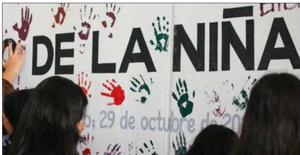
▲ El periodo de inscripciones cierra el próximo 18 de noviembre.

Para participar, dijo, deberán presentar los siguien-