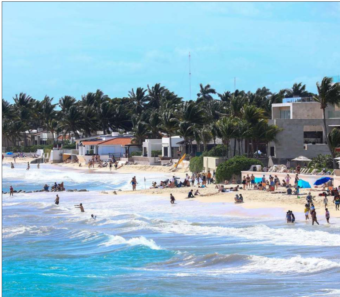
▲ Las 22 playas con las que cuenta el municipio están dotadas con servicios públicos como sanitarios, regaderas, palapas; dos de ellas son inclusivas para beneficio de personas con alguna discapacidad y adultos mayores.

De acuerdo con cifras de la Secretaría de Turismo federal (Sectur), durante el año 2023 se tuvo una afluencia turística de 172 mil 259 personas en el municipio, mientras que en este año 2024 se prevé la llegada de 176 mil 332 visitantes, teniendo un alza de 2.4 por ciento.