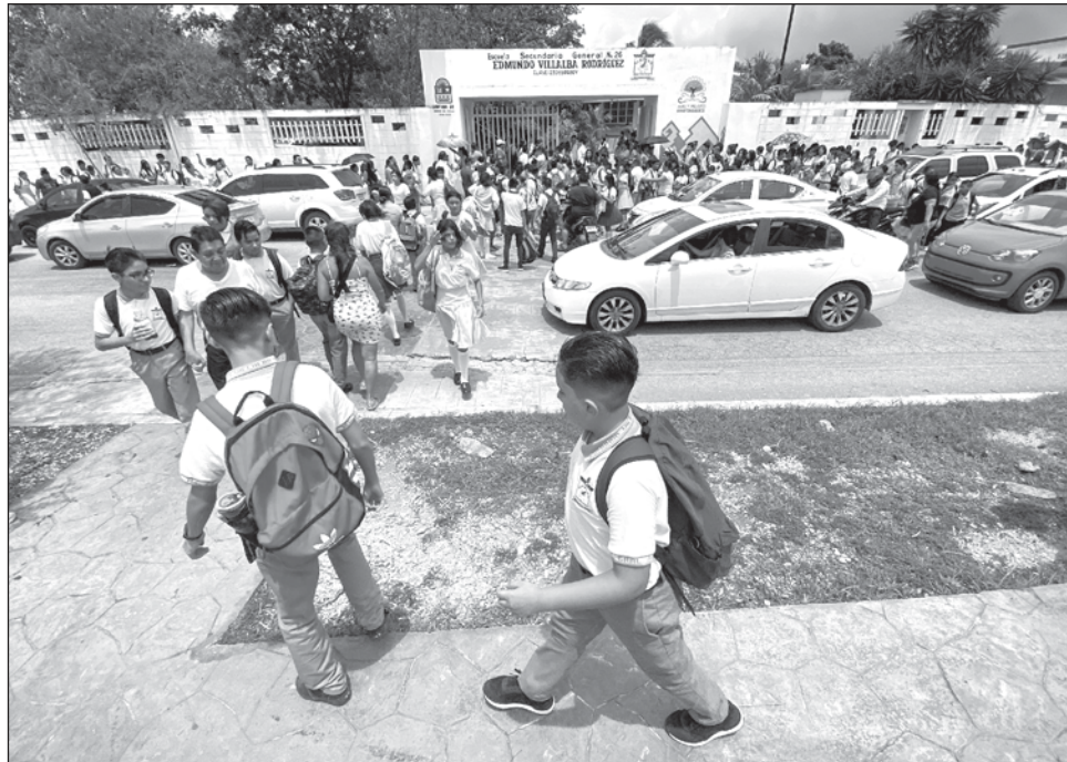
▲ El PAEMS arrancó el lunes de acuerdo a la cita programada que ya tienen quienes presentaron el examen, informó el secretario estatal de Educación.

Los que no presentaron examen también fueron atendidos en Tulum el lunes 5 de agosto, de 10 a 13 horas, en las instalaciones de los servicios educativos; en Solidaridad, la reasignación de espacios para un plantel