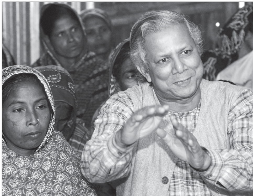
▲ Yunus declaró que está dispuesto a asumir la jefatura de un gobierno interino, luego de que los militares tomaran el control de Bangladesh después de que una ola de protestas derrocó a la primera ministra, Sheikh Hasina, quien huyó del país a India.

Hasina, de 76 años, estaba en el poder desde hace 15 años, pero su último mandato como primera ministra, que comenzó en enero, estuvo marcado por el boicot de la oposición a las elecciones, que denunció que no fueron libres ni justas.