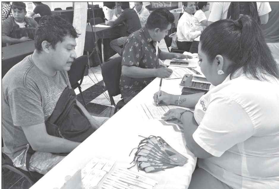
▲ En la feria del empleo participaron 13 centros de hospedaje de cuatro y cinco estrellas, clase especial y gran turismo de la zona hotelera de Cancún y Puerto Morelos.

Si bien, la mayoría de las vacantes están relacionadas con cargos operativos en los centros de hospedaje, también se ofertaron plazas en áreas de supervisión y gerencias, es decir, se abrió una amplia de oportunidad para quienes están en busca de empleo o de algún cambio laboral.