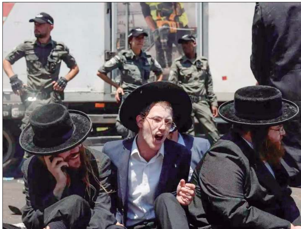
▲ Tras el establecimiento del Estado de Israel, Ben-Gurion esperaba mantener vivos conocimientos y tradiciones sagradas, prácticamente aniquilados en el Holocausto nazi.

Las imágenes de vídeo compartidas por la policía israelí mostraban a decenas de hombres con los tradicionales trajes y sombreros negros que lleva la comuni-