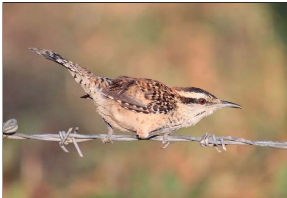
▲ Se encuentra en bosques secos tropicales, sabanas y áreas modificadas de Veracruz, desde el nivel del mar hasta mil 200 metros de altitud.

En su suplemento número 65, publicado en junio, la AOS hizo la recategorización de la siguiente manera: matraca veracruzana ( Campylorhynchus rufinucha ), con presencia en Veracruz; matraca nuca canela ( Campylorhynchus humilis ) distribuida desde Colima hasta el suroeste de Chiapas, y