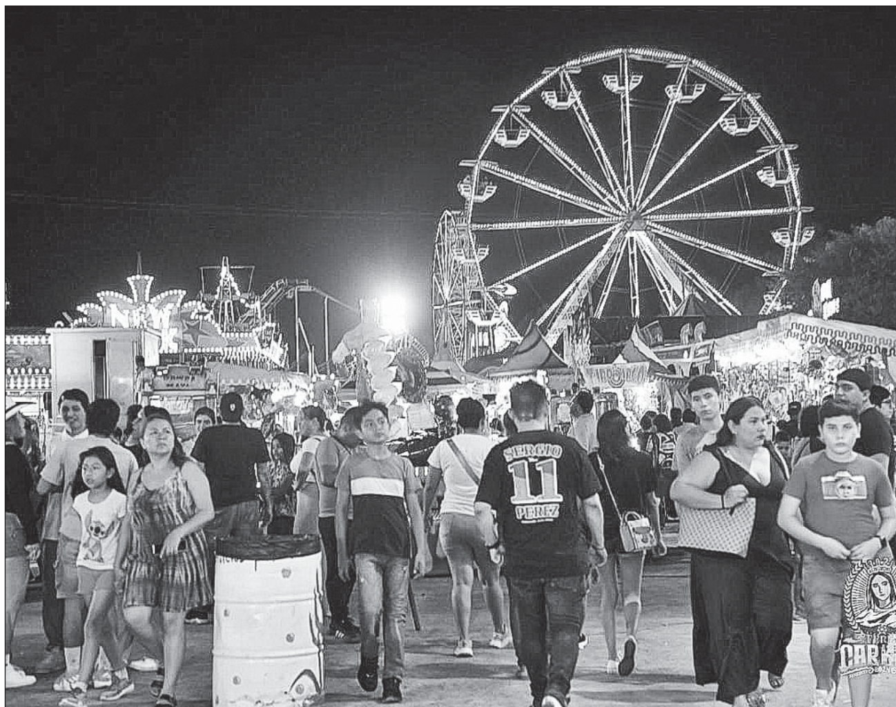
▲ Se estima que los micro empresarios que participaron e obtuvieron ventas de hasta 12 mil pesos.

El empresario sostuvo que en el caso de los comerciantes establecidos en la nave comercial de la Canaco, se