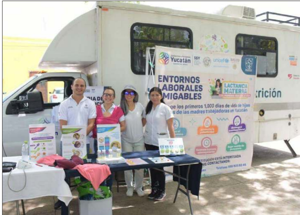
▲ Todas las empresas que reúnan los requerimientos de capacitar a un porcentaje de la plantilla laboral, recibe de la SGG, la SSY y la Sefoet la placa distintiva.

En la Semana Mundial de la Lactancia Materna 2024, la Secretaría General de Gobierno (SGG) destacó que estos esfuerzos para favorecer la actividad en los Centros de Trabajo son realizados en coordinación con las Secretarías de Salud (SSY) y de Fomento Económico y Trabajo (Sefoet) y forman parte de la estrategia de los Primeros Mil Días de vida de los recién nacidos, la cual ha sido sumamente exitosa con el apoyo de la iniciativa privada.