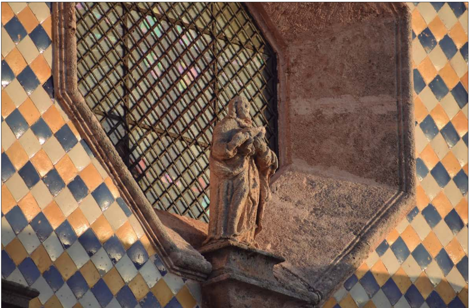
▲ "Una sola palabra del sacerdote pudo haberlo sanado, pero el confesor no la dijo. Y pasó lo contrario. La redención, pensó el criminal, no existe".