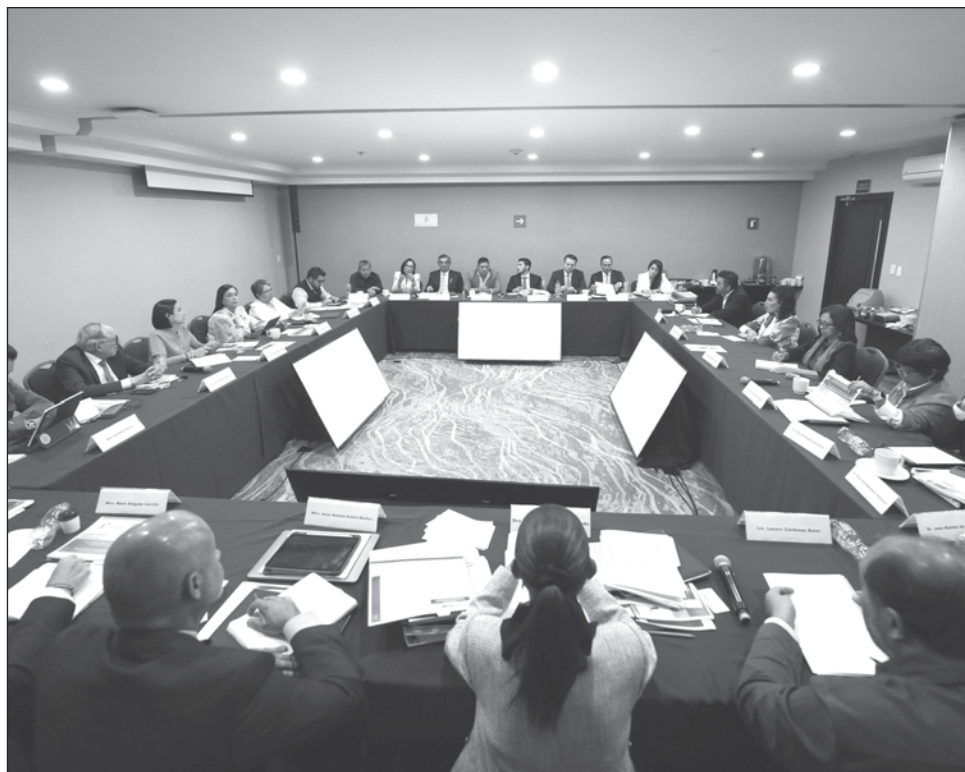
▲ A la reunión asistieron gobernadores de Coahuila, Durango, Nuevo León, Tamaulipas, Aguascalientes, San Luis Potosí, Zacatecas y la mandataria electa de Veracruz.

Adelantó que tras su toma de protesta el 1 de octubre, en un acto en el Zócalo de la Ciudad planteará “los 100 puntos de manera clara ya trabajados con los gobernadores”, y recalzó que trabajará de manera institucional con todos los gobernadores independien-