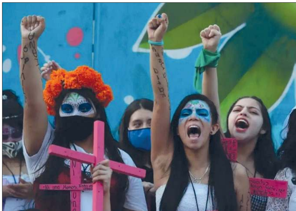
▲ La secretaria aseguró que en estos territorios es donde se ha puesto énfasis y se han desarrollado diversas acciones en coordinación con las autoridades locales.

Al presentar la estrategia del gobierno federal en contra de la violencia de género y feminicida, durante la mañana del presidente Andrés Manuel López Obrador, la funcionaria aseguró que las acciones emprendidas ha permitido que el feminicidio se redujera en junio de este año en todo el país en 35.6