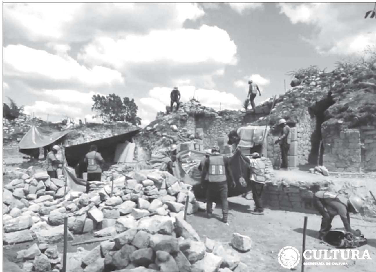
▲ Los trabajadores que ayudan a rehabilitar el fulgor de la antigua ciudad del Jaguar Negro han aprendido que hay diferentes piedras, tallados y cuidados: “Todo está quedando muy bonito, lo estamos dejando muy limpio”, aseguraron.

“Al momento en que escarbas y te encuentras, por ejemplo, restos de al-