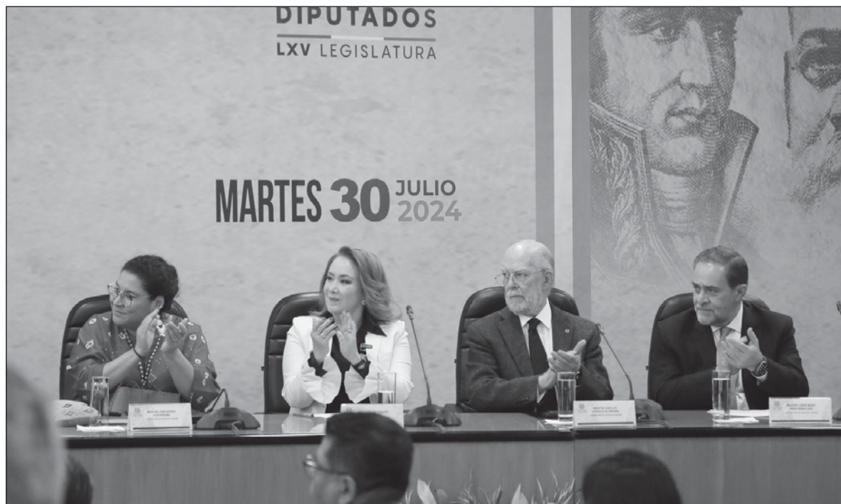
▲ “Históricamente ha sucedido que de forma engañosa se coloca a la razón de la élite por encima del consenso popular (...) Como resultado, se presupone que aquellos ‘más capaces’ para deliberar están en mejor posición de representar a quien sea, sin que resulta necesaria una vía democrática”.

ASÍ, LAS TEORÍAS liberales del gobierno representativo proponen que la competencia técnica es una fuente de conocimiento e institucionalidad que implica que los ciudadanos tengan un papel más cercano al de testigos que al de participantes de la deliberación pública y, por tanto, de las estrategias para establecer políticas públicas. Esta perspectiva bastante común en las democracias contemporáneas presupone que el conocimiento técnico de los expertos conlleva una perspectiva