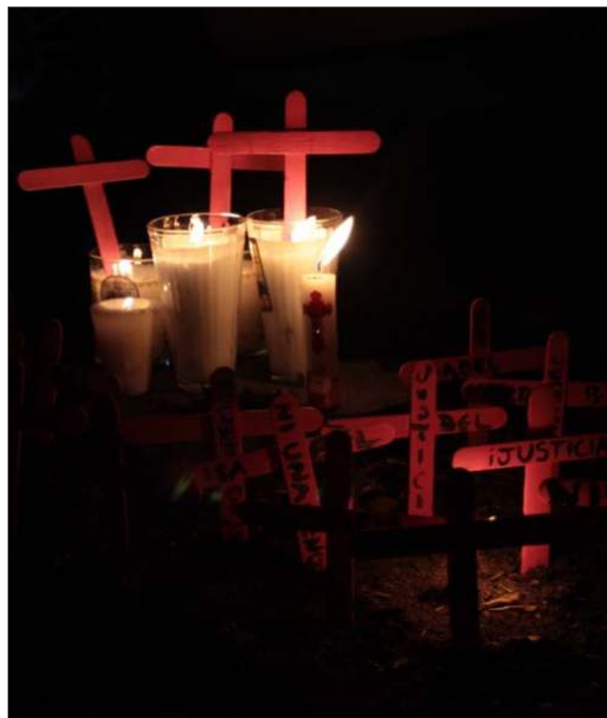
▲ Queda mucho por hacer para que dejemos de hablar de feminicidio y violencia de género, pero eso no debe ser motivo para el desaliento. Al contrario, hoy los logros son visibles.

El cambio de administración es momento para hacer