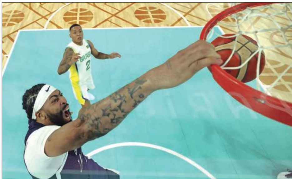
▲ Anthony Davis, estrella de la NBA, encesta para Estados Unidos durante el encuentro ante Brasil.

Si acaso hubo un problema para los estadounidenses en la Arena Bercy, a donde se trasladó el basketbol para la etapa final, fue que LeBron James se marchó en el tercer cuarto