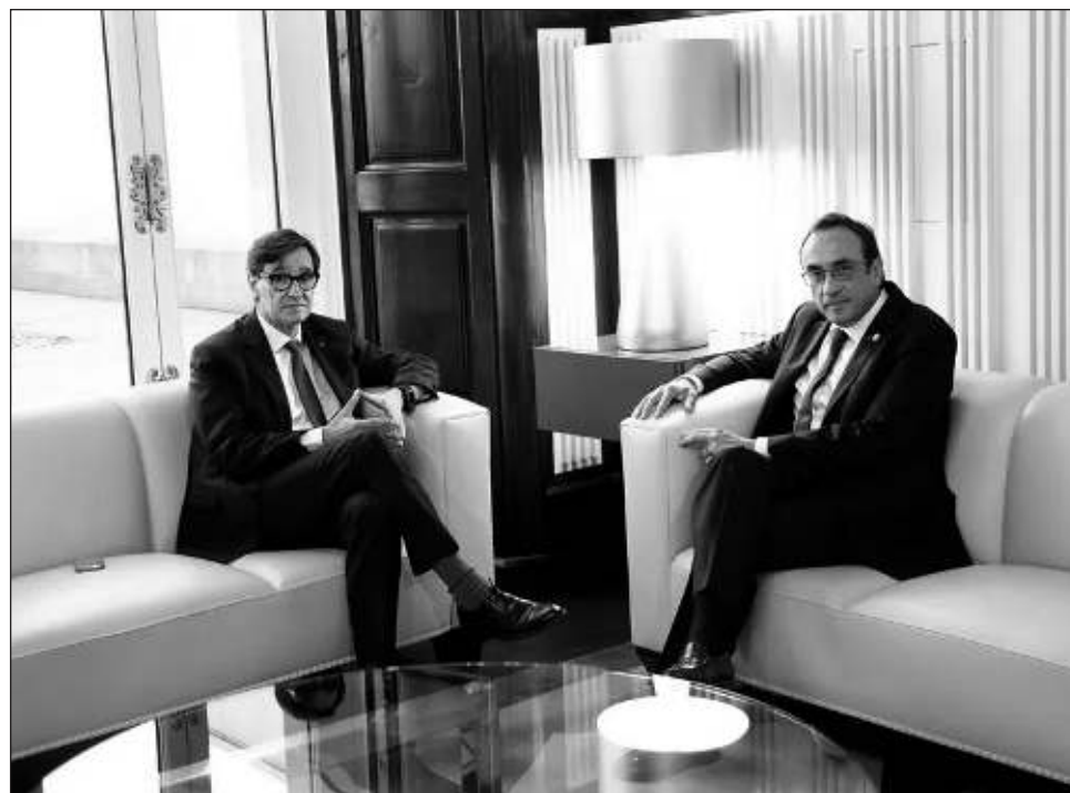
▲ Josep Rull, presidente del Parlamento catalán, propuso la fecha del jueves tras consultar con los diferentes partidos que ganaron escaños en las elecciones de mayo.

Los socialistas del presidente del Gobierno español, Pedro Sánchez, llega-