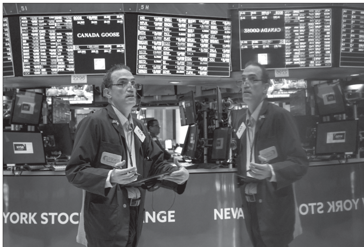
▲ La moneda nacional enfrenta una importante volatilidad luego de el debilitamiento de las economías, las decisiones de los bancos centrales y la caída de las acciones tecnológicas en alza que sacudieron los mercados financieros el lunes.

Los intereses de la deuda han descendido desde la semana pasada para adaptarse al repentino pesimismo macroeconómico y a las bajadas de tasas más agresivas que podría realizar la Reserva Federal. En la sesión de ayer las compras de bonos se frenan, y los intereses, que evolucionan de manera inversa al precio, activan el rebote.