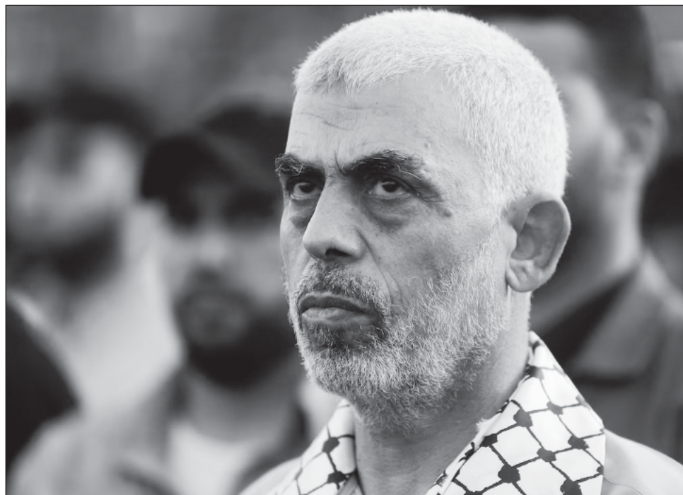
▲ El movimiento islamista palestino Hamas anunció este martes que designó como nuevo líder político a Yahya Sinwar, jefe de la organización en Gaza, una semana después del asesinato del dirigente Ismail Haniyeh en Irán, tras casi diez meses de guerra con Israel.