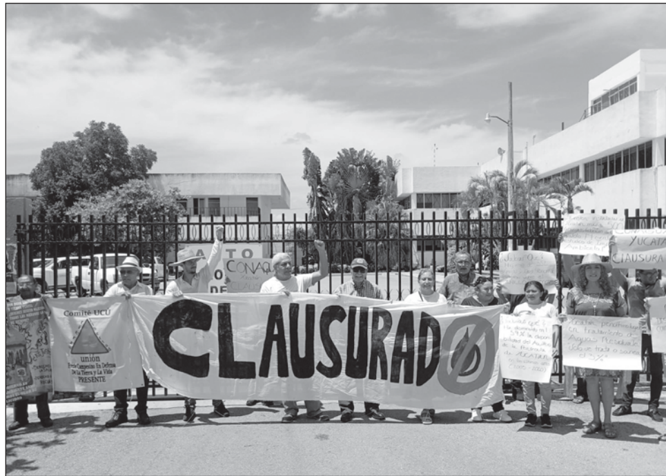
▲ En Hunucmá, la industria cervecera Constellation Brands tiene una concesión de 30% del agua, lo que ha causado escasez de este recurso en la población, acusa el Consejo.

El Consejo expresó que la Conagua, en el caso de Yucatán, refiere con frecuencia que el manto freático del estado es ilimitado, lo que invita a industrias y megaproyectos inmobiliarios a instalarse en la región. En 2017, los datos de la misma