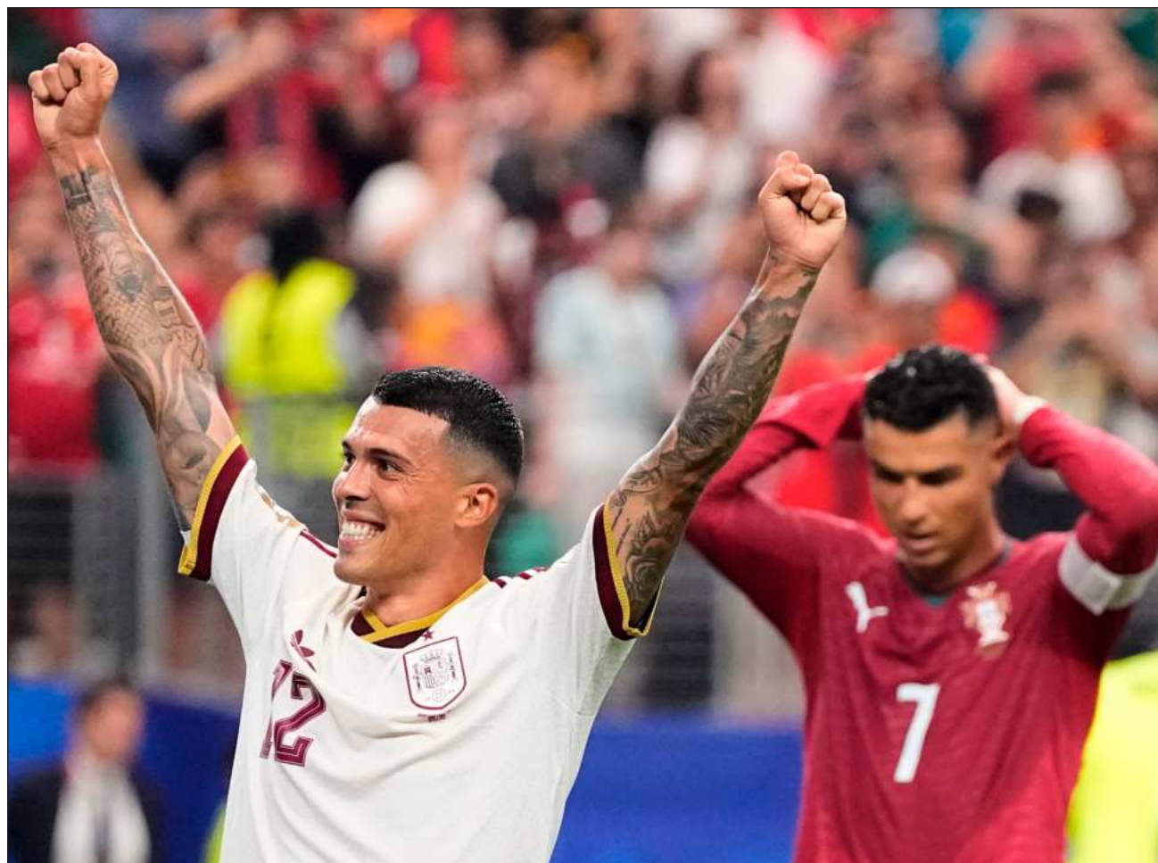
▲ El Comandante buscaba llevar a Portugal a los cuartos de final por segundo torneo consecutivo, algo inédito en su historia, pero un gol del español Mikel Merino en la segunda parte del encuentro frustró sus sueños.

En busca de su primer título mundial, Bélgica eli-