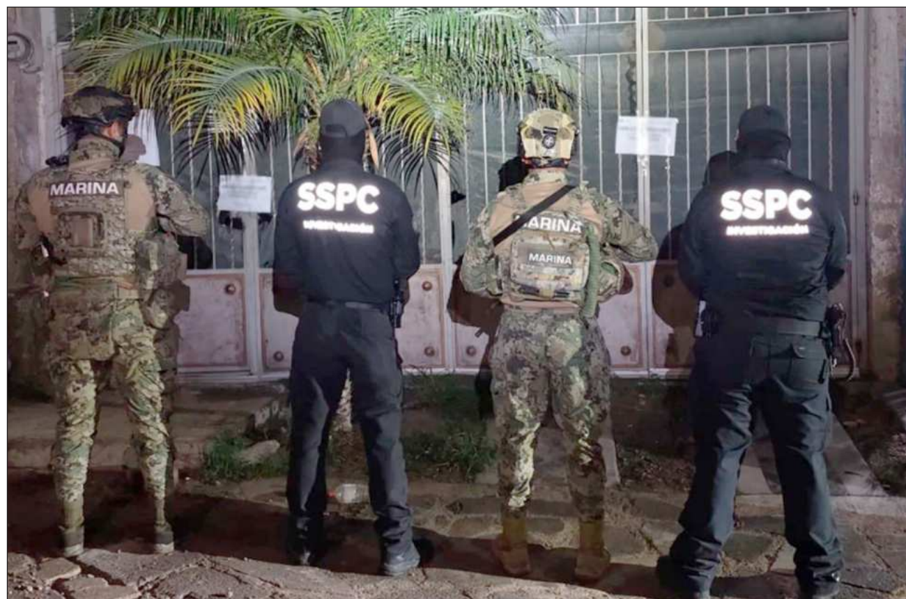
▲ Las autoridades decomisaron más de cuatro toneladas de drogas y 150 mil litros de hidrocarburo ilícito.

De acuerdo con el informe de acciones relevantes del 3 al 5 de julio, difundido este lunes, el golpe más significativo al crimen organizado ocurrió en Chiapas, donde fueron detenidas 18 personas en distintas acciones y la Secretaría de Marina (Semar) aseguró 4.19 toneladas de cocaína en operaciones de vigilancia marítima.