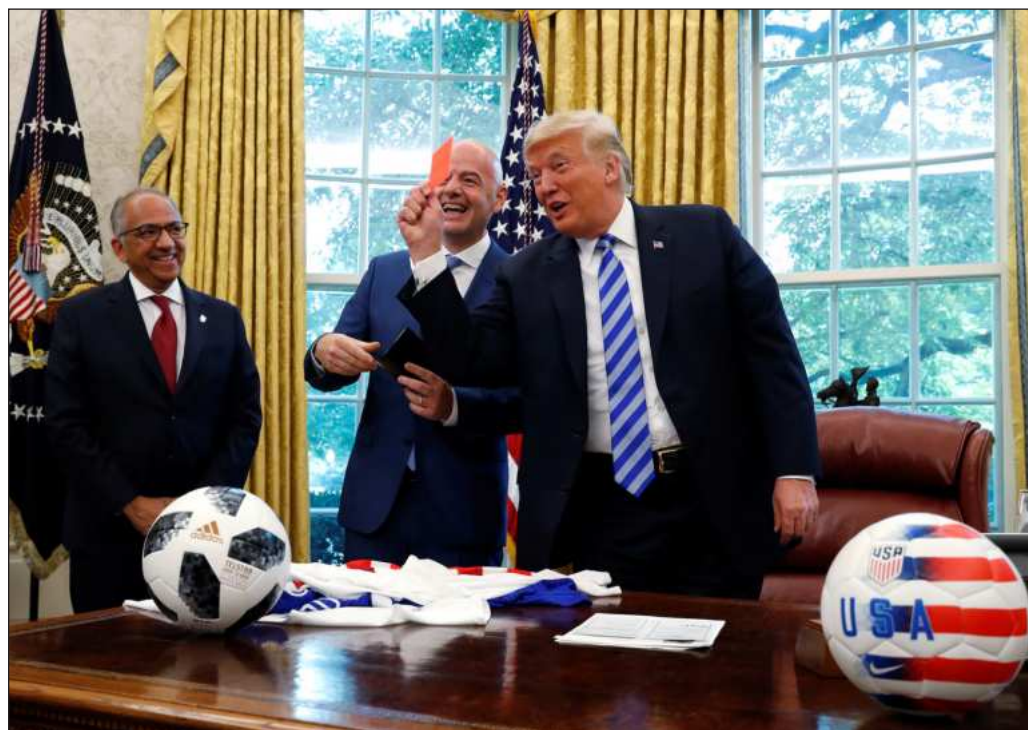
▲ La parcialidad de la FIFA en el presente Mundial ha quedado de manifiesto por su obsecuencia ante los atropellos cometidos por el gobierno de Trump contra diversos equipos, empezando por el de Irán.

Esta inocultable sumisión del máximo organismo del fútbol internacional ante Estados Unidos es sólo una de las miserias exhibidas por la FIFA en el curso del presente torneo. Ya habrá ocasión de comentar sobre su acentuado mercantilismo y su propensión a convertir ese deporte en un espectáculo exclusivo para un público pudiente.