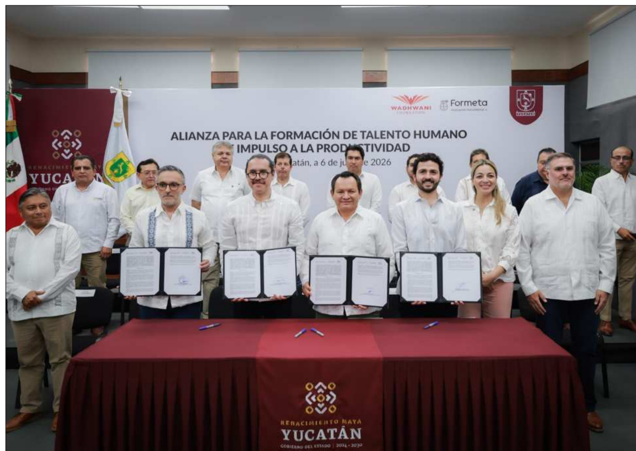
▲ Con el convenio se promoverán programas orientados al desarrollo de las habilidades que demanda el mercado laboral, así como al fortalecimiento de competencias digitales, técnicas y profesionales, reveló Díaz Mena.

Díaz Mena señaló que se busca que estas oportunidades de preparación lleguen a las comunidades donde más se necesitan, para que las juventudes de los municipios