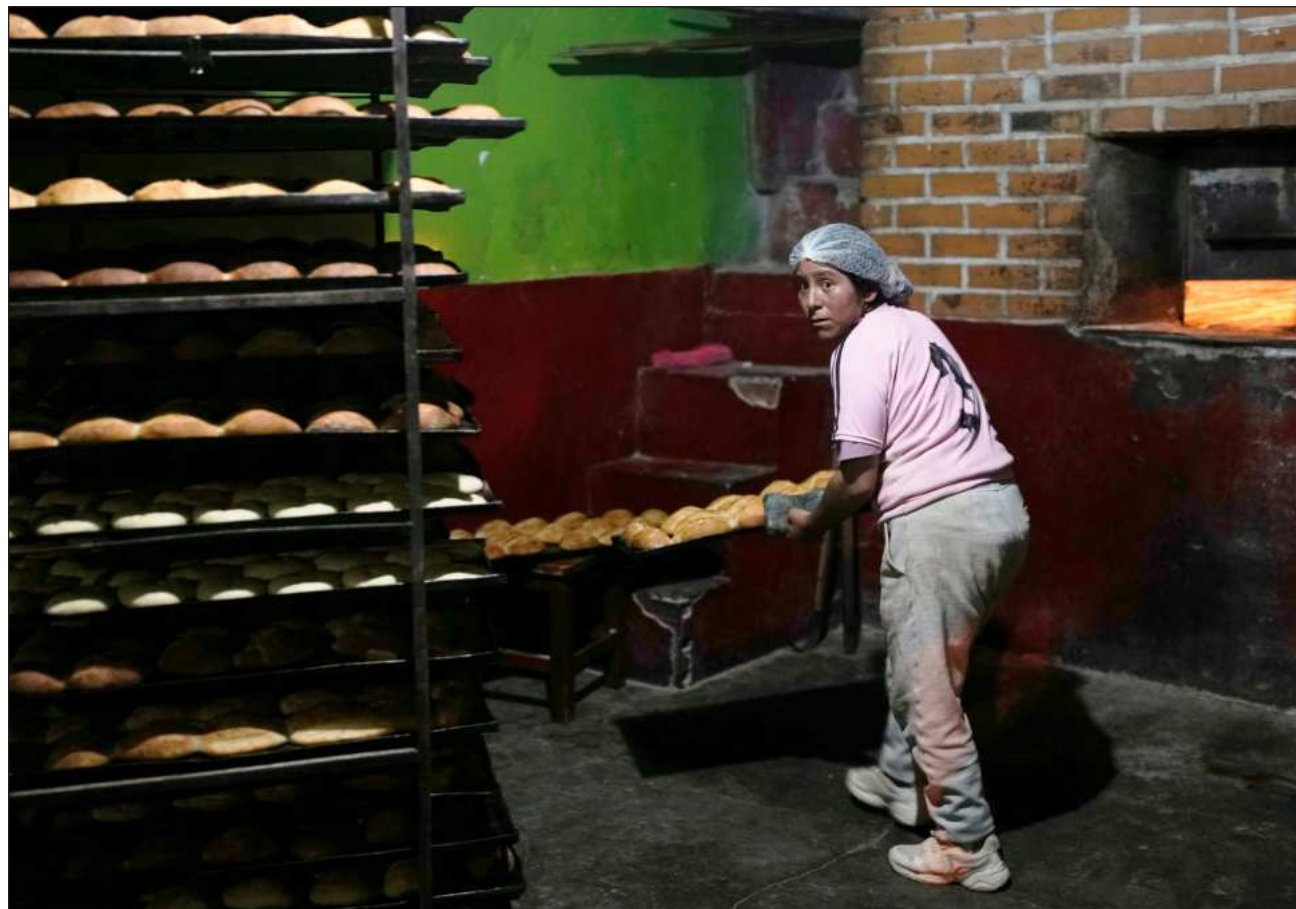
▲ Mallea recordó que el pan fue declarado en 2006 Patrimonio Cultural e Histórico de La Paz por la entonces Prefectura Departamental de la región; y en 2024 se aprobó una ley municipal y se declaró el 6 de julio el Día de la Marraqueta.

Por esto se promoverá que sea declarada "patrimonio nacional" y luego se acudirá ante la Unesco "para que sea patrimonio de la humanidad", zanjó el antropólogo Diego Noriega sobre el proceso.