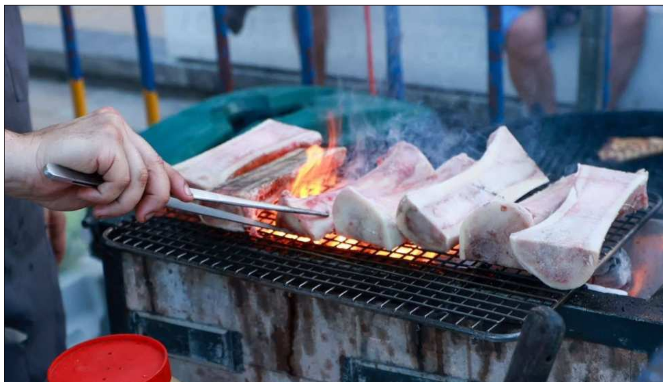
▲ La meta del festival Sabor a Playa es contrarrestar la pérdida de dinamismo económico observada recientemente mediante la promoción constante de la gastronomía estatal y creación de nuevos empleos.

El festival sigue la exitosa estela del Playa Grill Fest, que recientemente reunió a más de 2 mil 500 personas en el Parque Fundadores de Playa del Carmen, con 22 restaurantes que ofrecieron platillos a precios accesibles, demostrando el potencial de los