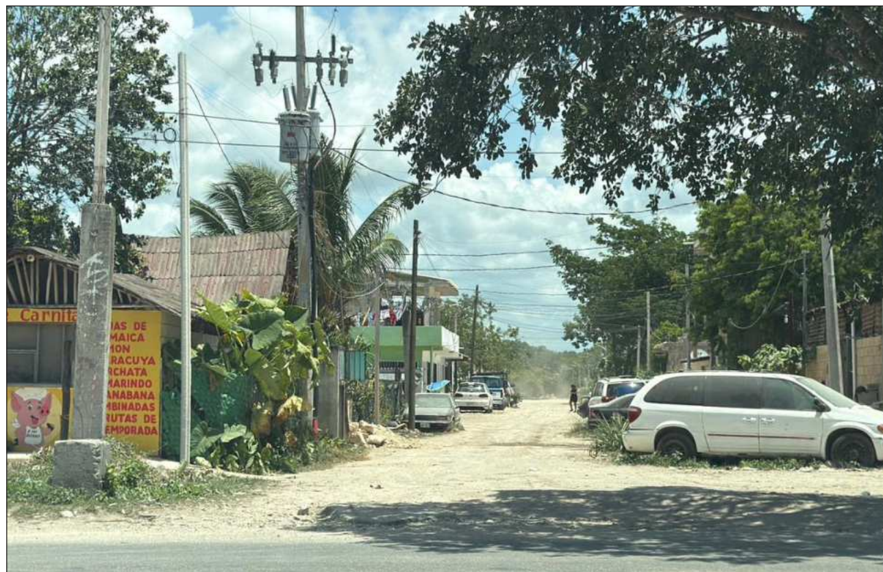
▲ De acuerdo con el integrante del Comité Étnico Pluricultural de Tulum, el proceso de electrificación inició hace algunos meses y actualmente existen comités organizados en torno a 54 transformadores distribuidos en las 14 colonias.

“Todas las colonias ya están conectadas, pero donde