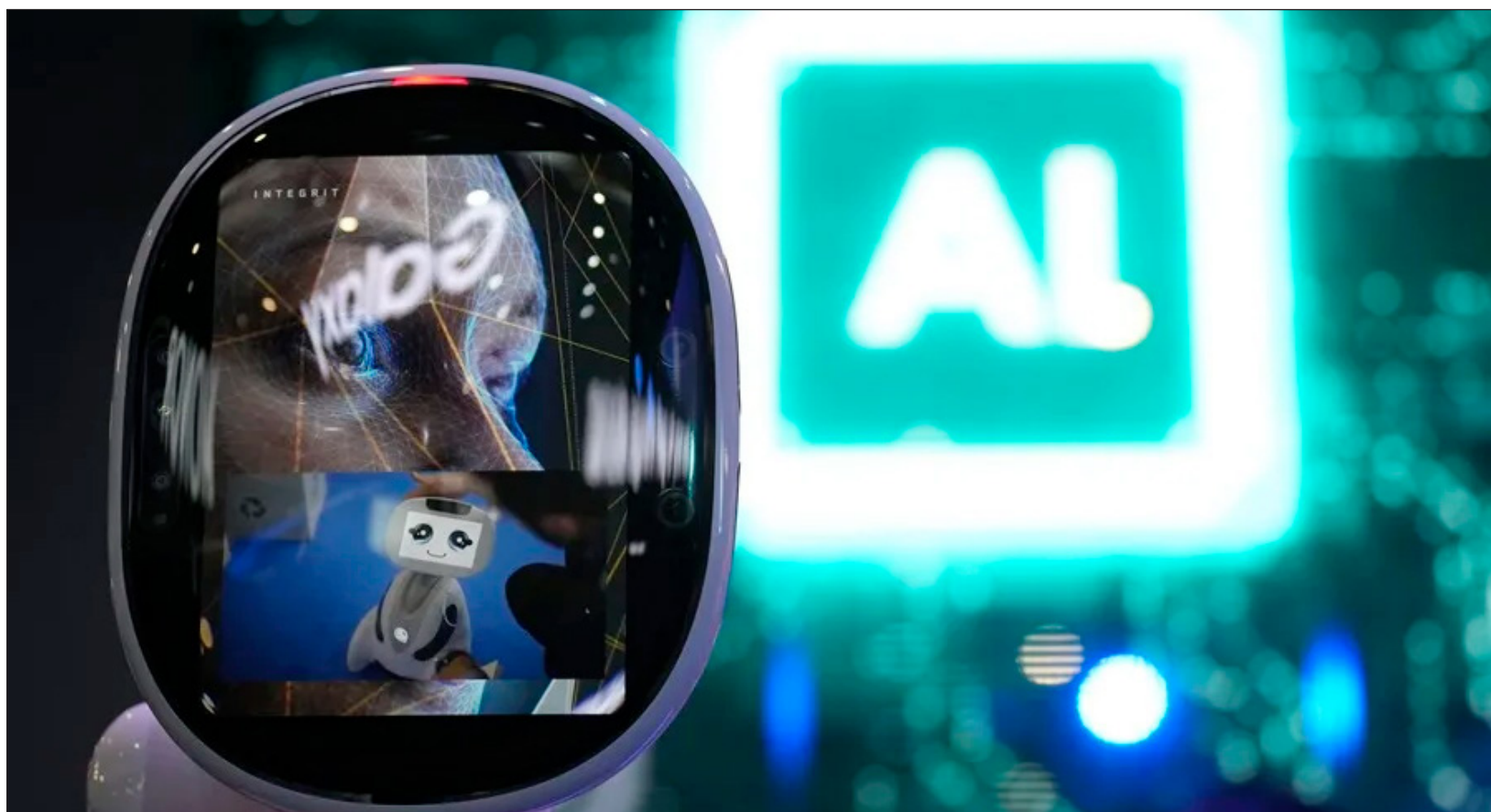
▲ Guterres pide que se respeten cuatro prioridades: la seguridad, los derechos humanos, las capacidades de los países en desarrollo y la transparencia.

Antonio Guterres también instó a las grandes empresas del sector a publicar la huella ambiental de sus sistemas y a alimentar todos sus centros de datos con energías renovables para 2030. E hizo hincapié en el peligro del uso militar de la inteligencia artificial, en particular el recurso a los sistemas de armas letales autónomas.