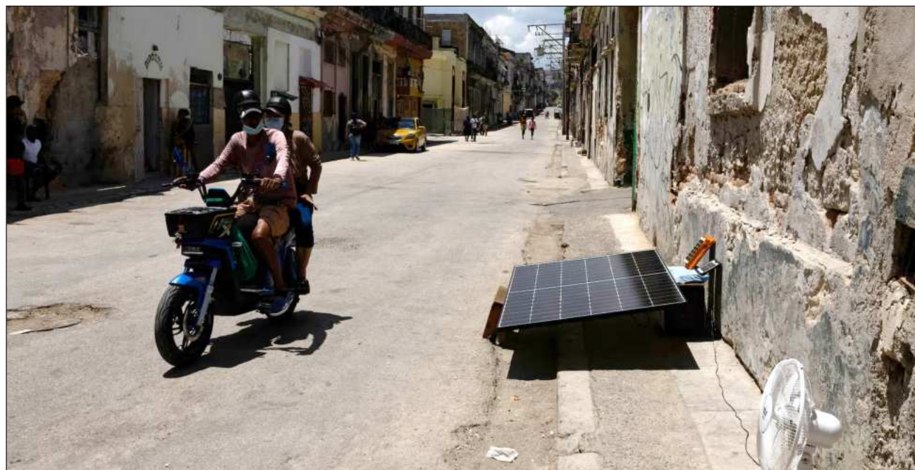
▲ Casi dos tercios del país ya se encontraban sin electricidad cuando la red eléctrica colapsó este lunes.

Cuba lleva meses sufriendo cortes de electricidad que duran horas y, más recientemente, días, debidos en parte a una red eléctrica obsoleta y al bloqueo petrolero impuesto por Estados Unidos, que ha cortado el suministro de combustible a la isla.