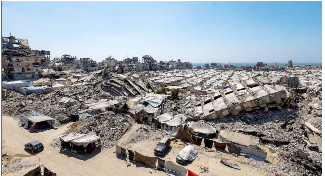
▲ "Hamas da un nuevo paso al renunciar a administrar la Franja de Gaza para privar a la ocupación de cualquier pretexto para continuar su agresión y su guerra de exterminio", declaró el portavoz del movimiento, Hazem Qasem.

El movimiento islamista palestino Hamas anunció este lunes la disolución del organismo que gobernó la Franja de Gaza durante casi dos décadas. La medida representa un cambio político significativo para el grupo, que tomó el control del enclave en 2007 tras enfrentamientos con Fatah, el partido del presidente de la Autoridad Palestina, Mahmud Abbas, con sede en Ramala, en la Cisjordania ocupada.