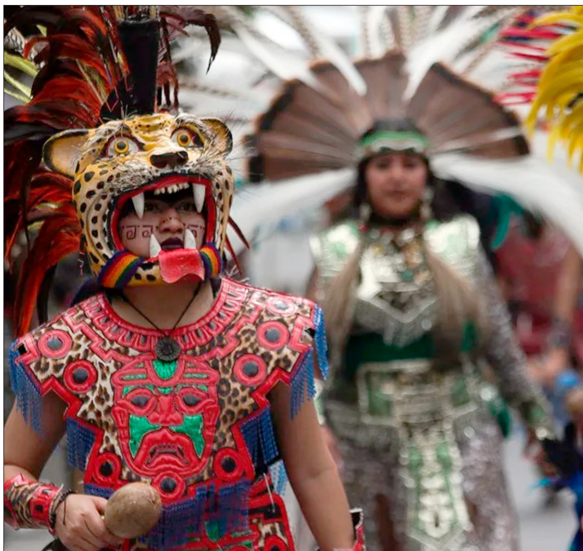
▲ “Las propuestas que surjan serán analizadas y se incorporarán al proyecto de iniciativa entre el 21 de septiembre y 11 de octubre. El 12 de octubre será turnada la iniciativa al Congreso. El proceso es liderado por el Instituto Nacional de los Pueblos Indígenas”.