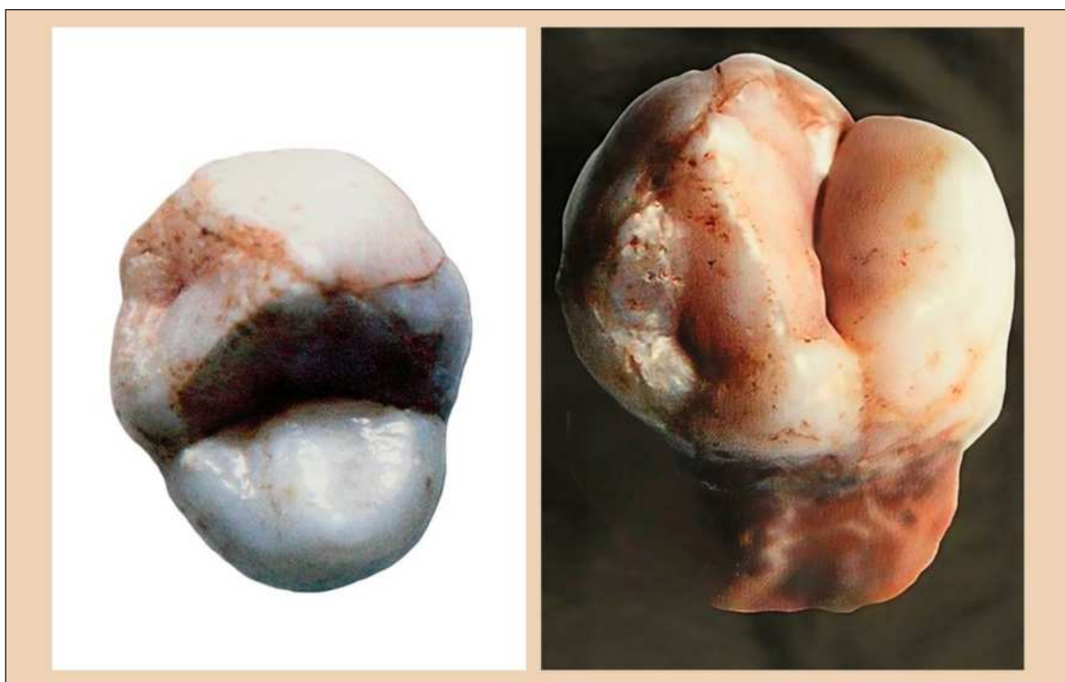
▲ "La fotografía muestra un primer premolar superior derecho con el rasgo de premolar Uto-Azteca, perteneciente a un individuo de entre 8 y 10 años de edad, procedente del municipio de Loja, provincia de Granada".

ANTE ESTO, QUEDA el reto de determinar si este rasgo evolucionó mucho antes de lo que se pensaba en algún territorio de los viejos continentes (Africa, Asia, Europa) y que por difusión (flujo génico) llegó a las demás regiones donde hoy se encuentra o por evolución paralela se dieron eventos mutacionales autosómicos recesivos similares que llevaron a que este rasgo se encuentre en diversas regiones continentales. Esto lo podremos resolver en la medida de que los investigadores encuentren más casos de premolar Uto-Azteca en las colecciones que investigan y conozcamos su lugar de procedencia y la datación de estas.