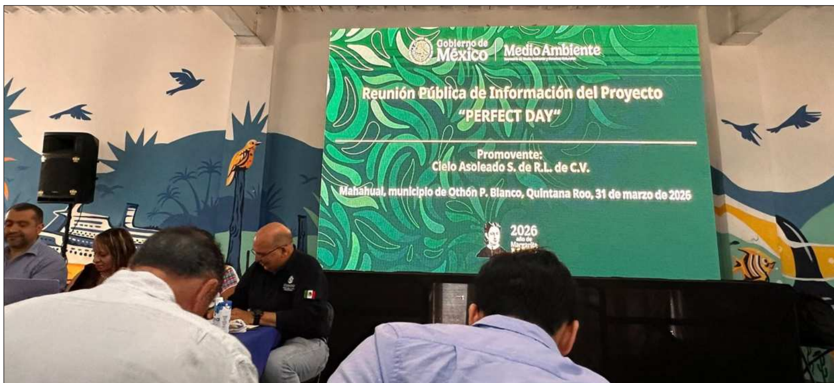
▲ Con motivo de las transmisiones de los partidos, se desplegó un operativo interinstitucional en coordinación con autoridades de los tres órdenes de gobierno.

expone que tres grupos distintos de ciudadanos promovieron juicios de amparo contra las modificaciones al Programa de Desarrollo Urbano de Mahahual; sin embargo, ninguno de ellos ha podido obtener un análisis de fondo de sus planteamientos debido a resoluciones que calificaron de manera distinta la naturaleza jurídica de los actos reclamados, lo que derivó en el desechamiento de las demandas.