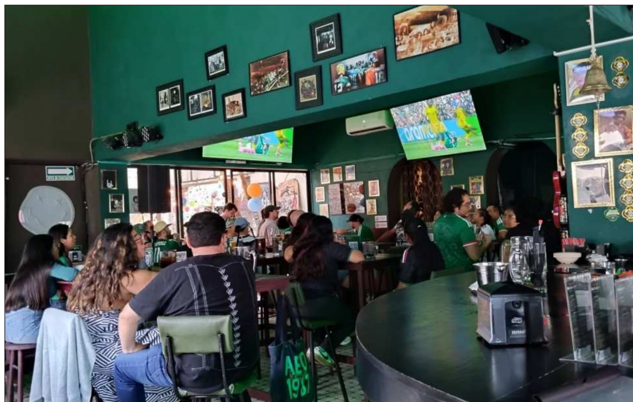
▲ Durante las primeras semanas del Mundial, 41.7% de los restaurantes consultados reportó un incremento en la afluencia de comensales durante los partidos, mientras que 33.3% señaló un comportamiento similar al habitual.

Impacto en el arribo de clientes por los juegos se divide prácticamente por igual, revela sondeo de la Canirac