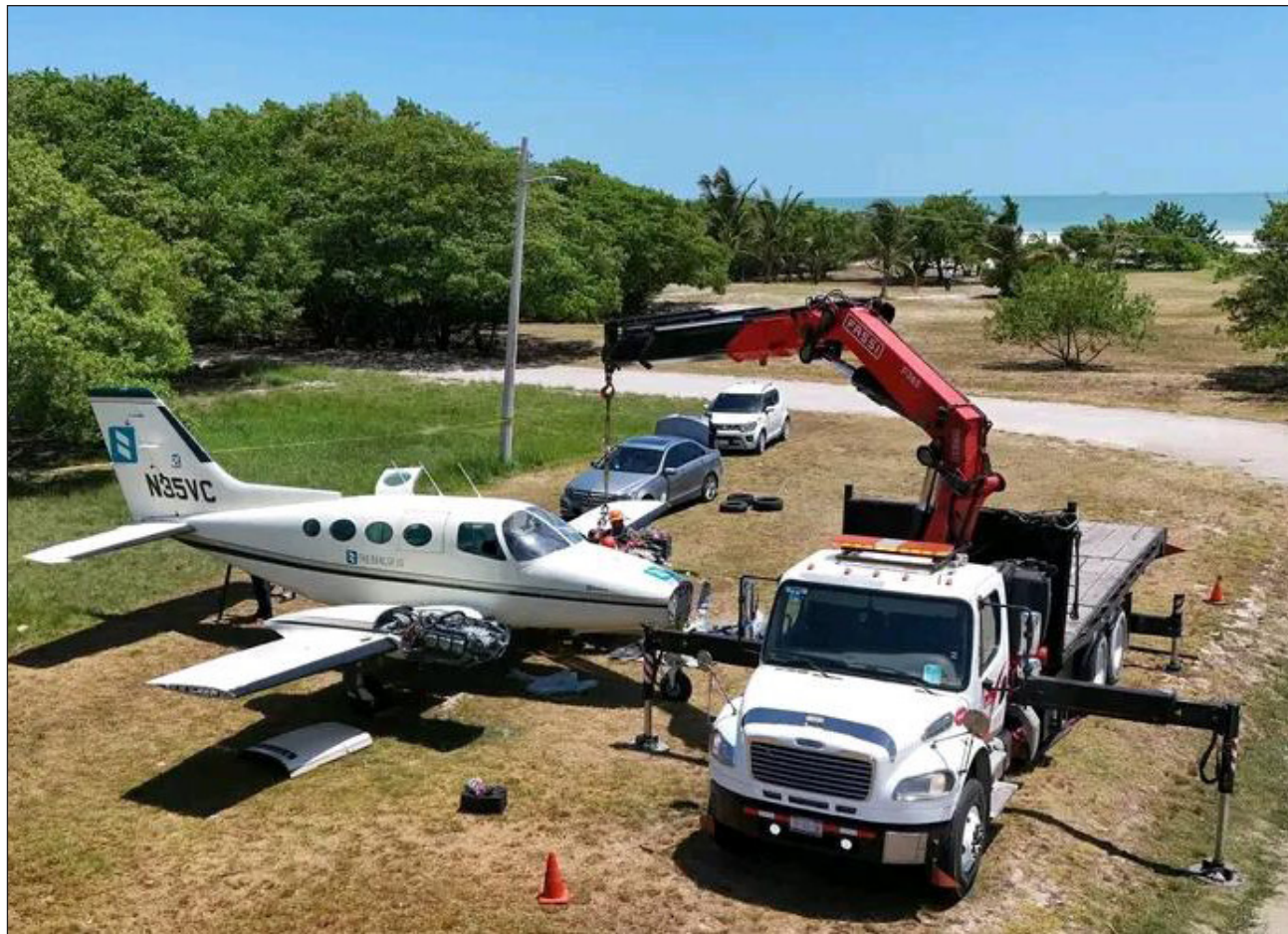
▲ Auxiliado con una grúa, el cuerpo de la aeronave tipo Cessa fue colocado sobre la cama de un camión para ser retirado del área del balneario de Playa Norte.

En el accidente no se registraron personas lesio-