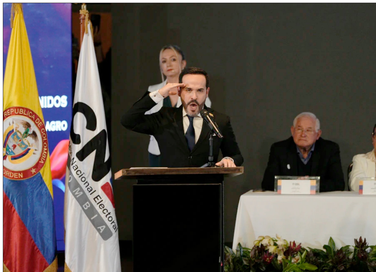
▲ El abogado De la Espriella asumirá el poder el 7 de agosto en reemplazo del izquierdista Petro y ha prometido una política de seguridad más estricta frente a guerrillas y narcotraficantes, en medio de un deterioro de la violencia en el país.