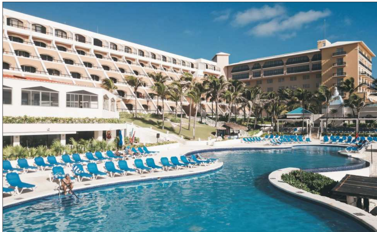
▲ Con esta resolución del Tribunal Laboral a favor de los más de 140 trabajadores del hotel Golden Parnassus, en Cancún, la empresa pondrá a remate la propiedad para pagar salarios, al SAT, cuotas del IMSS e Infonavit.

El líder croquista informó que el Tribunal Laboral ya emitió sentencia a favor de los trabajadores del hotel Golden Parnassus, quienes iniciaron una huelga desde septiembre del año pasado para exigir el pago de diversas prestaciones de ley, así