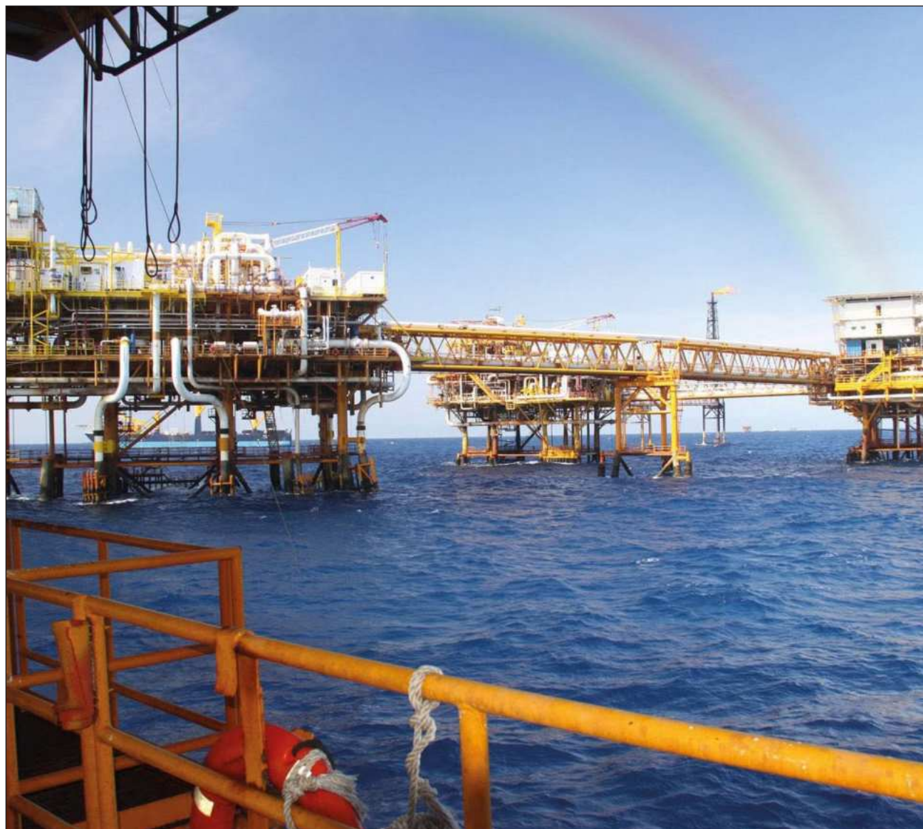
▲ La presidenta Claudia Sheinbaum reprochó la sobre explotación, “irresponsable” del principal yacimiento que ha tenido México, que fue Cantarell cuando el país producía 3.2 millones de barriles diarios.

“Seguimos dialogando con el gobierno de Estados Unidos con la idea de que no represente certidumbre, sino que se garantice la inversión para éste y los próximos años”, agregó.