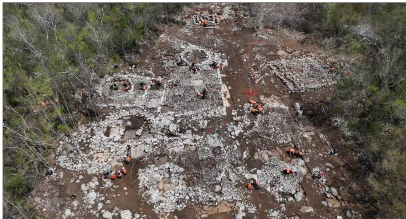
▲ El conjunto doméstico fue explorado por especialistas y personal capacitado durante el acompañamiento que el Instituto Nacional de Antropología e Historia realiza en la construcción del servicio ferroviario de carga del Tren Maya.