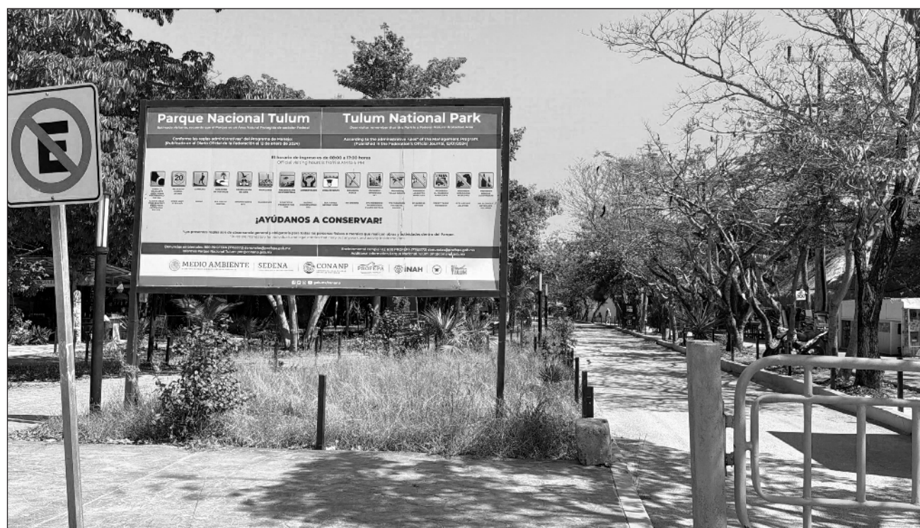
▲ Las autoridades del ayuntamiento de Tulum instalaron módulos de información turística que funcionarán diariamente para orientar a los visitantes sobre los costos reales de la entrada, tours y servicios dentro del área.

Fueron retiradas siete casetas irregulares donde operaban los “jaladores”