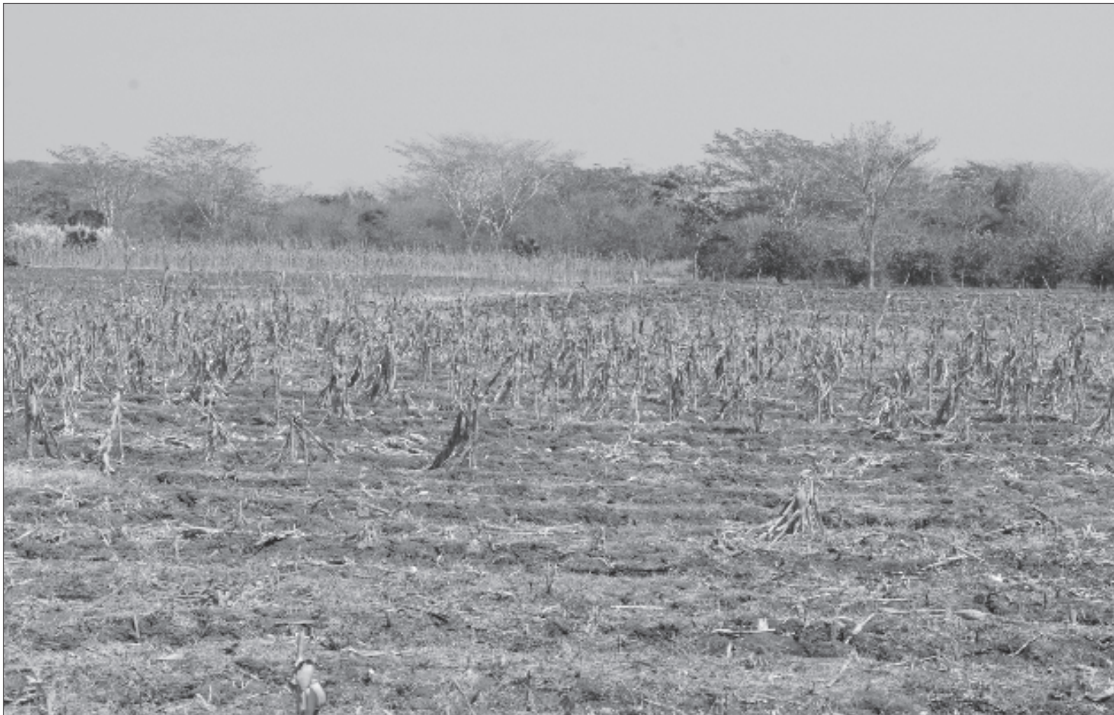
▲ “La sequía y el calor han sido terribles. Varios cultivos están en alto riesgo de siniestro. No es posible planificar la milpa. Hay preocupación entre los agricultores. En años normales ya habían caído varias lluvias en los meses pasados. Había la esperanza de que el 3 de mayo llegara con lluvia”.