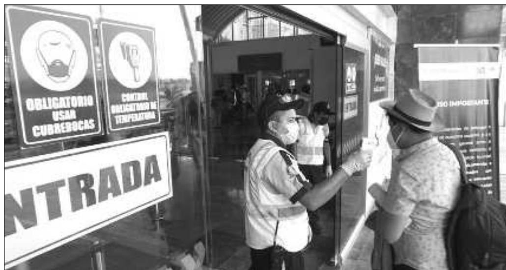
▲ El dato implica que casi cuatro de cada 10 fallecimientos oficialmente atribuidos al coronavirus pudieron haberse evitado, pues se debieron más a un manejo político de la pandemia.

Lo extraño entonces es que se haya dejado de poner el tema de salud en la agenda política considerando el antecedente inmediato de la pandemia, como si fuera imposible que en un futuro cercano surja otro virus incluso más mortífero que el SARS-CoV-2, y que no hayamos escuchado a las candidatas presidenciales pronunciarse al respecto.