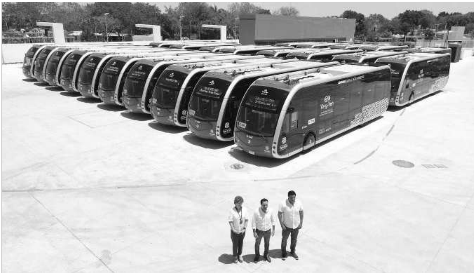
▲ En el Cetram de La Plancha, se dio a conocer que el sábado 11 llegará el sistema Va y Ven al interior del estado.

Hay que recordar que las cinco rutas que conforman el Ie-tram son: Paseo 60-La Plancha-Teya y Mejorada-La Plancha-Kanasín, que ya funcionan; La Plancha-Facultad de Ingeniería, La Plancha-Umán y La Plancha-Umán (Estación del Tren Maya), que próximamente operarán.