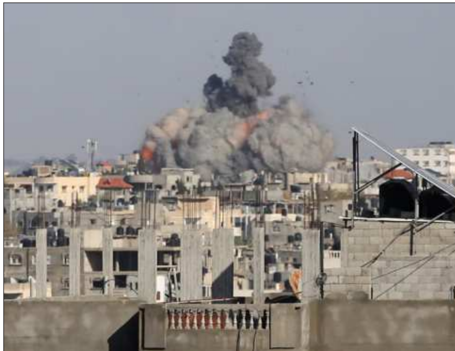
▲ El Gabinete de Guerra israelí acordó este lunes continuar "la operación" en Rafah, donde más de un millón de desplazados acudieron a buscar refugio tras el comienzo de la guerra.

No queda claro si el acuerdo satisfará la exigencia clave de Hamas de poner fin a la guerra y completar la retirada israelí.