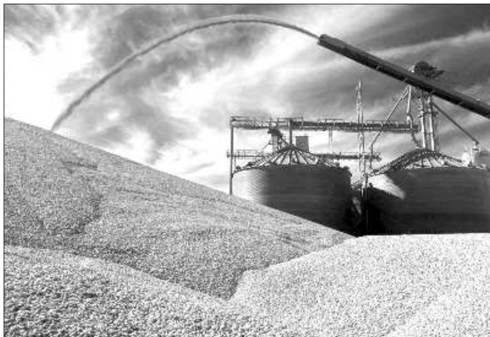
▲ A mediados de febrero de 2023, suavizó su postura en torno al maíz genéticamente modificado pero mantiene su prohibición para productos de consumo humano como las tortillas.

En su argumentación, EU expone que durante décadas la comunidad científica internacional ha considerado que los cultivos genéticamente modificados son seguros para el consumo humano y para la vida y la salud de animales y plantas. De hecho, asegura que México formaba parte de esta comunidad hasta que de manera intempestiva decidió prohibirlos sin base científica.