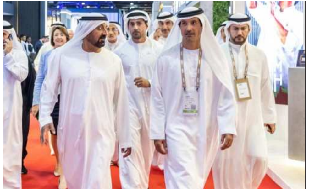
▲ Una vez que haya clientes interesados, entonces podrán analizar con las principales aerolíneas del mundo, como las de Arabia Saudita o Qatar, la posibilidad de abrir vuelos directos a Q. Roo.

Por ahora, dijo el secretario, el comportamiento turístico en el Caribe Mexicano es positivo, se percibe una gran confianza del turismo norteamericano. De acuerdo a los números, tan solo en el primer bimestre del año se tuvo más de 25