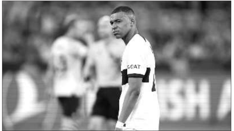
▲ Mbappé se irá del club este verano boreal tras una etapa de siete años, y su ambición como jugador es completarla alzando la Copa de Europa en Wembley el próximo 1 de junio.

"Nuestro objetivo es, que nuestros mejores jugadores, cuanto más participen, mejor", declaró el técnico del PSG Luis Enrique el lunes. "Pero claro, si un rival se encierra, hay espacios... Yo no quiero que el delantero toque la pelota en el sitio