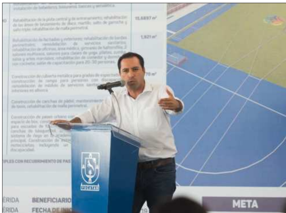
▲ El gobernador con licencia, Mauricio Vila Dosal, destacó que toda su vida ha sido una persona que respeta y acata la ley y que en esta ocasión no será la excepción.

“Juntos y en equipo hemos puesto a nuestro estado en una ruta de cambio y transformación. Una ruta de trabajo conjunto que nos ha llevado a tener resultados históricos en generación de empleo, reducción de pobreza y en reducción de