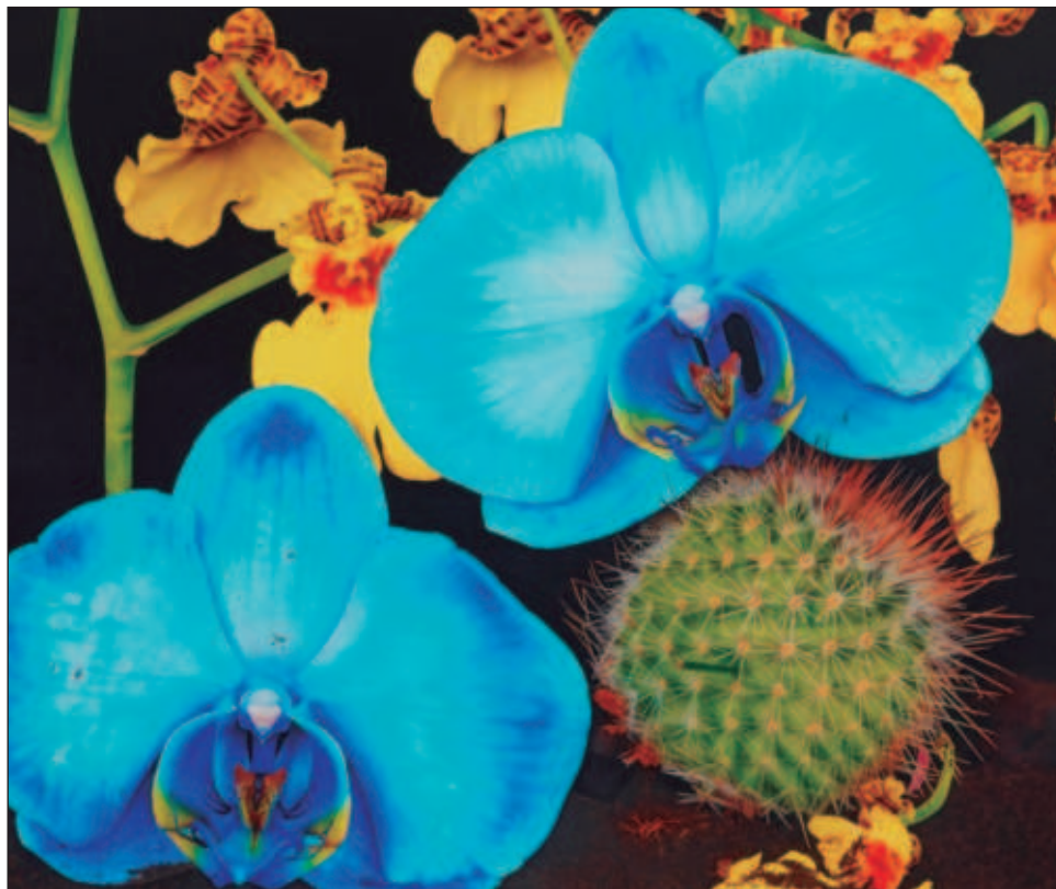
▲ La exhibición, que permanecerá abierta al público hasta 29 de septiembre, está integrada por una variedad de obras de Quinn que se fusionan en el paisaje de los Jardines de Kew.

destacan las ubicadas en los majestuosos invernaderos victorianos, cuyas formas recortadas hechas de un material altamente pulido hacen difícil distinguir qué es cielo y árboles reales, y qué es reflejo. Al acercarse a las formas parecidas a plantas, los espectadores perciben como si las esculturas desaparecie-