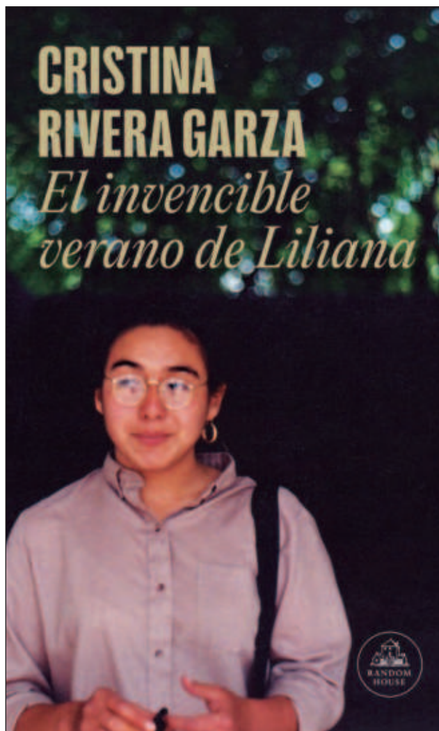
▲ La obra “mezcla memorias, periodismo de investigación feminista y biografía poética unidos con una determinación nacida de la pérdida”, argumentó la junta de los premios.

La Junta de los prestigiosos Premios Pulitzer otorgó en su 108 edición una mención