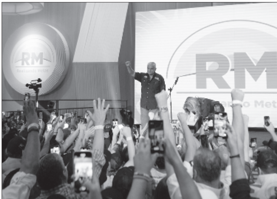
▲ El presidente electo de Panamá, José Raúl Mulino, debe prepararse para liderar a un país fragmentado políticamente que enfrenta grandes desafíos económicos.

“Basta ya de llevar la venganza como gestión de gobierno... de justicia amañada, se acabó”, afirmó Mu-