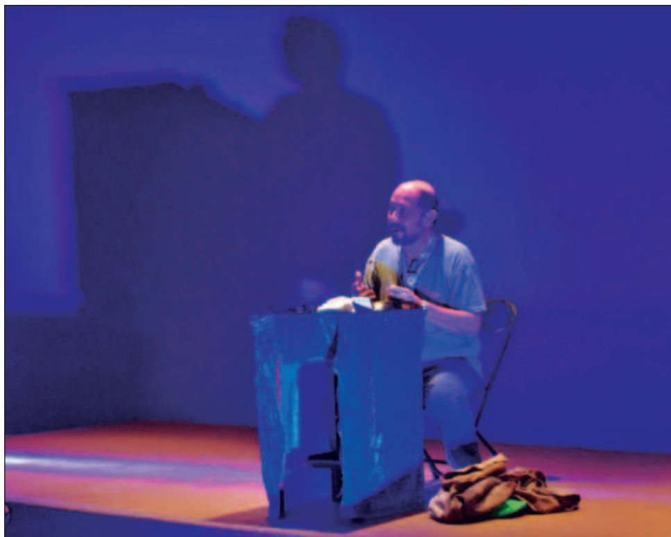
▲ El taller está dirigido a creadores de las disciplinas como artes visuales y tradiciones populares, danza, literatura, medios audiovisuales y alternativos, música y teatro.