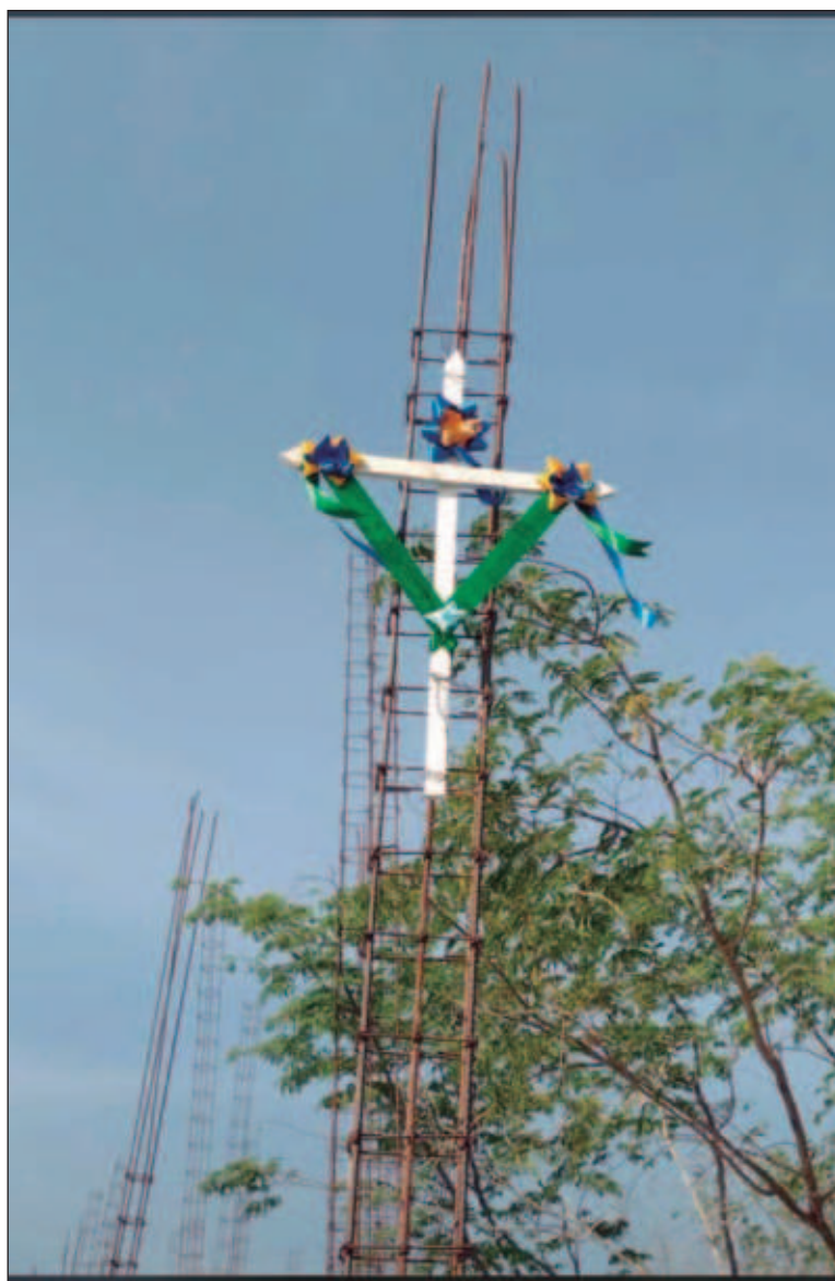
▲ “La fiesta del día del albañil inicia con la instalación de la cruz hecha con desperdicios de madera y colocada en lo alto de la obra en construcción (...) algunas veces se improvisa un altar y colocan veladoras”.

LA RELIGIOSIDAD DEL obrero de la construcción es poco explícita, si el albañil es católico pronto define su filiación religiosa, pero cuando forma parte de algún otro culto, se limita a no hablar de religión y a participar en la fiesta sin beber alcohol si su religión lo prohíbe.