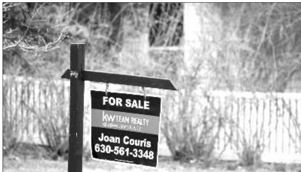
▲ En los últimos veinte años más de 2 mil 600 millones de dólares provenientes de fondos sospechosos se invirtieron en el sector inmobiliario estadounidense, según Integridad Financiera Global.

La propiedad comercial en EU ofrece a sindicatos criminales, cárteles, cleptócratas y estafadores un camino fácil para ocultar y lavar sus ganancias mal habidas, destaca la organización. Ello se debe en parte a que cada vez es más frecuente que las propiedades pertenezcan a fideicomisos tanto de ese país como del extranjero, a los que no se aplican las regulaciones en materia de transparencia corporativa.