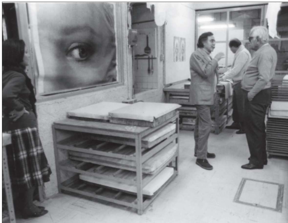
▲ “La Jornada se establece como el diario de la izquierda ilustrada y de las clases intelectuales”.

El salinismo se aúpa en la intelectualidad dominante y corona