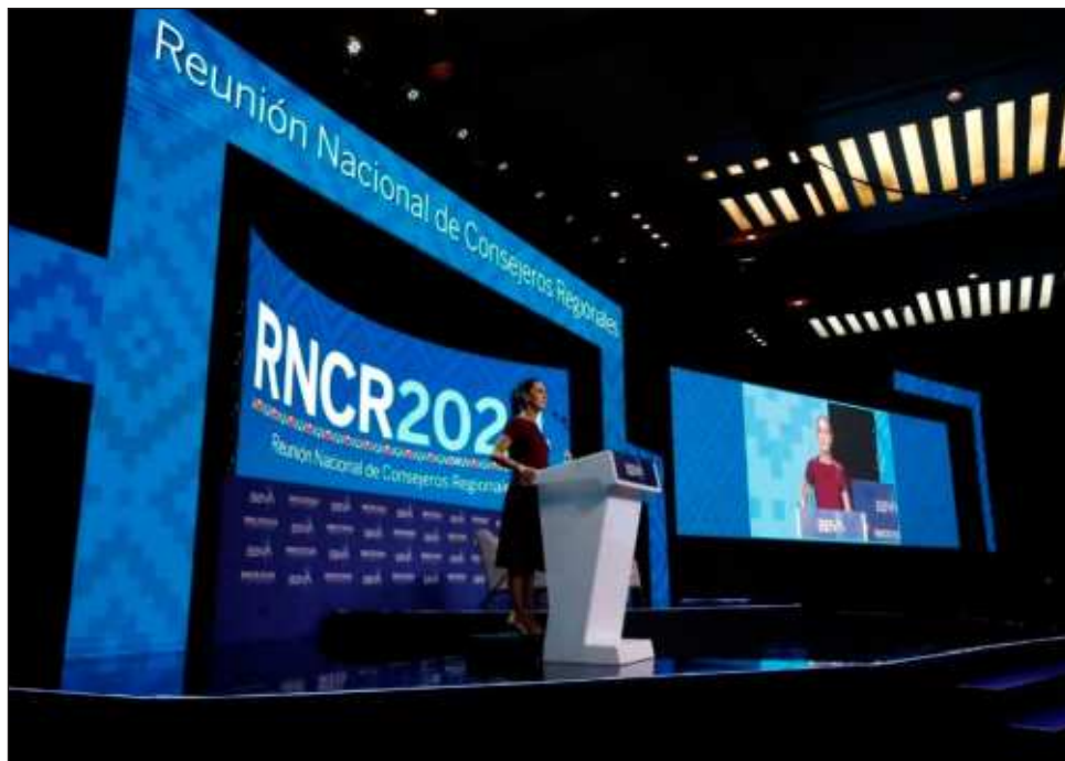
▲ El objetivo es poner por delante el desarrollo de las vocaciones regionales del país, destacó la candidata de Sigamos haciendo historia durante la RNCR 2024.

En el encuentro con los consejeros regionales de BBVA, Sheinbaum Pardo recuperó el proyecto económico que presentó hace tres semanas en la 87 Convención Bancaria, en el que propone doce polos de desarrollo regional adicionales a los diez promovidos por esta administración; la instalación de 100 parques industriales para atraer la relocalización de empre-