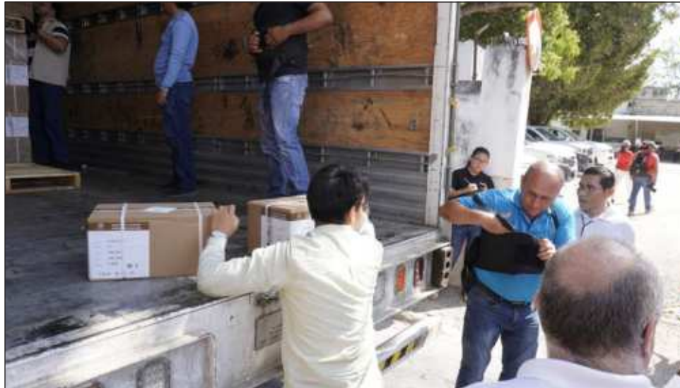
▲ Llegaron al estado 27.18 toneladas de material electoral que cubren 23.88 metros cúbicos, en la que se puede destacar actas de escrutinio y cómputo por cada elección, entre otras.

Sobresale por su importancia la entrega de las 2 millones 260 mil 473 boletas electorales, por lo que estos envíos son acompañados desde su salida del Centro Logístico de Distribución en la Ciudad de México hasta los consejos distritales por elementos de la Secretaría de la Defensa Nacional, la Guardia Nacional y la Marina Armada de México, que al llegar a las sedes distritales en Campeche la custodia queda a cargo de la Marina Armada de México, destacó.