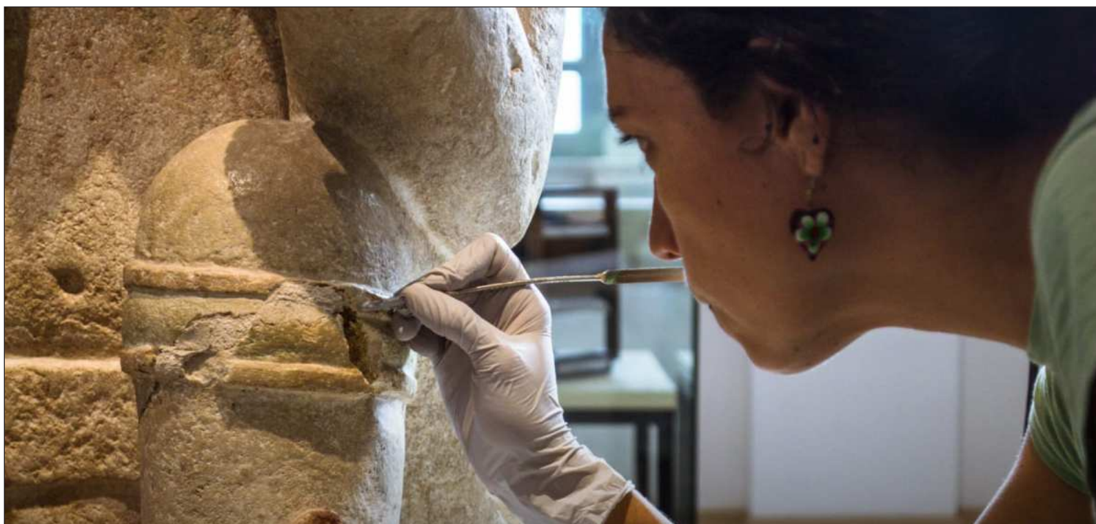
▲ “Conservar el portaestandarte de Chichén Itzá es, en última instancia, preservar una historia que sigue construyéndose”.