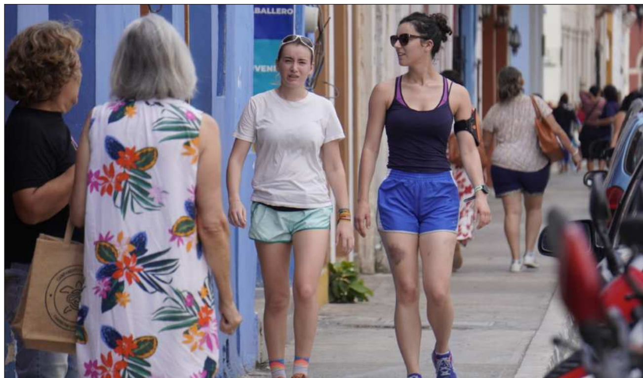
▲ Reprochan que mientras los empresarios hoteleros pagan impuestos, personal de limpieza, administrativo, en algunas ocasiones contable externo y de vigilancia, quienes son socios de la aplicación Airbnb no tienen esta responsabilidad.

Mencionó que mientras los empresarios hoteleros pagan impuestos, personal de limpieza, administrativo, en algunas ocasiones contable externo y de vigilancia, quienes son socios de la aplicación Airbnb no tienen esta responsabilidad.