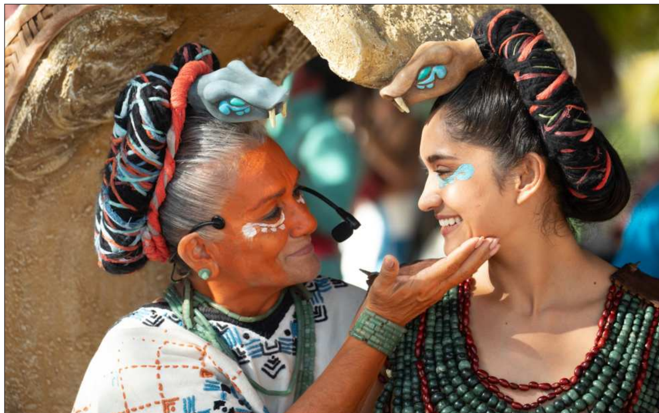
▲ Mientras grandes consorcios turísticos generan riqueza utilizando la simbología y el nombre del pueblo maya, las comunidades enfrentan el abandono gubernamental, con calles intransitables y falta de servicios.

Acusó que mientras grandes consorcios turísticos generan riqueza uti-