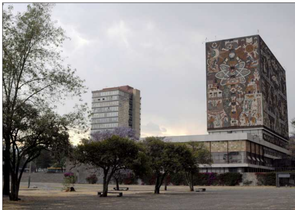
▲ Las licenciaturas más solicitadas (medicina, derecho y contaduría) sumaron 47 mil 204 candidatos para sólo 2 mil 235 lugares, siendo la de médico cirujano la más requerida.

Una revisión de La Jornada revela que las licencia-