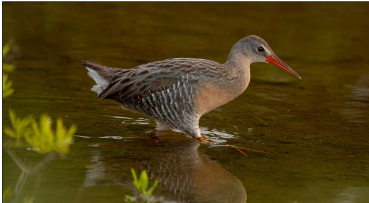
▲ El hallazgo confirma un evento de anidación exitoso en el Refugio Estatal de Flora y Fauna Laguna Colombia.