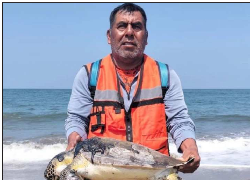
▲ El juez Ulises Oswaldo Rivera pidió a las autoridades que rindan un informe previo en un plazo de 48 horas y sobre las acciones para cumplir con la suspensión.

Pero no sólo eso, además la exclusión de crear juzgados de distrito especializados en materia ambiental, ejecutar el Plan Nacional de Contingencia para Derrames de Hidrocarburos y Sustancias Nocivas Poten-