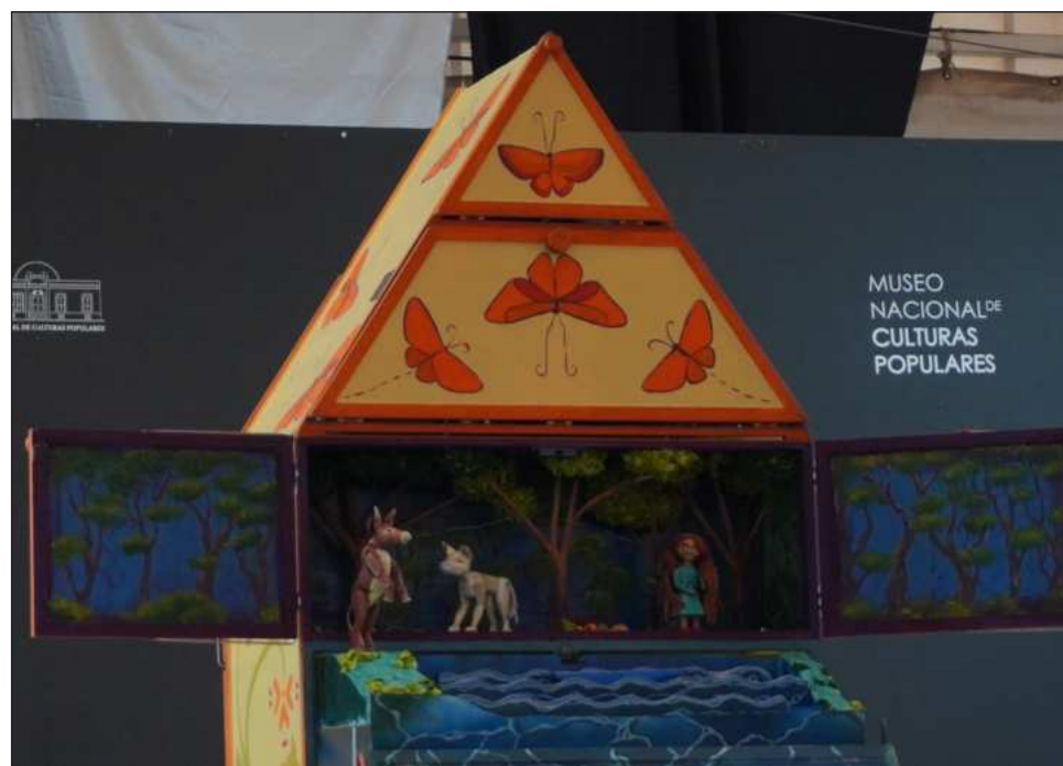
▲ La obra Ga ñomújí yombaro/El aleteo de las mariposas aborda cómo vamos dejando de lado el conocimiento de nuestros antecesores.