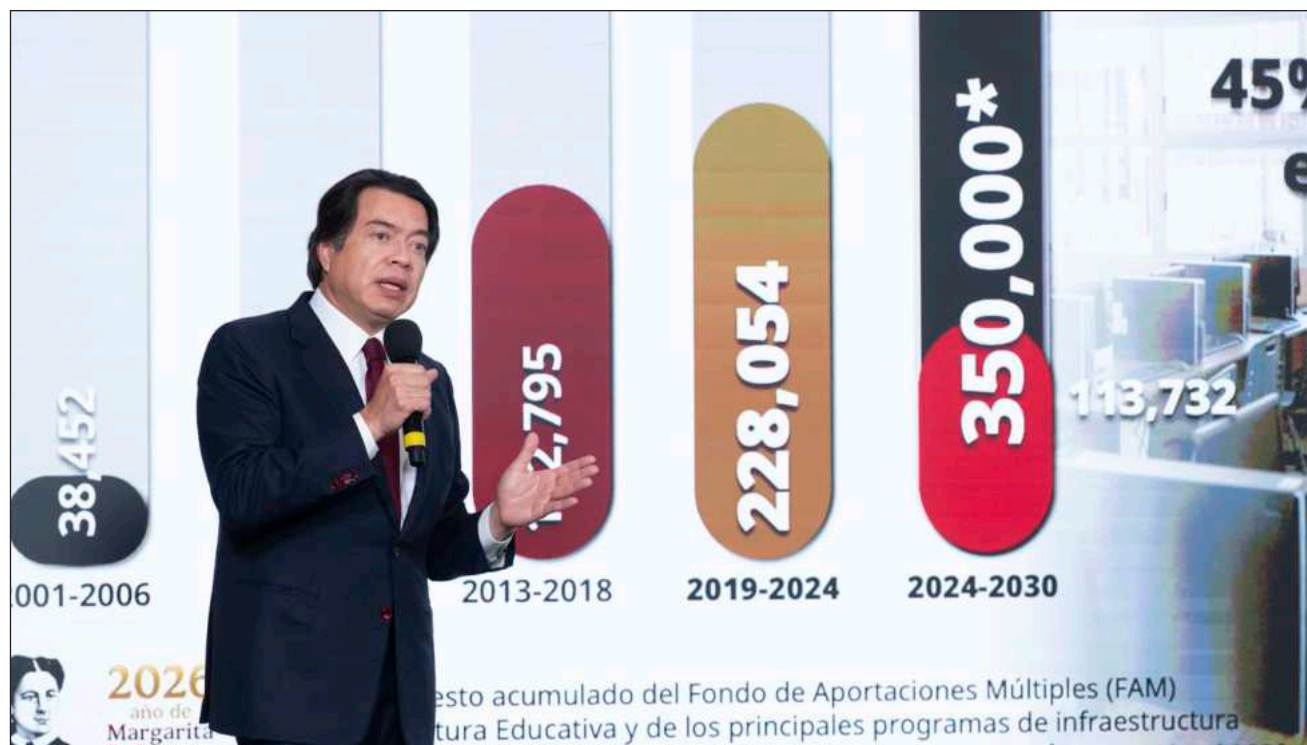
▲ El gobierno federal destinará a Q. Roo 150 millones 822 mil 302 pesos.

Entre los estados más beneficiados con recursos para estas universidades está en primer lugar Michoacán, con 262 millones 897 mil 301 pesos, seguido de Quintana Roo, con 150 millones 822 mil 302 pesos, mientras que a Campeche corresponderán 112 millones 727 mil 690 pesos.