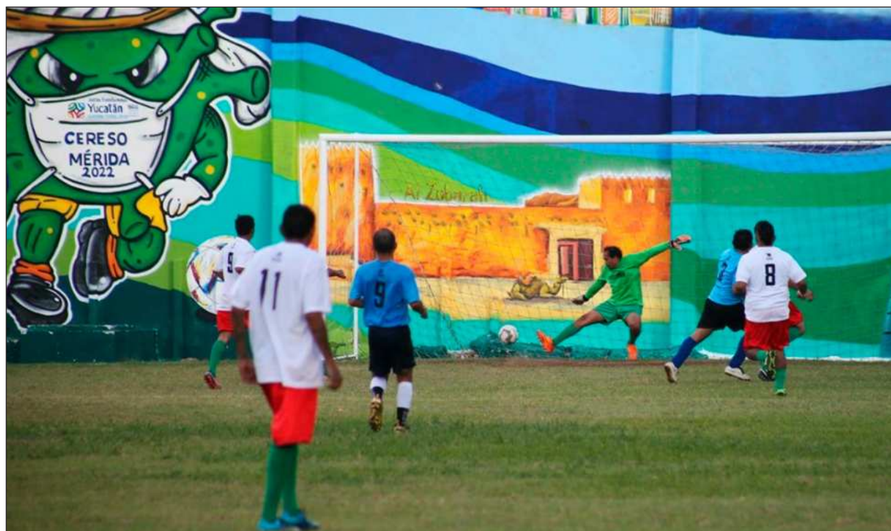
▲ A meses de dar inicio al Mundialito , las y los internos se encuentran preparándose para los encuentros.

Esto quiere decir que participarán en la ceremonia de inauguración, en la creación de la mascota oficial, el diseño de coreogra-