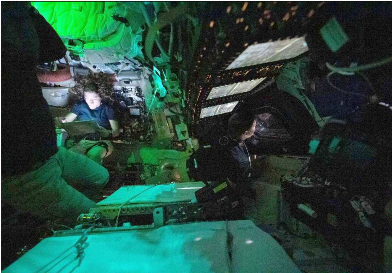
▲ La agencia espacial estadounidense subrayó que la observación lunar de ahora, de unas siete horas mientras la tripulación estaba lo suficientemente cerca, hasta a 6 mil 545 kilómetros de la Luna, representando un avance significativo.

La misión Artemis II , de diez días, ahora inició su regreso a la Tierra, que culminará el 10 de abril con un amerizaje al frente de la costa de San Diego (California).