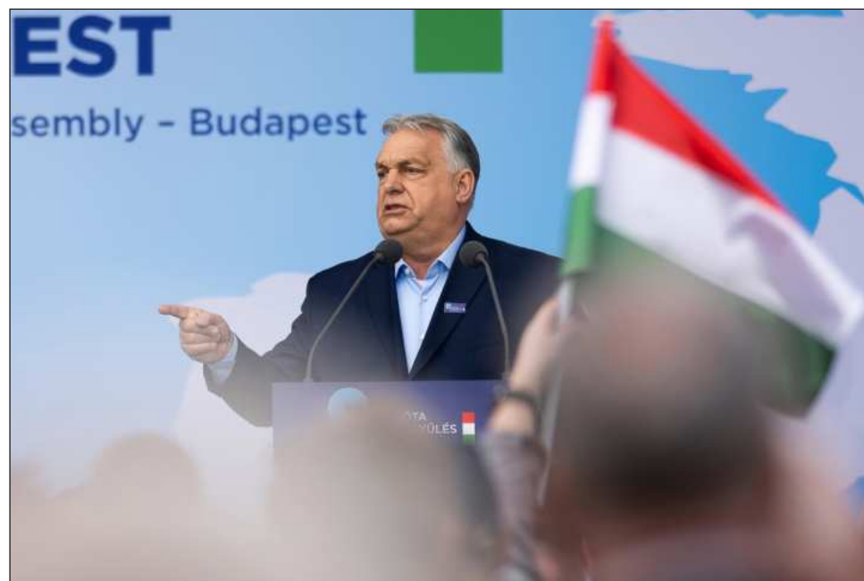
▲ Orbán llegó al poder en 1998 prometiendo prosperidad tanto a ricos como a pobres.

Pero los vetos de Orbán han limitado las respuestas