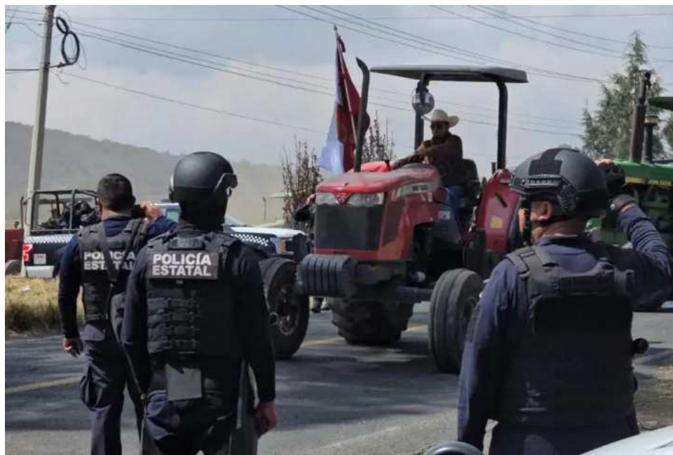
▲ Las autoridades federales indicaron que los bloqueos se realizan en Baja California, Chihuahua, Guanajuato, Morelos, Sinaloa, Tlaxcala, Veracruz y Zacatecas.

Las autoridades federales indicaron que los bloqueos, cierres o liberación de casetas de cobro en carretera, se realizan en Baja California, Chihuahua, Guanajuato, Morelos, Sinaloa, Tlaxcala, Veracruz y Zacatecas.