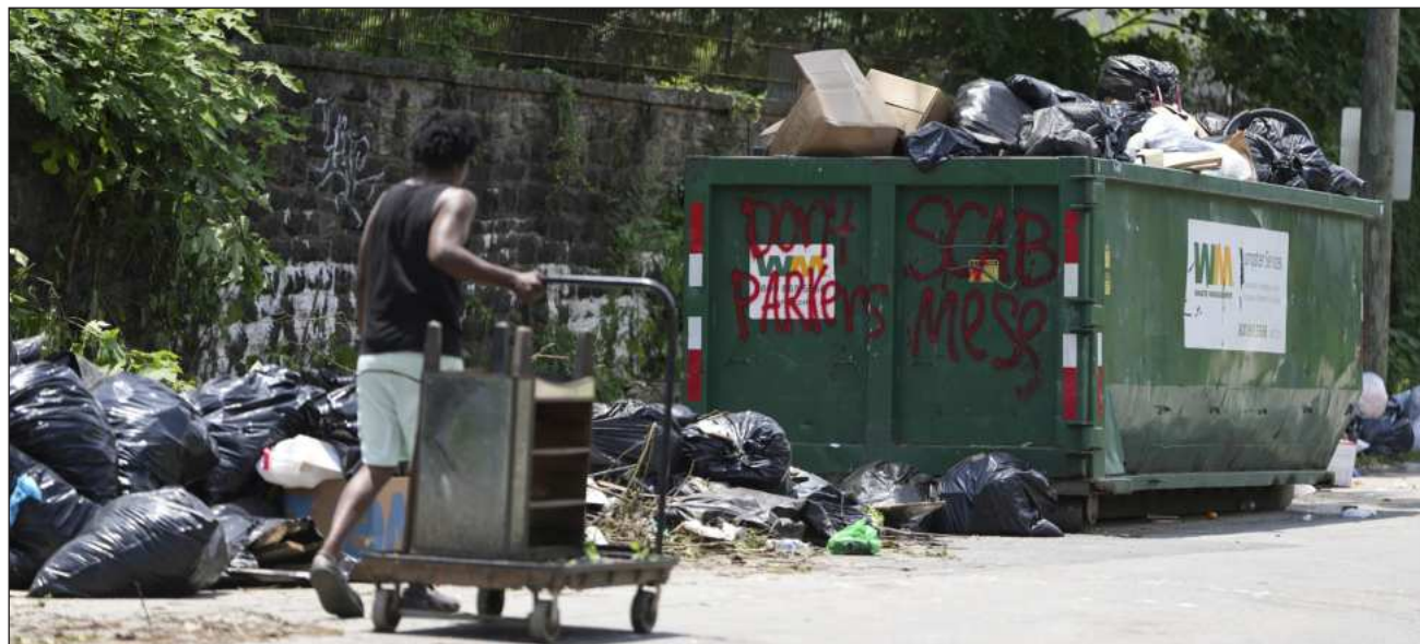
▲ De acuerdo con los datos más recientes (2022), a nivel global se generan 2 mil 600 millones de toneladas de residuos; y alrededor de 30 por ciento no se recogen, lo que agrava los riesgos para las economías locales, la salud pública y el medio ambiente.

De acuerdo con los datos más recientes (2022), a nivel global se generan 2 mil 600 millones de toneladas de residuos; y alrededor del 30 por