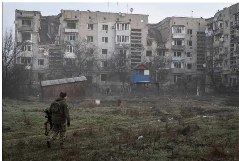
▲ Ayer, Kiev propuso a Moscú una tregua en los ataques contra objetivos energéticos.

Aunque Ucrania logró evitar el colapso de su infraestructura pese a los limitados suministros de munición, Ru-