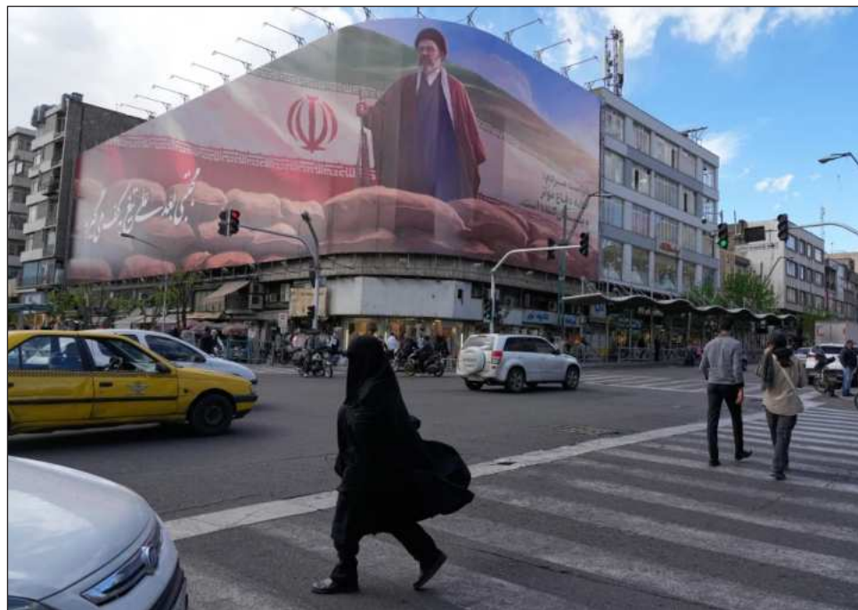
▲ Katz afirmó que Israel atacó el lunes una planta petroquímica clave en Asaluyeh.

Los ataques contra South Pars son lo suficientemente provocadores para