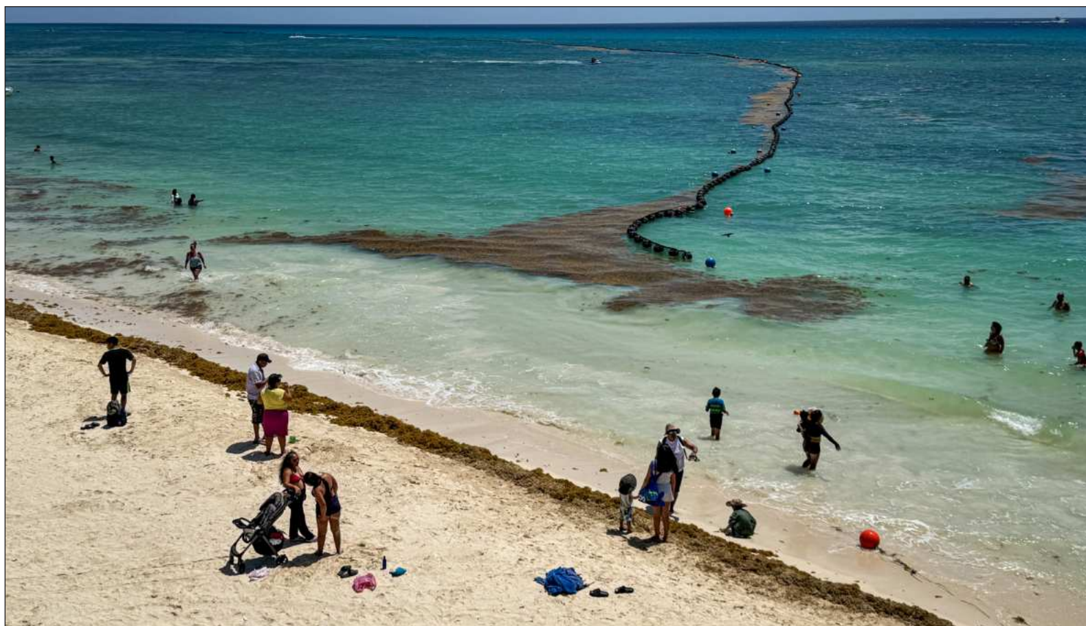
▲ "La presencia del sargazo sigue siendo una preocupación legítima y constante para quienes viven del turismo".

*Secretario de Ecología y Medio Ambiente de Quintana Roo