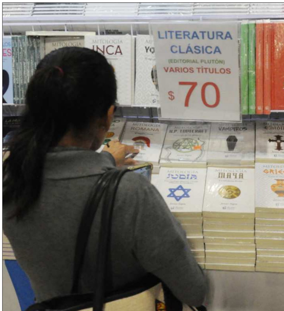
▲ Paloma Sainz asegura que es difícil saber el número exacto de visitantes al encuentro literario, pero que “creo que hubo más gente este año que en cualquier otra edición”.

En el día soleado con cierto frescor en el aire, turistas acicateados por la prisa atravesaban el espacio capitalino, en algún lo-