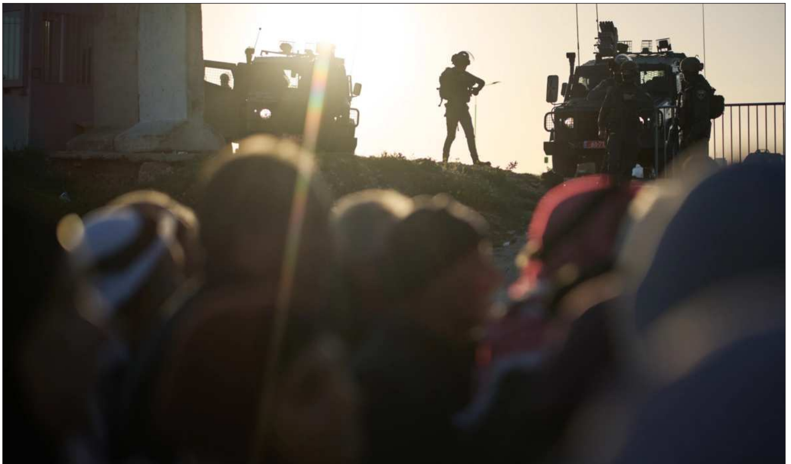
▲ “La destrucción y el hambre impuesta por Israel dejan una secuela trágica, tanto sanitaria como tóxica, que afectará a niñas y niños por nacer”.