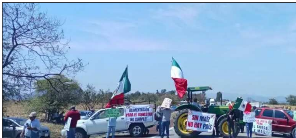
▲ El problema está más allá de la interlocución y la entrega de apoyos, con un factor externo que incide negativamente: el aumento internacional en los precios de los combustibles.

De nuevo, es cuestión de que el diálogo tenga espacios para la escucha atenta y la elaboración de propuestas de desarrollo. No solamente ejecutar bloqueos, sino también contar con rutas críticas para llegar a los objetivos planteados.