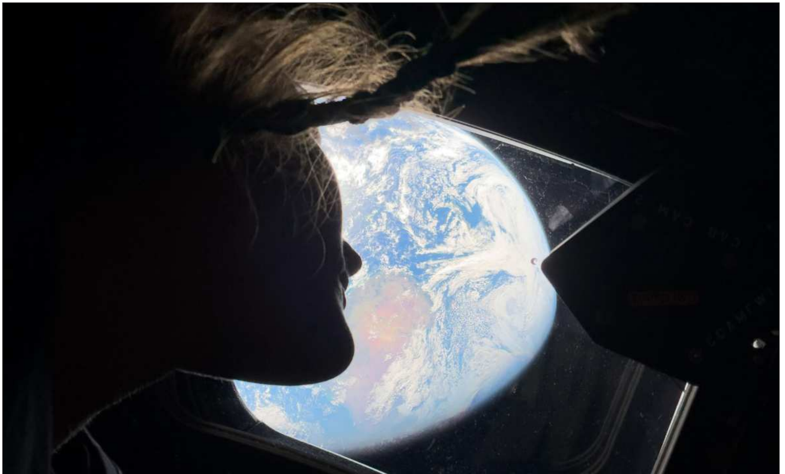
▲ "Detrás de la proeza hay una enorme cantidad de trabajo, planeación, organización, logística. Hay la articulación de diferentes disciplinas científicas".