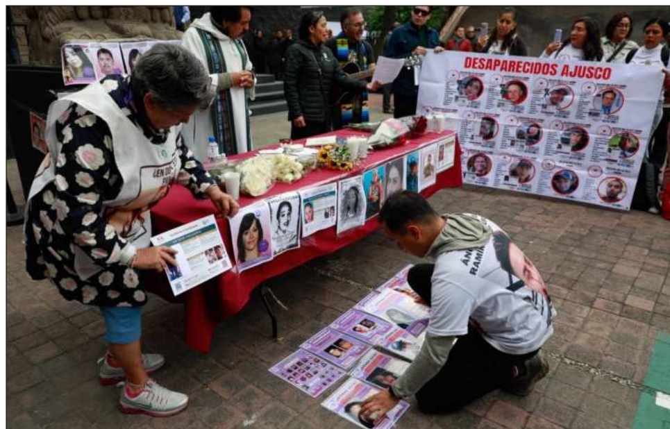
▲ “No estipulan los estatutos de la comisión”, dijo Sheinbaum.

“No fueron consideradas las acciones que hemos hecho y no tiene nada que ver con los colectivos, la soli-