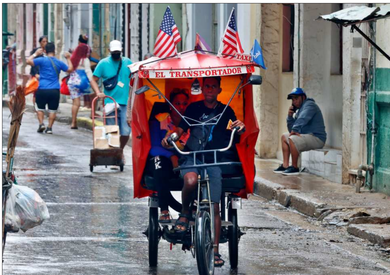
▲ Los representantes Pramila Jayapal y Jonathan Jackson recorrieron por cinco días la isla de corcho.

“O bien ayudamos a estas personas a permanecer en sus hogares y a llevar una vida sana y normal, o bien se producirá una migración masiva hacia EU. Lo que la gente no hará es quedarse aquí simplemente a sufrir y morir”, dijo Jackson.