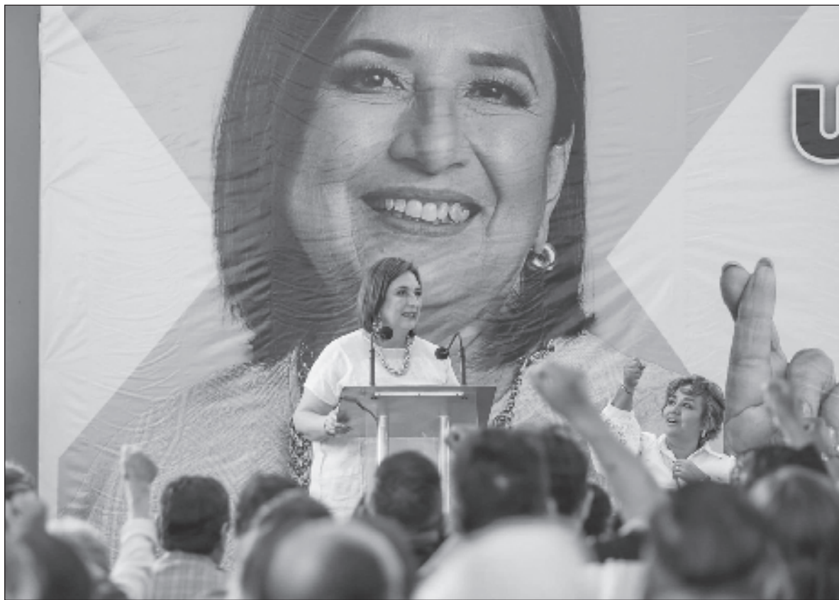
▲ "El manual ahorita es go negative con Claudia Sheinbaum, no con López Obrador, o también con López Obrador, con investigación de oposición, con chismes, con todo'. Es lo que han venido haciendo, y tampoco les ha dado resultado".

Anoche comenzaban a fluir los resultados del Supermartes, la jornada electoral en varios estados de la Union Americana, tanto del partido Demócrata como del Republicano. Aparecían amarrados el presidente Biden y el ex presidente Trump. Hubo actividad en Alabama, Arkansas, California, Colorado, Maine, Massachusetts,