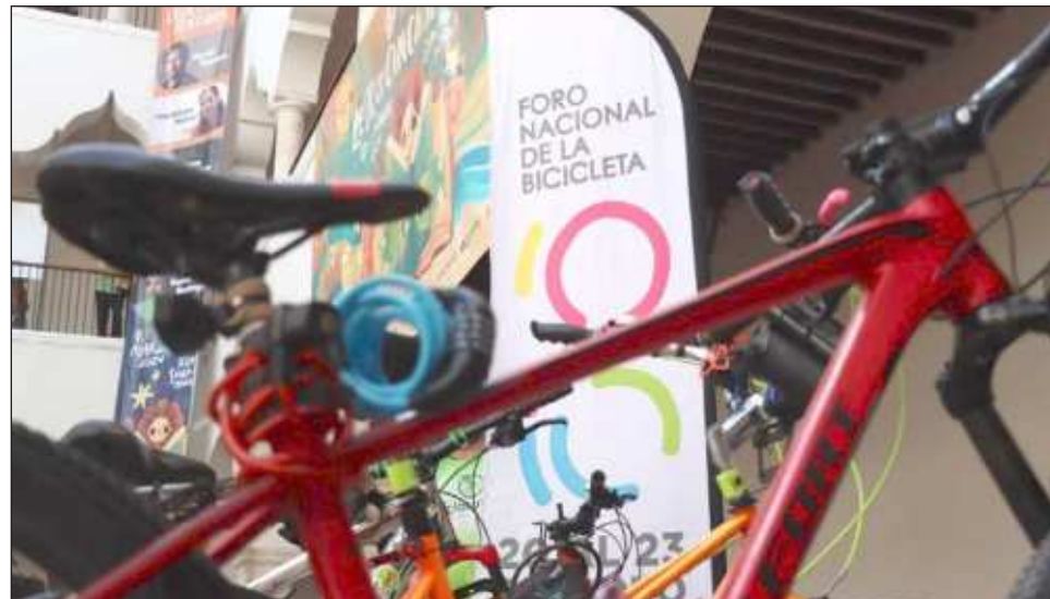
▲ El Foro Nacional de la Bicicleta es un espacio para la discusión e intercambio de ideas, conocimientos y experiencias exitosas en torno a la movilidad sostenible.

Resaltó que tiene como objetivo impulsar una movilidad