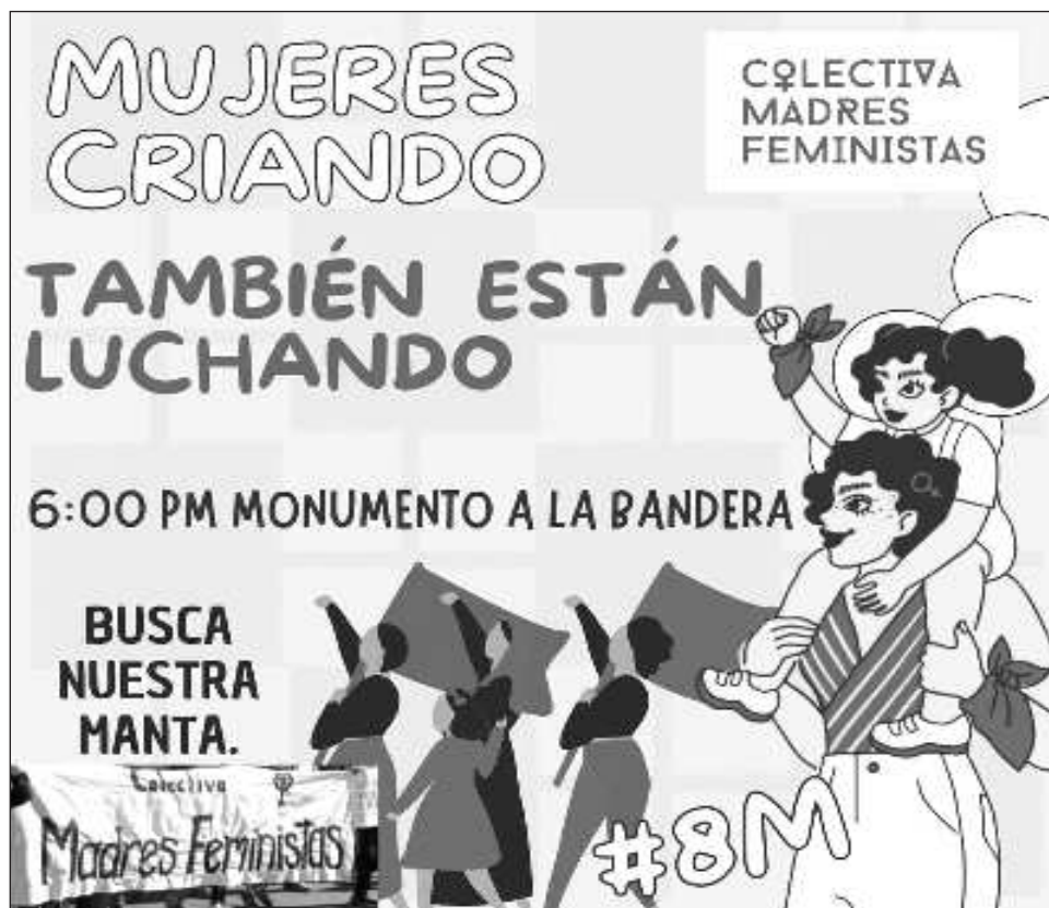
▲ La Colectiva Madres Feministas Yucatán también emitió una convocatoria para que las mujeres criando se unan al contingente de madres e infancias.

La marcha del 8M suele estar acompañada de actividades grupales, artísticas y culturales.