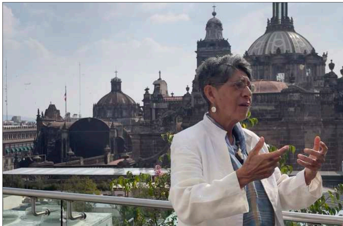
▲ Uno de los objetivos de la también colaboradora de esta casa editorial es la creación del CECI, el Consejo Estatal de Ciencia e Innovación y atender el rezago educativo a través de programas sabatinos de asesorías.

La idea es que los gobiernos estatales recurran, al menos de manera consultiva, al equipo de científicas y científicos que forman parte de la academia para