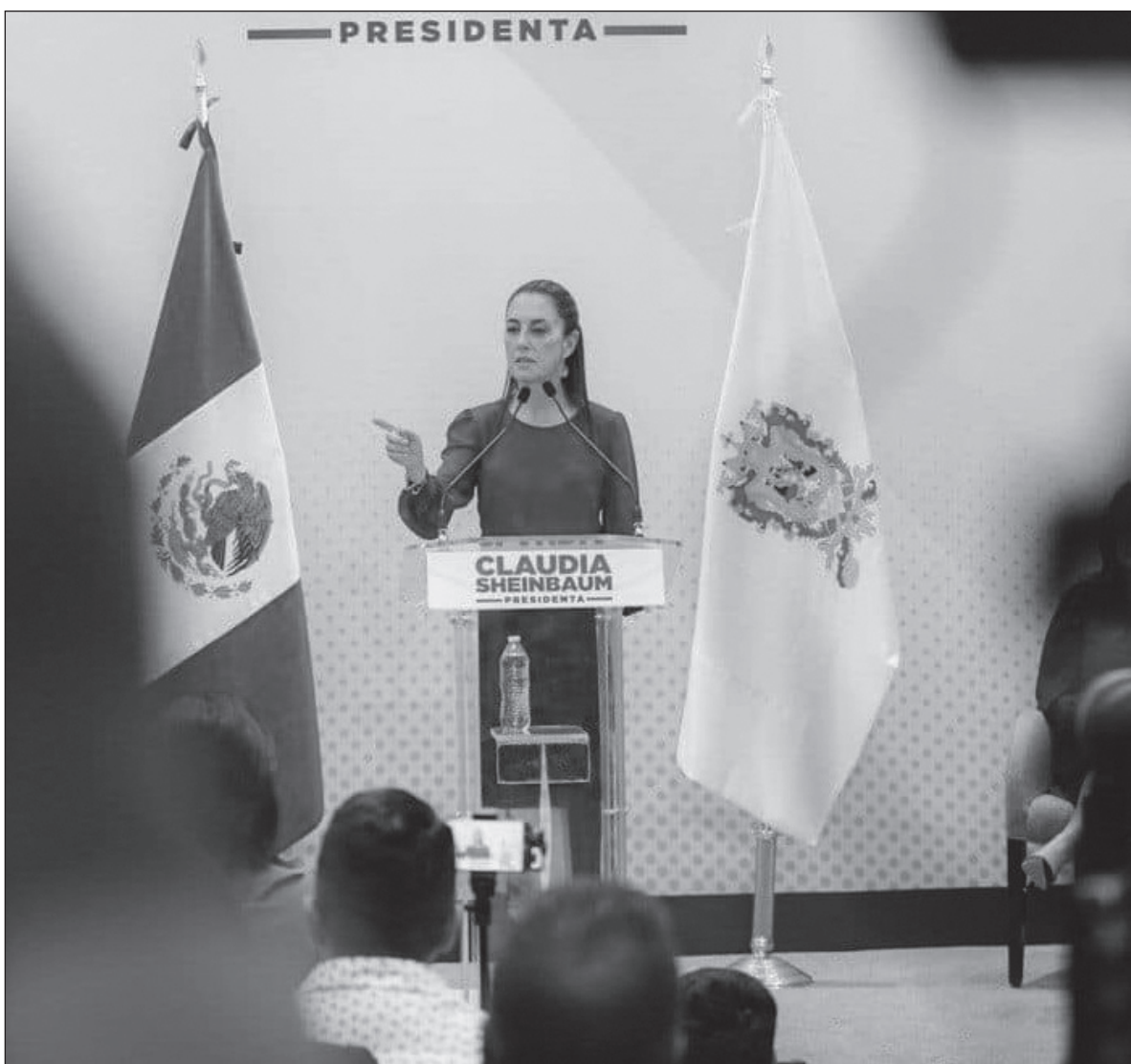
▲ Sheinbaum mantiene una línea de continuidad "programática de lo hecho por el obradorismo".