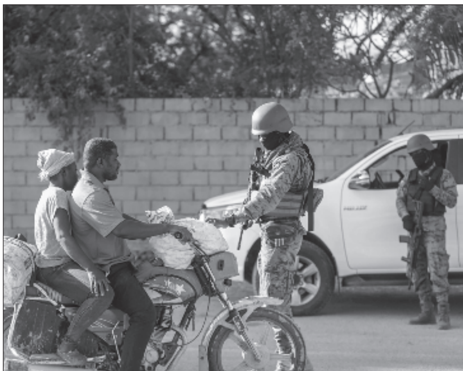
▲ Los grupos criminales que controlan la mayor parte de Puerto Príncipe y las carreteras que conducen al resto del país, han atacado en los últimos días lugares estratégicos.

“La práctica mayoría de los objetivos de Rusia son civiles. Casas e iglesias, infraestructura y escuelas, universidades. Todo esto necesita ser restaurado”, abundó el presidente ucraniano, quien agradeció la voluntad mostrada por Grecia en ayudar en esta reconstrucción.