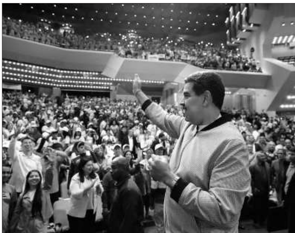
▲ La autoridad electoral, señalada de servir al chavismo, fijó la votación presidencial para el 28 de julio, lo que dificulta un gran despliegue de misiones de observación internacional.

“No tengo ninguna duda que esto va a ser por consenso”, dijo Diosdado Cabello, considerado número dos del chavismo.