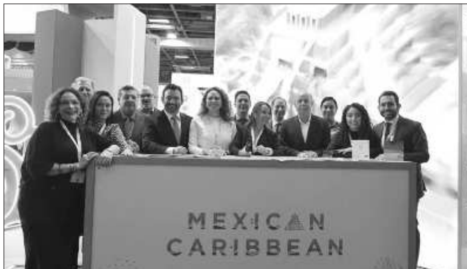
▲ La delegación de Quintana Roo participa en la ITB, que se lleva a cabo del 5 al 7 de marzo y reúne a países, destinos, operadores turísticos, sistemas de reserva, empresas de transporte, hoteles y servicios de renta de autos.

En ese tenor, precisó que a partir del segundo semestre del presente año se tendrán dos vuelos semanales desde Frankfurt hacia el aeropuerto internacional de Tulum y tres frecuencias más hacia el aeropuerto internacional de