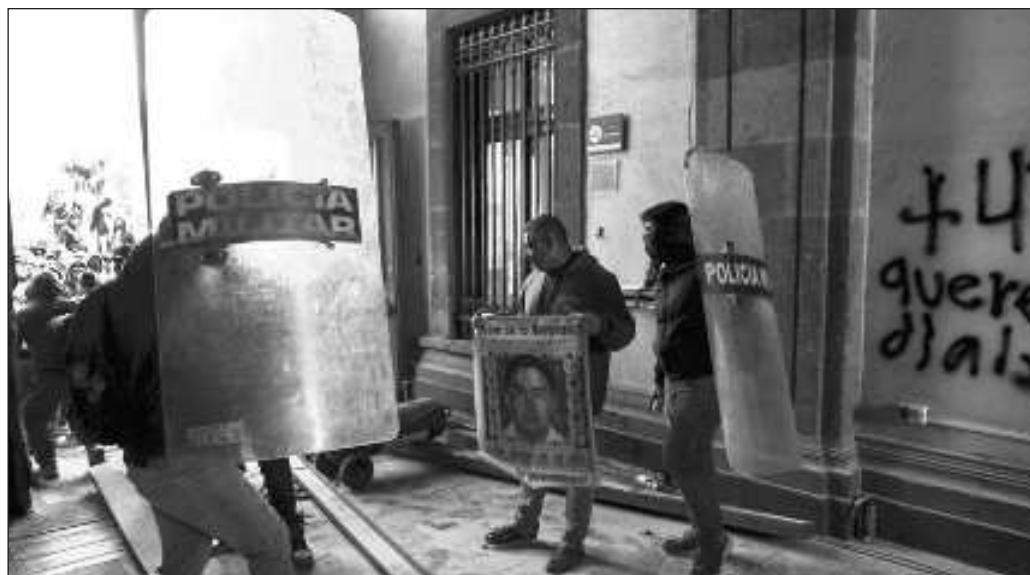
▲ El presidente Andrés Manuel López Obrador manifestó que está dispuesto a reunirse con los padres de familia y estudiantes de Ayotzinapa en 15 días.

Quedan entonces muchos claroscuros antes de llegar a la conclusión tanto del conflicto como de las investigaciones. Pero la clave está en que éstas dejen satisfechas a las víctimas, que son los padres y madres de familia, quienes tampoco han recuperado la totalidad de los restos de sus hijos; la justicia pasa también por saber lo que ocurrió en realidad con cada uno de ellos. En tanto, no habrá explicación que deje satisfecho a nadie y la conclusión se antoja de película, con alguien pronunciando que la neta es chida pero inalcanzable, al menos en este caso.