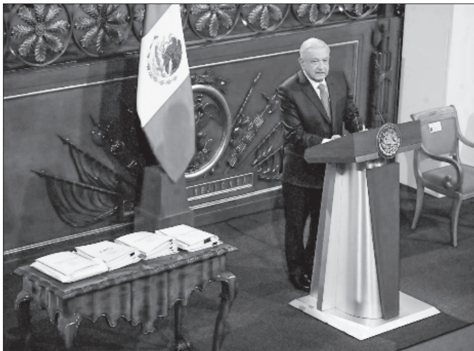
▲ En la mañana, ante la pregunta expresa de por qué hasta ahora envió estas propuestas al Congreso de la Unión a ocho meses del cierre de su mandato, el presidente López Obrador señaló: “Porque hasta ahora se dieron las condiciones y además porque vienen las elecciones y el pueblo va a decidir”.