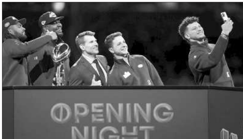
▲ Patrick Mahomes (derecha) toma una foto con Brock Purdy, Scott Hanson, de NFL Network, Chris Jones y Fred Warner, en la noche de apertura del Súper Tazón.

Purdy sonrió y respondió: “Sí. Y lo voy a dejar ahí”.