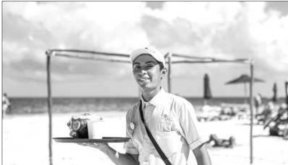
▲ La presidente de Coparmex Cancún dijo que “estamos a favor, pero de manera paulatina, no tengo el dato exacto, pero podrían ser cuatro años, como se proponía con las vacaciones”.

Expuso también que auna empresaria en el área de seguridad relató que estaba pensando en cambiar de giro, porque una modi-