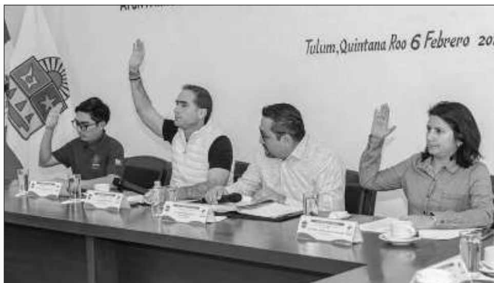
▲ En cuanto a las acciones que serán realizadas con recursos propios, el Cabildo validó invertir 60 millones 60 mil pesos en beneficio de toda la comunidad, a través de obras sociales como la modernización de la avenida Cobá Sur, tercera etapa.

Asimismo, alumbrado público de la avenida La Selva, primera etapa; construcción de pozos de absorción pluvial, en la localidad de Tulum; rehabilitación y ampliación de la casa de salud de Chemuyil; rehabilitación y remodelación de las casas de salud de Manuel