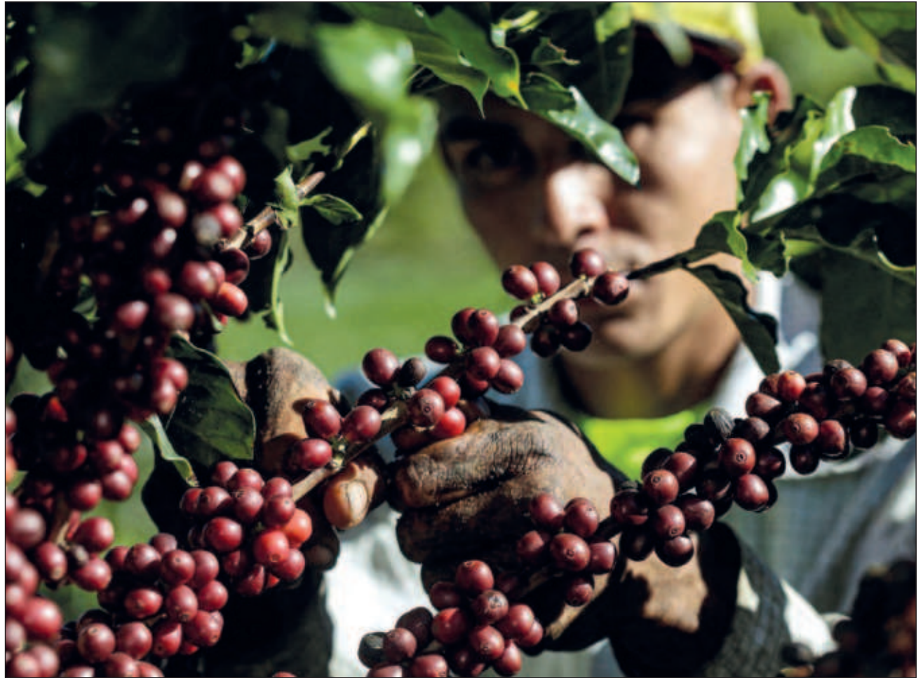
▲ Yaan ba'alo'ob ma' uts u lúubul ti' meyajob ku beeta'al tumen ku k'askúunta'al.

Beey túuno', meyaj ku beeta'al ti'al u túuxta'al konbil káafée ma' póoka'ani', mix xan déeskafeinarta'aki', éem 67.37 por siento tu ts'ook óoxp'eel winalo'ob u ja'abil 2023 tak ka'aj náak 24.9 miyoonesil doolarées, a'alab tumen u kúuchil Data México de la Secretaría de Economía.