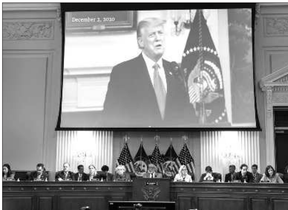
▲ El caso en Washington es uno de los cuatro procesos que afronta Donald Trump.

La decisión marca la segunda vez en otros tantos meses que los jueces han rechazado los argumentos de inmunidad de Trump y han sostenido que puede ser procesado por acciones realizadas mientras estaba en la Casa Blanca y en el período previo al 6 de enero de 2021, cuando una turba de sus partidarios irrumpieron en el Capitolio de Estados Unidos. Pero también sienta las bases para apelaciones adicionales del ex presidente republicano que podrían llegar a la Corte Suprema de Estados Unidos y provocar más demoras.