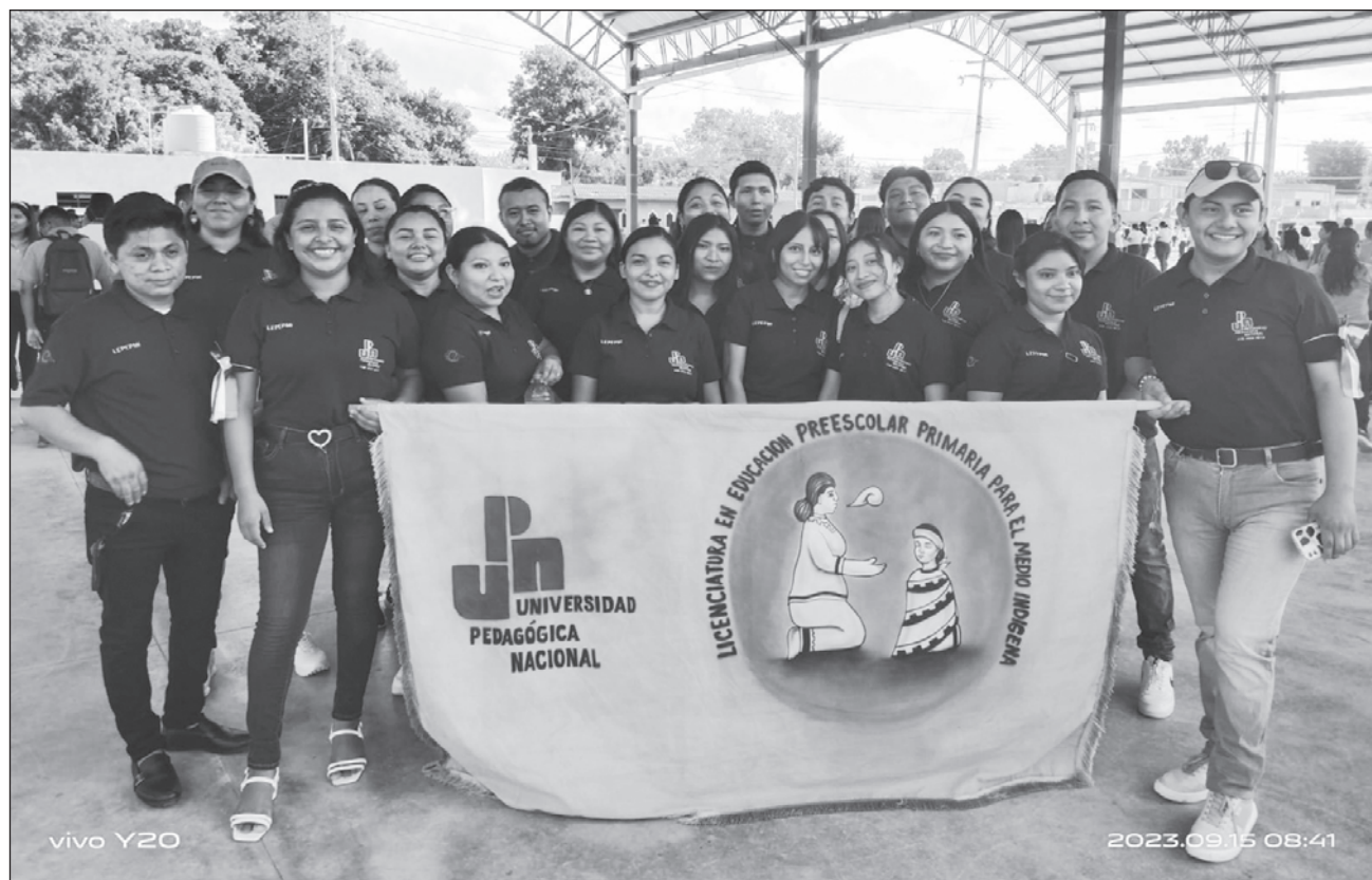
▲ Los estudiantes afectados esperan su título para poder ejercer su profesión.

“Nos dijeron que el 15 de diciembre estaba lista, pero hace unos días le dijeron a la respon-