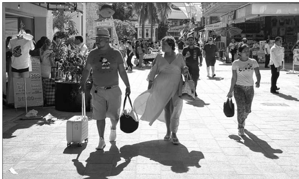
▲ El Caribe Mexicano acapara 62 por ciento del total de los paquetes ofrecidos por Azabache, mayorista de productos turísticos para agencias de viajes.

Azabache, como mayorista de productos turísticos para agencias de viajes, tiene ya 11 años de trayectoria con base en Mérida, Yucatán, y cuenta con presencia en