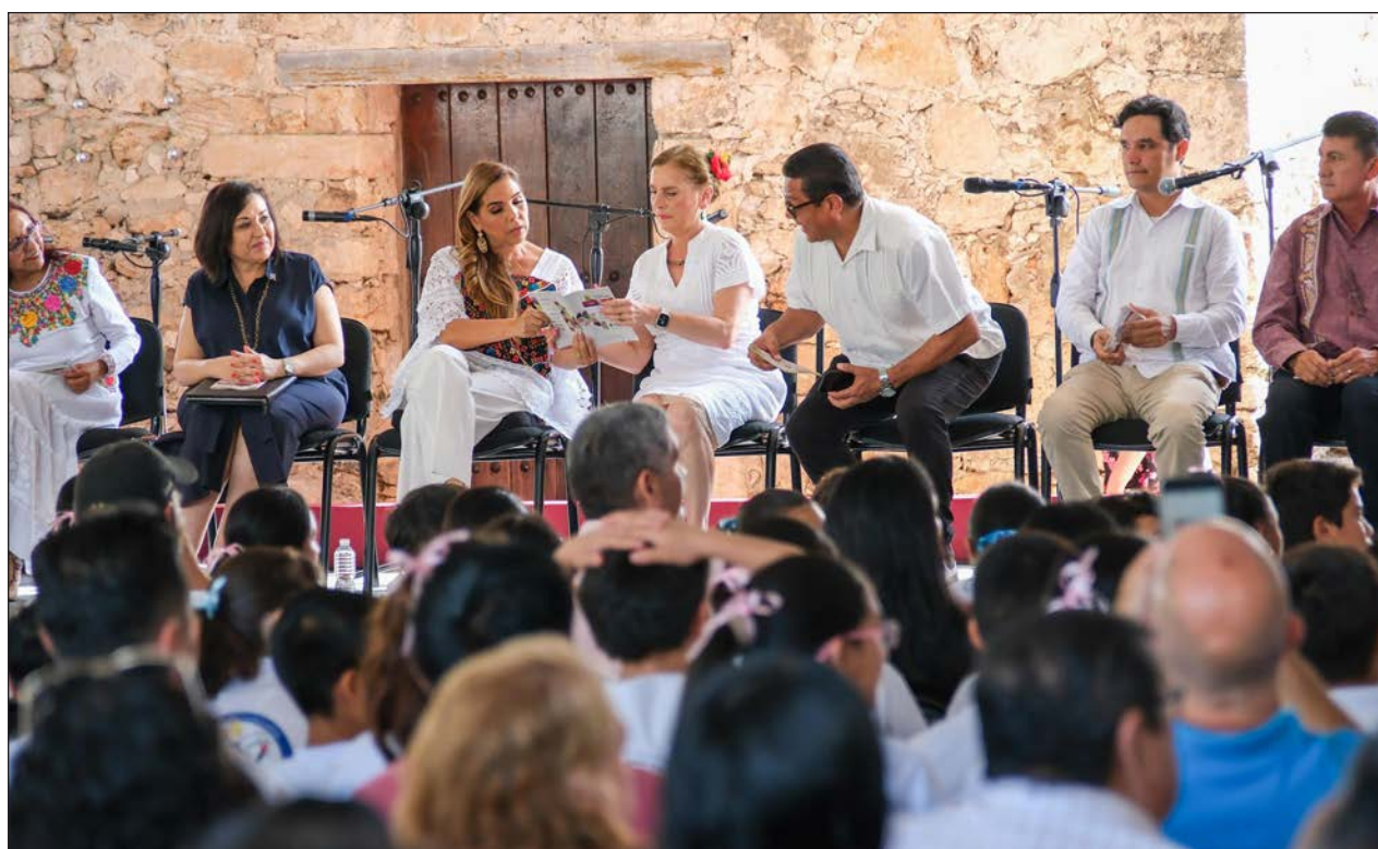
▲ La gobernadora Mara Lezama acompañó a la historiadora y esposa del presidente Andrés Manuel López Obrador en el evento y le agradeció haber llevado a Bacalar este programa de fomento a la lectura.

El evento se llevará a cabo en Tajamar y será gratuito, todo lo que se genere va a ser directamente para las artesanas y artesanos, puesto que la meta es que realmente haya una derrama económica.