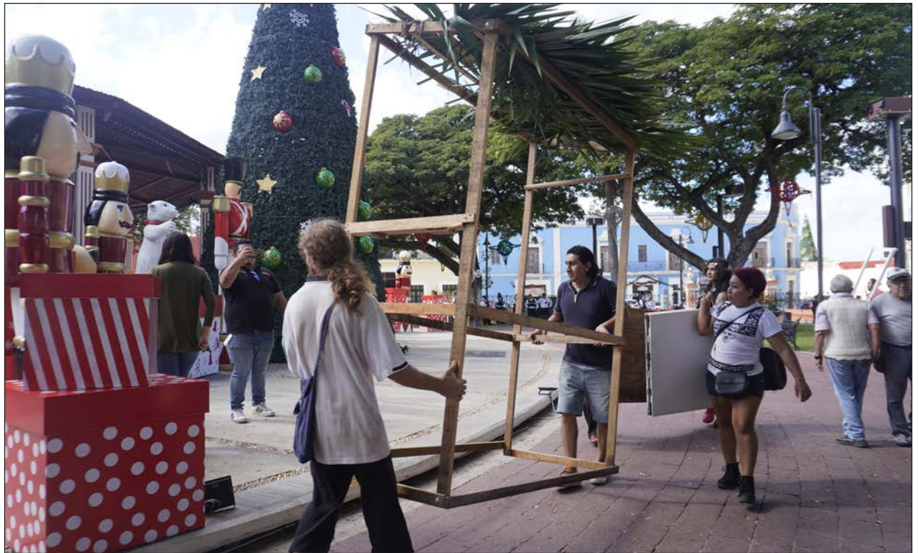
▲ El subsecretario de Asuntos Jurídicos y Derechos Humanos, Arturo Aguilar Ramírez, nuevamente retó a las artesanas a instalarse para ser desalojadas, pues aseguró que ante el Registro Público de la Propiedad el inmueble pertenece a la entidad.

Actualmente, los derechohabientes reciben 4 mil 800 pesos bimestrales, y a partir de enero del próximo año la pensión incrementará 25 por ciento.