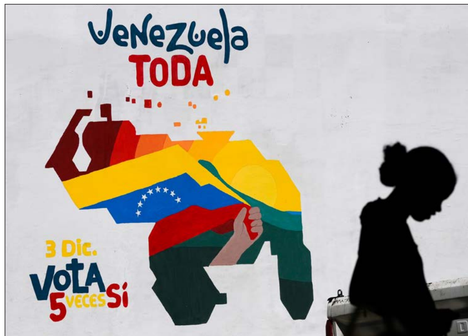
▲ El pasado viernes, la Corte Internacional de Justicia ordenó al gobierno venezolano "abstenerse de cualquier acción que modifique la situación actualmente vigente".

Caracas argumenta que el río Esequibo es la frontera natural, como en 1777 cuando era colonia de España, y apela al acuerdo de Ginebra, firmado en 1966 antes de la independencia de Guyana del Reino Unido, que sentaba las bases para una solución negociada y