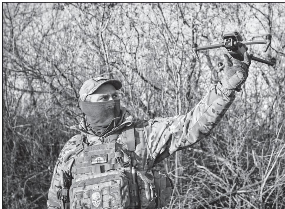
▲ El Kremlin afirmó que drones ucranianos habían atacado dos bases aéreas en territorio ruso, por lo que lanzaron 70 misiles como represalia, causando la muerte de varios civiles.

El lunes, Putin trató de demostrar que su país podía recuperarse de esa afrenta