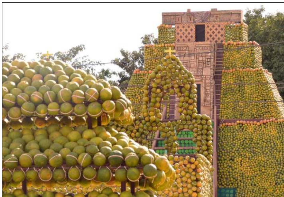
▲ En la Feria de la Naranja, los expositores también presentarán productos elaborados con el cítrico, y se llevarán a cabo actividades como shows infantiles y de comedia.

El alcalde resaltó que llevan 36 años celebrando esta feria y solamente estuvo interrumpida debido a la pandemia, pero ahora el esfuerzo continúa para