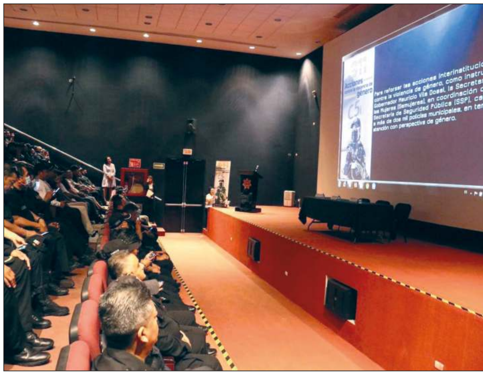
▲ El taller sobre perspectiva de género ante situaciones de violencia, impartido por la SSP y Semujeres, busca reforzar las acciones interinstitucionales.

“Trabajando de la mano, seguimos avanzando en la construcción de un estado más seguro e igualitario para las mujeres; gracias por sumar esfuerzos con nosotras, estamos seguras que brindarán una atención más efectiva y sin revictimizar”, detalló.