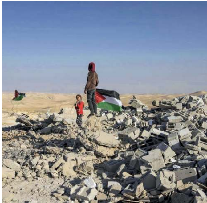
▲ Con o sin Trump, el gobierno de EU ha sido corresponsable de despojos, limpiezas étnicas, violaciones a los derechos humanos, y los tratos racistas que han venido sufriendo los territorios palestinos desde la proclamación del Estado hebreo, en 1948.

Cabe recordar que el conflicto jerosolimitano se remonta a 1967, cuando las fuerzas israelíes pasaron por encima de la línea verde – que delimitaba las posiciones de árabes e israelíes tras el armisticio de 1949–, capturaron la porción oriental de la ciudad, a la que los palestinos llaman Al Quds y a la que reivindican como capital