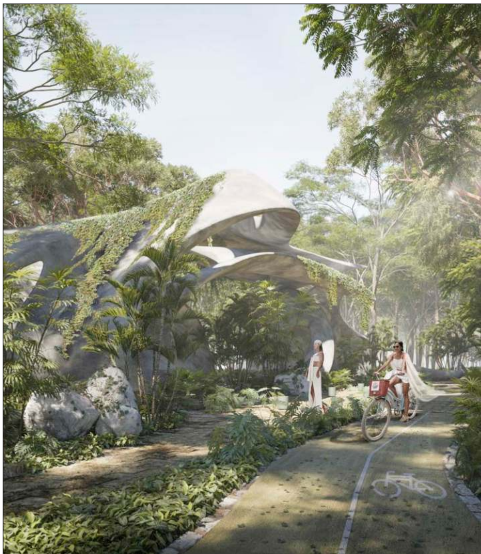
▲ El complejo Tulum 101, que se edifica a la altura del kilómetro 4, contará con gimnasios, albercas, espacio para yoga y elevadores, entre otras amenidades.

“El confinamiento causado por la pandemia de Covid-19 llevó a la humanidad a reevaluar el verdadero valor de estar en contacto con la naturaleza, de ahí que la fase 2 de este proyecto sea el partea-guas que rompe con los cánones establecidos de una zona residencial convencional, al incorporar la zona virgen de Tulum, en el Caribe Mexicano, a un plan maestro sustentable”, dijo la entrevistada.