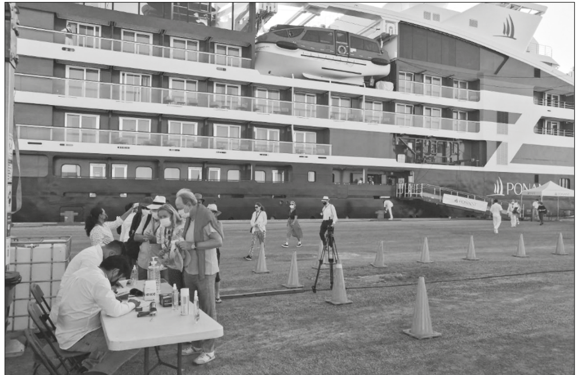
▲ Como consumidores, proveedores o trabajadores, debemos ayudar a mejorar las condiciones para quienes laboran y dependen del sector turístico, y no solo enfocarnos al disfrute.

EL PANORAMA EN Yucatán no es distante al nacional o al global. En septiembre de este año (2021) se observó la llegada de 96,683 turistas con pernocta al estado, una cifra superior a la de septiembre del año pasado (2020) cuando solo se registró la llegada de 50,095 visitantes como consecuencia de las rigurosas medidas de confinamiento. Otro ejemplo es la situación de los puertos del estado, la actividad turística en cruceros se vio afectada, cuando en septiembre de 2020 no se registró arribo