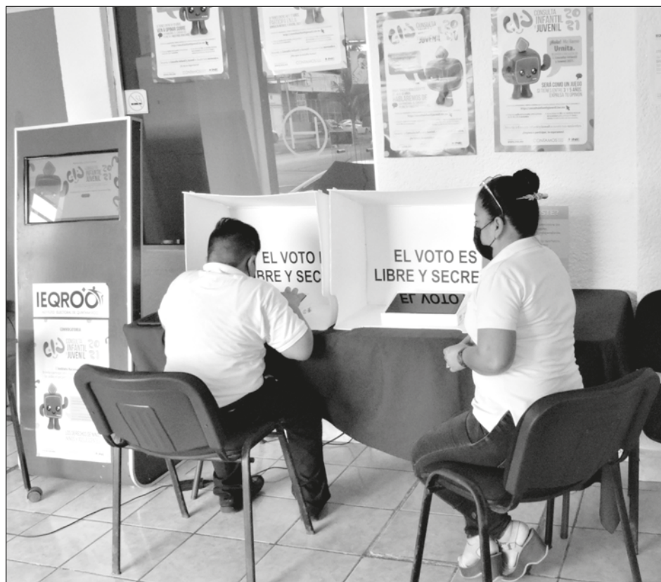
▲ Quienes cumplan con todos los requisitos obtendrán el derecho de obtener su registro a más tardar el 8 de diciembre del año en curso.