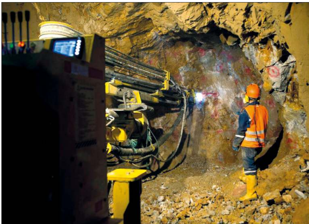
▲ El crecimiento ininterrumpido en la cantidad de agua concesionada a la minería resulta más chocante cuando se considera que la mayor parte de ella se extrae en entidades cuyos territorios son mayormente desérticos.

Lo dicho no debe interpretarse como un llamado a clausurar un sector fundamental para la economía del país y proveedor de insumos clave a escala global, pero sí a revisar sus prácticas para asegurar que se desarrollen de acuerdo con los mejores estándares, a fin de minimizar su impacto ambiental, sanitario y social. La necesidad de supervisar y regular estrechamente a esta industria cobra una importancia todavía mayor si se atiende el hecho de que, de enero a septiembre de este año, la inversión extranjera directa en minería no petrolera tuvo un repunte de 250 por ciento en comparación con el mismo periodo de 2020, por lo que cabe esperar un aumento semejante en sus actividades.