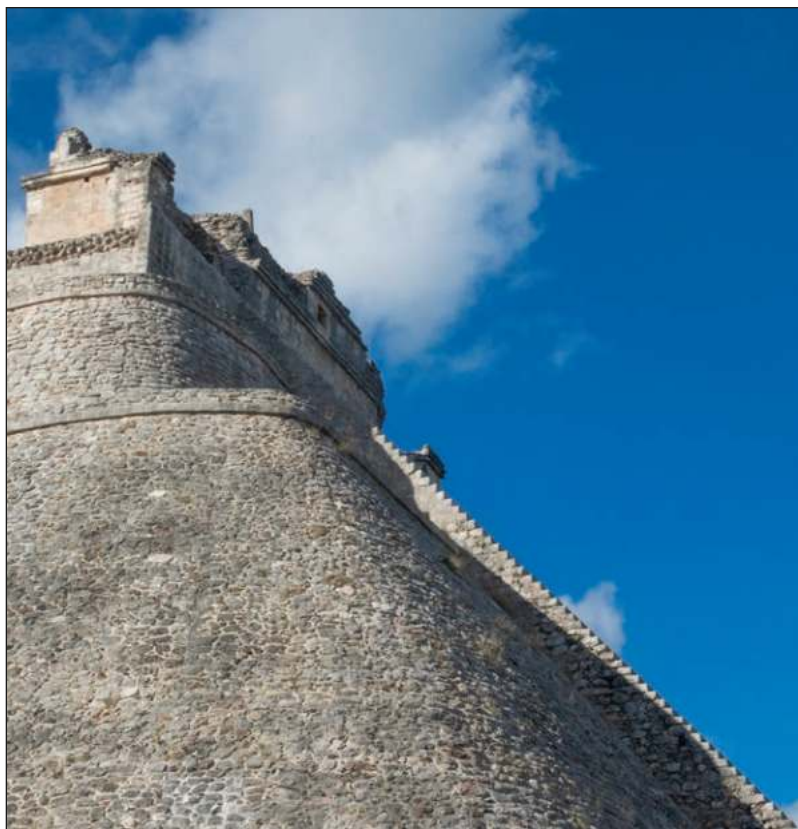
El trabajo en piedra, que sostiene el valor universal de la urbe.