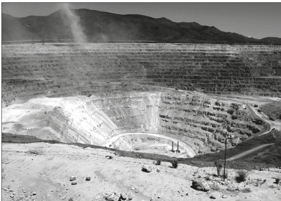
▲ Entre señalamientos de que la industria minera en México ha perdido competitividad, la inversión extranjera directa se disparó 250%.

Sobre la propuesta de reforma a los artículos 25, 27 y 28 Constitucional, que busca fortalecer a la CFE, para devolver la operación del mercado eléctrico al Estado, comentó que es preciso definir la planeación como eje rector.