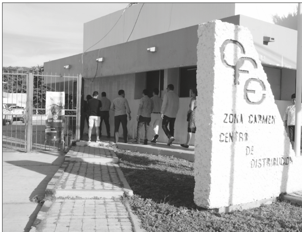
▲ Aunque el aporte del gobierno estatal sería menos que en la primera ocasión, el actual gobierno justificó que no hay los recursos suficientes.

El acuerdo firmado señalaba que de marzo a octubre, los municipios como Calkiní,