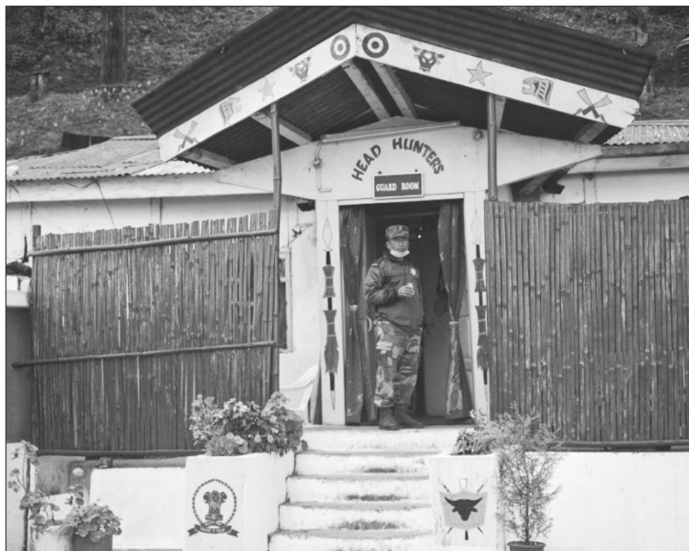
▲ Un oficial del Ejército señaló que los soldados abrieron fuego contra un vehículo después de recibir información sobre un movimiento de rebeldes en la zona.

Un oficial del Ejército señaló que los soldados abrieron fuego contra un vehículo después de recibir información sobre un movimiento de rebeldes en la zona, y mata-