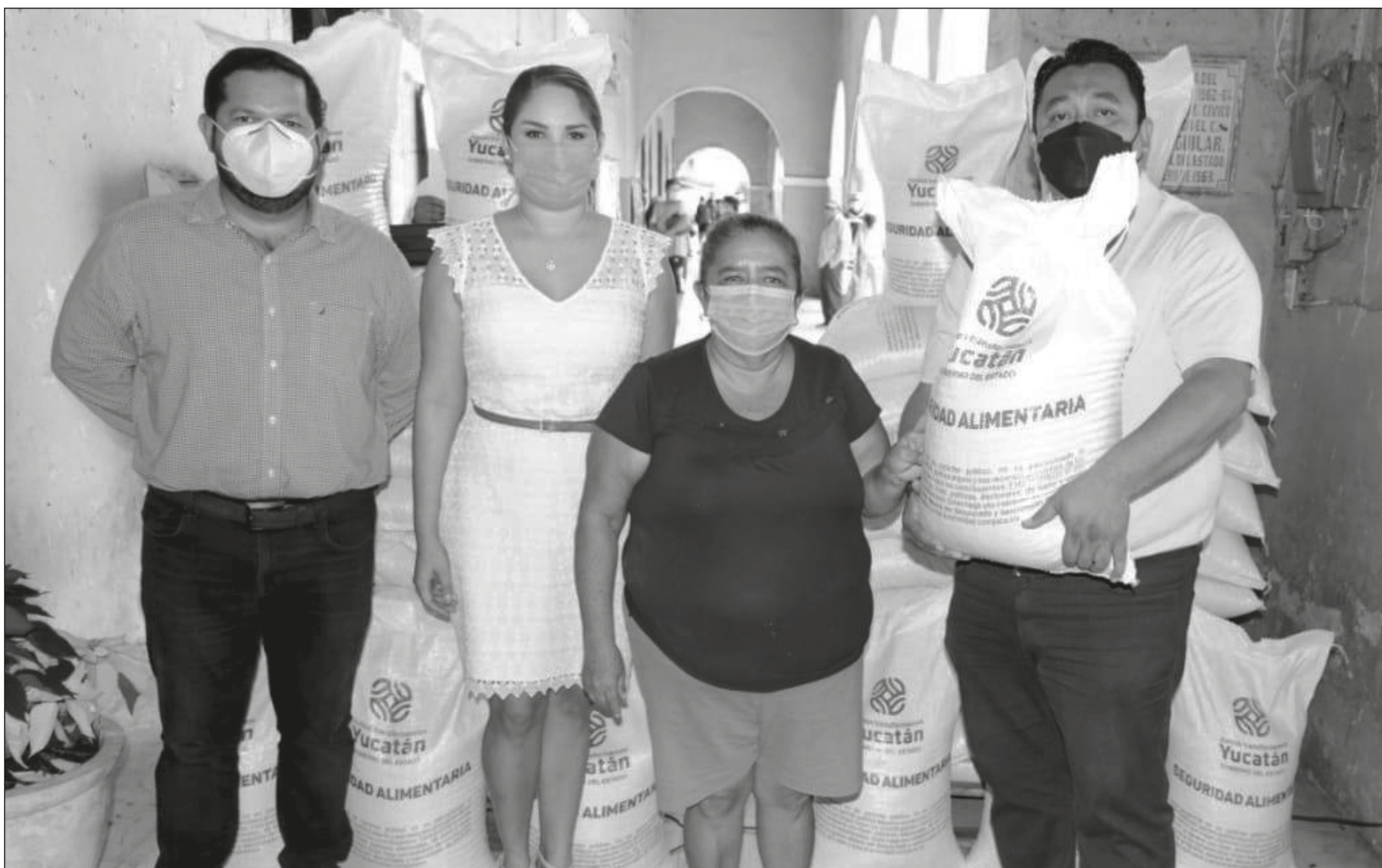
▲ A la fecha, los apoyos del programa Seguridad Alimentaria han llegado a casi 100 municipios afectados por fenómenos naturales.

"Soy ama de casa, por eso, sé que este programa está muy bien, porque es una gran ayuda para nosotros; además, me gusta tortear y, ahorita que todo ya está más caro, mejor yo las hago y, con eso, nos ahorramos el dinerito", platicó.