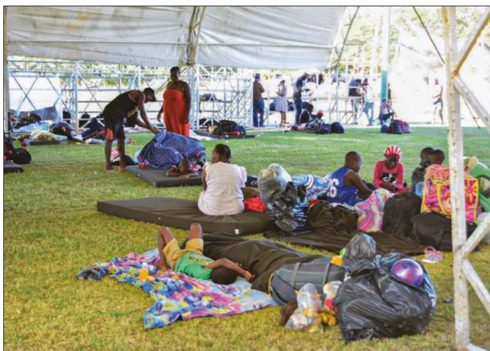
▲ Las oficinas de migración en el perímetro del Palacio Federal lucen con gente llenando formularios y contestando entrevistas.

Los documentos que regularizan les permite estar un año sin la necesidad de pedir naturalización o que sean tomados como un grupo vulnerable después de un año, pasando ese período, y si no arreglan sus papeles de manera definitiva, el INM procederá a la deportación de origen a quienes sigan en territorio campechano, por ello los exhortan a decidir cuál será su plan a futuro.