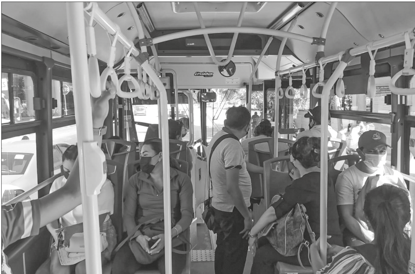
▲ Ahora, en este recién estrenado Va y Ven, ¿qué mensaje nos dejó el joven con un graffiti?