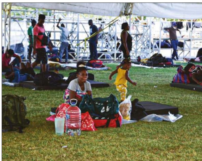
▲ Los primeros migrantes traídos a Campeche, canalizados desde Chiapas, ahora señalan que se sienten en el olvido, pues les prometieron ayuda humanitaria y hasta el momento no reciben más que agua y comida.