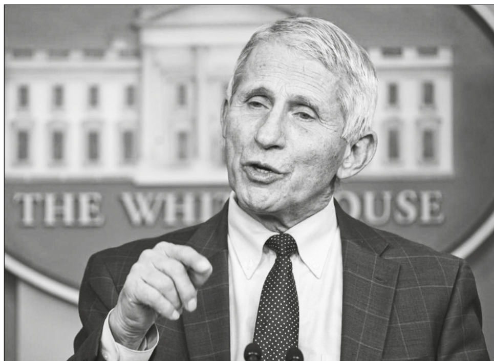
▲ El gobierno de Biden está sopesando retirar las restricciones de viaje a los extranjeros que desean entrar a Estados Unidos procedentes de varios países africanos.

"Hasta ahora, no parece que tenga un grado de severidad muy grande", señaló Fauci. "Pero tenemos que ser realmente cuidadosos antes de hacer cualquier determinación de que es menos grave, o de que realmente no pro-