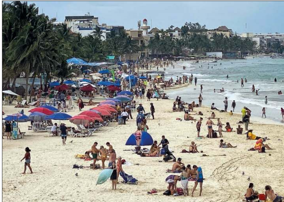
▲ El gobernador indicó que el balance de la presencia del Batallón Turístico es positivo y que hasta los visitantes se toman fotografías con los elementos.

En entrevista en el marco del banderazo del Plan de Seguridad Vacacional 2021, en el que dio a conocer tres puntos fundamentales para esta temporada, que tienen que ver con la seguridad a visitantes y turistas, agilidad de tránsito y garantizar precios justos y de calidad, dijo que se prevén niveles de ocupación superiores al 90-95 por ciento e incluso "llenos totales", previendo la llegada hasta un millón 300 mil turistas hasta el 2 de enero de 2022.