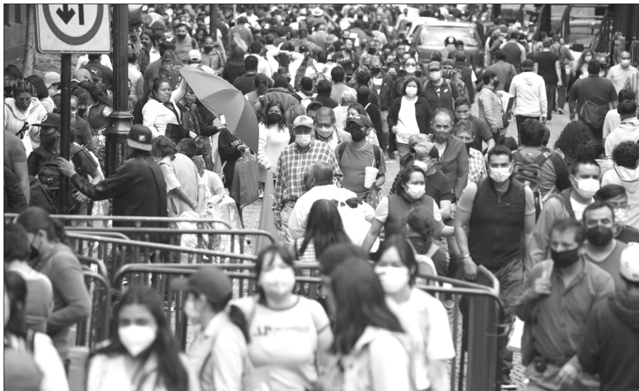
▲ Aún faltan 1.9 millones de empleos para alcanzar los niveles prepandemia.

Una mujer de 27 años y dos de 42, así como tres hombres de 45, 36 y 51 años de edad, con probables fracturas. Además un hombre de 34 y una mujer de 45 resultaron con contusión y policontundida. Todos fueron trasladados a un hospital para su atención médica especializada.