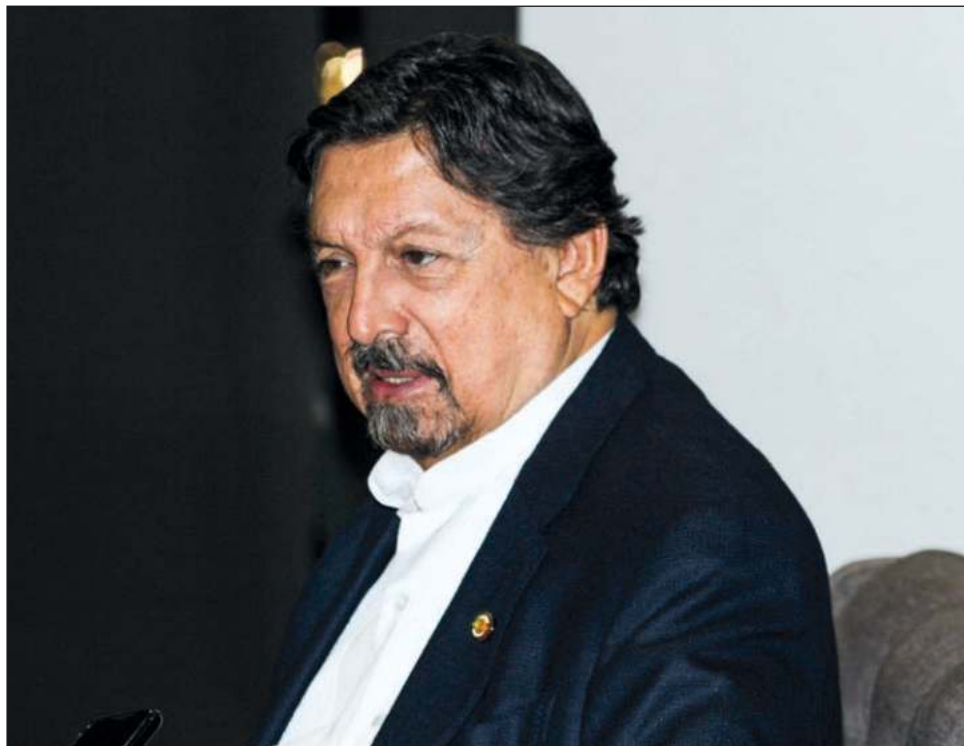
▲ El senador morenista, Napoleón Gómez, llamó a aplicar medidas más estrictas en contra de quienes atenten contra la clase trabajadora y el medio ambiente.

El senador anunció que está revisando y preparando un proyecto de ley, para lograr un consenso y el apoyo de los demás senadores, aunque está consciente de