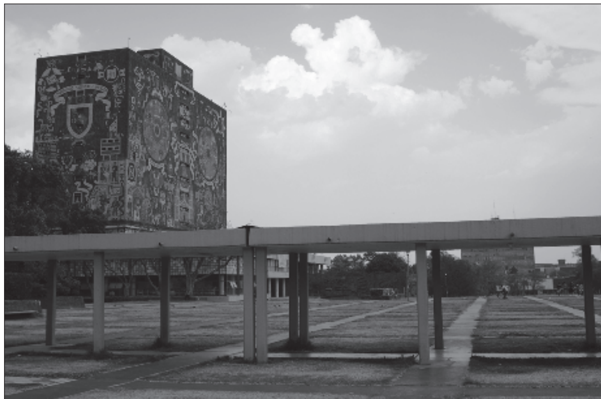
▲ "Hablar del no acceso a la Universidad podría llevarnos hojas y hojas de escritura. En 1959 Charles Wrigth Mills escribió una de sus obras cumbres La imaginación sociológica , en ella el sociólogo invita a conciliar los problemas individuales con los problemas que enfrenta la sociedad".

2) Una fuerte tradición centralista; los esfuerzos de la UNAM por expandir su oferta académica a lo largo y ancho del país mediante un elaborado ejercicio de