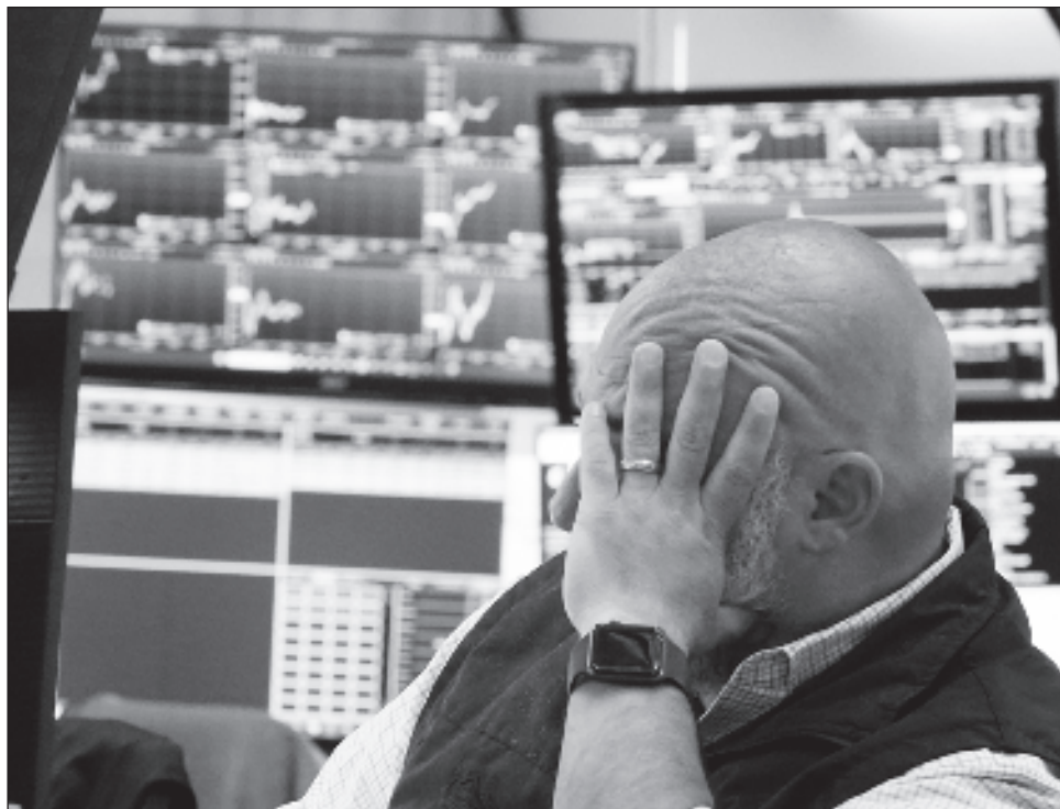
▲ El dólar se cayó frente a la canasta de las seis principales monedas internacionales, al depreciarse, según su índice ponderado DXY, 0.45 por ciento, para cerrar en 102.525 unidades.

Pese a la caída del dólar a nivel mundial, el peso en México recibe con pesimismo no sólo la expectativa de una recesión económica en Estados Unidos, también un acelerado descenso de las tasas de interés por parte de la Reserva Federal y una encrucijada del Banco de México en su actuar monetario, que aunque el diferencial de tasas siguiera atractivo, la economía mexicana se vería en problemas con una recesión de su principal socio comercial.