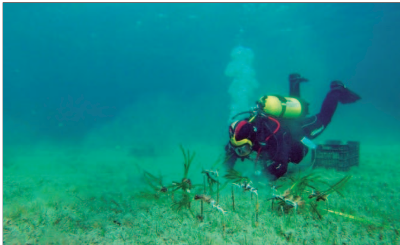
▲ La pesca, el turismo y la contaminación de los océanos son factores que afectan estos sitios, cuyas probabilidades de ser restaurados son escasas, costosas y tienen pocas probabilidades de éxito.

La superficie mundial de praderas marinas es muy incierta. Los científicos consul-