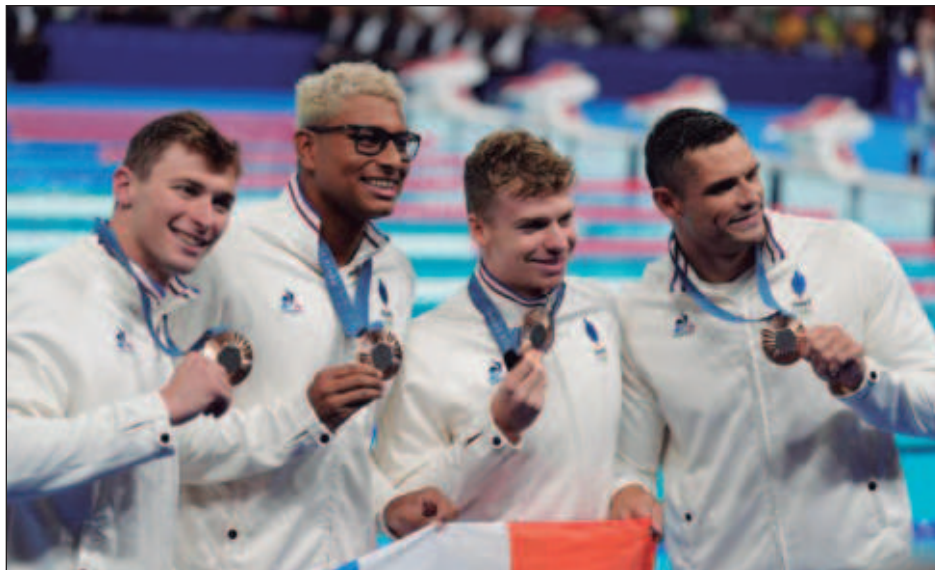
▲ León Marchand (segundo de derecha a izquierda) se colgó su quinta medalla de los Juegos, de bronce, en el relevo 4x100 de estilos combinados.

Es la sexta deportista olímpica en llegar a semejante cifra de metales de oro, con lo que se unió al nadador