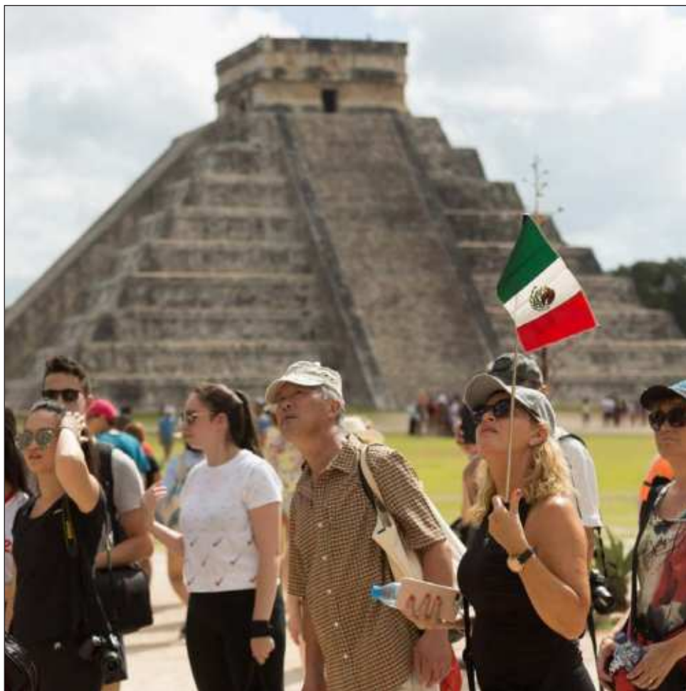
▲ El año pasado Chichén Itzá registró la llegada de 2 millones 332 mil 445 de turistas, un ritmo de 710 personas por hora; en segundo lugar quedó Teotihuacán.

El año pasado Chichén Itzá registró la llegada de 2 millones 332 mil 445 de turistas, un ritmo de 710 personas por hora; en segundo lugar quedó Teotihuacán con un millón 788 mil 984 y Tulum en tercer lugar con un millón 300 mil 964, de acuerdo con las estadísticas del INAH y la base de datos Datatur de la Secretaría de Turismo federal.