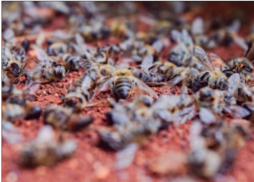
▲ En cuatro de siete muestras de abejas se encontró fipronil, clorpirifos y metabolitos de fipronil, en las otras muestras una combinación con endosulfan, prohibido en México.

En cuatro de las siete muestras tomadas de las abejas intoxicadas se en-