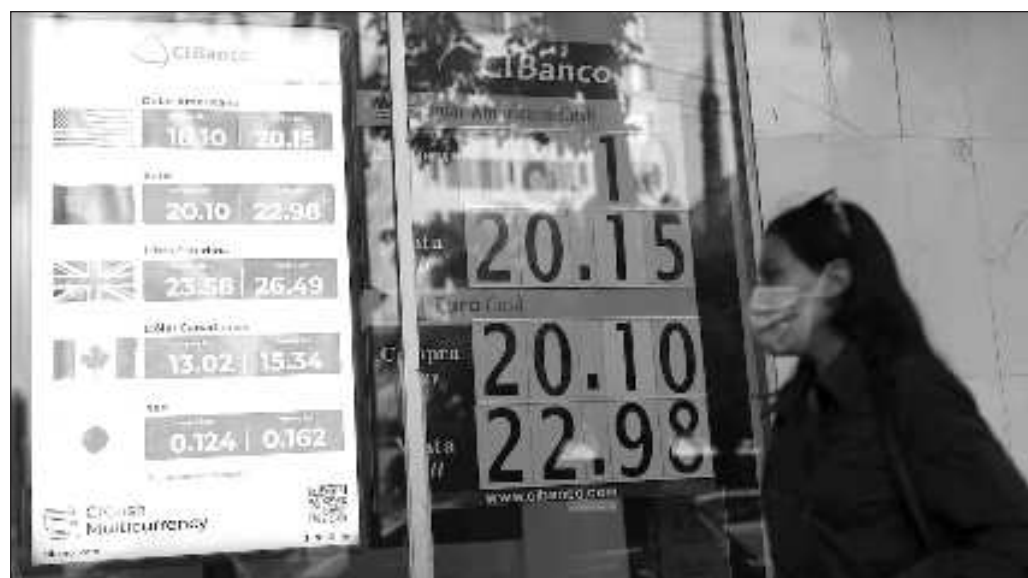
▲ El escenario mexicano, a diferencia de otras ocasiones, se encuentra mejor preparado para el manejo de una potencial crisis económica proveniente del exterior.

La caída de las bolsas se dio en un fin de semana, por lo que también resulta prematuro calificar de crisis el escenario actual. Mientras, la mejor preparación que se pudiera tener como país es mantener la economía sana y con un nivel de deuda manejable; algo que no se tuvo en el pasado.