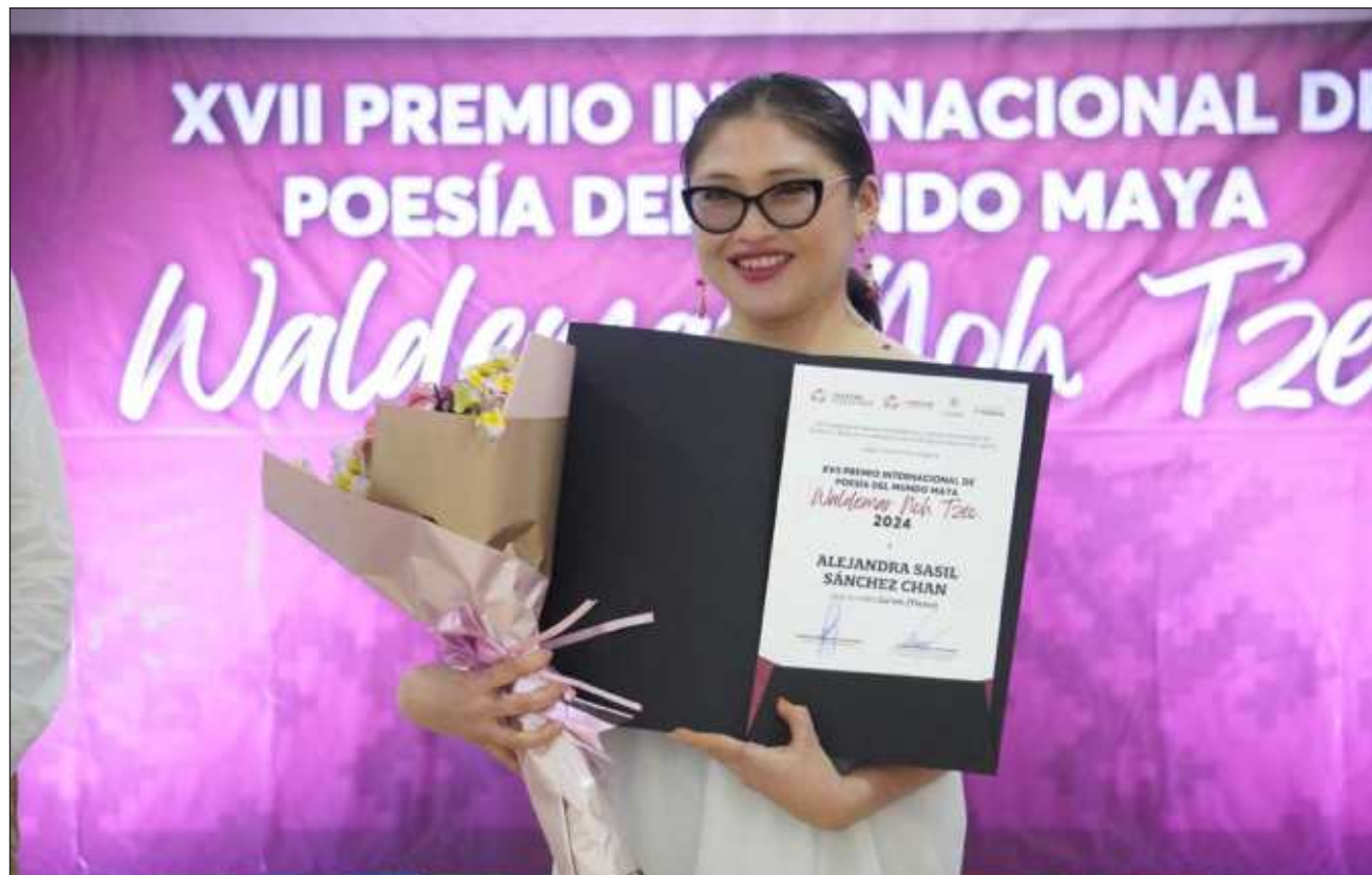
▲ La editora de K'iintsil, la sección en maya de La Jornada Maya, consideró que el sistema educativo debe “ser más empático con las regiones donde no tienen la oportunidad de aprender otro idioma previo a su lengua madre”.

Destacó que en Campeche se ha dado un gran paso, y es más un mensaje de fortaleza y entereza, que “la gobernadora de Campeche, Layda Sansores, ha iniciado una revolución al iniciar sus programas de los Martes (del Jaguar) con clases básicas en maya, que en sus discursos incluya al dialecto para dirigirse a los presentes, eso es un