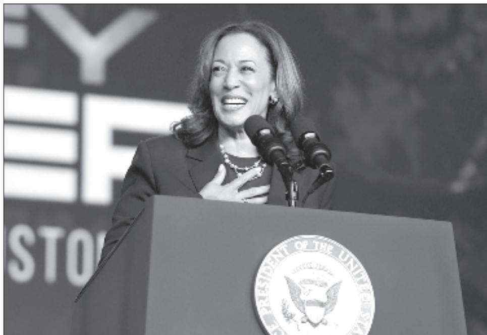
▲ La nominación de Harris se hizo oficial después de que el lunes por la noche concluyó una ronda de cinco días de votaciones por internet de los delegados de la Convención Nacional Demócrata.

Más de cuatro años después de que fracasara su primer intento de llegar a la presidencia, la coronación de Harris como abanderada de su partido pone fin a un periodo tumultuoso y frenético para los demócratas, provocado por la desastrosa actuación del presidente Joe Biden en el debate presidencial de junio, que acabó con la confianza de sus propios partidarios en sus posibilidades de reelección y desató una ex-