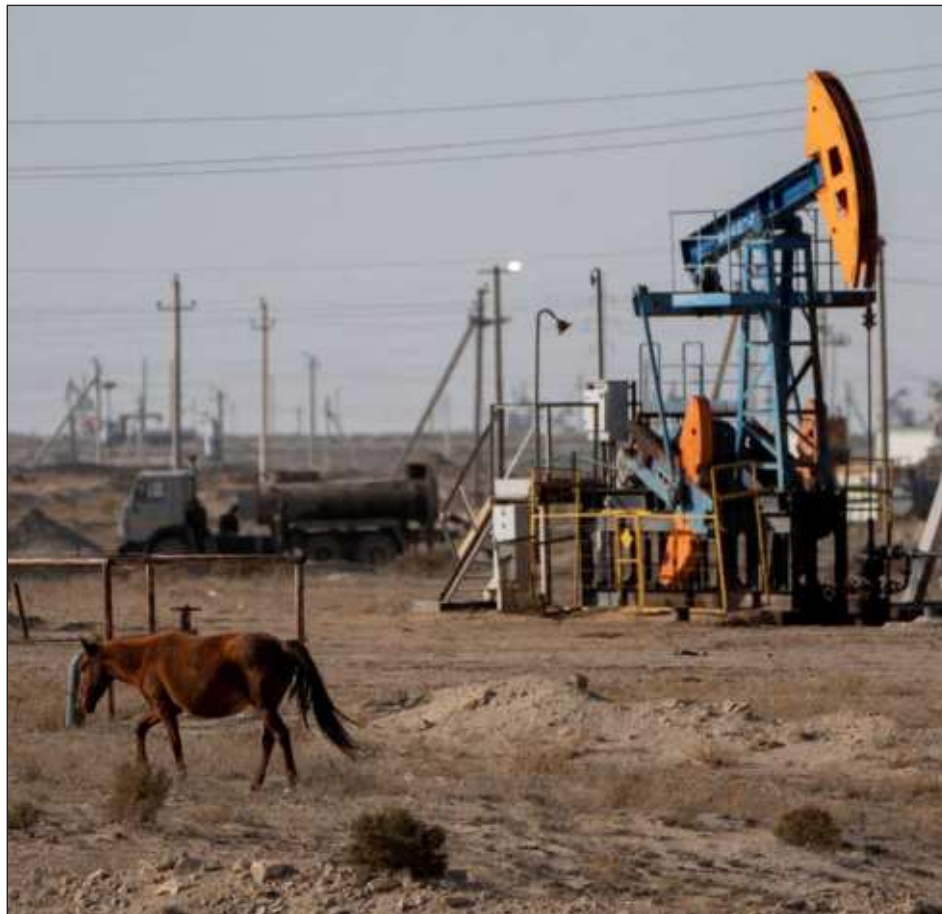
▲ La empresa es controlada por el yerno del ex dirigente Nursultán Nazarbayev, en el poder tres décadas y del que allegados están colocados en puestos importantes.

Esta empresa está controlada por el yerno del ex dirigente Nursultán Nazarbayev, en el poder durante tres décadas hasta 2019 y del que muchos allegados se encuentran colocados en puestos importantes bajo el presidente actual, Kasym-Jomart Tokáyev.