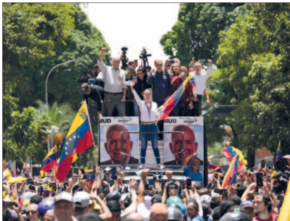
▲ El fiscal general, Tarek Saab, señaló que el proceso se inició debido a la "abierta incitación" a la desobediencia de las leyes por parte de los líderes opositores.

El ministerio público, afin al gobierno, informó de la decisión luego de que Machado y González Urrutia,