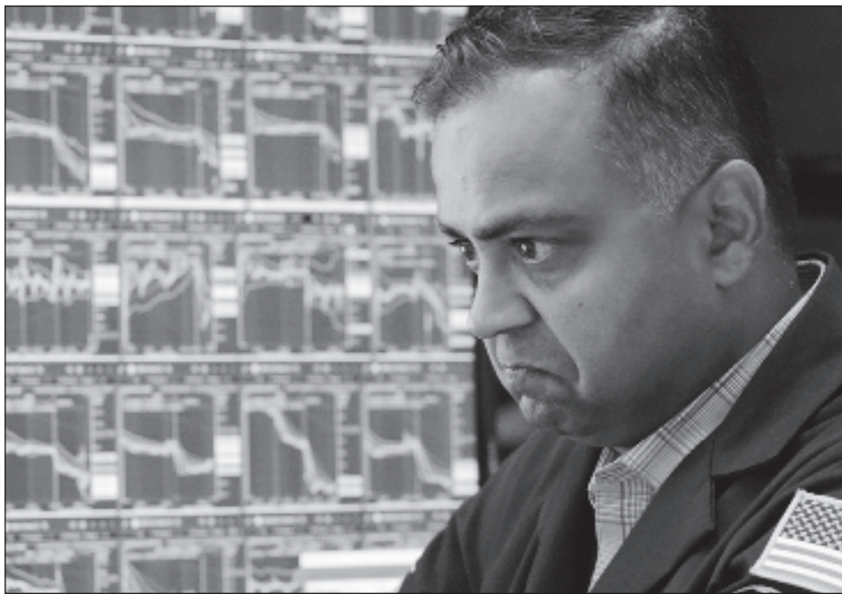
▲ Sheinbaum llamó a no ceder ante especulaciones de que EU pueda entrar en recesión.

“Todavía no nos adelantemos, vamos a esperar el impacto de lo que ocurrió ahora. Vienen también las elecciones en Estados Unidos en noviembre, entonces no podemos plantear, ya que hay ya una recesión o que viene una recesión. Nosotros estamos preparados y nos es-