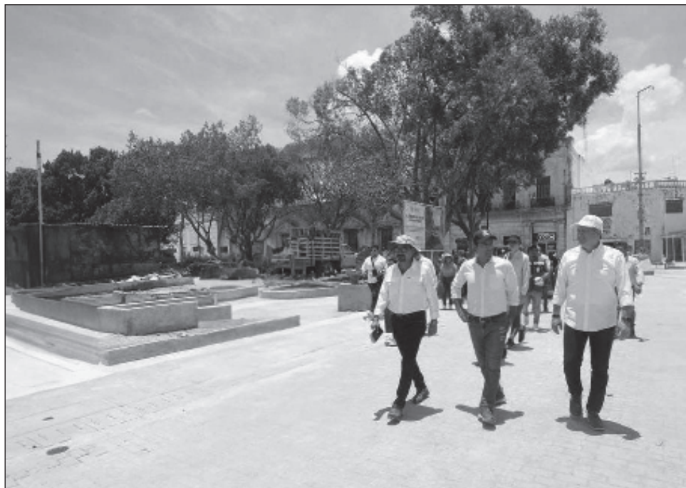
▲ Los trabajos de arborización contemplan la siembra de 102 nuevos árboles en la zona, además de la creación de más áreas con vegetación.

En presencia de la secretaria de Desarrollo Sustentable