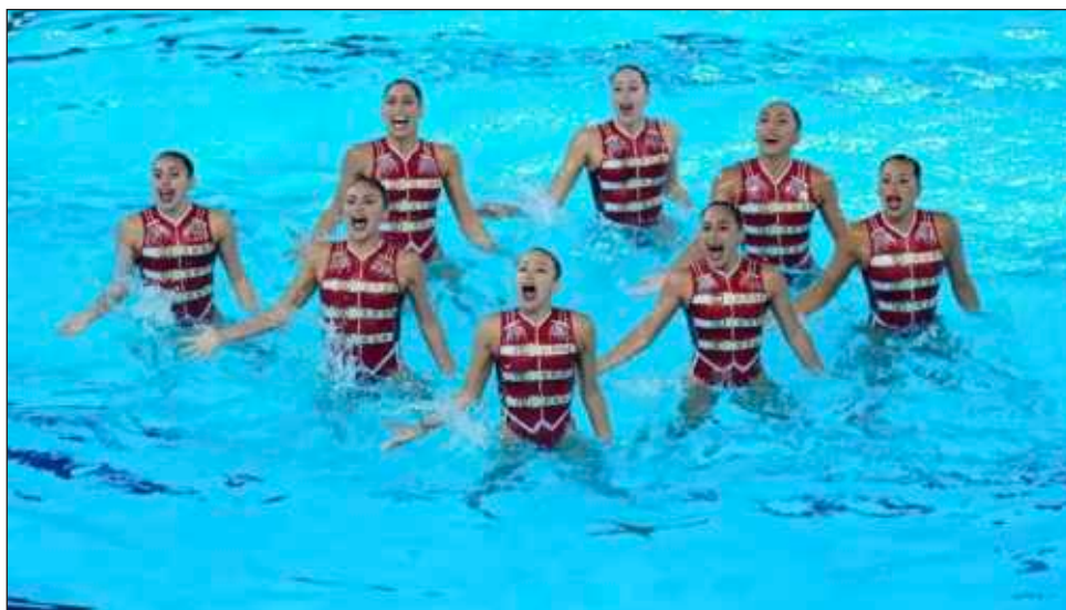
▲ El equipo tricolor compite en la rutina técnica de natación artística, en Saint-Denis.

La rutina técnica fue dominada por China (313.5538), España (287.14.75) e Italia (277.83.04).