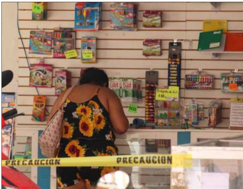
▲ La Profeco hizo un llamado a los consumidores a que antes de realizar sus compras, comparen los precios y la calidad de los productos que requieren.

La Profeco hizo un llamado a los consumidores que antes de realizar sus compras, comparen los precios y la calidad de los productos que se necesitan para la educación de sus hijos.