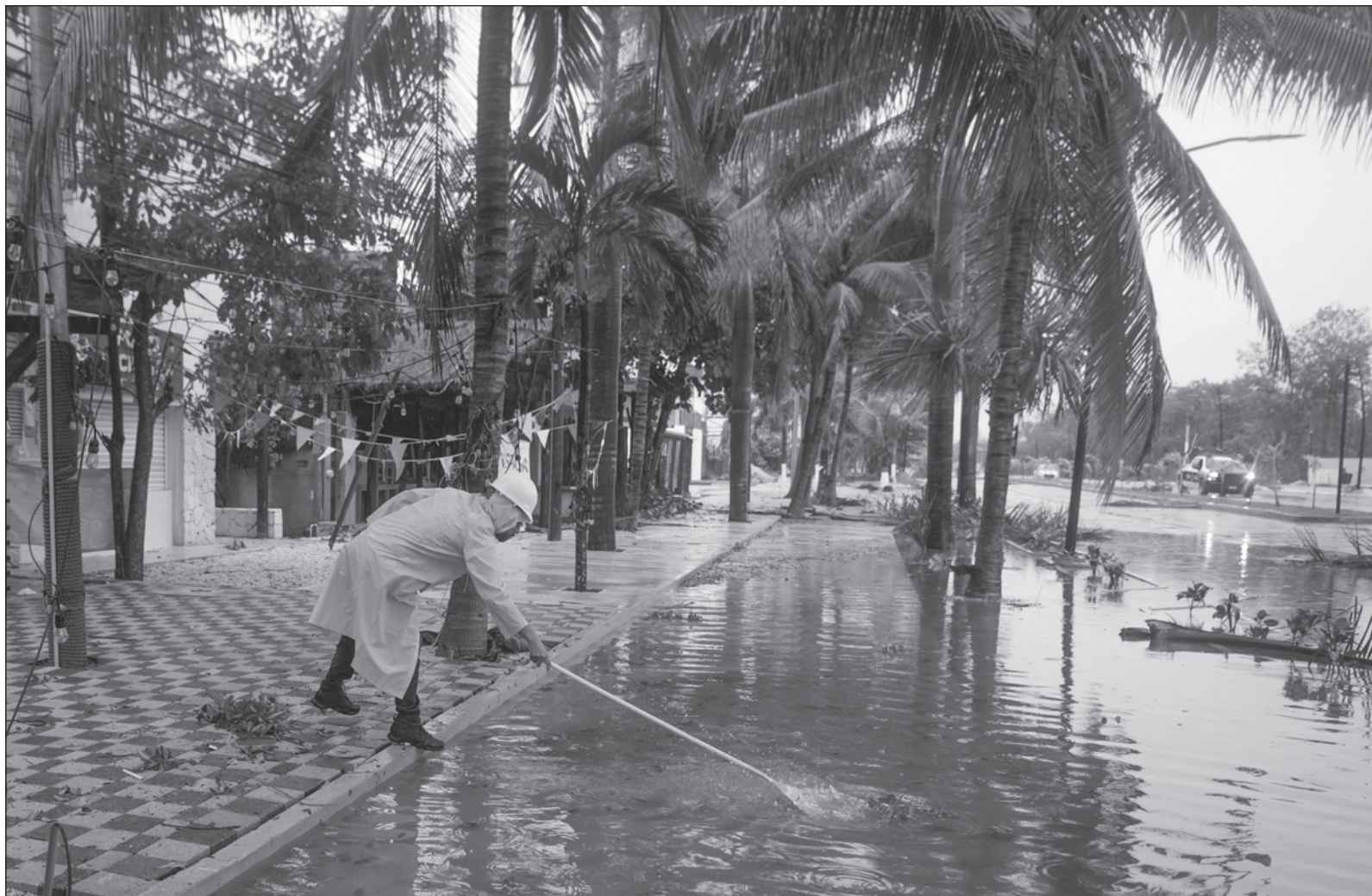
▲ "Esta pausa debe ser aprovechada para prepararnos. Limpiar drenajes pluviales, hacer obras que canalicen el desagüe desde los puntos de mayor inundación, educación ambiental, capacitación a servidores públicos y Protección Civil, preparación de albergues, planes de contingencia, combate a plagas y enfermedades que vienen con las lluvias".