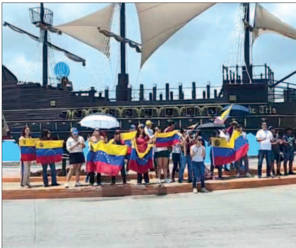
▲ Los manifestantes señalaron que el actual mandatario venezolano se ha negado a reconocer el triunfo electoral de Edmundo González el pasado 28 de julio.

Asimismo, expresaron que continuará manifestándose pacíficamente para sumarse a las protestas a nivel mundial contra la dictadura madurista.