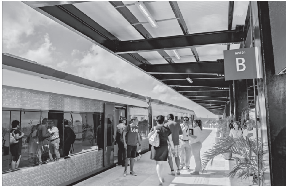
▲ El tramo 4, que cruza nueve municipios de los estados de Yucatán y Quintana Roo, ha transportado a 89 mil 158 pasajeros el 16 de diciembre de 2023 y el 29 de julio de 2024.

En lo que respecta a la operatividad de este tramo, que consta de 239 kilómetros de vía doble electrificada y cruza nueve municipios