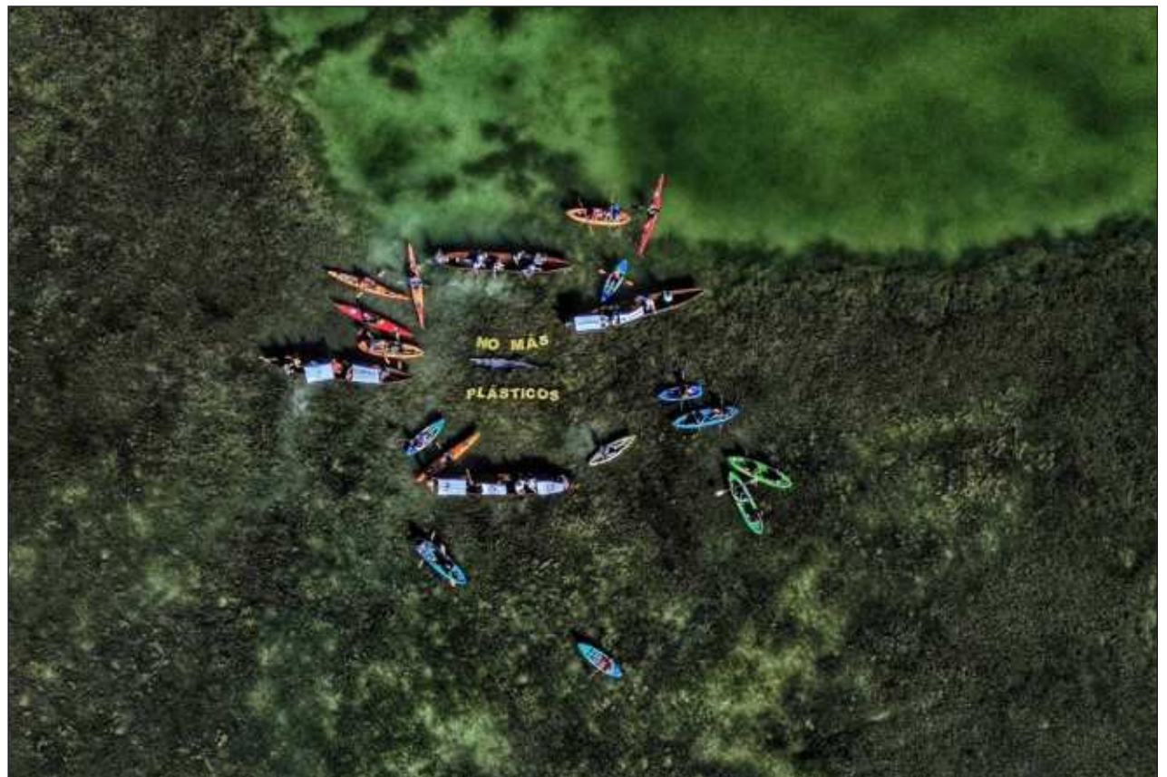
▲ Una iniciativa ciudadana impulsada por Greenpeace México busca que el Congreso reforme la Ley General de Residuos con la prohibición de los plásticos de un solo uso y asigne responsabilidades a las empresas contaminantes.

En la actividad se realizó una limpieza de residuos y una auditoría de marca como ejercicio de ciencia ciudadana, para coleccionar datos sobre cuáles son las empresas cuyos residuos contaminan más los ecosistemas, así como cuáles son los residuos con mayor presencia. La información resultante se dará a conocer en las próximas semanas.