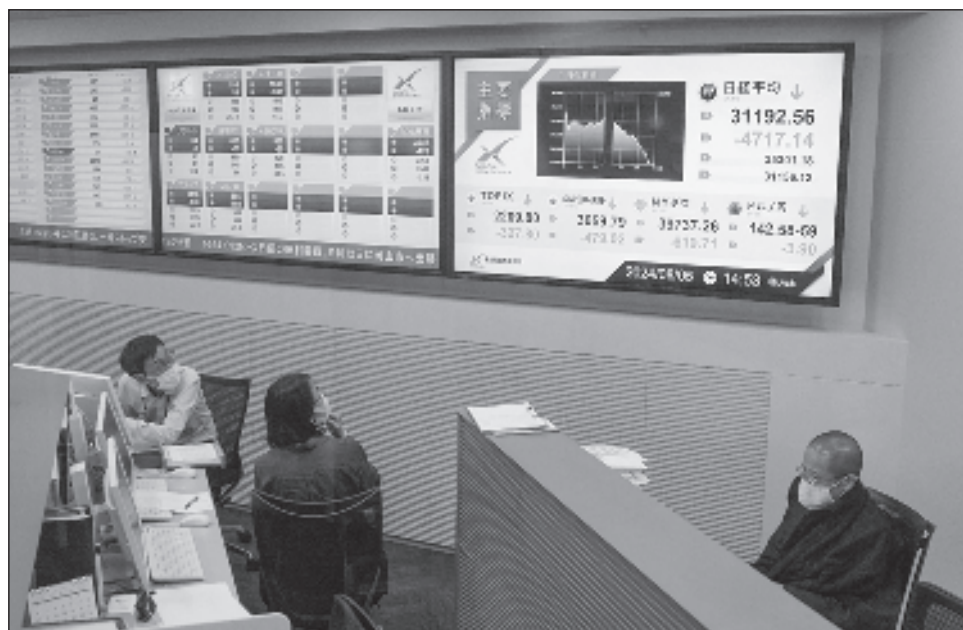
▲ En Asia, el Nikkei de la bolsa de Tokio cerró perdiendo 12.4 por ciento, la peor caída en puntos de su historia. Taiwán y Seúl cayeron más de 8 por ciento.

En Asia, el Nikkei de la bolsa de Tokio cerró perdiendo 12.4 por ciento, la peor caída en puntos de su historia. El en-