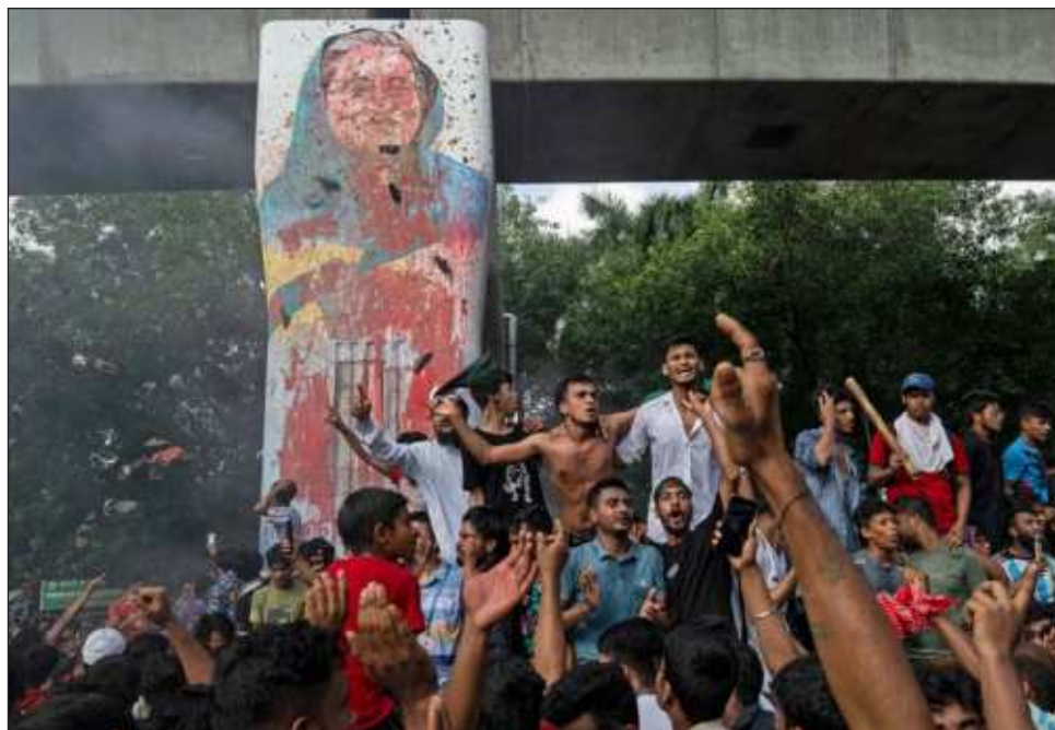
▲ Durante semanas, Sheikh Hasina intentó sofocar infructuosamente las multitudinarias protestas que comenzaron a principios de julio con una revuelta estudiantil. En la foto, manifestantes apedrean una imagen de la primera ministra en la capital, Daca.

Hasina, de 76 años, huyó del país en helicóptero, indicó una fuente cercana, que habló bajo condición de anonimato, y que precisó que primero trató primero de irse en auto.