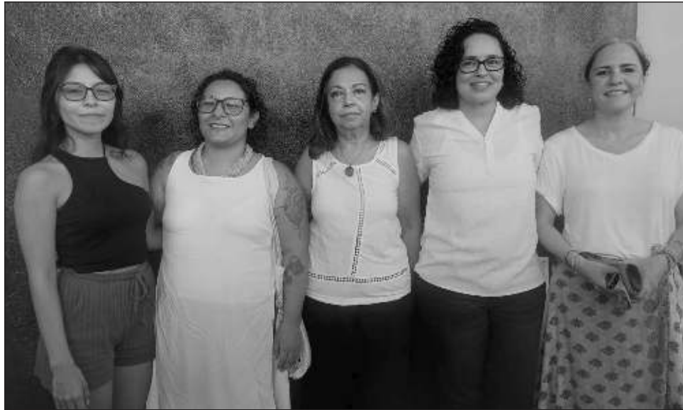
▲ Ha habido un incremento en denuncias de violencia de género en la entidad: hay más cultura y las autoridades identifican mejor los casos: Gobernanza MX.

“El feminicidio, que antes ni siquiera era un delito o al menos no de tipo penal en Quintana Roo, desde que se identificó como grupo penal hace unos 10 años aproximadamente, ya tenemos un mayor seguimiento de ese fenómeno; nos llama la atención que también están au-