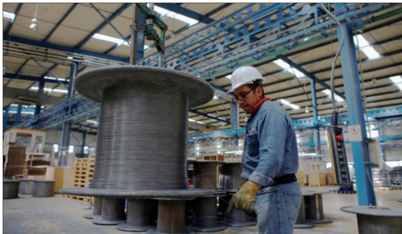
▲ “En muchos casos sale mejor importar (...) no hay un incentivo para que haya inversiones adicionales”, expuso Aguilar.

ejecutiva del Consejo Mexicano de Negocios, sobre cuáles podrían considerarse las limitantes o frenos para que se concreten proyectos de inversión en el país y cómo se explica que el sec-