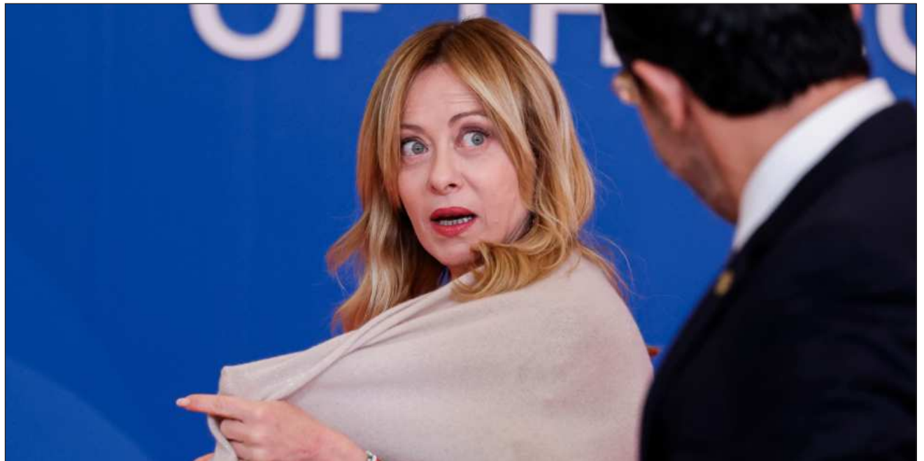
▲ "Verificar antes de creer, y creer antes de compartir. Porque hoy me pasa a mí, mañana le puede pasar a cualquiera", subrayó Meloni.

También mostró el mensaje original del usuario que distribuyó el contenido -cuyo nombre fue pixelado-, en el que se leía: "Que una primera ministra