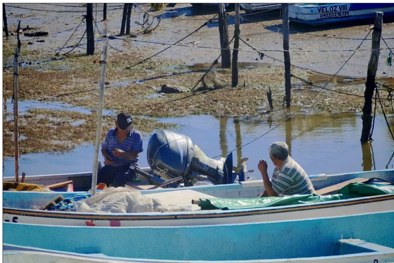
▲ Hace una semana se reunieron líderes pesqueros, donde denunciaron los daños que Pemex ha generado al mar del golfo.

Uicab dijo que se encontró grumos de petróleo en la zona cercana a Champotón, específicamente en el área del Tor-