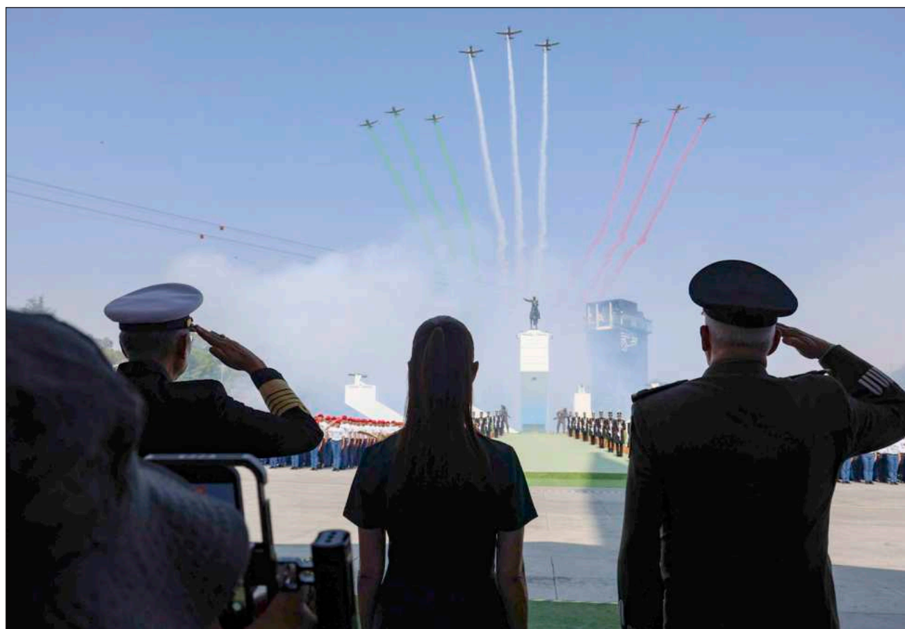
▲ “A nuestros vecinos les decimos, recordemos el momento de nuestra relación entre Juárez y Lincoln”, dijo Sheinbaum.

Sheinbaum aseguró que México tiene un pueblo que ama su independencia y su soberanía, y estamos dispues-