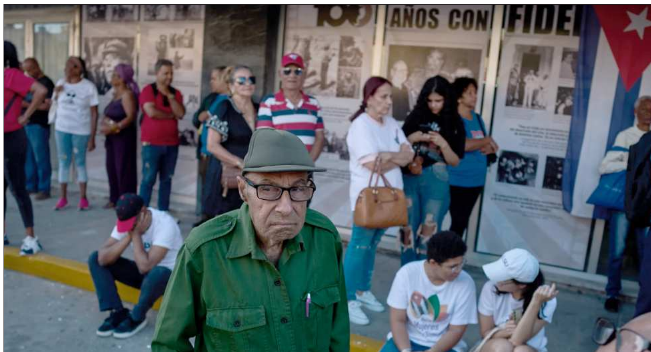
▲ El canciller cubano indicó que Donald Trump ha puesto “mayor empeño” en los últimos meses con dos nuevas órdenes ejecutivas.

como la amenaza de agresión militar y la propia agresión son crímenes internacionales”, escribió el ministro de Relaciones Exteriores en la red social X.