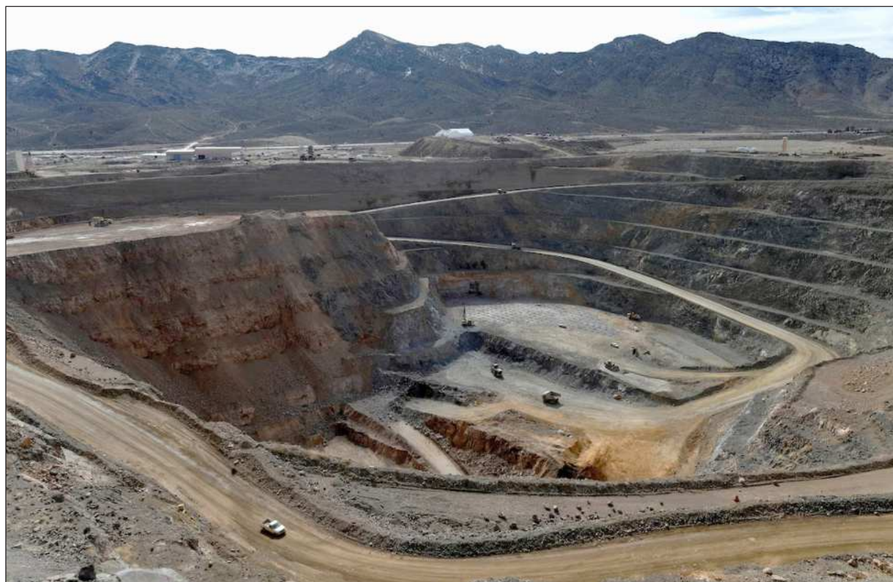
▲ China representa entre 60 y 70% de la producción de tierras raras, entre 80 y 90 de su refinado y de la fabricación de imanes.

El objetivo, según dijo hoy el ministro francés de Economía, Roland Lescure, es tratar de fomentar una mayor cooperación sobre materiales críticos en el seno del G7 (Estados Unidos, Canadá, Alemania, Francia, Italia, Reino Unido y Japón) de cara a la próxima cumbre de jefes de Estado y Gobierno del grupo prevista para junio en Évian (en los Alpes franceses).