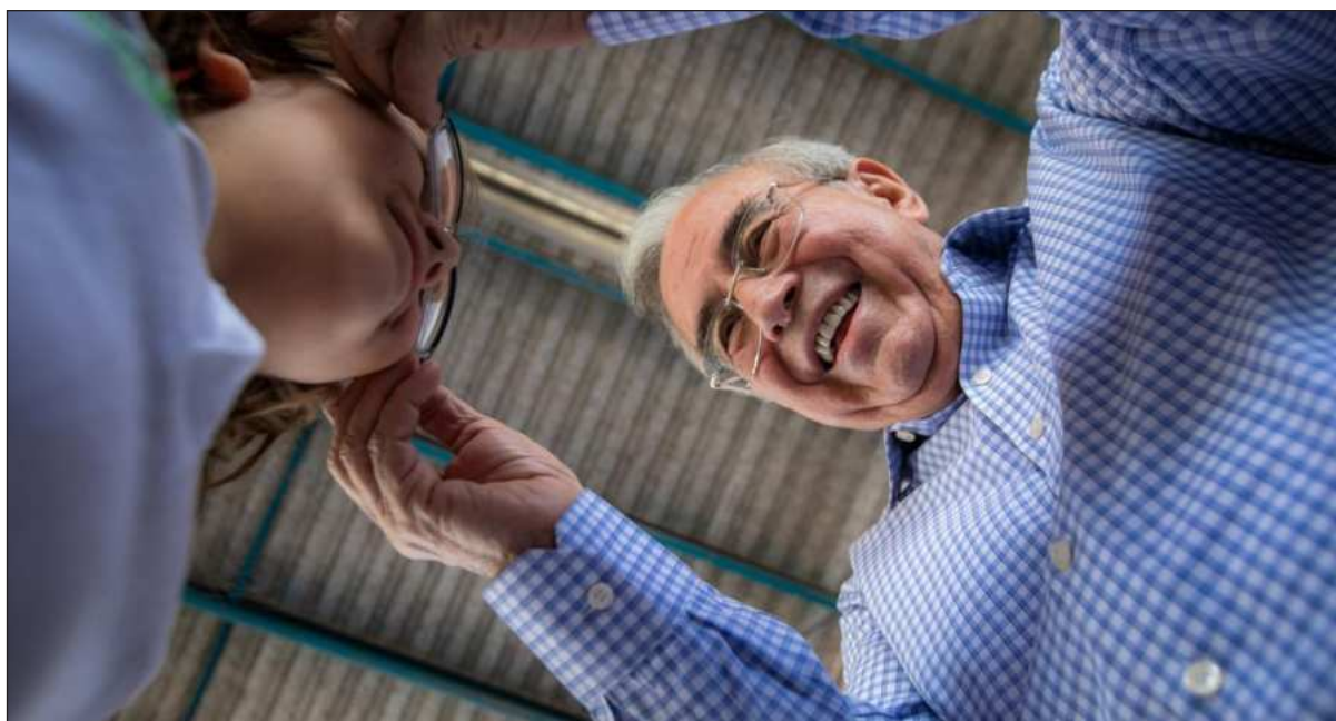
▲ "La licencia del gobernador Rocha Moya y el lunes la presencia del secretario de seguridad en Sinaloa y el perfil de la gobernadora interina trazan la operación quirúrgica que se diseña en palacio nacional".