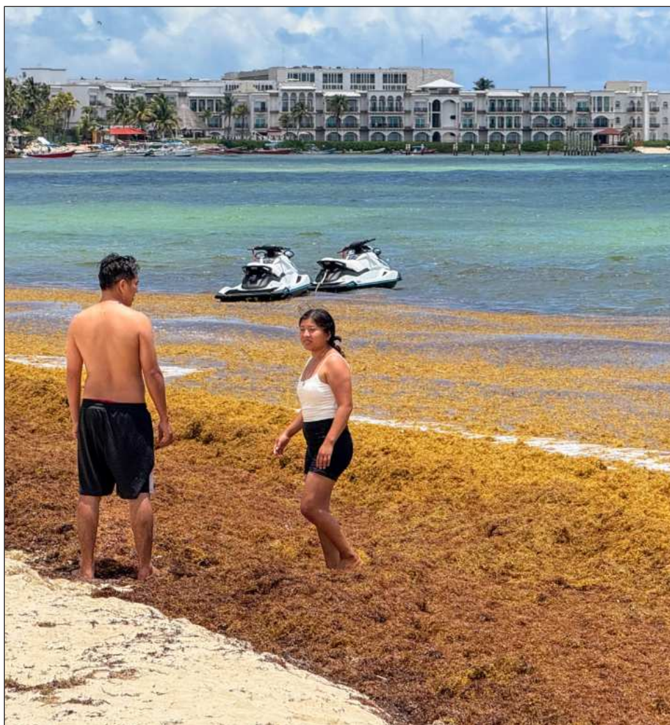
▲ Los marinos se integrarán a las tareas de limpieza coordinadas entre los tres niveles de gobierno para proteger la economía turística de la región.

La estrategia, dijo, busca neutralizar los arribos masivos mediante tecnología de gran calado; recolectando hasta ahora alrededor de 30 mil toneladas de material, centrando los esfuerzos en las rutas de entrada entre Mahahual y Banco Chinchorro, así como el canal de Cozumel.