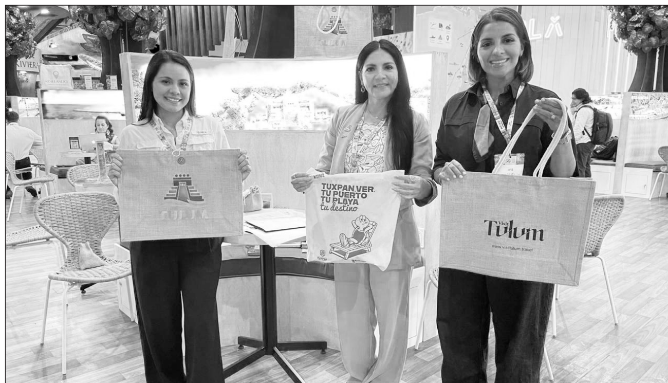
▲ Los acuerdos buscan impulsar estrategias que permitan fortalecer la cooperación entre destinos.

La delegación sostuvo reuniones con tour operadores y agencias de viaje