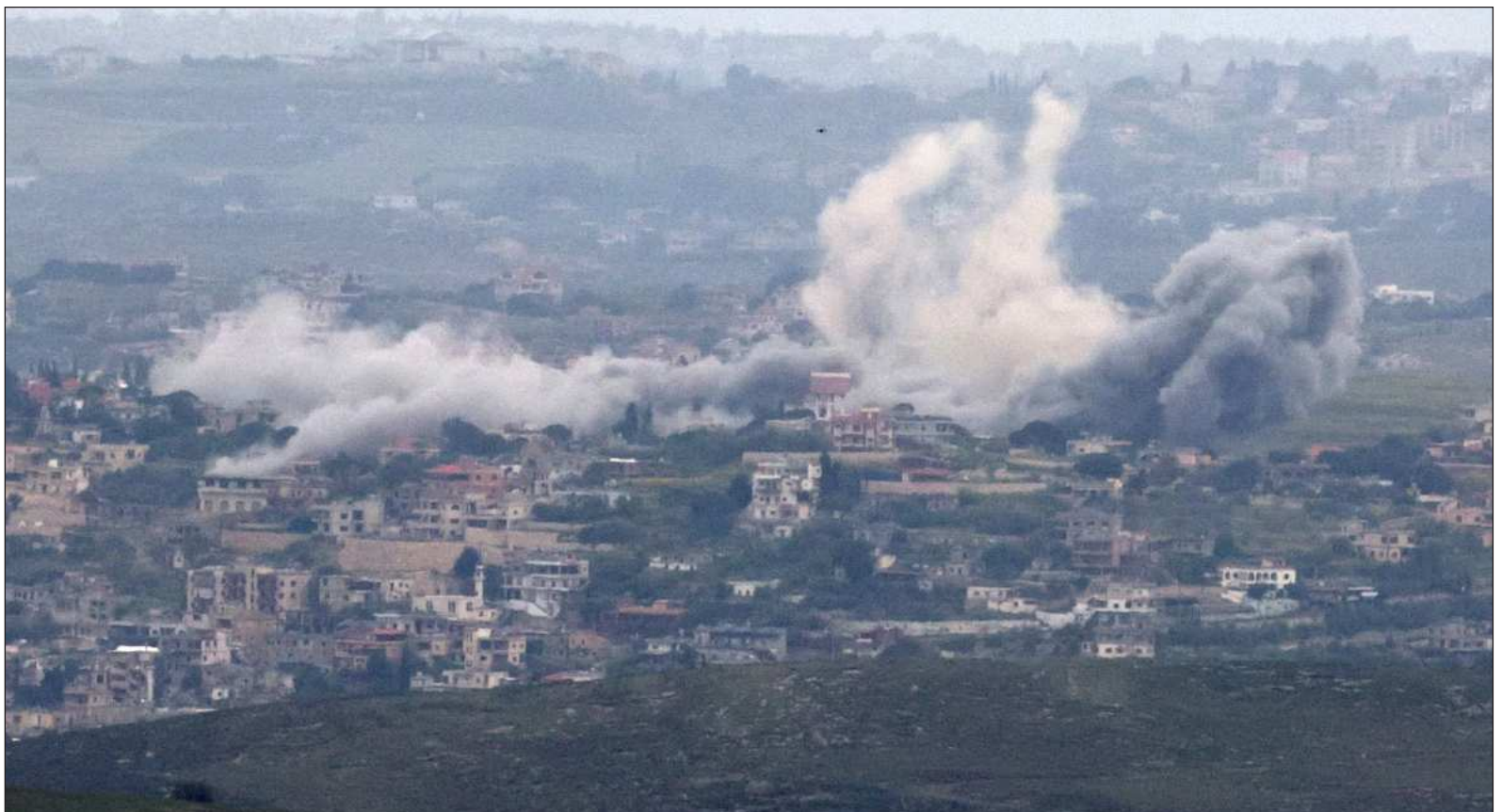
▲ “El riesgo para la humanidad está claro, la alianza del mal yanqui-sionista de Donald Trump y Benjamin Netanyahu, que se presenta como árbitro global, nos ha puesto en un punto muy peligroso de la historia contemporánea, pues una conflagración nuclear tendría efectos incalculables”.