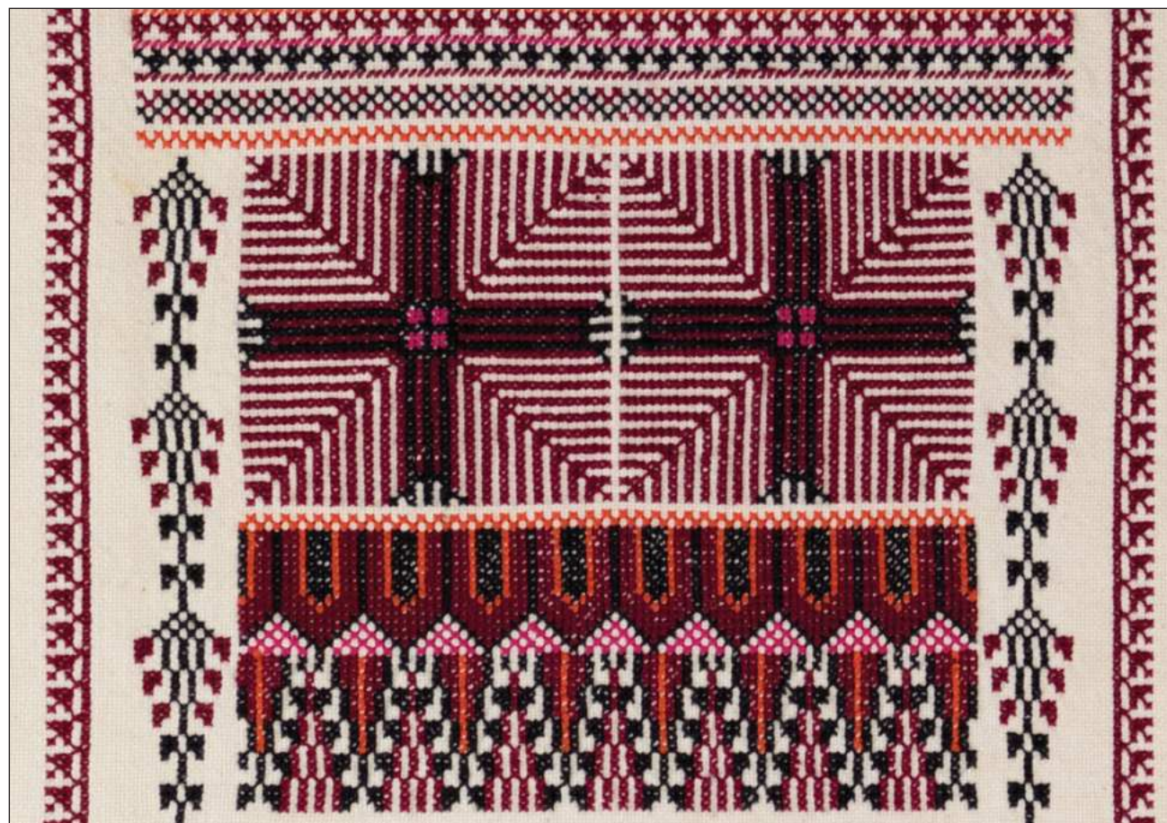
▲ El traje tradicional palestino suele incluir bordados de motivos como aves, árboles y flores, que indican la región de procedencia, el estado civil y la condición socioeconómica de cada mujer; estos diseños revelan belleza artística y comunión.