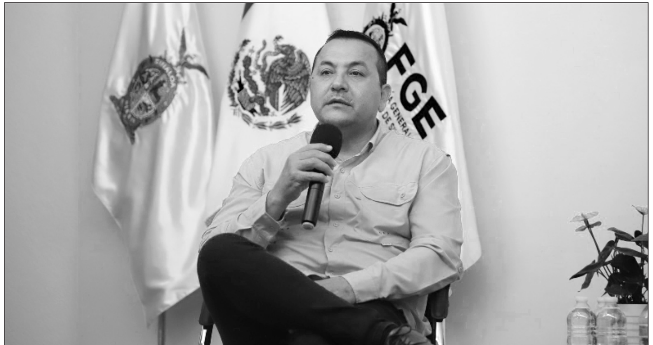
▲ Dámaso Castro es uno de las 10 mexicanos que el gobierno de Estados Unidos señaló por presuntos vínculos con Los Chapitos .

La Fiscalía General del Estado de Sinaloa confirmó que Dámaso Castro Zaavedra, vicefiscal general del estado, presentó una licencia sin goce de sueldo al cargo que ocupaba desde 2021 y manifestó que se pondrá a disposición para atender cualquier requerimiento institucional que le sea formulado por las vías legales. El funcionario es uno