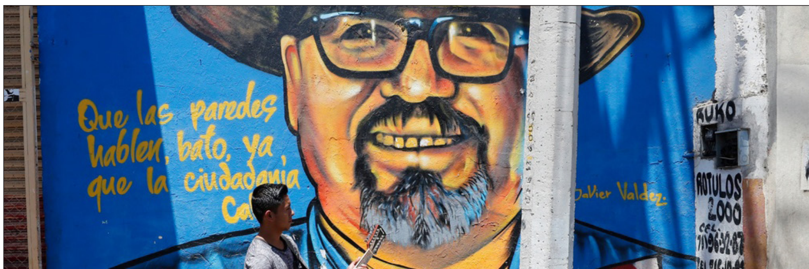
▲ “Javier Valdez nació en Culiacán, donde hizo su vida y encontró su muerte; ahí, convivir con el narco era una vecindad inevitable”.