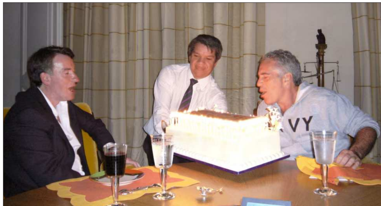
▲ "Estos hombres, mediante la manipulación, te prueban para ver hasta dónde se someterá una joven", relata la ex modelo francesa.

La mujer llama a esto la etapa de la "selección del objetivo". El cazatalentos le preguntó si era modelo