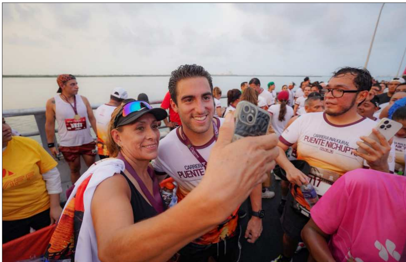
▲ El trabajo territorial tiene como objetivo primordial recoger de primera mano las inquietudes de la población para transformarlas en iniciativas y gestiones efectivas, explicó el senador Eugenio Segura.

“La labor de territorio es algo que nos manda la Presidenta y el pueblo”