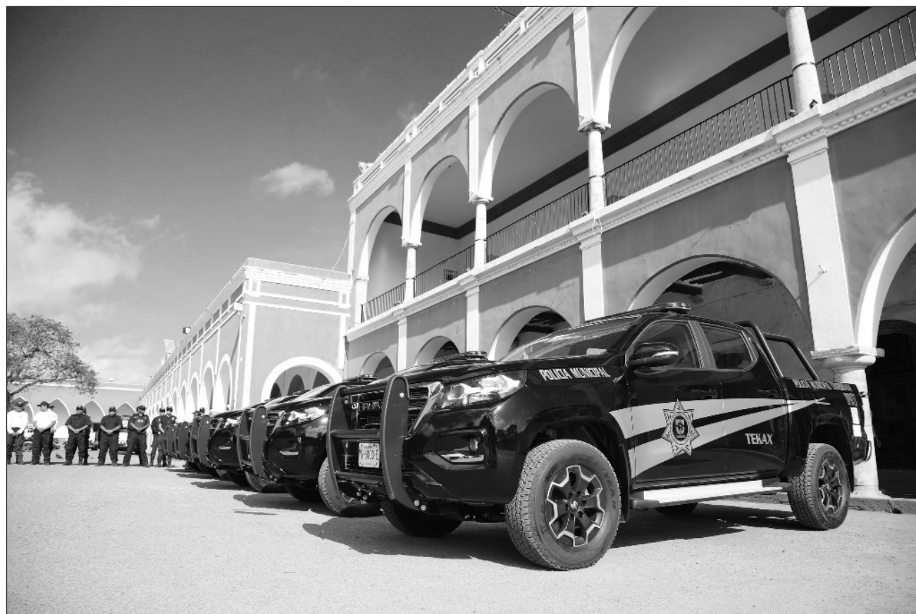
▲ Al momento, la Fiscalía General del Estado no ha compartido detalles del avance de las investigaciones.

El pasado sábado policías municipales acudieron a un domicilio a atender una denuncia por una agresión en vía pública y al realizar la detención del probable responsable, los uniformados