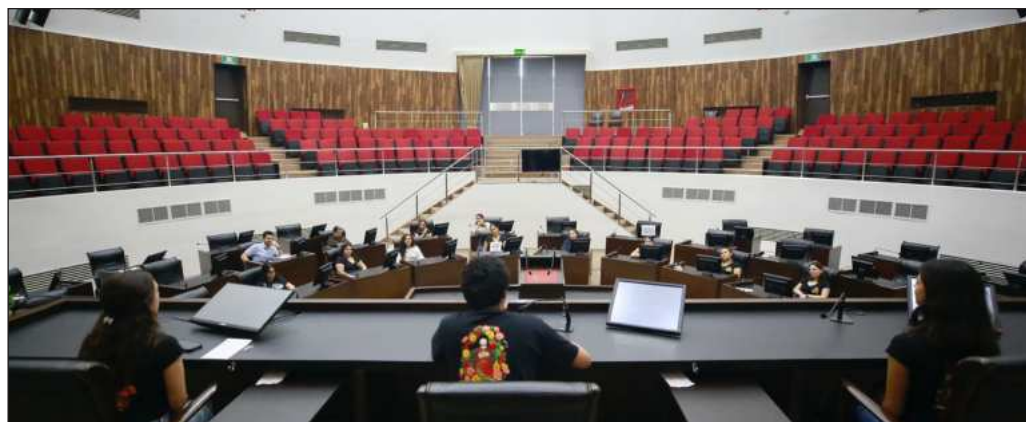
▲ La ciudadanía debe hacer el ejercicio de distinguir entre las responsabilidades del Legislativo y quienes ahí trabajan de la productividad de los legisladores locales.

Sin embargo, la ciudadanía debe hacer el ejercicio de distinguir entre las responsabilidades del Legislativo y quienes ahí trabajan de la productividad de los legisladores locales, sobre la cual existe una percepción negativa generalizada y que tampoco distingue partidos políticos. Las imágenes de diputados durmiendo en sus curules, luciendo en tribuna su vocabulario más florido y una magnífica capacidad para elaborar sofismas, la idea de que las votaciones son por consigna y no porque cada uno haya revisado la iniciativa o punto de acuerdo en cuestión, o los escándalos que involucran a más de uno, no entran a las encuestas que miden el destino del dinero público.