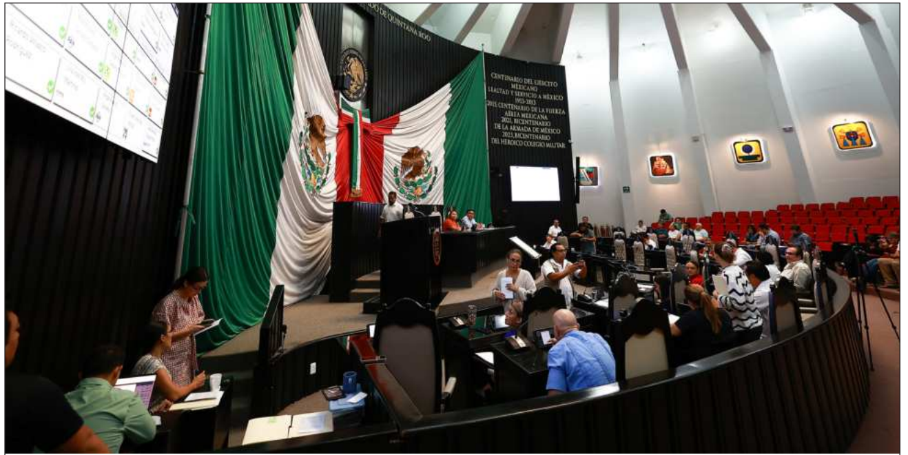
▲ Q. Roo ocupa la posición 12 sobre presupuesto ejercido con un total de 610 trabajadores adscritos.

Quintana Roo ocupa la posición 12 en cuestión de