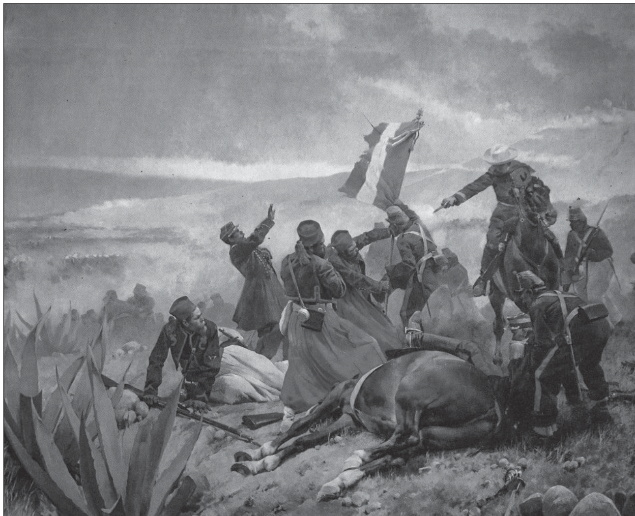
▲ Cuando la milicia de Francia invadió el territorio, México no se rindió tras la ocupación de la capital, sino que gracias al gran tamaño del país continuó su resistencia en el Norte, Sur, Occidente y Oriente. Foto José Cusachs. Batalla de Puebla, ca. 1903

El ejército francés, que invadió México y fue vencido en Puebla el 5 de mayo de 1862, era entonces “el más preparado del mundo, disciplinado y mejor armado; incluso, más que el de Gran Bretaña”, refirió.