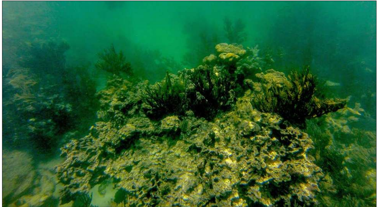
▲ El blanqueamiento está presente en los arrecifes que se encuentran a menor profundidad debido a factores como el mal manejo de aguas residuales y malas prácticas de los prestadores de servicios turísticos.

Sostuvo que los corales se están blanqueando y muriendo a pasos agigantados “a consecuencia de un montón de factores, y en el intercambio de ideas entre buzos nos preocupa que este daño suceda de forma inmediata”.