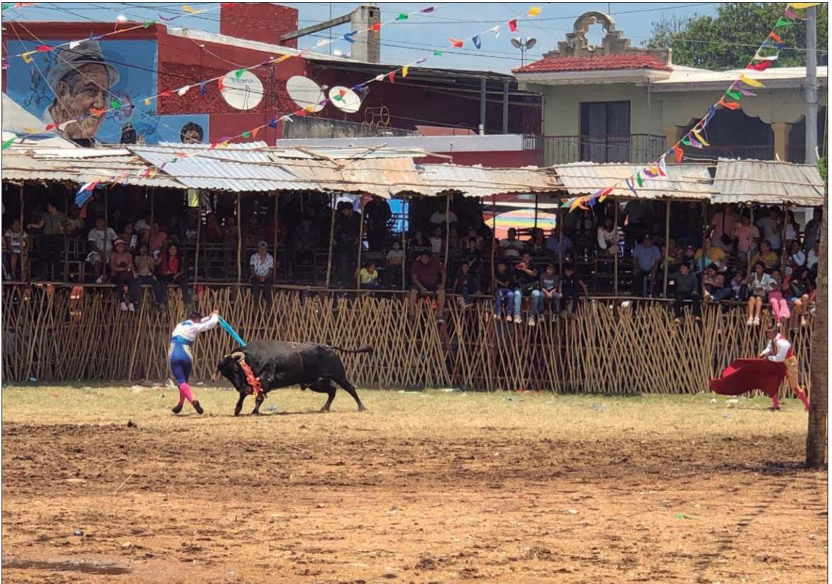
▲ La fiesta comienza el 20 de abril, y las celebraciones por el cumpleaños del cristo negro incluyen música en vivo y las corridas de toros.

volvería a hacer, también garantizó el éxito de una peligrosa intervención quirúrgica y a Santos le permitió ser padre aunque su mujer había perdido un ovario por un fallido embarazo ectópico.