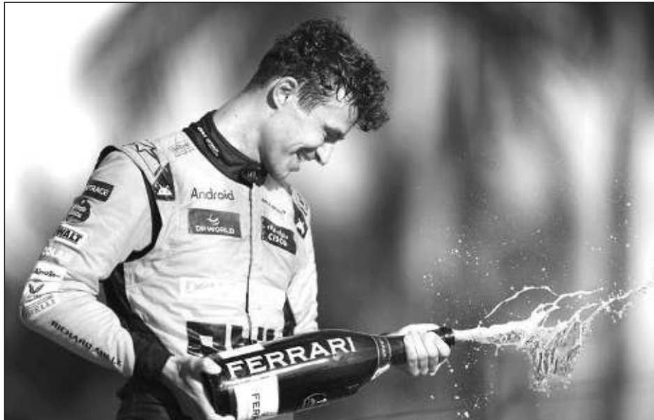
▲ El británico Lando Norris, tras conquistar el Gran Premio de Miami.

El podio lo completó el monegasco Charles Leclerc (Ferrari). El mexicano Sergio "Checo" Pérez, por su parte, no logró ingresar por segundo año en los puestos de honor. Después de que en la edición anterior finalizó segundo, el tapatío terminó quinto en un circuito que se le complicó luego de arrancar cuarto en el orden de salida.