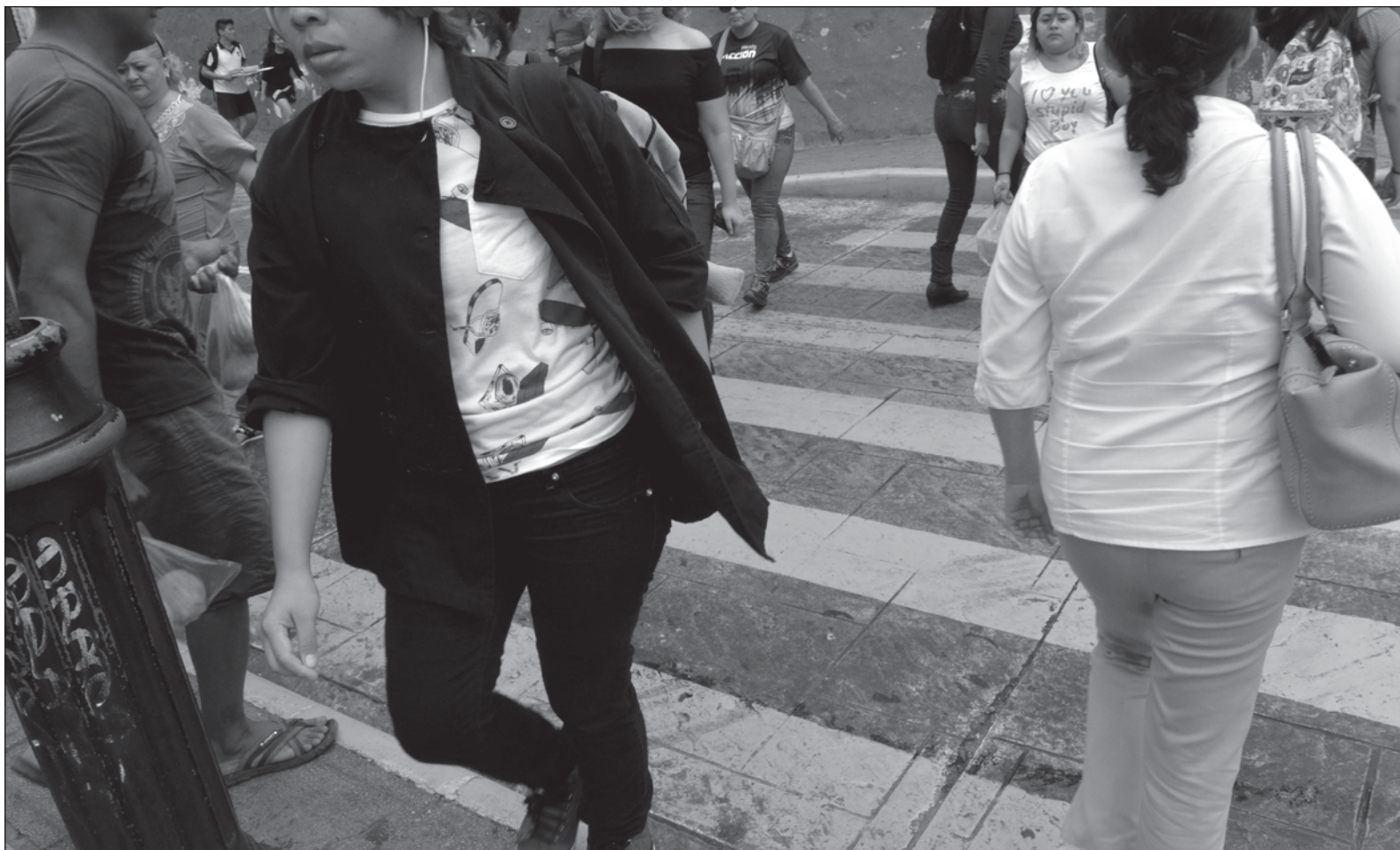
▲ "Los derechos humanos tienen una amplia aceptación en la actualidad (...) el derecho al desarrollo tiene la oportunidad de ser una puerta para pasar de lo discursivo a realidades tangibles, esto mediante las políticas públicas que sean afines a la riqueza de la cultura política".

SÍGANOS EN: http://orga.enesmerida.unam.mx/ Facebook @ORGACovid19 Instagram @orgacovid19 X @ORGA_COVID19