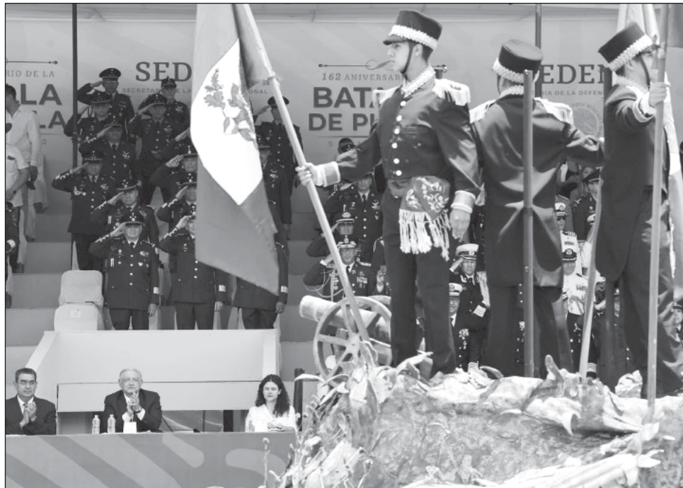
▲ El mandatario rememoró que nuestro país había sufrido varias invasiones e intervenciones extranjeras antes de la gesta histórica del 5 de mayo de 1862, por lo que los mexicanos sabían que la defensa de la patria “era cuestión de vida o muerte”.

Tras la independencia, recordó, se dio un intento de reconquista de España, una