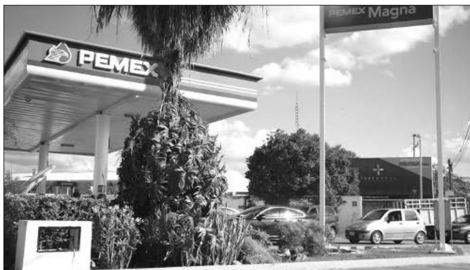
▲ La petrolera mexicana entregó 19 mil 650 millones de pesos en derecho de utilidad compartida (DUC) y derechos de extracción de hidrocarburos (DEXTH).

Desde agosto del año pasado, Pemex comenzó