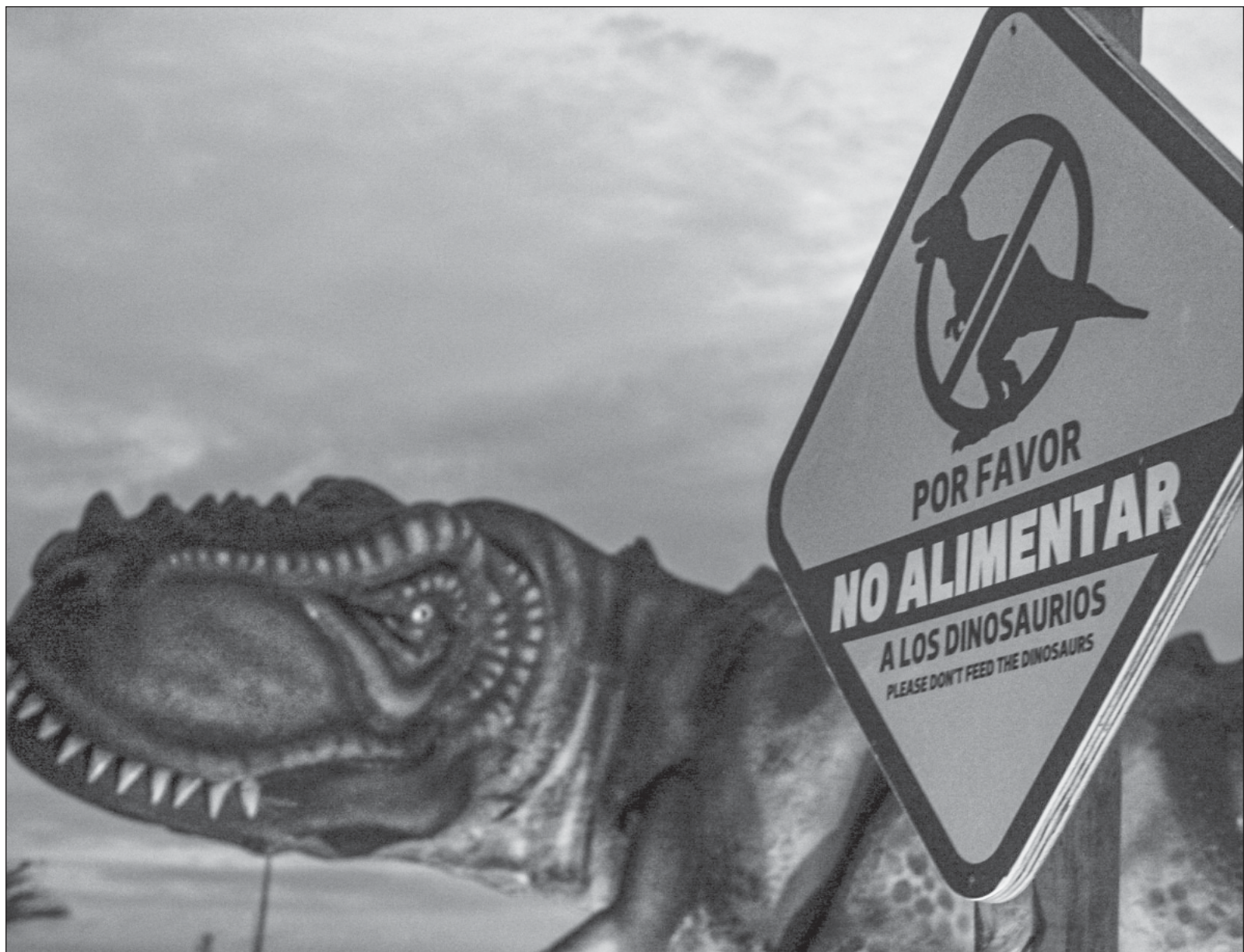
▲ “Son empresarios que han reptado sin escrúpulos para amasar sus fortunas y ponerlas al servicio de su pequeñez y de su alma purulenta. No entienden otra relación que la del contubernio. No hacen dinero por una vocación de bienestar, sino para acallar los reclamos de su consciencia”.