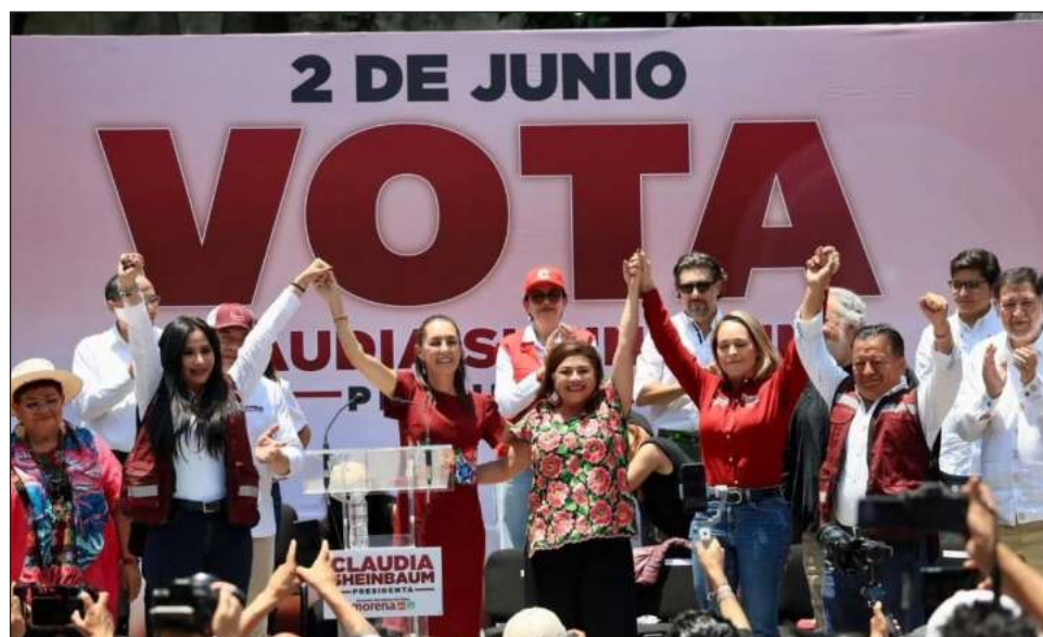
▲ “Ya tenemos un plan, ya sabemos de donde vendrá el agua, como invertir. Y esa será la gran inversión”, anticipó Claudia Sheinbaum durante el evento en Jardín Hidalgo.