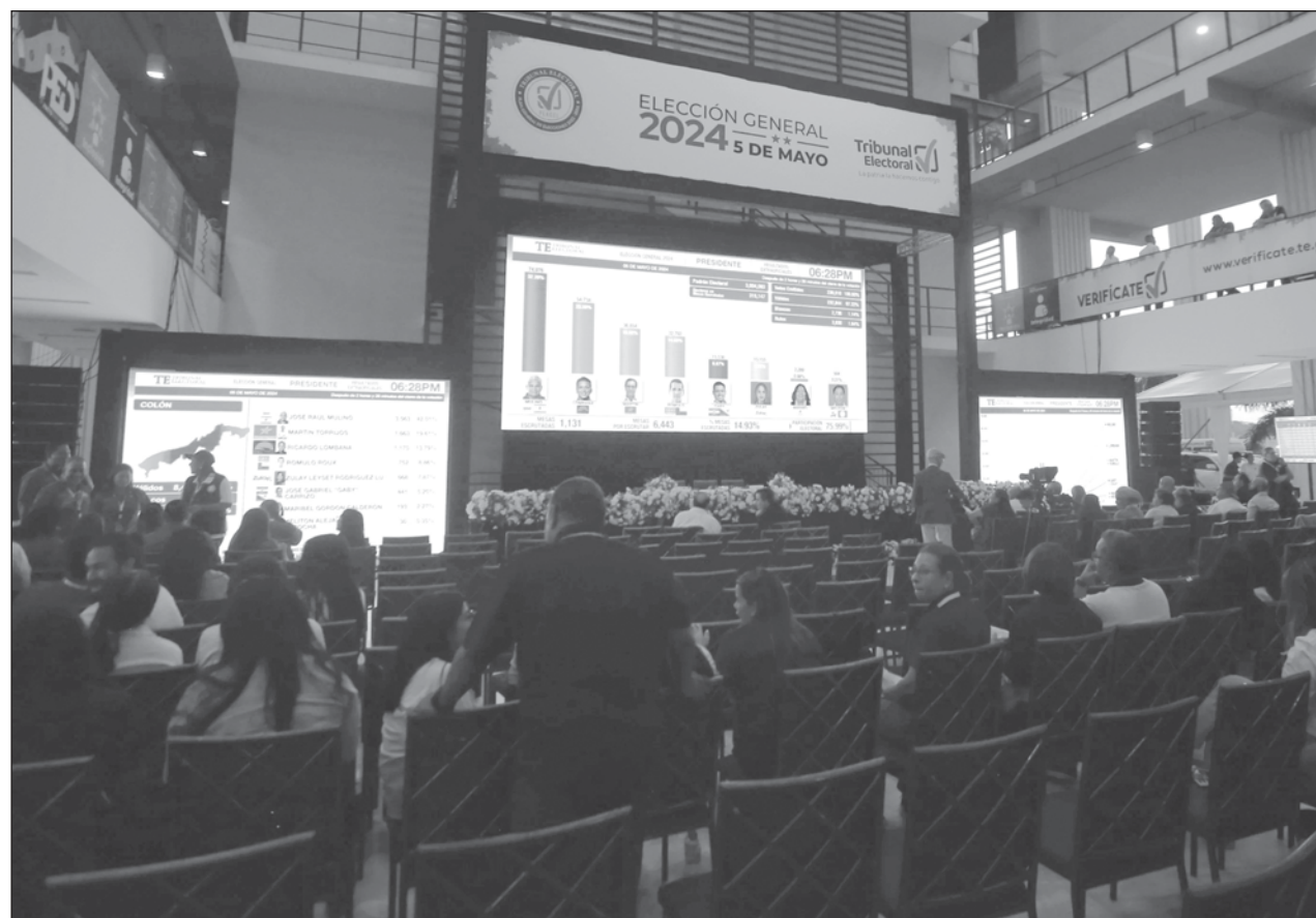
▲ La jornada electoral destacó por la histórica participación de votantes, con más de 77.57% de los panameños.