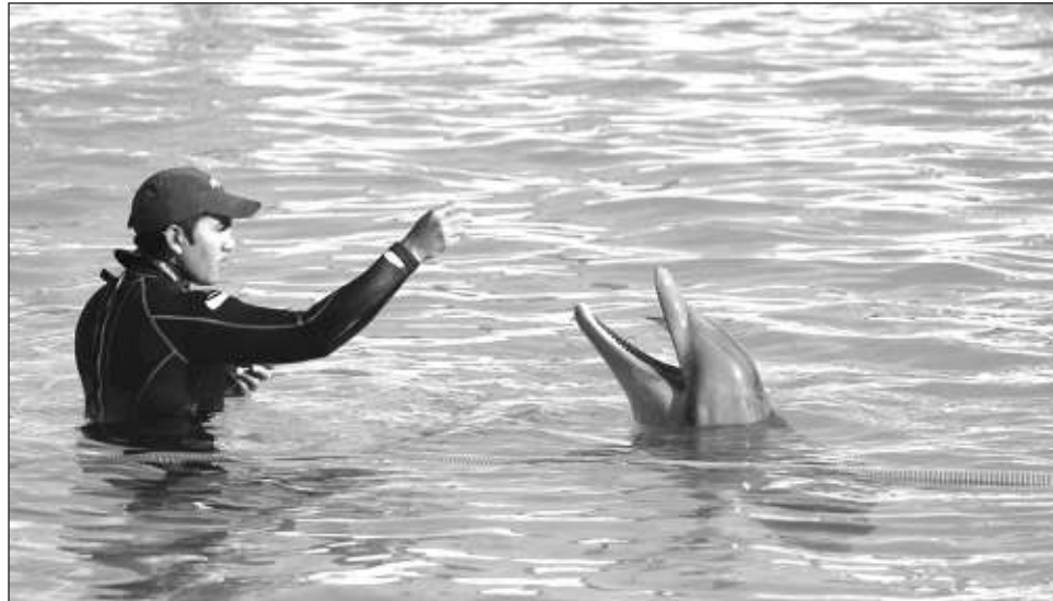
▲ La AMHAR relató que la última iniciativa que llegó al Senado pasó de las comisiones en un proceso que calificó como “muy irregular” y se quedó en el Pleno.

“Vamos a esperar a que terminen las elecciones para ver quiénes llegan al Senado y a la Cámara de Diputados para hacer un programa de educación, este programa de educación lo estamos llamando Viaje al Interior y lo que pretendemos es llevar a todos los diputados y senadores que podamos, a que conozcan los delfinarios y que sepan todo lo que hay detrás de ellos, para ahora sí que en el mejor de los términos que se eduquen”,