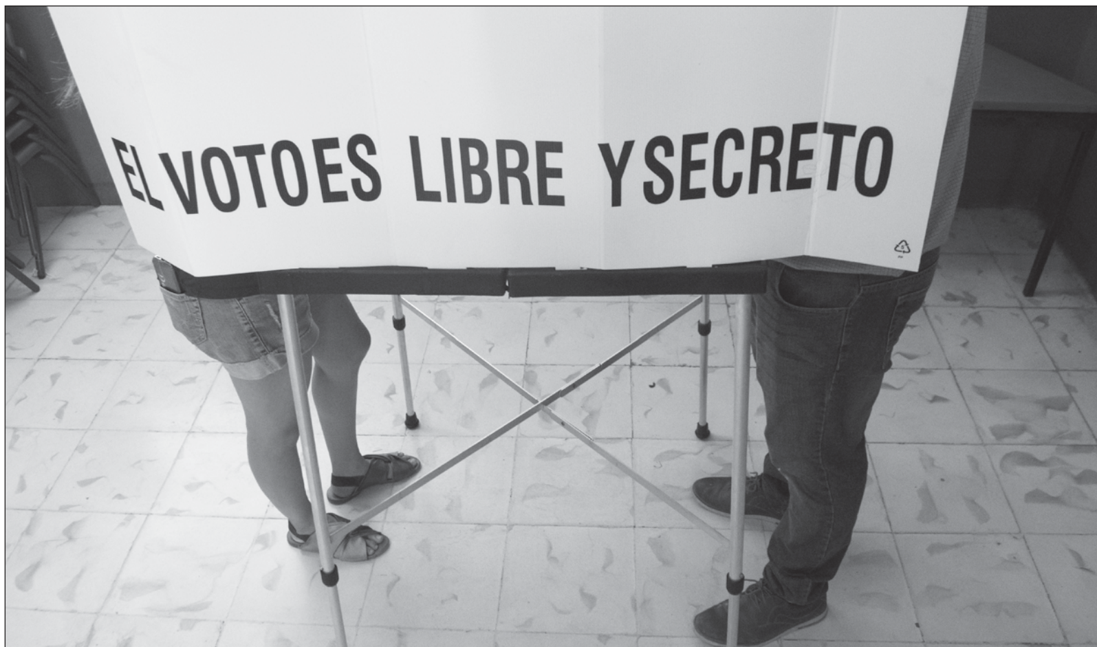
▲ Ser votante "no es cosa fácil; tiene uno que realizar uno de los ejercicios más detestados y horribles que existen: pensar".