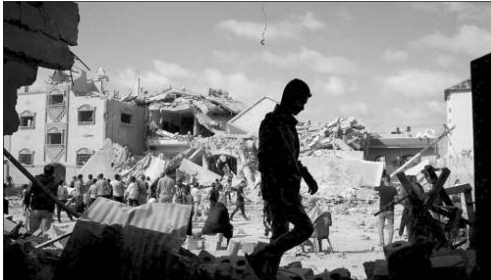
▲ El primer ministro israelí Benjamin Netanyahu prometió resistir la presión de la comunidad internacional y seguir con su ofensiva en la Franja de Gaza.

El ministro de Defensa israelí, Yoav Gallant, afirmó que Hamas no era serio respecto a un acuerdo y advirtió de “una poderosa operación en un futuro muy cercano en Rafah y otros lugares de toda Gaza”, después de que Hamas atacó el principal paso fronterizo de Israel para entregar ayuda humanitaria y mató a tres soldados. El ejército israelí dijo que creía que Hamas atacó a los soldados que estaban concentrados en la frontera de Gaza en preparación para una eventual invasión a