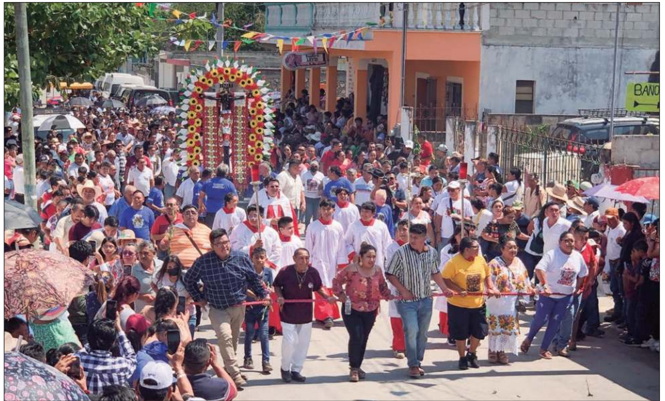
▲ El 3 de mayo, luego de realizar la misa, el Cristo de la Transfiguración es bajado de su nicho para recorrer las principales calles del centro del municipio acompañada de música de batucada y mariachi.