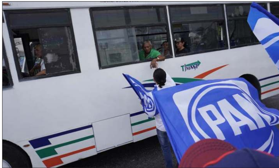
▲ Se verificó que la distribución no cumpliera únicamente con criterios de cantidad o porcentaje, sino también de oportunidad respecto a las posibilidades reales de participación.

Derivado del cumplimiento de sustitución realizado por el PAN, presentó la propuesta para la candidatura del ayuntamiento de Champotón, intercambiando de mujer a hombre a la persona que encabeza la lista, por lo que incumple el principio de paridad horizontal, el tener un total de seis mujeres y siete