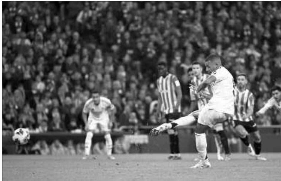
▲ Kylian Mbappé, del Real Madrid, falla un penal ante el Athletic Bilbao en la Liga española.

"Mal resultado. Un gran error en un partido en el que cada detalle cuenta. Asumo toda la responsabilidad", escribió Mbappé en una historia en Instagram. "Es un momento difícil,