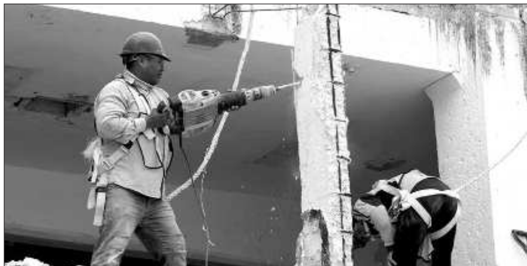
▲ Por mandato constitucional, los futuros incrementos deberán ser por encima de la inflación, en un reconocimiento a que durante mucho tiempo el salario mínimo fue más un microsalarario.

Y por último, es necesario llamar la atención sobre el factor inflación, que también obedece a estímulos externos, por lo que mantener los aumentos alrededor del 12 por ciento es, por ahora, un mero cálculo y para alcanzar la meta de que el salario mínimo equivalga a 2.5 salarios mínimos se requiere estabilidad en las condiciones económicas del país en los próximos seis años, algo que no queda bajo el control de ningún gobierno.