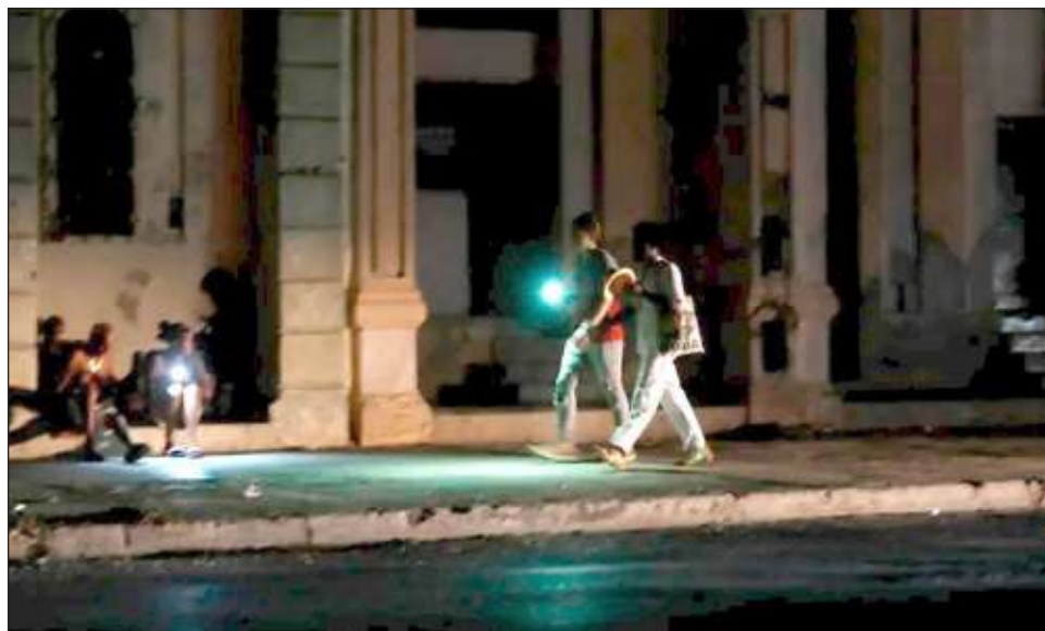
▲ El presidente Miguel Díaz-Canel dijo que espera un “buen avance” en la recuperación del servicio.

Según las autoridades, en el transcurso de la mañana circuitos independientes de