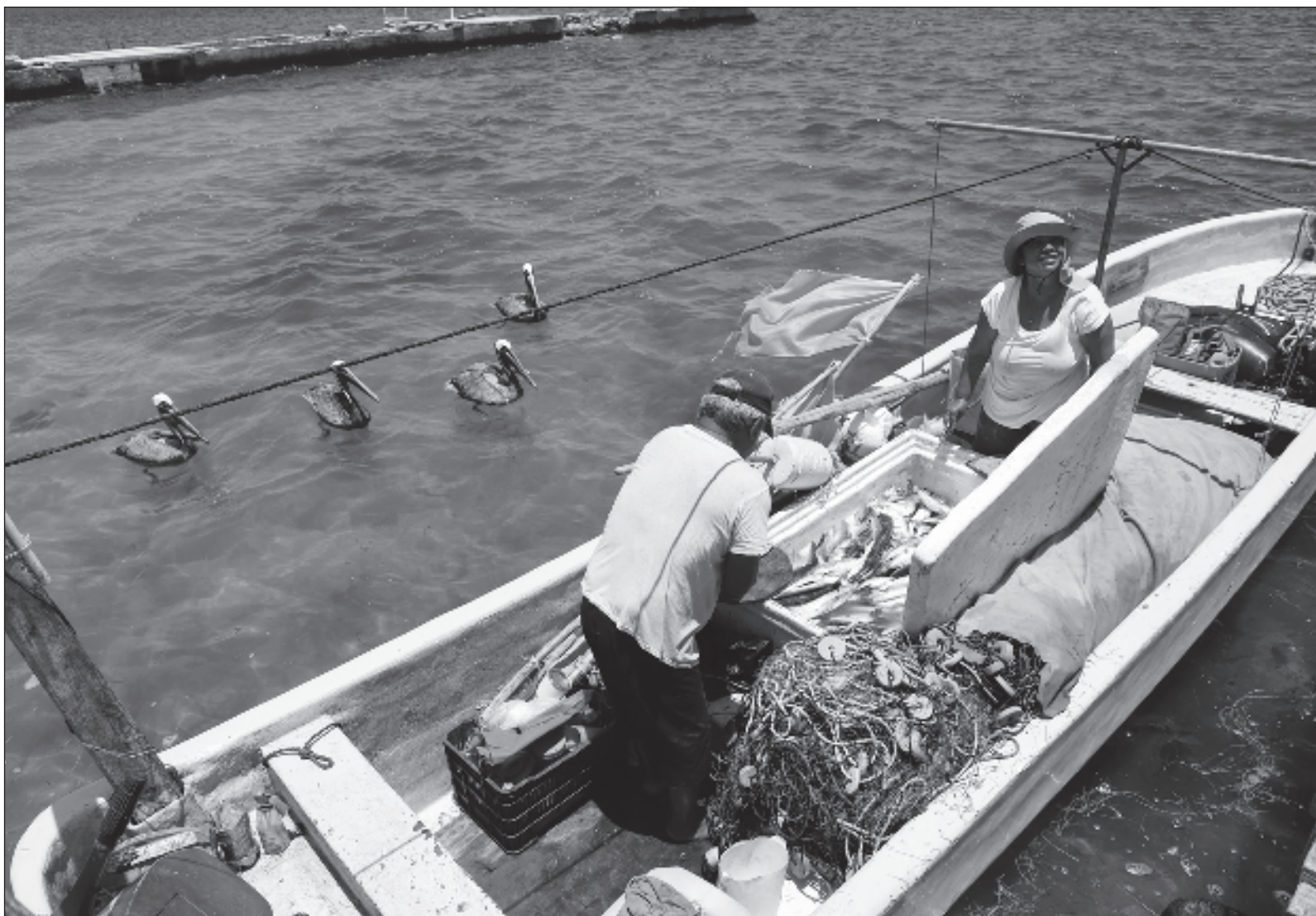
▲ "Nuestro país es uno de los principales productores de pescado a nivel mundial, ocupando la posición 15 como potencia pesquera".