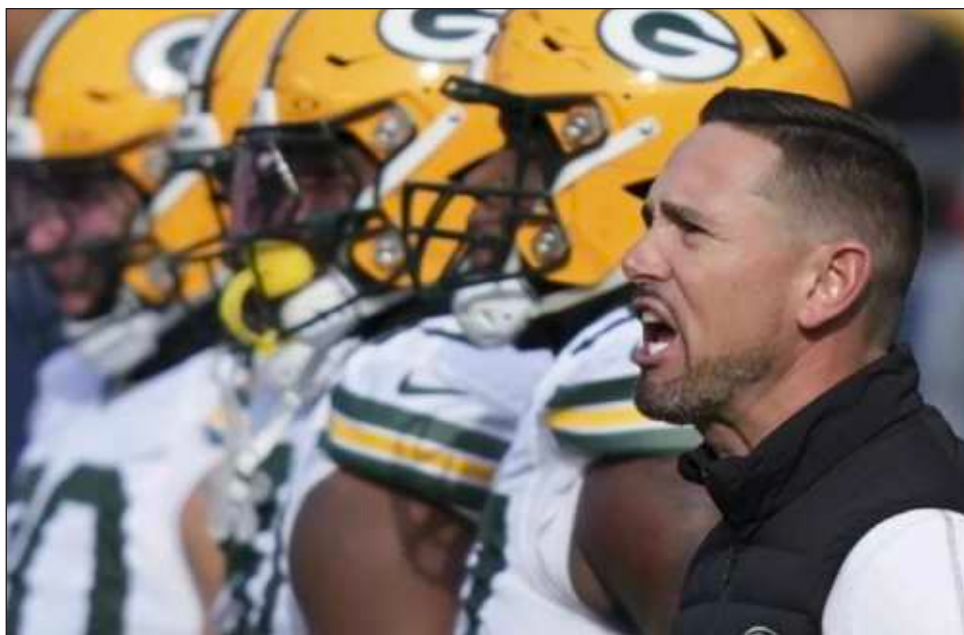
▲ Los Empacadores del entrenador Matt LaFleur buscarán frenar a los Leones.

Jahmyr Gibbs y David Montgomery, los primeros compañeros de equipo en la historia de la NFL en correr para al menos 10 touchdowns en campañas consecutivas, se han combinado para un promedio de más de 140 yardas terrestres por encuentro.