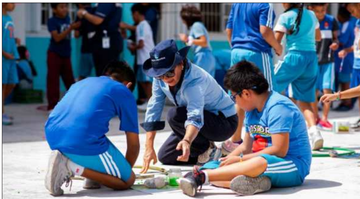
▲ Dentro de las actividades principales realizadas está Gira del Agua, con visitas a escuelas de kínder, primaria y secundaria para enseñar a los chicos la importancia del agua y a mejorar su relación con el medio ambiente.

“Con Tinaco Sí”: Programa en apoyo a las familias que no tienen las condiciones necesarias para almacenar agua