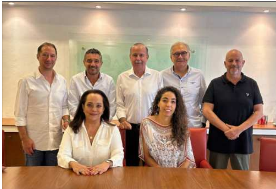
▲ En un comunicado de prensa, la asociación puntualizó que “con estas acciones, el CHCM rearma su papel como un pilar de la industria turística nacional, representando más de 130 mil habitaciones en el Caribe Mexicano”.