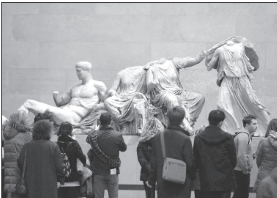
▲ El Proyecto Partenón pidió en 2023 al instituto YouGov una encuesta según la cual 64 por ciento de los británicos apoya el retorno de los mármoles.

Tenía 66 años cuando fue secuestrada. Había regresado a Guatemala de un exilio de varios años en México a causa de la persecución contra su esposo.