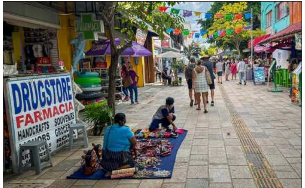
▲ Otras modalidades de la informalidad son aquellas en las que las y los trabajadores no cuentan con seguridad social ni con prestaciones sociales.

La economía informal de México se integra por el sector informal —que incluye la totalidad de actividades económicas que