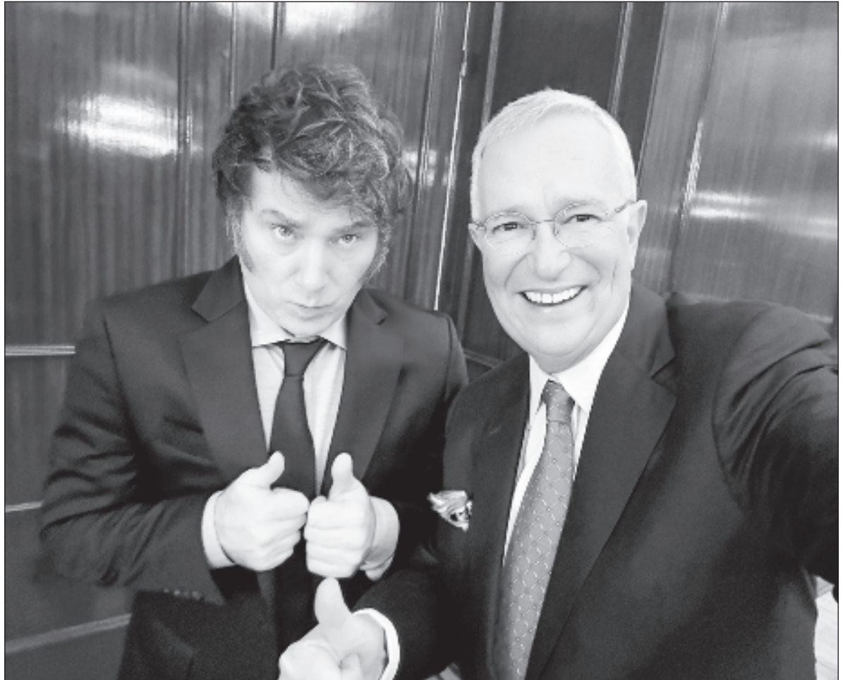
▲ "Analistas han advertido sobre la posibilidad de que se esté frente a una taimada operación que daña a los inversionistas menores, devalúa el precio de las acciones y, posteriormente, cuando se retire a tal empresa de la Bolsa Mexicana de Valores, permita a los inversionistas mayores comprar acciones a precio reducido".

TALES MANIOBRAS HABRÍAN causado fuerte daño patrimonial a Elektra, según el alegato del grupo empresarial. Sin embargo, analistas del ámbito económico han advertido sobre la posibilidad de que se esté frente a una taimada operación que daña a los inversionistas menores, devalúa el precio de las acciones y posteriormente, cuando se retire a tal empresa de la Bolsa Mexicana de Valores, permita a los inversionistas mayores comprar acciones a precio reducido.