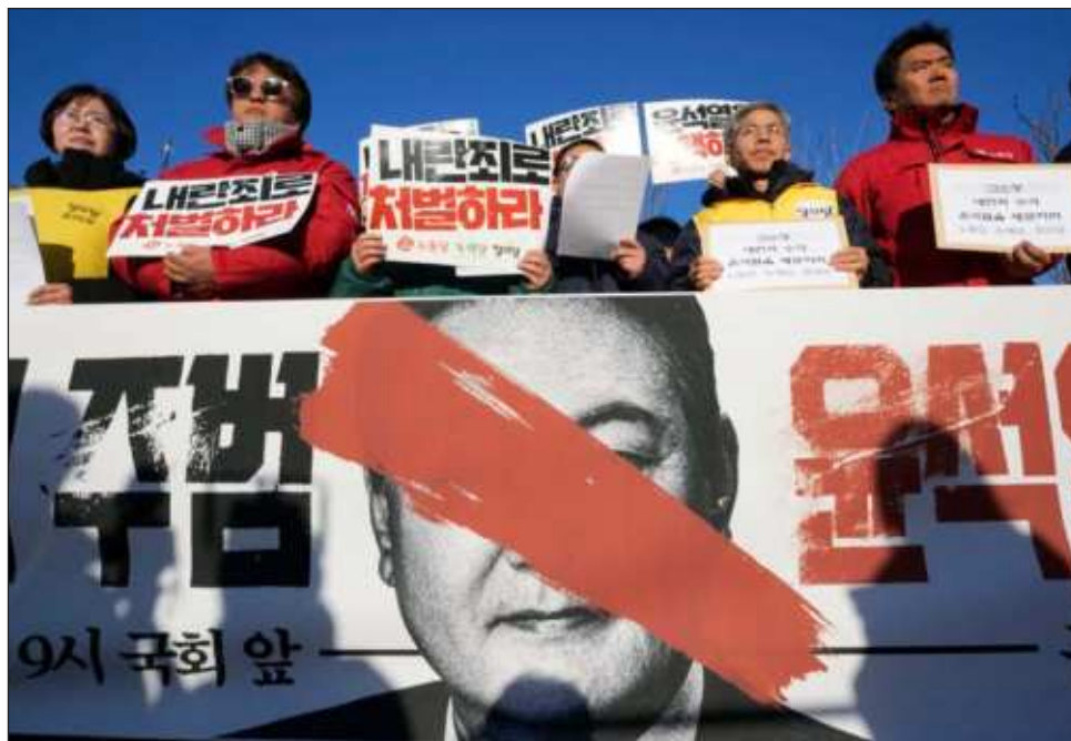
▲ Destituir al presidente Yoon Suk Yeol por la breve imposición de la ley marcial requeriría el apoyo de dos tercios del Parlamento, y al menos seis jueces de los nueve miembros de la Corte de Constitucionalidad tendrían que respaldar la iniciativa para apartarle del cargo.

Varios asesores de alto nivel y el ministro de Defensa, Kim Yong Hyun, se ofrecieron a dimitir mientras la nación trataba de comprender lo que parecía ser una