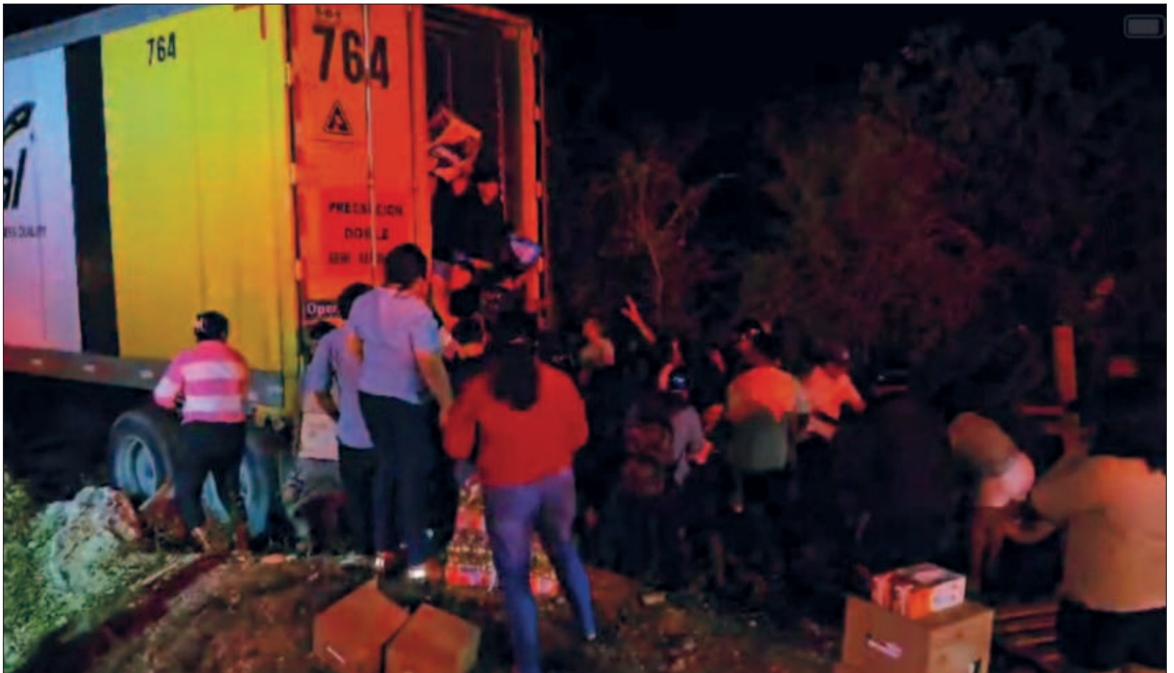
▲ En los tres incidentes se contó con la presencia de elementos de seguridad municipal y de la Guardia Nacional pero no pudieron contener a la turba de pobladores que llegaban con bolsas, sacos, cajas y otros utensilios para llevarse el producto regado en la cinta asfáltica.

“Antes se contaba con una oficina de la Profepa, la cual fue cerrada y ahora no hay quien proteja, ya que la Fiscalía Especializada en Delitos Ambientales y contra los Animales, tampoco cuenta con un titular o encargado en la Isla”.