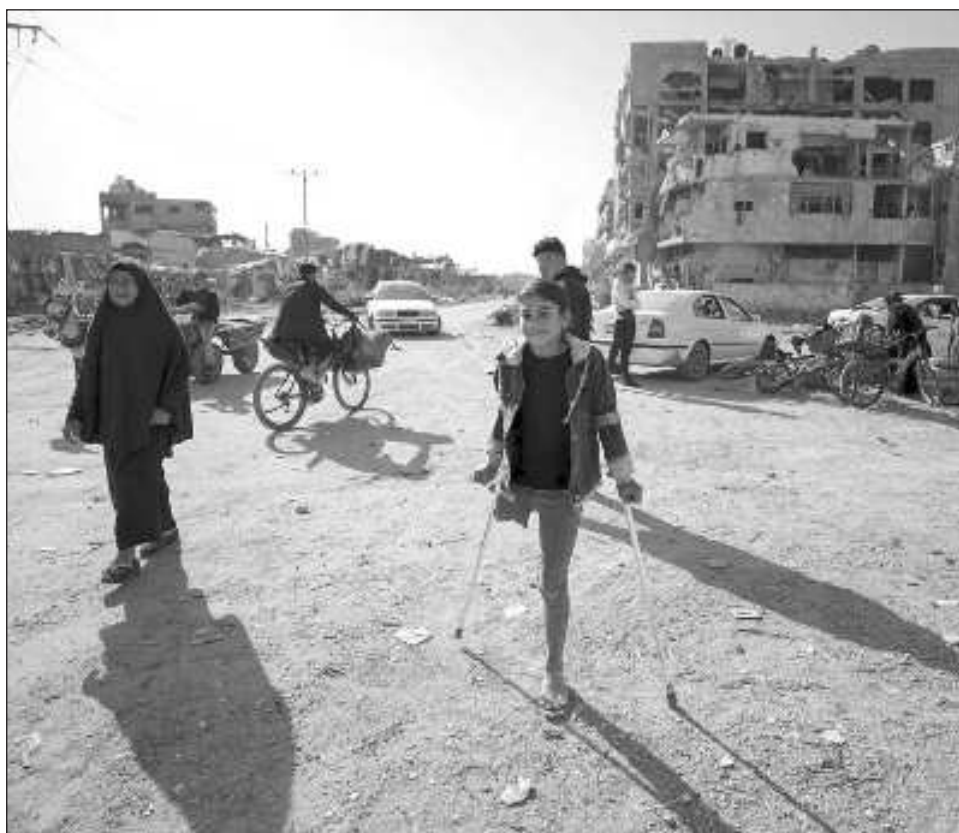
▲ El principal órgano de la ONU consideró que tanto Israel como Palestina deberían "vivir uno al lado del otro en paz y seguridad dentro de fronteras reconocidas".

Pero se proclamó solamente la creación de Israel el 14 de mayo de 1948, lo que desencadenó una guerra entre el Estado hebreo y sus vecinos árabes.