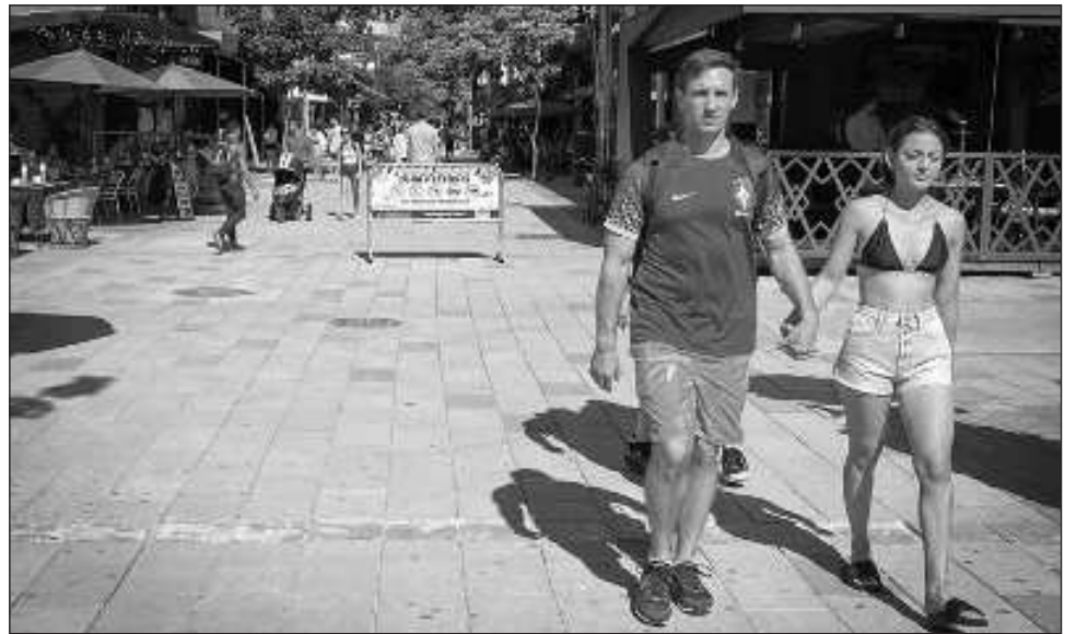
▲ En Playa del Carmen, Quintana Roo, se registra el mayor número de casos de depredadores sexuales ocasionales, que normalmente se hospedan y cometen sus delitos en los hoteles 5 estrellas de la Riviera Maya.

De esta manera, se incluyó una fracción en el artículo 58 de la citada ley, para que los hoteles tengan la obligación de aplicar medidas de seguridad para salvaguardar la integridad y la vida de niñas, niños y adolescentes, previo a la prestación del servicio ya sea de manera física o a través de medios electrónicos.