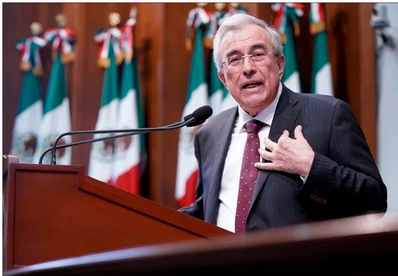
▲ "No tenemos ningún indicio ni dato de que pueda ser atacado (Rocha Moya) o de que tenga alguna amenaza", señaló Harfuch.

Cuestionado sobre si el gabinete de Seguridad tenía sospechas previas sobre el mandatario, respondió: "Por supuesto que no teníamos ningún indicio. Desde el inicio de la administración de la presidenta Claudia Sheinbaum Pardo hemos presentado resultados y detenciones, y nunca hemos tenido obstrucción por parte de funcionarios del gobierno estatal para realizar las operaciones".