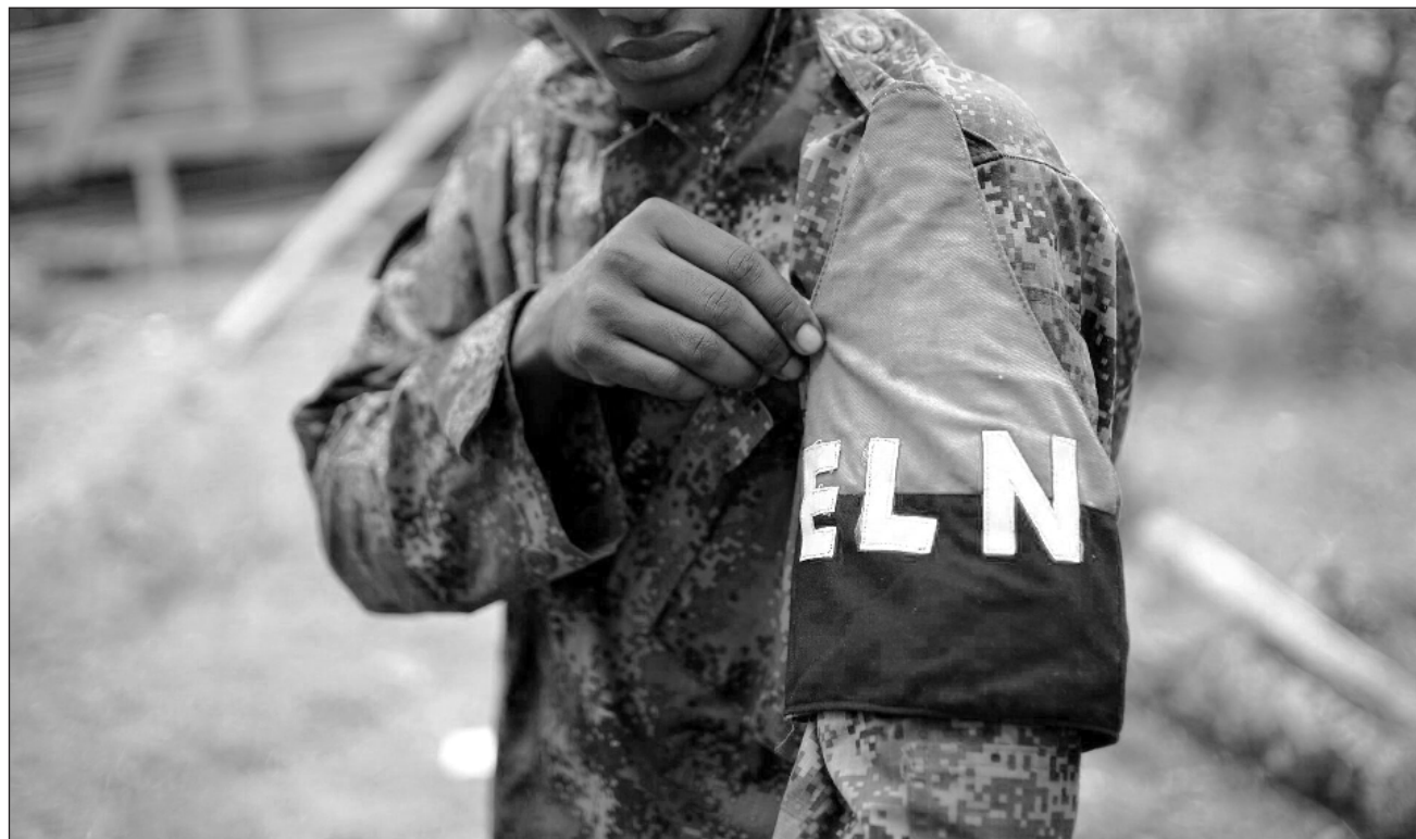
▲ “Si el ELN decide dismantelar con nosotros economías ilícitas se abren de nuevo caminos para la paz”, escribió Petro en X.

Esa masacre fue uno de los mayores golpes para la