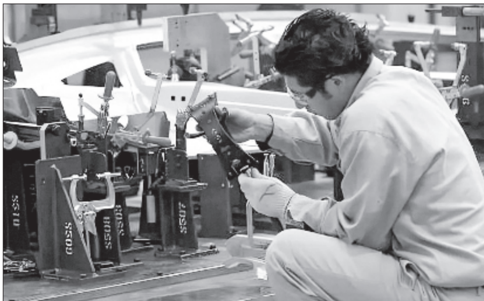
▲ En 2025 arrancará la discusión sobre la reforma para instaurar la jornada laboral de 40 horas en el país, adelantó este martes la presidenta Claudia Sheinbaum Pardo, quien aseguró que será un proceso gradual y por sectores.