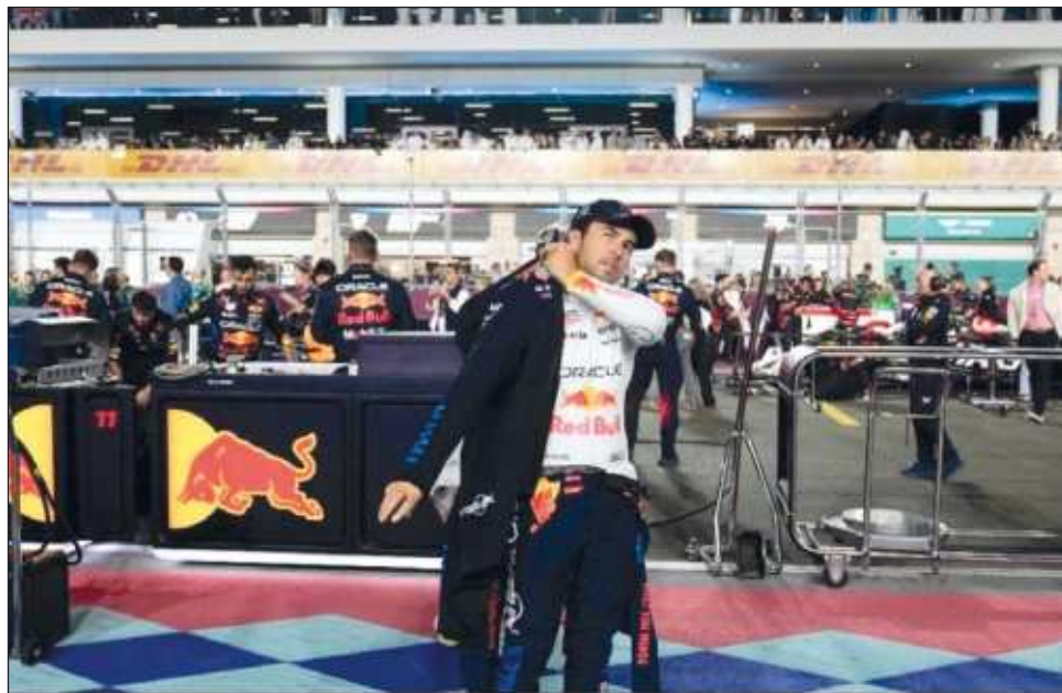
▲ Sergio Pérez comenzó 2024 en gran forma, pero su desempeño fue a la baja.

El lugar de Checo como compañero de equipo de Max Verstappen ha sido cuestionado durante meses, ya que el mexicano tiene un contrato firmado para 2025, pero sus resultados son tan pobres que su posición parece insostenible, hasta el punto de que parece probable un anuncio luego del