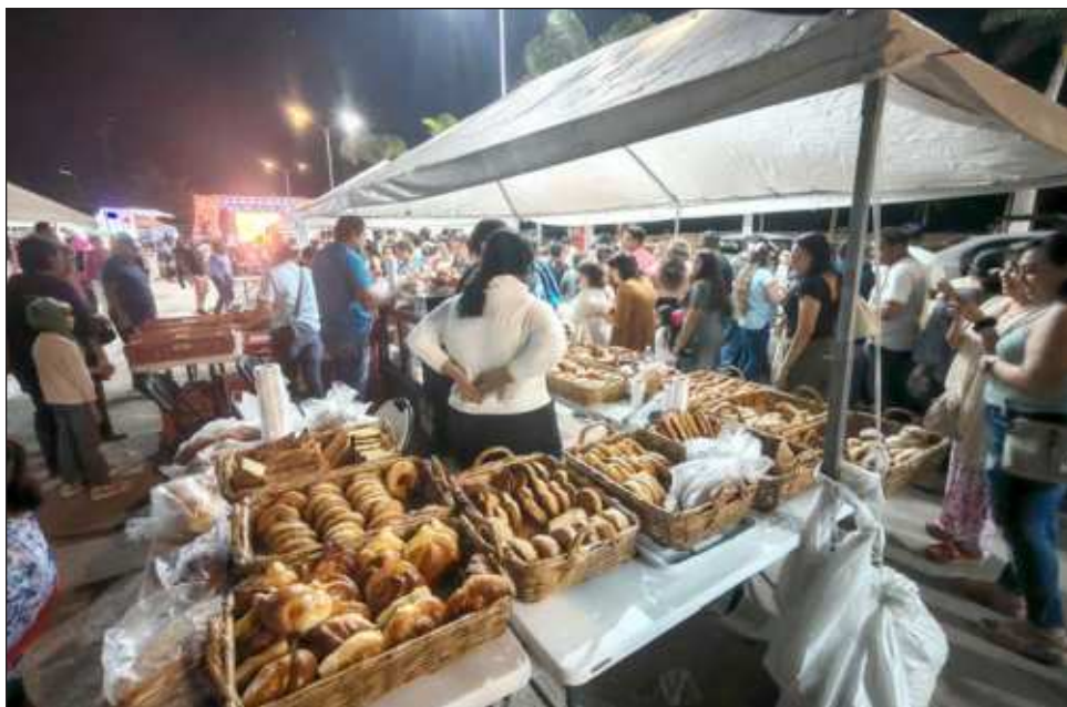
▲ En la feria participaron más de 60 panificadoras, refresqueras, cafeterías y emprendedores. Destacó el concurso Pan Tradicional Campechano, Orgullo de México 2024 .