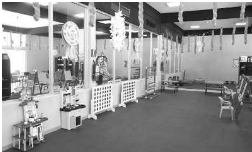
▲ El magistrado presidente ofreció una visita guiada a los medios de comunicación por el nuevo edificio, ubicado en la avenida Tulum con Chichén Itzá.

Este lugar da la oportunidad de que niños y papás que enfrentan un proceso legal de separación puedan convivir en un ambiente seguro tras la determinación de un juez. De acuerdo con el presidente del Poder Ju-