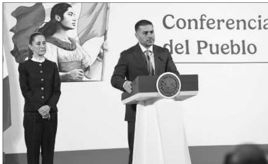
▲ El operativo es un mensaje del Estado y que implica el desmantelamiento de redes de apoyo y complicidad en las cuales se encuentran entretejidos el crimen organizado y los tres niveles de gobierno.

También debe entenderse que el operativo es un mensaje del Estado y que implica el desmantelamiento de redes de apoyo y complicidad en las cuales se encuentran entretejidos el crimen organizado y los tres niveles de gobierno. Esta es una estructura que requiere de mucha aplicación para desmontarla con el mínimo daño a la población civil, que ya quiere dejar de escuchar balazos.