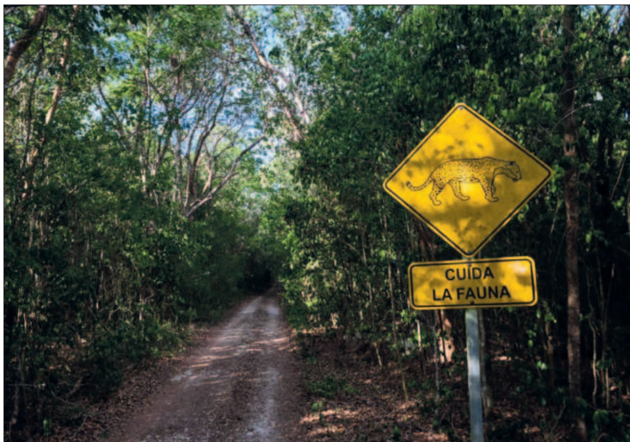
▲ El programa contempla la construcción de 21 pasos de fauna, de los cuales 15 serían elevados, dos de tirolesa y cuatro subterráneos, para asegurar la protección de diversas especies de fauna silvestre del estado.

“La Dirección de Sustentabilidad Ambiental está trabajando en conjunto con la Profepa y el Comité de Vigilancia Ambiental Participativa, así como con las direcciones de Protección Civil y Bomberos, donde le damos seguimiento a los reportes relacionados con la fauna silvestre, esto incluye atropellamientos, daño y maltrato, accidentes, tenencia ilegal de ejemplares y otros incidentes que involucren a la fauna silvestre”, precisó.