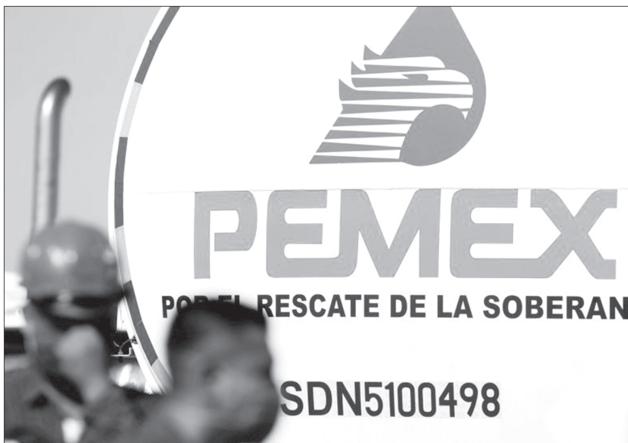
▲ Se estima que al menos 140 empresas asentadas en el municipio campechano mantienen contratos directos con Petróleos Mexicanos, por lo que el pago generará la reactivación de la economía local y estatal.

“Estamos confiando porque hemos visto mayor disposición de los directivos al diálogo y han presentado un plan real de pagos, que pueden llegar a ser benéfico, ya que la economía del municipio y de entidad, se encuentra estrechamente ligada a la actividad petrolera”, concluyó.