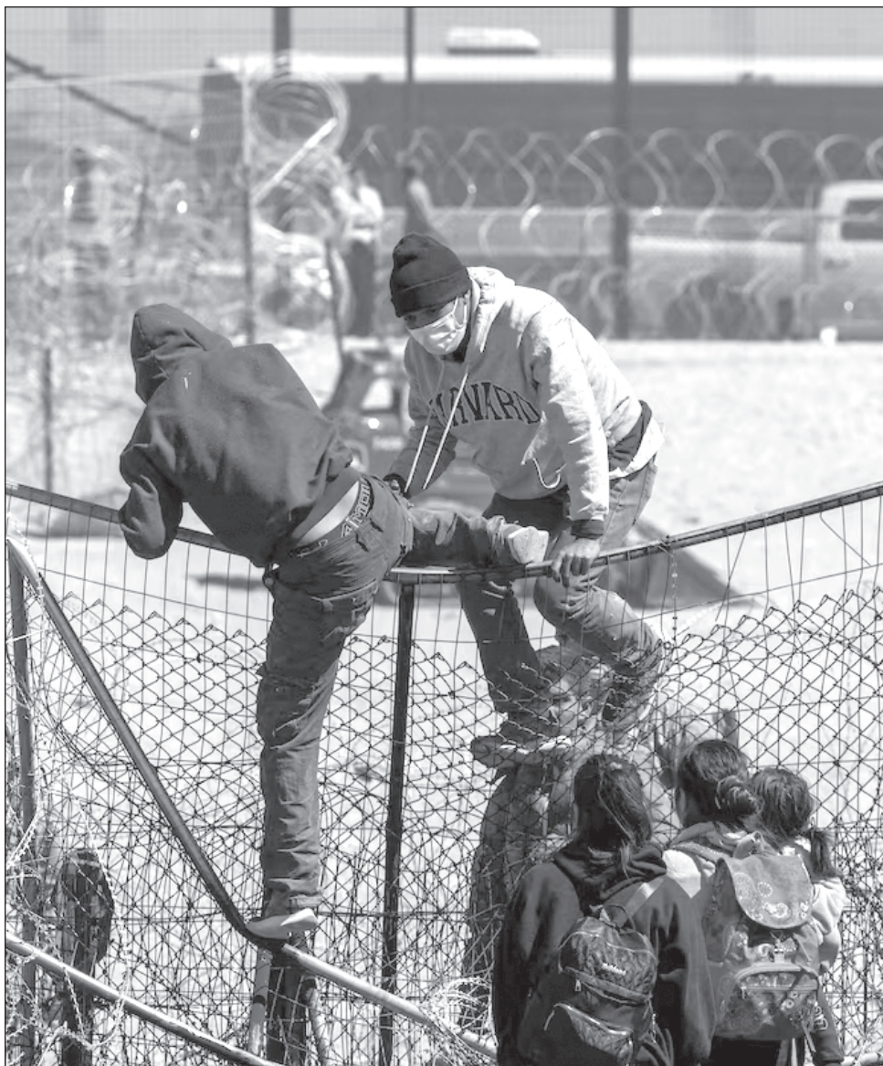
▲ El canciller puntualizó que este plan está orientado para la recepción de migrantes mexicanos, como corresponde a la responsabilidad del Estado mexicano.

De igual forma el todavía comisionado del Instituto Nacional de Migración Francisco Garduño y quien lo sucederá, el aún gobernador de Puebla, Salomón Céspedes quien dejará su encargo el 5 de diciembre para incorporarse al Instituto.