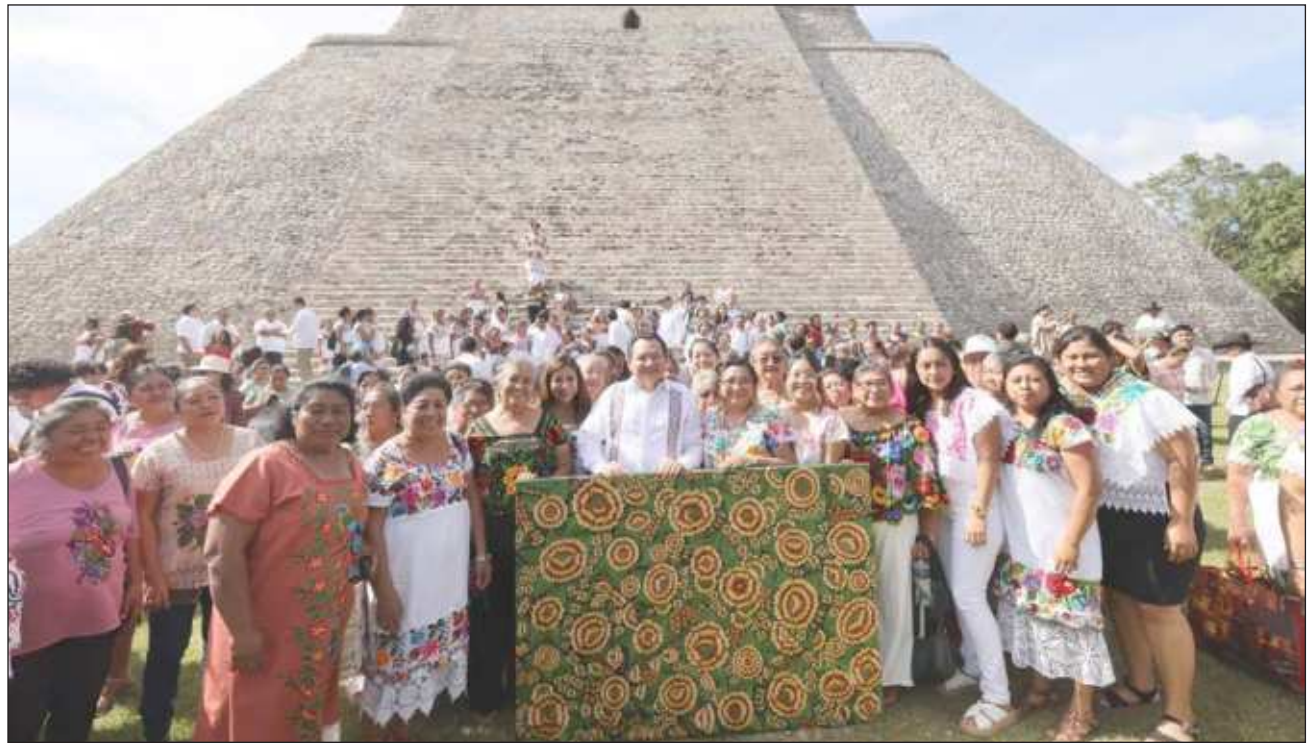
▲ El gobernador Joaquín Díaz Mena se comprometió a conservar y promover este patrimonio de la cultura que pervive en las manos de las artesanas, por lo que refrendó el seguimiento del Plan de Salvaguardia del Bordado Maya Yucateco.

Añadió: "Queremos que el arte del bordado sea una