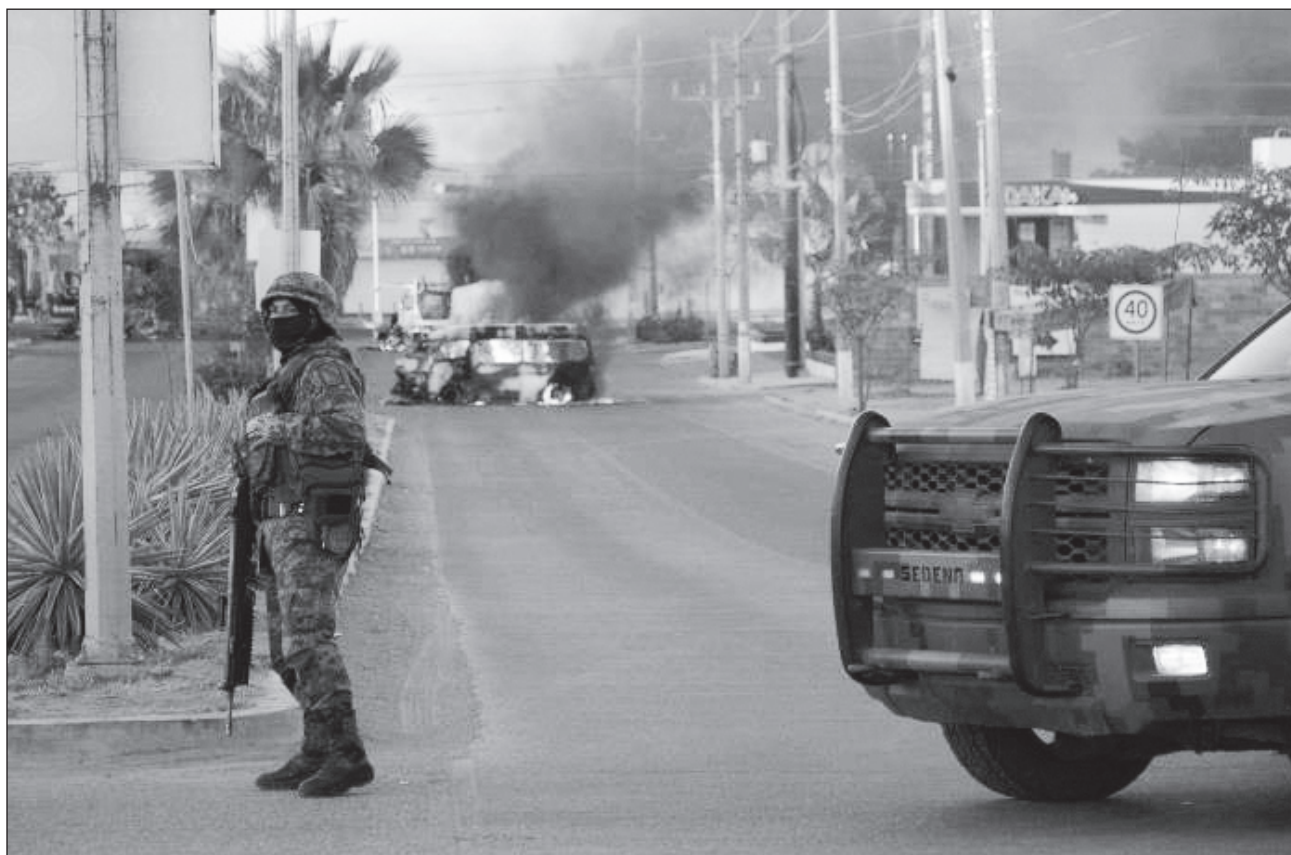
▲ La madrugada del martes se produjo la explosión de un vehículo, luego de una balacera en la Limita de Itaje, municipio de Culiacán, Sinaloa.

En la zona se reportaron detonaciones, por lo que se presume que se trató de un enfrentamiento.