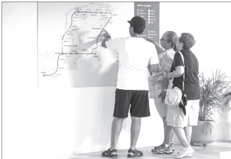
▲ La Presidenta anunció que el fin de semana del 15 de diciembre se pondrá en servicio, de manera comercial, la última parte del Tren Maya que inauguró el ex presidente López Obrador en el último día de su mandato, previo al 1 de octubre.

“Ahora vienen los hoteles, vamos a informar la próxima