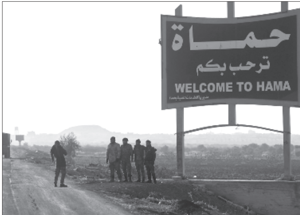
▲ El secretario general de la ONU, António Guterres, quien se dijo "alarmado por la reciente escalada de violencia en el noroeste de Siria", instó el lunes al "cese inmediato de las hostilidades".

El grupo islamista Hayat Tahrir al Sham (HTS) y otras facciones rebeldes lanzaron el 27 de noviembre una ofensiva relámpago en el noroeste