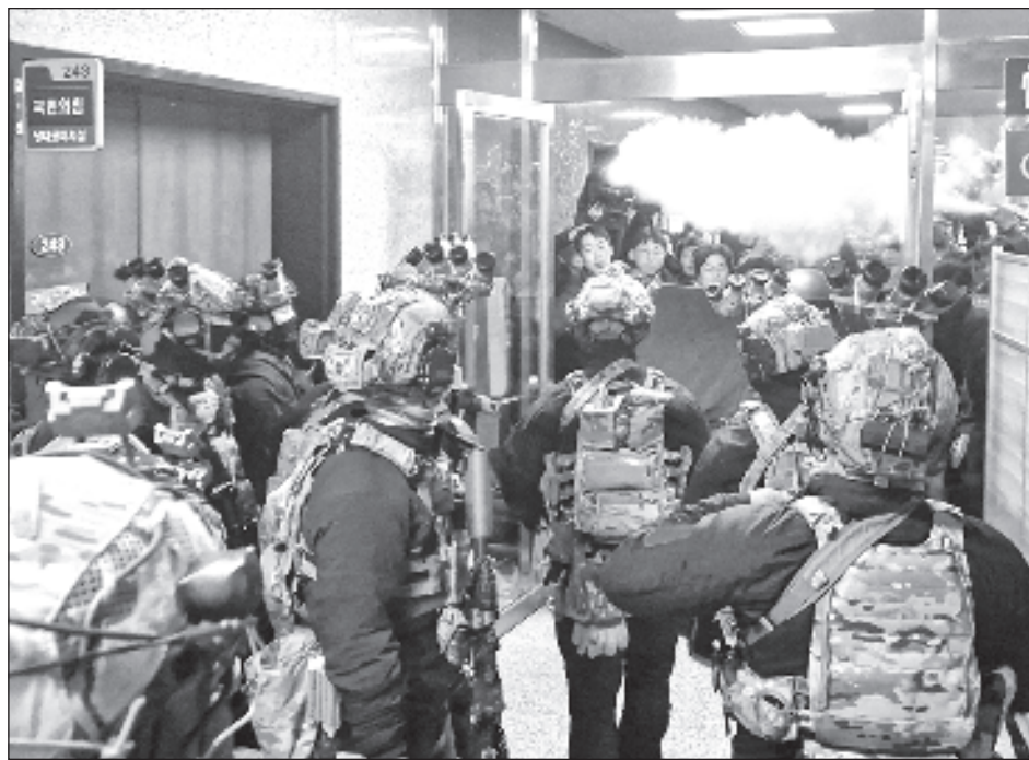
▲ Medios de comunicación locales mostraron a agentes de policía bloqueando la entrada de la Asamblea, así como a soldados con cascos y rifles frente al edificio.

La concentración tuvo lugar frente a la Asamblea, rodeada por un amplio dispositivo policial y sin que se produjeran incidentes destacables por el momento, según pudo presenciar Efe , poco después de que Yoon proclamara la ley marcial y de que el mando militar anunciara la prohibición de toda actividad política, incluidas las manifestaciones o protestas.