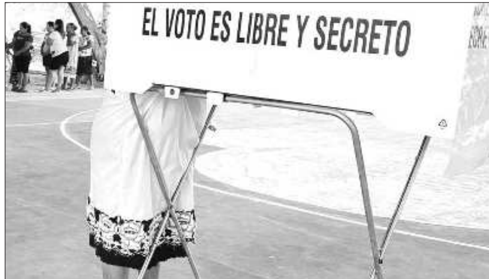
▲ El secretario general reconoció la alta participación de los pobladores y destacó que, durante este proceso electoral, se observó un ambiente de respeto y civismo.

El secretario general reconoció la alta participación de los pobladores y destacó que, durante este proceso