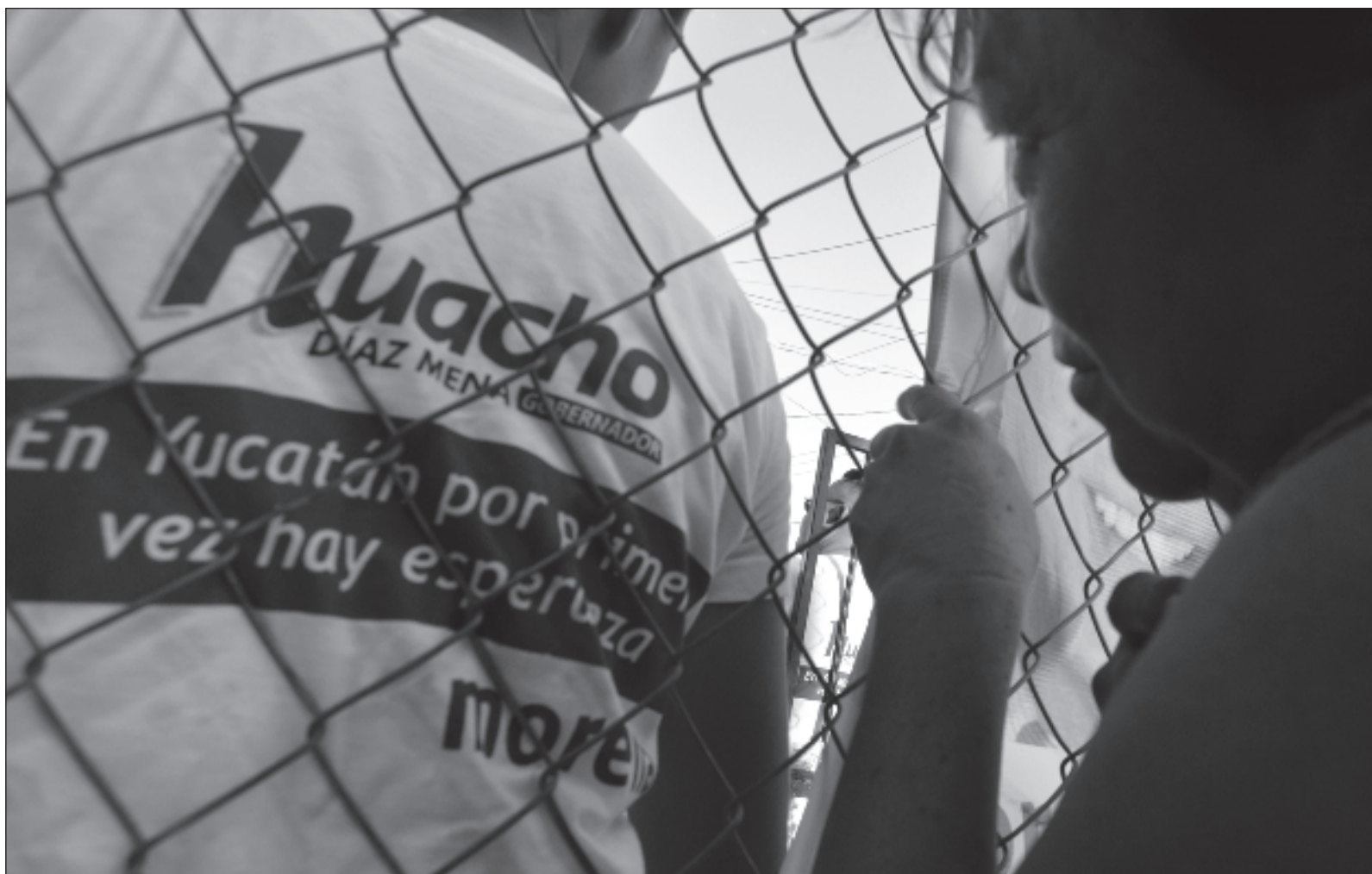
▲ "Dos mil veinticuatro ha visto un cambio de gobierno. Una mujer, la primera, sacudió el polvo de los prejuicios, y se enfrenta a un reto diario".