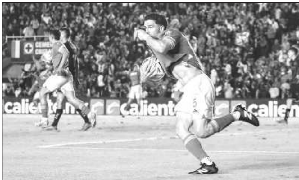
▲ La Máquina llega en gran momento a semifinales tras eliminar a Tijuana en vibrante serie.

Al avanzar como el séptimo lugar, los azulcremas sabían que tendrían que ir contracorriente si querían