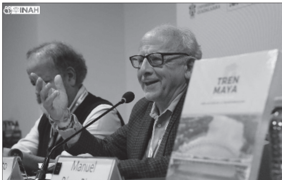
▲ El antropólogo agregó que el libro La nación maya: Gestación, devenir y resistencia / Maayáaj Lu'umkabal. U síijil, u pachk'iinil yéetel u muuk' ólal , trata “de un gran panorama del extraordinario proceso histórico y cultural (...) en el pasado y en el presente”.

El Tren Maya no es la primera intervención en la geografía, en la economía y en la sociedad de esa región del sureste; “asegurar