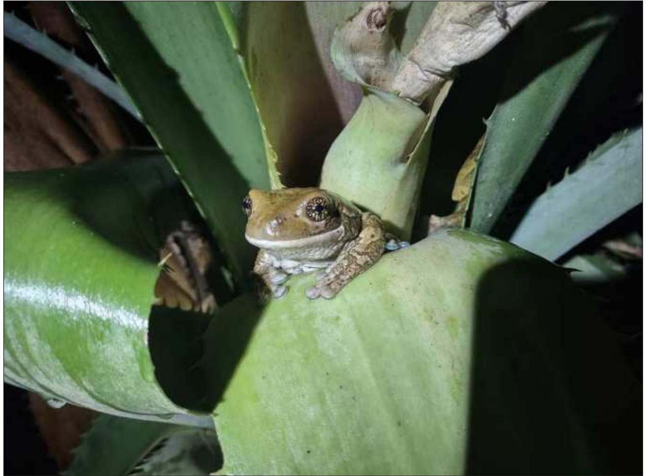
▲ Ichil tuláakal noj lu'ume', sajbe'entsil yanik u ch'éeejel kex u chúumuk le beyka'aj yano'obo'. Oochel UNAM

Ka'aj túun xak'alta'ab u jejeláasil anfibios yaan Méxicoe', ila'abe' ya'abach ti' leti'obe' sajbe'entsil yaniko'ob ikil u k'éexel wa u jebes'al bix u meyaj lu'um, tumen u ya'abil ba'alche'obe' ma' nojoch tu'ux ku kuxtal'o'obi, le beetik keen ch'éenek u