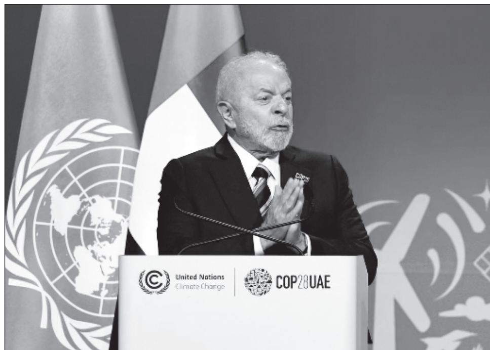
▲ Brasil fue invitado a sumarse al grupo formado por los 13 miembros de la Organización de Países Exportadores de Petróleo y otros 10 productores de crudo, encabezados por Rusia.

"Brasil no participará en la OPEP, [pero] Brasil sí participará en la OPEP+, es tan