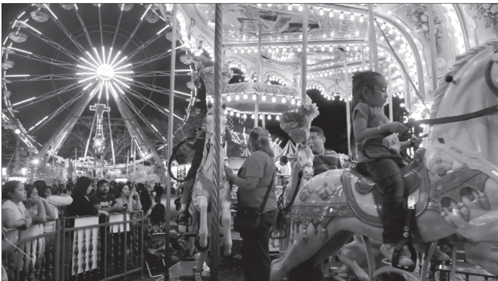
▲ "En los juegos mecánicos, usted puede elegir entre una variedad de ellos a diferentes precios, los más baratos son los juegos infantiles".

Síganos en: http://orga.enesmerida.unam.mx/ Facebook @ORGACovid19 Instagram @orgacovid19 X @ORGA_COVID19