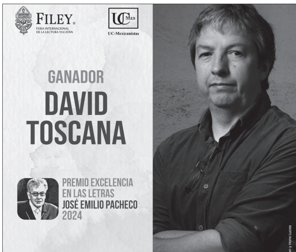
▲ El escritor recibirá el galardón el 10 de marzo en la inauguración de la Filey.

El jurado otorgó por unanimidad el Premio Excelencia en las Letras a Toscana por "la gran calidad en todos los géneros que practica, así como el arrobo y el asombro que producen sus libros. Toscana tiene la virtud de relacionar lo singular mexicano a lo universal, los problemas y los temas del mundo con gran sentido del humor; también destaca por su amplia cultura literaria y compromiso con la responsabilidad estética".