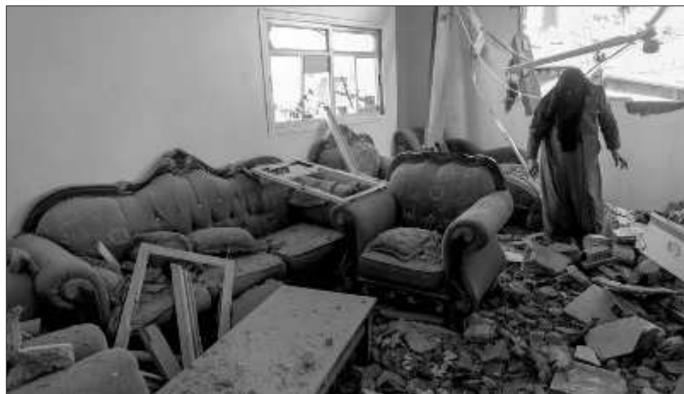
▲ “El ejército israelí está continuando y expandiendo la operación terrestre contra la presencia de Hamas en todas las partes de la Franja de Gaza”, afirmó el vocero militar Daniel Hagari.

El ejército israelí ordenó a los civiles palestinos evacuar más zonas en la segunda ciudad más grande de la Franja de Gaza, Jan Yunis, y sus alrededores, y siguió con sus intensos