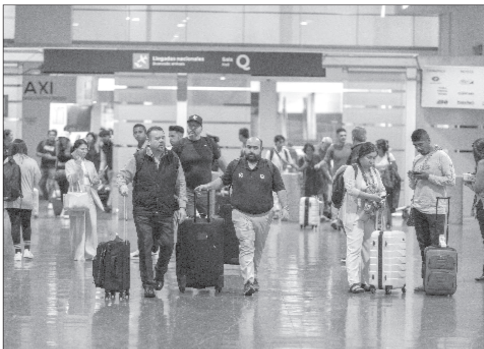
▲ Los aeropuertos de Cancún, de la Ciudad de México y de Los Cabos fueron los aeródromos que recibieron el mayor número de turistas internacionales.

La Sectur precisó que de enero a octubre de este año,