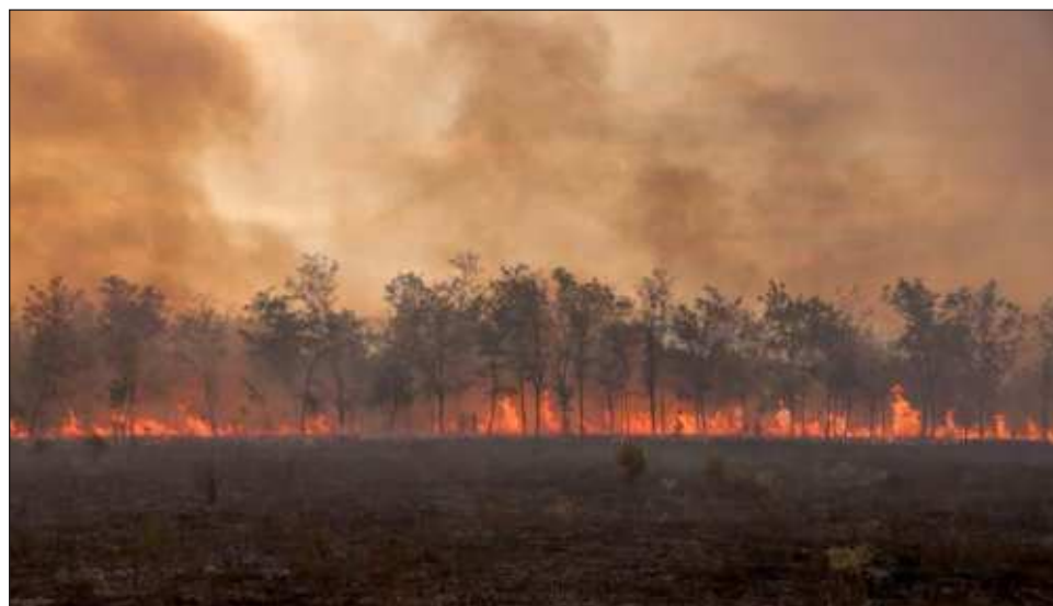
▲ El incremento de temperatura provocado por la quema de carbón, gas y petróleo ha empeorado las catástrofes naturales como inundaciones, olas de calor y sequía.

Las sesiones del sábado terminaron con el anuncio de la presidencia de la cumbre de que 50 compañías de gas y petróleo habían acordado alcanzar las emisiones netas de metano y poner fin a la quema rutinaria en sus ope-