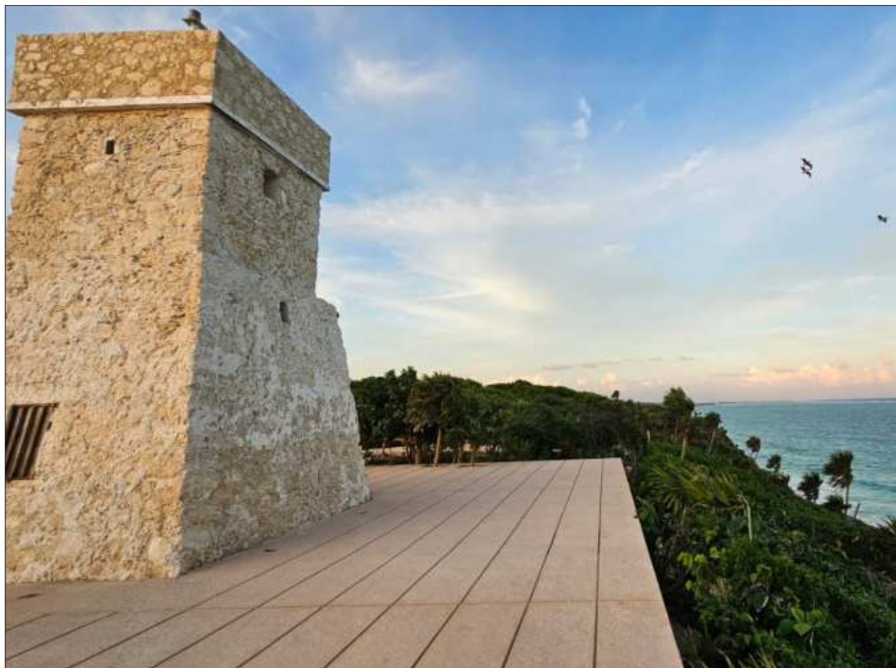
▲ Dicho faro conecta con la costa, que tiene un corredor de más 3 kilómetros de arenales y mar.

Dicho faro conecta con la costa, que tiene un corredor de más 3 kilómetros de arenales y mar, que además tiene ocho puntos con servicios, baños y accesos públicos a las playas.