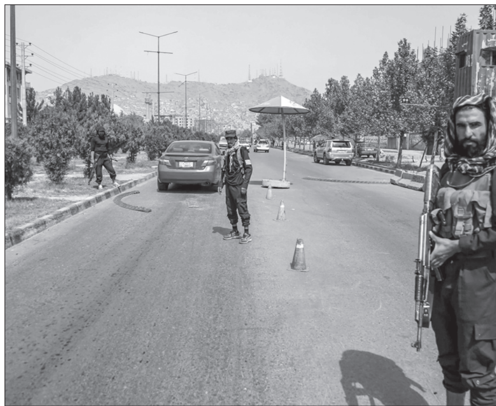
▲ Los dirigentes del Emirato islámico también devolvieron a los kabulíes kilómetros de calles bloqueadas por los poderosos del antiguo régimen y las arcas se han llenado.

Para frustrar los ataques de los yihadistas del grupo Estado Islámico, los talibanes dejaron los puestos de control colocados por las autoridades anteriores para impedir sus propios atentados.