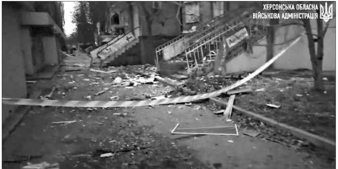
▲ De acuerdo con información de la fiscalía local, las personas fallecidas durante el bombardeo fueron un hombre de 78 años, en la localidad de Sadove, y una mujer, en Jersón, cuando "se encontraba en la calle".

En la noche, las fuerzas rusas lanzaron 12 drones Shahed, señaló el ejército