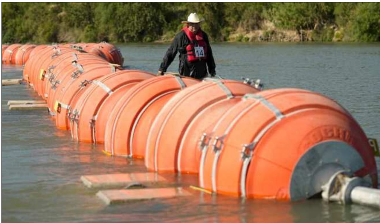
▲ Este sábado, el tribunal estadounidense determinó que Texas debe eliminar una barrera flotante de 305 metros de largo que colocó en el Río Bravo para disuadir a los migrantes de intentar cruzar la frontera de manera ilegal.

5° Tribunal de Circuito de Apelaciones de EEUU, de rechazar la solicitud de Texas para mantener instaladas las boyas en el Río Bravo. Continuamos trabajando para garantizar la integridad física y los derechos humanos de las y los migrantes", señaló la Cancillería en un mensaje en las redes sociales.