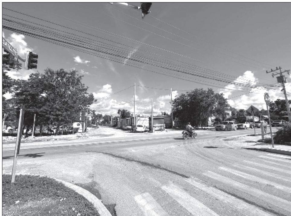
▲ Los habitantes de zonas no regulares no pueden tener energía eléctrica de calidad, carecen de agua potable y no tienen drenaje, calles ni banquetas.

Apuntó que su esquema de comercialización es con 10 por ciento de enganche y 36 mensualidades, pero tuvieron que hacer un programa mucho más flexible de acuerdo a la capacidad que demuestre la familia que puede pagar. En el caso de los particulares, precisó que han podido ya recuperar 28 hectáreas para comercializar.