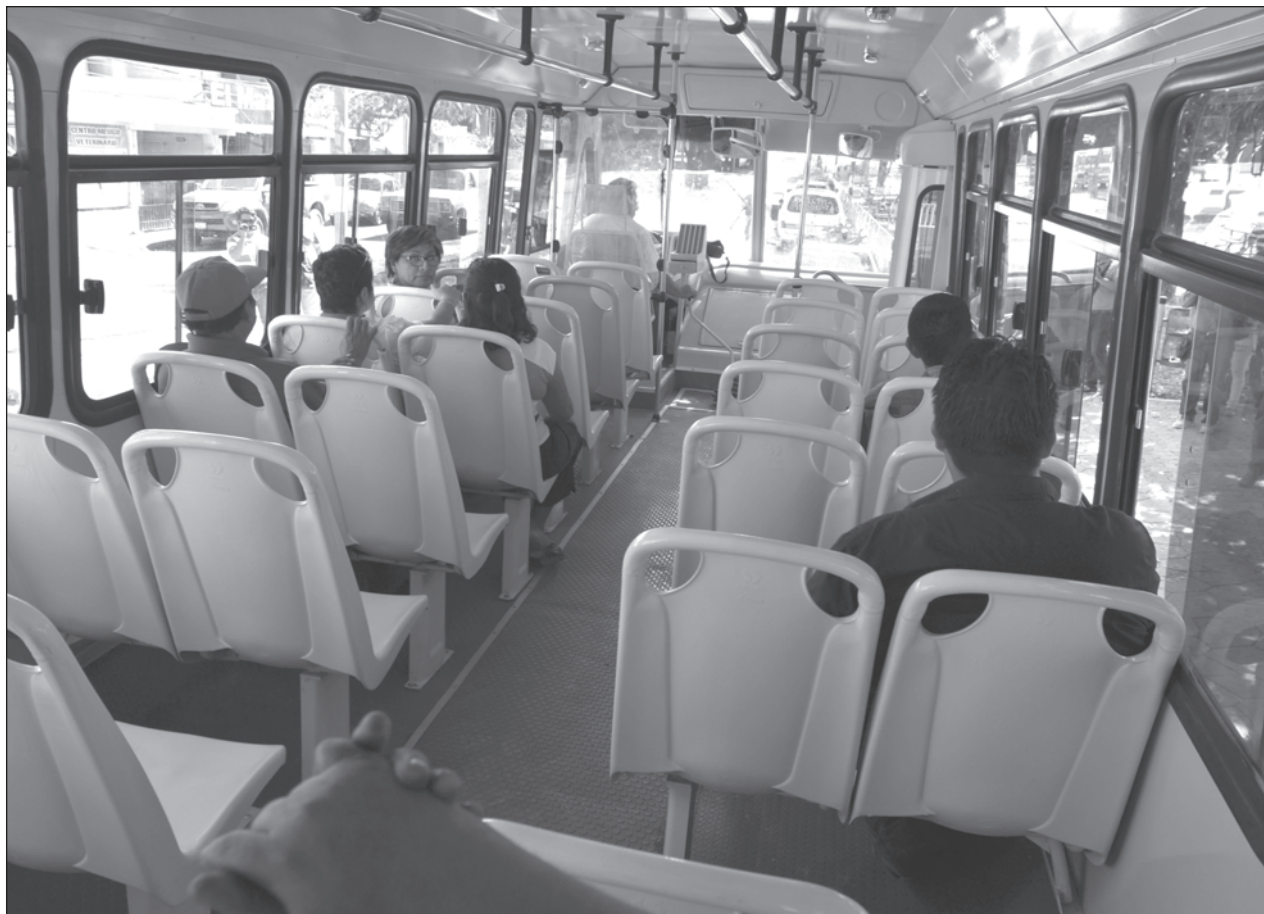
▲ El presidente municipal de Carmen explicó que se reactivará la Coordinación del Transporte Urbano, que ahora dependerá de la Dirección de Turismo y Desarrollo Económico, proyecto que se presentará en Cabildo.

Reveló que las unidades son de procedencia china, por lo cual técnicos de la empresa automotriz que proporcionará las unidades, han visitado la Isla para identificar las características de las rutas que recorrerán las mismas.