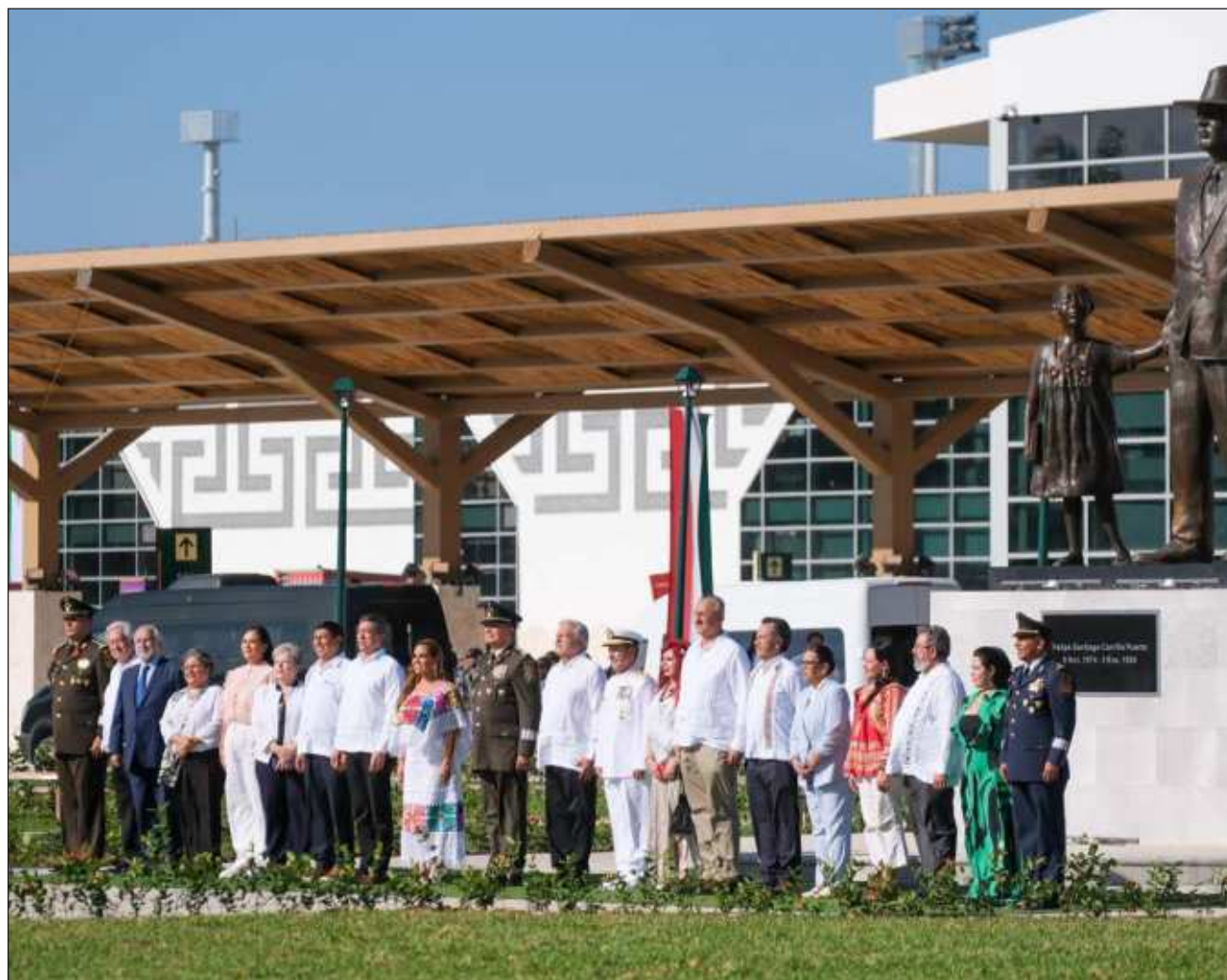
▲ El viernes 1º de diciembre el presidente Andrés Manuel López Obrador encabezó la inauguración del Aeropuerto Internacional Felipe Carrillo Puerto, de Tulum. Paralelo al acto

protocolario arribó el primer vuelo a la terminal aérea, una frecuencia de la ruta Ciudad de México-Tulum de Viva Aerobus.