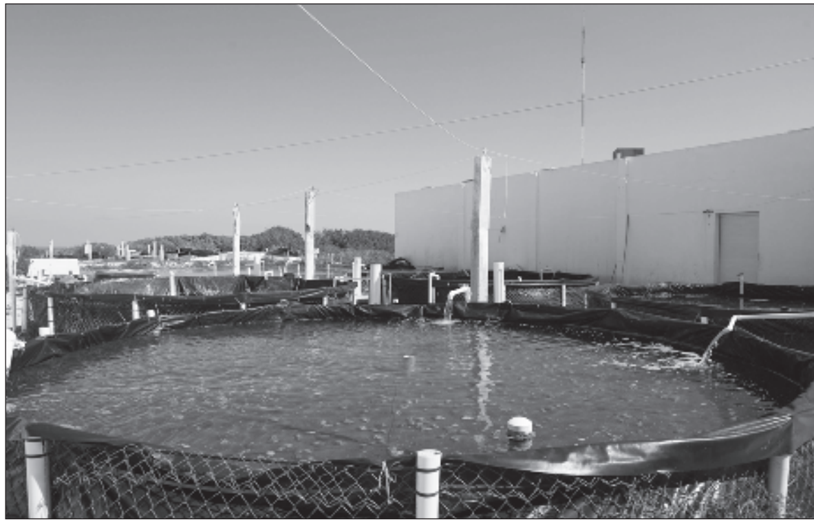
▲ “Somos además la generación que consolidó los posgrados, hoy con más de 2 mil 300. Hemos tenido una contribución social muy importante para México, somos les Jardiniers des intelligences humaines ”.

A qué ha servido mi trabajo cotidiano, mi oficio como investigadora. Más allá del Publish or Perish , ha servido para la elaboración de normas y planes de manejo de la pesca, al desarrollo de la acuicultura, a medir el efecto del cambio climático y la acidificación de los océanos y a la conservación de la biodiversidad en los mares, tanto con el trabajo de investigación como a través de múltiples acciones y programas de divulgación de la ciencia en los cuales me he involucrado o incluso he desarrollado. Los científicos somos piezas únicas hechas a mano por un director de tesis, somos críticos y creativos. De la misma manera, así se forman las nuevas generaciones de investigadores siempre al lado de un director de tesis. Yo me formé en Francia, donde además de mi formación académica adquirí un enriquecimiento cultural en muchas artes