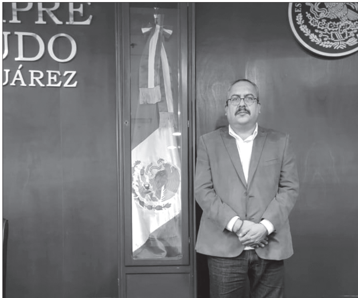
▲ “Los indígenas inconformes reclamaban que sus tierras y su poblado habían sido invadidos y ellos desplazados por la construcción de dicha obra, sin que la Comisión Nacional del Agua los indemnizara conforme a derecho”.

No nos equivocamos. El tiempo que estuvo ocupando el departamento jurídico, todavía en calidad de becario, desempeñó el puesto de manera eficiente, lo que le valió que al terminar su servicio social se le extendiera el nombramiento oficial, devengando el sueldo